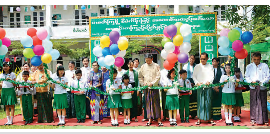
ပြည်ထောင်စုဝန်ကြီး ဒေါက်တာမျိုးသိမ်းကြီးနှင့် တာဝန်ရှိသူများ တာမေမြို့နယ်ရှိ အမှတ်(၂)အခြေခံပညာ မူလတန်းကျောင်း စာကြည့်တိုက်ကို ဖွင့်ပွဲအခမ်းအနားကျင်းပ

ရန်ကုန် အောက်တိုဘာ ၇ “စာဖတ်ကြစို့” စီမံကိန်းဖြင့် ဆောင်ရွက်သော ကျောင်းစာကြည့်တိုက်များ ဖွင့်ပွဲအခမ်းအနားကို ယနေ့ နံနက် ၉ နာရီတွင် ရန်ကုန်မြို့၊ တာမေမြို့နယ် အမှတ်(၂) အခြေခံပညာ အလယ်တန်းကျောင်း အစည်းအဝေးခန်းမ၌ ကျင်းပသည်။