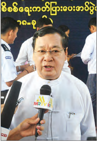
ပြည်ထောင်စုဝန်ကြီး ဦးသိန်းဆွေ

အလုပ်သမား၊ လူဝင်မှုကြီးကြပ်ရေးနှင့် ပြည်သူ့အင်အားဝန်ကြီးဌာနက ရန်ကုန်တိုင်းဒေသကြီး အရှေ့ပိုင်းခရိုင်အတွင်းရှိ သာကေတစက်မှုဇုန်၊ ဒဂုံမြို့သစ် (တောင်ပိုင်း) စက်မှုဇုန်နှင့် ဒဂုံမြို့သစ် (အရှေ့ပိုင်း) စက်မှုဇုန်များရှိ စက်ရုံ/အလုပ်ရုံများမှ အလုပ်သမားများအား လုပ်ငန်းခွင်မပျက် သစ္စာစိစစ်ချက်ဖြင့် နိုင်ငံသားစိစစ်ရေးကတ်ပြားများကို အောက်တိုဘာ ၆ ရက်တွင် ထုတ်ပေးခဲ့သည်။ အဆိုပါ စိစစ်ချက်နှင့်ပတ်သက်၍ မြန်မာ့သတင်းစဉ်က မေးမြန်းထားသည်များကို ဖော်ပြလိုက်ပါသည်။