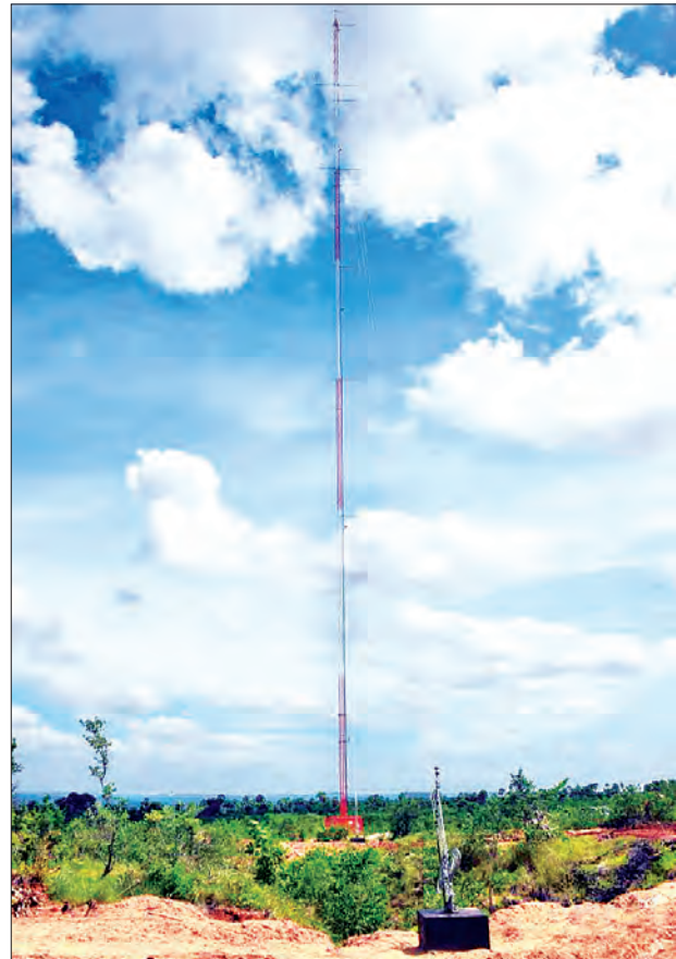
လေအားလျှပ်စစ်စီမံကိန်းဆောင်ရွက်ရန် မိုးလေဝသစစ်တမ်းကောက်ယူသည့် တာဝါတိုင်တစ်ခုကိုတွေ့ရစဉ်။