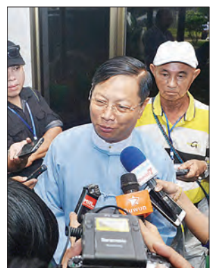
ပြည်ထောင်စုဝန်ကြီး သူရဦးအောင်ကို