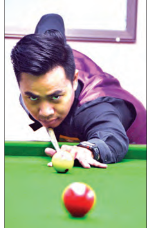
ကမ္ဘာ့ဘိလိယက်နှင့် စနူကာပြိုင်ပွဲအတွက် ဘိလိယက်ကစားသမားချစ်ကိုကို လေ့ကျင့်နေစဉ်။

အဆိုပါပြိုင်ပွဲကြီးတွင် ပြိုင်ပွဲအမျိုးအစား ငါးမျိုးပါဝင်မည်ဖြစ်ပြီး ဘိလိယက်ပြိုင်ပွဲများဖြစ်သည့် 150 UP ပြိုင်ပွဲနှင့် Long Point ပြိုင်ပွဲများကို နိုဝင်ဘာ ၁၂ ရက်မှ ၁၈ ရက်အထိ ကျင်းပမည်ဖြစ်ပြီး စာမျက်နှာ ၅ ကော်လံ ၄