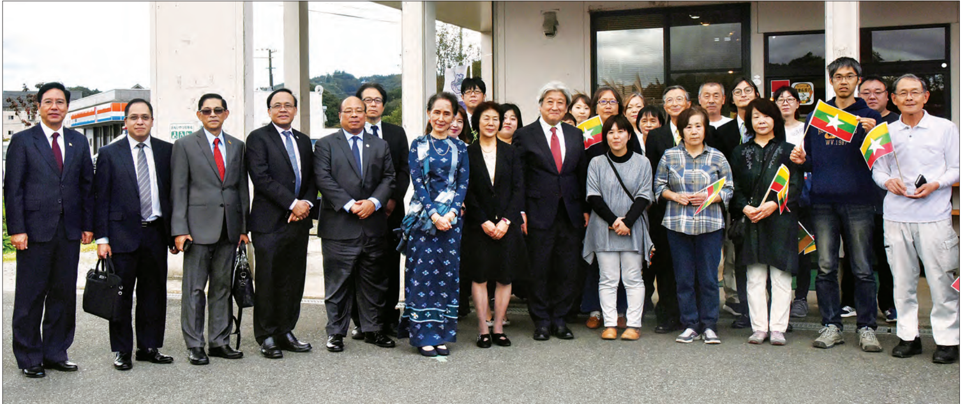
နိုင်ငံတော်၏ အတိုင်ပင်ခံပုဂ္ဂိုလ် ဒေါ်အောင်ဆန်းစုကြည်နှင့် ကိုယ်စားလှယ်အဖွဲ့ဝင်များ ဇူကူရိုမားခရိုင် ဒုတိယအုပ်ချုပ်ရေးမှူး၊ လယ်ယာစိုက်ပျိုးရေး၊ သစ်တောနှင့် ငါးလုပ်ငန်းဝန်ကြီးဌာန ညွှန်ကြားရေးမှူးချုပ် နှင့် တာဝန်ရှိသူများနှင့်အတူ “Kokoron” လုပ်ငန်းစုရှေ့တွင် စုပေါင်းမှတ်တမ်းတင်ဓာတ်ပုံရိုက်စဉ်။