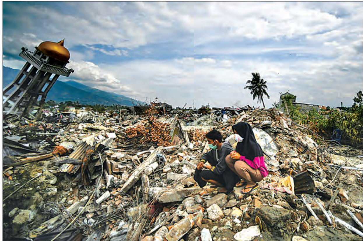
ရုပ်အလောင်းတွေရှာဖွေ

လူသားတွေ ကြိုတင်တားဆီးကာကွယ်လို့မရတဲ့ အရာတွေထဲမှာ သဘာဝဘေးအန္တရာယ်က ထိပ်ဆုံးကပါဝင်ပါတယ်။ သဘာဝဘေးကြောင့် အသက်ဆုံးရှုံးမှု၊ ပစ္စည်းဥစ္စာ ဆုံးရှုံးမှုတွေဟာလည်း မနည်းပါဘူး။ ပြီးခဲ့တဲ့ စက်တင်ဘာ ၂၈ ရက်က အင်ဒိုနီးရှားနိုင်ငံ ဆူလာဝေစီကျွန်း ပါလူမြို့မှာ ပြင်းအား ၇ ဒဿမ ၅ ငလျင်လှုပ်ခဲ့ပြီး နေအိမ်တိုက်တာ အဆောက်အအုံတွေ မြေကြီးအောက် ရောက်ကုန်ပါတယ်။