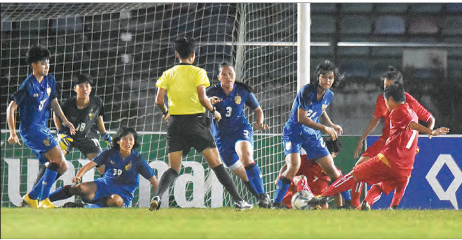
မြန်မာ ယူ-၁၉ အမျိုးသမီးအသင်းနှင့် ထိုင်း ယူ-၁၉ အမျိုးသမီးအသင်း ယှဉ်ပြိုင်နေစဉ်။

၂၀၁၉ အာရှယူ-၁၉ အမျိုးသမီးခြေစစ်ပွဲအတွက် လေ့ကျင့်ပြိုင်ဆင်မှုများ ပြုလုပ်နေသည့် မြန်မာယူ-၁၉ အမျိုးသမီးအသင်းနှင့် ထိုင်းယူ-၁၉ အမျိုးသမီးအသင်းတို့၏ ဒုတိယခြေစစ်ပွဲကို ယနေ့ညနေ ၆ နာရီက သုဝဏ္ဏတွင်း၌ကျင်းပရာ ထိုင်းယူ-၁၉ အမျိုးသမီးအသင်းက လေးဂိုး သုံးဂိုးဖြင့် အနိုင်ရခဲ့သည်။