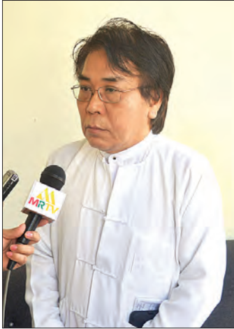
ဦးတင်စိန်