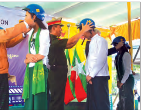
အများဆုံး ကလေးသူငယ်များကို အဆင့် မြင့်ဆိုင်ကယ်စီးဦးထုပ်များ တိုက်ရိုက် ပေးအပ်ခြင်းဖြစ်ကြောင်း ပြောကြားခဲ့ သည်။ ထို့နောက် ကျောင်းသား ကျောင်းသူ လေးများက ဆိုင်ကယ်စီးဦးထုပ်များ မှန်ကန်စွာအသုံးပြုခြင်းကို လက်တွေ့ သရုပ်ပြခြင်းနှင့် One Helmet, One Life ကို သရုပ်ပြတင်ဆက်ကြကြောင်း သိရသည်။ အေပီအိုင် (မန်းကိုယ်ပွား)

အဖြစ် ရွေးချယ်လိုက်ခြင်းဖြစ်ကြောင်း၊ မြန်မာနိုင်ငံတွင် ဆိုင်ကယ် စီးနင်းသူ အများစုသည် ဆိုင်ကယ်စီး ဦးထုပ် ဆောင်းကြသော်လည်း ကလေးသူငယ် များ အပါအဝင် လိုက်ပါစီးနင်းသူများ၏ ၇ ရာခိုင်နှုန်း ထက်နည်းသော ပမာဏက သာလျှင် ဆိုင်ကယ်စီး ဦးထုပ်ဆောင်း ကြသည်ကို ဝမ်းနည်းဖွယ်တွေ့ရ ကြောင်း၊ UPS Foundation ၏ ကူညီထောက်ပံ့မှု၊ အသိပညာပေး မြှင့်တင်လုပ်ဆောင်မှုနှင့် မြန်မာနိုင်ငံ ရဲတပ်ဖွဲ့၏ တရားဥပဒေစိုးမိုးရေး တိုးမြှင့် လုပ်ဆောင်မှုတို့ ပေါင်းစပ်၍ လိုအပ်မှု