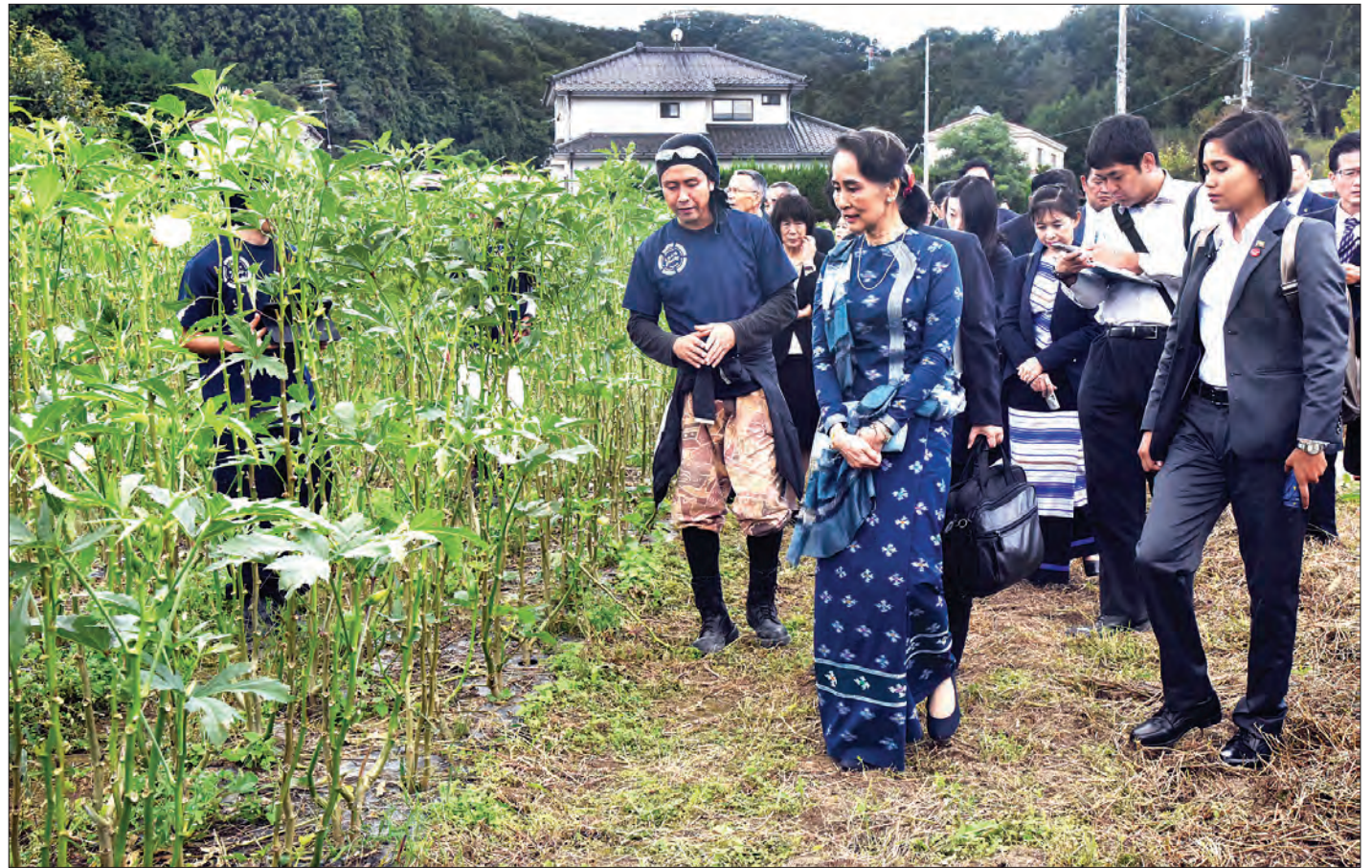
နိုင်ငံတော်၏ အတိုင်ပင်ခံပုဂ္ဂိုလ် ဒေါ်အောင်ဆန်းစုကြည် ဖူကူရီမားခရိုင် အီဇမိဇကိကျေးရွာရှိ “Kokoron” လုပ်ငန်းစု၏ စိုက်ခင်းများကို ကြည့်ရှုလေ့လာစဉ်။ သတင်းစဉ်

လေဖိအားနည်းရပ်ဝန်းဖြစ်ပေါ် နေပြည်တော် အောက်တိုဘာ ၇ ယနေ့ ညနေ ၇ နာရီခွဲ တိုင်းထွာချက်များအရ တင်္ဂလာ ပင်လယ်အော်တောင်ပိုင်းတွင် လေဖိအားနည်းရပ်ဝန်း တစ်ခု ဖြစ်ပေါ်နေသည်။ မိုး/လေ