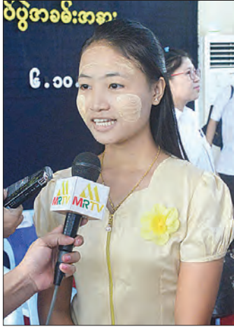
မသိရိဖြိုးပြည့်