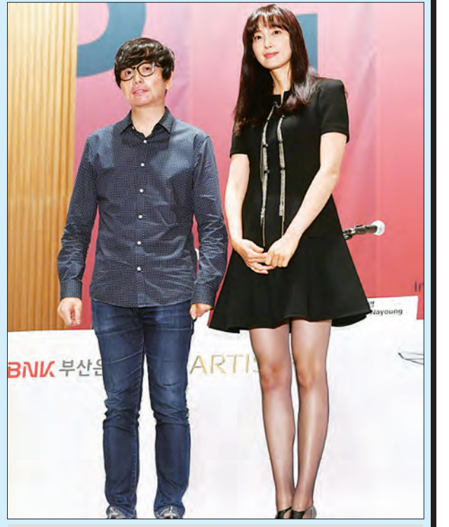
ဘူဆန်နိုင်ငံတကာ ရုပ်ရှင်ပွဲတော်သို့ တက်ရောက်လာသည့် “လှပသောနေ့ရက်များ” ရုပ်ရှင်ဇာတ်ကား ဒါရိုက်တာ ဂျေဂျီယွန်နှင့် တောင်ကိုရီးယား ရုပ်ရှင်မင်းသမီး လီနယောင်တို့ကို တွေ့ရစဉ်။