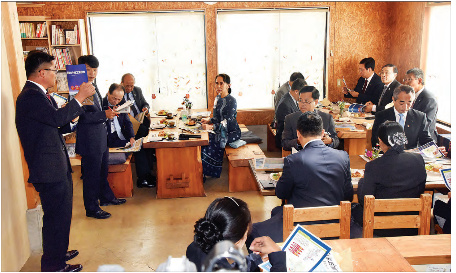
နိုင်ငံတော်၏ အတိုင်ပင်ခံပုဂ္ဂိုလ် ဒေါ်အောင်ဆန်းစုကြည်အား “Kokoron” လုပ်ငန်းစုနှင့် ပတ်သက်၍ တာဝန်ရှိသူများက ရှင်းလင်းတင်ပြစဉ်။

စိုက်ခင်းများ လေ့လာ ထို့နောက် နိုင်ငံတော်၏ အတိုင်ပင်ခံပုဂ္ဂိုလ်နှင့် ကိုယ်စားလှယ်အဖွဲ့ဝင်များသည် ဇူကူရိုမားခရိုင် ဒုတိယအုပ်ချုပ်ရေးမှူး၊ လယ်ယာစိုက်ပျိုးရေး၊ သစ်တောနှင့် ငါးလုပ်ငန်းဝန်ကြီးဌာန ညွှန်ကြားရေးမှူးချုပ်နှင့် တာဝန်ရှိသူများနှင့်အတူ “Kokoron” လုပ်ငန်းစုရှေ့တွင် စုပေါင်းမှတ်တမ်းတင် ဓာတ်ပုံရိုက်ပြီး “Kokoron” လုပ်ငန်းစု၏ စိုက်ခင်းများကို သွားရောက်လေ့လာသည်။ အီဇမိဇက်ကျေးရွာသည် ဧရိယာအကျယ်အဝန်း ၃၅ ဒသမ ၄၃ စတုဂံရန်း ကီလိုမီတာကျယ်ဝန်း၍ ဇူကူရိုမားခရိုင် တောင်ပိုင်းတွင် တည်ရှိပြီး တိုကျိုမြို့မှ