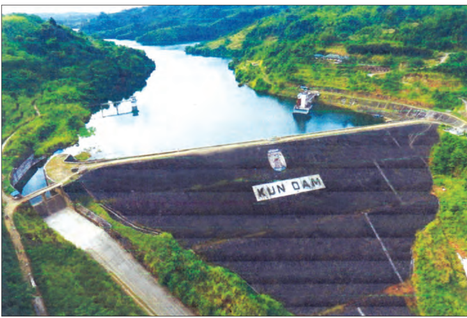
ကွန်းချောင်းရေလှောင်တံမံကို တွေ့ရစဉ်။

ရေအားလျှပ်စစ် ရေလှောင်တံမံများ ကြံ့ခိုင်မှုရှိစေရန်အတွက် လျှပ်စစ်နှင့် စွမ်းအင်ဝန်ကြီးဌာန ရေအားလျှပ်စစ် အကောင်အထည်ဖော်ရေးဦးစီးဌာနက တာဝန်ယူထိန်းသိမ်းလျက်ရှိပြီး ရဲရွာ၊ အထက်ပေါင်းလောင်း၊ ကွန်းချောင်း၊ မိုးပြ၊ ရွှေကျင်နှင့် ဇောင်းတူရေအား လျှပ်စစ်ရေလှောင်တံမံများကို တစ်စုစု အစားအလှယ် စစ်ဆေးတိုင်းတာ ခြင်းများ ဆောင်ရွက်လျက်ရှိကြောင်း သိရသည်။