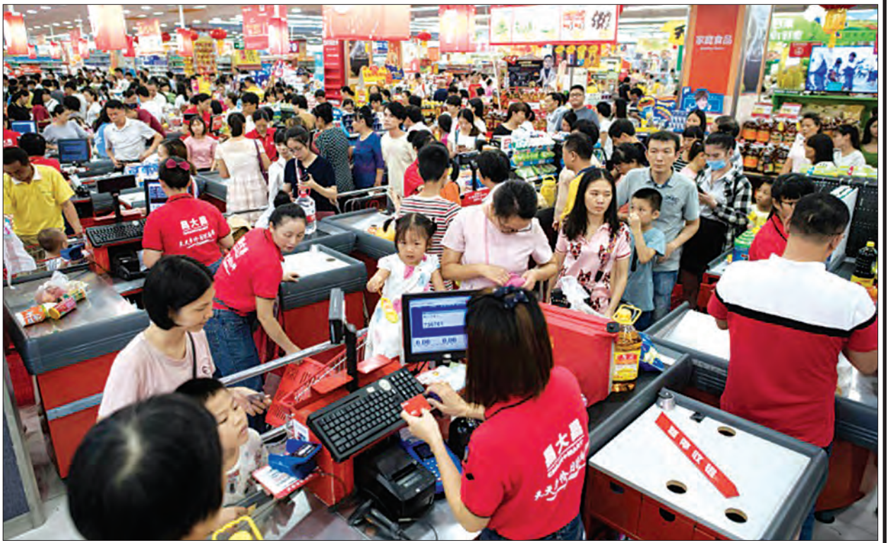
အပူပိုင်းမုန်တိုင်း မန်ခတ်မဝင်မီ တရုတ်နိုင်ငံ ကွမ်တုံပြည်နယ်ရှိ စူပါမားကက်တွင် အစားအစာနှင့် ရေများဝယ်ယူနေကြသည့် ပြည်သူများကို တွေ့ရစဉ်။

ယခုအခါ ဟောင်ကောင်၌လည်း လူများကို လုံခြုံစိတ်ချရာနေရာများတွင် နေထိုင်ကြရန် သတိပေးမှုထုတ်ပြန်ထားပြီး လေယာဉ်ခရီးစဉ်ပေါင်း ၉၀၀ ကျော်လည်း ရပ်နားထားသည်။ တိုင်ဖုန်းမုန်တိုင်းကြောင့် ကားများပြေးဆွဲမှုရပ်နားထားပြီး