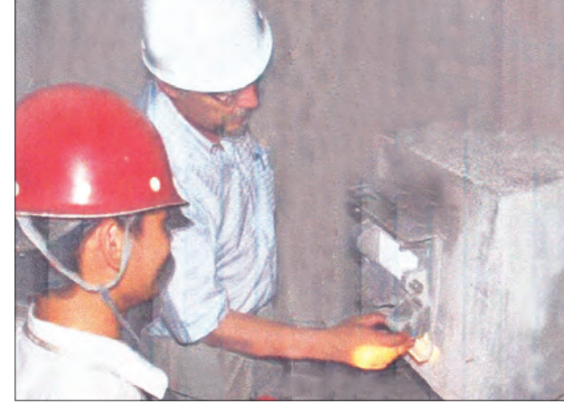
တံမံကိုယ်ထည် တိုင်းစောင့်မှုအခြေအနေအား စစ်ဆေးတိုင်းတာနေမှုကို တွေ့ရစဉ်။

ရေများအား နေ့စဉ်စီးဝင်နေတဲ့လျှပ်စစ် ဓာတ်အားထုတ်လုပ်ရာတွင် အသုံးပြု သည့်ရေမာဏပေါ်မူတည်ကာ ရေလို လှောင်ထိန်းညှိခြင်းနှင့် ရေထုတ်လွှတ် ခြင်းများ ဆောင်ရွက်လျက်ရှိကြောင်း၊ ထို့ပြင် ရေအားလျှပ်စစ်တံမံများတွင် ရေကြီးရေလျှံခြင်းများ လျော့ပါးစေရန် ရေဝင်ရောက်မှုအခြေအနေအပေါ် အနီး ကပ်စောင့်ကြည့်ပြီး သက်ဆိုင်ရာ အုပ်ချုပ် ရေး အဖွဲ့အစည်းများနှင့် ပေါင်းစပ်ညှိနှိုင်း ကာ တစ်စုတည်းမှ သိုလှောင်ရေကို ထိန်းညှိထုတ်လွှတ်ခြင်းများ ဆောင်ရွက် လျက်ရှိကြောင်း သိရသည်။ “ရေလှောင်တံမံတွေကို တည် ဆောက်ပြီးရုံနဲ့ မပြီးဘဲ ရေရှည်တည်တံ့ဖို့ အန္တရာယ်ကင်းဖို့ ကြံ့ခိုင်မှုအခြေအနေ ကို အချိန်နဲ့တစ်ပြေးညီ စံချိန်စံညွှန်း တွေနဲ့အညီ စောင့်ကြည့်စစ်ဆေးနေပါ တယ်။ တံမံတွေ ကြံ့ခိုင်ကောင်းမွန်နေမှ ရေအားလျှပ်စစ်နဲ့ပတ်သက်ပြီး ပြည်သူ တွေလိုအပ်တဲ့ လျှပ်စစ်ဓာတ်အားကို အချိန်နဲ့တစ်ပြေးညီ အလုံအလောက် ထုတ်လုပ်ပေးနိုင်မှာ ဖြစ်ပါတယ်”ဟု ဦးမြသုရက ဆက်လက်ပြောကြား သည်။ သိမ်သိမ်မိုး(မြန်မာ့အလင်း)