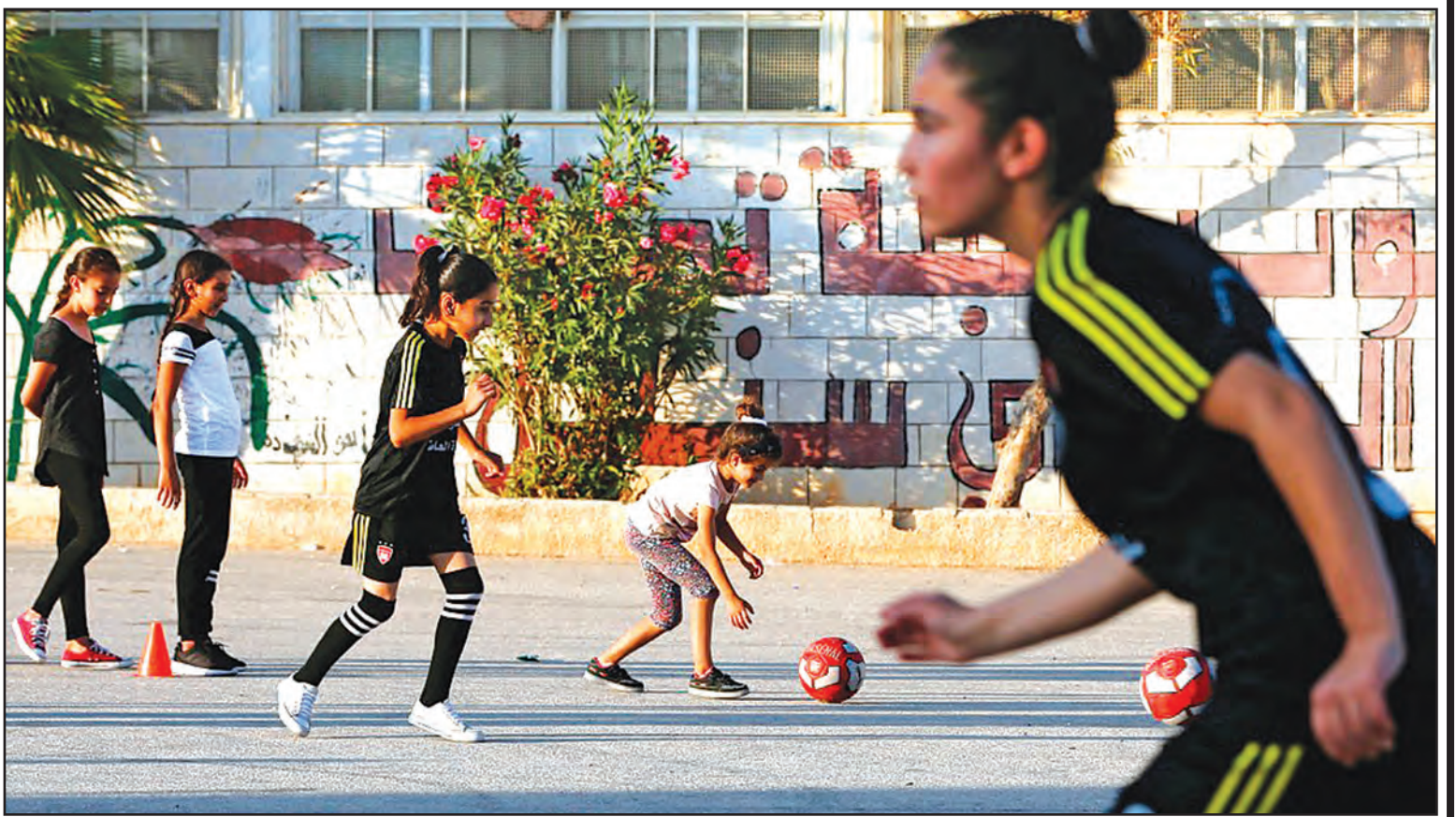
ရာမလာတွင် ဘောလုံးကစားနေကြသော ပါလက်စတိုင်းမိန်းကလေးငယ်များကို တွေ့ရစဉ်။

ကာရိုလိုင်းနား မြောက်ပိုင်းနှင့် တောင်ပိုင်းတို့တွင် နေအိမ်ပေါင်း ၃၀၀ သိန်းခွဲခန့်မှာ လျှပ်စစ်မီးများပြတ်တောက် လျက်ရှိသည်။ လွန်ခဲ့သောနှစ်က ဖြစ်ပွား ခဲ့သော အင်အားပြင်းဟာရီကီနီးမုန်တိုင်း ကြောင့် တက္ကဆက်ပြည်နယ်နှင့် ဟွာတိုရီ ကိုတို့တွင် ဒေသခံအများအပြားသေဆုံး ခဲ့မှုဖြစ်ပွားခဲ့ရာ ယခုတစ်ကြိမ်မုန်တိုင်း တွင် ထိုသို့မဖြစ်ပွားစေရေး အမေရိကန် အာဏာပိုင်များသည် သတိပေးထုတ်ပြန် မှုများ အမြင်ဆုံးအဆင့်ပြုလုပ်ထားသည်။ အင်န်အိတ်ချ်ကေ