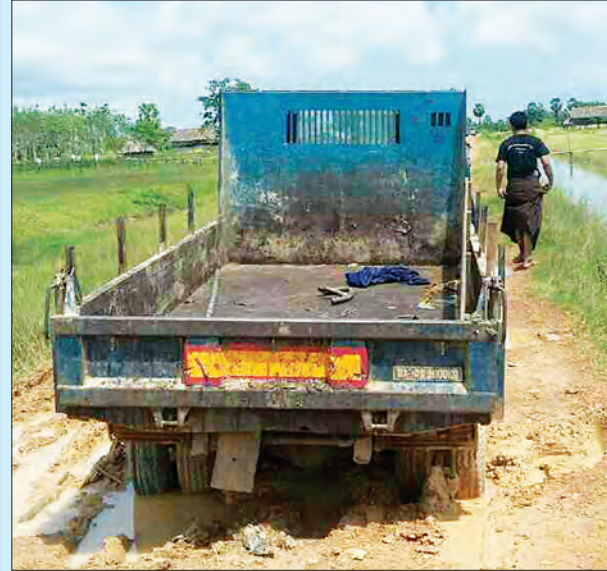
အကျဉ်းသားများထွက်ပြေးရာတွင် အသုံးပြုခဲ့သည့်ယာဉ်ကို တွေ့ရစဉ်။

ပြန်လည်တွေ့ရှိ မွန်းလွဲပိုင်းတွင် မောင်းနှင်