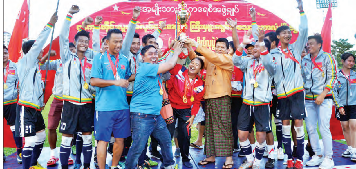
ရန်ကုန်တိုင်း လူငယ်ဖလားဘောလုံးပြိုင်ပွဲတွင် အနိုင်ရရှိခဲ့သော သာကေတမြို့နယ် လူငယ်အသင်းအား တိုင်းဒေသကြီး လူမှုရေးဝန်ကြီး ဦးနိုင်လင်း ဆုချီးမြှင့်စဉ်။