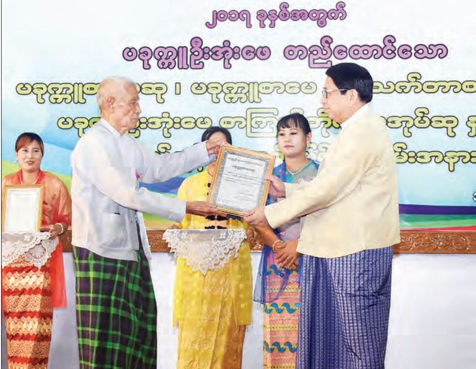
ပြည်ထောင်စုဝန်ကြီး ဒေါက်တာဖေမြင့် ၂၀၁၇ ခုနှစ်အတွက် ပခုက္ကူတစ်သက်တာစာပေဆုရ ဒေါက်တာ သန်းဦး(ပြည်စိုးမင်း) အား ဆုချီးမြှင့်စဉ်။

ထို့နောက် ပြည်ထောင်စုဝန်ကြီးသည် ၂၀၁၇ ခုနှစ်အတွက် ပခုက္ကူစာပေဆုရရှိသူများ၊ ပညာသင်ဆုရရှိသူများနှင့်အတူ စုပေါင်းမှတ်တမ်းတင် ဓာတ်ပုံရိုက်ကြသည်။