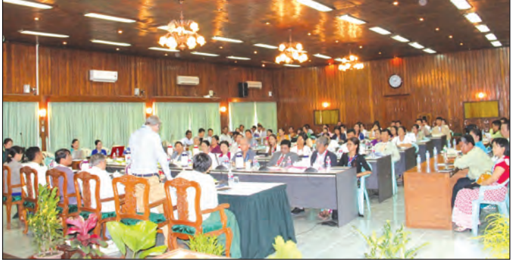
နိုင်ငံမှ စိုက်ပျိုးရေးဂေဟစနစ်မတူညီသည့် ဒေသများတွင် အကောင်အထည်ဖော်ဆောင်ရွက်မည့် ရေရှည်တည်တံ့သော သီးနှံစိုက်ပျိုးရေးနှင့်သစ်တောစီမံအုပ်ချုပ်မှုစီမံကိန်းသည် ရေရှည်တည်တံ့သည့် သစ်တောစီမံအုပ်ချုပ်မှု၊ ရာသီဥတုနှင့်လိုက်လျောညီထွေမှုရှိသည့် စိုက်ပျိုးရေးနှင့် ရေရှည်တည်တံ့သည့် မြေယာစီမံခန့်ခွဲမှုတို့အတွက် လက်ရှိကြုံတွေ့နေရသည့် အခက်အခဲနှင့် စိန်ခေါ်မှုများကို ကူညီဖြေရှင်းရန် သက်ဆိုင်ရာနည်းပညာများ စွမ်းရည်မြှင့်တင်ခြင်းနှင့် ကျယ်ကျယ်ပြန့်ပြန့် အသုံးပြုခြင်းတို့ကို လုပ်ဆောင်သွားမည်ဖြစ်ကြောင်းလည်း ဆွေးနွေးပွဲမှ သိရသည်။ ဇူလိုင်မိုး (မြန်မာ့အလင်း)

များအသုံးပြုမှုနှင့် ပတ်သက်သည့်များကိုဆွေးနွေးခဲ့ကြသည်။ အလုပ်ရုံဆွေးနွေးပွဲတွင် မြန်မာနိုင်ငံရာသီဥတုနှင့် သဟဇာတဖြစ်သောစိုက်ပျိုးရေးနည်းပညာများနှင့် ပတ်သက်သည့် သုတေသနစာတမ်း ၁၆ စောင်ကို တင်သွင်းဖတ်ကြားခဲ့သည်။ အလုပ်ရုံဆွေးနွေးပွဲပြုလုပ်ခြင်း ရည်ရွယ်ချက်မှာ စာတမ်းရှင်များ ဖတ်ကြားတင်ပြသွားသော သုတေသနစာတမ်းများအပေါ်အခြေခံ၍ ရရှိလာမည့်ဆွေးနွေးတင်ပြချက်များကို ပညာပေးဝန်ထမ်းများနှင့် ကျောင်းသား ကျောင်းသူများအား သိရှိနားလည်စေပြီး မိမိတို့ဒေသနှင့် လိုက်လျောညီထွေဖြစ်မည့် စိုက်ပျိုးရေးနည်းပညာများကို တောင်သူများထံ ပြန့်လှင်းဖြန့်ဖြူးပေးနိုင်ရန်ဖြစ်ကြောင်း သိရသည်။ သယ်ယူပို့ဆောင်ရေးနှင့် သဘာဝပတ်ဝန်းကျင်ထိန်းသိမ်းရေးဝန်ကြီးဌာန၊ စိုက်ပျိုးရေး၊ မွေးမြူရေးနှင့် ဆည်မြောင်းဝန်ကြီးဌာန၊ ရေဆင်းစိုက်ပျိုးရေးတက္ကသိုလ်နှင့် FAO တို့ ပူးပေါင်းဆောင်ရွက်သည့် မြန်မာ