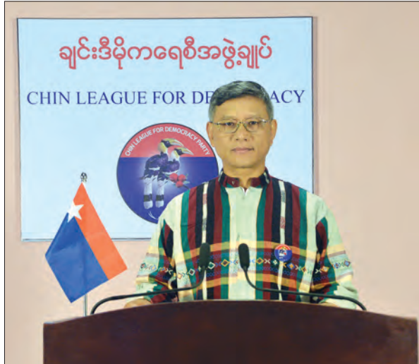
ချင်းဒီမိုကရေစီအဖွဲ့ချုပ်ပါတီ အထွေထွေအတွင်းရေးမှူး၊ ဆလိုင်ငံပိုင်ပြော

အဆိုပါဟောပြောတင်ပြချက်အပြည့်အစုံမှာ အောက်ပါအတိုင်းဖြစ်ပါသည်။