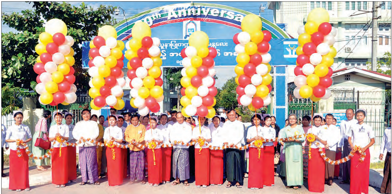
ပြည်ထောင်စုဝန်ကြီး ဒေါက်တာမြင့်ထွေး၊ မန္တလေးတိုင်းဒေသကြီးဝန်ကြီးချုပ် ဒေါက်တာ ဇော်မြင့်မောင်နှင့် တာဝန်ရှိသူများက သူနာပြုတက္ကသိုလ် မန္တလေး နှစ် (၂၀) ပြည့် အထိမ်းအမှတ်အခမ်းအနားကို ဖဲကြိုးဖြတ်ဖွင့်လှစ်ပေးစဉ်။

ဆက်လက်၍ ပြည်ထောင်စုဝန်ကြီး ဒေါက်တာမြင့်ထွေးက အဖွင့်အမှာစကား ပြောကြားရာတွင် သူနာပြုတက္ကသိုလ် မန္တလေးသည် ၁၉၉၈ ခုနှစ်မှ ယခု ၂၀၁၈ ခုနှစ်အထိ နှစ်ပေါင်း ၂၀ ကာလ ပီပြင်စွာရပ်တည်နေခြင်းမှာ နှစ် ၂၀ ကာလအတွင်း ပါမောက္ခချုပ်၊ ပါမောက္ခ၊ ဌာနမှူးများ၊ ဆရာ၊ ဆရာမများ၊ တာဝန်ထမ်းဆောင်ခဲ့ကြသော ဝန်ထမ်းများအားလုံး၏ ကြိုးပမ်းဆောင်ရွက်ခဲ့မှုများကြောင့် ဖြစ်ကြောင်းနှင့် အဆိုပါ ပုဂ္ဂိုလ်များကို ဂုဏ်ပြုမှတ်တမ်းတင်အပ်ပါကြောင်း၊ သူနာပြုတက္ကသိုလ် (မန္တလေး) ကို စတင်ဖွင့်လှစ်ခဲ့သည့် ၁၉၉၈ ခုနှစ်မှ ယနေ့အထိ သူနာပြု ၃၄၄၇ ဦးမွေးထုတ်ပေးနိုင်ခဲ့ကြောင်း၊ သူနာပြုများ၏ စွမ်းရည်နှင့် ပြုစုကုသမှုကောင်းမွန်ပါက လူနာများ လျင်မြန်စွာ ရောဂါသက်သာပျောက်ကင်းပြီး ဆေးရုံတက်ရောက်ရချိန် နည်းပါးလာမည်ဖြစ်ပြီး လူနာတစ်ဦးချင်းစီအတွက်၊ လူနာ၏ မိသားစုဝင်များအတွက် အကျိုးများသကဲ့သို့ နိုင်ငံတော်များ ကုန်ကျမှုသက်သာစေနိုင်သဖြင့် နိုင်ငံအတွက်ကိုလည်း အကျိုးများစေမည်ဖြစ်ကြောင်း၊ ထိုသို့ သူနာပြုများ၏ အခန်းကဏ္ဍသည် လွန်စွာအရေးကြီးသည်ဖြစ်သဖြင့် နိုင်ငံတော်နှင့် ဝန်ကြီးဌာနအနေဖြင့် သူနာပြုများ လေ့ကျင့်မွေးထုတ်နိုင်ရေးအတွက် သူနာပြုတက္ကသိုလ်များ၊ သင်တန်းကျောင်းများတွင် ဘဏ္ဍာ