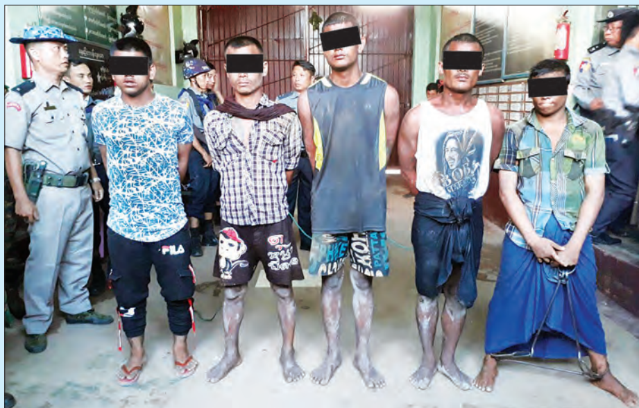
ဘားအံအကျဉ်းထောင်မှ ထွက်ပြေးသွားသည့် အကျဉ်းသားများအနက်မှ ဖမ်းဆီးရမိသူအချို့ကို လုံခြုံရေးတပ်ဖွဲ့ဝင်များနှင့်အတူ တွေ့ရစဉ်။