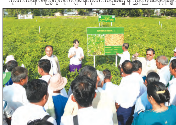
သိမ့်သိမ့်မိုး (မြန်မာ့အလင်း)