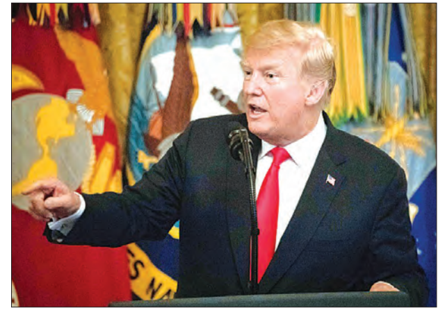
ထိပ်သီးစီးပွားရေးနိုင်ငံကြီး နှစ်ကြား ကုန်သွယ်ရေးတင်းမာမှုကို လျော့ချပေးနိုင်မည်ဟု မျှော်လင့်ခဲ့ကြသည်။ အေအက်စ်ပီ

ဝါရှင်တန်နှင့် ပေကျင်းကြား ကုန်သွယ်ရေးတင်းမာမှုကို လျော့ချတော့မည်လား ဟု မျှော်လင့်ချက်ကို အားနည်းစေခဲ့သည်။ ကြာသပတေးနေ့ကလည်း အမေရိကန်က ကမ်းလှမ်းလာသော ကုန်သွယ်ရေးဆွေးနွေးပွဲကို တရုတ်နိုင်ငံမှ ကြိုဆိုခဲ့ပြီး ကမ္ဘာ