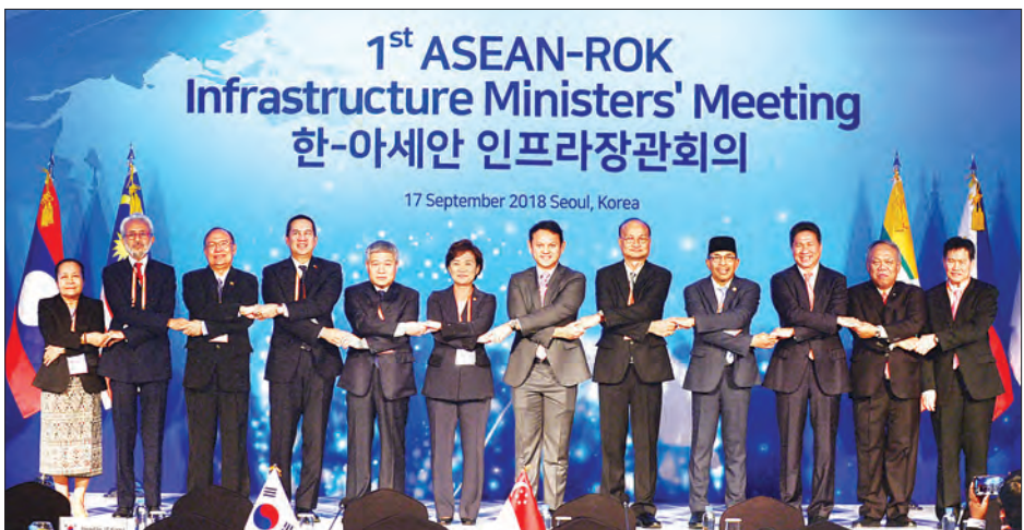
ဖလှယ်ခဲ့ကြသည်။ ARIMM အစည်းအဝေးနှင့် ဆက်စပ်၍ 2018 သို့ တက်ရောက်ခဲ့ကြောင်း သတင်းဆက်လက်၍ ပြည်ထောင်စုဝန်ကြီး ကျင်းပသည့် Global Infrastructure Cooperation Conference- GICC ရရှိသည်။ သတင်းစဉ်

ပထမဦးဆုံးအကြိမ် ကျင်းပခြင်းဖြစ်ပြီး ကိုရီးယားသမ္မတနိုင်ငံနှင့် အာဆီယံနိုင်ငံများအကြား အခြေခံအဆောက်အအုံကဏ္ဍ ဖွံ့ဖြိုးတိုးတက်ရေးအတွက် ပိုမိုနီးကပ်စွာ ပူးပေါင်းဆောင်ရွက်နိုင်ရန် ရည်ရွယ်ချက်ဖြင့် ကျင်းပခြင်းဖြစ်သည်။ အစည်းအဝေးမစတင်မီ ပြည်ထောင်စုဝန်ကြီးသည် ကိုရီးယားသမ္မတနိုင်ငံ၊ မြေယာ၊ အခြေခံအဆောက်အအုံနှင့် ပို့ဆောင်ရေးဝန်ကြီးဌာန ဝန်ကြီး Ms. Kim Hyun Mee နှင့် သီးခြားတွေ့ဆုံခဲ့ပြီး ကိုရီးယားသမ္မတနိုင်ငံ၏ ချေးငွေဖြင့် ဆောင်ရွက်လျက်ရှိသည့် ပို့ဆောင်ရေးနှင့် ဆက်သွယ်ရေးစီမံကိန်းများ၊ ဆက်လက်ပူးပေါင်းဆောင်ရွက်နိုင်မည့် အခြေအနေများနှင့် စပ်လျဉ်း၍ ရင်းနှီးပွင့်လင်းစွာ ဆွေးနွေးအမြင်ချင်း