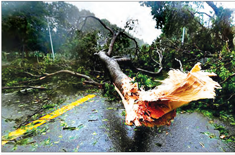
အင်အားပြင်းမုန်တိုင်း မန်ခတ်တိုက်ခတ်ပြီးနောက် ပြိုလဲကျနေသည့် သစ်ပင်ကြီးများကိုတွေ့ရစဉ်။

အင်အားပြင်း တိုင်ဖုန်းမုန်တိုင်း မန်ခတ်သည် ပြီးခဲ့သည့် ရက်သတ္တပတ်က ဖိလစ်ပိုင်နိုင်ငံနှင့် တရုတ်နိုင်ငံတောင်ပိုင်း ဒေသသို့ ဝင်ရောက်ခဲ့ပြီး မိုးသည်းထန်စွာရွာသွန်းခြင်းနှင့် လေပြင်းမုန်တိုင်းများ တိုက်ခတ်ခဲ့သည်။ ဆင်ဟွာ