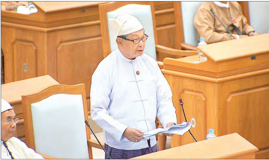
ပြည်ထောင်စုဝန်ကြီး ဦးကျော်တင်ဆွေ ရှင်းလင်းတင်ပြစဉ်။

လက်ရှိအချိန်ဟာ အေးချမ်းတည်ငြိမ်ပြီး ခိုင်မာတောင့်တင်းတဲ့ နိုင်ငံတော်ဖြစ်အောင် ပြန်လည်တည်ဆောက်နေရတဲ့ ကာလဖြစ်ပါတယ်။ တစ်ချိန်တည်းမှာပဲ နိုင်ငံလွတ်လပ်ရေးရရှိပြီးကတည်းက မျှော်မှန်းခဲ့ကြတဲ့ တရားမျှတခြင်း၊ လွတ်လပ်ခြင်းနဲ့ တန်းတူညီမျှခြင်းဆိုတဲ့ လောကပါလတရားတွေကို ရရှိစေပြီး နိုင်ငံရေးတရားမျှတမှု၊ စီးပွားရေးတရားမျှတမှု၊ လူမှုရေးတရားမျှတမှုစတဲ့ အခွင့်အရေး သာတူညီမျှခြင်းတွေ၊ ဝါဒရေးရာအရ ဖြူစင်တဲ့၊ အားလုံးအမြတ်