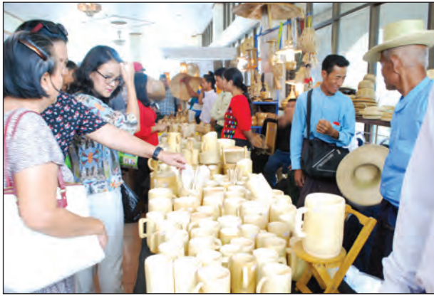
နိုင်ငံများတွင် ဝါးမီးသွေးသည် တစ်တန်လျှင် ဒေါ်လာ ၇၀၀-၈၀၀ အထိရှိကြောင်း သိရသည်။ အိမ်နီးချင်းနိုင်ငံဖြစ်သော တရုတ်နိုင်ငံတွင် ဝါးဖြင့်ပြုလုပ်သော ပါကေး၊ ပရိဘောဂအသုံးအဆောင်များ ထုတ်လုပ်ခြင်းများ ဖွံ့ဖြိုးတိုးတက်လျက်ရှိပြီး မြန်မာနိုင်ငံ ကြိမ်နှင့်ဝါးလုပ်ငန်းရှင်များအသင်းက သွားရောက်လေ့လာကာ ပြည်တွင်း၌ အသိပညာများ ပြန့်လှင်းဖြန့်ဝေပေးလျက်ရှိသည်။

မြန်မာနိုင်ငံတွင် ကချင်ပြည်နယ်၊ ကရင်ပြည်နယ်၊ ရခိုင်ပြည်နယ်နှင့် တနင်္သာရီတိုင်းဒေသကြီးတို့၌ ဝါးတောများ အဓိကပေါက်ရောက်ပြီး ဝါးအမျိုးအစားအလိုက် မျှစ်အချို့ မျှစ်အချဉ်စသော စားသောက်ကုန်များထုတ်လုပ်သလို စက်မှုကုန်ကြမ်း၊ လက်မှုထည်လုပ်ငန်းနှင့် ဆောက်လုပ်ရေးလုပ်ငန်းများတွင်လည်း ဝါးကို တွင်ကျယ်စွာ အသုံးပြုလျက်ရှိသည်။ ဝါးသည် စနစ်တကျထုတ်ယူပြီး တန်ဖိုးရှိအောင် သုံးစွဲ၍ရသော အပင်အမျိုးအစားဖြစ်ကြောင်း သိရသည်။ ဝါးထုတ်ကုန်သည် မျှစ်မူ ဝါးရွက်အထိ သုံး၍ရပြီး ဝါးတူး၊ သွားကြားထိုးတံအထိ အသုံးဝင်ကြောင်းလည်း သိရသည်။ အချို့