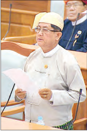
စီမံကိန်းနှင့် ဘဏ္ဍာရေးဝန်ကြီးဌာန ဒုတိယဝန်ကြီး ဦးမောင်မောင်ဝင်း

အက်ဖြတ်၍ Group A,B,C, သုံးမျိုး ခွဲခြားထားပါကြောင်း။