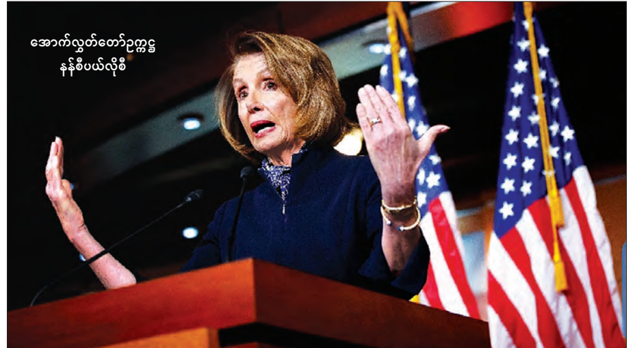
အောက်လွှတ်တော်ဥက္ကဋ္ဌ နန်စီပယ်လိုစီ