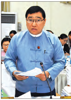
ပြည်ထောင်စုဝန်ကြီး ဒေါက်တာဝင်းမြတ်အေး