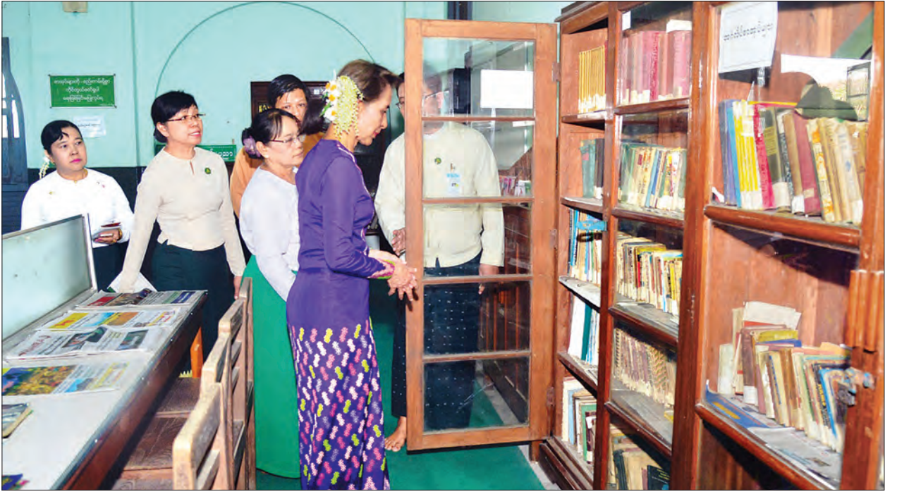
နိုင်ငံတော်၏အတိုင်ပင်ခံပုဂ္ဂိုလ် ဒေါ်အောင်ဆန်းစုကြည် အမှတ်(၁)အခြေခံပညာအထက်တန်းကျောင်း (ပန်းဘဲတန်း) ကျောင်းစာကြည့်တိုက်ကို ကြည့်ရှုစဉ်။ သတင်းစဉ်