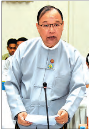
ပြည်ထောင်စုဝန်ကြီး ဦးသန်းစင်မောင်