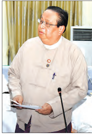
ပြည်ထောင်စုဝန်ကြီး ဦးဝင်းခိုင်