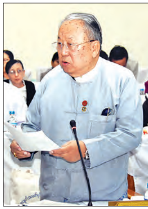
မြန်မာနိုင်ငံတော်ဗဟိုဘဏ်ဥက္ကဋ္ဌ ဦးကျော်ကျော်မောင်

Plan များ ပေါ်ပေါက်လာစေပါကြောင်း။ တစ်နှစ်တစ်ကြိမ် ဆောင်ရွက်သင့် စာရင်းအင်းဆိုင်ရာ အသိပညာ (Statistical Literacy) နှင့် အချက် အလက်များကို အသုံးပြုသည့် အလေ့ အထ (Data Culture)ကို ဌာနဆိုင်ရာ များ၌သာမက အများပြည်သူနှင့် ပုဂ္ဂလိက စီးပွားရေးအဖွဲ့အစည်းများ အကြား၌ပါ ပျံ့နှံ့အောင် ဆောင်ရွက်ကြရမည် ဖြစ်ပါ ကြောင်း၊ စာရင်းအင်းပညာ ( Statistics Literacy)ကို မြှင့်တင်သည့်အနေဖြင့် စာရင်းအင်းနှင့်သက်ဆိုင်သည့် Stake holders များအကြား ပူးပေါင်းဆောင် ရွက်ရန် Platform တစ်ခုအဖြစ် မြန်မာ ဆောင်ရွက်သင့်ပါကြောင်း။ ကမ္ဘာ့နိုင်ငံများအနေဖြင့် ရေရှည်