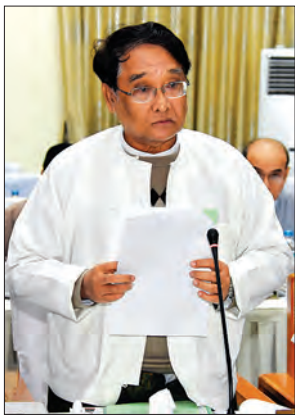
ပြည်ထောင်စုဝန်ကြီး ဒေါက်တာသန်းမြင့်