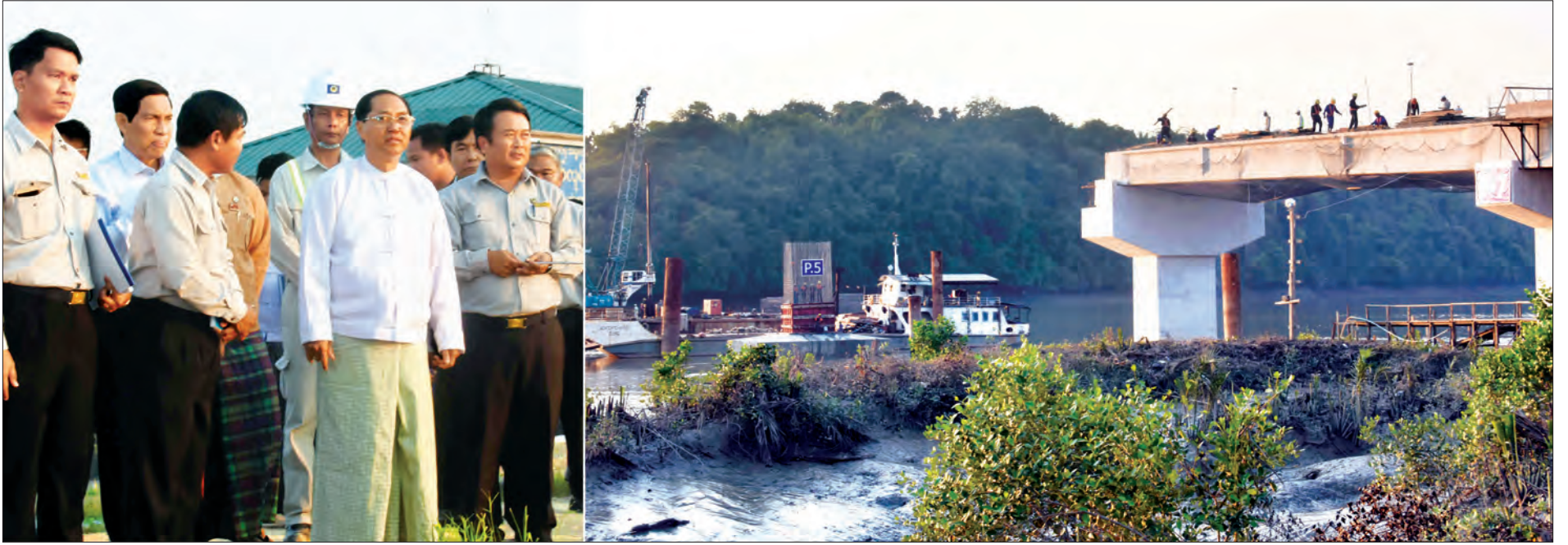
ဒုတိယသမ္မတ ဦးမြင့်ဆွေ သမုတ်-လွတ်လွတ်တံတား တည်ဆောက်ရေးလုပ်ငန်းခွင်ကို ကြည့်ရှုစဉ်။