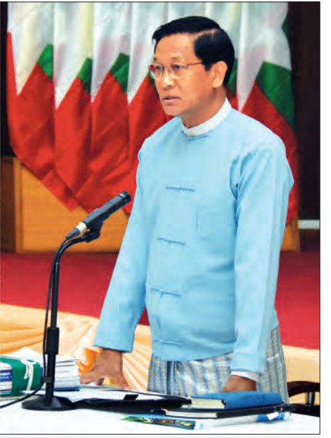
ဒုတိယသမ္မတ ဦးဟင်နရီပန်ထီးယူ စာရင်းအင်းအချက်အလက်မှန်ကန်ရေးနှင့် အရည်အသွေးပြည့်ဝရေး ပဟိုကော်မတီအစည်းအဝေးတွင် အမှာစကားပြောကြားစဉ်။ သတင်းစဉ်

နယ်ခြားမှတ်တိုင် (၄၁)ရဲကင်းစခန်း အား ပစ်ခတ်ခံရမှု နှင့် စပ်လျဉ်း၍ မြန်မာနိုင်ငံဆိုင်ရာ ဘင်္ဂလားဒေ့ရှ် သံအမတ်ကြီးအား ခေါ်ယူတွေ့ဆုံပြီး သံတမန်စာပေးအပ် စာမျက်နှာ ၁၃