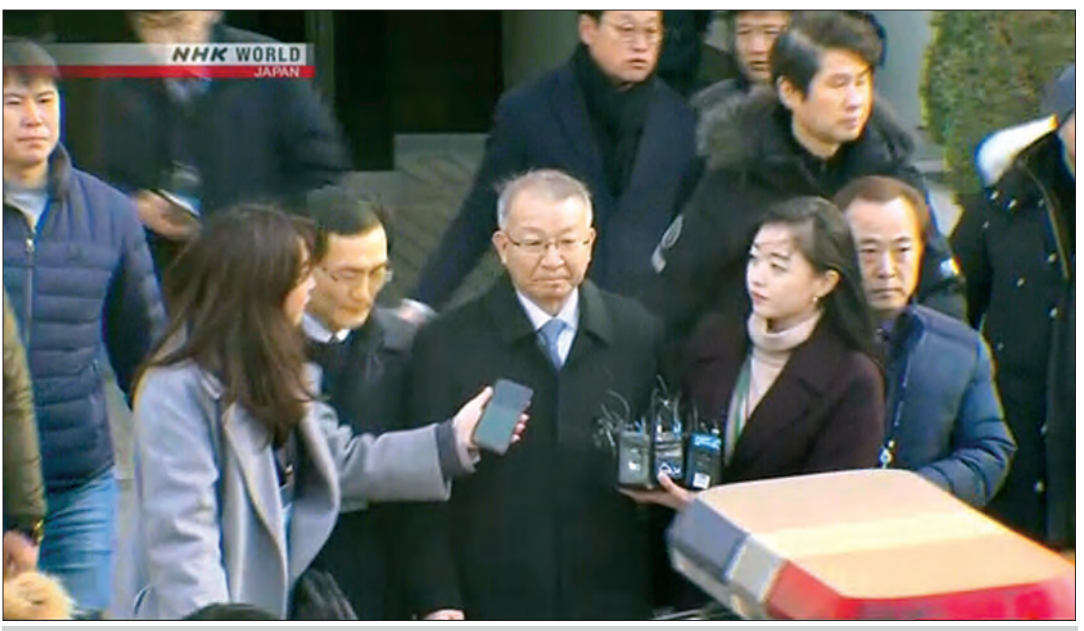
တောင်ကိုရီးယားတရားရုံးချုပ်အကြီးအကဲဟောင်း ရန်ဆန်ထယ်ကို လူအုပ်ထဲ၌ တွေ့ရစဉ်။

တောင်ကိုရီးယားတရားရုံးချုပ်အကြီးအကဲဟောင်း ရန်ဆန်ထယ်ကို ကြာသပတေးနေ့တွင် ဖမ်းဆီးလိုက်ပြီးနောက် ၎င်းအား လုပ်ပိုင်ခွင့်အာဏာကို အလွဲသုံးစားပြုမှု၊ စစ်အတွင်းအမွေလုပ်အားခိုင်းစေမှုကိစ္စ စီရင်ဆုံးဖြတ်ရာတွင် မတော်မတရားပြုလုပ်ကာ နှောင့်နှေးကြန့်ကြာအောင် ပြုလုပ်ခဲ့မှုတို့ဖြင့် စွပ်စွဲထားသည်။ လက်ရှိတရားရေးအကြီးအကဲမှာ ပြည်သူတို့၏မျှော်လင့်ချက်များကို ပျောက်ဆုံးစေခဲ့သည့်အတွက် တရားရုံးကို တောင်းပန်နေကြောင်း သိရသည်။ တရားရုံးချုပ် အကြီးအကဲဟောင်း ရန်ဆန်ထယ်ကို အစိုးရရှေ့နေများက သမ္မတဟောင်း ပတ်ဂွမ်ဟေးနှင့် အလိုတူအလိုပါ ဆောင်ရွက်ခဲ့သည်ဟု စွပ်စွဲထားသည်။ ဂျပန်က ပါဝင်ပတ်သက်နေသည့် စစ်အတွင်းလုပ်သားကိစ္စ ကြားနာစစ်ဆေးမှုများကို အချိန်ဆွဲထားခဲ့သည်ဟု ၎င်းကို စွပ်စွဲခဲ့သည်။ ထို့အပြင် ရန်ဆန်ထယ်သည် ၎င်းစိတ်ကြိုက်နည်းလမ်းဖြင့် တရားသူကြီးများအား တရားစီရင်ဆုံးဖြတ်စေရန် အတင်းအကျပ်ဖိအားပေးမှုများ လုပ်ဆောင်ခဲ့ပြီး ၎င်းနှင့်အယူအဆ သဘောထားမတိုက်ဆိုင်သူများကို အမည်ပျက်စာရင်းထည့်သွင်းခဲ့သည်ဟုလည်း စွပ်စွဲခြင်းခံထားရသည်။ ပြီးခဲ့သည့်နှစ်က တောင်ကိုရီးယားထိပ်တန်းတရားရုံးက စစ်အတွင်းလုပ်သားစေခိုင်းမှုကို ကြားနာစစ်ဆေး ခဲ့သည်။ တရားရုံးက ဂျပန်ကုမ္ပဏီများကို ဒုတိယကမ္ဘာစစ်အတွင်း အတင်းအကျပ် လုပ်သားအဖြစ် စေခိုင်းခံခဲ့ရသည့် အမျိုးသားများနှင့် အမျိုးသမီးများကို လျော်ကြေးပေးရန် အမိန့်ချမှတ်ခဲ့သည်။