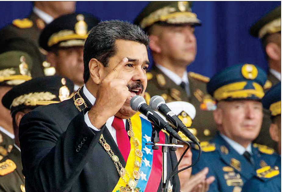
ပင်နီစွဲလားသမ္မတ နီကိုလပ်စ် မာဒူရိုကို တွေ့ရစဉ်။