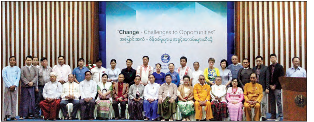
ပြည်ထောင်စုဝန်ကြီး နိုင်သက်လွင်နှင့်တာဝန်ရှိသူများ စုပေါင်းမှတ်တမ်းတင်ဓာတ်ပုံရိုက်ကြစဉ်။

ထိုအခွင့်အလမ်းများ ဖန်တီးပေးနိုင် ရန်အတွက် ပြည်တွင်းငြိမ်းချမ်းရေးသည်