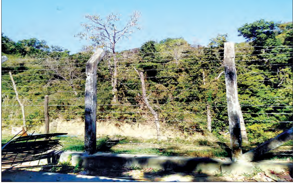
သောင်းကျန်းသူ (စိစစ်ဆဲ) အဖွဲ့က ဘင်္ဂလားဒေ့ရှ်နိုင်ငံဘက်ခြမ်း မီတာ ၂၀၀ ခန့်အကွာမှ ပစ်ခတ်တိုက်ခိုက်သည့်နေရာကို တွေ့ရစဉ်။