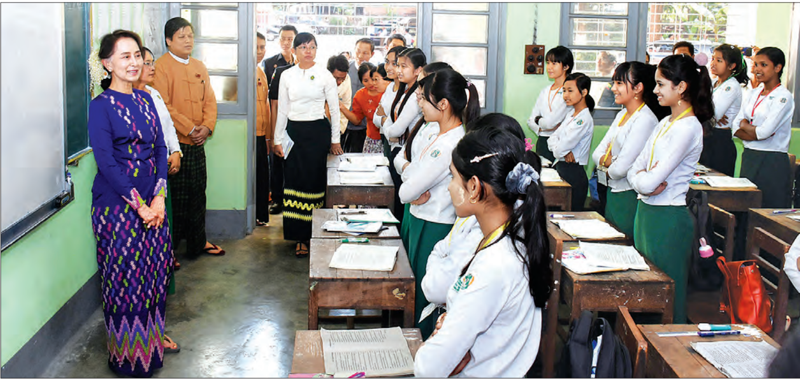
နိုင်ငံတော်၏အတိုင်ပင်ခံပုဂ္ဂိုလ် ဒေါ်အောင်ဆန်းစုကြည် အမှတ်(၁)အခြေခံပညာအထက်တန်းကျောင်း (ပန်းဘဲတန်း) အဋ္ဌမတန်းတွင် ပညာသင်ကြားနေသော ကျောင်းသူများအား အားပေးစကားပြောကြားစဉ်။ သတင်းစဉ်

ပုဂ္ဂိုလ်သည် ကျောင်းအစည်းအဝေး ခန်းမ၌ မိဘဆရာအသင်းမှ ကျောင်းသား မိဘများ၊ ကျောင်းအုပ်ဆရာမကြီးနှင့် ဆရာမများအား တွေ့ဆုံပြီး ကျောင်း၏ လိုအပ်ချက်များကို မေးမြန်းကာ လိုအပ် သည်များကို ပေါင်းစပ်ညှိနှိုင်း ဖြည့်ဆည်း ဆောင်ရွက်ပေးသည်။ ပန်းဘဲတန်းမြို့နယ် အမှတ်(၁) အခြေခံပညာအထက်တန်းကျောင်းကို ၁၈၈၆ ခုနှစ် ဖေဖော်ဝါရီလ ၂၃ ရက်နေ့ တွင် စတင်တည်ထောင်ခဲ့သည်။ ယခင်က ခရစ်ယာန် သာသနာပြုကျောင်းဖြစ် ပြီး စိန့်မေရီဒိုင်အိုစီဇင် မိန်းကလေး အထက်တန်းကျောင်းဟု ခေါ်သည်။ ၁၉၆၅ ခုနှစ် ဧပြီလ ၁ ရက်နေ့တွင် အမှတ် (၁) အခြေခံပညာအထက်တန်းကျောင်း အမည်ပြောင်းလဲ သတ်မှတ်ခေါ်တွင်ခဲ့ ကြောင်း သိရသည်။ မိန်းကလေးအထက် တန်းကျောင်းဖြစ်ပြီး လက်ရှိ ကျောင်းသူ ၂၇၃ ဦး ပညာသင်ကြားလျက်ရှိသည်။ တက္ကသိုလ်ဝင် စာမေးပွဲအောင်ချက် ရာခိုင်နှုန်းအနေဖြင့် ၂၀၁၅-၂၀၁၆ ပညာ သင်နှစ်တွင် ၂၀ ရာခိုင်နှုန်း၊ ၂၀၁၆-၂၀၁၇ ပညာသင်နှစ်တွင် ၄၂ ဒသမ ၄၂ ရာခိုင် နှုန်း၊ ၂၀၁၇-၂၀၁၈ ပညာသင်နှစ်တွင် ၂၉ ဒသမ ၀၃ ရာခိုင်နှုန်းဖြစ်ကြောင်း သိရသည်။ သတင်းစဉ်