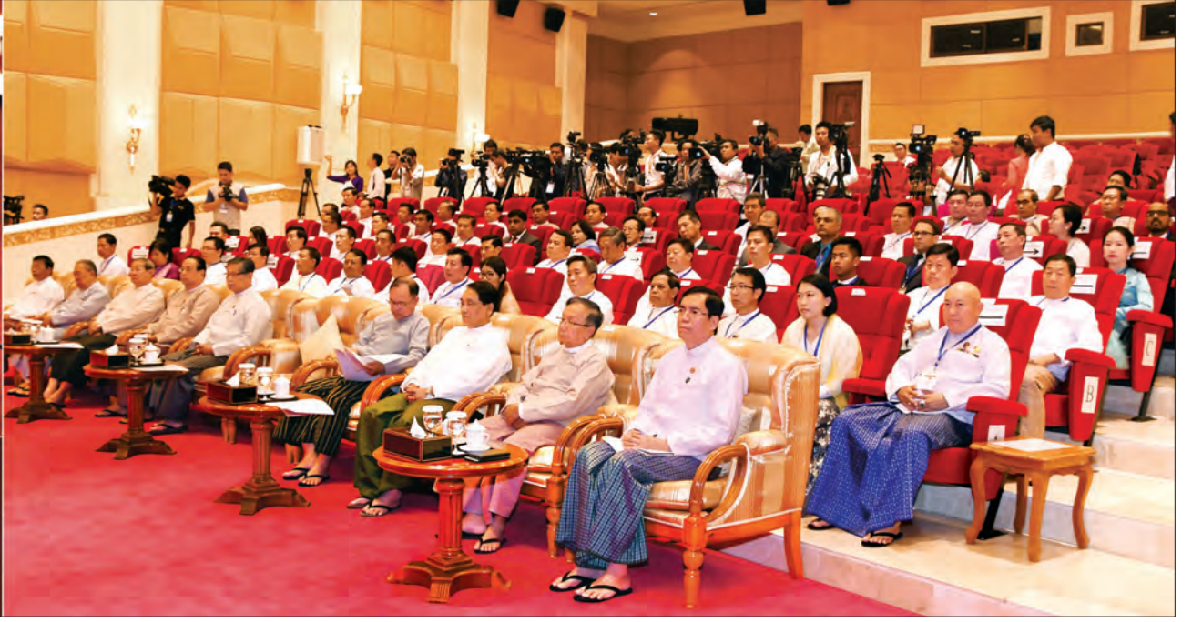
နိုင်ငံတော်သမ္မတ ဦးဝင်းမြင့် ၂၀၁၇-၂၀၁၈ စည်းကြပ်နှစ်အတွက် ဝင်ငွေခွန်၊ ကုန်သွယ်လုပ်ငန်းခွန်နှင့် အထူးကုန်စည်ခွန် အများဆုံးပေးဆောင်ခဲ့သူများအား ဂုဏ်ထူးဆောင်ဆုနှင့် ဂုဏ်ပြုမှတ်တမ်းလွှာ ပေးအပ်ချီးမြှင့်ခြင်း အခမ်းအနားတွင် အမှာစကားပြောကြားစဉ်။

◆ ရှေ့မှ မှီခိုခြင်းမဟုတ်ဘဲ နိုင်ငံသူနိုင်ငံသားများ၏ တာဝန်သိမှုနှင့် စီးပွားရေးဖွံ့ဖြိုးမှုကို ရောင်ပြန်ဟပ်သည့် အခွန်အကောက်များကို အမှီပြုမှသာ တည်ငြိမ်တိုးတက်နိုင်မည်ဖြစ်ပါကြောင်း၊ ထို့ကြောင့် နိုင်ငံတော်အတွင်း အခွန်ယဉ်ကျေးမှုတစ်ရပ် ပိုမိုဖြစ်ထွန်းစေရေးကို ဦးတည်၍ ယနေ့အခမ်းအနားကို ကျင်းပရခြင်းဖြစ်ကြောင်း။