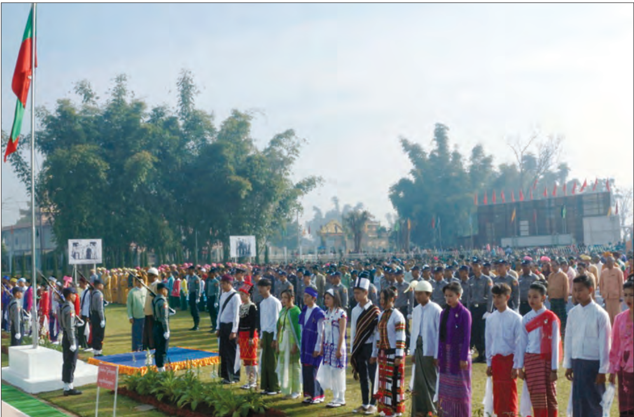
၂၀၁၈ ခုနှစ် ပင်လုံမြို့၌ ကျင်းပသော (၇၁)နှစ်မြောက် ပြည်ထောင်စုနေ့အခမ်းအနားတွင် တက်ရောက်လာကြသူများက နိုင်ငံတော်အလံအား အလေးပြုကြစဉ်။

လက်မှတ်ရေးထိုးနိုင်ခဲ့ကြပါတယ်။ အောင်ဆန်း-အက်တလီစာချုပ်ဟာ မြန်မာနိုင်ငံကို လွတ်လပ်ရေးပေးတဲ့စာချုပ် မဟုတ်ပေမယ့်လို့ လွတ်လပ်ရေးအတွက် အသွင်ကူးပြောင်းရေးကာလမှာ ဆောင်ရွက်ကြမယ့် ဗြိတိသျှ-မြန်မာ နှစ်ဖက်သဘောတူညီချက်တွေ ဖြစ်ပါတယ်။ အဲဒီဆွေးနွေးပွဲ ကို တက်ရောက်ကြတဲ့ မြန်မာကိုယ်စားလှယ်တွေထဲက သဘောမတူလို့ စာချုပ်မှာ လက်မှတ်မထိုးခဲ့တဲ့သူတွေကတော့ သခင်စိန်နဲ့ ဦးစောတို့ပဲဖြစ်ပါတယ်။ ဒါတင်မကသေးပါဘူး။ ဦးစောဟာ ဆွေးနွေးပွဲပြီးလို့ ရန်ကုန်ပြန်ရောက်တဲ့ အချိန်မှာ “ပိုလ်ချုပ်အောင်ဆန်းဟာ ဗြိတိသျှအစိုးရရဲ့ ဩဇာကိုမလွန်ဆန်နိုင်လို့ လက်မှတ်ထိုးခဲ့ရတာ။ လက်မှတ်ထိုးနေတဲ့အချိန် ပိုလ်ချုပ်ရဲလက်တွေ တုန်ယင်နေခဲ့တယ်” လို့ လုပ်ကြံလိမ္မော်ပြီး ဝါဒဖြန့်ခဲ့ပါသေးတယ်။ ဦးစောဟာ ပိုလ်ချုပ်အောင်ဆန်းကို နယ်ချဲ့သမားနဲ့ ပေါင်းပြီး တိုင်းပြည်ကို သစ္စာဖောက်တဲ့သူလို့ စွပ်စွဲပြီး ဖေဖော်ဝါရီလ ၁၉ ရက်နေ့မှာ ဘုရင်ခံအမှုဆောင်ကောင်စီကနေ နုတ်ထွက်သွားခဲ့ပါတယ်။ ဒါကိုကြည့်ရင် အသားထဲက လောက်ထွက်ဆိုတဲ့ စကားရဲ့အဓိပ္ပာယ်ကို ပုံဖော်နိုင်ကြလိမ့်မယ်ထင်ပါတယ်။