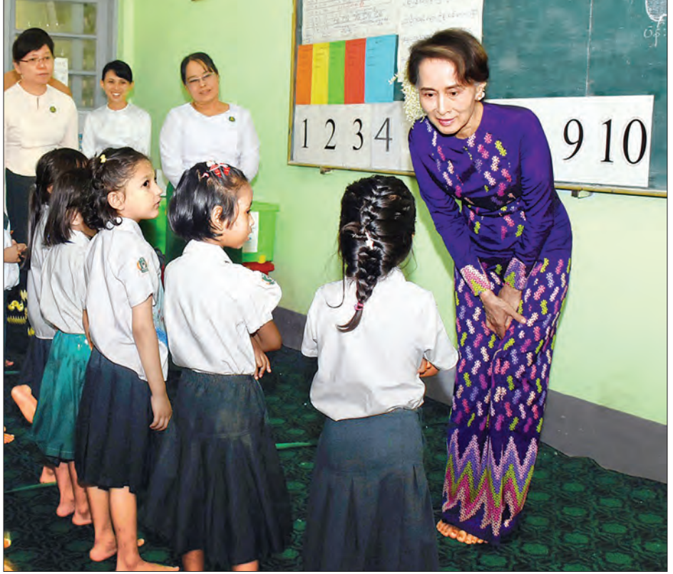
နိုင်ငံတော်၏အတိုင်ပင်ခံပုဂ္ဂိုလ် ဒေါ်အောင်ဆန်းစုကြည် အမှတ်(၁) အခြေခံပညာအထက်တန်းကျောင်း (ပန်းဘဲတန်း) KG တန်းတွင် ပညာသင်ကြားနေသော ကျောင်းသူလေးများ၏ ပညာသင်ကြားနေမှုအခြေအနေကို ရင်းရင်းနှီးနှီး မေးမြန်းစဉ်။ သတင်းစဉ်

နိုင်ငံတော်သမ္မတ ဦးဝင်းမြင့် ၂၀၁၇-၂၀၁၈ စည်းကြပ်နှစ်အတွက် ဝင်ငွေခွန်၊ ကုန်သွယ်လုပ်ငန်းခွန်နှင့် အထူးကုန်စည်ခွန် အများဆုံးပေးဆောင်ခဲ့သူများအား ဂုဏ်ထူးဆောင်ဆုနှင့် ဂုဏ်ပြုမှတ်တမ်းလွှာများ ပေးအပ်ချီးမြှင့်