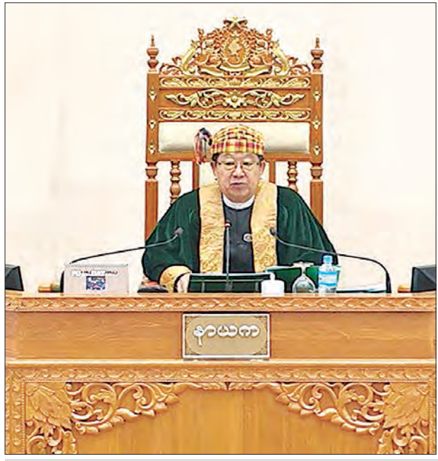
ပြည်ထောင်စုလွှတ်တော်နာယက ဦးတီခွန်မြတ်

စတုတ္ထအကြံပြုချက်အနေဖြင့် နိုင်ငံတကာပညာရေး မိတ်ဖက်အဖွဲ့အစည်းများနှင့် ပိုမိုပူးပေါင်းဆောင်ရွက်ရေးဖြစ်ပါကြောင်း၊ ကော်မရှင်နှင့် ကော်မတီများသည်