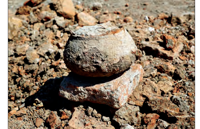
ထွန်ယက်ရာတွင် ပေါ်လာသည့် မြေအိုးကို တွေ့ရစဉ်။

ပေးရန်လိုအပ်နေပြီး ယခုကဲ့သို့ တွေ့ရှိ တောင်ငူဒေသခံတစ်ဦးက ပြောကြား ရသော နေရာများကို ကာကွယ် သည့်။ ရဲကင်းစခန်းများကို ထိန်းသိမ်းရန်လည်း လိုအပ်ကြောင်း ကိုလွင်(ဆွာ)