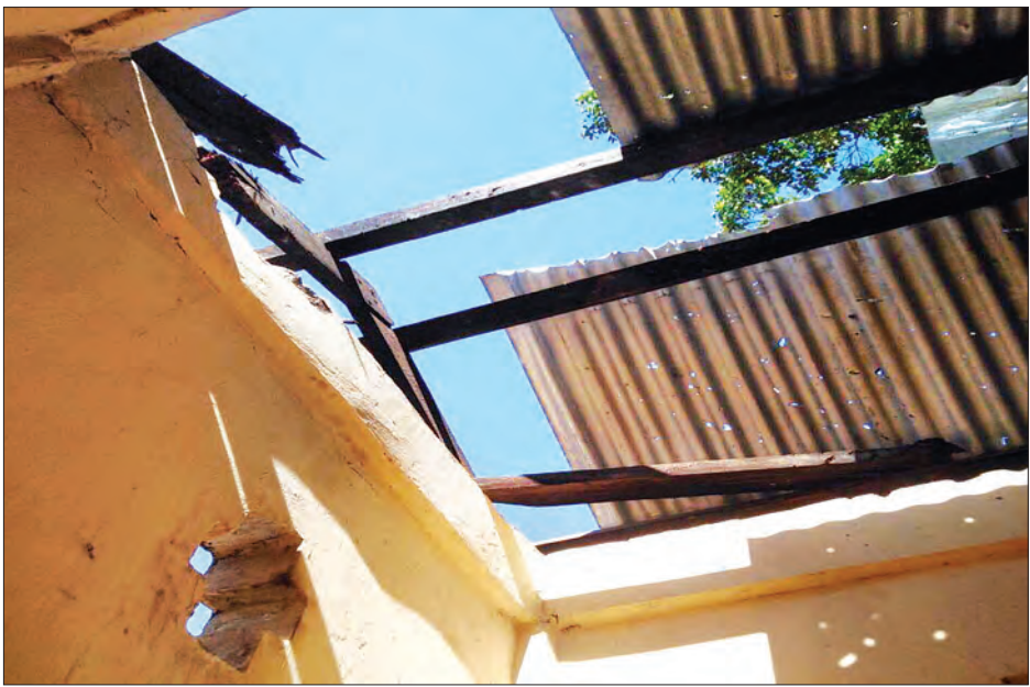
ကျည်ထိမှန်ထားသည့် ခေါင်မိုးအား တွေ့ရစဉ်။