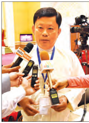
ဦးသိန်းဝင်းဇော်

အဓိကဖြစ်တဲ့အတွက်ကြောင့် လုပ်ငန်းတွေ စတင်ရက် ကတည်းက ကျသင့်တဲ့အခွန်ကို မှန်မှန်ကန်ကန် တိတိကျကျ ပေးဆောင်ဖို့ ကျွန်တော်တို့ဥက္ကဋ္ဌက ညွှန်ကြားခဲ့ပါတယ်။ အဲဒီလိုပဲ ဆောင်ရွက်ခဲ့ပါတယ်။ တိုင်းပြည်တည်ဆောက်ရေး အတွက် မရှိမဖြစ်တဲ့အခွန်ကို ပေးဆောင်တဲ့အတွက်ကြောင့် တိုင်းပြည်အတွက်လည်း အကျိုးရှိ၊ ပြည်သူ့အတွက်လည်း အကျိုးရှိပါတယ်။ မိမိတစ်ဦးတည်း ချမ်းသာတာမဟုတ်ဘဲ နှစ်စဉ်ကျင့်ကျင့် ဘယ်လိုအကျိုးပြုကြမလဲဆိုတာကို အားလုံးက ဒီနေ့စဉ်းစားသုံးသပ် ဆောင်ရွက်နေကြပါတယ်။ အထိုရောက်ဆုံး နည်းလမ်းကတော့ အခွန်ဆောင်တဲ့နည်းလမ်းပဲ ဖြစ်ပါတယ်။ အခွန်ဆောင်ခြင်းအားဖြင့် နိုင်ငံတော်တည်ဆောက်ရေးလုပ်ငန်း