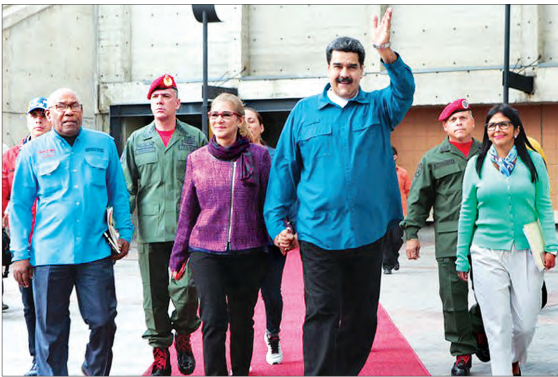
ပင်နီဇွဲလားသမ္မတ နီကိုးလပ်စ် မာဒူရိုနှင့်နီး ကာရာကရို ဆွေးနွေးပွဲတစ်ခုသို့ တက်ရောက်လာစဉ်။

အစိုးရကိုဆန့်ကျင်တဲ့ ဆန္ဒဖော်ထုတ်မှုတွေ အများအပြားဟာ တစ်ညလုံးပေါ်ထွက်ခဲ့ပါတယ်။ အတိုက်အခံခေါင်းဆောင်က ဇန်နဝါရီ ၁၀ရက်မှာ ဒုတိယအကြိမ် သမ္မတသက်တမ်းအဖြစ် ဆောင်ရွက်ဖို့ ကျမ်းသစ္စာကျိန်ဆိုခဲ့တဲ့ မာဒူရိုကိုဖြတ်ချစ်ဖို့ဟာ အချိန်မှာ အချိန်ကောင်းပါ။ ဘာကြောင့်လဲဆိုတော့ မာဒူရိုအစိုးရအဖွဲ့ဟာ စီးပွားရေးအကျပ်အတည်းကျရောက်မှုဝန်ထုပ်ဝန်ပိုးအောက်မှာ ပြုလဲလာနေသလို ခါတိုင်းထက်လည်း ပိုပြီးတော့ သီးခြားဆန့်လာ