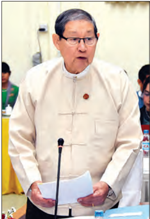
ပြည်ထောင်စုဝန်ကြီး ဦးစိုးဝင်း

တိုက်တွန်းလိုပါကြောင်း။ ကျင်းပနိုင်ခဲ့ စာရင်းအင်းဆိုင်ရာ အချက်အလက် ထုတ်ပြန်သူများနှင့် အချက်အလက်သုံးစွဲ သူများအကြား ဆက်ဆံရေးကောင်းမွန် ရေး၊ လိုအပ်နေသည့် စာရင်းအင်းများ ဖြည့်ဆည်းရေးနှင့် အကျိုးသက်ဆိုင်သူ Stakeholders များအကြား ပူးပေါင်း ဆောင်ရွက်ရန်ပြုလုပ်သည့် Platform တစ်ရပ်အဖြစ် မြန်မာစာရင်းအင်းဖိုရမ် (၂၀၁၈) ကို ပထမအကြိမ် ကျင်းပနိုင်ခဲ့ သည့်အတွက်လည်း ဂုဏ်ယူပါကြောင်း၊ အဆိုပါဖိုရမ်မှ Stakeholders များ အကြား ပူးပေါင်းဆောင်ရွက်ရန် Action