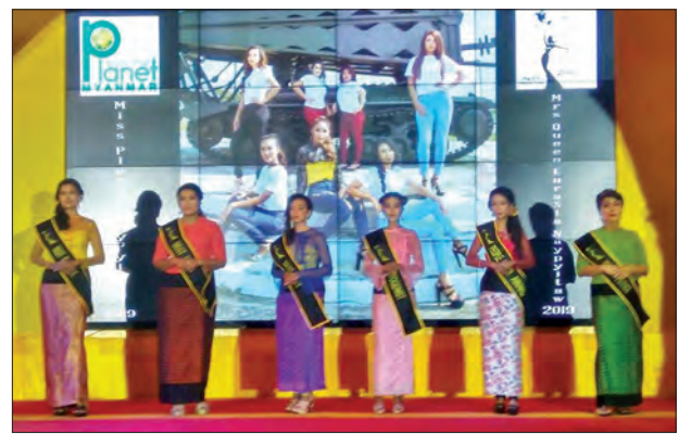
နေပြည်တော် Hilton Hotel တွင် ဇန်နဝါရီ ၂၀ ရက်က အိမ်ထောင်သည်အမျိုးသမီးများ Miss မြိုင်ပွဲ Miss Planet 2019 & Mrs Queen Eurasia Myanmar 2019 (Nay Pyi Taw) ကို ကျင်းပရာ အိမ်ထောင်သည်အမျိုးသမီးခြောက်ဦး ဝင်ရောက်ယှဉ်ပြိုင်ခဲ့ကြစဉ်။

နိုင်ငံတော်အစိုးရ၏ လူမှုကာကွယ်စောင့်ရှောက်ရေး ငွေကြေးထောက်ပံ့မှု အစီအစဉ်များတွင် အကျိုးဝင်ပါလျက်နှင့် အချိန်မီမရရှိလျှင်သော်လည်းကောင်း၊ ကလေးသူငယ်များနှင့် အမျိုးသမီးများအပေါ် အကြမ်းဖက်မှုများနှင့် ပတ်သက်၍သော်လည်းကောင်း၊ သတင်းပေးတိုင်ကြားလိုပါက အောက်ဖော်ပြပါ Help Line တယ်လီဖုန်းနံပါတ်များသို့ (၂၄) နာရီ တိုင်ကြားနိုင်ပါကြောင်း အသိပေးအပ်ပါသည်။ ၀၆၇-၃၄၄၄၂၂၂၊ ၀၆၇-၃၄၄၄၉၉၉ လူမှုဝန်ထမ်း၊ ကယ်ဆယ်ရေးနှင့် ပြန်လည်နေရာချထားရေးဝန်ကြီးဌာန လူမှုဝန်ထမ်းဦးစီးဌာန