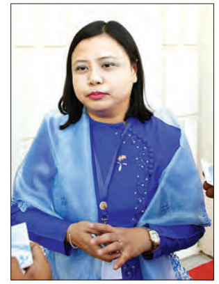
မယဉ်ယဉ်ဌေး

တဲ့ အခြေခံအဆောက်အအုံတွေ၊ ပညာရေး၊ ကျန်းမာရေး စတဲ့ နိုင်ငံတော်တိုးတက်မှုအပိုင်းတွေကို အကျိုးရှိရှိဆောင်ရွက်နိုင်မှာ ဖြစ်ပါတယ်။ အခွန်ပေးဆောင်ခြင်းက စီးပွားရေးတိုးတက်မှုကို တွန်းအားပေးတဲ့သဘောလည်း ဖြစ်ပါတယ်။ စီးပွားရေးကောင်း လေ အခွန်များများဆောင်နိုင်လေ၊ အခွန်များများဆောင်နိုင် လေ စီးပွားရေးပိုကောင်းလေပါ။ ကျွန်တော်တို့ ကုမ္ပဏီအနေနဲ့ အခွန်ထမ်းဆောင်တာရှိသလို ကုမ္ပဏီဝန်ထမ်းတွေကလည်း ထမ်းဆောင်ကြပါတယ်။ အဲဒီဝန်ထမ်းတစ်သောင်းကျော်ကလည်း သက်ဆိုင်ရာ Personal Income Tax ကို အပြည့်အဝ ပေးဆောင်နေတဲ့ ကုမ္ပဏီတစ်ခုဖြစ်ပါတယ်။