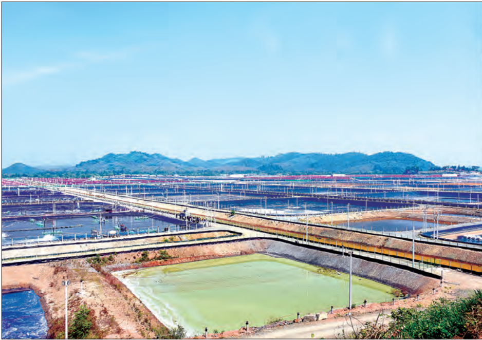
ဒုတိယသမ္မတ ဦးမြင့်ဆွေ ပြည်ထွန်းအင်တာနေရှင်နယ် ကုမ္ပဏီလီမိတက် ရေငန်ပုစွန် မွေးမြူရေးမှူးချုပ်ကို ကြည့်ရှုစဉ်။

စည်းမျဉ်း စည်းကမ်းများနှင့်အညီ ယင်းနောက် ဒုတိယသမ္မတက သိရှိလိုသည်များကို မေးမြန်းပြီး ယခု လုပ်ငန်းသည် ပုဂ္ဂလိကကဏ္ဍဖွံ့ဖြိုး တိုးတက်ရေး၏ ရှေ့ပြေးလုပ်ငန်း (Pilot Project) တစ်ခုဖြစ်သော ကြောင့် အောင်မြင်အောင် ဆောင်ရွက် ရန် ကြိုးပမ်းကြစေလိုကြောင်း၊ အောင်မြင်ပြီး တိုးချဲ့နိုင်သည်နှင့်အမျှ အလုပ်အကိုင် အခွင့်အလမ်းများ များစွာ ပေါ်ထွန်းလာမည်ဖြစ်ပါကြောင်း၊ ပျက်စီး ဆုံးရှုံးမှုများ မဖြစ်ပေါ်စေရန်နှင့် ဇီဝ လုံခြုံရေးအတွက် သတ်မှတ်ချက်များ နှင့်အညီ ဆောင်ရွက်ရန်နှင့် စည်းမျဉ်း စည်းကမ်းများနှင့်အညီ လိုက်နာ ဆောင်ရွက်ကြရန် လိုကြောင်း ပြောကြားသည်။