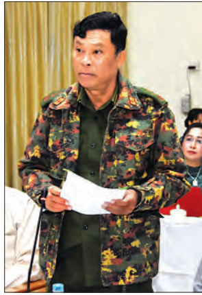
ပြည်ထောင်စုဝန်ကြီး ဒုတိယဗိုလ်ချုပ်ကြီး ကျော်ဆွေ