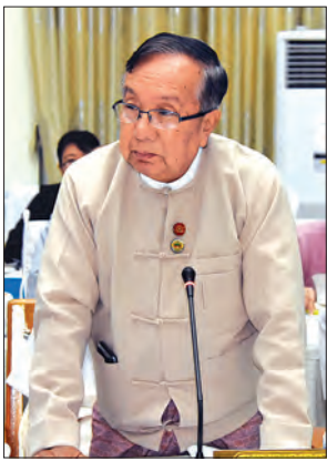
ပြည်ထောင်စုဝန်ကြီး ဦးဟန်ဇော်