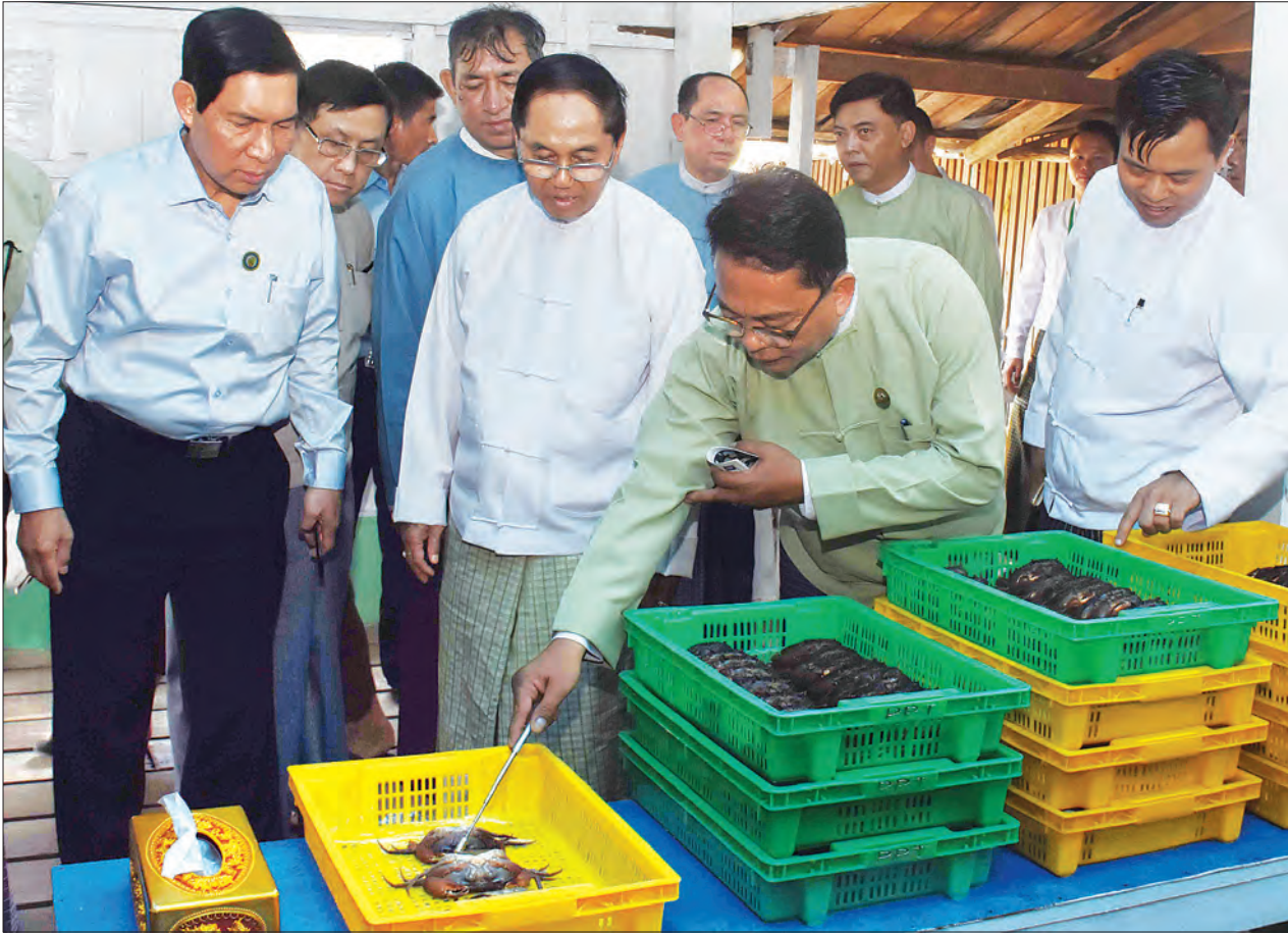
မြိတ် ဇန်နဝါရီ ၂၄

ဒုတိယသမ္မတ ဦးမြင့်ဆွေသည် ယနေ့တွင် တနင်္သာရီတိုင်းဒေသကြီး မြိတ်မြို့ရှိ မွေးမြူရေးလုပ်ငန်းများ၊ သင်္ဘောကျင်းလုပ်ငန်း၊ သစ်အချောထည်လုပ်ငန်း၊ ငါးပုစွန်အအေးခန်းစက်ရုံ၊ ရော်ဘာစက်ရုံနှင့် သမုတ် - လွတ်လွတ်တံတား တည်ဆောက်ရေး စီမံကိန်းတို့အား လှည့်လည်ကြည့်ရှုသည်။