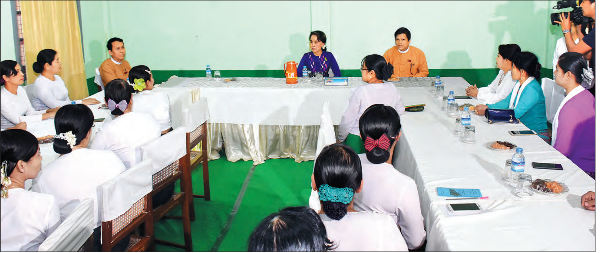
နိုင်ငံတော်၏အတိုင်ပင်ခံပုဂ္ဂိုလ် ဒေါ်အောင်ဆန်းစုကြည် အမှတ်(၁)အခြေခံပညာအထက်တန်းကျောင်း (ပန်းဘဲတန်း) အစည်းအဝေးခန်းမ၌ ကျောင်းအကျိုးတော်ဆောင်များ၊ ဆရာ ဆရာမများအား တွေ့ဆုံမှာကြားစဉ်။ သတင်းစဉ်