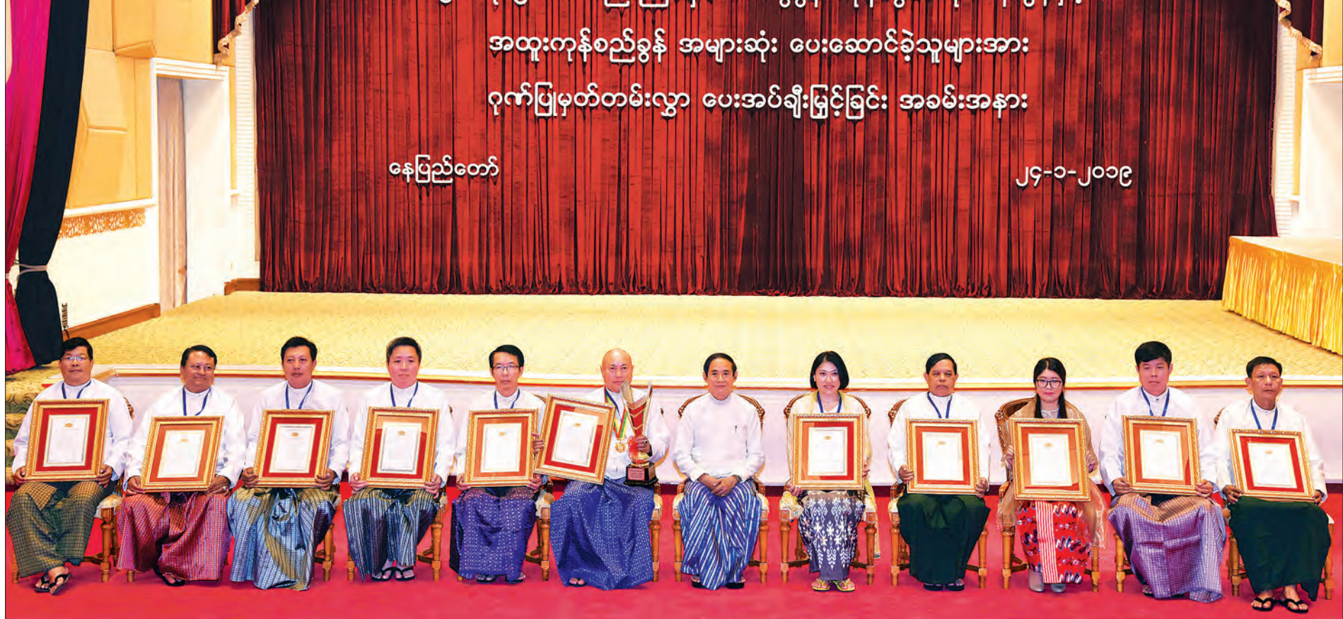
နိုင်ငံတော်သမ္မတ ဦးဝင်းမြင့် ၂၀၁၇-၂၀၁၈ ခုနှစ်အတွက် အထူးကုန်စည်ခွန်အများဆုံးပေးဆောင်ခဲ့ကြသော မြန်မာကုမ္ပဏီလုပ်ငန်းရှင်များနှင့် စုပေါင်းမှတ်တမ်းတင်ဓာတ်ပုံရိုက်စဉ်။