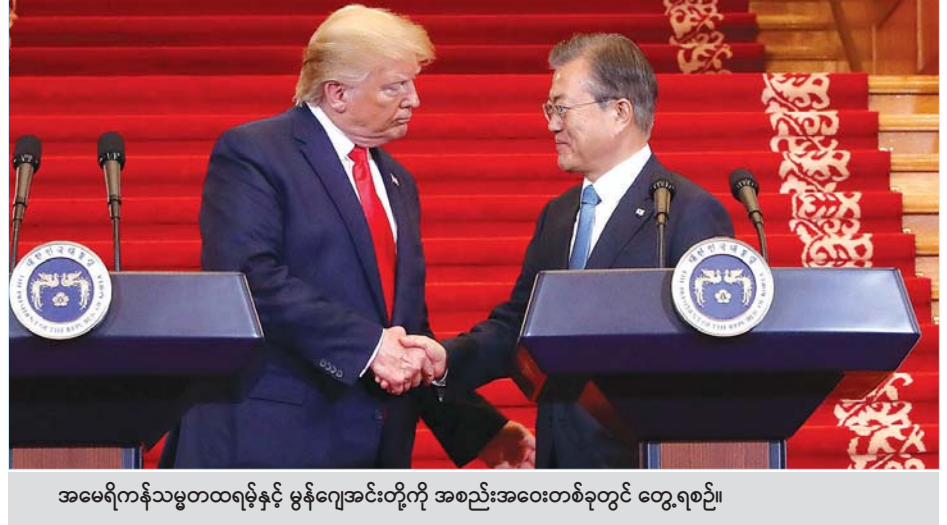
အမေရိကန်သမ္မတထရမ်နှင့် မွန်ဂျော့အင်းတို့ကို အစည်းအဝေးတစ်ခုတွင် တွေ့ရစဉ်။

ကိုင်တွယ်မည်နည်းဆိုသည့်ကိစ္စရပ် နှင့်ပတ်သက်၍ တောင်ကိုရီးယား သမ္မတ ဒေါ်နယ်ထရမ်နှင့် ဖုန်းဖြင့်