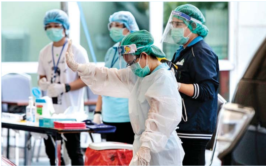
ဗန်ကောက်ရှိ ဗစ်ဟာဘာဒီဆေးရုံတွင် ဆေးဝန်ထမ်းများ ကိုရိုနာဗိုင်းရပ်စ်ကာကွယ်ရေးဝတ်စုံများ ဝတ်ဆင်ထားသည်ကို တွေ့ရစဉ်။