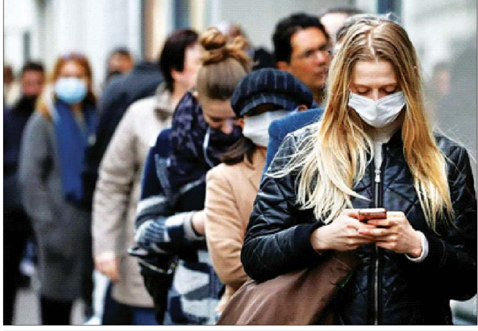
အစွတန်ဘူလ်လေဆိပ်တွင် အယ်လ်ဂျီးရီးယားနိုင်ငံမှ ခရီးသည်များကို တွေ့ရစဉ်။

ဝင်ရောက်ခွင့်မပြုကြောင်း လေဆိပ် တာဝန်ရှိသူများ၏ ပြောပြချက်အရ သိရသည်။ တူရကီနိုင်ငံက အယ်လ်ဂျီးရီးယားနိုင်ငံအနေဖြင့် အဆိုပါခရီးသွားများအား နေအိမ်သို့ ပြန်ခွင့်ပြုရန် တိုက်တွန်းထားသည်။ အိုင်ဂျီအေ၊ တူရကီကြက်ခြေနီ အဖွဲ့၊ တူရကီလေကြောင်းလိုင်းနှင့် ဟာဗက်စ် ဘတ်စ်ကားကုမ္ပဏီတို့က အယ်လ်ဂျီးရီးယား ခရီးသွား ၁၀၀၀ ကျော်ကို ရက်အတန်ကြာသည်အထိ လူသားချင်းစာနာထောက်ထားမှု ဆိုင်ရာ လိုအပ်ချက်များ ဖြည့်ဆည်း ပေးနိုင်ရန် ကြိုးပမ်းခဲ့ကြောင်း အော်ပရေတာက တွစ်တာပေါ်၌ ဖော်ပြခဲ့သည်။ တူရကီနိုင်ငံ၌ ဗိုင်းရပ်စ်ကူးစက် ခံရသူ အရေအတွက် ၃၄၃ ဦးထပ်မံ တိုးပွားလာမှုကြောင့် ကူးစက်ခံရသူ အရေအတွက် စုစုပေါင်း ၁၈၅၂ ဦး ရှိလာကာ သေဆုံးသူ ၄၄ ဦးအထိရှိလာ ကြောင်း တူရကီကျန်းမာရေးဝန်ကြီး ဖာရက်တင်ကိုကာက မတ် ၂၄ ရက် တွင် ကြေညာခဲ့သည်။ အေအက်ဖ်ပီ