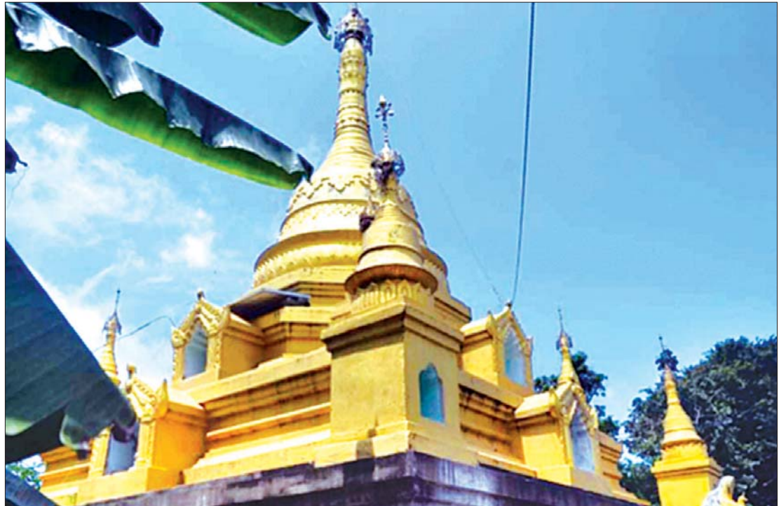
ကင်းသာရွာ၌ တည်ထားကိုးကွယ်သည့် နန်းဦးဘုရား။

တောင်ဘက်ကုန်းမြေပေါ်ရှိ ကံရိုးကြီးရွာနှင့် ကျောခိုင်း၊ ဤနယ်အတွင်းရှိ ကျေးရွာများကို ထုံးတမ်းစဉ်လာအတိုင်း အုပ်ချုပ်ရပါသည်။ ရှေးအခါက ဤနယ်သားများသည် ကင်းစခန်းများတွင် ကင်းသားတာဝန်ထမ်းခဲ့ကြသည်။ ကင်းသားများကို အခွန်ကောက်ခံခြင်းမပြုပါ။ ကျွန်ကျေးရွာသားများ၏ တရားကွမ်းဘိုး၊ အကောက်အစားများကို တောင်ငူမြို့ရုံးတော်သို့ ဆက်သွင်းရပါသည်။ အရှင်ခမည်းတော် (အလောင်းဘုရား)နှင့် ယခုလက်ထက် တိုင်အောင် ကင်းစခန်းများမထားရှိတော့ပါ။ တောင်ငူမြို့ရုံးတော်က စီမံသည့်အတိုင်း ကင်းသားဟောင်းများကို အုပ်ချုပ်ပါသည်။ အသည်၊ အလာ၊ ဝင်နေကပ္ပိုးတို့ကို အခြား