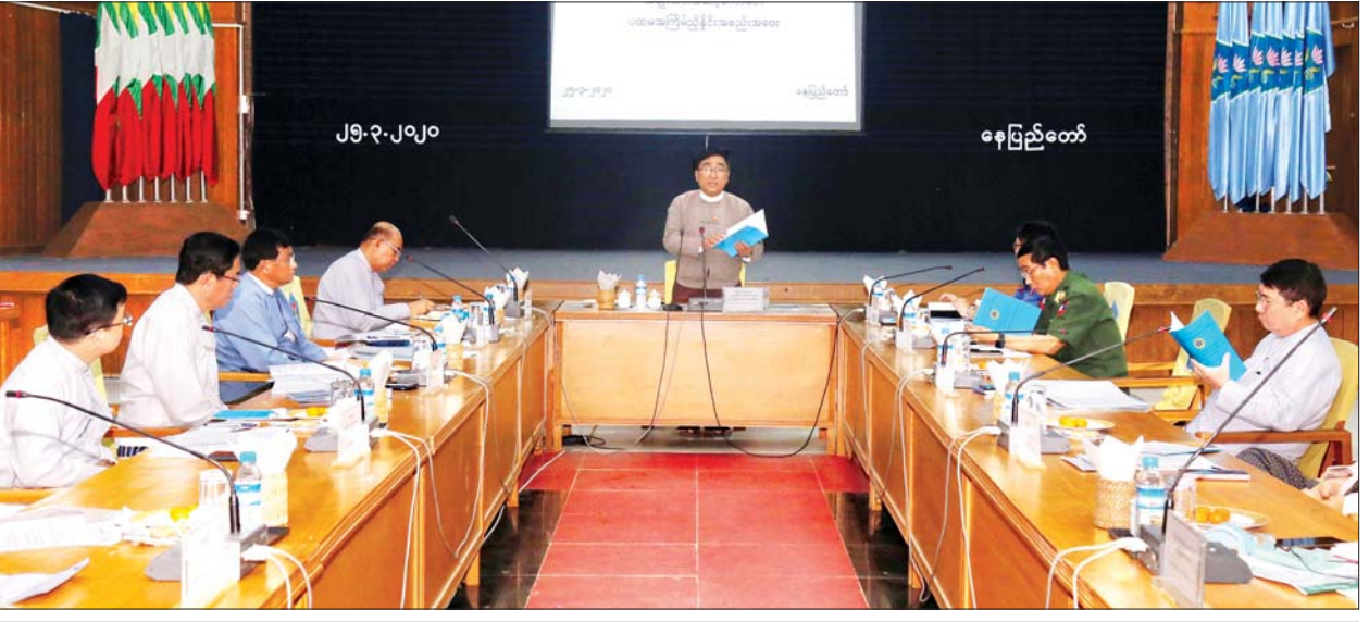
ပြည်ထောင်စုဝန်ကြီး ဒေါက်တာဝင်းမြတ်အေး ပြည်တွင်းနေရပ်စွန့်ခွာသူများ ပြန်လည်နေရာချထားရေးနှင့် ယာယီခိုလှုံရာစခန်းများ ပိတ်သိမ်းရေးဆိုင်ရာ အမျိုးသားအဆင့်ကော်မတီ ညှိနှိုင်းအစည်းအဝေးတွင် အမှာစကားပြောကြားစဉ်

မိမိတို့ အမျိုးသားကော်မတီ၏ လုပ်ငန်းအကောင်အထည်ဖော် ဆောင်ရွက် မှုများကို (၆)လ တစ်ကြိမ် ပြည်ထောင်စုအစိုးရအဖွဲ့ထံသို့ အစီရင်ခံစာပြ ကြရမည်ဖြစ်ပါကြောင်း၊ လူ့မွဲခံယူခြင်း၊ ကယ်ဆယ်ရေးနှင့် ပြန်လည်နေရာချထား ရေးဝန်ကြီးဌာနအနေဖြင့် ယာယီခိုလှုံရာစခန်းများ ပိတ်သိမ်းရေးကို မဟာဗျူဟာ မပေါ်ပေါက်ခင်ကပင် ဆောင်ရွက်နေခြင်းဖြစ်ပြီး ယခုအခါ အမျိုးသားအဆင့် ကော်မတီ ပေါ်ပေါက်လာပြီဖြစ်၍ ဆက်လက် တာဝန်ယူဆောင်ရွက်သွားမည် ဖြစ်ပါကြောင်း၊ သက်ဆိုင်ရာပြည်နယ်များတွင် ဖွဲ့စည်းထားသော ဆက်စပ် ကော်မတီများ၊ လုပ်ငန်းကော်မတီများနှင့် ညှိနှိုင်းပူးပေါင်းခြင်း၊ ကြီးကြပ်ကွပ်ကဲ ခြင်းများကိုလည်း ဆောင်ရွက်သွားကြမည်ဖြစ်ကြောင်း၊ ပြည်တွင်းနေရပ် စွန့်ခွာသူများ ပြန်လည်နေရာချထားရေးနှင့် ယာယီခိုလှုံရာစခန်းများ ပိတ်သိမ်း ရေးလုပ်ငန်းသည် ငြိမ်းချမ်းရေးလုပ်ငန်းစဉ်နှင့် များစွာဆက်စပ်ပါကြောင်း၊ ထို့ကြောင့် လုပ်ငန်းအကောင်အထည်ဖော်မှုများကို အမျိုးသားပြန်လည် သင့်မြတ်ရေးနှင့် ငြိမ်းချမ်းရေးဗဟိုဌာနကိုလည်း တင်ပြဆောင်ရွက်ရန် အရေးကြီးပါကြောင်း၊ မိမိတို့နိုင်ငံအနေဖြင့် နိုင်ငံတကာဖိအားများစွာရှိနေပါ ကြောင်း၊ နေရပ်စွန့်ခွာသူများအတွက် ဆောင်ရွက်ပေးရာတွင် ၎င်းတို့၏ အခွင့် အရေးများကို လျစ်လျူမရှုဘဲ ကြိုးပမ်းဆောင်ရွက်ပေးလျက်ရှိပါကြောင်း၊ သို့သော်လည်း ဝေဖန်မှုများရှိနေသည့်အတွက် နိုင်ငံတကာ စံချိန်စံညွှန်းများနှင့် ကိုက်ညီမှုရှိအောင် မဟာဗျူဟာကို ဆွစ်ဇာလန်နိုင်ငံမှ ကျွမ်းကျင်သူ Professor Walter Kaelin ၏ ပံ့ပိုးကူညီမှုများဖြင့် ပူးပေါင်းရေးဆွဲခဲ့ခြင်းဖြစ်ပါကြောင်း၊ ထို့အတူ လုပ်ငန်းစဉ်များ ရေးဆွဲရာတွင် အထောက်အကူဖြစ်စေရန် လုပ်ငန်းစဉ် ရေးဆွဲရေးလမ်းညွှန် (Guide Line) တစ်ခုကို ပူးပေါင်းညှိနှိုင်းရေးဆွဲထား