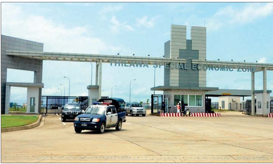
သီလဝါအထူးစီးပွားရေးဇုန်။

ဖျန်းခြင်းနှင့်သန့်ရှင်းရေးဆောင်ရွက် ခြင်းတို့ကို ယနေ့ နံနက်ပိုင်းမှစတင်၍ ဆောင်ရွက်ကြသည်။ (အပေါ်ပုံ) ထို့ပြင် လမ်းများတွင်လည်း အများပြည်သူများ အသုံးပြုနိုင်ရန် လက်ဆေးကန်များကို ဆောင်ရွက် ပေးထားသည့်အပြင် လက်သန့် ဆေးရည်များနှင့် နှာခေါင်းစည်း များကို အခမဲ့ဝေပေးသွားရန် စီစဉ်ထားသည်။ လသာမြို့နယ်သည် ရန်ကုန်မြို့ ၏ အချက်အချာကျသည့် မြို့နယ် တစ်ခုဖြစ်သည်နှင့်အညီ ပြည်သူများ သွားလာမှု များပြားသည့်အတွက် လသာမြို့နယ် တစ်ခုလုံးကို ဆေးဖျန်း ခြင်းလုပ်ငန်းများ ဆောင်ရွက်ပေး သွားမည်ဖြစ်ကြောင်း သိရသည်။ သတင်းစဉ်