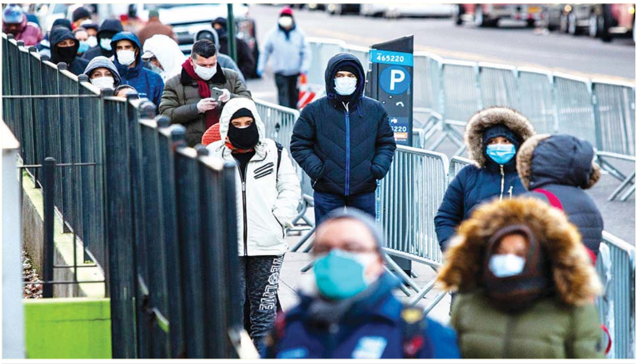
နယူးယောက်မြို့ ရှိ အမ်းဟာ့စ် ဆေးရုံရှေ့တွင် ဆေးစစ်ရန် တန်းစီနေကြသည့် လူများကိုမတ် ၂၄ ရက်ကတွေ့ရစဉ်။

“အမေရိကန်ဟာ ကိုရိုနာဗိုင်းရပ်စ်ပြန့်ပွားရာ နောက်ထပ်နေရာတစ်ခု ဖြစ်လာနိုင်တယ်လို့ ကမ္ဘာ့ကျန်းမာရေးအဖွဲ့ကြီးက ပြောပါတယ်။ အမေရိကန်မှာ ကူးစက်ခံရမှုနှုန်းကတော့ သိသိသာသာမြင့်တက်နေဆဲပါပဲ။ အခုဆိုရင် အမေရိကန်မှာ ကူးစက်ခံရမှုနှုန်းတွေ မြင့်တက် လာနေတာကို တွေ့ရသလို ကူးစက်မှုဗဟိုချက်မ အသစ်တစ်ခုဖြစ်လာနိုင်တယ်လို့ ကမ္ဘာ့ ကျန်းမာရေး အဖွဲ့ကြီးက ပြောရေးဆိုခွင့်ရှိသူ မာဂရက်ဟာရစ်က ပြော”