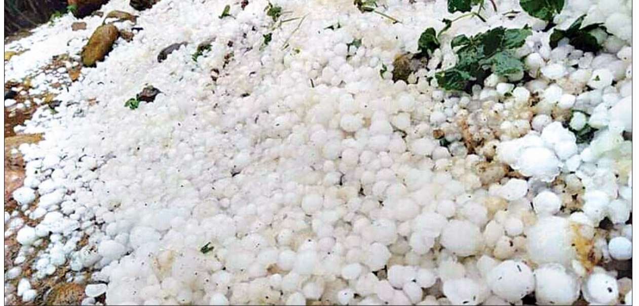
အချိန်အခါမဲ့ မိုးရွာမှုနှင့်အတူ ကြွေကျသည့် မိုးသီးများ။

ဖားကန့် မတ် ၂၅ ဖားကန့်မြို့နယ်၌ ယမန်နေ့ ညနေ ၃ နာရီခွဲခန့်က အချိန်အခါမဲ့ မိုးရွာသွန်းပြီး မိုးသီးကြွေကျမှုဖြစ်စဉ်ကြောင့် ဆိုင်းဂျာတွမ်ကျေးရွာမှ နေအိမ် ၁၉၃ လုံး အမိုးများပျက်စီးမှုဖြစ်ပေါ်ခဲ့သည်။ မိနစ်လေးဆယ်ခန့်ရွာသော မိုးနှင့်အတူ ဆိပ်မုကျေးရွာအုပ်စုနှင့် အေးမြသာယာအုပ်စုအတွင်းမှ ကျေးရွာများပေါ်သို့ စာမျက်နှာ ၈ ကော်လံ ၄