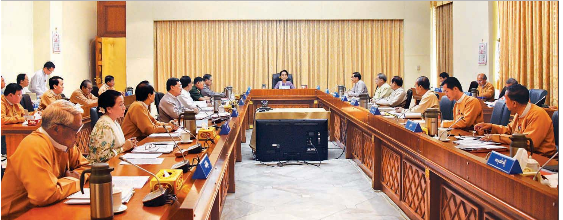
နိုင်ငံတော်၏အတိုင်ပင်ခံပုဂ္ဂိုလ် ဒေါ်အောင်ဆန်းစုကြည် Coronavirus Disease 2019 (COVID-19) ရောဂါနှင့်စပ်လျဉ်းသည့် အစည်းအဝေးတွင် အမှာစကားပြောကြားစဉ်။