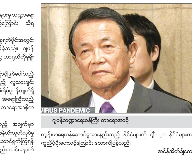
ဂျပန်ဘဏ္ဍာရေးဝန်ကြီး တာရောအာစို ကျန်းမာရေးဝန်ဆောင်မှုအားနည်းသည့် နိုင်ငံများကို ဂျီ - ၂၀ နိုင်ငံများက ကူညီပံ့ပိုးပေးသင့်ကြောင်း ထောက်ပြခဲ့သည်။

တိုကျို မတ် ၂၅ ကိုရိုနာဗိုင်းရပ်စ်ရောဂါကို တုံ့ပြန်ဆောင်ရွက်ရန် ဂျီ-၂၀ နိုင်ငံများမှ ဘဏ္ဍာရေး ဝန်ကြီးများနှင့် ဗဟိုဘဏ်ဥက္ကဋ္ဌများ ဆွေးနွေးခဲ့ကြကြောင်း သိရ သည်။ ဘဏ္ဍာရေးဝန်ကြီးများနှင့် ဗဟိုဘဏ်ဥက္ကဋ္ဌများသည် ယခုရက်ပိုင်းအတွင်း တယ်လီဖုန်းဖြင့် အရေးပေါ်ဆက်သွယ်ဆွေးနွေးမှုပြုလုပ်ခဲ့သည်။ ဂျပန် ဘဏ္ဍာရေးဝန်ကြီး တာရောအာစိုနှင့် ဗဟိုဘဏ်ယာယီဥက္ကဋ္ဌ ဟာရဟိကိုခရီး ဒါတို့လည်း အစည်းအဝေးတွင် ပါဝင်ဆွေးနွေးခဲ့ကြသည်။ ဂျီ - ၂၀ နိုင်ငံများအနေဖြင့် ကိုရိုနာဗိုင်းရပ်စ်ကြောင့်ဖြစ်ပေါ်သည့် နောက်ဆက်တွဲဂယက်ရိုက်ခတ်မှုကြောင့် ပေါ်ပေါက်လာမည့် လူသားချင်း စာနာထောက်ထားမှုဆိုင်ရာ အကျပ်အတည်းကို လွန်စွာစိုးရိမ်ပူပန်လျက်ရှိ ကြောင်း၊ ဂျီ - ၂၀ နိုင်ငံများက ယင်းကိစ္စနှင့်ပတ်သက်၍ အရေးကြီးသည့် နေရာမှ ပါဝင်ဆောင်ရွက်နေကြောင်း ဘဏ္ဍာရေးဝန်ကြီး တာရောအာစိုက သတင်းထောက်များသို့ ပြောကြားခဲ့သည်။ လက်ရှိအခြေအနေကိုကျော်လွှားရန် အဓိကကျသည့် အချက်မှာ ကိုရိုနာဗိုင်းရပ်စ်ကုသဆေးကို ဖော်ထုတ်နိုင်ရန်ဖြစ်ပြီး ဆေးဝါးဖန်တီးထုတ်လုပ်မှု ပိုမိုမြန်ဆန်စေရန် အားလုံးအတူတကွ ပိုင်းဝန်းပူးပေါင်းဆောင်ရွက်ကြရန် နိုင်ငံများအားလုံးကို ၎င်းကတိုက်တွန်းပြောကြားလိုက်သည်။ ယင်းနောက်