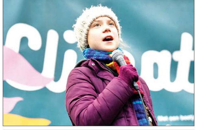
ရာသီဥတုအရေးတက်ကြွလှုပ်ရှားသူ ဂရီတာသွန်းဘတ်

စတော့ဟုမ်း မတ် ၂၅ ဆွီဒင်နိုင်ငံမှ ရာသီဥတုအရေးတက်ကြွလှုပ်ရှားသူ ဂရီတာသွန်းဘတ်က ၎င်း၌ ကိုရိုနာဗိုင်းရပ်စ်ကူးစက်ခံထားရပွယ်ရှိနေကြောင်း မတ် ၂၄ ရက်တွင် ပြောကြားခဲ့သည်။ ဥရောပအလယ်ပိုင်းခရီးစဉ်မှ ပြန်လာပြီးနောက်တွင် ရောဂါကူးစက်ခံရသည့် လက္ခဏာအချို့ကို ခံစားလာရသည်ဟု ၎င်းက ဆိုသည်။ ပြီးခဲ့သည့် ၁၀ ရက်ခန့်အကြာက ၎င်းအနေဖြင့် မောပန်းနွမ်းနယ်ခြင်း၊ ချမ်းတုန်ခြင်း၊ လည်ချောင်းနာခြင်းနှင့် ချောင်းဆိုးခြင်းများကို ခံစားခဲ့ရကြောင်း ရာသီဥတုအရေးတက်ကြွလှုပ်ရှားသူ ဆယ်ကျော်သက် ဂရီတာသွန်းဘတ်က ပြောကြားခဲ့သည်။ ဥရောပအလယ်ပိုင်းမှ ပြန်ရောက်လာပြီးနောက် ယင်းလက္ခဏာများ ဖြစ်ပေါ်ခဲ့ကာ ၎င်းနှင့် ဖခင်ဖြစ်သူတို့မှာ ကြိုတင်ကာကွယ်သည့်အနေဖြင့် သီးခြားနေထိုင်လျက်ရှိကြောင်း ၎င်းကပြောသည်။ ဆွီဒင်နိုင်ငံ၌ မတ် ၂၄ ရက်က ကိုရိုနာဗိုင်းရပ်စ်ကူးစက်ခံရသည့်လူနာ ၂၂၇ ဦးရှိကြောင်း အတည်ပြုခဲ့သည်။ ကျန်းမာရေးစစ်ဆေးမှု မခံယူရသေးသော်လည်း ကိုရိုနာဗိုင်းရပ်စ် ကူးစက်ခံရခြင်း ဖြစ်နိုင်ချေများကြောင်း ဂရီတာသွန်းဘတ်က ပြောကြားခဲ့ သည်။ အေအက်ဖ်ပီ