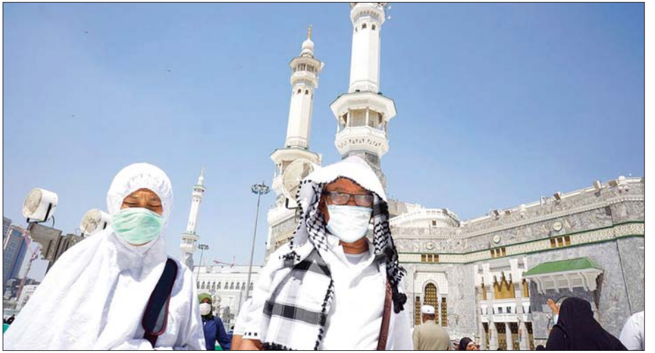
နာခေါင်းစည်းတပ်ဆင်သွားလာနေသည့် ဆော်ဒီပြည်သူများကို တွေ့ရစဉ်။

ချိန်အထိ အပြင်မထွက်ရအမိန့်ကို မတ် ၂၃ ရက်တွင် စတင် ထုတ်ပြန်ခဲ့သည်။ အာရပ်ကမ္ဘာ၏ အကြီးဆုံးစီးပွားရေး အင်အားစုဖြစ် သည့် ဆော်ဒီသည် ရုပ်ရှင်ရုံများ၊ ဈေးဝယ်ကုန်တိုက်များ၊ စားသောက်ဆိုင်များအားလုံးကိုပိတ်ထားခဲ့ပြီး လေယာဉ် ခရီးစဉ်များကို ရပ်နားထားခဲ့ကာ တစ်နှစ်ပတ်လုံးဘုရားဖူး ခရီးစဉ်များကို ရပ်နားထားခဲ့သည်။ ဆော်ဒီဘုရင်နိုင်ငံအနေဖြင့် ဗိုင်းရပ်စ်ကြောင့် ဖြစ်ပွားရသည့် အဝင်အထွက်ပိတ်ဆို့မှုနှင့် ရေနံဈေးကျဆင်း မှုတို့၏ ထိုးနှက်ချက်များကို ရင်ဆိုင်နေရသည့်ဖြစ်ရာ ဗိုင်းရပ်စ်ကို တိုက်ဖျက်ရာတွင် ပိုမိုခက်ခဲသည့်အခြေအနေ တစ်ခုကို ရင်ဆိုင်ရနိုင်ကြောင်း ဘုရင်မင်းမြတ် ဆယ်လ်မန် က ပြောကြားခဲ့သည်။ အေအက်ဖ်ပီ