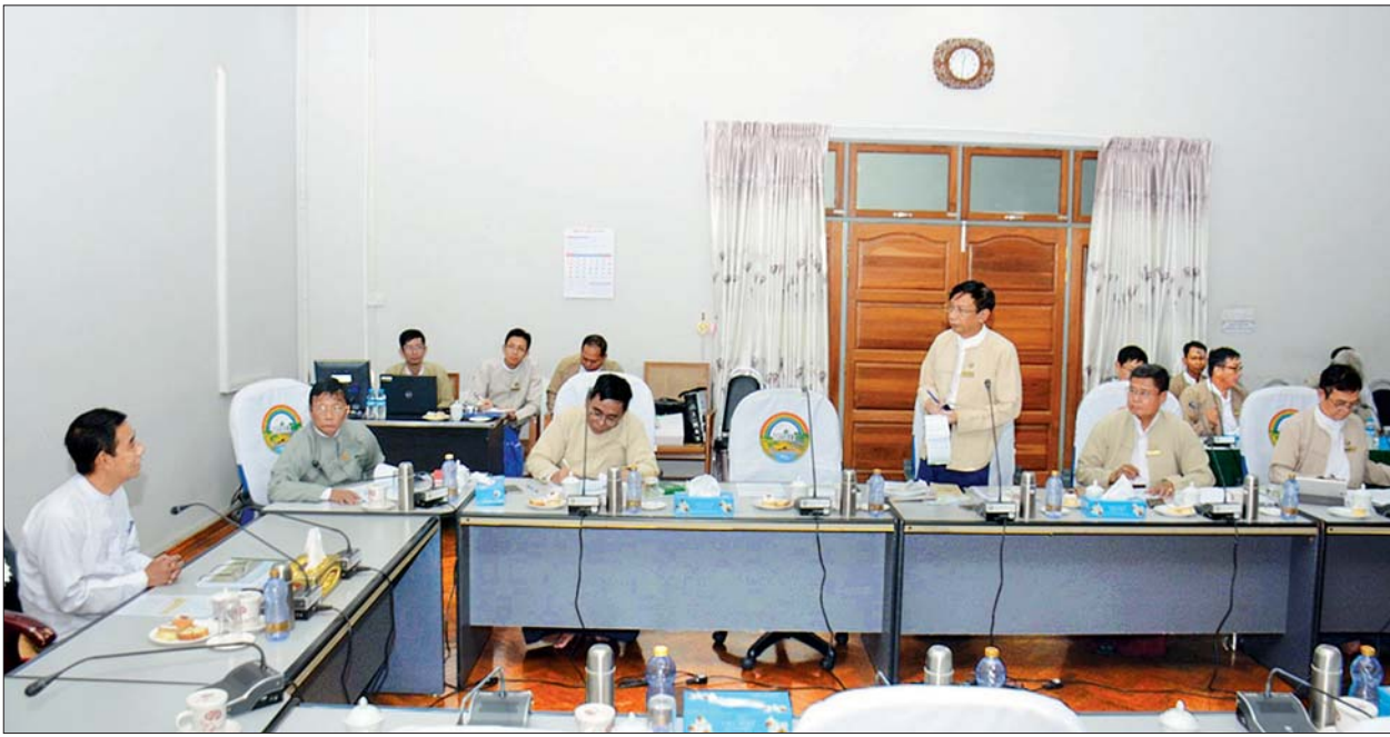
လယ်ယာမြေဥပဒေကို ပြင်ဆင်သည့် ဥပဒေ(၂၀၂၀ပြည့်နှစ်)အတွက် နည်းဥပဒေရေးဆွဲရေး(ပထမအကြိမ်) လုပ်ငန်းညှိနှိုင်းအစည်းအဝေးနှင့် ရောဝတီတိုင်းဒေသကြီး လွှတ်တော်က ရေးဆွဲပြဋ္ဌာန်းထားရှိသော မြေယာခွန်ဥပဒေဆိုင်ရာကိစ္စရပ်များ ညှိနှိုင်းအစည်းအဝေး ကျင်းပစဉ်။ သတင်းစဉ်

နေပြည်တော် မတ် ၂၅ လယ်ယာမြေဥပဒေကို ပြင်ဆင်သည့် ဥပဒေ(၂၀၂၀ပြည့်နှစ်)အတွက် နည်းဥပဒေရေးဆွဲရေး(ပထမအကြိမ်) လုပ်ငန်းညှိနှိုင်းအစည်းအဝေးနှင့် ရောဝတီတိုင်းဒေသကြီး လွှတ်တော်က ရေးဆွဲပြဋ္ဌာန်းထားရှိသော မြေယာခွန်ဥပဒေဆိုင်ရာကိစ္စရပ်များ ညှိနှိုင်းအစည်းအဝေးကို ယနေ့မနက်လွှဲပိုင်းက နေပြည်တော်ရှိ စိုက်ပျိုးရေး၊ မွေးမြူရေးနှင့် ဆည်မြောင်းဝန်ကြီးဌာန ပြည်ထောင်စုဝန်ကြီးရုံးအစည်းအဝေးခန်းမ၌ ကျင်းပသည်။