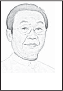
မောင်စွာ

တတိယအကြိမ်လွှတ်တော်သက်တမ်းအတွက် အထွေထွေရွေးကောက်ပွဲကြီးကို ယခု ၂၀၂၀ ပြည့်နှစ်အတွင်း ကျင်းပသွားရန်ရှိပါသည်။ မြန်မာနိုင်ငံ၏ ခေတ်အဆက်ဆက် ရွေးကောက်ပွဲများတွင် အမျိုးသမီးများ ပါဝင် ယှဉ်ပြိုင်မှုအခန်းကဏ္ဍ မည်သို့ရှိခဲ့သနည်း။ သမိုင်းကြောင်း ဖြစ်စဉ် အနှစ်ချုပ်ဖော်ပြပါမည်။