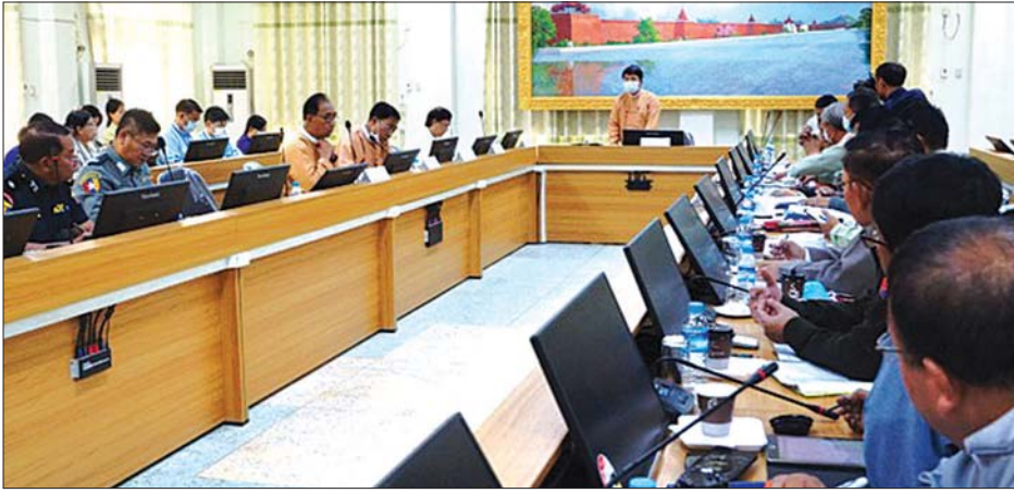
ယင်းနောက် တက်ရောက်လာသော ဌာနဆိုင်ရာများနှင့် စားသောက်ကုန်လုပ်ငန်းရှင်များက ဆွေးနွေး ပြောကြားခဲ့ကြသည်။ အဆိုပါ အစည်းအဝေးသို့ တိုင်းဒေသကြီးခေတ္တဝန်ကြီးချုပ်နှင့် တိုင်းဒေသကြီး ဝန်ကြီးများ၊ တိုင်းဒေသကြီးအဆင့် ဌာနဆိုင်ရာတာဝန်ရှိသူများ၊ စားသောက်ကုန်လုပ်ငန်းရှင်များနှင့် ဖိတ်ကြားထားသူများ တက်ရောက်ခဲ့ကြသည်။ သန်းဇော်မင်း(ပြန်/ဆက်)

COVID-19 ရောဂါကာကွယ်၊ ထိန်းချုပ်၊ ကုသရေး တိုင်းဒေသကြီး လုပ်ငန်းကော်မတီ ညှိနှိုင်းအစည်းအဝေးကို မန္တလေးမြို့၊ အောင်မြေသာစံမြို့နယ်ရှိ မန္တလေးတိုင်းဒေသကြီး အစိုးရအဖွဲ့ရုံး အစည်းအဝေးခန်းမ၌ ယမန်နေ့က ကျင်းပသည်။ (ယာဝု)