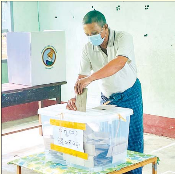
ရေတာရှည်မြို့နယ်တွင် ၂၀၂၀ ပြည့်နှစ် အထွေထွေရွေးကောက်ပွဲအတွက် အသက် ၆၀ နှင့်အထက် မဲဆန္ဒရှင်တစ်ဦး ကြိုတင်ဆန္ဒမဲပေးစဉ်။