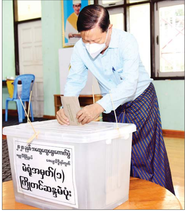
ပြည်ထောင်စုဝန်ကြီး သူရဦးအောင်ကို ကြိုတင်ဆန္ဒမဲပေးသည့် ဆန္ဒမဲလက်မှတ်များ ထည့်သွင်းစဉ်။ သတင်းစဉ်

နေပြည်တော် အောက်တိုဘာ ၃၀ ပြည်ထောင်စုဝန်ကြီးများ၊ ဒုတိယဝန်ကြီးများနှင့် ၎င်းတို့၏ ဇနီးများသည် ယနေ့နံနက်ပိုင်းတွင် နိုင်ငံ့ဝင်ဘာ ၈ ရက်၌ ကျင်းပမည့် ၂၀၂၀ ပြည့်နှစ် အထွေထွေ ရွေးကောက်ပွဲတွင် နေပြည်တော် ဇေယျသီရိမဲဆန္ဒနယ်မှ ဝင်ရောက်ယှဉ်ပြိုင်ကြမည့် လွှတ်တော်ကိုယ်စားလှယ်နေရာများအတွက် ကြိုတင်ဆန္ဒမဲများ ပေးကြသည်။ ရင်းနှီးမြုပ်နှံမှုနှင့် နိုင်ငံခြား စီးပွားဆက်သွယ်ရေး ဝန်ကြီးဌာန ပြည်ထောင်စုဝန်ကြီး ဦးသောင်းထွန်း နှင့် ဇနီး ဒေါ်စန္ဒာလွင်၊ ပြန်ကြားရေး ဝန်ကြီးဌာန ပြည်ထောင်စုဝန်ကြီး ဒေါက်တာဖေမြင့်နှင့် ဇနီး ဒေါ်ခိုင် နွယ်ဦး၊ သာသနာရေးနှင့် ယဉ်ကျေးမှု ဝန်ကြီးဌာန ပြည်ထောင်စုဝန်ကြီး သူရဦးအောင်ကိုနှင့် ဇနီး ဒေါ်မြင့်မြင့်ရီ၊ ပညာရေးဝန်ကြီးဌာန ပြည်ထောင်စု ဝန်ကြီး ဒေါက်တာမျိုးသိမ်းကြီးနှင့် ဇနီး ဒေါ်စန်းစန်းယု၊ ဆောက်လုပ်ရေး ဝန်ကြီးဌာန ပြည်ထောင်စုဝန်ကြီး ဦးဟန်ဇော်နှင့် ဇနီး ဒေါ်သွင်သွင်အေးမှ၊ ဒုတိယဝန်ကြီးများ ဖြစ်ကြသည့် ဦးဗရတ်ဆင်း၊ ဦးအောင်လှထွန်း၊ ဦးလှကျော်၊ ဦးအောင်ထူး၊ ဦးလှမော်ဦး၊ ဒုတိယရှေ့နေချုပ် ဦးဝင်းမြင့်နှင့် ၎င်းတို့၏ ဇနီးများသည်