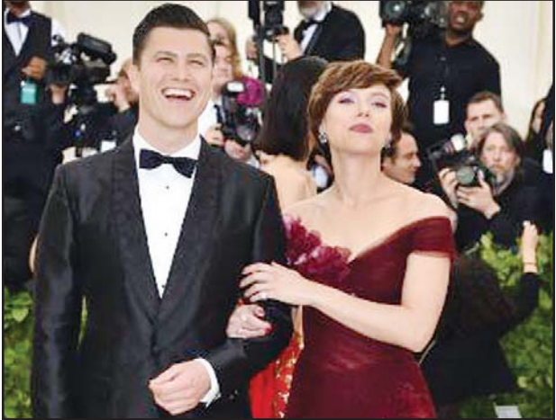
စကားလက်ဂျီဟန်ဆန် နှင့် ကောလင်းဂျီစ်