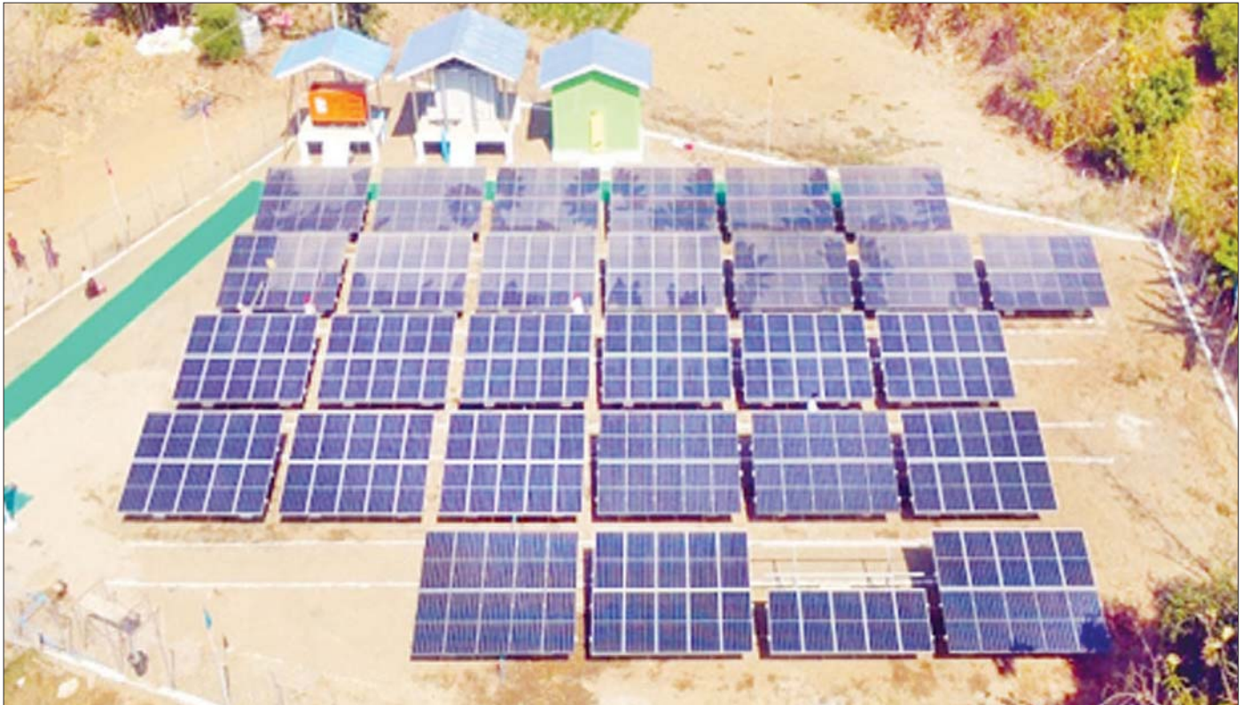
ကြမ်းမြို့နယ် ထိန်ပင်မြောင်ကျေးရွာ အသေးစားဓာတ်အားပေးစနစ်ကို တွေ့ရစဉ်။

ချမှတ်ရမည်။ (ခ) ခြိမ်းခြောက်ခြင်း၊ နှောင့်ယှက်ခြင်း၊ ဟန့်တားခြင်း သို့မဟုတ် တားဆီးခြင်း ပြုလုပ်ကြောင်း ဖြစ်မှုထင်ရှား စီရင်ခြင်း ခံရလျှင် ထိုသူကို တစ်နှစ်ထက် မပိုသော ထောင်ဒဏ်ဖြစ်စေ၊ ကျပ်တစ်သိန်းထက် မပိုသော ငွေဒဏ်ဖြစ်စေ၊ ဒဏ်နှစ်ရပ်လုံး ဖြစ်စေ ချမှတ်ရမည်။