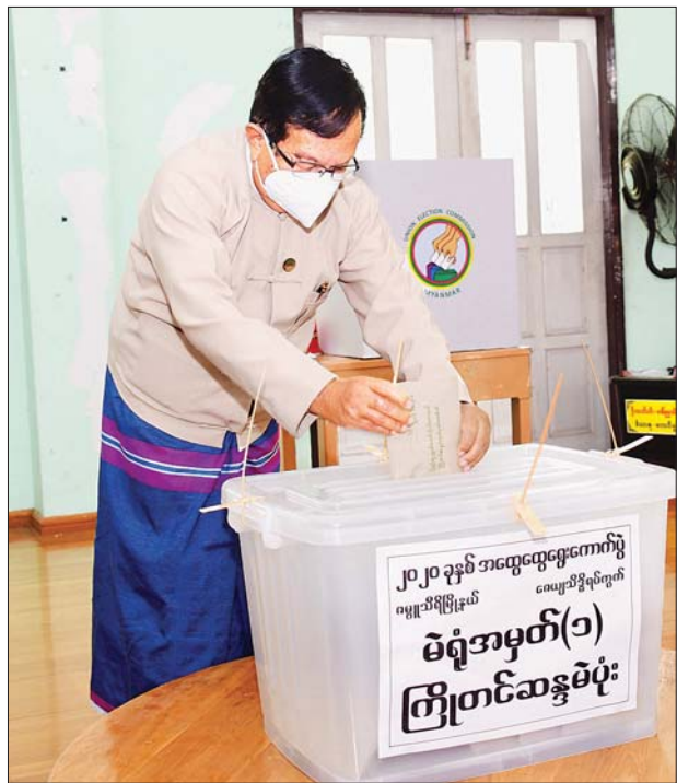
ပြည်ထောင်စုဝန်ကြီး ဦးဟန်ဇော် ကြိုတင်ဆန္ဒမဲပေးသည့် ဆန္ဒမဲလက်မှတ်များ ထည့်သွင်းစဉ်။ သတင်းစဉ်