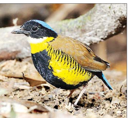
တောင်ငုံးရင်မည်းငှက် အထီးတစ်ကောင်ကို တွေ့မြင်ရစဉ်။