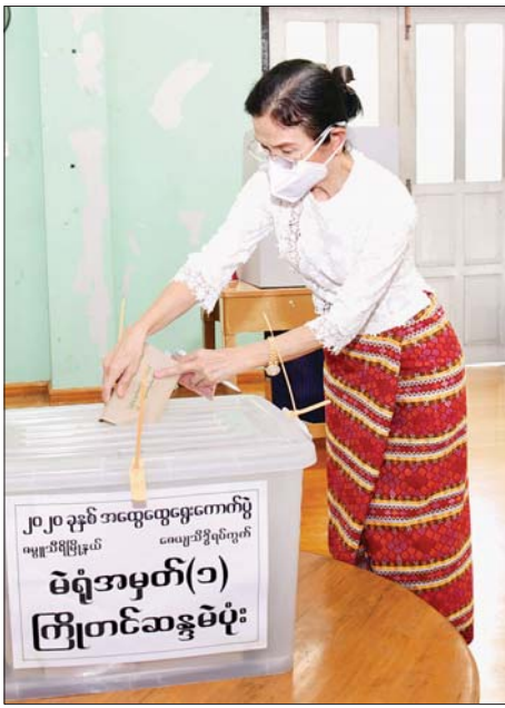
ပြည်ထောင်စုဝန်ကြီး သူရဦးအောင်ကို၏ ဇနီး ဒေါ်မြင့်မြင့်ရီ ကြိုတင်ဆန္ဒမဲပေးသည့် ဆန္ဒမဲလက်မှတ်များ ထည့်သွင်းစဉ်။ သတင်းစဉ်