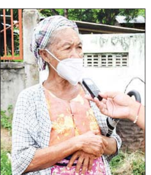
ဦးထွန်းရှိန်

တွေအတိုင်း မဲရုံတိုင်းမှာ ကျန်းမာရေး ဝန်ထမ်းတွေရှိသလို လုံခြုံရေးအတွက် လည်း မဲရုံတွေအတွက် အထူးရဲတွေ ကလည်း တာဝန်ယူဆောင်ရွက်နေပါ တယ်။ လိုအပ်တဲ့ ကိုဗစ်-၁၉ ရောဂါ ကာကွယ်ရေး ပစ္စည်းတွေကိုလည်း ကျန်းမာရေးဌာနက ပံ့ပိုးဆောင်ရွက် ပေးထားပါတယ်။ မနေ့ကစပြီး ကြိုတင်မဲပေးခွင့်ရှိသူတွေ လာရောက် မဲပေးနေကြပါပြီ။ နောက်ပိုင်း ရက်တွေမှာတော့ ကျေးရွာအုပ်စု ရွေးကောက်ပွဲ ကော်မရှင်အဖွဲ့ခွဲက တာဝန်ရှိသူတွေ၊ မဲရုံတာဝန်ရှိသူတွေ ပါဝင်တဲ့အဖွဲ့က အိမ်အရောက်သွားပြီး လာရောက်မဲပေးနိုင်တဲ့ သက်ကြီး ရွယ်အိုတွေ၊ ကျန်းမာရေးမကောင်းသူ တွေနဲ့ မသန်စွမ်းတွေအတွက် မဲထည့် နိုင်အောင် လိုက်လံဆောင်ရွက်ပေး သွားမှာဖြစ်ပါတယ်။