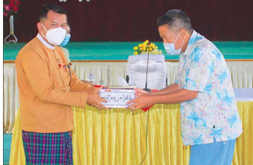
တိုင်းဒေသကြီးဝန်ကြီးချုပ် ဦးမြင့်မောင်က တောင်သူတစ်ဦးထံ မြေယာလျော်ကြေးများ ပေးအပ်နေစဉ်

မြိတ် အောက်တိုဘာ ၃၀ မြိတ်မြို့ ကျောက်ဖျာမြို့သစ်စီမံကိန်း ဧရိယာထဲရှိ အုပ်ချုပ်မှုဧရိယာတွင် ပါဝင်သွားသော မြေများ အတွက် မြေပိုင်ရှင် တောင်သူငါးဦးအား တနင်္သာရီ တိုင်းဒေသကြီးအစိုးရအဖွဲ့က ဒုတိယအကြိမ် မြေ လျော်ကြေးနှင့် သီးနှံနစ်နာကြေးများကို အောက်တို ဘာ ၂၉ ရက်က ပေးအပ်ခဲ့သည်။