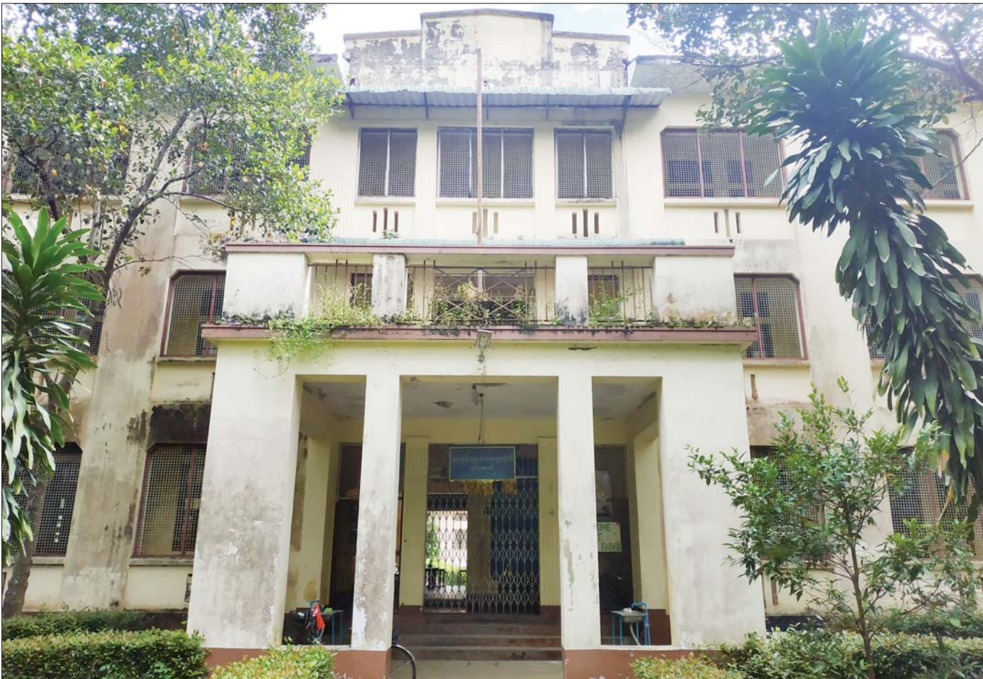
ရန်ကုန်တက္ကသိုလ်အတွင်းရှိ ပုဂံဆောင်ကို တွေ့ရစဉ်။