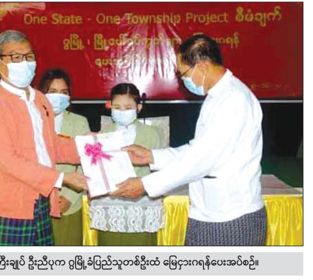
ပြည်နယ်ဝန်ကြီးချုပ် ဦးညီပုက ဂွမြို့နယ်၌ ပြန်လည်စွန့်လွှတ်မြေများကို မူလပိုင်ရှင်များထံပေးအပ်စဉ်။

ထုတ်ပေးသည့် အကျိုးကျေးဇူးများကိုရှင်းလင်း ပြောကြားပြီးနောက် ပြည်နယ်ဝန်ကြီးချုပ်၊ ပြည်နယ်လူမှုရေးဝန်ကြီး၊ ခရိုင်လယ်ယာမြေ စီမံခန့်ခွဲမှုအဖွဲ့ ဥက္ကဋ္ဌနှင့် အတွင်းရေးမှူးတို့က ဂွမြို့နယ် မကျေးငူကျေးရွာအုပ်စု စဉ့်အိုးချောင်း ကွင်းရှိ ငါးလှပင်ဦးစီးဌာနမှ စွန့်လွှတ်မြေများ အတွက် ပုံစံ(၇)ရရှိသူ ၆၄ ဦးအား လယ်ယာ မြေလုပ်ပိုင်ခွင့် ပုံစံ(၇)များကိုလည်းကောင်း၊ ကင်းပုံကျေးရွာအုပ်စု ကမ်းသာကျေးရွာရှိ စိုက်ပျိုးရေးဦးစီးဌာနမှ ပြန်လည်စွန့်လွှတ်မြေ အတွက် မူလပိုင်ရှင် ဦးဖိုးဖေထံသို့ လယ်ယာ မြေ ယာယီလုပ်ပိုင်ခွင့်ပြုလက်မှတ် ပုံစံ(၃)ကို လည်းကောင်း ပေးအပ်ခဲ့သည်။ တင်ထွန်း(ပြန်/ဆက်)