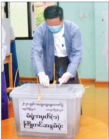
ဒုတိယဝန်ကြီး ဦးအောင် ထူး ကြိုတင် ဆန္ဒမဲပုံးထဲသို့ ဆန္ဒမဲ လက်မှတ်များ ထည့်သွင်း စဉ်။ သတင်းစဉ်