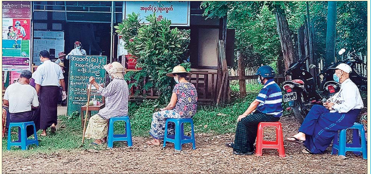
ကချင်ပြည်နယ် ရွှေကျမြို့ အမှတ်(၄) ရပ်ကွက်တွင် ၂၀၂၀ ပြည့်နှစ် အထွေထွေရွေးကောက်ပွဲအတွက် အသက် ၆၀ နှင့်အထက် မဲဆန္ဒရှင်များ ကြိုတင် ဆန္ဒမဲပေးရန် စောင့်ဆိုင်းနေမှုကို အောက်တိုဘာ ၃၀ ရက်က တွေ့ရစဉ်။ ကျော်မျိုးအောင်(ပြန်/ဆက်)