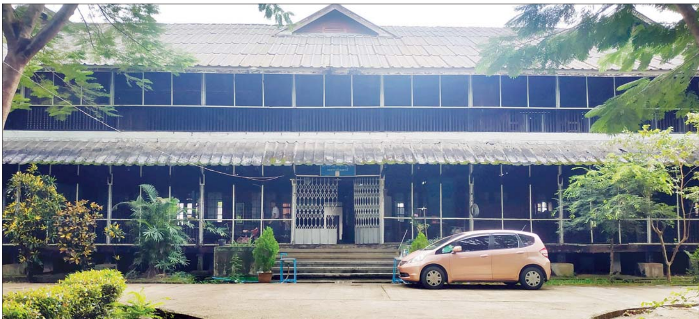
ရန်ကုန်တက္ကသိုလ်နယ်မြေ၌ ပထမဆုံး သစ်သားဖြင့်တည်ဆောက်ခဲ့ပြီး ၁၉၂၄ ခုနှစ်က ဖွင့်လှစ်ခဲ့သည့် တကောင်းဆောင်ကို တွေ့ရစဉ်။

ဤတစ်ကြိမ်တွင် စာရေးသူသည် အမှုထမ်း တစ်ယောက်ဖြစ်နေပါပြီ။ အိမ်ထောင်ကျ၍ သားသမီး များလည်း ရှိနေပြီဖြစ်ပါသည်။ အဆောင်နေခွင့်ကို