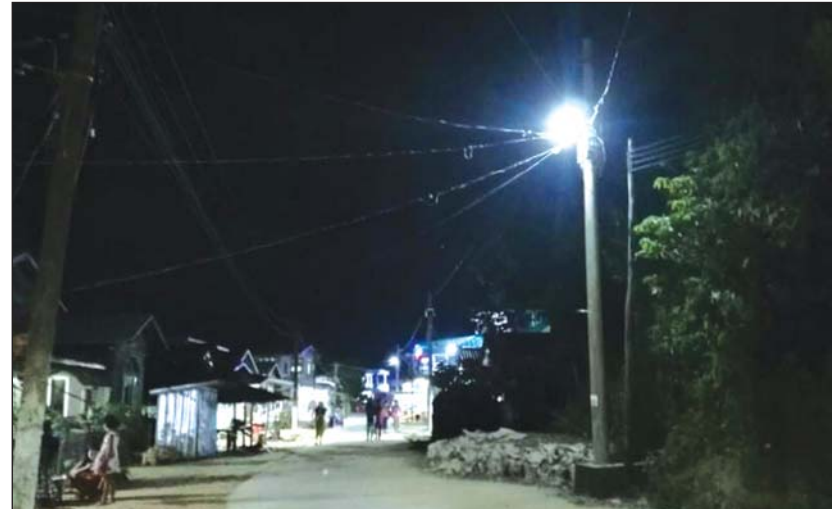
ကျော့ကွာကျေးရွာ၌ လျှပ်စစ်မီးရရှိမှုကို တွေ့ရစဉ်။