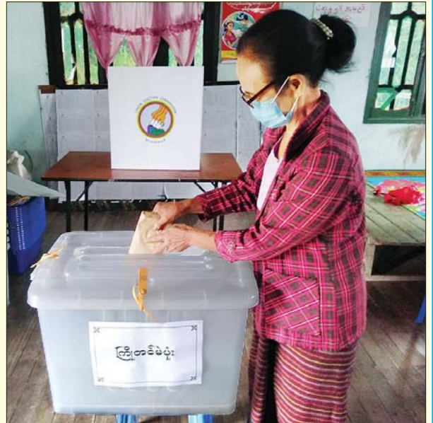
သံတောင်ကြီးမြို့နယ်တွင် အသက် ၆၀ နှင့်အထက် မဲဆန္ဒရှင်တစ်ဦး ကြိုတင်ဆန္ဒမဲပေးစဉ်။ မြို့နယ်(ပြန်/ဆက်)