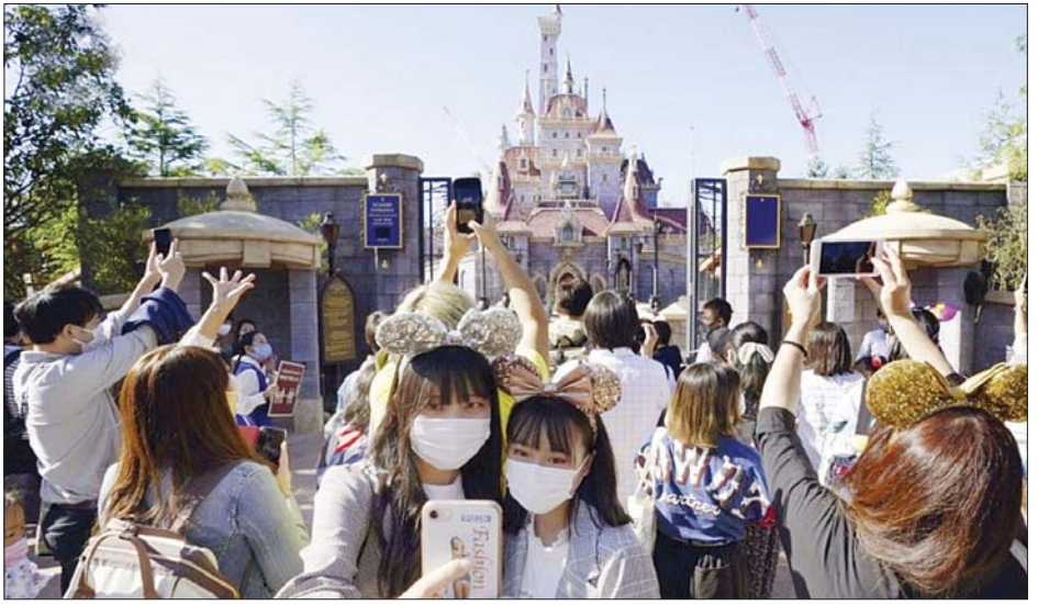
တိုကျိုဒစ္စနေးလ်ဥယျာဉ်သို့ လာရောက်လည်ပတ်သူများကို တွေ့ရစဉ်။