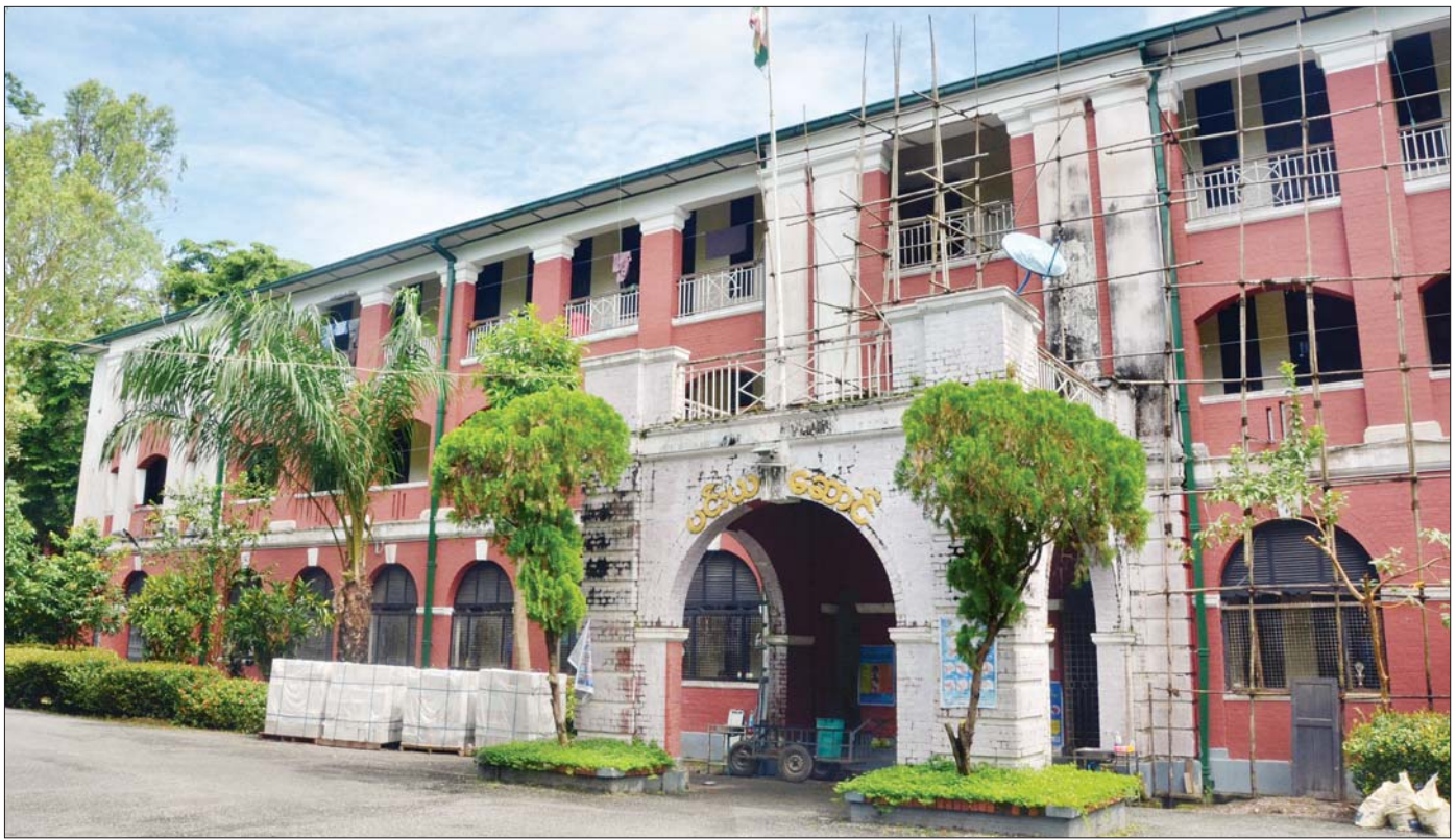
ရန်ကုန်တက္ကသိုလ်အတွင်းရှိ ပင်းယဆောင်ကို တွေ့ရစဉ်။

ဤစာရေးသူသည် လွတ်လပ်ရေးရပြီး နောက် တစ်နှစ်တွင် တက္ကသိုလ်ဝင်စာမေးပွဲကို အောင်မြင်