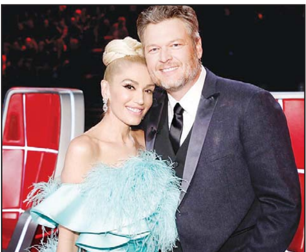
ဝမ်းစတက်ဖနီနှင့် ဘလိတ်ခိရယ်တန်