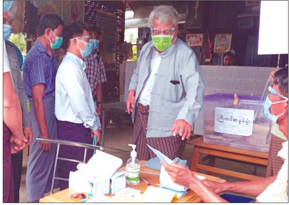
မဲရုံတစ်ရုံ၌ ကြိုတင်မဲများပေးနေမှုကို တိုင်းဒေသကြီးဝန်ကြီးချုပ် ဒေါက်တာမြင့်နိုင် ကြည့်ရှုအားပေးစဉ်

တိုင်းဒေသကြီး ဝန်ကြီးချုပ်သည် ကျေးရွာများမှ ရွေးကောက်ပွဲကော်မရှင် အဖွဲ့ခွဲဝင် တာဝန်ရှိသူများ၊ သက်ဆိုင် ရာဌာနများမှ တာဝန်ပေးအပ်ထား သော ဝန်ထမ်းများနှင့် စေတနာ့ ဝန်ထမ်းများအား ပြည်သူများ စိတ် ချမ်းမြေ့လုံခြုံစွာ ဆန္ဒမဲပေးနိုင်ရေး အတွက် ဆောင်ရွက်ပေးရန် တိုက် တွန်းပြောကြားခဲ့သည်။