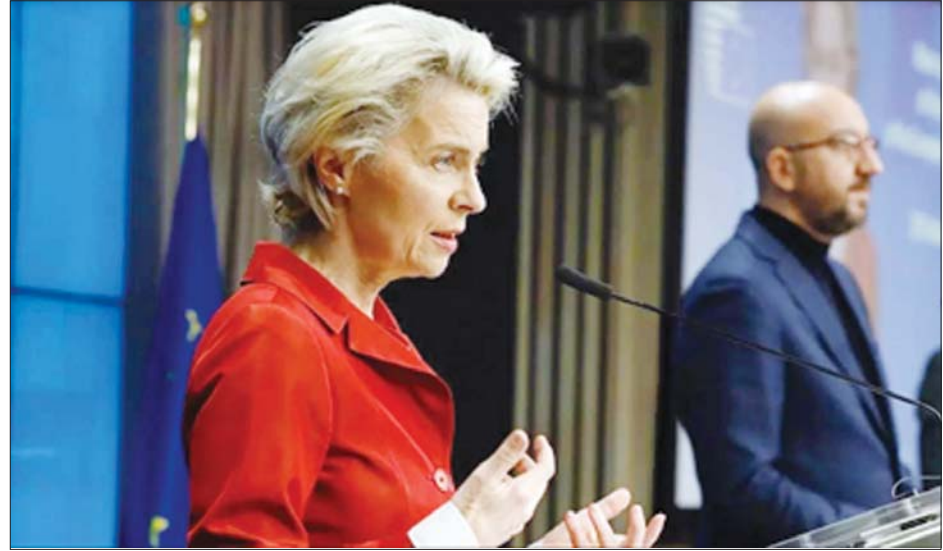
ဥရောပကော်မရှင် ဥက္ကဋ္ဌ အာဆူလာဗွန်ဒါလီယန်