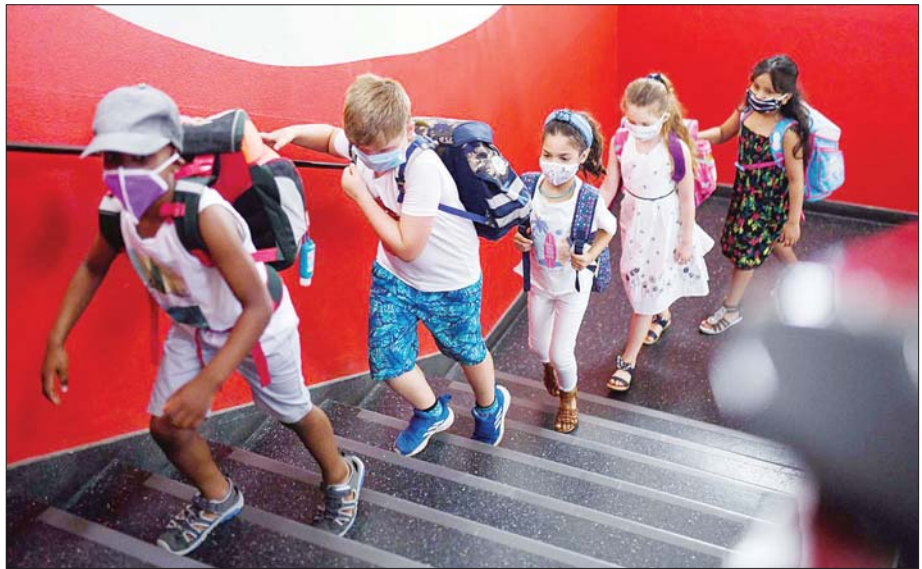
ဂျာမနီနိုင်ငံတွင် ကျောင်းတက်လာသည့် ကလေးငယ်များကို တွေ့ရစဉ်။

အိမ်တွင်းအကြမ်းဖက်မှုတွေ များလာ ဂျာမနီဝန်ကြီးချုပ် အင်ဂျလာမာကယ်ဟာ ကျောင်းတွေဆက်ဖွင့်ဖို့ ဆုံးဖြတ်ချက်နဲ့ ပတ်သက်ပြီး ရှင်းလင်းခဲ့ပါတယ်။ ပြီးခဲ့တဲ့ မတ်လနဲ့ ဧပြီလတို့မှာ ကျောင်းတွေ၊ နေ့ကလေးထိန်းကျောင်းတွေ ပိတ်ခဲ့ရပြီး မိသားစုတွေအပေါ် သက်ရောက်မှုတွေ ရှိခဲ့ပါတယ်။ အမျိုးသမီးနဲ့ကလေးတွေအပေါ် အကြမ်းဖက်မှုတွေဟာ တစ်ရှိန်ထိုးတိုးမြှင့်လာပါတယ်။ ဒါကြောင့် အားကစားပွဲတွေ၊ စားသောက်ဆိုင်တွေနဲ့ ယဉ်ကျေးမှုဆိုင်ရာပွဲတွေကို ပိတ်ပင်ခဲ့ပေမယ့် ကျောင်းတွေနဲ့ နေ့ကလေးထိန်းကျောင်းတွေကို ဆက်လက်ဖွင့်ထားဖို့ အစိုးရအဖွဲ့ရဲ့