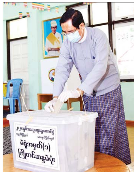
ဒုတိယဝန်ကြီး ဦးအောင် လှထွန်း ကြိုတင် ဆန္ဒမဲပုံးထဲသို့ ဆန္ဒမဲ လက်မှတ်များ ထည့်သွင်း စဉ်။ သတင်းစဉ်

အဖြစ်များ တိုးမြှင့်သုံးစွဲသွားမည် ဖြစ်ကြောင်း ပြောကြားသည်။ ဆက်လက်၍ ပြည်ထောင်စုဝန်ကြီးက ကိုဗစ်-၁၉ အလွန်ကာလများတွင် စီးပွားရေးပြန်လည်ဖွံ့ဖြိုးတိုးတက်လာစေရေး ကုစားဆောင်ရွက်ရာတွင် ပတ်ဝန်းကျင်ထိခိုက်မှု မရှိဘဲ ရာသီဥတုပြောင်းလဲမှုဒဏ် ခံနိုင်ရည်ရှိသော အစီအစဉ်များ ထည့်သွင်းဆောင်ရွက်ရန် အရေးကြီးကြောင်း၊ ထိုကဲ့သို့ ဆောင်ရွက်ရာတွင် အလားအလာရှိသော အစီမံရေး စီးပွားရေး ဖွံ့ဖြိုးတိုးတက်မှုဆိုင်ရာ အစီအစဉ်ဖြင့် ဆောင်ရွက်ခြင်းဖြင့် အချိန်တိုအတွင်း ထိရောက်သော ထင်ရှားသည့်ရလဒ်များ ရရှိနိုင်မည်ဟု ကျွန်တော်တို့အနေဖြင့် ယုံကြည်ပါကြောင်း၊ တစ်ကမ္ဘာလုံး ပူးပေါင်းဆောင်ရွက်ခြင်းဖြင့် ပါရီသဘောတူညီချက်နှင့် ကိုဗစ်-၁၉ ရောဂါ တိုက်ဖျက်မှုတို့အပေါ် အောင်မြင်နိုင်မည်ဟု ယုံကြည်ကြောင်း ပြောကြားခဲ့သည်။ အစည်းအဝေးသို့ မြန်မာနိုင်ငံအပါအဝင် (G-77) အဖွဲ့ဝင် ၁၀ နိုင်ငံ တို့မှ ဝန်ကြီးအဆင့် ကိုယ်စားလှယ်များ တက်ရောက်အမှာစကား ပြောကြားခဲ့ကြောင်း သိရသည်။ သတင်းစဉ်