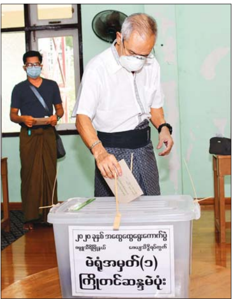
ဒုတိယဝန်ကြီး ဦးလှမော်ဦး ကြိုတင် ဆန္ဒမဲပုံးထဲသို့ ဆန္ဒမဲ လက်မှတ်များ ထည့်သွင်း စဉ်။ သတင်းစဉ်

စာမျက်နှာ ၃ မှ ယနေ့တွင် ဧမ္မာသီရိမြို့နယ် ဧယျသိဒ္ဓိ ရပ်ကွက် ရွေးကောက်ပွဲကော်မရှင် အဖွဲ့ခွဲရုံးသို့ လာရောက်ကြပြီး ကိုဗစ်-၁၉ ရောဂါ ကာကွယ်ထိန်းချုပ်ရေး လမ်းညွှန်ချက်များနှင့်အညီ ကြိုတင်