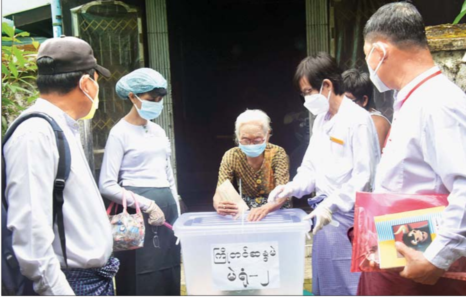
ဒလမြို့နယ်တွင် ကြိုတင်ဆန္ဒမဲပေးမှုကို တွေ့ရစဉ်။