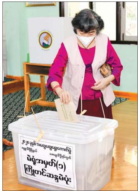
ပြည်ထောင်စုဝန်ကြီး ဦးဟန်ဇော်၏ ဇနီး ဒေါ်သွင်သွင် အေးမှီ ကြိုတင်ဆန္ဒမဲပေးသည့် ဆန္ဒမဲလက်မှတ်များ ထည့်သွင်းစဉ်။ သတင်းစဉ်