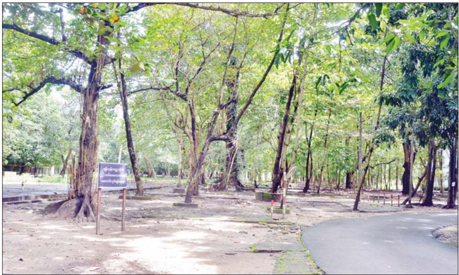
ယခင်ရန်ကုန်တက္ကသိုလ် ဦးချစ်လက်ဖက်ရည်ဆိုင်နေရာတွင် နှစ်ထပ်စားသောက်ဆိုင်ဆောက်လုပ်ရန် သတ်မှတ်ထားမှုကို တွေ့ရစဉ်။

ထိုကဲ့သို့ အတူတကွ နေထိုင်ကြရသဖြင့် တစ်ဦးနှင့် တစ်ဦး အချင်းချင်းထံမှ ဒေသဆိုင်ရာ ထူးခြား၊ ကွဲပြား သည့်အခြေအနေများ၊ ဒေသအလျောက် သင်ကြား သင်ယူမှုပြုကြရသည်များ၊ ဒေသအလျောက် ဆရာ ဆရာမများ ဘဝရန်ကုန်လှုပ်ရှားနေမှုများ၊ ဒေသ အလျောက် ယဉ်ကျေးမှုဆိုင်ရာ ပွဲလမ်းသဘင် ဆင်ယင် ကျင်းပမှု၊ ဝတ်စားဆင်ယင်မှု၊ ဓလေ့စရိုက်လက္ခဏာများ ခြားနားမှုအလျောက် စာမျက်နှာ ၈ သို့