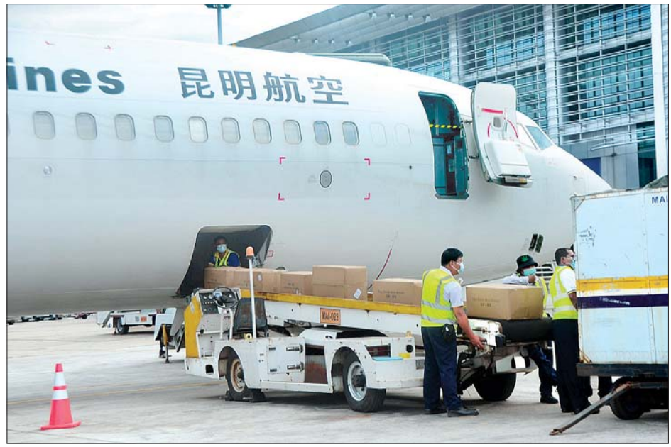
ရန်ကုန်အပြည်ပြည်ဆိုင်ရာလေဆိပ်သို့ အထောက်အကူပစ္စည်းများ အထူးလေယာဉ်ဖြင့် ရောက်ရှိစဉ်။