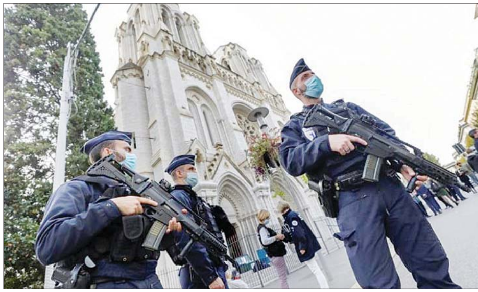
ပြင်သစ်နိုင်ငံ နိစ်မြို့တွင် လုံခြုံရေးယူနေသော လုံခြုံရေးတပ်ဖွဲ့ဝင်များကို တွေ့ရစဉ်။

တိုက်ခိုက်ရေးသမားကို ရဲများက ပစ်ခတ်ဖမ်းဆီးပြီးနောက် ထိခိုက်သိမ်း ထားလိုက်သည်။ ဓားကိုင်တိုက်ခိုက် မှုကြောင့် သေဆုံးခဲ့ရသူတစ်ဦးမှာ ဘတ်ဆလီကာ အဆောက်အအုံတွင် ဝတ်ပြုနေသည့် အသက် ၆၀ ကျော် အရွယ် အမျိုးသမီးတစ်ဦးဖြစ်ပြီး ကျန်သေဆုံးသူနှစ်ဦးမှာ အသက် ၅၀