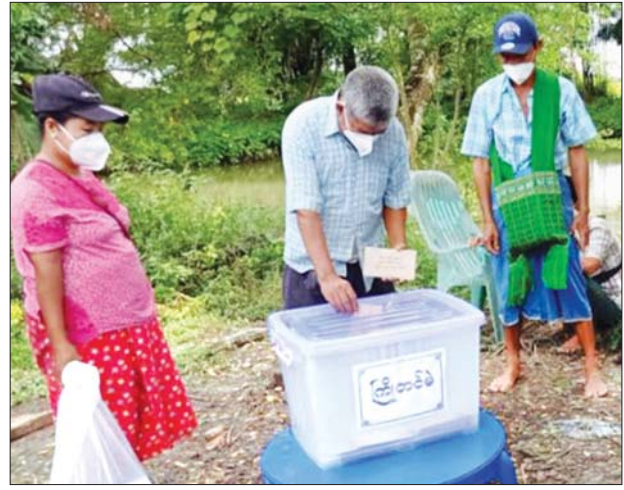
* ရှေ့ဖုံးမှ ကော့မှူးမြို့နယ်တွင် မဲရုံပေါင်း ၁၆၁ ရှိရှိကာ စုစုပေါင်း မဲဆန္ဒရှင်ဦးရေ ၉၈၆၀၀ ကျော်ရှိပြီး အသက်(၆၀)နှင့် အထက် မဲဆန္ဒရှင်ဦးရေ ၁၃၄၀၀ ကျော် ရှိကြောင်း မြို့နယ်ကော်မရှင်အဖွဲ့ခွဲထံမှ သိရသည်။မောင်အေးချမ်း(ပြန်/ဆက်)

တို့အတွင်းရှိ မဲရုံများ၌လည်း ယနေ့တွင် ကြိုတင်ဆန္ဒမဲပေးခွင့်ရှိသူများ လာရောက်ဆန္ဒမဲပေးကြကြောင်း။ လက်ရှိ စာရင်းများအရ နေပြည်တော် ပြည်ထောင်စုနယ်မြေ ဧမ္မာသီရိမြို့နယ်တွင် မဲပေးခွင့်ရှိသူ ၈၉၈၆ ဦး၊ ဒက္ခိဏာသီရိမြို့နယ်တွင် မဲပေးခွင့်ရှိသူ ၂၈၀၆၇ ဦး၊ ပျဉ်းမနားမြို့နယ်တွင် မဲပေးခွင့်ရှိသူ ၁၃၄၆၀၃ ဦး၊ လယ်ဝေးမြို့နယ်တွင် မဲပေးခွင့်ရှိသူ ၂၈၆၇၁ ဦးရှိကြောင်း သိရသည်။ သတင်းစဉ်