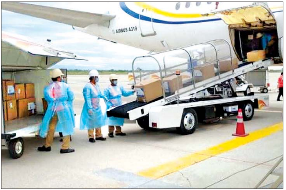
မန္တလေးအပြည်ပြည်ဆိုင်ရာလေဆိပ်သို့ အထောက်အကူပစ္စည်းများ အထူးလေယာဉ်ဖြင့် ရောက်ရှိစဉ်။