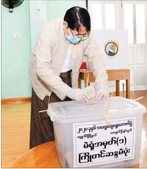
ပြည်ထောင်စုဝန်ကြီး ဒေါက်တာဖေမြင့် ကြိုတင်ဆန္ဒမဲပေးသည့် ဆန္ဒမဲလက်မှတ်များ ထည့်သွင်းစဉ်။ သတင်းစဉ်