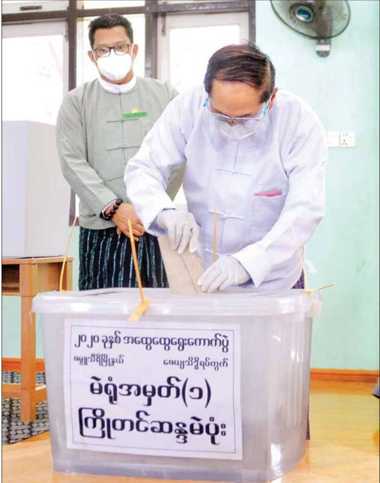
ဒုတိယသမ္မတ ဦးမြင့်ဆွေနှင့် ဇနီး ဒေါ်ခင်သက်ဌေးတို့ ကြိုတင်ဆန္ဒမဲပုံးထဲသို့ ဆန္ဒမဲလက်မှတ်များ ထည့်သွင်းစဉ်။