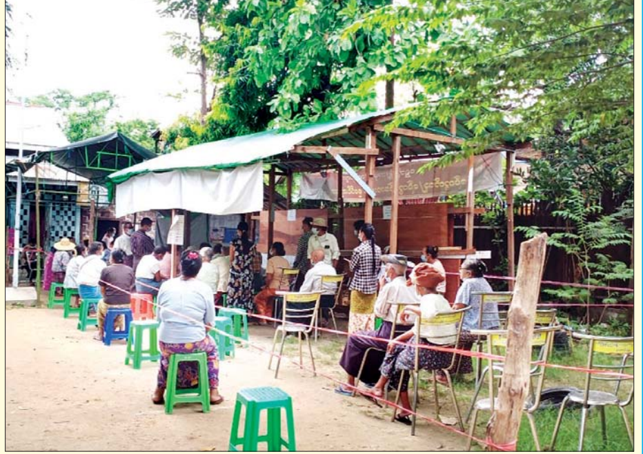
စစ်ကိုင်းတိုင်းဒေသကြီး ရွှေဘိုမြို့ အမှတ်(၁၀) ရပ်ကွက်ရှိ မဲရုံတွင် အောက်တိုဘာ ၃၀ ရက်က အသက် ၆၀ နှင့်အထက် မဲဆန္ဒရှင်များ ကြိုတင်ဆန္ဒမဲပေးရန် ရောက်ရှိနေမှုကို တွေ့ရစဉ်။