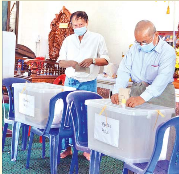
ရန်ကုန်မြို့ ဗဟန်းမြို့နယ် ကိုယ့်မင်းကိုယ်ချင်းရပ်ကွက် ဓမ္မာရုံ၌ အောက်တိုဘာ ၃၀ ရက်က ၂၀၂၀ ပြည့်နှစ် အထွေထွေရွေးကောက်ပွဲအတွက် အသက် ၆၀ နှင့်အထက် မဲဆန္ဒရှင်များ ကြိုတင်ဆန္ဒမဲလာရောက်ပေးကြစဉ်။