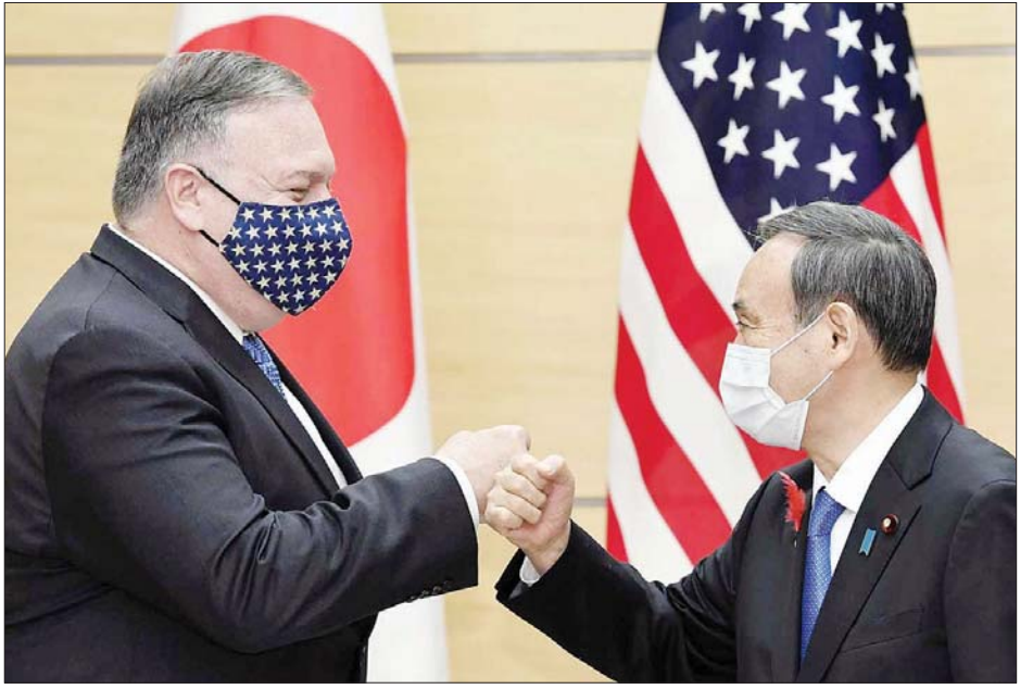
အမေရိကန်နိုင်ငံခြားရေးဝန်ကြီး မိုက်ပွန်ဒီအိုနှင့် ဂျပန်နိုင်ငံဝန်ကြီးချုပ် ဆူဂါယိုရှိဟိဒဲးတို့ အောက်တိုဘာ ၆ ရက်က ဂျပန်ဝန်ကြီးချုပ်ရုံးခန်းတွင် တွေ့ဆုံနှုတ်ဆက်စဉ်။