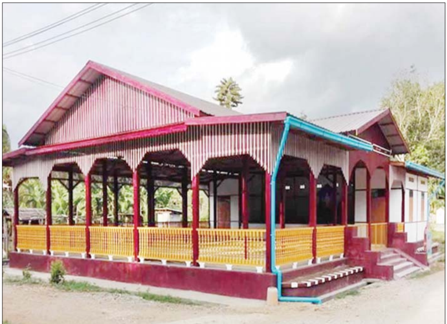
ပေါက်မြို့နယ် ပုတီးကျေးရွာ ကျေးရွာခန်းမ ဆောက်လုပ်ထားမှုကို တွေ့ရစဉ်။

“တစ်ယောက်အားနှင့် ယူသော်မရ ၊ တစ်သောင်းအားဖြင့် ယူသော်ရ၏” ဆိုသည့် စကားနှင့်အညီ ပြည်ထောင်စုလွှတ်တော်အသီးသီးမှလည်းကောင်း၊ ပြည်ထောင်စု အစိုးရနှင့် တိုင်းဒေသကြီး၊ ပြည်နယ်အစိုးရအဖွဲ့ အသီးသီးကလည်းကောင်း၊ သက်ဆိုင်ရာအစိုးရဌာန၊ အစိုးရအဖွဲ့အစည်းများ၊ အစိုးရမဟုတ်သော အဖွဲ့အစည်း များကလည်းကောင်း၊ ကျေးလက်ဒေသနေပြည်သူလူထုကလည်းကောင်း၊ ကျေးလက် ဒေသ၏ ဖွံ့ဖြိုးရေးတိုးတက်ရေးကဏ္ဍကို အာရုံစိုက်၍ ဆောင်ရွက်ရမည့်အချိန် ဖြစ်ပါသည်။ ကမ္ဘာ့ကုလသမဂ္ဂနှင့် လက်အောက်ခံအဖွဲ့အစည်းများ နိုင်ငံတကာ အစိုးရနှင့် အစိုးရမဟုတ်သော အဖွဲ့အစည်းများ ပြည်တွင်း ပြည်ပပုဂ္ဂလိကများအနေ ဖြင့်လည်း ဤဥပဒေ၏ ပြဋ္ဌာန်းချက်များနှင့်အညီ ကြိုးပမ်းနေမှုများကို ကြည့်မြင် သုံးသပ်ကာပါဝင်ကူညီကြရန် လိုအပ်မည်”