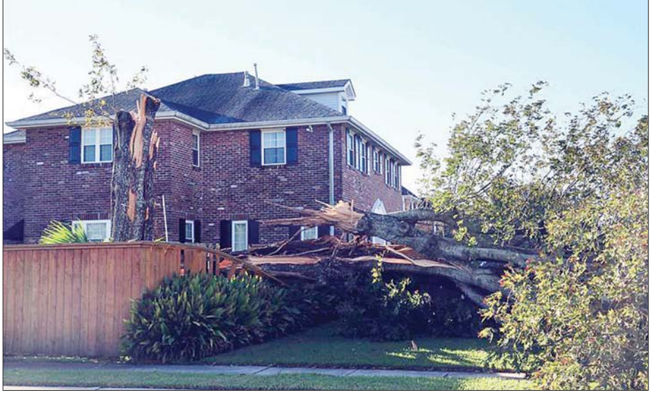
ဟာရီကိန်း ဇီတာတိုက်မှုကြောင့် သစ်ပင်တစ်ပင် ထက်ပိုင်းကျိုးကျကာ ခြစ်စည်းရိုးပေါ်ပိမိနေသည်ကို တွေ့ရစဉ်။