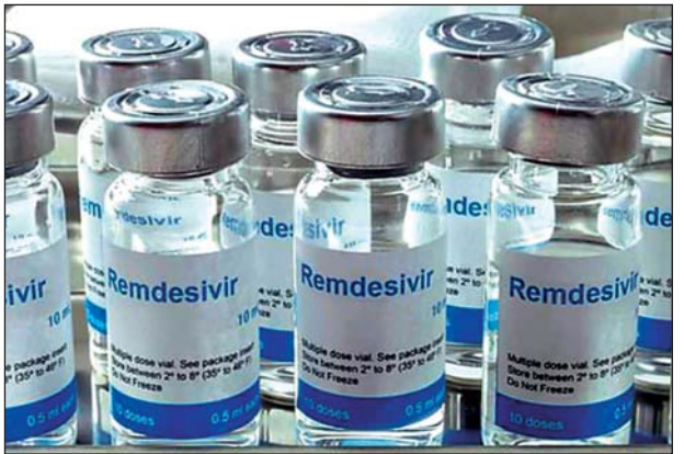
မကွေးတိုင်းဒေသကြီးအတွက်ရရှိသော Remdesivir ထိုးဆေးများ

မကွေး အောက်တိုဘာ ၃၀ အိန္ဒိယနိုင်ငံက မြန်မာနိုင်ငံအတွက် လှူဒါန်းခဲ့သည့် ကိုဗစ်-၁၉ ကုသရေးဆိုင်ရာ ရမ်ဒက်စပီယာ ထိုးဆေးများကို ကျန်းမာရေးနှင့် အားကစားဝန်ကြီးဌာနက တိုင်းဒေသကြီးနှင့် ပြည်နယ်များသို့ ဖြန့်ဝေပေးလျက်ရှိရာ မကွေးတိုင်းဒေသကြီး