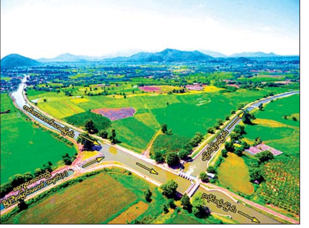
ကင်းတားဆည်သို့ ရေကူပေးနေသည့် ရေပေးမြောင်းမကြီးများ