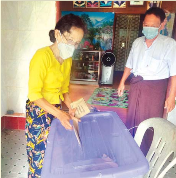
၂၀၂၀ ပြည့်နှစ် ပါတီစုံဒီမိုကရေစီအထွေထွေရွေးကောက်ပွဲအတွက် အသက် ၆၀ နှင့်အထက် မဲဆန္ဒရှင်များ၏ ကြိုတင်မဲများကို ကော့မှူးမြို့နယ်တွင် ရွှေလျားစနစ်ဖြင့် အိမ်တိုင်ရာရောက် ကွင်းဆင်းဆောင်ရွက်ပေးလျက်ရှိရာ အောက်တိုဘာ ၃၀ ရက်က ကြိုတင်ဆန္ဒမဲပေးမှုကို တွေ့ရစဉ်။ ကျော်သူရ(ပြန်/ဆက်)