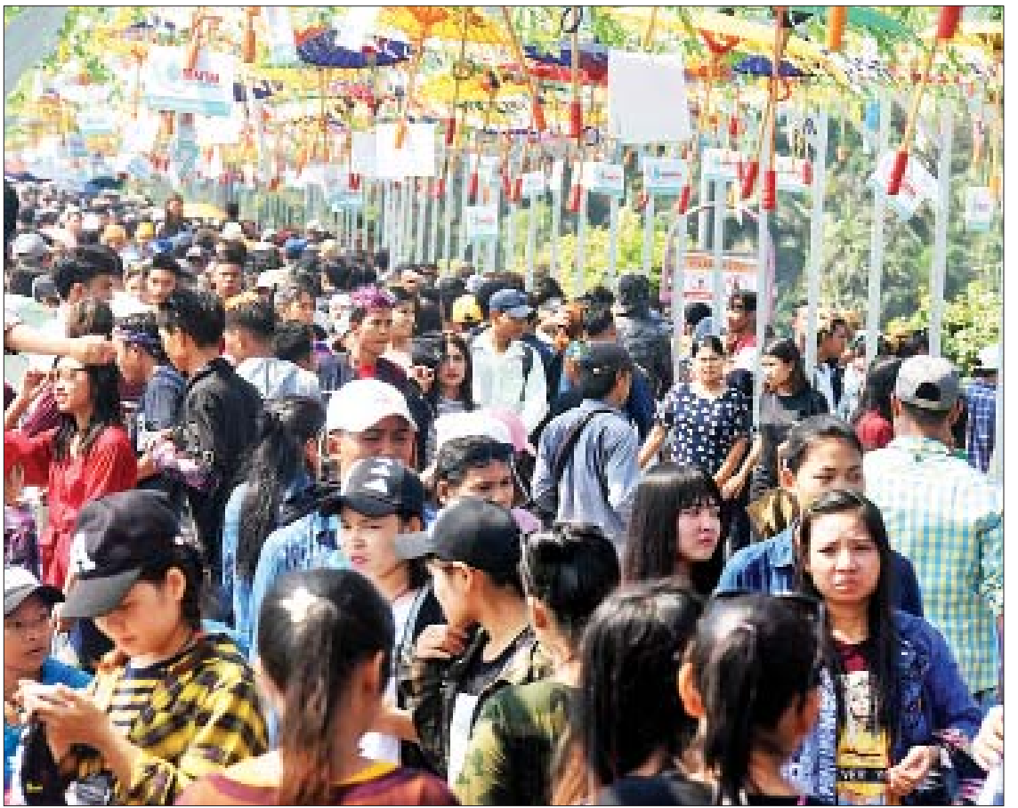
မဟာသင်္ကြန်အကျနေ့တွင် ရန်ကုန်မြို့၊ ကမာရွတ်မြို့နယ် အင်းလျားကန်ပေါင်၌ မြန်မာ့ရိုးရာတိုင်းရင်းသားလမ်းလျှောက် မဟာသင်္ကြန်တွင် သင်္ကြန်ချစ်သူများ ပျော်ရွှင်စွာ ပါဝင်ဆင်နွှဲနေကြစဉ်။

သတင်း - ရဲခေါင်၊ မင်းသစ်