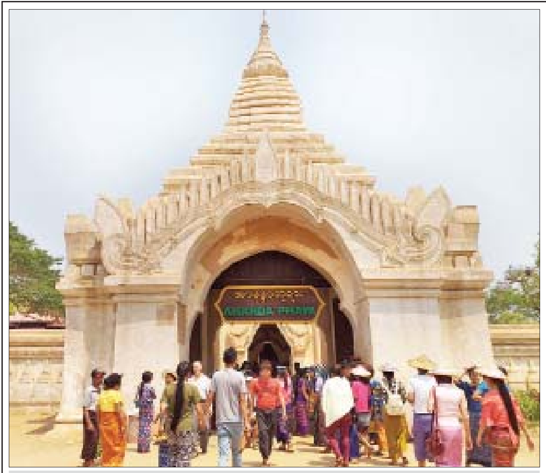
မဟာသင်္ကြန်အကျနေ့တွင် ပုဂံရှေးဟောင်းယဉ်ကျေးမှုအမွေအနှစ်ဒေသရှိ အာနန္ဒာဘုရားသို့ လာရောက်လည်ပတ်သူများဖြင့် စည်ကားများပြားလျက်ရှိသည်ကို တွေ့ရစဉ်။ အောင်မင်းတန်