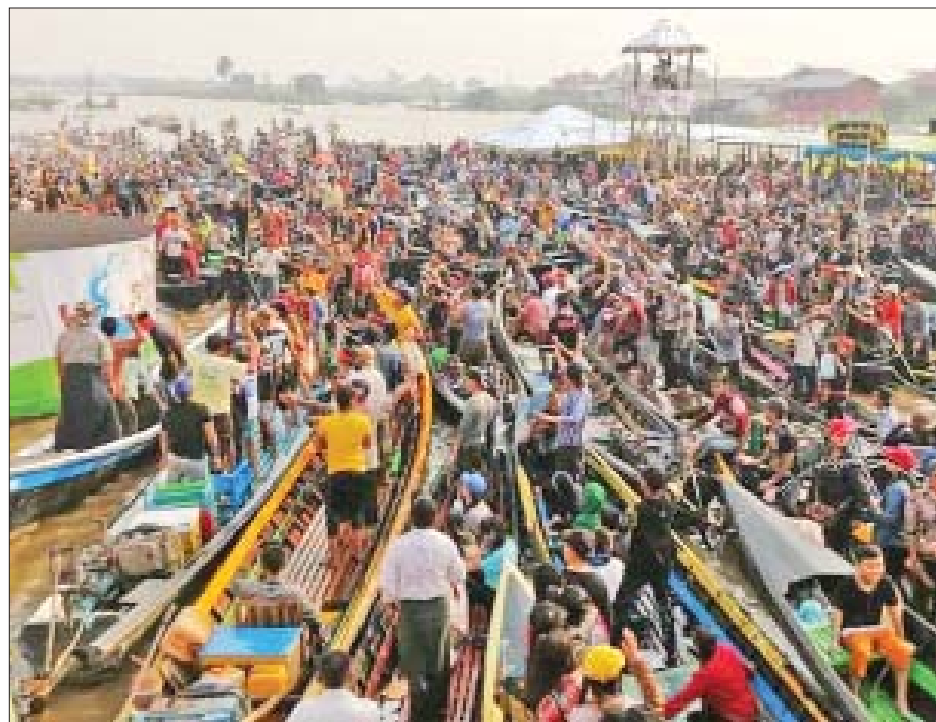
ဧပြီ ၁၄ ရက်တွင် ညောင်ရွှေမြို့နှင့် အင်းလေးဒေသသို့ ခရီးသွားဧည့်သည်များ လာရောက်လည်ပတ်လျက် ရှိရာ ရေပေါ်သင်္ကြန် ကျင်းပသော အင်းလေးရေပြင်၌ ရေကစားခြင်းတို့ဖြင့် စည်ကားလျက်ရှိကြောင်း သိရသည်။ နေမျိုးသူရိန်