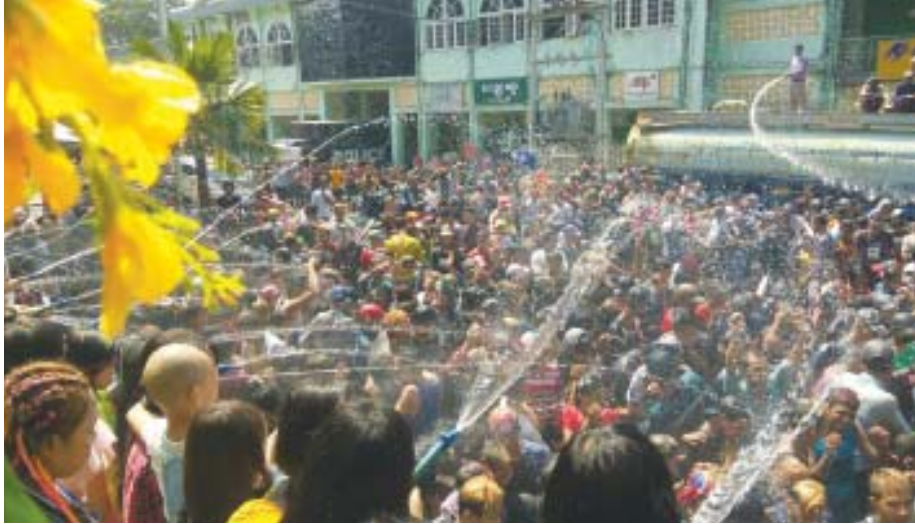
သန်လျင်မြို့နယ် သန်းဝင်း (သန်လျင်)