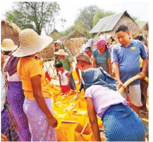
ရပ်ဝန်းဒေသတွင် ပါဝင်နေသည့် အတွက် ယခုလို နွေရာသီကာလများတွင် သောက်သုံးရေအတွက် ကျေးရွာအရောက် လာရောက် ဖြန့်ဝေလှူဒါန်းပေးသည့် ပရဟိတ ရေလှူအသင်းအဖွဲ့များကို မှီခိုနေကြောင်း ညောင်ဦး မြို့နယ် မကျီးတန်းကျေးရွာမှ ဒေသခံ ပြည်သူများထံမှ သိရသည်။ ရဲဝင်းနိုင် (ညောင်ဦး)

ဖြန့်ဝေ လှူဒါန်းပေးခဲ့ကြောင်း သိရသည်။ ယင်းသို့ သင်္ကြန်ကာလအတွင်း ကျေးလက်နေ ပြည်သူများ သောက်သုံးရေ ဖူလုံ စွာ သုံးစွဲနိုင်ရေးအတွက် ရေသယ်ယာဉ်များဖြင့် သောက်သုံးရေများ ဖြန့်ဝေလှူဒါန်းပေးရာတွင် ညောင်ဦး မြို့နယ်မြင်းကပါ ကျေးရွာ ဖြူစင်မေတ္တာ ရေလှူအသင်းနှင့် သုမင်္ဂလာ ပရဟိတ ရေလှူအသင်းမှ ပရဟိတ အသင်းသားများစုပေါင်းအဖွဲ့က ညောင်ဦးမြို့နယ် မကျီးတန်းကျေးရွာ ဒေသခံ ပြည်သူများအတွက် ရေဂါလန် ၃၀၀၀၊ ကုန်းရှည်ကျေးရွာ ဒေသခံ ပြည်သူများအတွက် ရေဂါလန် ၃၀၀၀၊ လက်ပံပင်တဲတိုက်ရှိ ဒေသခံပြည်သူများအတွက် ရေဂါလန် ၃၀၀၀ စုစုပေါင်း ရေဂါလန် ၉၀၀၀ အား အိမ်ထောင်စုအလိုက် စနစ်တကျ ခွဲဝေလှူဒါန်းပေးခဲ့ကြောင်း သိရသည်။ မန္တလေးတိုင်းဒေသကြီး ညောင်ဦး မြို့နယ်သည် အပူပိုင်းဒေသ မိုးနည်း