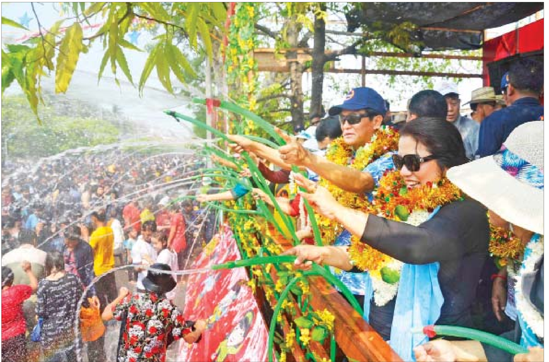
ဒုတိယသမ္မတ ဦးဟင်နရီဗန်ထီးယူနှင့် ဇနီး ဒေါက်တာရွှေလွမ်း မန္တလေးမြို့ မြန်မာ့ရိုးရာမဟာသကြံနိပွဲတော်၌ ပါဝင်ဆင်နွှဲကြစဉ်။