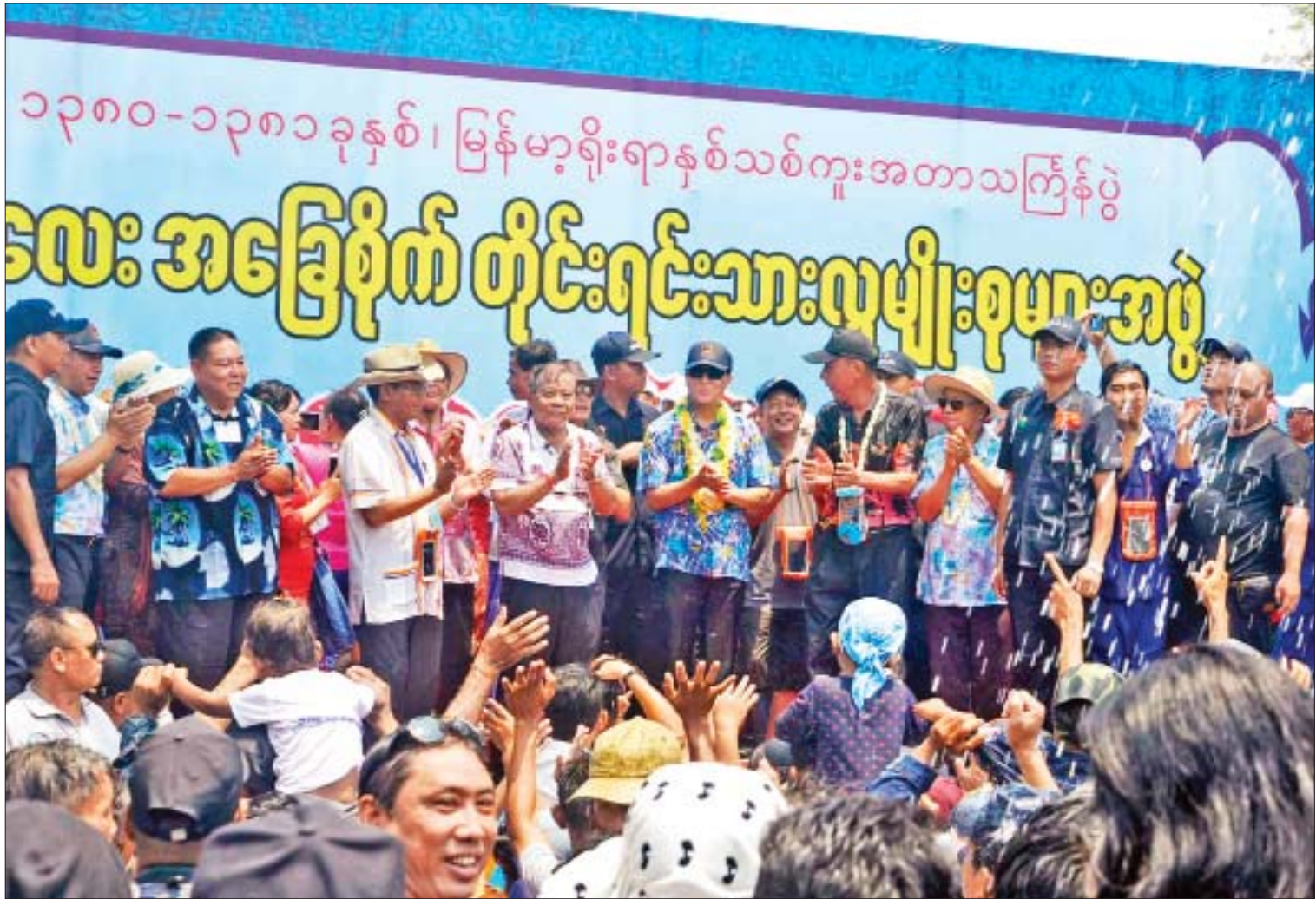
ဒုတိယသမ္မတ ဦးဟင်နရီပန်ထီးယူ၊ မန္တလေးတိုင်းဒေသကြီးဝန်ကြီးချုပ် ဒေါက်တာဇော်မြင့်မောင်နှင့် တာဝန်ရှိသူများ မန္တလေးအခြေစိုက် တိုင်းရင်းသားလူမျိုးစုများအဖွဲ့ ရေကစား မဏ္ဍပ်တွင် ပါဝင်ဆင်နွှဲကြစဉ်။

❖ ရှေ့မှ ဆက်လက်၍ ဒုတိယသမ္မတနှင့်ဇနီးတို့ သည် ကျုံးတောင်ဘက်ခြမ်းတွင် ကျင်းပ လျက်ရှိသည့် လမ်းလျှောက်သင်္ကြန်ပွဲတော်သို့ လာရောက်လည်ပတ် ရေကစားကြသည့် သင်္ကြန်ချစ်သူပြည်သူများအား ရင်းနှီးစွာ နှုတ်ဆက်၍ အမျိုးသားဒီမိုကရေစီအဖွဲ့ချုပ် ရေကစားမဏ္ဍပ်၊ မန္တလေးတိုင်းဒေသကြီး ကုန်သည်များနှင့် စက်မှုလက်မှုလုပ်ငန်းရှင် များအသင်း၏ ရေကစားမဏ္ဍပ်၊ မန္တလေး အခြေစိုက် တိုင်းရင်းသားလူမျိုးစုများအဖွဲ့၏ စတုဒိသာမဏ္ဍပ်များ၊ ရေကစားမဏ္ဍပ်များကို လိုက်လံကြည့်ရှုအားပေးခဲ့ပြီး တိုင်းရင်းသား လူမျိုးစုများ၏ ရိုးရာယဉ်ကျေးမှု အကအလှ များကို ကြည့်ရှုအားပေး၍ မန္တလေး လမ်းလျှောက်သင်္ကြန်အား ပါဝင်ဆင်နွှဲသည်။ ညနေပိုင်းတွင် ဒုတိယသမ္မတနှင့်ဇနီး သည် တိုင်းဒေသကြီးဝန်ကြီးချုပ်နှင့် တိုင်းဒေသကြီး အစိုးရအဖွဲ့ဝင်ဝန်ကြီးများ လိုက်ပါလျက် ကျုံးတောင်ဘက် ၂၆ လမ်းနှင့် ၇၁ လမ်းထောင့်ရှိ နန်းမြို့သူ ရေကစားမဏ္ဍပ် နှင့် မဟာအောင်မြေမြို့နယ် မနော်ရမ္မာကွင်းရှိ တိုင်းရင်းသားသွေးချင်းများ၏ စုပေါင်း မဟာသင်္ကြန်မဏ္ဍပ်များသို့ သွားရောက်၍ တိုင်းရင်းသားများ၏ သီဆိုဖျော်ဖြေမှုများ၊ သံချပ်အသင်းများ၏ ပြိုင်ပွဲဝင်မှုများကို အားပေးကြည့်ရှုသည်။ ထို့နောက် ကျုံးအရှေ့ဘက်ခြမ်းရှိ တောသင်္ကြန် နေ့ညဈေးရောင်းပွဲတော်သို့ သွားရောက်ကြည့်ရှုအားပေးသည်။ သတင်းစဉ်