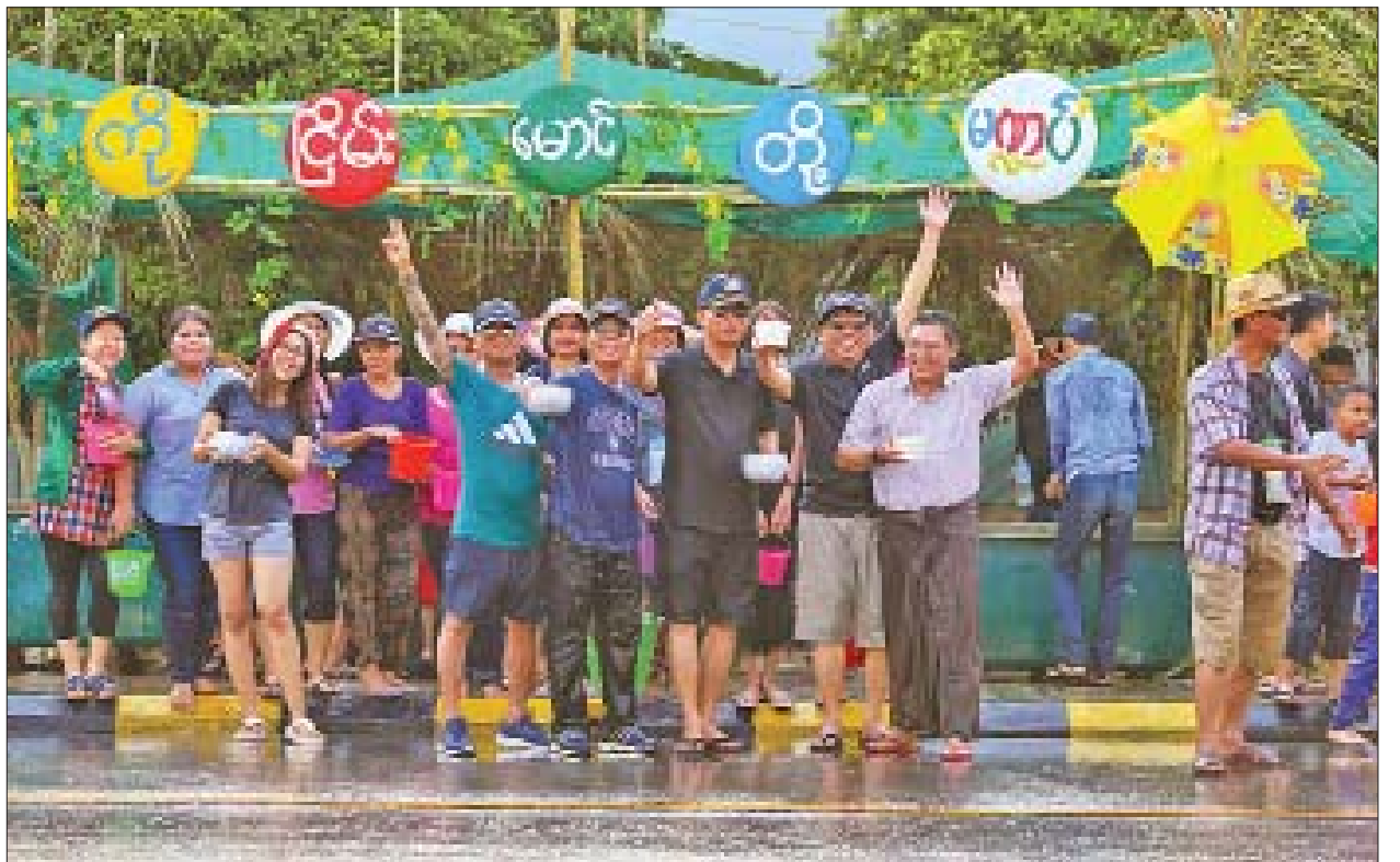
နေပြည်တော် ရာဇသင်္ဂဟလမ်းပေါ်ရှိ ကိုငြိမ်းမောင်တို့မဏ္ဍပ်တွင် ပျော်ရွှင်စွာရေကစားနေကြသူများကို ဧပြီ ၁၄ ရက်(သင်္ကြန်အကျနေ့)က တွေ့ရစဉ်။

အလားတူ နေပြည်တော်ဇေယျာသီရိမြို့နယ်ရှိ အမျိုးသားအထိမ်းအမှတ် ဥယျာဉ်၊ လှေခွင်းတောင်အပန်းဖြေစခန်း၊ နေပြည်တော် ရေပန်းဥယျာဉ် စသည့် နေရာများတွင်လည်း လာရောက်လည်ပတ် အနားယူအပန်းဖြေကြသူ