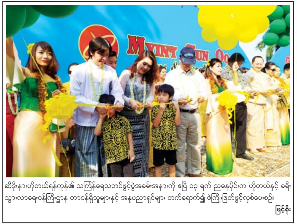
ဆီဒိုးနားဟိုတယ်ရန်ကုန်၏ သင်္ကြန်ရေသဘင်ဖွင့်ပွဲအခမ်းအနားကို ဧပြီ ၁၄ ရက် ညနေပိုင်းက ဟိုတယ်နှင့် ခရီးသွားလာရေးဝန်ကြီးဌာန တာဝန်ရှိသူများနှင့် အနုပညာရှင်များ တက်ရောက်၍ ဖဲကြိုးဖြတ်ဖွင့်လှစ်ပေးစဉ်။ မြင့်စိုး

ရိုးရာယဉ်ကျေးမှုအတာသင်္ကြန်ပွဲတော်ကို မြန်မာ့ဓလေ့ထုံးထမ်းအစဉ်အလာနှင့်အညီ အစဉ်အလာမပျက် ဆက်လက်ထိန်းသိမ်းနိုင်ရန်၊ ပြည်သူများ စိတ်ရွှင်လန်းချမ်းမြေ့စွာဖြင့် ရေကစားနိုင်စေရန်၊ ရေသဘင်ပွဲတော်တွင် မြန်မာ့ရိုးရာဝတ်စားဆင်ယင်မှုကို ဆက်လက်ထိန်းသိမ်းတတ်စေရန်၊ နှစ်သစ်ကူးအခါသမယတွင် ပြည်သူများသည် မိမိတို့ ပင်ပန်းနွမ်းနယ်သမျှကို အတာရေပက်ဖျန်းလန်းဆန်းစေပြီး စိတ်သစ်ကိုယ်သစ် စွမ်းအားအပြည့်ဖြင့် ဆောင်ရွက်နိုင်ကြရန်၊ မြန်မာမှု၊ မြန်မာ့ဟန်၊ မြန်မာ့ယဉ်ကျေးမှုအမွေအနှစ်များ၊ အမျိုးသားရေးလက္ခဏာများကို ဆက်လက်ထိန်းသိမ်းစောင့်ရှောက်ကြစေရန် ရည်ရွယ်၍ ကျင်းပခြင်းဖြစ်သည်။ တိုးတိုးမေ(ဟိုပင်)