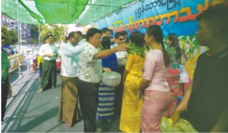
ပုဇွန်တောင်မြို့နယ် မြို့နယ် (ပြန်/ဆက်)