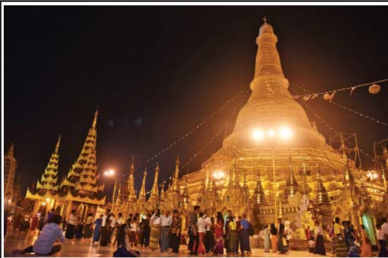
မဟာသင်္ကြန်အကျနေ့ညပိုင်းတွင် ရန်ကုန်မြို့၊ ရွှေတိဂုံစေတီတော်၌ ကုသိုလ်ကောင်းမှုပြုကြသူများဖြင့် စည်ကားလျက်ရှိသည်ကို တွေ့ရစဉ်။