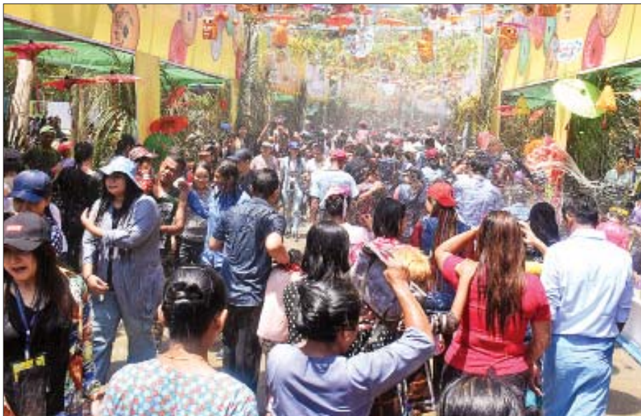
မဟာသင်္ကြန်အကျနေ့တွင် ရန်ကုန်မြို့၊ မြကျွန်းသာလမ်းလျှောက်သင်္ကြန်၌ သင်္ကြန်ချစ်သူများ ပျော်ရွှင်စွာ ဆင်နွှဲနေကြစဉ်။