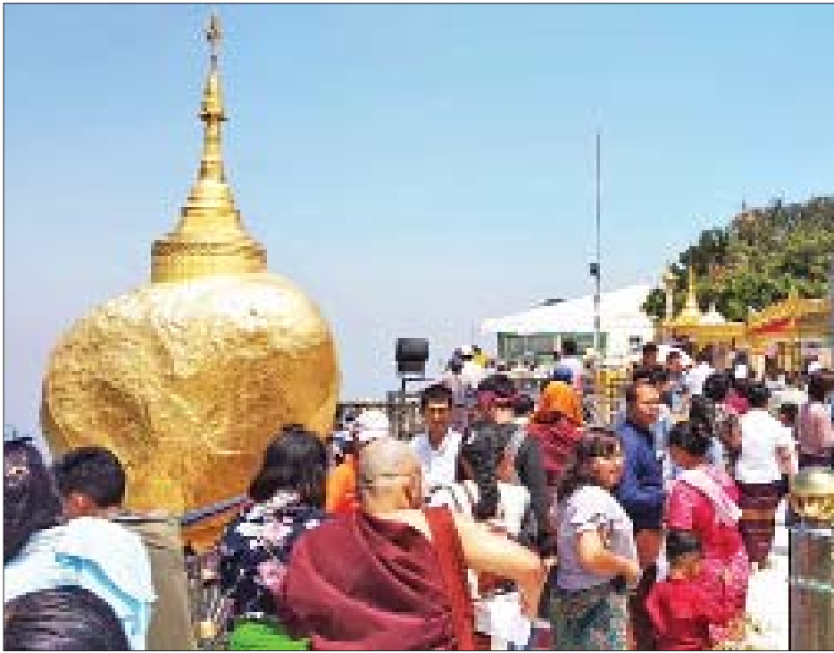
ကမ္ဘာ့အံ့ဩဖွယ်စာရင်းဝင် မွန်ပြည်နယ်ရှိ ကျိုက်ထီးရိုးစေတီတော်သို့ ဧပြီ ၁၄ ရက် မဟာသင်္ကြန်အကျနေ့တွင် လာရောက်ကြည့်ရှုသူများဖြင့် စည်ကားနေသည်ကို တွေ့ရစဉ်။