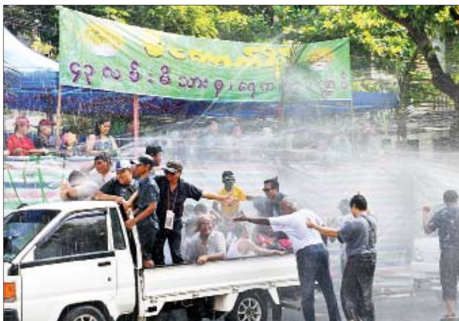
ဧပြီ ၁၄ ရက် မဟာအတာသင်္ကြန်အကျနေ့ ညနေပိုင်းတွင် ရန်ကုန်မြို့၊ မဟာဗန္ဓုလလမ်းနှင့် ၄၃ လမ်းထိပ်ရှိ ပိတောက်ရိပ်ရေကစားမဏ္ဍပ်တွင် ပျော်ရွှင်စွာရေပန်းခတ်နေစဉ်။ အောင်ဌေး