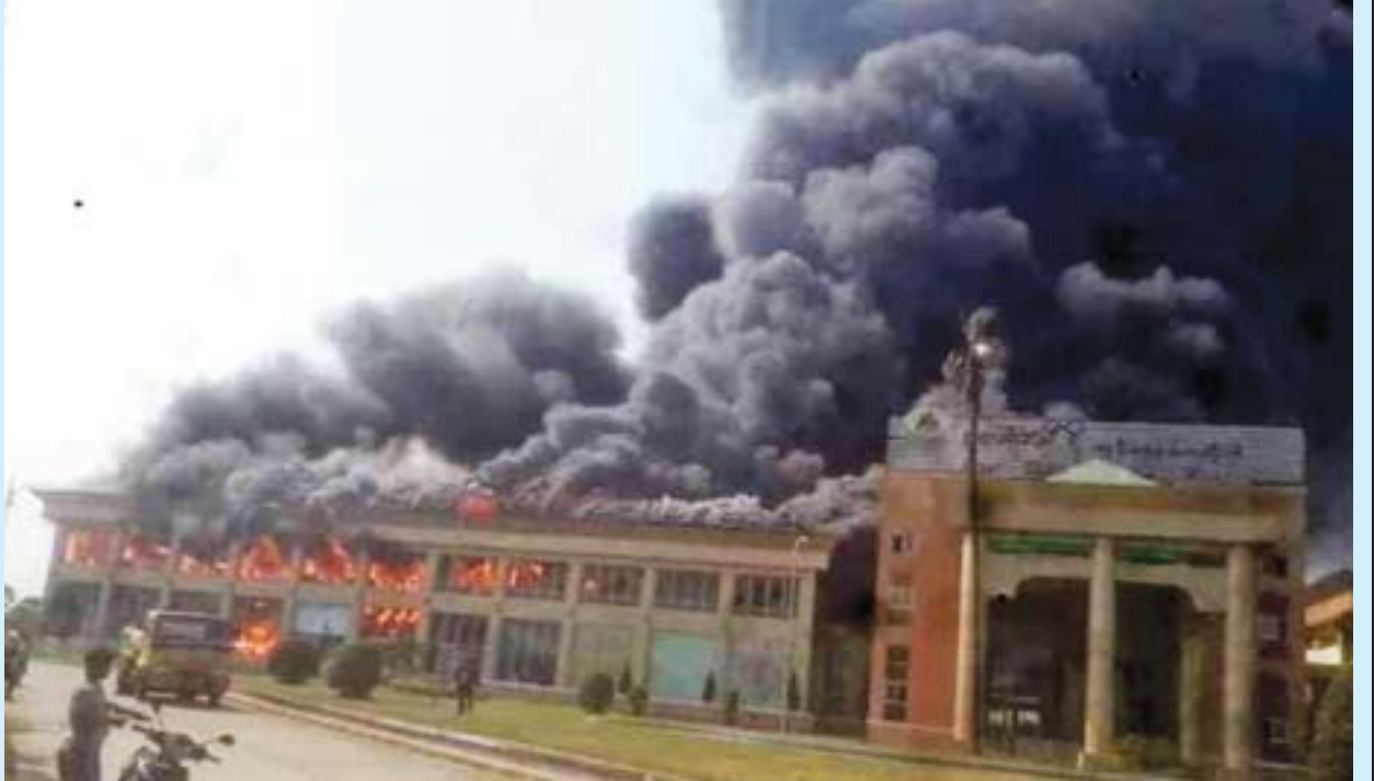
ရှိခဲ့ပြီး သက်ဆိုင်ရာ ဆေးရုံသို့ ပို့ဆောင်ကုသလျက်ရှိကြောင်း၊ ပဏာမ စစ်ဆေးချက်များအရ မီးလောင်မှုမှာ ဝိုင်ယာရှော့ကြောင့် မီးလောင်ကျွမ်းခြင်း ဖြစ်ပြီး မီးသတ်ဦးစီးဌာနမှ မီးလောင်ကျွမ်းမှု Level - 2 အဆင့် သတ်မှတ်ကာ မီးငြိမ်းသတ်ခဲ့ကြောင်း၊ မီးကြွင်းမီးကျန်များမရှိစေရေးနှင့် ကျန်အဆောက်

မီးငြိမ်းသတ်စဉ် မှန်ကွဲစထိမှန်သည့် ဒဏ်ရာရရှိသူ (မစိုးရိမ်ရ) နှစ်ဦး