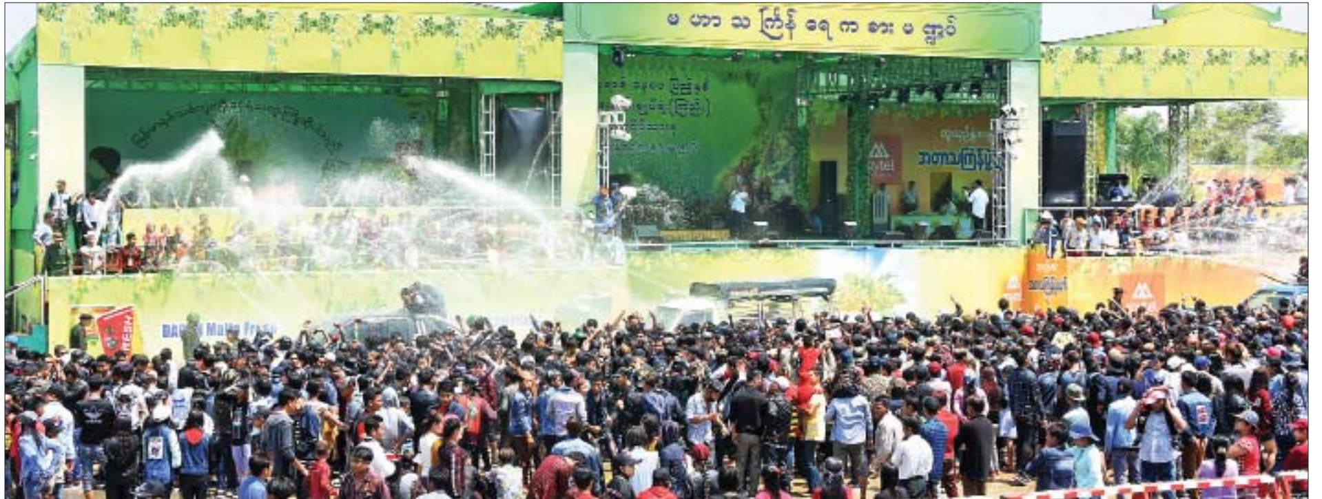
ကာကွယ်ရေးဦးစီးချုပ်ရုံး(ကြည်း) မဟာသင်္ကြန်ရေကစားမဏ္ဍပ်တွင် လာရောက်ရေကစားသူများဖြင့် စည်ကားလျက်ရှိသည်ကို တွေ့ရစဉ်။

ကြီးဘုရား၊ ဆုတောင်းပြည့်လောကမာရဇိန်စေတီတော်ကြီး စသည့် ဘုရားကျောင်းကန်များတွင် ဥပုသ်သီလဆောက်တည်ကြသူများ၊ တရားစခန်းများတွင် တရားဘာဝနာရှုမှတ်ပွားများကြသူများလည်း များပြားခဲ့ကြကြောင်း သိရသည်။ သတင်း - မျိုးရဲသူ၊ ဓာတ်ပုံ - သန်းထိုက်စုန်