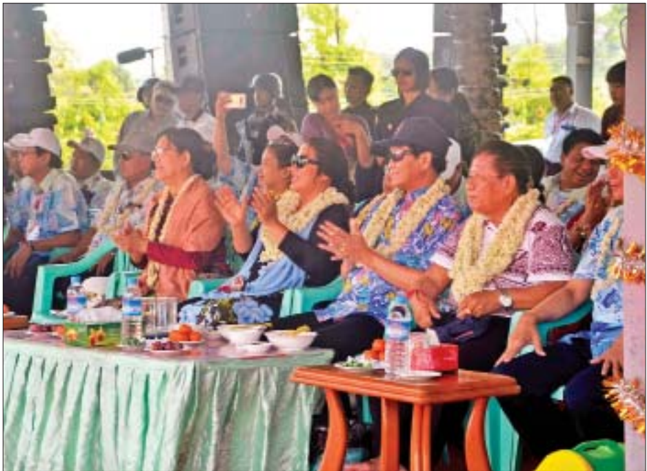
ဒုတိယသမ္မတ ဦးဟင်နရီပန်ထီးယူနှင့်ဇနီး ဒေါက်တာရွှေလွမ်း၊ မန္တလေးတိုင်းဒေသကြီးဝန်ကြီးချုပ် ဒေါက်တာဇော်မြင့်မောင်နှင့် ဇနီး ဒေါက်တာယုယုမေတို့ မန္တလေးမြို့တော် မဟာသင်္ကြန်မဏ္ဍပ်၌ တေးသံရှင်များ၏ သီဆိုဖျော်ဖြေမှုနှင့် ယိမ်းအကအဖွဲ့များ၏ ဖျော်ဖြေမှုများကို ကြည့်ရှုအားပေးကြစဉ်။