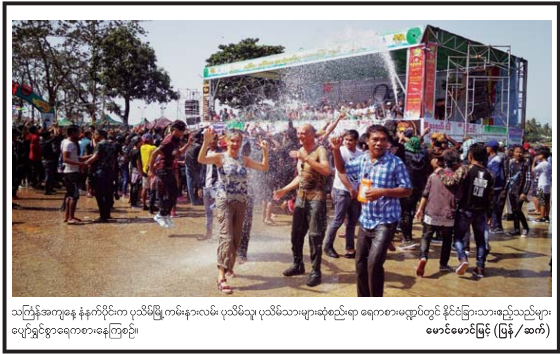
သင်္ကြန်အကျနေ့ နံနက်ပိုင်းက ပုသိမ်မြို့ကမ်းနားလမ်း ပုသိမ်သူ၊ ပုသိမ်သားများဆုံစည်းရာ ရေကစားမဏ္ဍပ်တွင် နိုင်ငံခြားသားဧည့်သည်များ ပျော်ရွှင်စွာရေကစားနေကြစဉ်။ မောင်မောင်မြင့် (ပြန်/ဆက်)