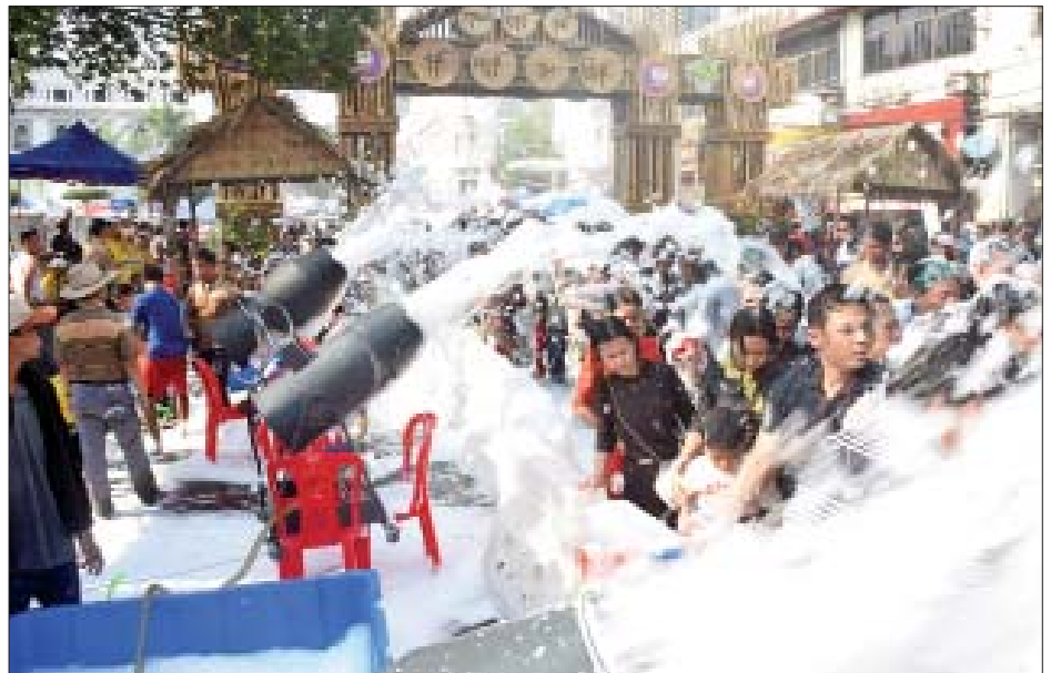
မဟာသင်္ကြန်အကျနေ့တွင် ရန်ကုန်မြို့၊ မဟာဝန္ဓုလပန်းခြံလမ်း လမ်းလျှောက်သင်္ကြန်၌ သင်္ကြန်ချစ်သူများ ပျော်ရွှင်စွာ ပါဝင်ဆင်နွှဲနေသည်ကို စည်ကားစွာ တွေ့ရစဉ်။