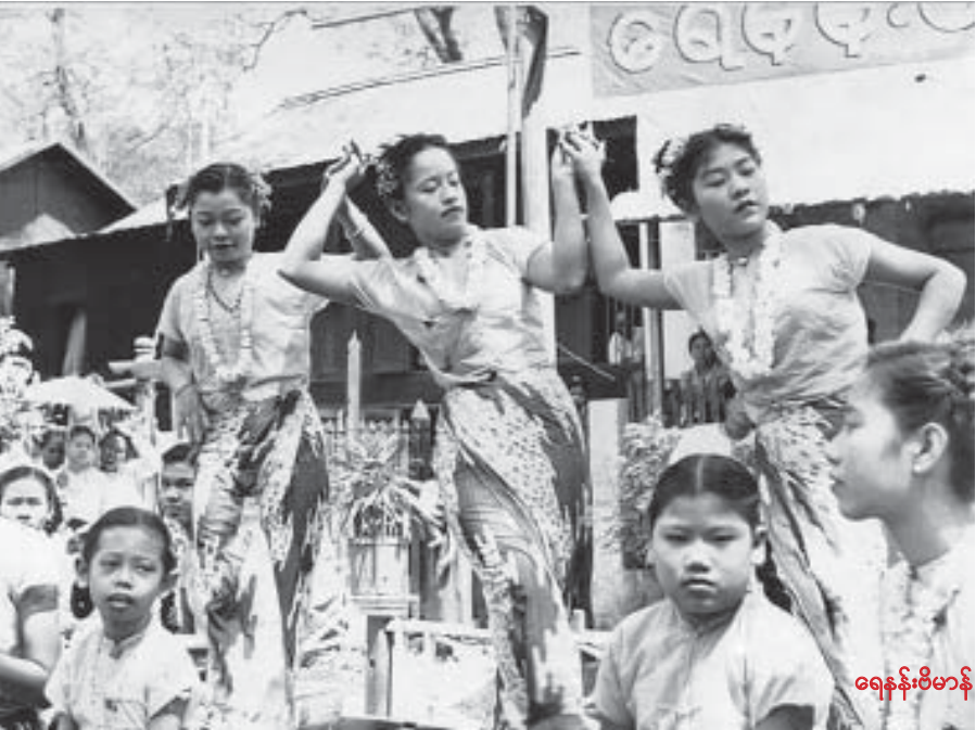
ရေနန်းဗိမာန်

ထိုစာသားလေးတွေက ညက်ညောလှပသော သံစဉ်နှင့်အတူ ရင်ထဲက တစ်ဆင့် နှလုံးသားထဲထိ စီးဝင်စွဲမြဲသွားသည်။ ပျိုတိုင်းကြိုက်တဲ့ နှင်းဆီခိုင် ပျိုတို့မောင်ကြီးတွေ လေပြည့်လေညင်းနှင့်အတူ အရောက်လာမည့် “ရေနန်းဗိမာန်” ဆိုတာ မိမိတို့ ကိုယ်တိုင်ပင်ဖြစ်လိုက်ပါစေတော့ ... ။