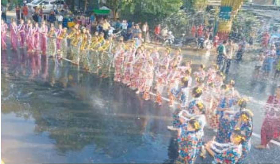
ပေါင်မြို့ ကိုဟိန်း (ပေါင်)