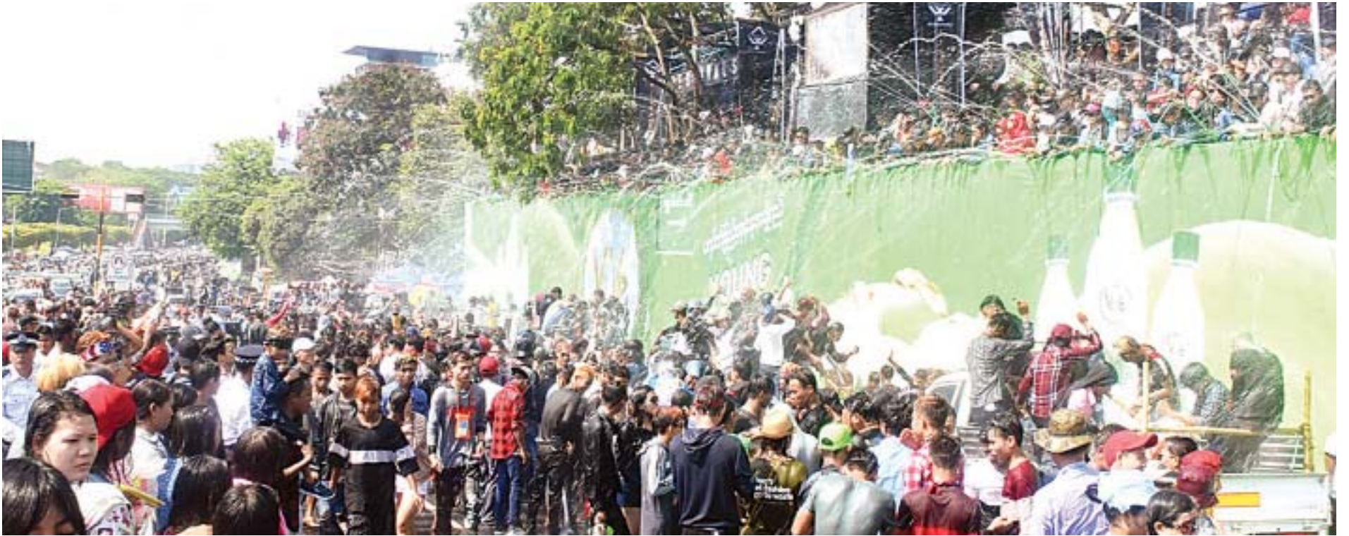
မဟာသင်္ကြန်အကျနေ့တွင် ရန်ကုန်မြို့၊ ပြည်လမ်းတစ်လျှောက် ရေကစားမဏ္ဍပ်များ၌ သင်္ကြန်ဆင်နွှဲနေသူများ ပျော်ရွှင်စွာ ရေကစားနေကြစဉ်။