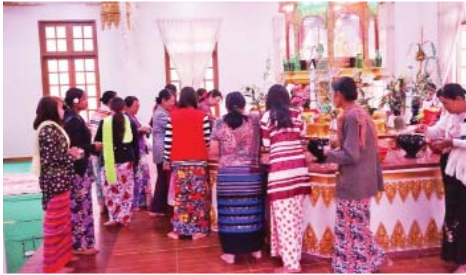
လူငယ်နှင့်သင်္ကြန်ချစ်သူများက ရေကစားမဏ္ဍပ်များ ပြုလုပ်၍ နှစ်ဟောင်းမှ အညစ်အကြေးများကို အတာသင်္ကြန်ရေဖြင့် ပက်ဖျန်းကာ ကျန်းမာချမ်းသာပြီး တစ်နှစ်လုံး ကိုယ်စိတ်နှစ်ဖြာ ကျန်းမာရွှင်လန်းပါစေကြောင်း ဆုတောင်းမေတ္တာပို့ပေးခဲ့ကြကြောင်း သိရသည်။ စိုင်းသန်းကျော်(တောင်ကြီး)

အတာသင်္ကြန်အကျနေ့ နံနက်ပိုင်းတွင် ဘုရားကိုးဆူး၊ နှစ်ကျိပ်ရှစ်ဆူဘုရားများသို့ နံနက် ဆွမ်းများကို ဗုဒ္ဓမြတ်စွာဘုရား ရည်စူး၍ ဆွမ်းဆက်ကပ် လှူဒါန်းမှုများ၊ ဘုရားကျောင်းကန်၊ စေတီများ၊ အထင်ကရ နေရာများတွင် သီလယူ၍ ကုသိုလ်ပွားများ အားထုတ်ခဲ့ကြပြီး