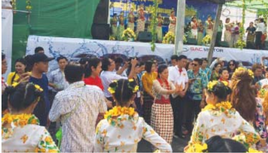
မင်္ဂလာတောင်ညွန့်မြို့နယ် ကျော်စိုးမိုး (မင်္ဂလာတောင်ညွန့်)