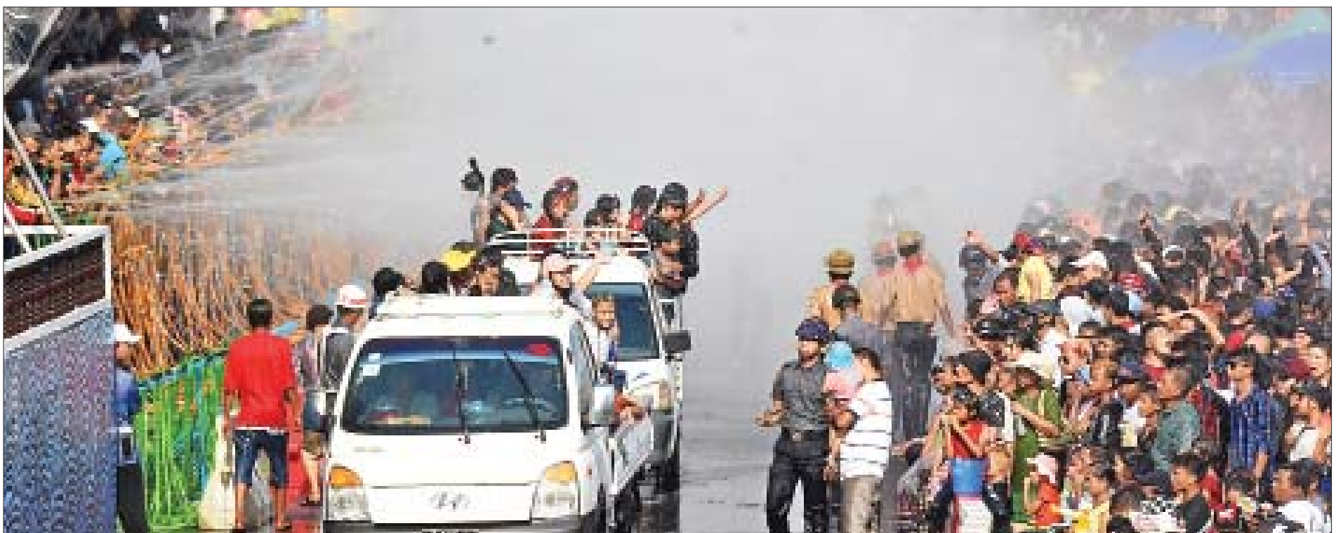
မဟာသင်္ကြန်အကျနေ့တွင် ရန်ကုန်မြို့တော် မဟာသင်္ကြန်ပဟိုမဏ္ဍပ်၌ ရေပက်ခံကားများ၊ ရေပက်ခံထွက်သူများဖြင့် စည်ကားလျက်ရှိသည်ကို တွေ့ရစဉ်။