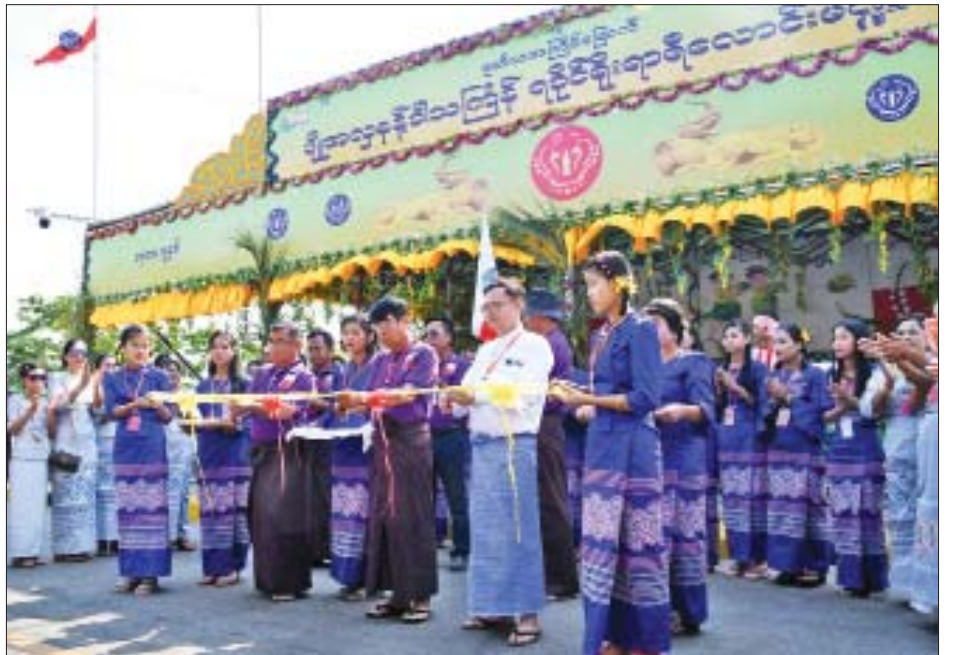
ရခိုင်ရိုးရာ ရေကစားမဏ္ဍပ် ဖွင့်ပွဲအခမ်းအနား ကျင်းပစဉ်။