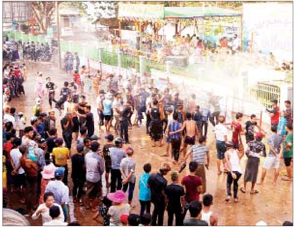
၁၃၈၀ ပြည့်နှစ် သာပေါင်းမြို့နယ် အမှတ်(၂)ရပ်ကွက် ကမ်းနားလမ်း ပြည်သူ့ပန်းခြံ ဗဟိုမဏ္ဍပ်၌ မြန်မာ့ရိုးရာ ယဉ်ကျေးမှု နှစ်သစ်ကူးမဟာသင်္ကြန်ပွဲ ရေသဘင်ပွဲဆင်နွှဲနေကြသူများကို ဧပြီ ၁၃ ရက်က တွေ့ရစဉ်။