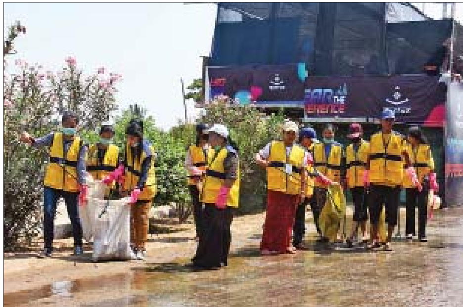
မဟာသင်္ကြန်ကာလအတွင်း ပျဉ်းမနားမြို့အတွင်း အမှိုက်ကင်းစင်ရေးအတွက် မျှဝေသောလက်များ ပရဟိတအသင်းက အမှိုက်ကင်းစင်ရေးလုပ်ငန်းမှု ဆောင်ရွက်စဉ်။