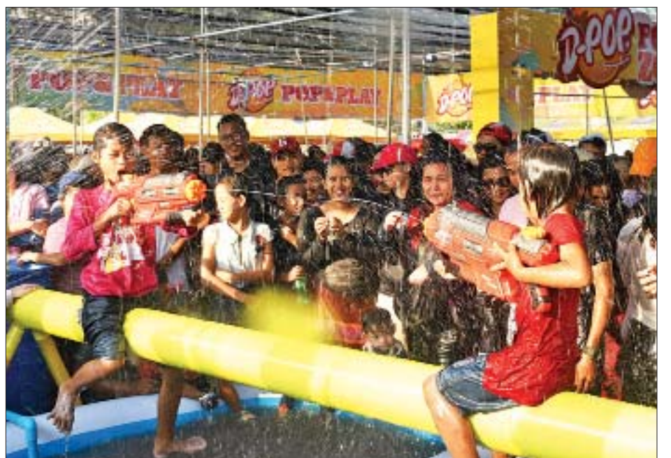
ဧပြီ ၁၄ ရက် အတာသင်္ကြန်အကျနေ့ ညနေပိုင်းတွင် ရန်ကုန်မြို့၊ တာမွေမြို့နယ် ကျိုက္ကဆံကွင်းအတွင်း၌ Enveron-C Forever တို့၏ သင်္ကြန်ပျော်ပွဲ ချွင်ပွဲတွင် ကလေးငယ်များ ပျော်ရွှင်စွာပါဝင်ဆင်နွှဲစဉ်။ အောင်ဌေး