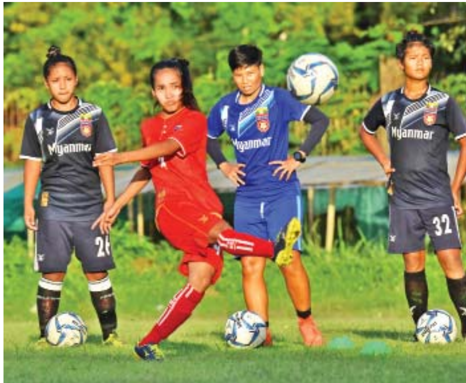
မြန်မာ ယူ-၁၉ အမျိုးသမီးအသင်း လေ့ကျင့်နေစဉ်။

သည် ပထမအကျောအိမ်ကွင်းပွဲတွင် နှစ်ဂိုး-တစ်ဂိုးဖြင့် ရှုံးနိမ့်ခဲ့သည်။ ရှမ်းယူနိုက်တက်အသင်းသည် ယင်းပြိုင် ပွဲတွင် အုပ်စုသုံးပွဲစလုံး ရှုံးထားပြီး တင်ဒေါင်းအသင်းမှာမူ သုံးပွဲကစား လေးမှတ်ရထားသည်။ သတင်း-ရှိုင်းထက်ဇော်