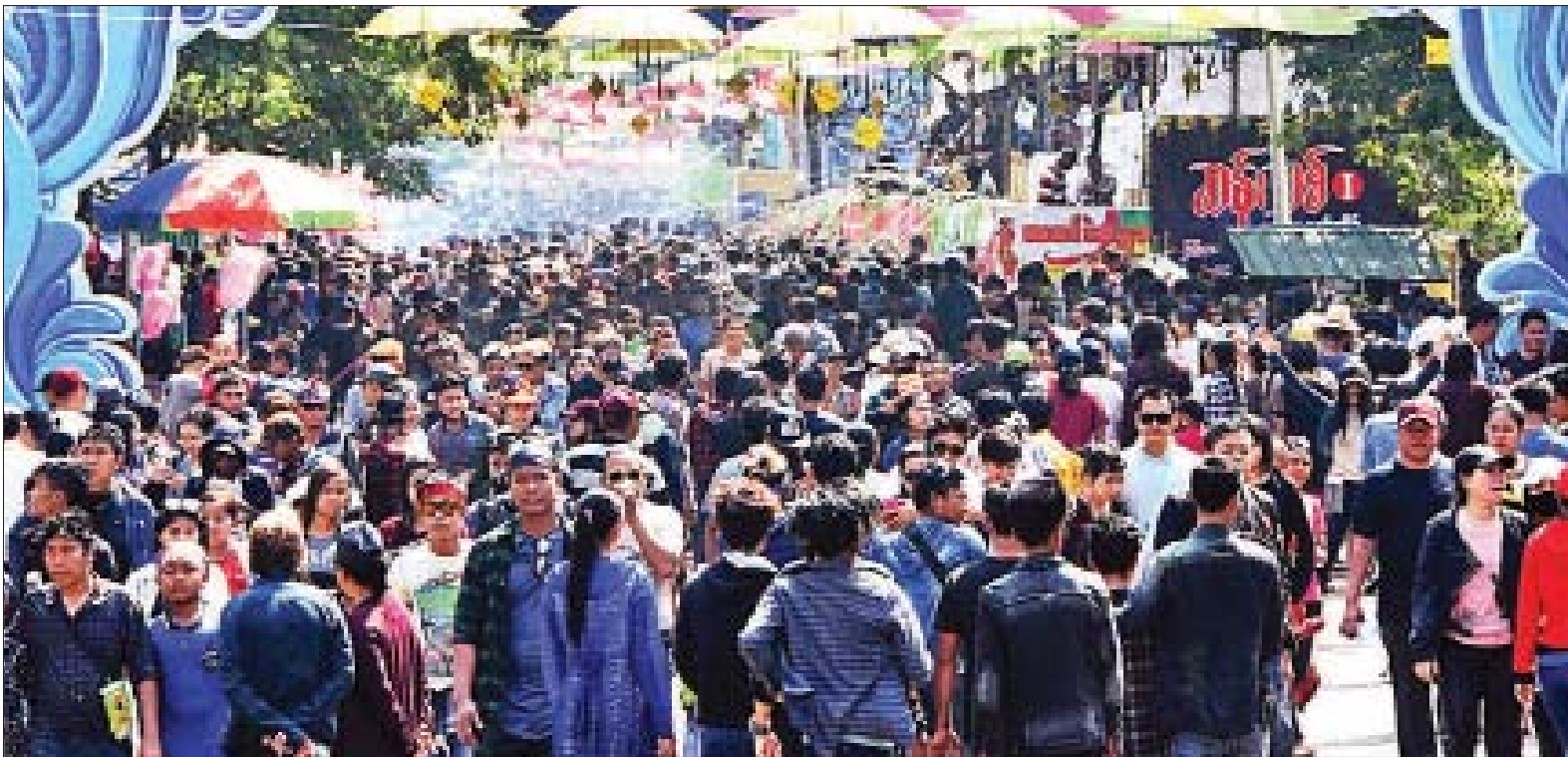
ပျဉ်းမနားလမ်းလျှောက်သင်္ကြန်ပွဲတော်တွင် ပါဝင်ဆင်နွှဲသူများဖြင့် စည်ကားလျက်ရှိသည်ကို ဧပြီ ၁၄ ရက်(သင်္ကြန်အကျနေ့)က တွေ့ရစဉ်။