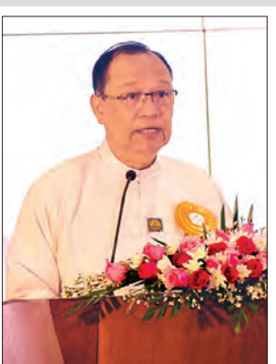
ပြည်ထောင်စုဝန်ကြီး ဦးသန့်စင်မောင် အမှာစကားပြောကြားစဉ်။

ဦးဆောင်ကော်မတီ၏ လုပ်ငန်းတာဝန်များကို အောင်မြင်စွာ အကောင်အထည်ဖော်ဆောင်ရွက်နိုင်ရန်အတွက် ဦးဆောင်ကော်မတီက ၂၀၁၆ ခုနှစ်၊ ဇွန် ၁၂ ရက်တွင် e-ID စနစ်လုပ်ငန်းကော်မတီကိုဖွဲ့စည်းခဲ့ပြီး ယင်းအပြင် e-Government အကောင်အထည်ဖော်ရေး လုပ်ငန်းကော်မတီ၏ အောက်