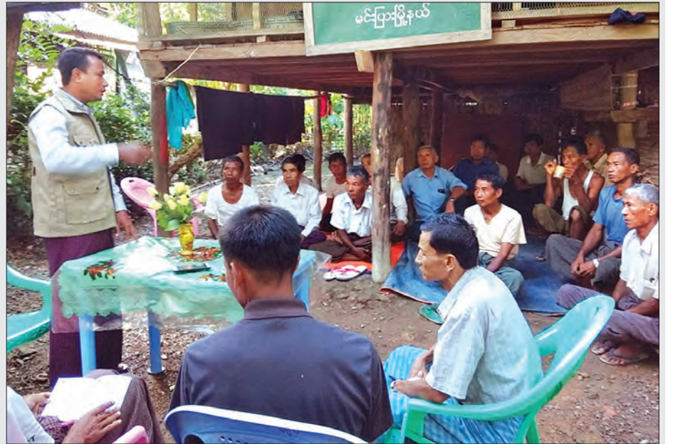
မင်းပြားမြို့နယ်တွင် ကျွဲ၊ နွားများ ရောဂါကာကွယ်ထိန်းချုပ်ရေးလုပ်ငန်းများနှင့် ပတ်သက်ပြီး တာဝန်ရှိသူများက ဒေသခံများအား ကွင်းဆင်းအသိပညာပေးလုပ်ငန်းများ ဆောင်ရွက်စဉ်။