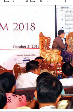
“Implementation Challenges and Opportunities for Local Industry” ခေါင်းစဉ်ဖြင့် စကားပိုင်းဆွေးနွေးပွဲ ကျင်းပစဉ်။

ပိုမိုတိုးတက်ကောင်းမွန် ချောမွေ့လာမည်ဖြစ်သကဲ့သို့ မိမိတို့၏ အရည်အသွေးများလည်း တိုးတက်လာမည်ဖြစ်ကြောင်း၊ မိမိတို့ဝန်ဆောင်မှုပေးနေသည့် ပြည်သူများကိုလည်း e-Government စနစ်နှင့် ရင်းနှီးကျွမ်းဝင်လာအောင် ရှင်းလင်းဆွဲဆောင်ကြရန် တိုက်တွန်းပြောကြားလိုကြောင်း၊ သို့မဟုတ် e-Government စနစ်မြန်မြန်ဆန်ဆန် အကောင်အထည်ဖော် ဆောင်ရွက်လာမည်ဖြစ်ကြောင်း။