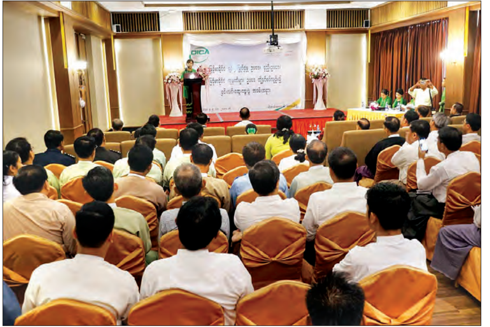
တရားသူကြီး၊ ဥပဒေချုပ်၊ စာရင်းစစ်ချုပ်၊ ရင်းနှီးမြှုပ်နှံမှုနှင့် ကုမ္ပဏီများ ညွှန်ကြားမှုဦးစီးဌာနမှ တာဝန်ရှိသူများ၊ ဌာနဆိုင်ရာ တာဝန်ရှိသူများ၊ စီးပွားရေးလုပ်ငန်းရှင်များ၊ ဖိတ်ကြားထားသူ များ တက်ရောက်ခဲ့ကြောင်း သိရသည်။ ခရိုင် (ပြန်/ဆက်)

အဆိုပါ အခမ်းအနားသို့ တိုင်းဒေသကြီး ဝန်ကြီးချုပ်နှင့် ဝန်ကြီးများ၊ လွှတ်တော်ဒုတိယဥက္ကဋ္ဌ၊ တရားလွှတ်တော်