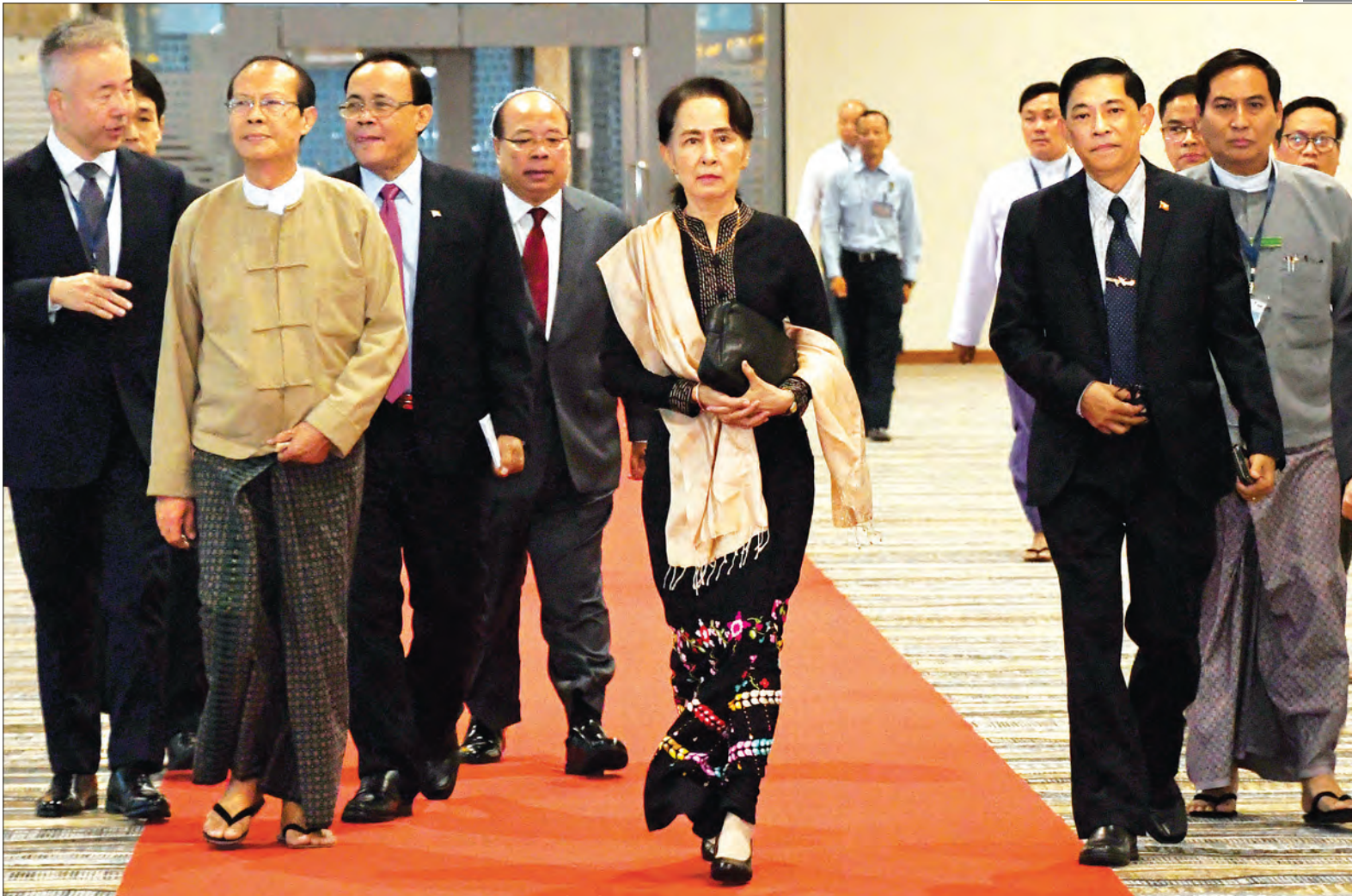
နိုင်ငံတော်၏အတိုင်ပင်ခံပုဂ္ဂိုလ် ဒေါ်အောင်ဆန်းစုကြည်အား နေပြည်တော်ကောင်စီဥက္ကဋ္ဌ ဒေါက်တာမျိုးအောင်နှင့် တာဝန်ရှိသူများက နေပြည်တော်အပြည်ပြည်ဆိုင်ရာလေဆိပ်၌ ပို့ဆောင်နှုတ်ဆက်ကြစဉ်။ သတင်းစဉ်

ထိုမှတစ်ဆင့် နိုင်ငံတော်၏ အတိုင်ပင်ခံပုဂ္ဂိုလ် ဒေါ်အောင်ဆန်းစုကြည်နှင့် အဖွဲ့သည် ဂျပန်လေကြောင်းလိုင်းဖြင့် ဒေသစံတော်ချိန် ညနေ ၆ နာရီတွင် ဂျပန်နိုင်ငံ တိုကျိုမြို့သို့ ရောက်ရှိရာ ဂျပန်နိုင်ငံဝန်ကြီးချုပ်၏ အထူးအကြံပေး ပုဂ္ဂိုလ် Mr. Hiroto Izumi၊ မြန်မာ နိုင်ငံဆိုင်ရာ ဂျပန်သံအမတ်ကြီး H.E.Mr. Ichiro Maruyama၊ ဂျပန်နိုင်ငံဆိုင်ရာ မြန်မာသံအမတ်ကြီး ဦးသူရိန်သန်းဇော်၊ မြန်မာစစ်သံမှူး ဝိုင်းပန်းချုပ်ခင်ဇော်၊ မြန်မာသံရုံးနှင့် စစ်သံရုံးတို့မှ တာဝန်ရှိသူများနှင့် သံရုံး မိသားစုများက Haneda အပြည်ပြည် ဆိုင်ရာလေဆိပ်၌ ကြိုဆိုနှုတ်ဆက်ကြ သည်။