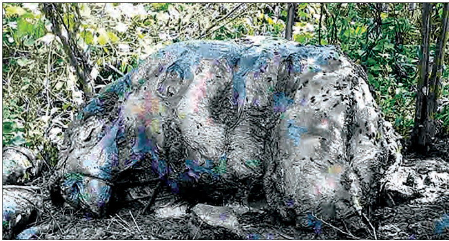
ဆင်သတ်မှုဆိုးများ သတ်ဖြတ်ခံရသည့် တောဆင်ရိုင်းတစ်ကောင်ကို တွေ့ရစဉ်။