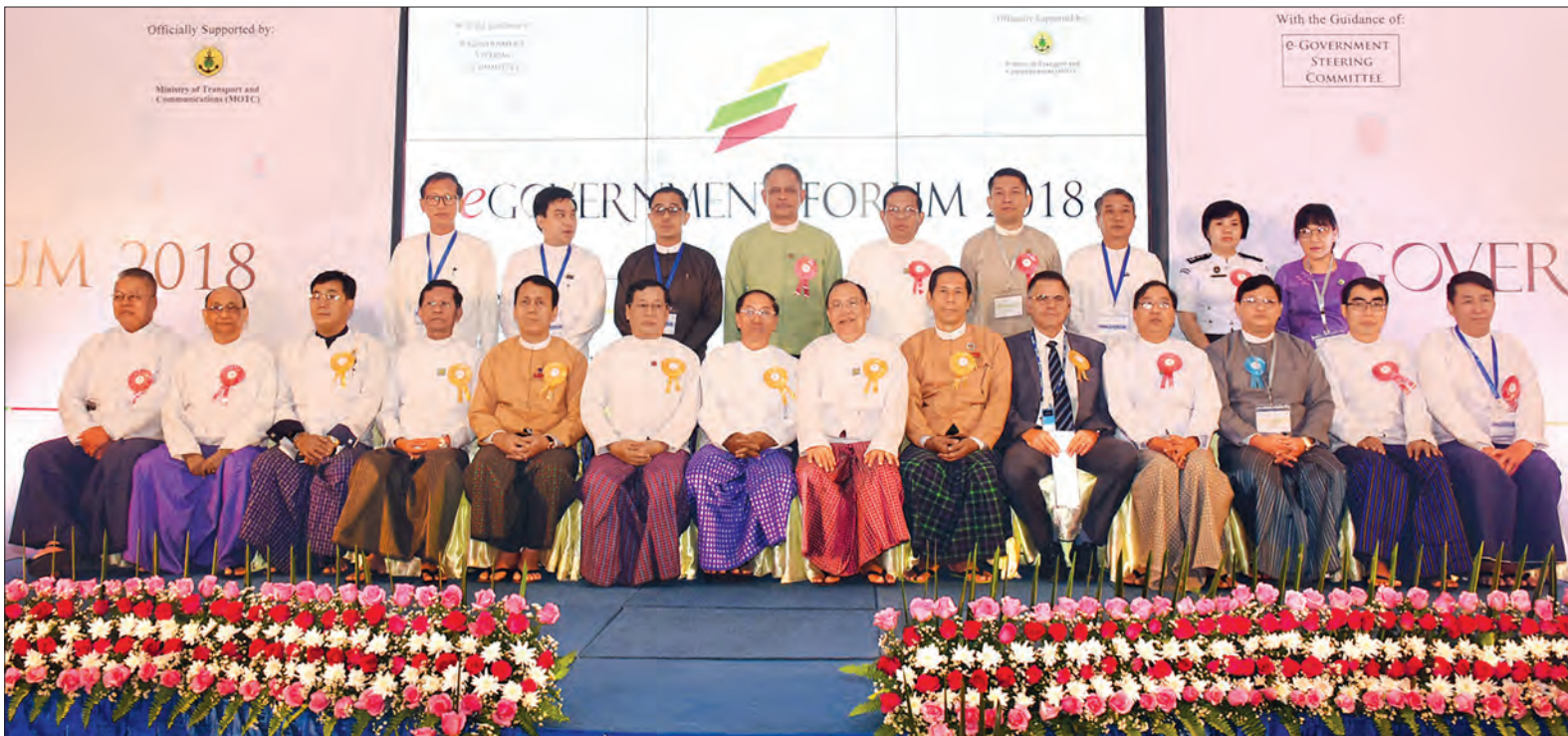
ဒုတိယဥက္ကဋ္ဌ ဦးမြင့်ဆွေ e-Government Forum 2018 ဖွင့်ပွဲအခမ်းအနားသို့ တက်ရောက်လာကြသူများနှင့်အတူ စုပေါင်းမှတ်တမ်းတင်ဓာတ်ပုံရိုက်စဉ်။ သတင်းစဉ်

လုပ်ငန်းတာဝန်(၅)ရပ် ချမှတ် မြန်မာနိုင်ငံတွင် e-Government စနစ်အောင်မြင်စွာ အကောင်အထည်ဖော် ဆောင်ရွက်နိုင်ရန်အတွက် နိုင်ငံတော် သမ္မတရုံး၏ ၂၀၁၆ ခုနှစ်၊ ဇန်နဝါရီလ ၂၃ ရက်စွဲပါ အမိန့်ကြော်ငြာစာအမှတ်၊ ၁၄/၂၀၁၆ နှင့် နိုင်ငံတော်၏ အတိုင်ပင်ခံပုဂ္ဂိုလ်က နာယကအဖြစ် ဦးဆောင်သည့် “e-Government ဦးဆောင်