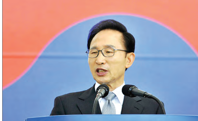
တောင်ကိုရီးယားသမ္မတဟောင်း အိမြောင်ဘတ်