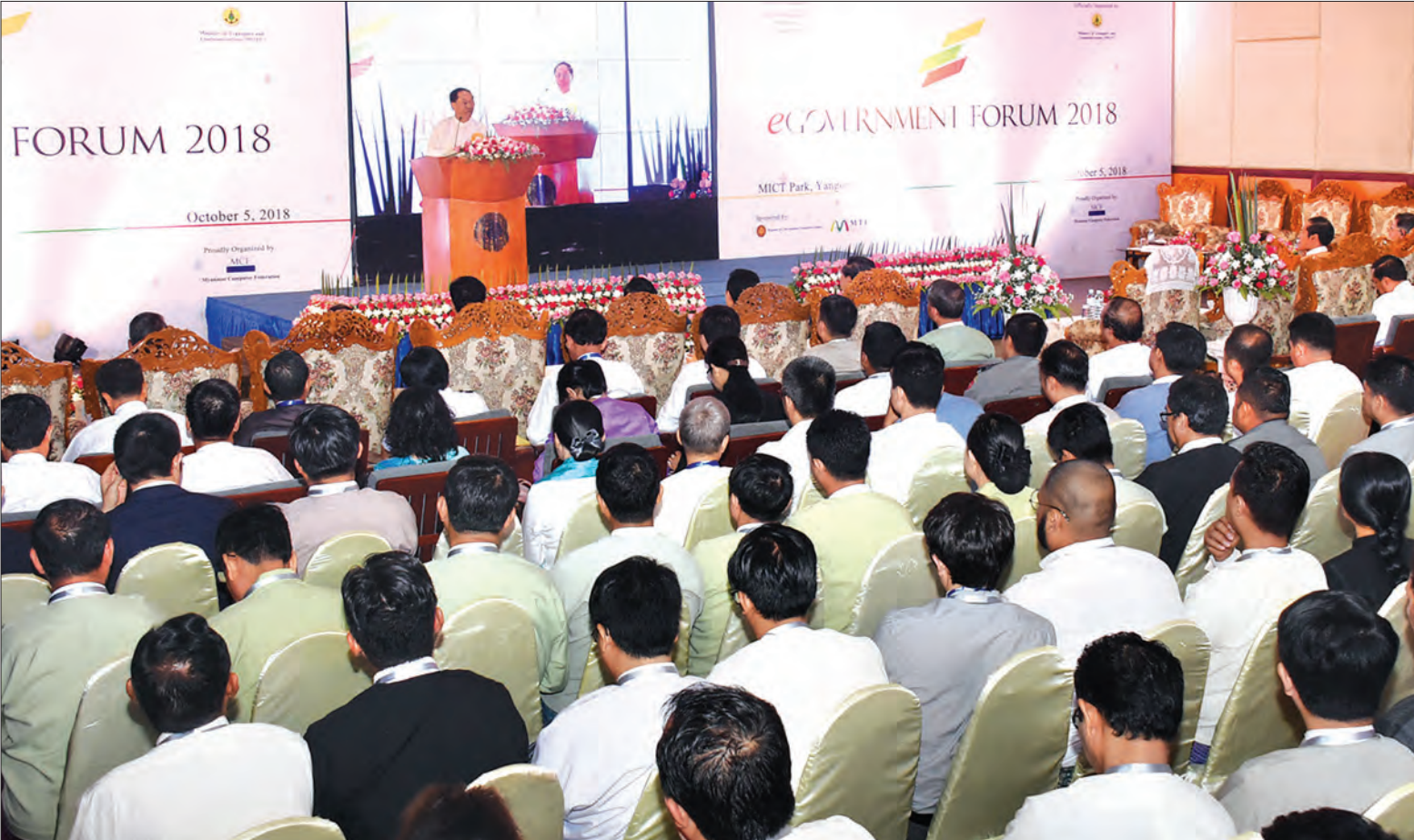
ဒုတိယသမ္မတ ဦးမြင့်ဆွေ e-Government Forum 2018 ဖွင့်ပွဲအခမ်းအနားတွင် အမှာစကားပြောကြားစဉ်။ သတင်းစဉ်

ရန်ကုန် အောက်တိုဘာ ၅ မြန်မာနိုင်ငံကွန်ပျူတာအသင်းချုပ်က ကြီးမှူးကျင်းပသည့် e-Government Forum 2018 ဖွင့်ပွဲအခမ်းအနားကို ယနေ့ နံနက် ၉ နာရီက ရန်ကုန်မြို့၊ လှိုင် တက္ကသိုလ်နယ်မြေရှိ MICT Park တွင် ကျင်းပရာ e-Government ဦးဆောင် ကော်မတီဥက္ကဋ္ဌ ဒုတိယသမ္မတ ဦးမြင့်ဆွေ တက်ရောက်အမှာစကား ပြောကြားသည်။ e-Government Forum 2018 ဖွင့်ပွဲအခမ်းအနားသို့ e-Government ဦးဆောင်ကော်မတီ ဒုတိယဥက္ကဋ္ဌ ပို့ဆောင်ရေးနှင့် ဆက်သွယ်ရေးဝန်ကြီးဌာန ပြည်ထောင်စုဝန်ကြီး ဦးသန့်စင် မောင်၊ အလုပ်သမား၊ လူဝင်မှုကြီးကြပ်ရေးနှင့် ပြည်သူ့အင်အားဝန်ကြီးဌာန ပြည်ထောင်စုဝန်ကြီး ဦးသိန်းဆွေ၊ ရန်ကုန်တိုင်းဒေသကြီး ဝန်ကြီးချုပ် ဦးဖြိုးမင်းသိန်း၊ ပို့ဆောင်ရေးနှင့် ဆက်သွယ်ရေးဝန်ကြီးဌာန ဒုတိယ ဝန်ကြီးဦးသာဦး၊ တိုင်းဒေသကြီး ဝန်ကြီး များ၊ လွှတ်တော်ကိုယ်စားလှယ်များ၊ မြန်မာနိုင်ငံဆိုင်ရာ နိုင်ငံခြားသံရုံး များမှ သံအမတ်ကြီးများနှင့် သံတမန် များ၊ ဌာနဆိုင်ရာ အကြီးအကဲများ၊ e-Government ဦးဆောင်ကော်မတီ စာမျက်နှာ ၄ ကော်လံ ၁ ❄