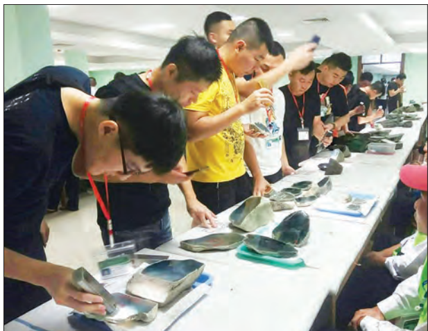
မြန်မာ့ကျောက်မျက်ရတနာပြပွဲ၌ ကျောက်မျက်အတွဲများအား ကုန်သည်များ ကြည့်ရှုလေ့လာစဉ်။

ကျောက်စိမ်းအတွဲအမှတ် ၁ မှ ၁၂၀၀ အထိကို မတ် ၁၅ ရက်တွင် လည်းကောင်း၊ အတွဲအမှတ် ၁၂၀၁ မှ ၂၄၀၀ အထိကို မတ် ၁၆ ရက်တွင်လည်းကောင်း၊ အတွဲအမှတ် ၂၄၀၁ မှ ၃၆၀၀ အထိကို မတ် ၁၇ ရက်တွင်လည်းကောင်း၊ အတွဲအမှတ် ၃၆၀၁ မှ ၄၈၀၀ အထိကို မတ် ၁၈ ရက်တွင်လည်းကောင်း၊ အတွဲ အမှတ် ၄၈၀၁ မှ ၆၀၀၀ အထိကိုမတ် ၁၉ ရက်တွင်လည်းကောင်း၊ အတွဲအမှတ် ၆၀၀၁ မှ ၆၉၇၄ အထိကို မတ် ၂၀ ရက်တွင်လည်းကောင်း၊ ကျောက်မျက်အတွဲ ၅၀၀ ကို မတ် ၁၄ ရက်တွင် လည်းကောင်း၊ ပုလဲအတွဲအတွဲအမှတ် ၁ မှ ၁၈၂ အထိကို မတ် ၂ ရက်တွင်လည်း ကောင်း၊ အတွဲအမှတ် ၁၈၃ မှ ၂၇၄ အထိကို မတ် ၁၃ တွင်လည်းကောင်း အိတ်ဖွင့် တင်ဒါစနစ်ဖြင့် ရောင်းချသွားမည်ဖြစ်သည်။ ကျောက်စိမ်းအရိုင်းအတွဲများအတွက် သတ်မှတ်ထားသည့် အခြေခံဈေးသည် ယူရိုငွေ ၅၀၀၀ နှင့်အထက်၊ ကျောက်စိမ်းအချောထည်များအတွက် သတ်မှတ်ထားသည့် အခြေခံဈေးသည် ယူရိုငွေ ၁၀၀၀ နှင့် အထက်၊ ကျောက်မျက်အတွဲများအတွက် သတ်မှတ်ထားသည့် အခြေခံဈေးသည် ယူရိုငွေ ၅၀၀ နှင့် အထက်၊ ပုလဲအတွဲများ အတွက်သတ်မှတ် ထားသည့် အခြေခံဈေးသည် ယူရိုငွေ ၁၀၀၀ နှင့် အထက်ဖြစ်ကြောင်း သိရသည်။