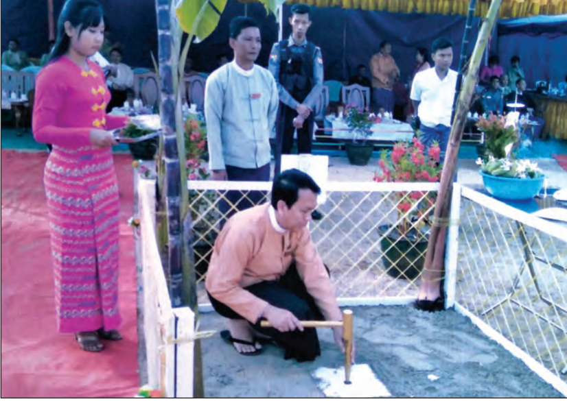
ရန်ကုန်တိုင်းဒေသကြီးဝန်ကြီးချုပ် ဦးမြိုးမင်းသိန်း ပန္နက်တင်ပေးနေစဉ်။

တည်ဆောက်ရန် ပန္နက်တင်အခမ်းအနားကို မတ် ၁၀ ရက်က အင်းစိန်မြို့နယ် ရွာမအရှေ့ရပ်ကွက် မင်းကြီး