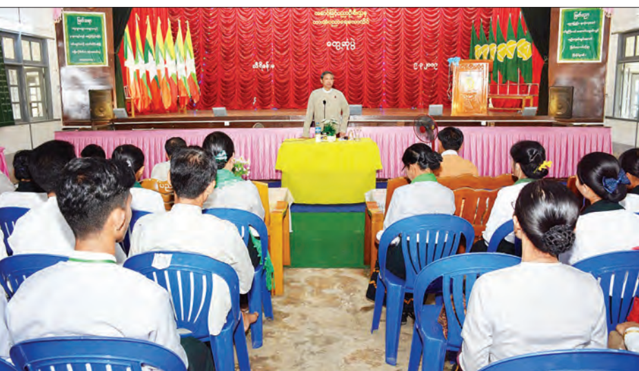
ပြည်ထောင်စုဝန်ကြီး ဒေါက်တာမျိုးသိမ်းကြီး ပညာရေးကောလိပ်(ဘားအံ)မှ ဆရာ ဆရာမများ၊ ကျောင်းသား ကျောင်းသူများ နှင့် တွေ့ဆုံအမှာစကားပြောကြားစဉ်။

ရန်ကုန် မတ် ၁၁ ပညာရေးဝန်ကြီးဌာန ပြည်ထောင်စုဝန်ကြီး ဒေါက်တာ မျိုးသိမ်းကြီးနှင့် ကရင်ပြည်နယ် ဘားအံမြို့၊ ကွန်ပျူတာ တက္ကသိုလ်(ဘားအံ)ရှိ ပါမောက္ခချုပ်၊ ဒုတိယ ပါမောက္ခချုပ်နှင့် ဆရာ ဆရာမများ၊ ကျောင်းသား ကျောင်းသူများနှင့် တွေ့ဆုံပွဲ အခမ်းအနားကို မတ် ၉ ရက် နံနက်ပိုင်းက ကွန်ပျူတာတက္ကသိုလ် (ဘားအံ)ရှိ တွဲနှင်းသဘင်ခန်းမ၌ ကျင်းပသည်။