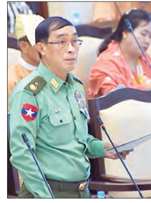
ဒုတိယဝန်ကြီး ဝိုလ်ချုပ် သန်းထွဋ်