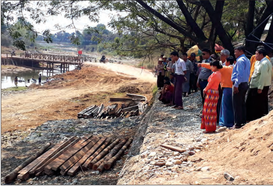
မောင်းကော်တံတား ဆောက်လုပ်ရေးလုပ်ငန်းများကို တိုင်းဒေသကြီးဝန်ကြီးချုပ် ကြည့်ရှုစစ်ဆေးစဉ်

ကသာ မတ် ၁၁ စစ်ကိုင်းတိုင်းဒေသကြီး ဝန်ကြီးချုပ် ဒေါက်တာမြင့်နိုင်သည် တိုင်းဒေသကြီး လွှတ်တော်ဥက္ကဋ္ဌနှင့် လွှတ်တော်ကိုယ်စားလှယ်များ၊ ကသာခရိုင်အုပ်ချုပ်ရေးမှူးနှင့် မြို့နယ်အုပ်ချုပ်ရေးမှူးများနှင့်အတူ ဝန်းသိုမြို့နယ်နှင့် အင်းတော်မြို့နယ်အတွင်းမှ ဒေသဖွံ့ဖြိုးရေးလုပ်ငန်းများကိုမတ် ၁၀ ရက်က ကြည့်ရှုစစ်ဆေးခဲ့သည်။