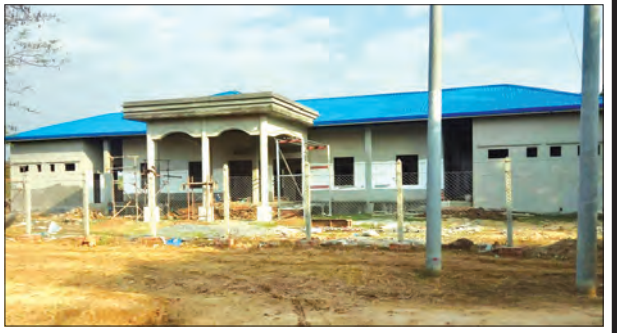
ရွှေသုဝဏ်ကျောင်းတိုက်ဆရာတော် ဆောက်လုပ်လှူဒါန်းသော တိုက်နယ် ဆေးရုံကို တွေ့ရစဉ်။

အောင်ချမ်းသာကျေးရွာရှိ တိုက်နယ်ဆေးရုံကြီးကို ငွေကျပ်သိန်းခြောက်ထောင် ဝန်းကျင်အထိ အကုန်အကျခံ ဆောက်လုပ်လျက်ရှိပြီး ဆရာတော်ကြီး၏ မတည်ငွေနှင့် ပြည်သူတို့၏ ပေးပေးငွေဖြင့် ဆောင်ရွက်ခဲ့ခြင်းဖြစ်ပြီး ၈၀ ရာခိုင်နှုန်း ကျော်ပြီးစီးခဲ့ပြီ ဖြစ်သည်။ ဆေးရုံကို ပေ ၁၂၀ x ၉၀ ပေ အဆောက်အအုံအဖြစ် တည်ဆောက်ထားပြီး ဟောခန်းနှစ်ခန်း၊ ဆရာဝန်နှင့် သူနာပြုများအတွက် အခန်းလေးခန်းအပါအဝင် အခြားအရေးကြီးသောအဆောင်အခန်းများပါကြောင်း သိရသည်။ ဆေးရုံသို့လာသော ပြည်သူများအတွက် သောက်သုံးရေ အဆင်ပြေစေရန် ဂါလန် ၅၀၀၀ ဆုံ ရေစင်နှင့်