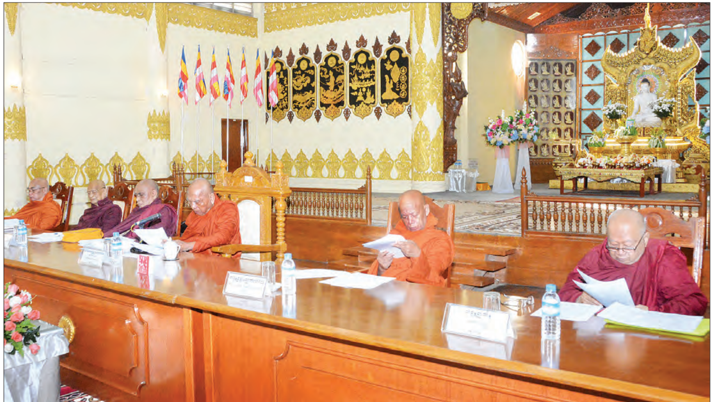
သတ္တမအကြိမ် နိုင်ငံတော်သံဃမဟာ နာယကအဖွဲ့(၄၇) ပါးစုံညီ ကျေနပ်သတိပ အစည်းအဝေး ပထမနေ့ကျင်းပစဉ်။ သတင်းစဉ်