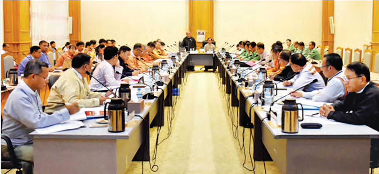
ပြည်ထောင်စုသမ္မတ မြန်မာနိုင်ငံတော် ဖွဲ့စည်းပုံအခြေခံဥပဒေ (၂၀၀၈ ခုနှစ်) ပြင်ဆင်ရေး ပူးပေါင်းကော်မတီအစည်းအဝေး (၄/၂၀၁၉) ကျင်းပစဉ်။ သတင်းစဉ်