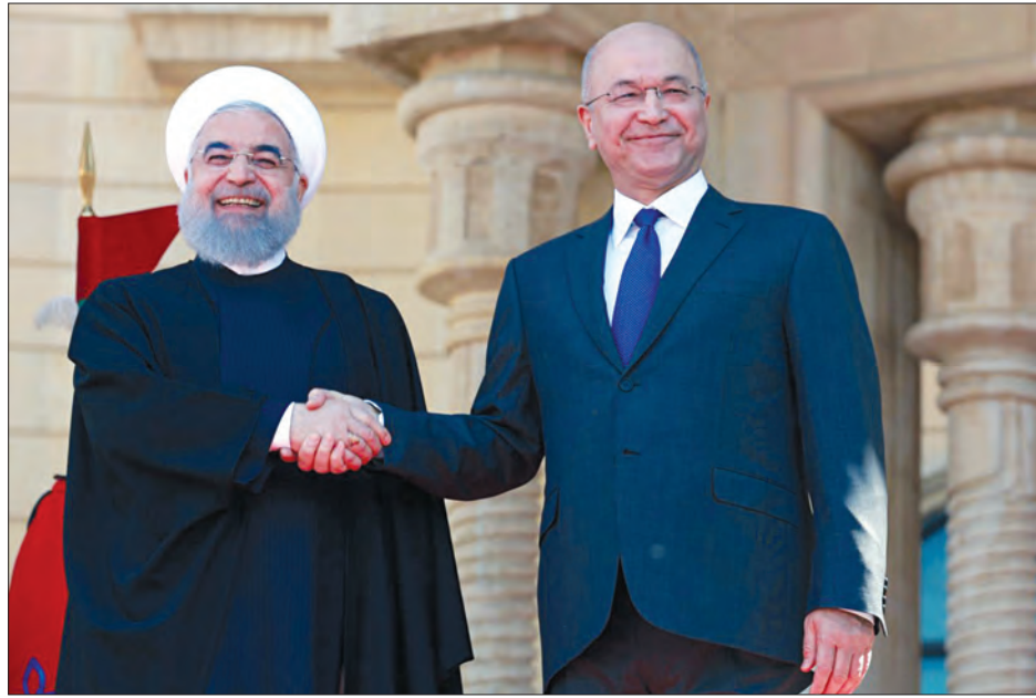
အီရန်သမ္မတ (ဝဲ) နှင့် အီရတ်သမ္မတ (ယာ) တို့ တွေ့ဆုံနှုတ်ဆက်စဉ်။