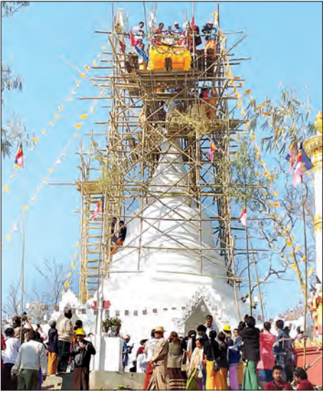
သီပေါ မဂ္ဂင်လမ်းပြ နိဗ္ဗာန်ရတနာတော်ကြီး ထီးတော်တင်မင်္ဂလာအခမ်းအနား ကျင်းပစဉ်။