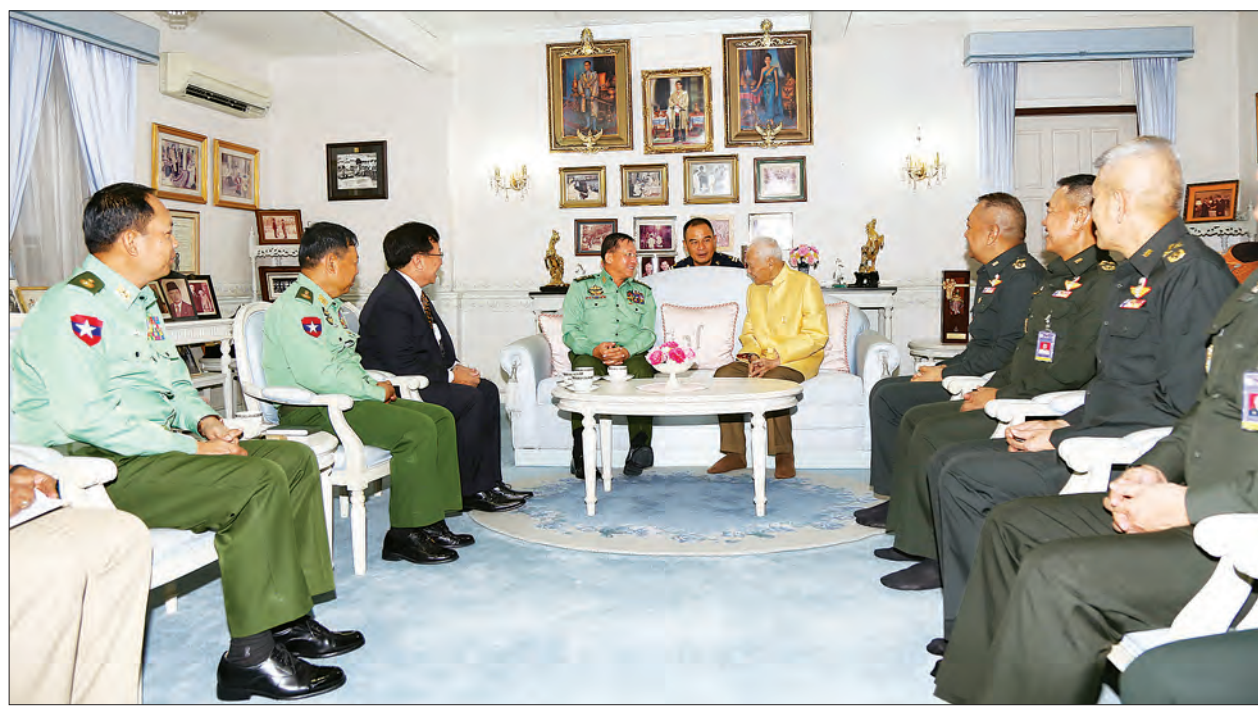
တပ်မတော်ကာကွယ်ရေးဦးစီးချုပ် ဝိုင်းချုပ်မှူးကြီး မင်းအောင်လှိုင်နှင့် ထိုင်းဘုရင့်အတိုင်ပင်ခံကောင်စီဥက္ကဋ္ဌ General Prem Tinsulanonda တို့ တွေ့ဆုံဆွေးနွေးစဉ်။

မွန်းလွဲပိုင်းတွင် နေပြည်တော် အပြည် ပြည်ဆိုင်ရာလေဆိပ်သို့ပြန်လည်ရောက် ရှိရာ ဒုတိယတပ်မတော် ကာကွယ်ရေး ဦးစီးချုပ်၊ ကာကွယ်ရေးဦးစီးချုပ်(ကြည်း) ဒုတိယဝိုင်းချုပ်မှူးကြီး စိုးဝင်း၊ ညှိနှိုင်း ကွပ်ကဲရေးမှူး (ကြည်း၊ ရေ၊ လေ) ဝိုင်းချုပ်ကြီး မြထွန်းဦး၊ ကာကွယ်ရေး ဦးစီးချုပ်(ရေ) ဝိုင်းချုပ်ကြီး တင်အောင် စန်း၊ ကာကွယ်ရေးဦးစီးချုပ် (လေ) ဝိုင်းချုပ်ကြီး မောင်မောင်ကျော်၊ ကာကွယ်ရေးဦးစီးချုပ်ရုံးမှ တပ်မတော် အရာရှိကြီးများနှင့် နေပြည်တော်တိုင်း စစ်ဌာနချုပ် တိုင်းမှူးတို့က လေဆိပ်တွင် ကြိုဆိုနှုတ်ဆက်ကြကြောင်း တပ်မတော် ကာကွယ်ရေးဦးစီးချုပ်ရုံး၏ ထုတ်ပြန် ချက်အရ သိရသည်။ သတင်းစဉ်