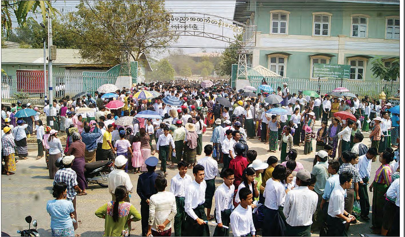
မကွေးတိုင်းဒေသကြီး ရေနံချောင်းမြို့အမှတ် (၁) အခြေခံပညာအထက်တန်းကျောင်း၌ တက္ကသိုလ်ဝင်စာမေးပွဲ ဓာတုပေးဘာသာရပ် ဖြေဆိုပြီးနောက် ကျောင်းသား ကျောင်းသူများနှင့် လာရောက်ကြိုဆိုကြသည့် မိဘပြည်သူများကို တွေ့ရစဉ်။

၂၀၁၈-၂၀၁၉ ပညာသင်နှစ် တက္ကသိုလ်ဝင်စာမေးပွဲကို မတ် ၆ ရက်က စတင်ဖြေဆိုခဲ့ရာ ယနေ့ (မတ် ၁၁ရက်) ပဉ္စမနေ့တွင် ဓာတုပေးဘာသာရပ်ကို ဖြေဆိုကြသည်။ မြန်မာနိုင်ငံတစ်နိုင်ငံလုံးရှိ တိုင်းဒေသကြီး၊ ပြည်နယ်များနှင့် နိုင်ငံခြားစာစစ်ဌာနများတွင် ဓာတုပေးဖြေဆိုရန် စာရင်းရှိ ကျောင်းသား ကျောင်းသူ စုစုပေါင်း ၇၆၃၆၄၃ ဦးတွင် ဖြေဆိုသူ ကျောင်းသား ကျောင်းသူ စုစုပေါင်း ၇၂၅၇၀၁ ဦး ဖြေဆိုကြပြီး ဖြေဆိုရန် ပျက်ကွက်သူ ၃၇၉၄၂ ဦးဖြစ်၍ ဖြေဆိုမှု ရာခိုင်နှုန်း ၉၅ ဒသမ ၀၃ ရာခိုင်နှုန်း ဖြစ်ကြောင်း သိရသည်။