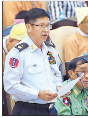
ဒုတိယဝန်ကြီး ဝိုလ်ချုပ် မြင့်နွယ်

မွန်ပြည်နယ် မဲဆန္ဒနယ်အမှတ်(၁) မှ ဦးအေးမင်းဟန်၏ မွန်ပြည်နယ်နှင့် ကရင်ပြည်နယ်တို့ရှိ ကျေးရွာပေါင်း ၁၃ ရွာကို ဆက်သွယ်ထားသော ဦးနုအောက်လမ်း (ကတိုး၊ ကော့နပ်၊ ဇာသပြင်) ၏ ပျက်စီးနေသောလမ်းပိုင်း သုံးမိုင် နှစ်ဖာလုံအား ၂၀၁၉-၂၀၂၀ ဘဏ္ဍာရေးနှစ်တွင် ၁၄ ပေ အကျယ် ကတ္တရာလမ်းအသစ်ခင်းပေးရန် အစီအစဉ် ရှိ မရှိ မေးခွန်းနှင့်စပ်လျဉ်း၍ ဒုတိယဝန်ကြီး ဝိုလ်ချုပ် သန်းထွဋ်က မွန်ပြည်နယ်အစိုးရအဖွဲ့အနေဖြင့် လွှတ်တော်ကိုယ်စားလှယ်မေးမြန်းသည့် မွန်ပြည်နယ်