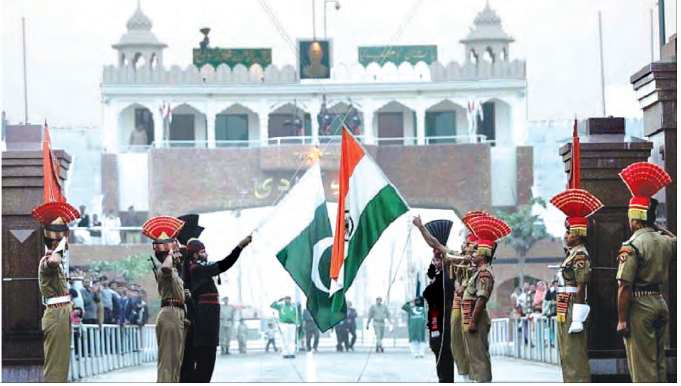
အိန္ဒိယ - ပါကစ္စတန်နိုင်ငံ နယ်စပ်ဂိတ်တွင် အလံတင်အခမ်းအနား ပြုလုပ်နေစဉ်။

အကျိုးလက်နက်ပိုင်ဆိုင်ထားကြတဲ့ အိန္ဒိယနိုင်ငံနဲ့ ပါကစ္စတန်နိုင်ငံအကြား အငြင်းပွားမှုတွေ ပိုမိုပြင်းထန်လာ ခဲ့ရင် ဒေသခွဲထဲမှာရှိနေတဲ့ နိုင်ငံတွေသာမက အင်အားကြီး