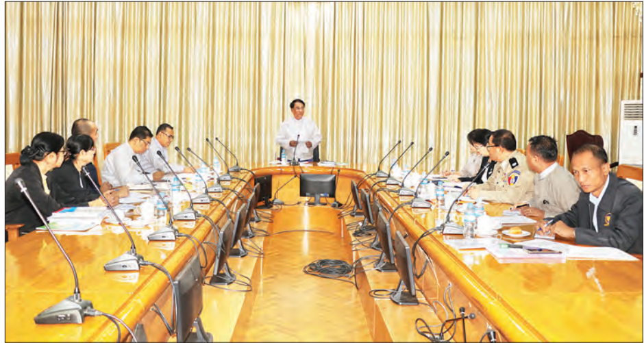
ပြည်ထောင်စုဝန်ကြီး ဒေါက်တာသန်းမြင့် မြန်မာနိုင်ငံယှဉ်ပြိုင်မှုကော်မရှင် ဒုတိယအကြိမ်ပုံမှန်အစည်းအဝေး၌ အမှာစကား ပြောကြားစဉ်။

နေပြည်တော် မတ် ၁၁ မြန်မာနိုင်ငံယှဉ်ပြိုင်မှုကော်မရှင် ဒုတိယအကြိမ်မြောက် ပုံမှန်အစည်းအဝေးကို ယနေ့နံနက် ၁၀ နာရီခွဲတွင် နေပြည်တော် ရှိ စီးပွားရေးနှင့် ကူးသန်းရောင်းဝယ်ရေးဝန်ကြီးဌာန အစည်းအဝေးခန်းမ၌ ကျင်းပသည်။ အစည်းအဝေးတွင် မြန်မာနိုင်ငံယှဉ်ပြိုင်မှုကော်မရှင်ဥက္ကဋ္ဌ ပြည်ထောင်စုဝန်ကြီး ဒေါက်တာသန်းမြင့် က ယှဉ်ပြိုင်မှုကော်မရှင်၏ အဓိကရည်ရွယ်ချက်ဖြစ်သော စီးပွားရေးလုပ်ငန်းများအကြား လွတ်လပ်ပြီးတရားမျှတသော ယှဉ်ပြိုင်မှုဝန်းကျင်ကောင်း တည်ထောင်ရေးအတွက် ယှဉ်ပြိုင်မှုဆိုင်ရာ အသိပညာပေးရန်၊ ဥပဒေချိုးဖောက်မှုများကို အရေးယူဆောင်ရွက်ရန် တို့သည် အရေးကြီးသည့် တာဝန်များဖြစ်ကြောင်း၊ ကော်မရှင်အသစ်တစ်ခုအနေဖြင့် ပြည်သူများနှင့် ဆက်စပ်အဖွဲ့အစည်းများ