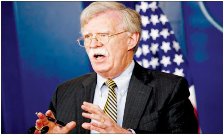
အမေရိကန်အမျိုးသားလိုခြံရေးအကြံပေး ဝန်ထောက်ချုပ်ကြီး