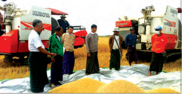
ရိတ်သိမ်းခြွေလှေ့စက်ကြီးများဖြင့် ဂျုံနှင့် ကုလားပဲရိတ်သိမ်းမှု သရုပ်ပြနေစဉ်။

စိုက်ပျိုးရေးဦးစီးဌာန ကော်မတီ-ရာသီသီးနှံဌာနခွဲက ဆောင်းသီးနှံဖြစ်သော ဂျုံ၊ ကုလား ပဲနှင့် စပ်မျိုးနေကြားများ၏ မျိုးကောင်းမျိုးသန့်များ ထုတ်လုပ်ခြင်း၊ သုတေသနစမ်း