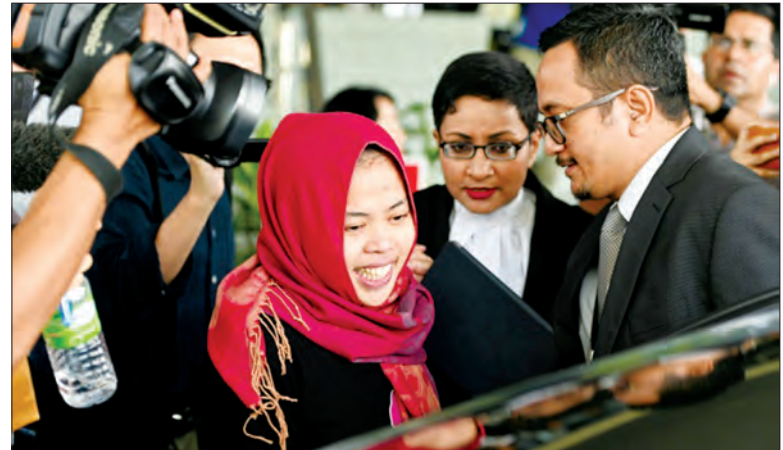
မလေးရှား တရားရုံးက ပြန်လွှတ်ပေးလိုက်သည့် အင်ဒိုနီးရှား အမျိုးသမီးကို တွေ့ရစဉ်။