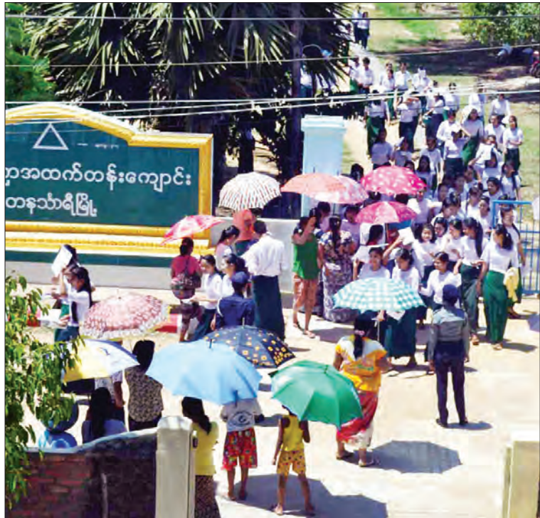
တနင်္သာတိုင်းဒေသကြီး တနင်္သာရီမြို့ အခြေခံပညာ အထက်တန်းကျောင်း၌ တက္ကသိုလ်ဝင်စာမေးပွဲ ဓာတုပေး ဘာသာရပ်ဖြေဆိုကြသည့် ကျောင်းသား ကျောင်းသူ များနှင့် ကြိုဆိုနေကြသည့် မိဘပြည်သူများကို တွေ့ရ စဉ်။ နန်းသာရီ - ထိန်ဝင်း