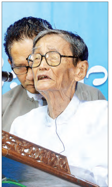
စည်သူပိုလ်ကလေးတင့်အောင်

အကယ်ဒမီ ဒါရိုက်တာ စင်ရော်မောင်မောင်က “၁၉၆၄