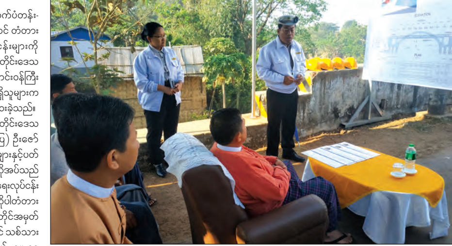
တံတားဆောက်လုပ်ရေး လုပ်ငန်းများနှင့်ပတ်သက်၍ တိုင်းဒေသကြီးဝန်ကြီးချုပ်အား ရှင်းလင်းတင်ပြစဉ်။

လက်ပံတန်း မတ် ၁၁ ပဲခူးတိုင်းဒေသကြီး လက်ပံတန်းမြို့နယ် လက်ပံတန်း-ကျွန်းကလေးလမ်းပေါ်ရှိ လက်ပံတန်းမြို့အဝင် တံတားအမှတ် (၃/၈၉) တည်ဆောက်ခြင်းလုပ်ငန်းများကို ပဲခူးတိုင်းဒေသကြီးဝန်ကြီးချုပ် ဦးဝင်းသိန်း၊ တိုင်းဒေသကြီး စိုက်ပျိုးရေး၊ မွေးမြူရေးနှင့် ဆည်မြောင်းဝန်ကြီး ဦးအောင်ဇော်နိုင်နှင့် ဌာနဆိုင်ရာ တာဝန်ရှိသူများက မတ် ၁၀ ရက်က သွားရောက်ကြည့်ရှုစစ်ဆေးခဲ့သည်။