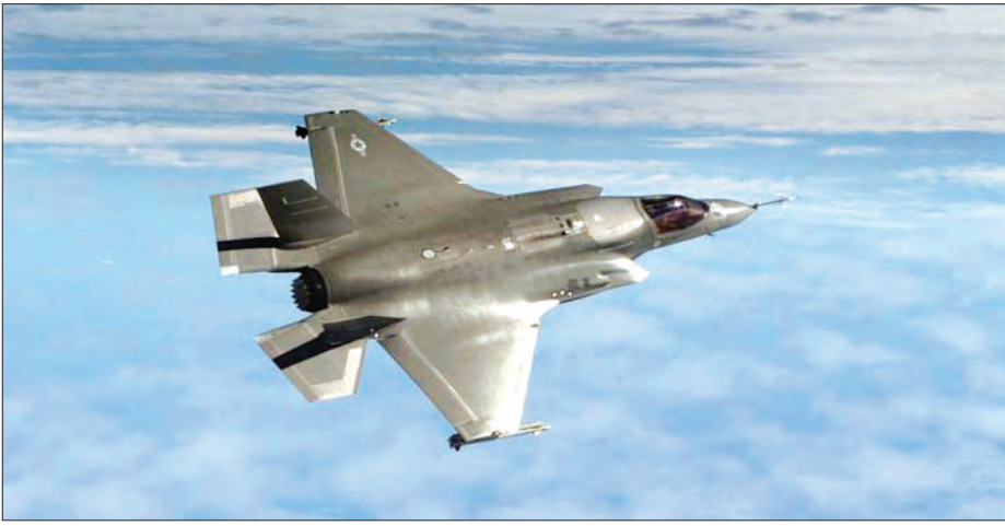
အမေရိကန်နိုင်ငံ၏ F-35B အမျိုးအစား အဆင့်မြင့် တိုက်ခိုက်ရေးလေယာဉ်။