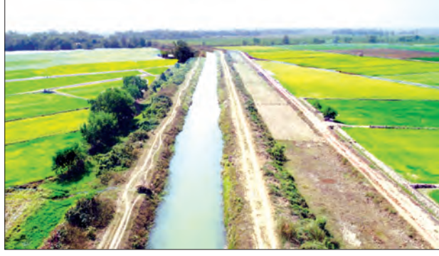
တဘူးလှရေလှောင်တံမံ ဆည်ရေဖြင့် နွေစပါးများစိုက်ပျိုးထားမှုကိုတွေ့ရစဉ်။

တဘူးလှရေလှောင်တံမံကို တိုက်ကြီးမြို့နယ် ဥက္ကဋ္ဌချောင်းပေါ်တွင် ၁၉၉၃-၁၉၉၄ ခုနှစ်က စတင်တည်ဆောက်ခဲ့ပြီး ၁၉၉၅ ခုနှစ်က တည်ဆောက်ပြီးစီးခဲ့ကြောင်း၊ ရေလှောင်တံမံ၏ ရေပေးဝေနိုင်သော စိစစ်ဧကမှာ ၃၀၄၄၄ ဖြစ်ပြီး တိုက်ကြီးနှင့် မှော်ဘီမြို့နယ်တို့မှ စပါးစိုက်ခင်းများအတွက် ရေပေးဝေလျက်ရှိကြောင်း တိုက်ကြီး မြို့နယ် ဆည်မြောင်းနှင့် ရေအသုံးချမှု စီမံခန့်ခွဲရေးဦးစီး ဌာနမှ သိရသည်။ မောင်မွှေး၊ ဓာတ်ပုံ - ဆည်မြောင်း