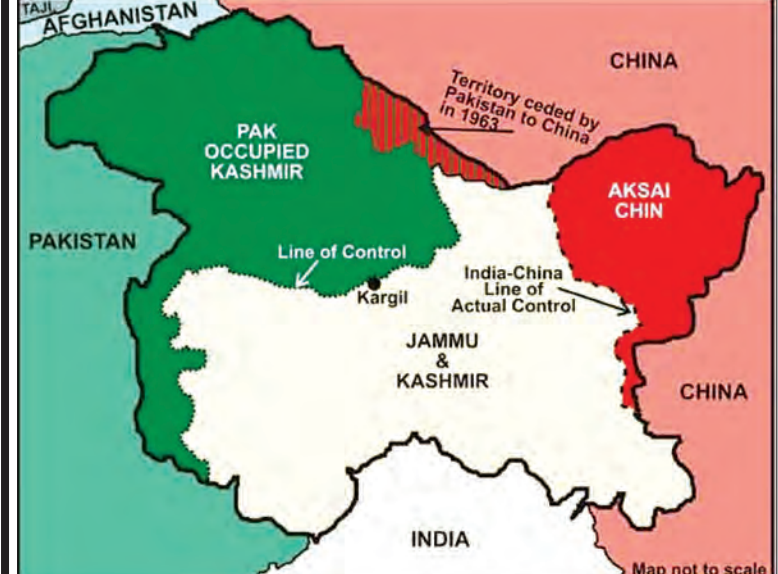
အိန္ဒိယ- ပါကစ္စတန်- တရုတ် နယ်နိမိတ် အခြေပြ မြေပုံ။