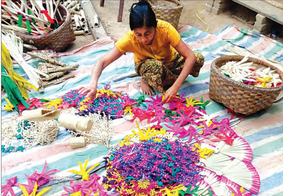
ညောင်ဝန်းကျေးရွာလုပ် ထန်းရွက်ပုတီးများကို တွေ့ရစဉ်။