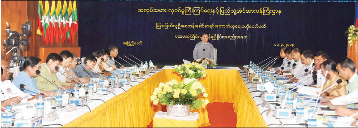
ပြည်ထောင်စုဝန်ကြီး ဦးသန်းဆွေ ကြားဖြတ်လူဦးရေသန်းခေါင်စာရင်းကောက်ယူရေး ဗဟိုကော်မတီ ပထမအကြိမ် လုပ်ငန်းညှိနှိုင်းအစည်းအဝေးတွင် အမှာစကားပြောကြားစဉ်။

ရှေးဦးစွာ ကြားဖြတ်လူဦးရေ သန်းခေါင်စာရင်းကောက်ယူရေး ဗဟို ကော်မတီဥက္ကဋ္ဌ ပြည်ထောင်စုဝန်ကြီး ဦးသန်းဆွေက ကြားဖြတ်လူဦးရေ သန်းခေါင်စာရင်းကို ၂၀၁၉ ခုနှစ်၊ နိုဝင်ဘာလတွင် ရက်ပေါင်း ၁၄ ရက်ခန့် ကောက်ယူမည်ဖြစ်ပြီး ခရိုင်အဆင့် ကိုယ်စားပြုသော အညွှန်းကိန်းများ ရရှိနိုင်ရေးအတွက် တစ်နိုင်လုံး အတိုင်းအတာဖြင့် နမူနာကောက်ကွက် ပေါင်း ၄၃၀၀ ခန့်ကို ရွေးချယ်ကောက် ယူသွားမည်ဖြစ်ကြောင်း၊ ကောက်ယူရရှိ လာသည့် အချက်အလက်များကို ၂၀၂၀ ခုနှစ်၊ ဇွန်လတွင် အတည်ပြုထုတ်ပြန် နိုင်ရန် လျာထားပါကြောင်း၊ ယင်းလုပ်ငန်း ကို အကောင်အထည်ဖော်ဆောင်ရွက် ရာတွင် ကြိုတင်ပြင်ဆင်ခြင်း၊ စာရင်း