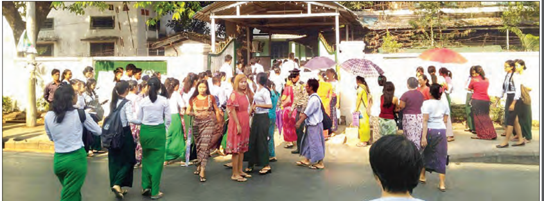
ရန်ကုန်မြို့ တာမွေမြို့နယ်၌ တက္ကသိုလ်ဝင်စာမေးပွဲ ဓာတုပေး ဘာသာရပ်ဖြေဆိုကြသည့် ကျောင်း သားကျောင်းသူများနှင့် မိဘပြည်သူ များကို တွေ့ရစဉ်။