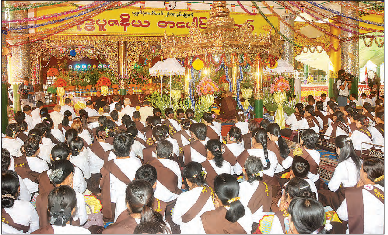
ရွှေတိဂုံစေတီတော် (၂၆၀၇) နှစ်မြောက် ဗုဒ္ဓပူဇော်ယ တပေါင်းပွဲတော် ဖွင့်ပွဲအခမ်းအနားတွင် ကျိုက်ပိကျောင်း ပဓာနနာယကဆရာတော် ဘဒ္ဒန္တဂုဏေသနထံမှ ဧည့်ပရိသတ်များက ကိုးပါးသီလ ခံယူဆောက်တည်ကြစဉ်။ သတင်းစဉ်

ယင်းနောက် အခမ်းအနားသို့ ကြွရောက်လာကြသည့် ဆရာတော် သံဃာတော်များအား ရွှေတိဂုံစေတီတော်ဂေါပကအဖွဲ့က လှူဖွယ်ဝတ္ထုပစ္စည်းများ ဆက်ကပ်လှူဒါန်းပြီး မဟာပဋ္ဌာန်းပစ္စယနိဒ္ဒေသဒေသနာတော်များကို ရွှေတိဂုံစေတီတော် ဘဏ္ဍာတော်ထိန်းဂေါပကအဖွဲ့၏ ဩဝါဒါစရိယဆရာတော်ကြီးများ၊ မဏ္ဍပ်အတွင်းရှိ ဧည့်ပရိသတ်များ၊ အာရုံခံမုခ်ဦးလေးခုတွင် နေရာယူထားကြသော ဧည့်ပရိသတ်များက ရွတ်ဖတ်ပူဇော်ကြသည်။