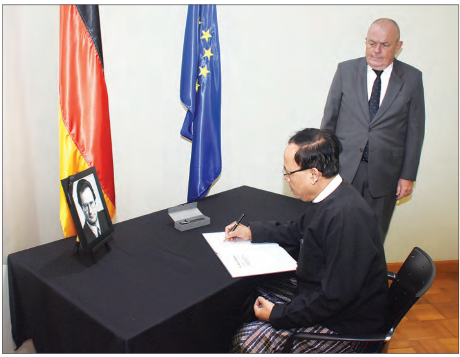
ပြည်ထောင်စုဝန်ကြီး ဦးကျော်တင် ဂျာမနီနိုင်ငံ၏ နိုင်ငံခြားရေးဝန်ကြီးဟောင်း ကွယ်လွန်ခြင်းအတွက် ဝမ်းနည်းခြင်းအထိမ်းအမှတ်လက်မှတ်ရေးထိုးစဉ်။

တိုးမြှင့်လာချိန်တွင် တရုတ်ဘာသာ သားတစ်ဦးအား သင်တန်းဆင်းလက်မှတ် များ ပေးအပ်သည်။ ယင်းနောက် ဒုတိယဝန်ကြီးက တရုတ်ဘာသာ သင်တန်းကျောင်း ကျောင်းအုပ်ဆရာမနှင့် သင်တန်း နည်းပြဆရာမတို့အား အမှတ်တရ လက်ဆောင်ပေးအပ်ပြီး သင်တန်း သားတစ်ဦးက ကျေးဇူးတင်စကား ပြောကြားသည်။ အဆိုပါသင်တန်းကို သင်တန်းသား၊ သင်တန်းသူ ၅၅ ဦးတက်ရောက်ကြပြီး သင်တန်းကာလမှာ ခြောက်လ ကြာမြင့် သည်။ သတင်းစဉ်