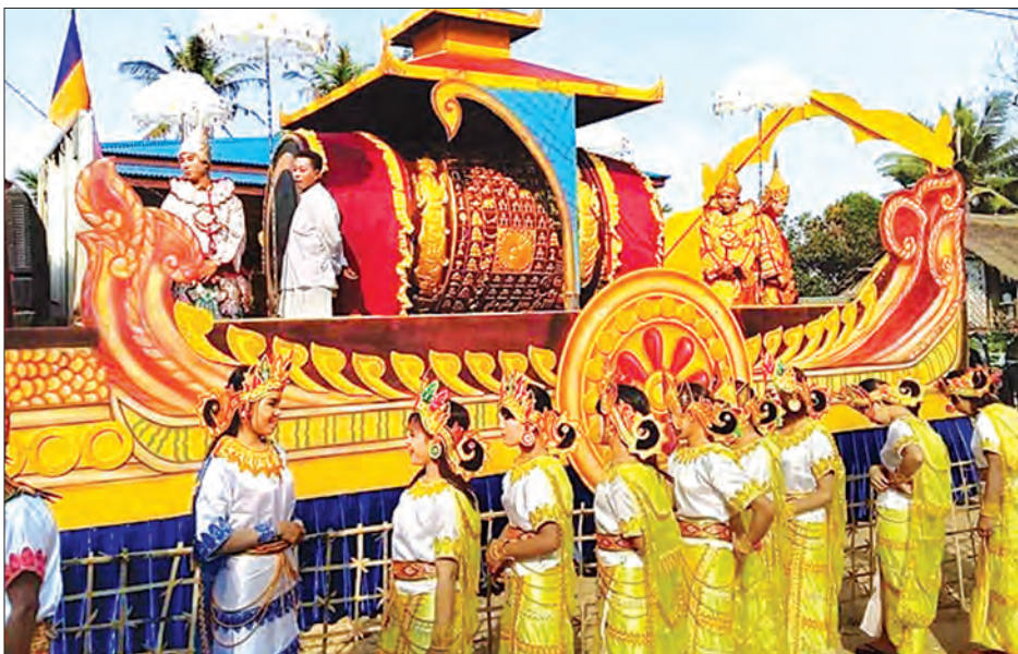
စည်တော်ကြီးကို အင်းတော်မြို့ အေးမြသာယာပြည်သူ့အားကစားကွင်းသို့ သယ်ဆောင်လာစဉ်။

မတ် ၁၇ ရက် နံနက်မှစတင်၍ အင်းတော်မြို့မှ ကောလင်းမြို့သို့ သယ်ဆောင်မည်ဖြစ်ကာ ကောလင်းမြို့ရှိ အားကစားကွင်းအတွင်း ညအိပ်ရပ်နားပြီး တရားပွဲကျင်းပသွားမည်ဖြစ်ကြောင်း မတ် ၁၈ ရက်တွင် ကောလင်းမြို့မှ ရွှေဘိုမြို့သို့