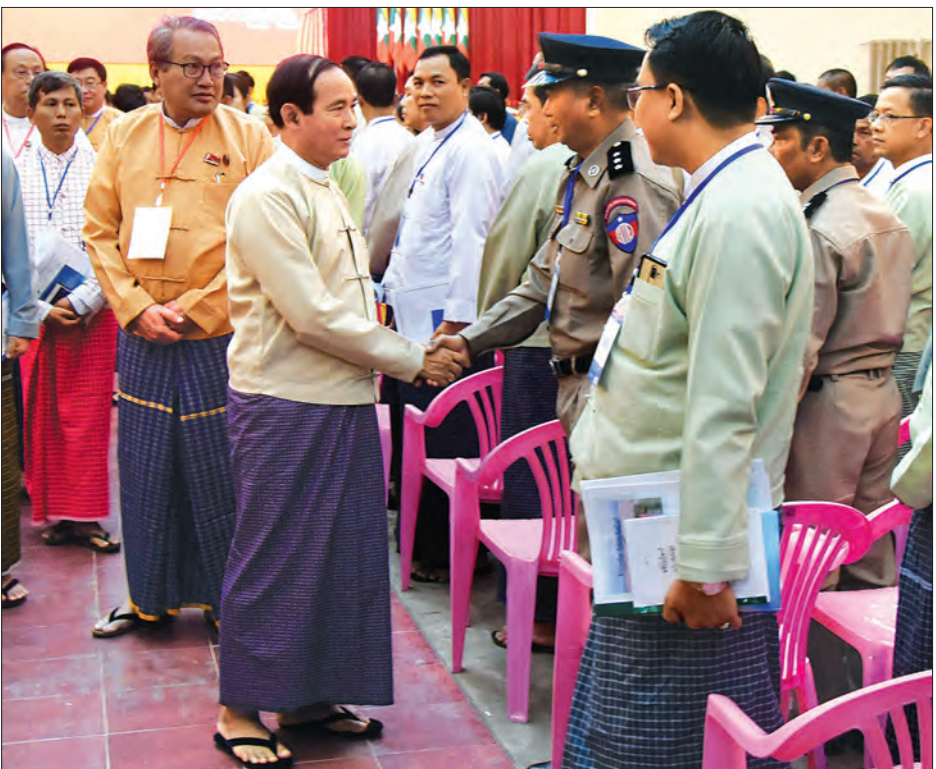
နိုင်ငံတော်သမ္မတ ဦးဝင်းမြင့် မွန်ပြည်နယ်အတွင်းရှိ အုပ်ချုပ်ရေး၊ ဥပဒေပြုရေးနှင့် တရားစီရင်ရေးမဏ္ဍိုင်တို့မှ တာဝန်ရှိသူများနှင့် တွေ့ဆုံပွဲတွင် တက်ရောက်လာကြသူများအား ရင်းရင်းနှီးနှီး လိုက်လံနှုတ်ဆက်စဉ်။

ယခုကဲ့သို့ နေထူးနေ့မြတ်အခမ်းအနားသို့ ဂုဏ်ပြုသဝဏ်လွှာ ပေးပို့ခွင့်ရသည့်အတွက် အထူးပင်ဂုဏ်ယူဝမ်းမြောက်မိ ပါကြောင်းနှင့် ရခိုင်ပြည်နယ်အတွင်း မှီတင်းနေထိုင်ကြသည့် ရခိုင်တိုင်းရင်းသားများနှင့်တကွ ပြည်ထောင်စုတစ်ဝန်းလုံး တွင်ရှိကြသည့် တိုင်းရင်းသားမိဘပြည်သူ ညီအစ်ကိုမောင်နှမများအားလုံး ကောင်းကျိုးချမ်းသာ မင်္ဂလာအဖြာဖြာနှင့် ပြည့်စုံကြပါစေကြောင်း ဆုမွန်ကောင်းတောင်းလျက် နှုတ်ခွန်းဆက်သအပ်ပါသည်။ ၁၉၇၄ ခုနှစ်၊ ဇွဲစည်းပုံအခြေခံဥပဒေအရ ရခိုင်ပြည်နယ်အဖြစ် ပြဋ္ဌာန်းပြီးနောက် ဇွဲစည်းပုံအခြေခံဥပဒေအတည်ပြုရေး အတွက် ဆန္ဒခံယူပွဲစတင်ကျင်းပသည့် ဒီဇင်ဘာလ ၁၅ ရက်နေ့ကို ရခိုင်ပြည်နယ်နေ့အဖြစ် သတ်မှတ်ခဲ့ပြီး ၁၉၇၅ ခုနှစ်မှ စ၍ ပြည်နယ်နေ့အခမ်းအနားကို နှစ်စဉ်ကျင်းပခဲ့သည်မှာ ယနေ့ဆိုလျှင် (၄၄)ကြိမ်မြောက် တိုင်ခဲ့ပြီဖြစ်ပါသည်။ ရခိုင်ပြည်နယ်သည် ရှည်လျားလှပသည့် ပင်လယ်ကမ်းရိုးတန်းဒေသနှင့် မြေဆီလွှာကောင်းမွန်ပြီး ကျယ်ပြောလှသည့် စာမျက်နှာ ၂ ကော်လံ ၃ ❀