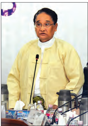
ပြည်ထောင်စုဝန်ကြီး ဒေါက်တာ သန်းမြင့် ရှင်းလင်းပြောကြားစဉ်။

ပြည်ထောင်စုသမ္မတ မြန်မာနိုင်ငံ ကုန်သည်များနှင့် စက်မှုလက်မှုလုပ်ငန်း ရှင်များအသင်းချုပ်ဥက္ကဋ္ဌ ဒုတိယဥက္ကဋ္ဌ များနှင့် အဖွဲ့ဝင်များ၊ မြန်မာနိုင်ငံ အလှူကုန်အသင်း၊ မြန်မာနိုင်ငံ သစ်သီး ဝလံ၊ ပန်းမန်နှင့် ဟင်းသီးဟင်းရွက် စိုက်ပျိုးထုတ်လုပ် တင်ပို့ရောင်းချသူများ အသင်း၊ Myanmar Business Initiatives မှ ဟိုတယ်နှင့် ခရီးလုပ်ငန်း အဖွဲ့နှင့် ကုန်သွယ်မှုနှင့် ရင်းနှီးမြှုပ်နှံမှု လုပ်ငန်းအဖွဲ့တို့မှ တာဝန်ရှိသူများ တက်ရောက်ကြ သည်။