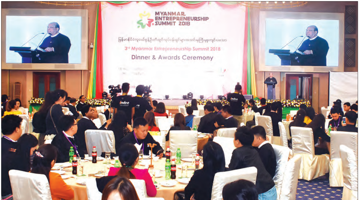
ပြည်ထောင်စုဝန်ကြီး ဦးသောင်းထွန်း တတိယအကြိမ်မြောက် မြန်မာနိုင်ငံ စွန့်ဦးတီထွင်လုပ်ငန်းရှင်များညီလာခံ ဂုဏ်ပြုညစာစားပွဲနှင့် ဆုပေးပွဲအခမ်းအနားတွင် ဂုဏ်ပြုအမှာစကားပြောကြားစဉ်။

အနာဂတ်ခေါင်းဆောင်များဖြစ် ယနေ့ လူငယ်လုပ်ငန်းရှင်များသည် မြန်မာနိုင်ငံ စီးပွားရေးလောက၏