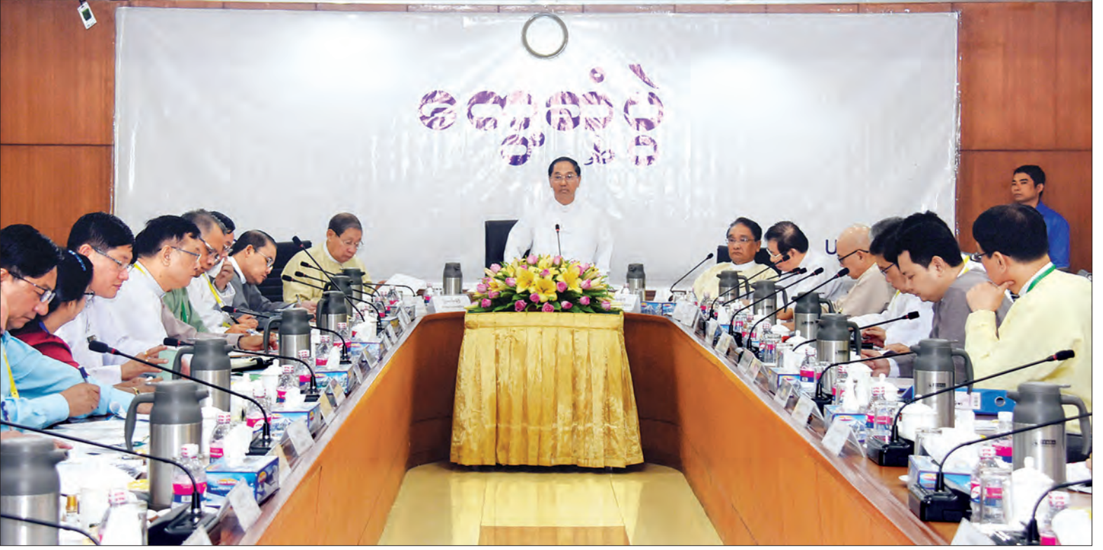
ဒုတိယသမ္မတ ဦးမြင့်ဆွေ ပုဂ္ဂလိက ကဏ္ဍ ဖွံ့ဖြိုးတိုးတက်ရေးကော်မတီနှင့် မြန်မာ့စီးပွားရေးလုပ်ငန်းရှင်များ (၂၂)ကြိမ်မြောက် ပုံမှန်တွေ့ဆုံဆွေးနွေးပွဲအခမ်းအနားတွင် အမှာစကားပြောကြားစဉ်။ သတင်းစဉ်

ရန်ကုန် ဒီဇင်ဘာ ၁၄ ပုဂ္ဂလိကကဏ္ဍ ဖွံ့ဖြိုးတိုးတက်ရေး ကော်မတီနှင့် မြန်မာ့စီးပွားရေးလုပ်ငန်းရှင်များ (၂၂)ကြိမ်မြောက် ပုံမှန်တွေ့ဆုံဆွေးနွေးပွဲ အခမ်းအနားကို ယနေ့ နံနက် ၉ နာရီတွင် ရန်ကုန်မြို့၊ လမ်းမတော်မြို့နယ် မင်းရဲကျော်စွာလမ်းရှိ ပြည်ထောင်စုသမ္မတမြန်မာနိုင်ငံ ကုန်သည်များနှင့် စက်မှုလက်မှုလုပ်ငန်းရှင်များ အသင်းချုပ် အစည်းအဝေးခန်းမ၌ ကျင်းပရာ ပုဂ္ဂလိကကဏ္ဍ ဖွံ့ဖြိုးတိုးတက်ရေး ကော်မတီဥက္ကဋ္ဌ ဒုတိယသမ္မတ ဦးမြင့်ဆွေ တက်ရောက် အမှာစကားပြောကြားသည်။ တွေ့ဆုံဆွေးနွေးပွဲသို့ ပုဂ္ဂလိကကဏ္ဍ ဖွံ့ဖြိုးတိုးတက်ရေးကော်မတီ ဒုတိယဥက္ကဋ္ဌ စီးပွားရေးနှင့် ကူးသန်းရောင်းဝယ်ရေးဝန်ကြီးဌာန ပြည်ထောင်စုဝန်ကြီး ဒေါက်တာသန်းမြင့်၊ စီမံကိန်းနှင့် ဘဏ္ဍာရေးဝန်ကြီးဌာန ပြည်ထောင်စုဝန်ကြီး ဦးစိုးဝင်း၊ ရန်ကုန်တိုင်းဒေသကြီး စိုက်ပျိုးရေး၊ မွေးမြူရေး၊ သစ်တောနှင့် စွမ်းအင်ဝန်ကြီး ဦးဟံထွန်း၊ အခြေတမ်းအတွင်းဝန်များ၊ ညွှန်ကြားရေးမှူးချုပ်များ၊ စာမျက်နှာ ၉ ကော်လံ ၁ ❖