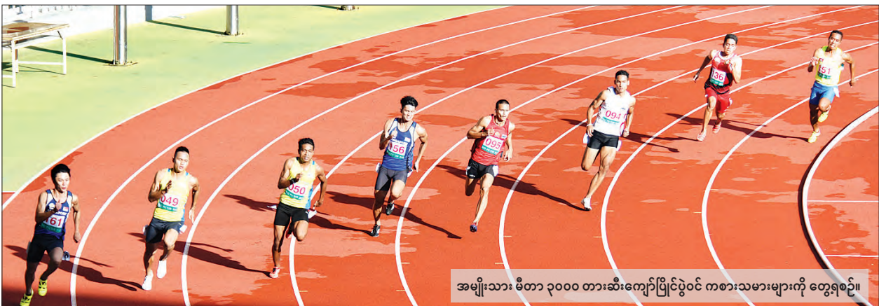
အမျိုးသား မီတာ ၃၀၀၀ တားဆီးကျော်ပြိုင်ပွဲဝင် ကစားသမားများကို တွေ့ရစဉ်။