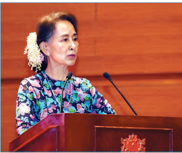
နိုင်ငံတော်၏အတိုင်ပင်ခံပုဂ္ဂိုလ် ဒေါ်အောင်ဆန်းစုကြည်

ဒီလိုကူညီဖို့ဆိုရင် ပထမဦးဆုံးအနေနဲ့တိုက်တွန်းချင်တာက ကိစ္စတစ်ခုကို လုပ်မကြည့်ဘဲနဲ့ မရပါဘူးလို့ အဲဒီလို စိတ်ဓာတ်မထားပါနဲ့။ ကိစ္စတစ်ခုကို တခြားသူ တွေ မလုပ်ဖူးလို့ မဖြစ်ပါဘူးလို့လည်း စိတ်ထဲမှာမထားပါနဲ့။ တခြားသူတွေမလုပ်ဖူး တဲ့ ကိစ္စတွေ၊ မဖြစ်ဖူးတဲ့ ကိစ္စတွေကို တို့တွေလုပ်မယ်၊ တို့တွေဖြစ်အောင်လုပ်မယ်