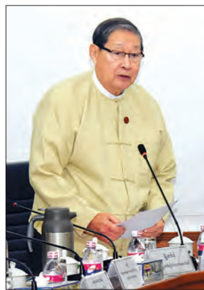
ပြည်ထောင်စုဝန်ကြီး ဦးစိုးဝင်း ရှင်းလင်းပြောကြားစဉ်။

အမှတ်တိုးမြှင့် ရရှိ ပြည်ပရင်းနှီးမြှုပ်နှံသူများအနေဖြင့် ကမ္ဘာ့ဘဏ်က ထုတ်ပြန်သည့် Doing Business Report အပေါ်မူတည်၍