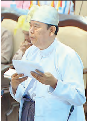
ဒုတိယဝန်ကြီး ဦးဝင်းမော်ထွန်း

ပလက်ဝမြို့နယ်၊ ချင်းဒေါက်ကျေးရွာ အခြေခံပညာအလယ် တန်းကျောင်းတွင် လက်ရှိကျောင်းသားဦးရေနှင့် စာသင်ဆောင်အခြေအနေအရ တိုးချဲ့ကျောင်းဆောင်သစ် တစ်ဆောင် ဆောက်လုပ်ပေးရန် လိုအပ်သောရန်ပုံငွေကို ၂၀၁၉-၂၀၂၀ ဘဏ္ဍာရေးနှစ်တွင် လျာထားပြီးဘဏ္ဍာငွေ ခွဲဝေရရှိမှုအပေါ် မူတည်၍ ဆောင်ရွက်ပေးမည်