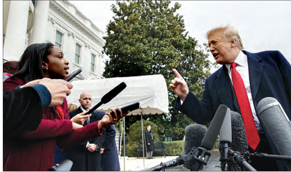
သတင်းထောက်များ၏မေးမြန်းမှုကို ဖြေကြားနေသော အမေရိကန်သမ္မတ ဒေါ်နယ်ထရမ်။