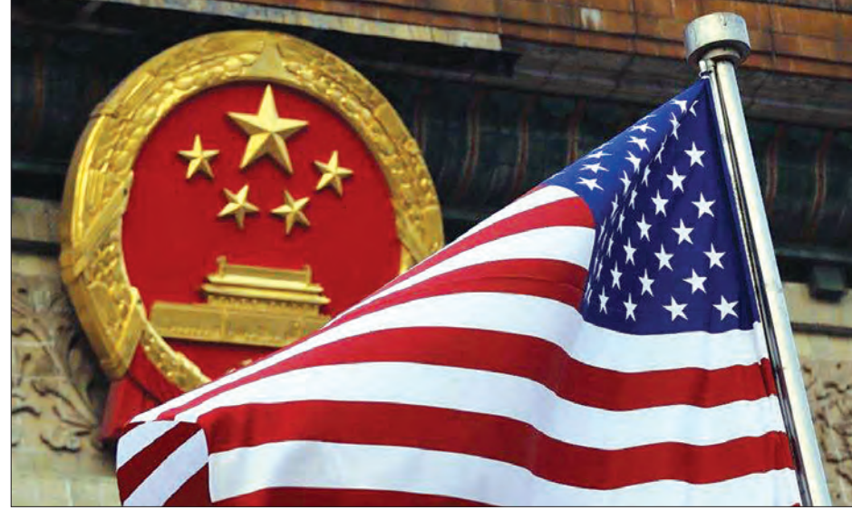
တရုတ်နှင့်အမေရိကန် နှစ်နိုင်ငံကိုယ်စားပြု သင်္ကေတများကို တွေ့ရစဉ်။