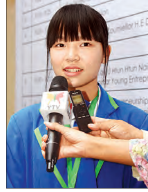
မခင်ဇာသက်

အထောက်အပံ့နဲ့တင် ဖွံ့ဖြိုးတိုးတက်ဖို့ လမ်းကြောင်းကို ရည်ရွယ်လို့မရပါဘူး။ ဒီအတွက် တစ်ဖက်ကလည်း လိုအပ်တဲ့ ဘဏ္ဍာရေးဆိုင်ရာ အထောက်အပံ့တွေ ရရှိအောင် နိုင်ငံခြားရင်းနှီးမြှုပ်နှံမှုရရှိ ဆောင်ရွက်သွားရမှာပါ။ ဦးထွန်းထွန်းနိုင်(ဥက္ကဋ္ဌ) မြန်မာနိုင်ငံလူငယ်စွန့်ခွာခြင်းထွက်ခွာရေးကော်မရှင်များအသင်း ဒီနေ့ညီလာခံက တတိယအကြိမ်မြောက် မြန်မာနိုင်ငံလူငယ်စွန့်ခွာခြင်းထွက်ခွာရေးကော်မရှင်များအသင်းရဲ့ တတိယအကြိမ်မြောက် လူငယ်ညီလာခံဖြစ်ပါတယ်။ ဒီပွဲ ကျင်းပခြင်းက ကျွန်တော်တို့အစိုးရတာဝန်ရှိသူတွေနဲ့ လူငယ်လုပ်ငန်းရှင်တွေ တွေ့ဆုံဆွေးနွေးနိုင်ဖို့နဲ့ လုပ်ငန်းရှင်အချင်းချင်း တွေ့ဆုံဆွေးနွေးနိုင်ဖို့ ဖြစ်ပါတယ်။ ပြီးတော့ နိုင်ငံခြား ပညာရှင်တွေကနေ ကမ္ဘာပေါ်မှာ နောက်ဆုံး သုံးနေတဲ့ နည်းပညာတွေနဲ့ သူတို့အောင်မြင်နေတဲ့ အကြောင်းတွေကို လူငယ်စီးပွားရေး လုပ်ငန်းရှင်တွေကို ပြန်ပြီးတော့ ဝေမျှနိုင်အောင် ဒီညီလာခံကို နှစ်စဉ်ပုံစံတိုင်း ကျင်းပပြုလုပ်ခြင်း ဖြစ်ပါတယ်။ ကျွန်တော်တို့ဆီမှာ အသင်းဝင်နှစ်ထောင်ကျော်ရှိပါတယ်။ ကျွန်တော်တို့အသင်းကနေ တစ်နှစ်တစ်နှစ်ကို ဟောပြောပွဲပေါင်း ငါးဆယ်ကနေ တစ်ရာ