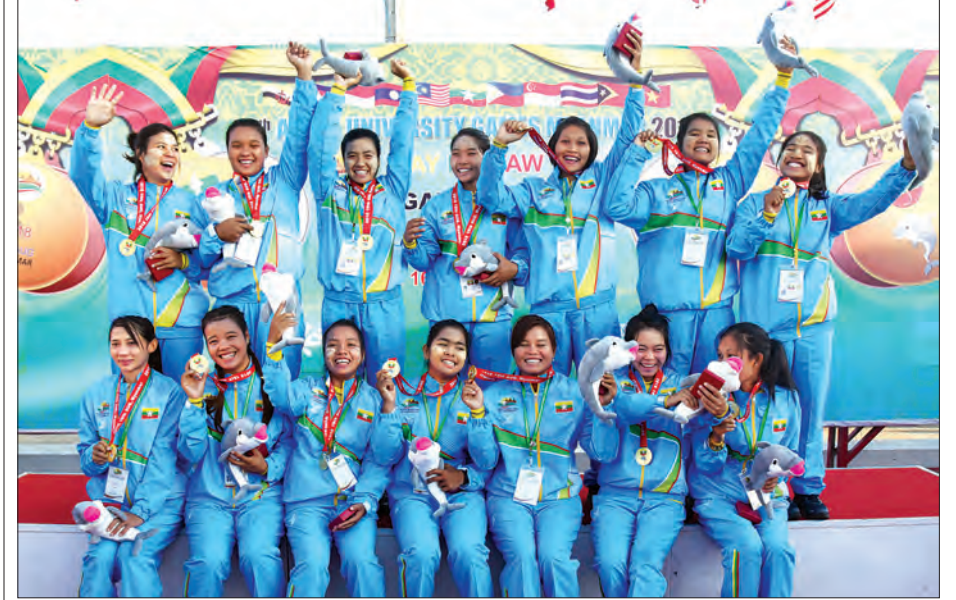
ရွှေတံဆိပ်ရခဲ့သည့် မြန်မာအမျိုးသမီးလှေလှော်အသင်း အောင်ပွဲခံနေစဉ်။

နေပြည်တော် ဒီဇင်ဘာ ၁၄ ယနေ့ ညနေ ၆ နာရီခွဲ တိုင်းထွာချက်များအရ ဘင်္ဂလားပင်လယ်အော် အရှေ့တောင်ပိုင်းတွင် ဖြစ်ပေါ်နေသော အားကောင်းသော မုန်တိုင်းငယ်သည် မြောက် - အနောက်မြောက်ဘက်သို့ ရွေ့လျားခဲ့ပြီး အိန္ဒိယနိုင်ငံ ချင်းမိုင်မြို့၏ အရှေ့ - အရှေ့တောင်ဘက် ၄၆၅ မိုင်ခန့်၊ မာချီလီပတ္တနမ်မြို့၏ အရှေ့တောင်ဘက် မိုင် ၅၅၀ ခန့်၊ သီရိလင်္ကာနိုင်ငံ ထရီကိုမာလီမြို့၏ အရှေ့ဘက် ၃၄၅ မိုင်ခန့်အကွာ ပင်လယ်ပြင်ကို ဖဟိပြုနေသည်။ အားကောင်းသော မုန်တိုင်းငယ်၏ လက်ရှိအခြေအနေမှာ မြန်မာနိုင်ငံဘက်သို့ ဦးတည်ရွေ့လျားမည့်အခြေအနေမရှိသဖြင့် အဝါရောင်အဆင့်ဟု သတ်မှတ်သည်။ အဆိုပါ အားကောင်းသောမုန်တိုင်းငယ်သည် ညနေ ၆ နာရီခွဲတွင် မြောက်လတ္တီကျု ၉ ဒီဂရီနှင့် အရှေ့လောင်ဂျီကျု ၈၇ ဒီဂရီ ၃၀ မိုင်ခန့်တွင်ရှိပြီး ဖဟိချက်လေဖိအား ၁၀၀၂ ဟက်တိုပါစကယ်နှင့် အမြင့်ဆုံးလေတိုက်နှုန်းမှာ တစ်နာရီလျှင် ၃၅ မိုင်နှုန်း ဖြစ်သည်။ အဆိုပါ အားကောင်းသောမုန်တိုင်းငယ်သည် မြောက် - အနောက်မြောက်ဘက်သို့ ရွေ့လျားနိုင်ပြီး နောက် ၁၂ နာရီအတွင်း ဆိုင်ကလုန်းမုန်တိုင်းအဖြစ်သို့ ရောက်ရှိနိုင်သည်ဟု ခန့်မှန်းရသည်။ အဆိုပါ အားကောင်းသောမုန်တိုင်းငယ်၏ အရှိန်ကြောင့် ယနေ့ညနေမှ နောက် ၇၂ နာရီအတွင်း စစ်ကိုင်းတိုင်းဒေသကြီးအောက်ပိုင်း။