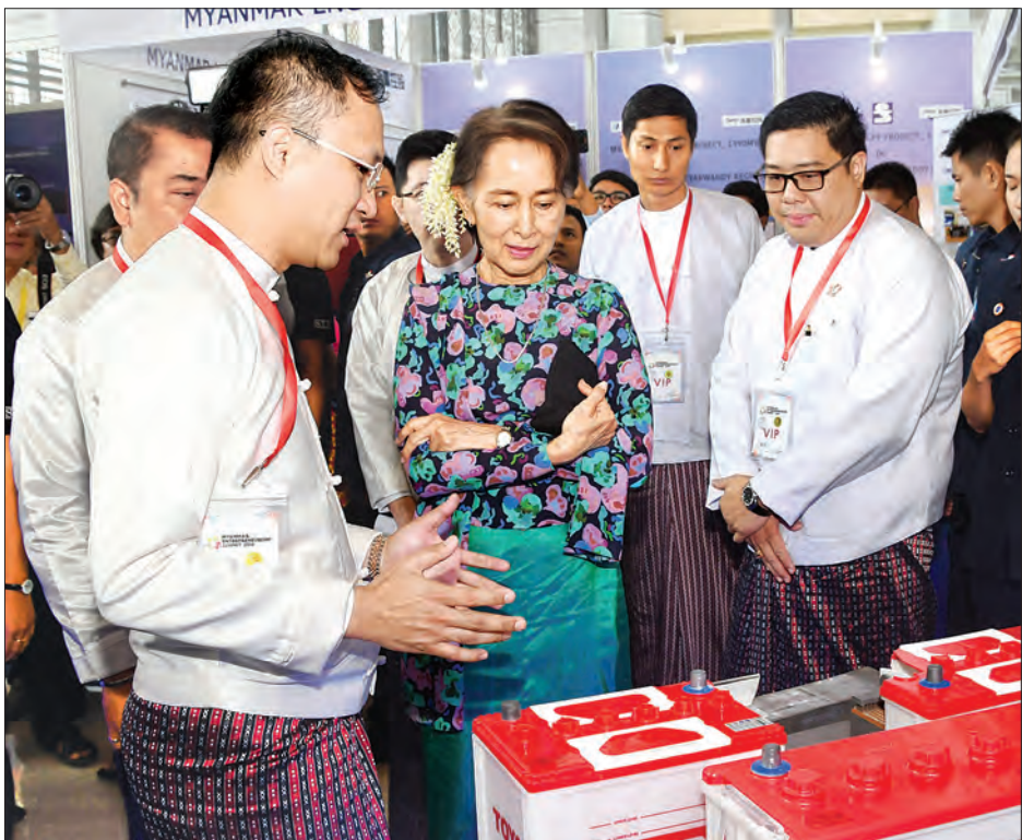
နိုင်ငံတော်၏အတိုင်ပင်ခံပုဂ္ဂိုလ် ဒေါ်အောင်ဆန်းစုကြည် တတိယအကြိမ်မြောက် မြန်မာနိုင်ငံ စွန့်ဦးတီထွင်လုပ်ငန်းရှင်များ ညီလာခံ အထိမ်းအမှတ်ပြခန်းများကို ကြည့်ရှုစဉ်။