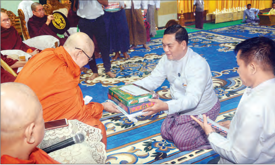
ရန်ကုန် ဒီဇင်ဘာ ၁၄

ထေရဝါဒဗုဒ္ဓသာသနာပြု ဩဝါဒါစရိယအဖွဲ့ ဥက္ကဋ္ဌ ဆရာတော်ထံမှ နယ်စပ်နှင့်တောင်တန်းဒေသသို့ သာသနာပြုကြွရောက်မည့် နိုင်ငံတော်ပရိယတ္တိသာသနာ့တက္ကသိုလ်(ရန်ကုန်)မှ စာအောင်သံဃာတော်များက ဩဝါဒခံယူပွဲကို ယနေ့ မွန်းလွဲ ၂ နာရီတွင် ရန်ကုန်မြို့ ကမ္ဘာ့အေးကုန်းမြေရှိ နိုင်ငံတော်ပရိယတ္တိသာသနာ့တက္ကသိုလ်(ရန်ကုန်) တွဲနှင့်သဘင်ခန်းမ၌ ကျင်းပသည်။ ရှေးဦးစွာ နိုင်ငံတော်ပရိယတ္တိသာသနာ့တက္ကသိုလ်(ရန်ကုန်) ပါမောက္ခချုပ်ဆရာတော် အဂ္ဂမဟာပဏ္ဍိတ အဂ္ဂမဟာသဒ္ဓမ္မ ဇောတိကဓဇ ဒေါက်တာဘဒ္ဒန္တကုမာရထံမှ သာသနာရေးနှင့် ယဉ်ကျေးမှုဝန်ကြီးဌာန ဒုတိယဝန်ကြီး ဦးကြည်မင်း အမျိုးပြုသော ပရိသတ်က ငါးပါးသီလ ခံယူဆောက်တည်ကြသည်။ ထို့နောက် ထေရဝါဒဗုဒ္ဓသာသနာပြု ဩဝါဒါစရိယအဖွဲ့ ဥက္ကဋ္ဌ ဆရာတော် အဂ္ဂမဟာသဒ္ဓမ္မ ဇောတိကဓဇ ဘဒ္ဒန္တကုမာရက နိုင်ငံတော်ပရိယတ္တိသာသနာ့တက္ကသိုလ်(ရန်ကုန်)