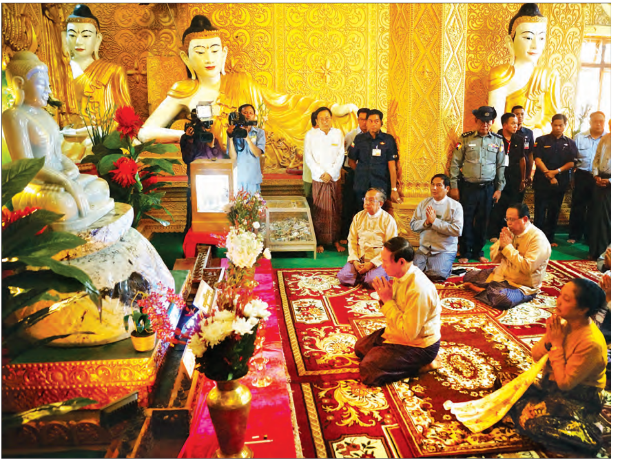
နိုင်ငံတော်သမ္မတ ဦးဝင်းမြင့်နှင့် ဇနီး ဒေါ်ချိုချိုနှင့် အဖွဲ့ မော်လမြိုင်မြို့၊ ကျိုက်သလွဲစေတီတော်ရှိ ပုဒ္ဒရုပ်ပွားတော်မြတ်အား ဖူးမြော်ကြည့်ညိုစဉ်။ သတင်းစဉ်