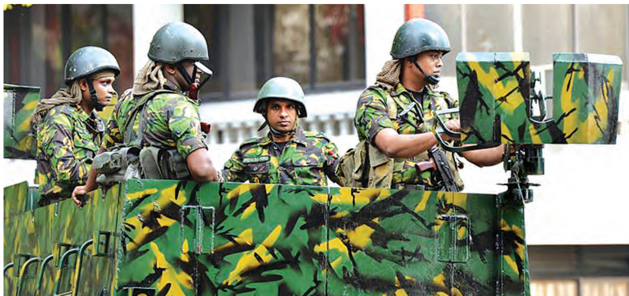
ကိုလံဘိုရှိ တရားရုံးချုပ်အနီးတွင် ကင်းလှည့်နေသည့် တပ်ဗွဲဝင်များ။