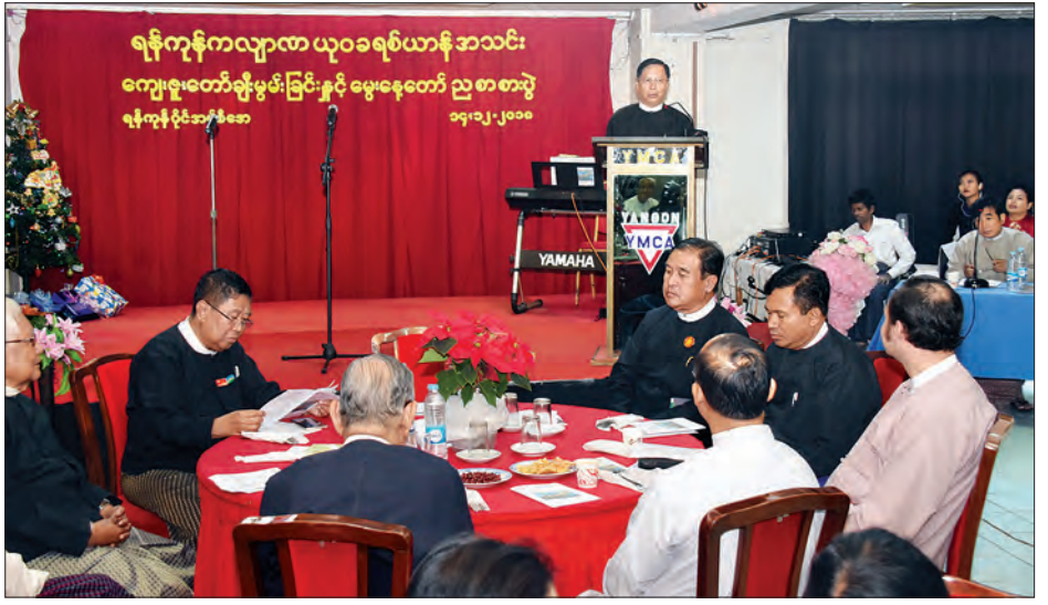
ပြည်ထောင်စုဝန်ကြီး သူရဦးအောင်ကို ရန်ကုန်ကလောင်ထုဝန်ရုံးအသင်း ကျေးဇူးတော်ချီးမွမ်းခြင်းနှင့် ခရစ်တော်မွေးနေ့အကြို ညစာစားပွဲအခမ်းအနား၌ အမှာစကားပြောကြားစဉ်။

ထို့နောက် YMCA ဝန်ထမ်းများက YMCA သီချင်းသီဆိုခြင်း၊ ပြည်ထောင်စုသမ္မတ မြန်မာနိုင်ငံတော်ဘာသာပေါင်းစုံ ချစ်ကြည်ညီညွတ်ရေးအဖွဲ့(ပဟို)ဥက္ကဋ္ဌ ဦးသောင်းထိုက်က ဂုဏ်ယူဝမ်းမြောက်စကား ပြောကြားခြင်း၊ သိက္ခာတော်ရဆရာ ဦးအောင်မြင့်စိန်က ညစာအတွက် ကျေးဇူးတော် ချီးမွမ်းခြင်း (၆၄)ကြိမ်မြောက် အသင်းသားစုဆောင်းခြင်းတွင် ဆုရရှိသူများကို ဆုချီးမြှင့်ခြင်းနှင့် နွတ်ဆက်သီချင်းဆုတောင်း၍ အခမ်းအနားကို ရုပ်သိမ်းလိုက်သည်။ သတင်းစဉ်