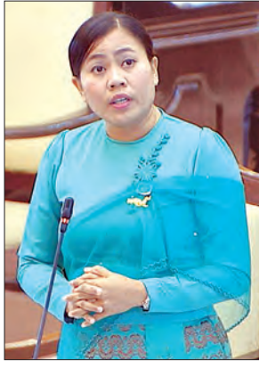
ရခိုင်ပြည်နယ် မဲဆန္ဒနယ်အမှတ် (၁၁)မှ ဒေါ်ထုမေ

တိုင်းဒေသကြီး မင်းဘူးခရိုင်၊ ပွင့်ဖြူမြို့နယ်၊ မုန်းလေကျေးရွာ အခြေခံပညာမူလတန်း ကျောင်း၌ အန္တရာယ်ရှိ ကျောင်းဆောင်အတွက် (၆၀ x ၃၀)ပေ သွပ်မိုး အုတ်ညှပ် တစ်ထပ် အသစ်ဆောက်လုပ်ပေးရန် အစီအစဉ် ရှိ မရှိ မေးခွန်းနှင့် စပ်လျဉ်း၍ ဒုတိယဝန်ကြီး ဦးဝင်းမော်ထွန်းက အန္တရာယ်ဆောင်ဖြစ်နေသည့် ကျောင်းဆောင် အစား ကျောင်းဆောင်အသစ်တစ်ဆောင် ဆောက်လုပ်ရန်အတွက် လိုအပ်သော ရန်ပုံငွေကို ၂၀၁၉-၂၀၂၀ ဘဏ္ဍာရေးနှစ်တွင် လျာထားပြီး ဘဏ္ဍာငွေခွဲဝေရရှိမှုအပေါ် မူတည်၍ ဆောင်ရွက်ပေးမည်ဖြစ်ပါကြောင်း ဖြေကြားသည်။