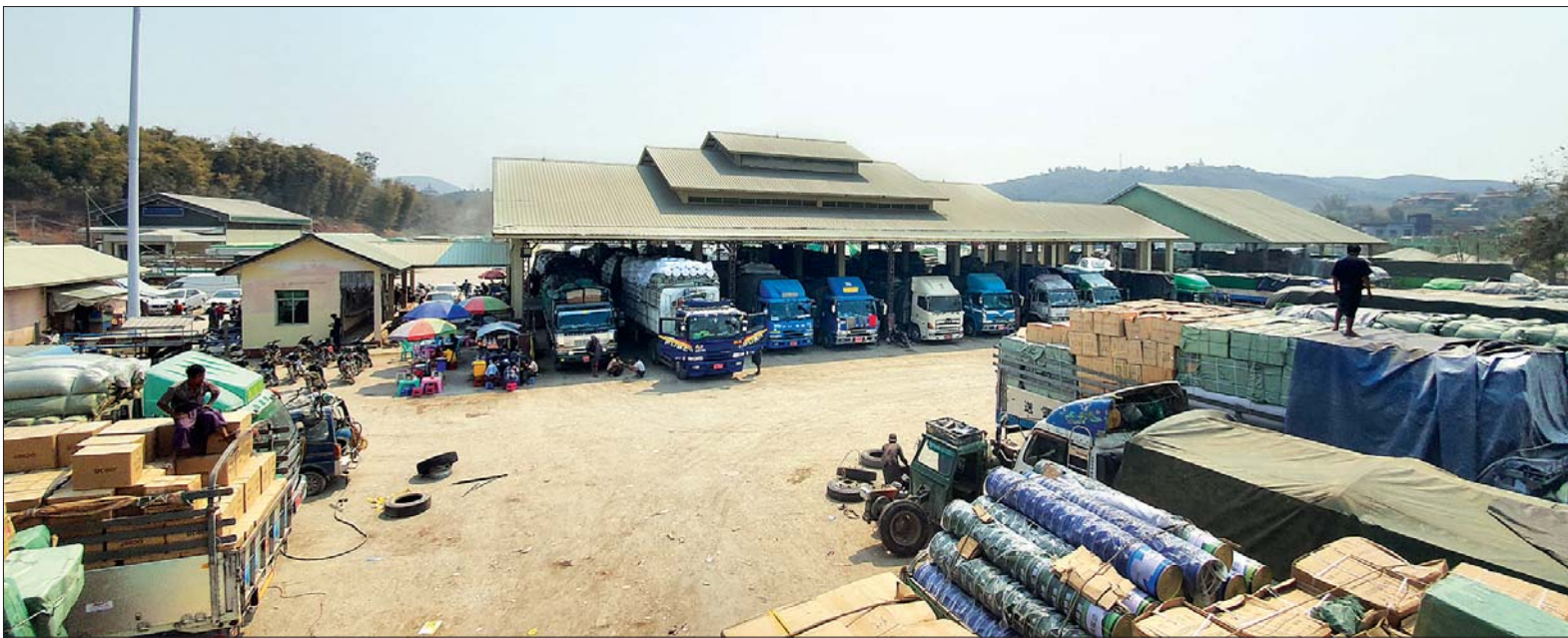
မူဆယ် ၁၀၅ မိုင် ကုန်သွယ်ရေးဇုန်တွင် ကုန်စည်များတင်ဆောင်လာကြသည့် ကုန်တင်ယာဉ်များအား တွေ့ရစဉ်။

နှစ်စဉ် တရုတ်နှစ်သစ်ကူးရုံးပိတ်ရက်ကာလတွင် ကုန်သွယ်မှုလျော့နည်းလေ့ရှိသော်လည်း ကိုရိုနာဗိုင်းရပ်စ် စတင်ကူးစက်မှုဖြစ်ပွားမှုနှင့် ဆက်စပ်သွားသဖြင့် ကုန်သွယ်မှုလုပ်ငန်းများ ဆက်လက်ရပ်ဆိုင်း