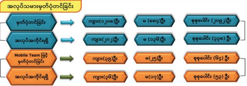
ရခိုင်ပြည်နယ်ဆိုင်ရာအကြံပြုချက်များအပေါ် အကောင်အထည်ဖော်ဆောင်ရွက်ရေးကော်မတီ