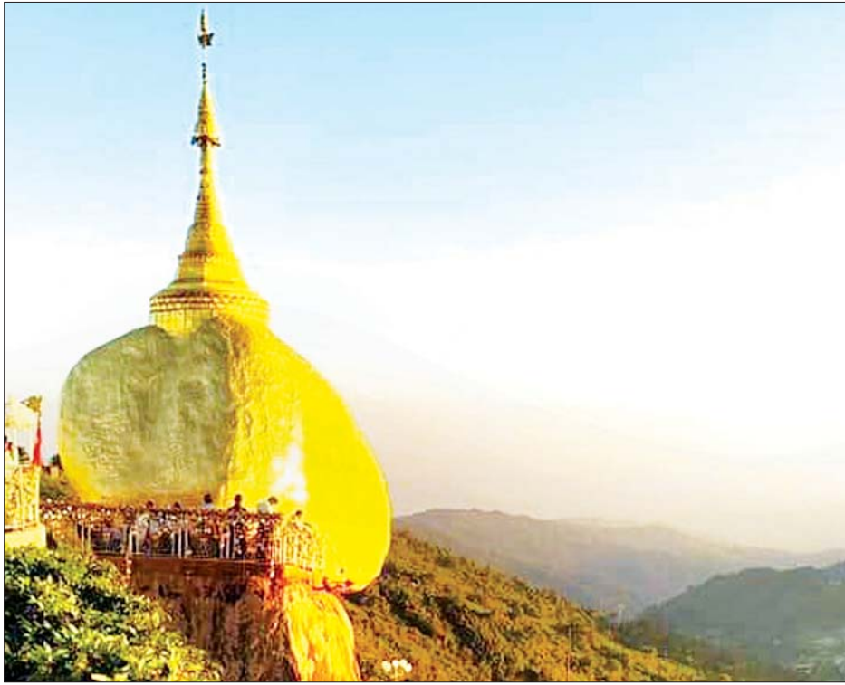
မပါတာ များတယ်။ မနေ့ကဆိုရင် ကား ၂၉ စီးအထိ သူတိုင်းကိုတောင်ပေါ်မတက်မီမှာ ကျန်းမာရေးစစ်ဆေးတာ ဝင်ရောက်မှုရှိခဲ့ပါတယ်။ ကျိုက်ထီးရိုးဘုရားဖူး လာရောက် တွေ့ ကိုယ်အပူချိန်တိုင်းတာ တာတွေကိုလည်း လုပ်ဆောင်

“မနေ့က မတ် ၁၇ ရက်အထိ ဘုရားဖူးတွေ လာရောက်ဖူးမြော်နေပေမယ့် ဒီနေ့ မတ် ၁၈ ရက်မှာ တော့ အတော်လေးကို ဝင်ရောက်မှုနည်းပါးသွားပါတယ်။ မွန်းလွဲပိုင်းအထိ လာရောက်ဖူးမြော်တဲ့ ဘုရားဖူးကား ခုနစ်စီးလောက်ပဲရှိသလို ကားပေါ်မှာလည်း လူအပြည့်