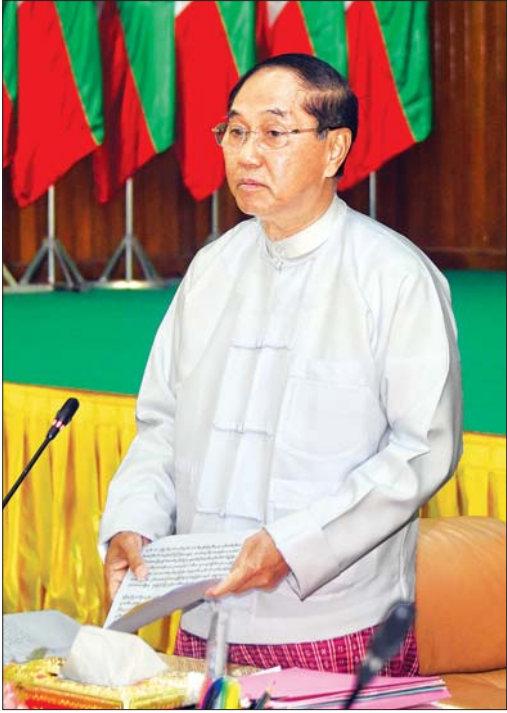
ဒုတိယသမ္မတ ဦးမြင့်ဆွေ ကမ္ဘာ့နိုင်ငံအားလုံး၏ လူ့အခွင့်အရေးအခြေအနေကို ပုံမှန်သုံးသပ်သည့် လုပ်ငန်းစဉ် (Universal Periodic Review - UPR) ဆိုင်ရာ အကြံပြုတိုက်တွန်းချက်များ အကောင်အထည်ဖော်ဆောင်ရွက်ရေး အမျိုးသားအဆင့်ကော်မတီ၏ တတိယအကြိမ် လုပ်ငန်းညှိနှိုင်းအစည်းအဝေးတွင် အမှာစကားပြောကြားစဉ်။