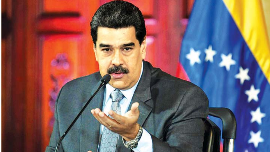
ဗင်နီဇွဲလားသမ္မတ နီကိုလပ်မာဒူရို

ဝါရှင်တန် မတ် ၁၈ ကိုရိုနာဗိုင်းရပ်စ်တိုက်ဖျက်ရန် စီးပွားရေးချွတ်ခြုံကျနေသည့် ဗင်နီဇွဲလားနိုင်ငံက အမေရိကန်ဒေါ်လာ ငါးဘီလီယံ ချေးငွေပေးရန် တောင်းဆိုမှုကို အပြည်ပြည်ဆိုင်ရာ နိုင်ငံတကာငွေကြေးရန်ပုံငွေအဖွဲ့က ပယ်ချလိုက်ကြောင်း နိုင်ငံတကာ သတင်းတစ်ရပ်တွင် မတ် ၁၈ ရက်က ဖော်ပြလိုက်သည်။ ဗင်နီဇွဲလားသမ္မတ နီကိုလပ်မာဒူရို၏ အစောပိုင်းတောင်းဆိုမှုပင် ဖြစ်ပြီးသော်လည်း အမေရိကန်အခြေစိုက် အဖွဲ့အစည်းဖြစ်သည့် နိုင်ငံတကာငွေကြေးရန်ပုံငွေအဖွဲ့က ၎င်း၏တောင်းဆိုမှုကို ပယ်ချခဲ့ခြင်းဖြစ်သည်။ နိုင်ငံတကာ ငွေကြေးရန်ပုံငွေအဖွဲ့အကြီးအကဲ ခရစ်စတော့လီနာ ဂျော့ဂျီဗာသို့ ပေးပို့သော ဗင်နီဇွဲလားသမ္မတ၏ စာထဲတွင် ချေးငွေ အမေရိကန်ဒေါ်လာ ငါးဘီလီယံသည် ကိုရိုနာဗိုင်းရပ်စ်ကူးစက်မှုနှင့် တုံ့ပြန်ရေးတွင် များစွာအရေးပါမည်ဖြစ်ကြောင်း ဖော်ပြခဲ့သည်။ ဗင်နီဇွဲလားနိုင်ငံသည် ၂၀၀၁ ခုနှစ်မှစကာ နိုင်ငံတကာငွေကြေးရန်ပုံငွေအဖွဲ့ထံမှ ပထမဆုံး ချေးငွေ တောင်းခဲ့သည့် နိုင်ငံတစ်နိုင်ငံဖြစ်သည်။ ငွေကြေးအကူအညီတောင်းခံမှုကို စဉ်းစားပေးရန် သင့်တော်သော အချိန်မဟုတ်ကြောင်း၊ ဗင်နီဇွဲလားအစိုးရကို နိုင်ငံတကာအသိအမှတ်ပြုထားသည့်ဆိုသည်မှာ ရှင်းလင်းမှုမရှိကြောင်း အမေရိကန်အခြေစိုက် နိုင်ငံတကာ ငွေကြေး ရန်ပုံငွေအဖွဲ့က ထုတ်ပြန်ဖော်ပြထားသည်။ မိမိတို့အရင်ကဖော်ပြခဲ့သလို နိုင်ငံတကာငွေကြေးရန်ပုံငွေအဖွဲ့က ချေးငွေအကူအညီပေးရန်မှာ နိုင်ငံတကာက အသိအမှတ်ပြုသော အစိုးရဖြစ်ရမည်ဖြစ်ကြောင်း၊ ဗင်နီဇွဲလားကို ချေးငွေပေးဖို့ဆိုသည်မှာ သင့်တော်သော အချိန်မဟုတ်သေးကြောင်း နိုင်ငံတကာ ငွေကြေးရန်ပုံငွေအဖွဲ့ အကြီးအကဲကပြောသည်။ ဗင်နီဇွဲလားနိုင်ငံတွင် ကိုရိုနာဗိုင်းရပ်စ်ကူးစက်မှုသည် ပြုလုနာ ၁၇ ဦးရှိလာပြီး နောက် မြို့တော်ကရာကက်စ်နှင့် အခြားပြည်နယ်ခြောက်ခုတို့ကို အလုပ်ပိတ်ထားခဲ့ကြောင်း သိရသည်။ အေအက်ဖ်ပီ