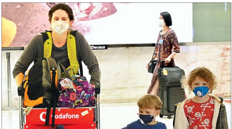
လေဆိပ်၌ နှာခေါင်းစည်းဝတ်ဆင်ကာ သွားလာနေသည့် မိသားစုတစ်စုကို တွေ့ရစဉ်။