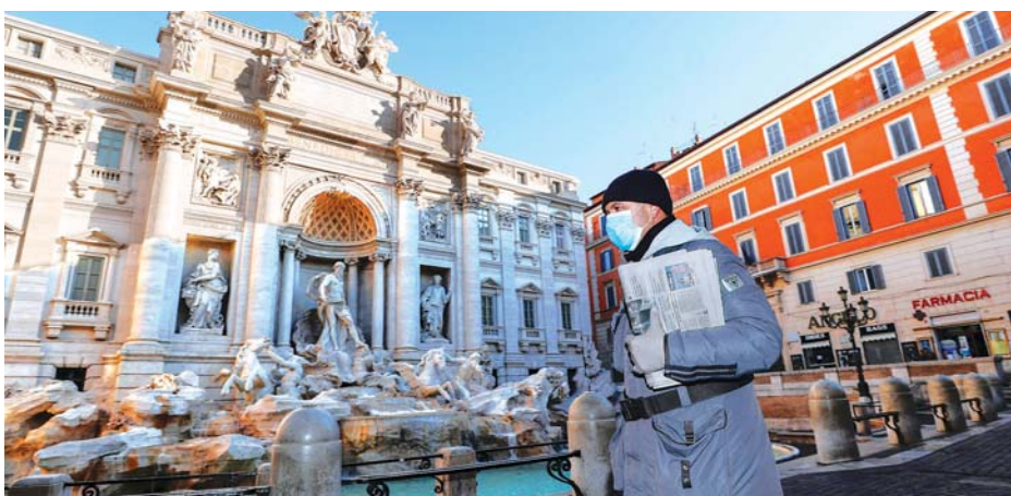
ရောမမြို့၌ နှာခေါင်းစည်းဝတ်ဆင်၍ သွားလာနေသူတစ်ဦးကို တွေ့ရစဉ်။

များဖြစ်ကြသည့် ဗြိတိန်နှင့် ရိုမေးနီးယားနိုင်ငံများမှ ခရီးသွားဧည့်သည်များကိုပါ အသွားအလာကန့်သတ်ရန် လုပ်ဆောင်မည်ဖြစ်သည်ဟု ဆိုသည်။ ထို့အပြင် ဂျပန်အစိုးရသည် အီတလီ၊ စပိန်နှင့် ဆွစ်ဇာလန်နိုင်ငံများရှိ အစိတ်အပိုင်းအချို့နှင့် ဆိုင်စလန်မှ ပြည်ပခရီးသွားများအပေါ် ပြည်ပဝင်ခွင့်ပိတ်ပင်မှု လုပ်ဆောင်ရန်လည်း စဉ်းစားနေကြောင်း အစိုးရသတင်းရင်းမြစ်များက ဖော်ပြခဲ့သည်။ ဂျပန်နိုင်ငံသားများအပါအဝင် ဥရောပနှင့် အရှေ့တောင်အာရှတို့မှ ခရီးသွားများအားလုံးကို ၎င်းတို့၏ နေအိမ်၌သာနေထိုင်ကြရန်၊ အများပြည်သူ သယ်ယူပို့ဆောင်ရေးယာဉ်များ အသုံးပြုခြင်းမှ ရှောင်ရှားရန်နှင့် ရောဂါကူးစက်ခံရသည့် လက္ခဏာများ ဖြစ်ပေါ်လာခြင်း ရှိမရှိကို သတိပြုစောင့်ကြည့်ကြရန် အစိုးရက တိုက်တွန်းထားကြောင်း သိရသည်။ ကျွန်ုပ်တို့အဖွဲ့