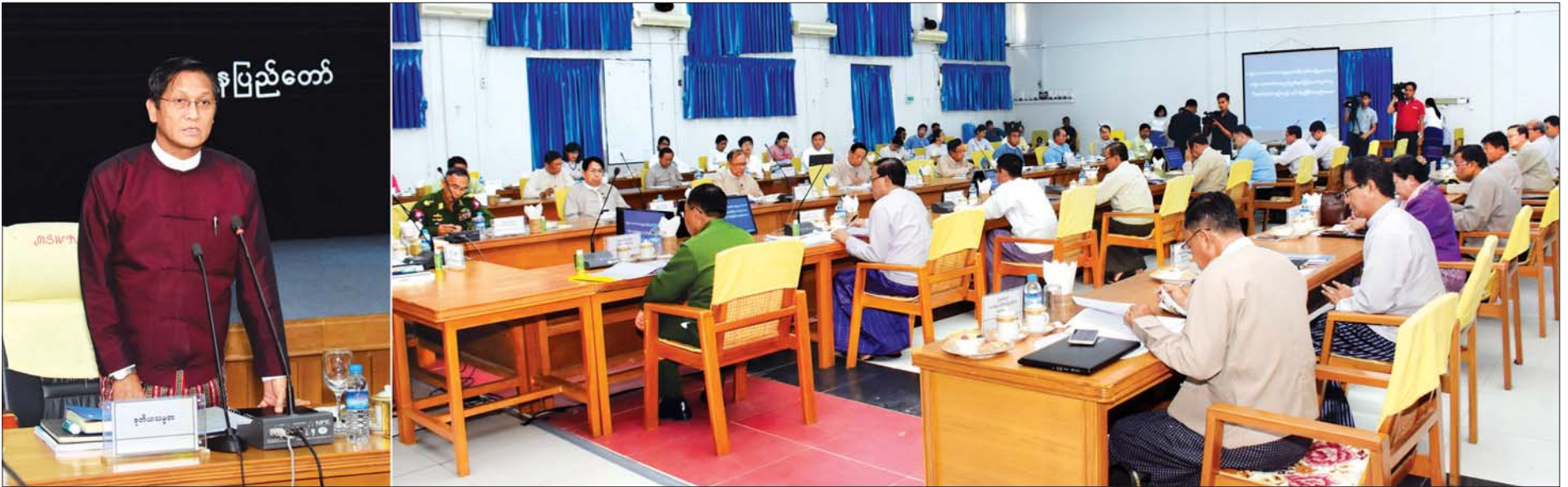
ဒုတိယသမ္မတ ဦးဟင်နရီဗန်ထီးယူ အမျိုးသားအဆင့် ရေထုညစ်ညမ်းမှု တုံ့ပြန်ဆောင်ရွက်ရေးစီမံချက် ရှင်းလင်းတင်ပြခြင်း အစည်းအဝေးတွင် အမှာစကား ပြောကြားစဉ်။ သတင်းစဉ်

နေပြည်တော် မတ် ၁၈ အမျိုးသားအဆင့် ရေထုညစ်ညမ်းမှု တုံ့ပြန်ဆောင်ရွက်ရေးစီမံချက် (National Contingency Plan for Marine Pollution)အား ရှင်းလင်းတင်ပြခြင်း အစည်းအဝေးကို ယနေ့မွန်းလွဲ ၂ နာရီတွင် နေပြည်တော်ရှိ လူမှုဝန်ထမ်း၊ ကယ်ဆယ်ရေးနှင့် ပြန်လည်နေရာချထားရေးဝန်ကြီးဌာန အစည်းအဝေးခန်းမ၌ကျင်းပရာ အမျိုးသားသဘာဝဘေးအန္တရာယ်ဆိုင်ရာ စီမံခန့်ခွဲမှုကော်မတီ ဥက္ကဋ္ဌ၊ ဒုတိယသမ္မတ ဦးဟင်နရီဗန်ထီးယူ တက်ရောက်အဖွင့်အမှာစကား ပြောကြားသည်။ အစည်းအဝေးသို့ အမျိုးသားသဘာဝဘေးအန္တရာယ်ဆိုင်ရာ စီမံခန့်ခွဲမှုကော်မတီဝင် ပြည်ထောင်စုဝန်ကြီးများ၊ ဒုတိယဝန်ကြီးများ၊ ဘေးအန္တရာယ် စီမံခန့်ခွဲမှုဆိုင်ရာ အကြံပေးအဖွဲ့ဝင်များ၊ ဌာနဆိုင်ရာအကြီးအကဲများနှင့် တာဝန်ရှိသူများ တက်ရောက်ကြသည်။ စာမျက်နှာ ၄ ကော်လံ ၁