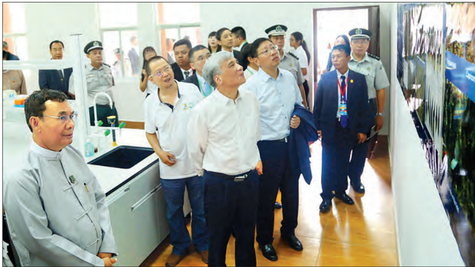
နေပြည်တော် စက်တင်ဘာ ၁၈

တရုတ်ပြည်သူ့သမ္မတနိုင်ငံ အမျိုးသားပြည်သူ့ကွန်ဂရက် (NPC) အမြဲတမ်းကော်မတီ၏ ဒုတိယဥက္ကဋ္ဌ H.E. Mr. Ding Zhongli နှင့်အဖွဲ့သည် ပြည်ထောင်စုဝန်ကြီးဌာန ဦးအုန်းဝင်း နှင့်အတူ ယမန်နေ့ နံနက် ၁၀ နာရီက သယ်ဇာတနှင့် သဘာဝ ပတ်ဝန်းကျင်ထိန်းသိမ်းရေးဝန်ကြီးဌာန သစ်တောဦးစီးဌာန သစ်တောသုတေသနဌာန (ရေဆင်း)သို့ သွားရောက်လေ့လာခဲ့ကြသည်။ (ခုံ)