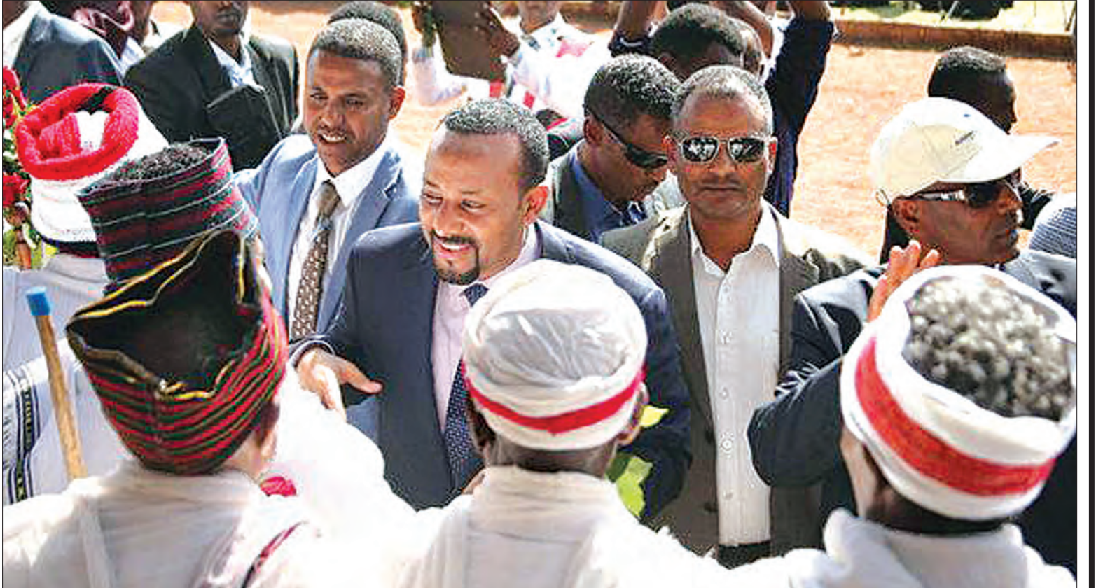
အိသီယိုပီးယားဝန်ကြီးချုပ် အဘီအာမက်ကို ပြေလအတွင်းက အိုရီယိုဒေသ စုဝေးပွဲတစ်ခုတွင် တွေ့ရစဉ်။

အိသီယိုပီးယားဝန်ကြီးချုပ် မစ္စတာ အဘီဟာ အာဖရိကမှာ အသက်အငယ်ဆုံး နိုင်ငံခေါင်းဆောင်တစ်ဦး ဖြစ်တဲ့အပြင် စောင့်ကြည့်ခံရဆုံး ခေါင်းဆောင်တစ်ဦးလည်း ဖြစ်ပါတယ်။