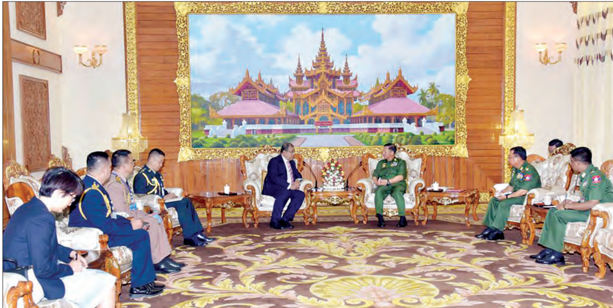
တပ်မတော်ကာကွယ်ရေးဦးစီးချုပ် ဗိုလ်ချုပ်မှူးကြီး မင်းအောင်လှိုင် မြန်မာနိုင်ငံဆိုင်ရာ ထိုင်းနိုင်ငံသံအမတ်ကြီး H.E. Mr. Jukr Boon-Long အား လက်ခံတွေ့ဆုံစဉ်။

နေပြည်တော် စက်တင်ဘာ ၁၈ တပ်မတော်ကာကွယ်ရေးဦးစီးချုပ် ဗိုလ်ချုပ်မှူးကြီး မင်းအောင်လှိုင်သည် တာဝန်ပြီးဆုံး၍ ပြန်လည်ထွက်ခွာ တော့မည့် မြန်မာနိုင်ငံဆိုင်ရာ ထိုင်းနိုင်ငံသံအမတ်ကြီး H.E. Mr. Jukr Boon-Long အား ယနေ့နံနက်ပိုင်းတွင် နေပြည်တော်ရှိ ဘုရင့်နောင်ရိပ်သာ ဧည့်ခန်းမ ဆောင်၌ လက်ခံတွေ့ဆုံသည်။ ထိုသို့တွေ့ဆုံစဉ် နှစ်နိုင်ငံတပ်မတော်နှစ်ရပ်အကြား