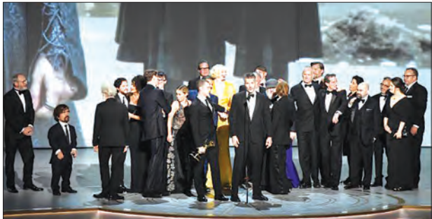
စီအင်နီအင်နီ

Game of Thrones ရုပ်သံစီးရီးအတွက် ထူးချွန်ဆုကိုတော့ ဒီတီဝစ်က လက်ခံခဲ့ပါတယ်။ ဒါတင်မကသေးပါဘူး Game of Thrones ဇာတ်လမ်းတွဲဟာ ဆုသုံးဆုလက်ခံ ရရှိခဲ့ပါတယ်။ အထူးချွန်ဆုဟာသဇာတ်လမ်းတွဲကိုတော့ The Marvelous Mrs. Maisel ဆိုတဲ့ ဇာတ်လမ်းတွဲနဲ့ ရရှိသွားပါတယ်။ ပြီးတော့ ဆုပေးပွဲတွေရပ်နားစဉ် အတောအတွင်းမှာ အစီအစဉ်တင်ဆက်သူ ကော်လင်းဂျီလီယာ မကြာသေးခင်က အမေရိကန်ကို ဝင်ပွားသွားတဲ့ ဟာရီကိန်းဗလော့ရန် ကြောင့် ပျက်စီးဆုံးရှုံးမှုများအတွက်လည်း ကူညီပေးကြပါလို့ ကြည့်ရှုသူတွေကို မေတ္တာရပ်ခံခဲ့ပါတယ်။ အခုဆိုရင် မုန်တိုင်းကြောင့် ပျက်စီးဆုံးရှုံးသွားတာတွေအတွက် ပြန်လည်ထူထောင်ရေးတွေ လုပ်နေပါပြီ။ ဒါကြောင့် အမေရိကန်ကြက်မြေခန့်နဲ့ အခြားသော ပရဟိတအဖွဲ့တွေကို လှူဒါန်းမှုတွေ ပြုလုပ်ကြဖို့လည်း ကော်လင်းဂျီလီယာ တိုက်တွန်းခဲ့ပါတယ်။