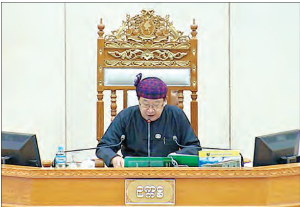
ပြည်သူ့လွှတ်တော် ဥက္ကဋ္ဌ ဦးတီခွန်မြတ်

သနပ်ပင်မဲဆန္ဒနယ်မှ ဦးမြင့်ဦး၏ သနပ်ပင်မြို့နယ် အခြေခံပညာကျောင်းများတွင် လိုအပ်ချက်ရှိသော ဆရာ၊ ဆရာမများအား ဖြည့်ဆည်းခန့်ထားပေးရန်နှင့် ယင်း ဆရာ၊ ဆရာမများနေရာတွင် ဒေသခံဘွဲ့ရလူငယ်များအား ဦးစားပေးခန့်ထားရန် အစီအစဉ် ရှိ မရှိ မေးခွန်းနှင့် စပ်လျဉ်း၍ ပညာရေးဝန်ကြီးဌာန ဒုတိယဝန်ကြီး ဦးဝင်းမော်ထွန်းက ဝန်ကြီးဌာနအနေဖြင့် သနပ်ပင်မြို့နယ်ရှိ အခြေခံပညာကျောင်းများတွင် လိုအပ်လျက်ရှိ သည့် မူလတန်းပြနှင့် အလယ်တန်းပြ ဆရာ၊ ဆရာမများကို ယခု ၂၀၁၈-၂၀၁၉ ပညာ သင်နှစ်တွင် PPTT နှင့် DTET သင်တန်းဆင်း မူလတန်းပြ ဆရာ၊ ဆရာမ ၁၄ ဦး၊ မူလတန်းပြ အလယ်တန်းပြ ဆရာထူးတို့ ၅၂ ဦး၊ PGDMA ဆရာ တစ်ဦးတို့ကို ဖြည့် ဆည်းဆောင်ရွက်ပြီးဖြစ်ပါကြောင်း၊ ဒုတိယအကြိမ်အဖြစ် အထက်တန်းပြ အပြောင်း အရွှေ့ ရာထူးများ ခန့်ထားဆောင်ရွက်ချိန်၌ ဘာသာရပ်လိုအပ်ချက်အပေါ် မူတည်၍ ဆန္ဒပြုလျှောက်ထားသူများ၊ ဘာသာရပ်ကိုက်ညီမှုရှိသူများအား လုပ်သက်တန်းစီယား မူဘောင်သတ်မှတ်ချက်အရ ဖြည့်ဆည်းခန့်ထား ဆောင်ရွက်သွားမည်ဖြစ်ပါကြောင်း၊ ဒေသခံပြင်ပဘွဲ့ရလူငယ်များအား ဆရာခန့်ထားခြင်းအဖြစ် လုပ်ငန်းခွင်အကြို မူလတန်း ဆရာအတတ်ပညာသင်တန်း PPTT သင်တန်းခေါ်ယူသည့်အချိန်တွင် သတ်မှတ်အရည် အချင်းများနှင့် ကိုက်ညီသောသူများ လျှောက်ထားနိုင်ပြီး ကိုက်ညီပါက ဒေသခံများအား