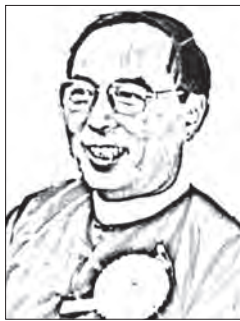
အတိတ်တိုက်ဖျက်ရေးဥပဒေ