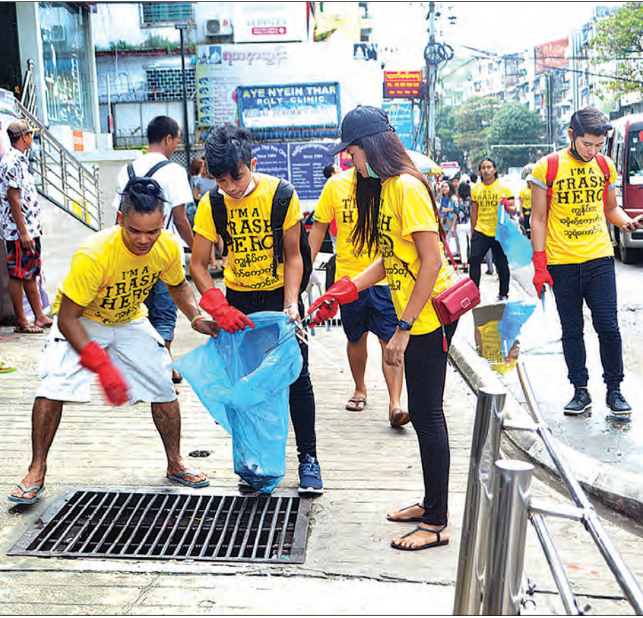
စက်တင်ဘာ ၁၅ ရက် ကမ္ဘာ့သန့်ရှင်းရေးနေ့တွင် လှည်းတန်းစုပါမားကတ်ရှေ့တွင် ပရဟိတလူငယ်များအမှိုက်များ ကောက်ယူသိမ်းဆည်းနေစဉ်။

တီရှပ်အဝါရောင် ဆင်တူအင်္ကျီတွင် I am a Trash Hero စာတန်းဖြင့် “ကျွန်ုပ်က အမှိုက်ကောက်တဲ့ သူရဲကောင်းပါ” ဟု စာတန်းရေးထိုးထားပြီး အပြာရောင်ပလတ်စတစ်အိတ်ကြီးများကို ကိုင်ဆောင်လျက် လမ်းပေါ်အမှိုက်များကို လိုက်လံ သိမ်းဆည်းလျက်ရှိရာ လှည်းတန်းလမ်းဆုံသည် ကမ္ဘာ့သန့်ရှင်းရေးနေ့တွင် ပရဟိတလူငယ်များဖြင့် စည်ကားလျက်ရှိသည်။ အထူးသဖြင့် နိုင်ငံခြားသားများ ကိုယ်တိုင်ပူးပေါင်းပါဝင်ခြင်း