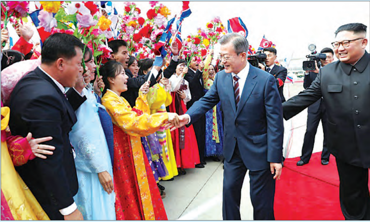
သမ္မတမွန်ဂျယ်အင်း မြောက်ကိုရီးယားတွင် နျူကလီးယားကင်းစင်ရေး ခေါင်းဆောင်ကင်ကို တိုက်တွန်းနိုင်ရေးအတွက် နှစ်ကျော့ဆွေးနွေးသွားဖွယ်ရှိသည်။ ဆွေးနွေးပွဲရလဒ်များကို ယခုလနှောင်းပိုင်းတွင် ပြုလုပ်မည့် ကုလသမဂ္ဂအထွေထွေညီလာခံတွင် သမ္မတထရန်နှင့် တွေ့ဆုံသည့်အခါ ပြန်လည်ရှင်းလင်းသွားဖွယ်ရှိသည်။ (အေအက်စီပီ)

ဆယ်စုနှစ်တစ်ခုအတွင်း တောင်ကိုရီးယားခေါင်းဆောင်တစ်ဦးအနေဖြင့် မြောက်ကိုရီးယား မြို့တော်ပြုယမ်းသို့ ပထမဦးဆုံးအကြိမ်အဖြစ်သွားရောက်ခဲ့ခြင်းဖြစ်သည်။ ယခုနှစ်အတွင်း ခေါင်းဆောင်ကင်နှင့် သမ္မတမွန်ဂျီ တတိယအကြိမ် တွေ့ဆုံဆွေးနွေးကြခြင်းလည်းဖြစ်သည်။ အမေရိကန်ပြည်ထောင်စုကလည်း မြောက်ကိုရီးယားတွင် နျူကလီးယားလက်နက် လုံခြုံရေးစစ်ဆေးမှုကို အစောဆုံးတောင်းဆိုလျက်ရှိပြီး ပြုယမ်းဘက်ကလည်း ၁၉၅၀-၅၁ ကိုရီးယားစစ်ပွဲကို အဆုံးသတ်ပြုစုကြောင်း တရားဝင်ကြေညာမှုပြုလုပ်ပေးစေလိုသည်။ တောင်ကိုရီးယားဘက်ကလည်း ကိုရီးယားကျွန်းဆွယ်တွင် ပဋိပက္ခများ ခြိမ်းခြောက်မှုများ လျော့ပါးစေရေးအတွက် နှစ်နိုင်ငံပူးပေါင်းဆောင်ရွက်နိုင်မည့် နည်းလမ်းကို ရှာဖွေလိုသည်။