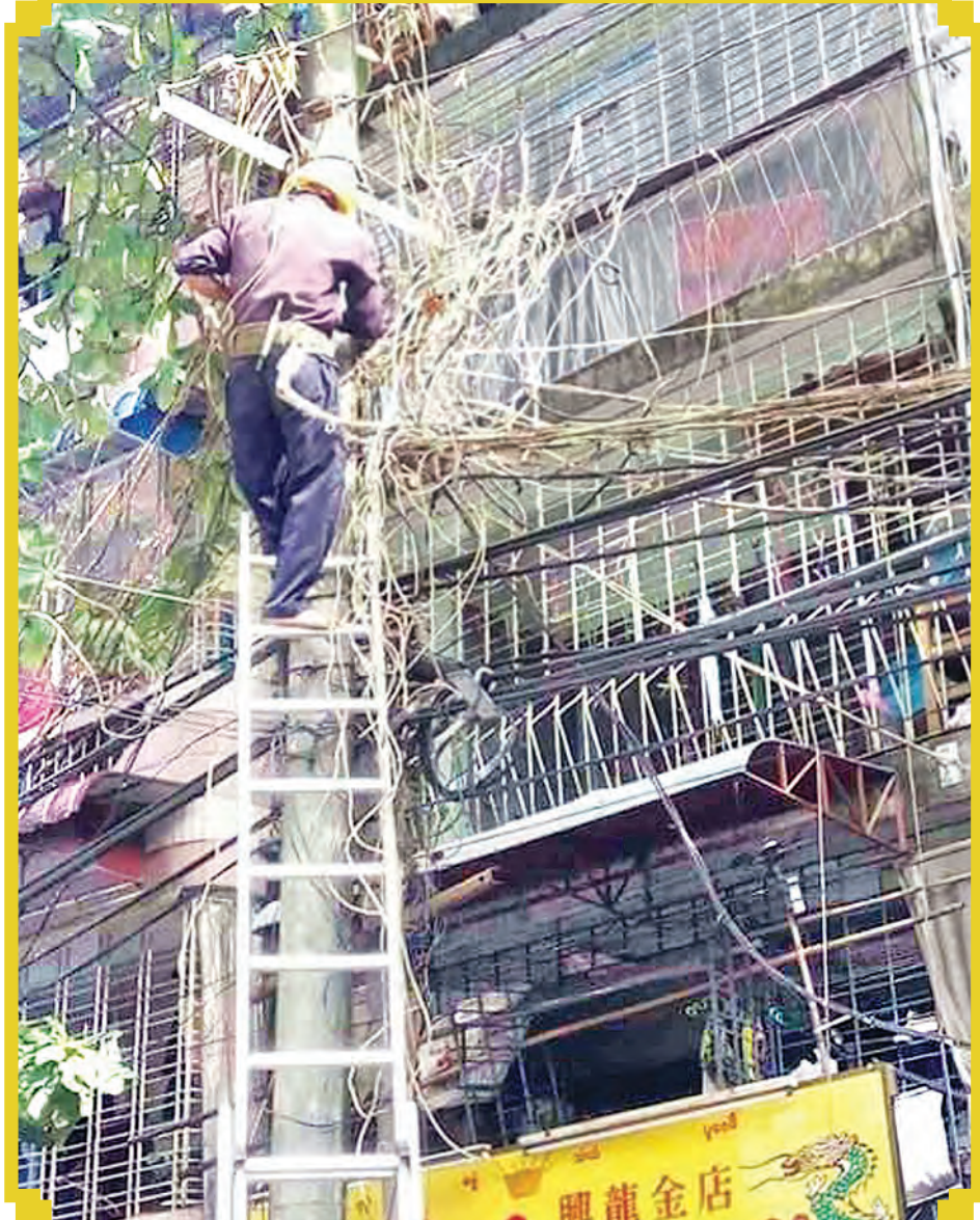
ရန်ကုန်မြို့ပြနေပြည်သူများ လျှပ်စစ်အန္တရာယ်ကင်းရှင်းစေရေးအတွက် လျှပ်စစ်ဝန်ထမ်းများက အိမ်သွယ်ဆားစစ်ကြီးများ ရှင်းလင်းနေမှုကို တွေ့ရစဉ်။