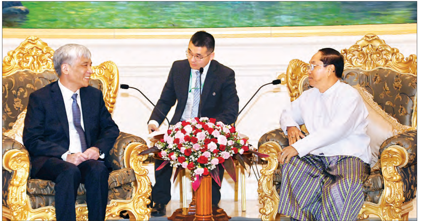
ဒုတိယသမ္မတ ဦးမြင့်ဆွေ တရုတ်ပြည်သူ့သမ္မတနိုင်ငံ အမျိုးသားပြည်သူ့ကွန်ဂရက် အမြဲတမ်းကော်မတီ ဒုတိယဥက္ကဋ္ဌ H. E. Mr. Ding Zhongli အား လက်ခံတွေ့ဆုံစဉ်။ သတင်းစဉ်

တွေ့ဆုံပွဲသို့ ဒုတိယသမ္မတ ဦးမြင့်ဆွေနှင့်အတူ ပြည်သူ့လွှတ်တော် ဒုတိယဥက္ကဋ္ဌ ဦးထွန်းထွန်းတိန်၊ နိုင်ငံခြားရေးဝန်ကြီးဌာန အမြဲတမ်းအတွင်းဝန် ဦးမြင့်သူ၊ နိုင်ငံတော်သမ္မတရုံး ညွှန်ကြားရေးမှူးချုပ် ဦးနိုင်ဆွေဦး၊ ဧည့်သည်တော် တရုတ်ပြည်သူ့သမ္မတနိုင်ငံ အမျိုးသားပြည်သူ့ကွန်ဂရက် အမြဲတမ်းကော်မတီ ဒုတိယဥက္ကဋ္ဌနှင့်အတူ မြန်မာနိုင်ငံဆိုင်ရာ တရုတ်နိုင်ငံ သံအမတ်ကြီး မစ္စတာ ဟန်လျန်နှင့် တာဝန်ရှိသူများ တက်ရောက်ကြသည်။