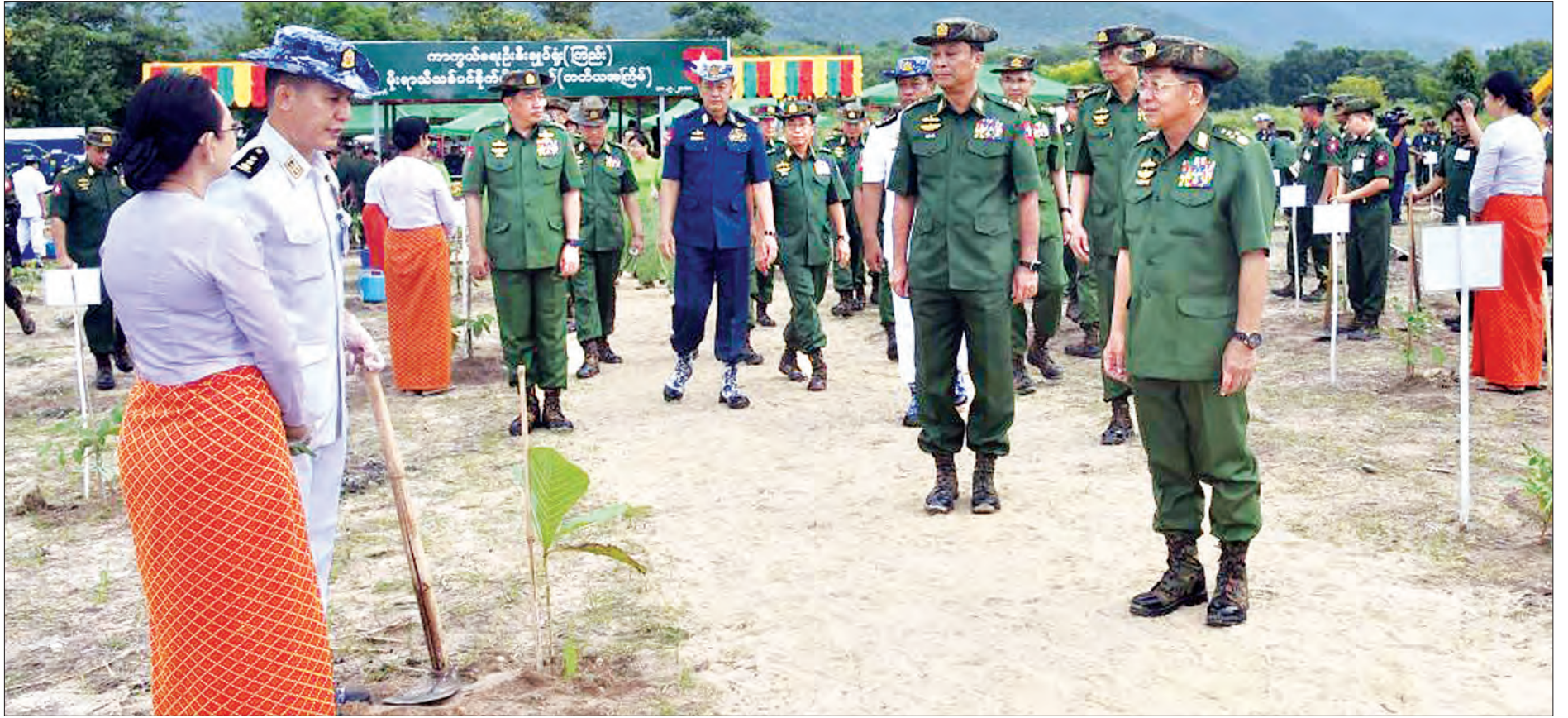
တပ်မတော်ကာကွယ်ရေးဦးစီးချုပ် ဝိုင်းချုပ်မှူးကြီး မင်းအောင်လှိုင် ကာကွယ်ရေးဦးစီးချုပ်ရုံး(ကြည်း၊ ရေ၊ လေ) မိသားစုများ၏ ၂၀၁၈ ခုနှစ် တတိယအကြိမ်မြောက် မိုးရာသီသစ်ပင်စိုက်ပျိုးပွဲတွင် အရာရှိ၊ စစ်သည်၊ မိသားစုများ၏ စုပေါင်းသစ်ပင်စိုက်ပျိုးနေမှုကို လှည့်လည်ကြည့်ရှုအားပေးစဉ်။

နေပြည်တော် စက်တင်ဘာ ၁၈ ရေဆင်းဆည်၏ သဘာဝပတ်ဝန်းကျင်ထိန်းသိမ်းရေးအတွက် ကာကွယ်ရေးဦးစီးချုပ်ရုံး(ကြည်း၊ ရေ၊ လေ)မိသားစုများ၏ ၂၀၁၈ ခုနှစ် တတိယအကြိမ်မြောက် မိုးရာသီသစ်ပင်စိုက်ပျိုးပွဲအခမ်းအနားကို ယနေ့ နံနက်ပိုင်းက ကျင်းပပြုလုပ်ရာ တပ်မတော် ကာကွယ်ရေးဦးစီးချုပ် ဝိုင်းချုပ်မှူးကြီး မင်းအောင်လှိုင် တက်ရောက်စိုက်ပျိုးသည်။ အဆိုပါ သစ်ပင်စိုက်ပျိုးပွဲအခမ်းအနားသို့ တပ်မတော်ကာကွယ်ရေးဦးစီးချုပ်၏ဇနီး ဒေါ်ကြူကြူလှ၊ ပြည်ထောင်စုဝန်ကြီး