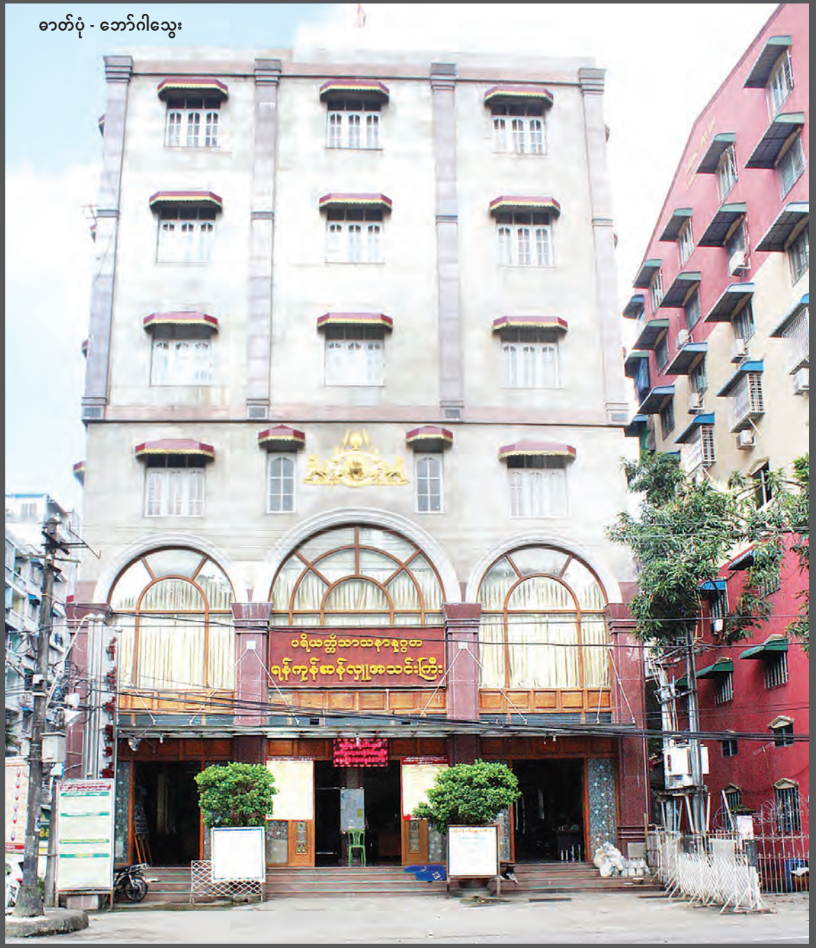
ဓာတ်ပုံ - ဘော်ဂါသွေး

လှူဒါန်းမှုများကို စစ်အတွင်း ခြောက်နှစ်တာ နားခဲ့ပြီး ၁၃၀၉ ခုနှစ် ဝါဆိုလပြည့်နေ့တွင် အငြိမ်းစား ရဲဝိုင်းချုပ်ကြီး ဦးဘရီ ဥက္ကဋ္ဌလက်ထက်၌ ရသမျှသော စာသင်တိုက်များကို စုစည်းကြ၊ ကျောင်းတိုက် ၁၅ တိုက်မှ သံဃာအပါး ၈၁၂ ပါးတို့ကို အကြိမ် (၅၀)မြောက်အဖြစ်