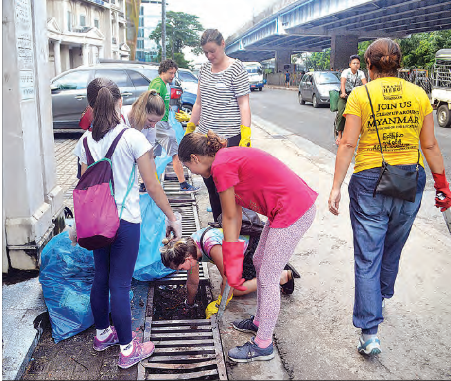
နိုင်ငံခြားသားမိသားစုအလိုက် အမှိုက်များ သိမ်းဆည်းနေသည်ကို တွေ့ရစဉ်။

ကိုယ့်နိုင်ငံအတွက် ကောင်းစေချင်လို့ လုပ်ဆောင်တာဖြစ်တဲ့ အတွက် ကျွန်တော်တို့ဆီက လူငယ်တွေလည်း မိမိမြို့