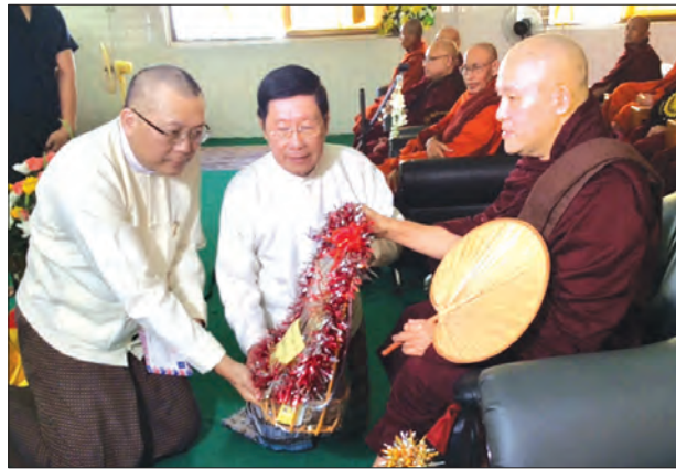
စာသင်တိုက်မှ မဟာဂန္ထဝါစကပဏ္ဍိတ တဒ္ဓန္တ ပညာသီရိရတနာဘိဝံသတို့အား ဂုဏ်ပြုမတ်တမ်းလွှာနှင့် လှူဖွယ်ဝတ္ထုပစ္စည်းများ ဆက်ကပ်လှူဒါန်းကြပြီး ဆက်လက်၍ ပုသိမ်အသင်း (ရန်ကုန်)မှ အသင်းသူ အသင်းသား

အဂ္ဂမဟာ သဒ္ဓမ္မဇောတိကဓဇ တဒ္ဓန္တဝိသုတထံမှ ငါးပါးသီလ ခံယူဆောက်တည်ကြသည်။ ယင်းနောက် ပုသိမ်အသင်း(ရန်ကုန်)ဥက္ကဋ္ဌ အဂ္ဂမဟာသီရိသုဓမ္မ မဏိဇောတဓရ ဦးစိုးဟန်လင်းက ဘွဲ့တံဆိပ်တော်ရ ဆရာတော်ကြီးများအား ချီးကျူးဂုဏ်ပြုပူဇော်ရခြင်းကို လျှောက်ထားသည်။ ယင်းနောက် နိုင်ငံတော်မှဆက်ကပ်လှူဒါန်းသည့် သာသနာတော်ဆိုင်ရာဘွဲ့တံဆိပ်တော်ရ ဆရာတော်ကြီးများဖြစ်သည့် ရောဂါတိုင်းဒေသကြီး ပုသိမ်မြို့စက်တော်ရာရပ်ကွက်၊ စန္ဒာရုံစာသင်တိုက်မှ အဂ္ဂမဟာပဏ္ဍိတ တဒ္ဓန္တက္ကန္တာဘာသ၊ ငပတောမြို့နယ် မကျည်းပင်ကျေးရွာ ရွှေကျောင်းတိုက်မှ အဂ္ဂမဟာ သဒ္ဓမ္မဇောတိကဓဇ တဒ္ဓန္တဘာဏနှင့် ပုသိမ်မြို့ အမှတ်(၃)ရပ်ကွက် မြောင်းမြ