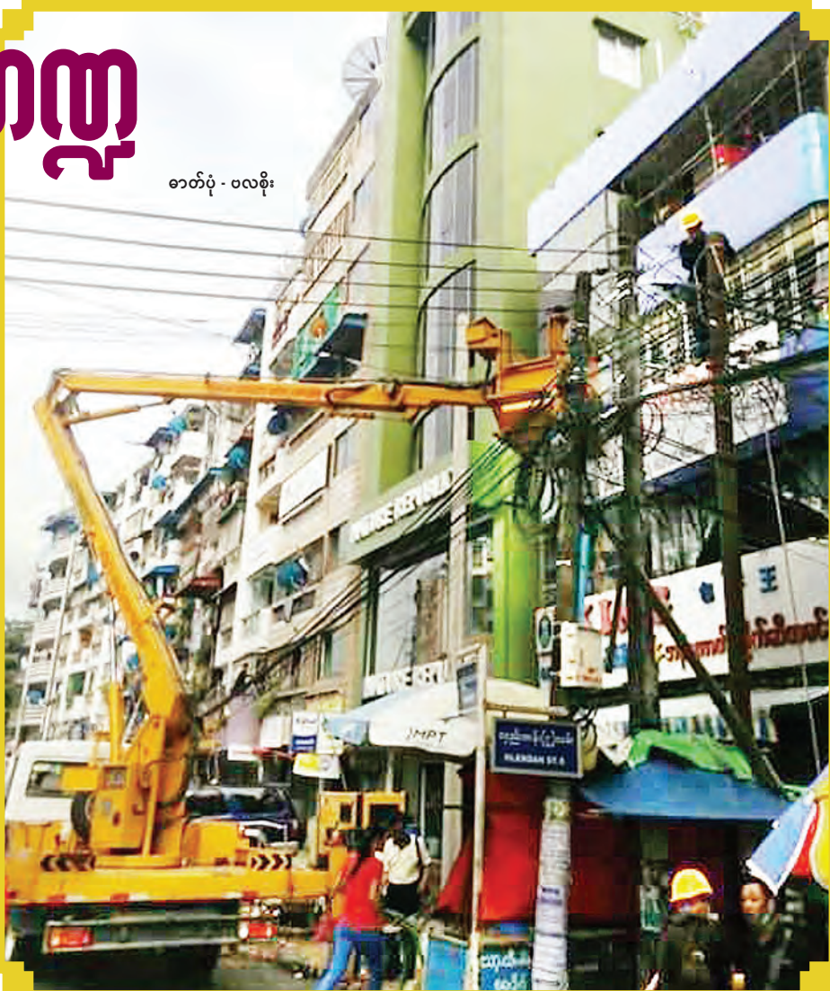
ရန်ကုန်မြို့ပြနေပြည်သူများ လျှပ်စစ်အန္တရာယ်ကင်းရှင်းစေရန် ကြိုးပမ်းလဲလှယ်နေမှုကို တွေ့ရစဉ်။

ကန်ထရိုက်တိုက်ခန်းစေ့နှုန်းများ မြင့်တက်လာနိုင် ယခင်က ရန်ကုန်တိုင်းဒေသကြီးအတွင်း ၃၀ ကီလိုဝပ်နှင့် အထက် ဓာတ်အားသုံးစွဲလိုသူများအား ထရန်စဖော်မာထိုင်ရန် ညွှန်ကြားချက်ရှိခဲ့သဖြင့် အခန်း ၁၇ ခန်းနှင့်အောက် ကန်ထရိုက် တိုက်များတွင် ဓာတ်အားရရှိရေးကိစ္စအပေါ် ကန်ထရိုက်တာ များမှ ငွေကြေးများစွာ ရင်းနှီးမြှုပ်နှံရမည်ဖြစ်သဖြင့် ကန်ထရိုက်