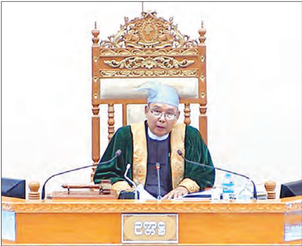
အမျိုးသားလွှတ်တော်ဥက္ကဋ္ဌ မန်းဝင်းခိုင်သန်း။

အလားတူ ကရင်ပြည်နယ် မဲဆန္ဒနယ်အမှတ်(၄)မှ ဒေါ်နန်းမိုးမိုးထွေ၊ တနင်္သာရီတိုင်းဒေသကြီး မဲဆန္ဒနယ်အမှတ်(၇)မှ ဦးဇော်ဟိန်းနှင့် ရှမ်းပြည်နယ် မဲဆန္ဒနယ်