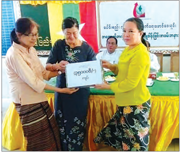
မြင့်တက်လာတယ်ဆိုရင် ဆေးခန်းကို ရှိပါတယ်”ဟု ဆေးရုံအုပ်ကြီး ဒေါက်တာ အရောက်လာစေချင်ပါတယ်။ ကုသဖို့ မြတ်မြတ်နှင့်က ပြောကြားသည်။ အတွက် စက်ကိရိယာတွေ အရန်သင့် မျိုးမင်းသိန်း(မရမ်းကုန်း)

ရွှေပြည်သာ အမှတ် ၁၂ ရပ်ကွက် အခြေစိုက်ပေါင်းစည်း လှူဖွဲ့ပြီးတိုးတက် ရေး ဖောင်ဒေးရှင်းက ရွှေပြည်သာပြည်သူ့ ဆေးရုံသို့ ဆေးရုံသုံးနှင့် မသန်စွမ်းသူ သုံး အထောက်အကူပြု ပစ္စည်းများ အား ယမန်နေ့က ဆေးရုံခန်းမ၌