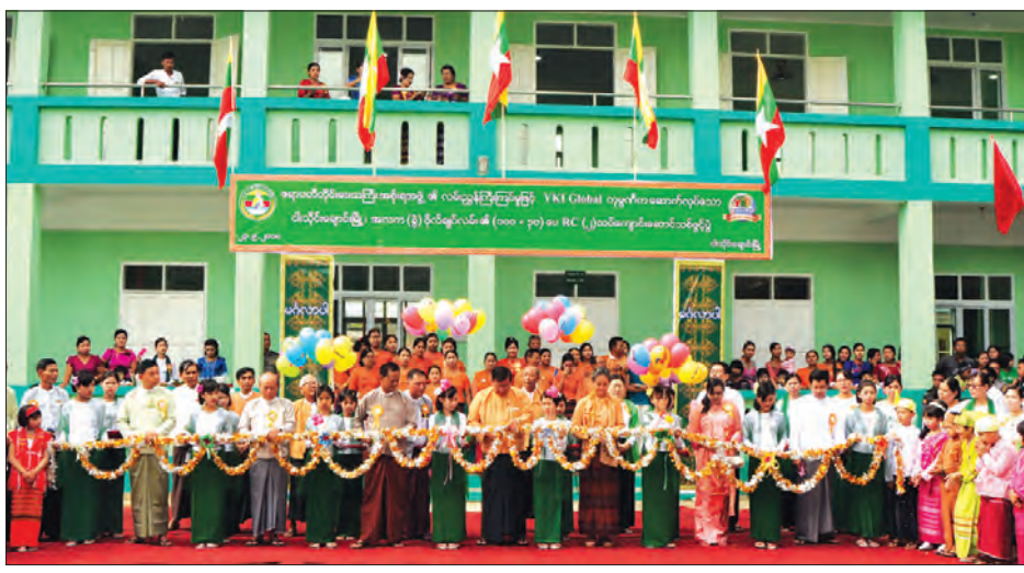
ထိုနေ့က တိုင်းဒေသကြီးဝန်ကြီးချုပ်နှင့်အဖွဲ့က ကျောင်း များ ပက်ဖျန်းပြီး ကျောင်းဆောင်သစ်ကို ကြည့်ရှုစစ်ဆေး ဆောင်သစ် ကမ္ဘည်းမော်ကွန်းကျောက်စာကို အမွှေးနံ့သာ ခဲ့ကြသည်။

အဆိုပါ နှစ်ထပ်ကျောင်းဆောင်သစ် ဖွင့်ပွဲအခမ်း အနားကို ယမန်နေ့က အဆိုပါကျောင်းဝင်းအတွင်း၌ ကျင်းပရာ တိုင်းဒေသကြီး ဝန်ကြီးချုပ် ဦးလှမိုးအောင်၊ တိုင်းဒေသကြီး လူမှုရေးဝန်ကြီး ဒေါက်တာလှမြတ်သွေး၊ လှုပ်စစ်၊ စွမ်းအင်၊ စက်မှုလက်မှုနှင့် လမ်းပန်းဆက်သွယ်ရေးဝန်ကြီး ဦးဝင်းဌေးနှင့် တာဝန်ရှိသူများ၊ တိုင်းဒေသကြီး ပညာရေးမှူးရုံးမှ ဒုတိယ ညွှန်ကြားရေးမှူး၊ ဦးမန်းသိန်းကျော်၊ တိုင်းဒေသကြီး ခရိုင်၊ မြို့နယ်နှင့် ဌာနဆိုင်ရာတာဝန်ရှိသူများနှင့် ကျောင်းအကျိုး တော်ဆောင်တို့က ကျောင်းဆောင်သစ်ကို ဖြစ်ကြီးဖြတ် ဖွင့်ပွဲတက် ပေးခဲ့သည်။