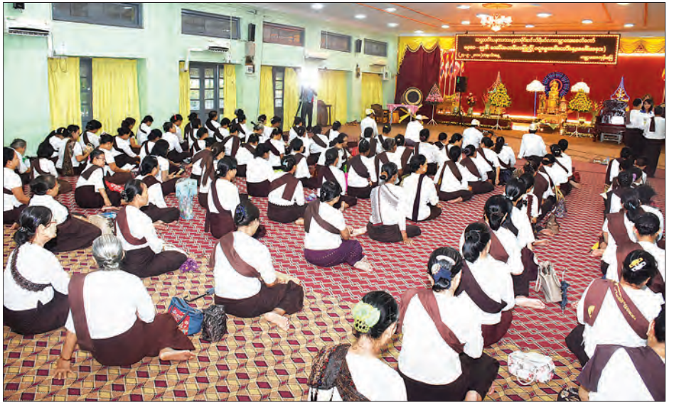
တော်နေ့ ကျင်းပရခြင်းအကြောင်းကို ဂေါပကအဖွဲ့ အလှည့်ကျသဘာပတိက မင်္ဂလာထောမနာစကား မြွက်ကြားတော် မူကာ အခမ်းအနားကို အစဉ်အလာမပျက် စည်ကားသိုက်မြိုက်စွာ ကျင်းပခဲ့ကြောင်း သတင်းရရှိသည်။ သတင်းစဉ်

အခမ်းအနားတွင် ဂေါပကအဖွဲ့ဝင်များ၊ ဝတ်အသင်းအဖွဲ့များက နတ်ဗြဟ္မာများကို ပင့်ဖိတ်ခြင်း၊ သမ္မာသမ္ဗုဒ္ဓသုံးလောကထွတ်ထား မြတ်စွာဘုရားကို ပင့်လျှောက်ခြင်း၊ ကမ္ဘာအေးဘုရားရှိခိုးဖြင့် ပူဇော်ကန်တော့ခြင်း၊ ပင့်လျှောက်ထားသော သမ္မာသမ္ဗုဒ္ဓ သုံးလောကထွတ်ထားမြတ်စွာဘုရားထံ ဂရုဓမ္မအမည်ရသော ငါးပါးသီလကို ခံယူတည်ဆောက်ခြင်းကို ဆောင်ရွက်ကြပြီး ဂရုဓမ္မအခါ