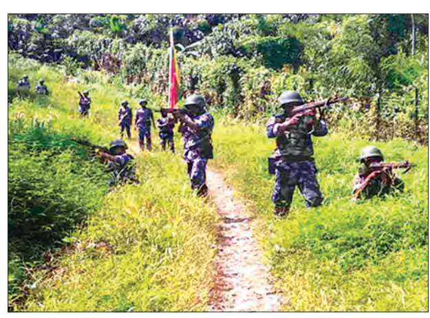
ရဲတပ်ဖွဲ့မှ အလုံရှိနေသည့် နာမည်ကြီးတရားခံပြေးအား ဖမ်းဆီးရမိ

အလားတူ နံနက် ၁၁ နာရီ ၂၅ မိနစ် မှ ၁၂ နာရီထိ မောင်တောမြို့နယ် နယ်မြေ(၁) အမှတ်(၅) နယ်ခြားစောင့်ရဲတပ်ဖွဲ့ခွဲ မှတ်တိုင်(၅၁-ခွဲ) ကင်းစခန်းမှ ဒုတိယရဲမှူး ညွှန်ကြားဦးစီးသည့် တပ်ဖွဲ့ဝင်များနှင့် ဘင်္ဂလားဒေ့ရှ်နိုင်ငံ အမှတ်(၁၁) BGB တပ်ရင်း Panchari ကင်းစခန်းမှ Naib Subedar Md. Salim Miah ဦးစီးသည့်တပ်ဖွဲ့ဝင်များ၊ စကားပြန်/လမ်းပြတို့သည် မိမိတို့နိုင်ငံ အသီးသီးအတွင်းရှိ နယ်စပ်ခြံစည်းရိုးလမ်း အတိုင်း နယ်နိမိတ်မှတ်တိုင် (၅၁/၅)မှ (၅၂)ထိ နှစ်နိုင်ငံ နှစ်ဖက်ညှိနှိုင်း၍ မြေပြင် လှည့်ကင်း ဆောင်ရွက်ခဲ့ကြောင်း သိရသည်။