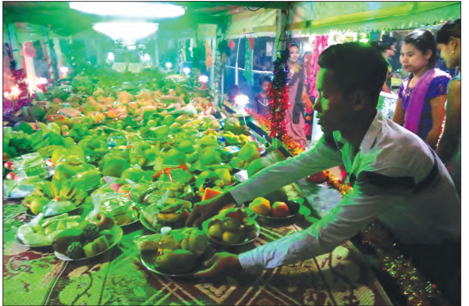
သစ်သီးနှင့် လှူဖွယ်ဝတ္ထုအမျိုးမျိုးကို လှေပေါ်တွင် တင်ဆောင်ထားစဉ်။

မွန်တိုင်းရင်းသားတို့၏ ကောင်းမွန်သော အစဉ်အလာ တစ်ရပ်ဖြစ်သည့် ဆွမ်းတော်တစ်ထောင်တင်လှူပွဲကို ရှေး ယခင်က တော်သလင်းလပြည့်နေ့ နံနက်အရုဏ်တက်ချိန်တွင် ကျင်းပခဲ့ကြပြီး ယခုနောက်ပိုင်းများတွင်မူ တော်သလင်းလဆန်း ၁၄ ရက်(အဖိတ်နေ့)ညနေပိုင်းအချိန်မှ စတင်ကျင်းပ တင်လှူ ပူဇော်လျက်ရှိကြောင်း သိရသည်။ ကိုဟိန်း(ပေါင်)