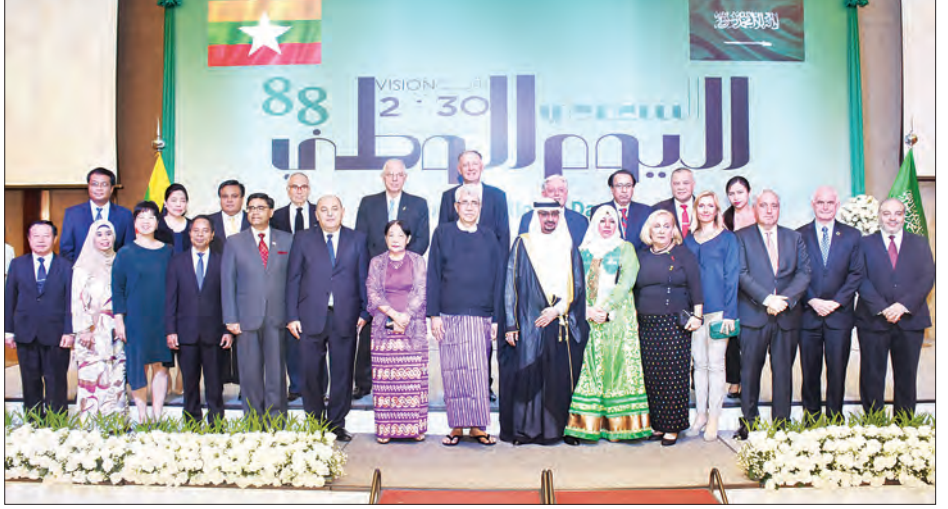
သံအမတ်ကြီးနှင့် ဇနီးတို့က ညစာစားပွဲဖြင့် တည်ခင်းဧည့်ခံသည်။ အဆိုပါ အခမ်းအနားသို့ ရန်ကုန်မြို့ နိုင်ငံခြားသံရုံးများမှ သံအမတ်ကြီးများ၊ သံရုံးယာယီတာဝန်ခံများ၊ ကုလသမဂ္ဂဆိုင်ရာ ဌာနကိုယ်စားလှယ်များနှင့် ဖိတ်ကြားထားသူများ တက်ရောက်ကြသည်။ သတင်းစဉ်