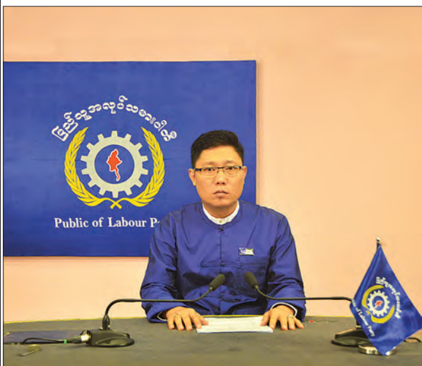
ပြည်သူ့အလုပ်သမားပါတီ ဗဟိုအလုပ်အမှုဆောင်အဖွဲ့ဥက္ကဋ္ဌ ဦးကျော်ဇင်

အဆိုပါ ဟောပြောတင်ပြချက် အပြည့်အစုံမှာ အောက်ပါအတိုင်းဖြစ်ပါသည်။