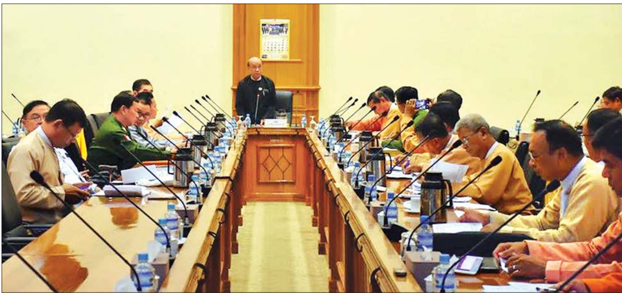
ပြည်ထောင်စုလွှတ်တော် ဥပဒေကြမ်းပူးပေါင်းကော်မတီ အစည်းအဝေးကျင်းပစဉ်။

အဆိုပါ အစည်းအဝေးသို့ ပြည်ထောင်စုလွှတ်တော် ဒုတိယနာယက၊ ဥပဒေကြမ်းပူးပေါင်းကော်မတီဥက္ကဋ္ဌ ဦးထွန်းအောင်(ခ) ဦးထွန်းထွန်းဟိန်၊ ဥပဒေကြမ်းပူးပေါင်းကော်မတီ ဒုတိယဥက္ကဋ္ဌများ၊ အတွင်းရေးမှူး၊ တွဲဖက် အတွင်းရေးမှူးနှင့် ကော်မတီဝင်များ၊ ပြည်သူ့လွှတ်တော် စိုက်ပျိုးရေး၊ မွေးမြူရေး နှင့် ကျေးလက်လူမှုဘဝ ဖွံ့ဖြိုးတိုးတက်ရေးကော်မတီ၊ အမျိုးသားလွှတ်တော် စိုက်ပျိုးရေး၊ မွေးမြူရေးနှင့် ရေလုပ်ငန်းဖွံ့ဖြိုးတိုးတက်ရေးကော်မတီနှင့် တောင်သူလယ်သမားရေးရာကော်မတီတို့မှ ဥက္ကဋ္ဌ၊ အတွင်းရေးမှူးနှင့် ကော်မတီဝင်များ၊ ပြည်ထောင်စုအစိုးရအဖွဲ့ရုံးဝန်ကြီးဌာန၊ စိုက်ပျိုးရေး၊ မွေးမြူရေးနှင့် ဆည်မြောင်းဝန်ကြီးဌာန၊ ပြည်ထောင်စုရှေ့နေချုပ်ရုံး နှင့် ပြည်ထောင်စုလွှတ်တော်ရုံးတို့မှ တာဝန်ရှိသူများ တက်ရောက်ခဲ့ကြ သည်။