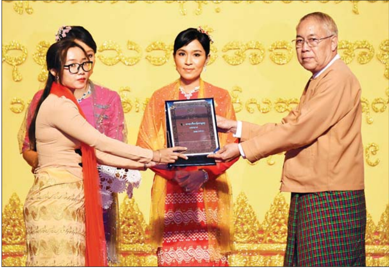
ရန်ကုန်တိုင်းဒေသကြီး လွှတ်တော်ဥက္ကဋ္ဌ ဦးတင်မောင်ထွန်း ၂၀၁၈ ခုနှစ်အတွက် စာပေဗိမာန်စာမူဆု ဝတ္ထုရှည် ဒုတိယဆုရ ယွန်းမြတ်မွန်နွယ်အား ဆုပေးအပ်ချီးမြှင့်စဉ်။ သတင်းစဉ်

ထို့နောက် ရန်ကုန်တိုင်းဒေသကြီး လွှတ်တော်ဥက္ကဋ္ဌ ဦးတင်မောင်ထွန်းက ၂၀၁၈ ခုနှစ်အတွက် စာပေဗိမာန်စာမူဆု အတွက် စာပေဗိမာန်စာမူဆု သုတပဒေသာ(ဝိဇ္ဇာ) တတိယဆုရ မောင်ခွန်နွယ်(အင်းလေး)အား ဆုပေးအပ်ချီးမြှင့်စဉ်။ သတင်းစဉ်