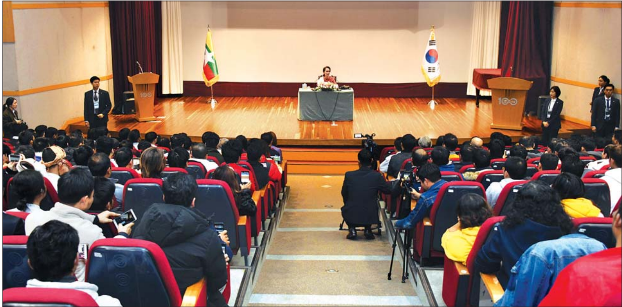
နိုင်ငံတော်၏အတိုင်ပင်ခံပုဂ္ဂိုလ် ဒေါ်အောင်ဆန်းစုကြည် ဘူဆန်မြို့ ဆာစန်းခရိုင်ခန်းမ၌ ကိုရီးယားနိုင်ငံရောက် မြန်မာနိုင်ငံသားများအား တွေ့ဆုံ သတင်းစဉ်