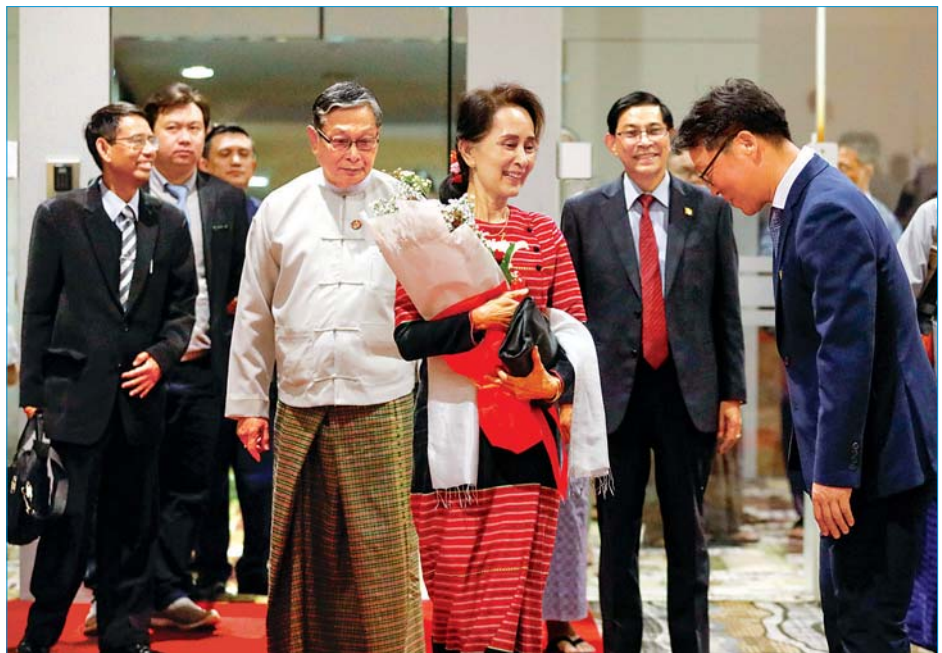
နိုင်ငံတော်၏အတိုင်ပင်ခံပုဂ္ဂိုလ် ဒေါ်အောင်ဆန်းစုကြည်အား ပြည်ထောင်စုဝန်ကြီး ဦးကျော်တင်ဆွေ၊ ကိုရီးယားသံရုံးမှ သံမှူးကြီး Mr. JUNG Yung Soo နှင့် တာဝန်ရှိသူများက ကြိုဆိုနှုတ်ဆက်စဉ်။

ဒေါ်အောင်ဆန်းစုကြည် ကိုရီးယားသမ္မတနိုင်ငံမှ နေပြည်တော်သို့ ပြန်လည်ရောက်ရှိ