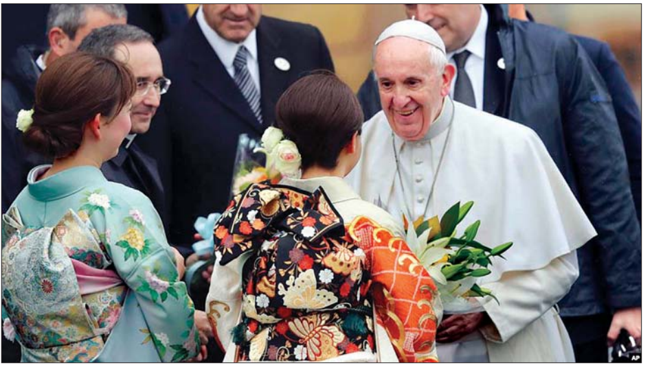
ပုပ်ရဟန်းမင်းကြီးကို နှုတ်ဆက်နေသည့် ရိုးရာဝတ်စုံဝတ်ဂျပန်အမျိုးသမီးများကို တွေ့ရစဉ်။

ဗုံးဒဏ်ခံစားခဲ့ရသော ဟိရိုရှီးမားနှင့် နာဂါဆာကီမြို့ တို့သို့ သွားရောက်ခဲ့ကာ နာဂါဆာကီမြို့တွင် နိုင်ငံရေးခေါင်းဆောင်များအား နျူကလီးယားလက်နက်များကို စွန့်လွှတ်ရန်၊ လက်နက်အပြိုင်အဆိုင်တပ်ဆင်မှုများကို စွန့်လွှတ်ရန် တိုက်တွန်းပြောကြားခဲ့ကြောင်း သိရသည်။ ထိုင်းနိုင်ငံခရီးစဉ်တွင် ဘာသာရေးယုံကြည်မှုကွဲပြားမှုများကို သည်းခံကြရန်နှင့် ငြိမ်းချမ်းရေးကို ရှေးရှုရန် ပြောကြားခဲ့သည်။ ၂၀၁၄ ခုနှစ်တွင် ပုပ်ရဟန်းမင်းကြီး ဖရန်စစ်သည် ဖိလစ်ပိုင်နှင့် သီရိလင်္ကာနိုင်ငံတို့သို့လည်းကောင်း၊ ၂၀၁၇ ခုနှစ်တွင် မြန်မာနိုင်ငံနှင့် ဘင်္ဂလားဒေ့ရှ်နိုင်ငံတို့သို့ လည်းကောင်း သွားရောက်ခဲ့သည်။ ပုပ်ရဟန်းမင်းကြီး ဖရန်စစ်သည် နှစ်ပေါင်း ၃၈ နှစ်အတွင်း ဂျပန်နိုင်ငံသို့ ပထမဆုံးလာရောက်ခဲ့သည့် ရိုမန်ကက်သလစ်ခေါင်းဆောင်တစ်ဦးဖြစ်သည်။ အင်န်အိတ်ချ်ကေ