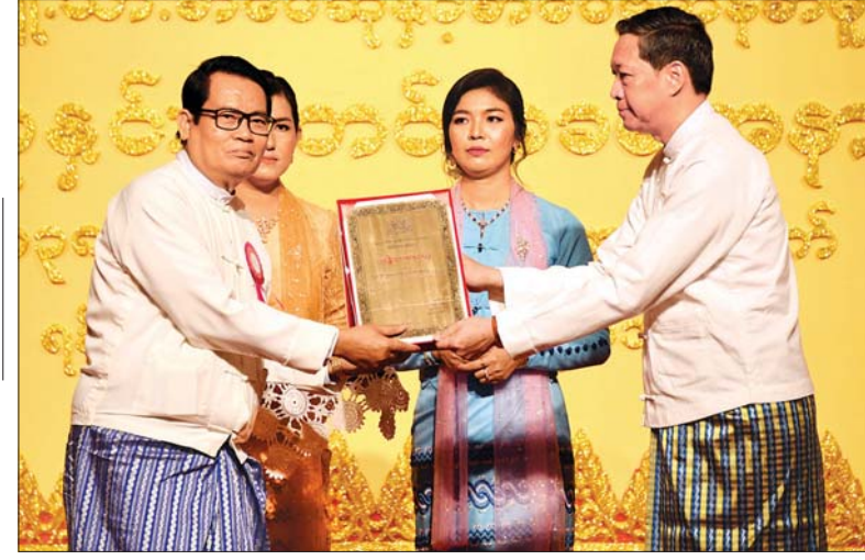
ပြည်ထောင်စုဝန်ကြီး ဒေါက်တာမျိုးသိမ်းကြီး ၂၀၁၈ ခုနှစ်အတွက် အမျိုးသားစာပေဆု ရသစာတမ်း (အက်ဆေး)ဆုရ မင်းချမ်းမွန်အား ဆုပေးအပ်ချီးမြှင့်စဉ်။