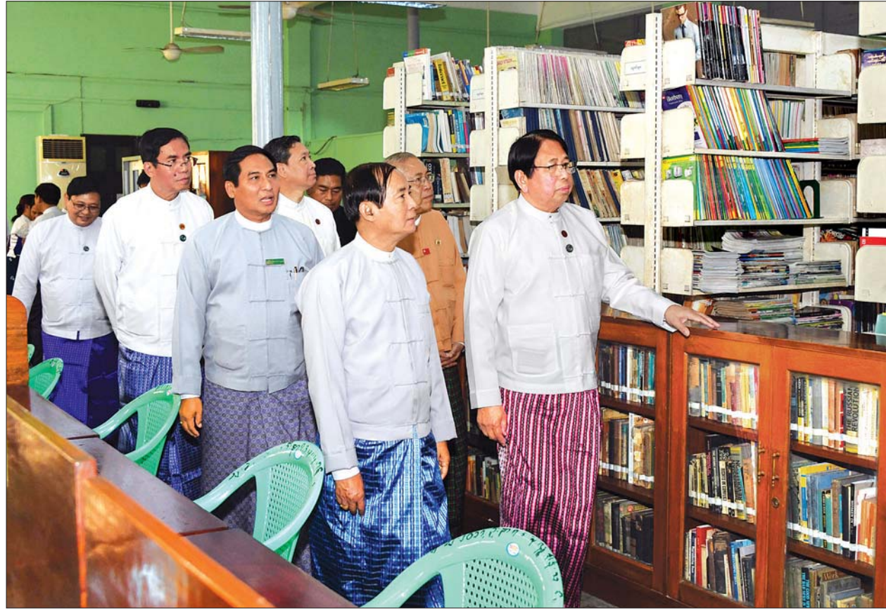
နိုင်ငံတော်သမ္မတ ဦးဝင်းမြင့် စာပေဗိမာန် ပြည်သူ့စာကြည့်တိုက်အတွင်း လှည့်လည်ကြည့်ရှုစဉ်။

စာစဉ်ထုတ်ဝေခြင်း၊ စာတမ်းဖတ်ပွဲ များ ကျင်းပခြင်းတို့နှင့် စပ်လျဉ်း၍ ရှင်းလင်းတင်ပြပြီး ပြည်ထောင်စု ဝန်ကြီး ဒေါက်တာ ဖေမြင့်က ဖြည့်စွက်ရှင်းလင်းတင်ပြသည်။