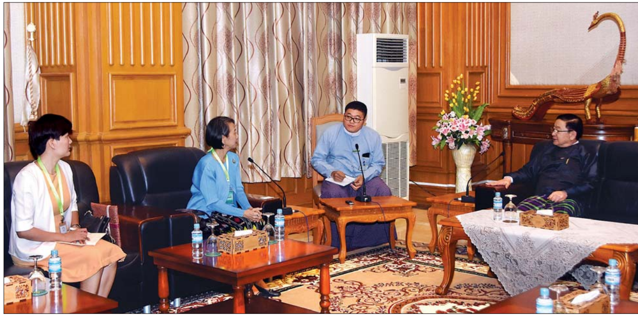
ပြည်သူ့လွှတ်တော်ဥက္ကဋ္ဌ ဦးတီခွန်မြတ် မြန်မာနိုင်ငံဆိုင်ရာ ထိုင်းနိုင်ငံ သံအမတ်ကြီး မစွစ် ဆူဖတ်သရာဆီ မိုင်သရဖိတ်ပံအား လက်ခံတွေ့ဆုံစဉ်။ သတင်းစဉ်

မြို့တွင်ကျင်းပသည့် ဒုတိယအကြိမ်အာဆီယံ-ကိုရီးယား ပြည်သူ့ဝန်ဆောင်မှု တီထွင်ပြောင်းလဲရေးဆိုင်ရာ ဝန်ကြီးအဆင့်အစည်းအဝေးနှင့် ပြည်ပအခမ်းအနားသို့ တက်ရောက်ခဲ့သည့် ပြည်ထောင်စုဝန်ကြီး ဦးမင်းသူနှင့်အဖွဲ့လည်း ပြန်လည်လိုက်ပါလာကြသည်။ သတင်းစဉ်