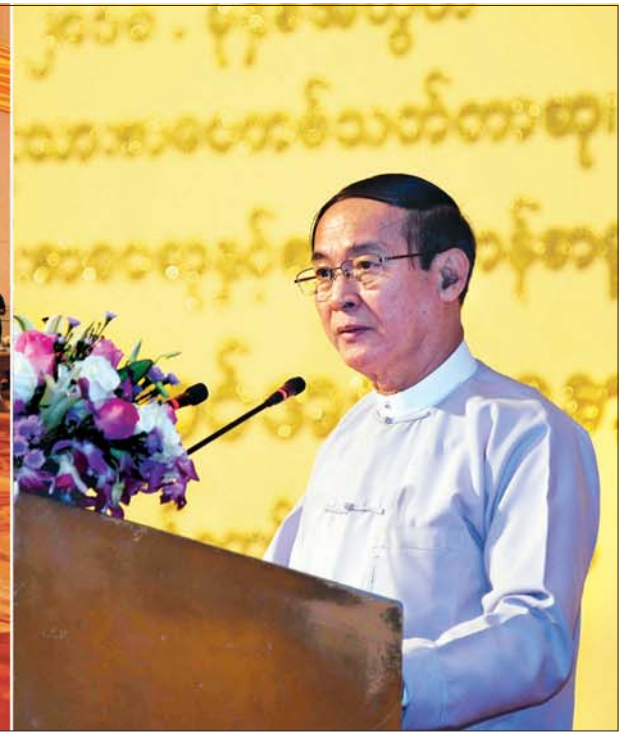
နိုင်ငံတော်သမ္မတ ဦးဝင်းမြင့် ၂၀၁၈ ခုနှစ်အတွက် အမျိုးသားစာပေတစ်သက်တာဆု၊ အမျိုးသားစာပေဆုနှင့် စာပေဗိမာန်စာမူဆုချီးမြှင့်ပွဲအခမ်းအနားတွင် မိန့်ခွန်းပြောကြားစဉ်။ သတင်းစဉ်