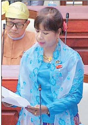
ဒုတိယဝန်ကြီး ဦးမောင်မောင်ဝင်း

ဆက်လက်၍ ကန့်ပတ်လက် မဲဆန္ဒနယ်မှ ဦးညွန့်ဝင်း၏ ကန့်ပတ်လက်မြို့နယ်တွင် လယ်ယာစိုက်ပျိုးရေးဘဏ်ခွဲတစ်ခု ဖွင့်လှစ်ပေးရန် အစီအစဉ်ရှိ မရှိ မေးခွန်းနှင့် သိရှိမဲဆန္ဒနယ်မှ ဦးစိုင်းဦးခမ်း၏ နိုင်ငံတော်တည်ဆောက်ရေးလုပ်ငန်းများအတွက် ရန်ပုံငွေတောင်းခံရာတွင် စီမံကိန်း၏ဖြစ်မြောက်နိုင်စွမ်း လေ့လာဆန်းစစ်ချက်ကို ကြိုတင်ဆောင်ရွက်ထားပြီး တို့မှ ရရှိလာသည့် Feasibility Study Report နှင့်အတူ Design, Drawing, Estimate, B.Q များပါဝင်သည့် စီမံကိန်းအဆိုပြုလွှာဖြင့် ပူးတွဲတင်ပြတောင်းဆိုခြင်းပြုနိုင်မည့် အစီအစဉ်ရှိ မရှိ မေးခွန်းနှင့်စပ်လျဉ်း၍ ဒုတိယဝန်ကြီး ဦးမောင်မောင်ဝင်းက လည်းကောင်း၊ ရွာခံမဲဆန္ဒနယ်မှ ဦးအောင်စိုးမင်း၏ ရွာခံမြို့နယ်၊ မြင်းကျဦးကျေးရွာ အုပ်စုအတွက် မီးသတ်စခန်းနှင့် မီးသတ်ယာဉ်များချထားပေးရန် အစီအစဉ်ရှိ မရှိ မေးခွန်းနှင့် လင်းခေးမဲဆန္ဒနယ်မှ ဦးစိုင်းဘသိန်း၏ လင်းခေးမြို့နယ်