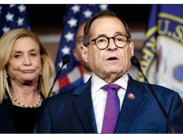
လွှတ်တော်တရားစီရင်ရေးဥက္ကဋ္ဌ နာ့ဒလာကို တွေ့ရစဉ်။

ဝါရှင်တန် နိုဝင်ဘာ ၂၇ အမေရိကန်သမ္မတဒေါ်နယ်ထရမ်၏ နောက်တစ်ဆင့် ကြားနာစစ်ဆေးမှုကို ဒီဇင်ဘာ ၄ ရက်တွင် ထပ်မံပြုလုပ်သွားမည်ဖြစ်ကြောင်း၊ ယင်းနေ့တွင် အမေရိကန်သမ္မတဒေါ်နယ်ထရမ်နှင့် ၎င်း၏ရှေ့နေကိုလည်း ဖိတ်ကြားထားကြောင်း လွှတ်တော်တရားစီရင်ရေးကော်မတီက ယမန်နေ့က ပြောကြားလိုက်သည်။ လွန်ခဲ့သော ရက်သတ္တနှစ်ပတ်ခန့်က ဒီမိုကရက်တစ်အမတ်အများစုဦးဆောင်နေသည့် အမေရိကန်အောက်လွှတ်တော်ရှိ အမတ်များက အိမ်ဖြူတော်အရာရှိများနှင့် နိုင်ငံရေးအရ အမြတ်ထုတ်ရန်ကြံရွယ်လျက် ယူကရိန်းအား စုံစမ်းစစ်ဆေးမှုများကို ဖိအားပေး လုပ်ဆောင်စေရာတွင် နိုင်ငံတော်အာဏာအလွဲသုံးစားလုပ်သည်ဟု အမေရိကန် သမ္မတထရမ်ကို စွပ်စွဲထားသော သံတမန်များအပါအဝင် သက်သေများကို လူသိရှင်ကြား မေးမြန်းမှုများ လုပ်ဆောင်ခဲ့သည်။ အဆိုပါအဆင့်ပြီးစီးခဲ့ပါက လွှတ်တော်တရားစီရင်ရေးကော်မတီဥက္ကဋ္ဌ ဂျယ်ရီနာ့ဒလာက သမ္မတထရမ်ကို စွပ်စွဲမှုနှင့်ပတ်သက်ပြီး ဥပဒေဆိုင်ရာ လုပ်ထုံးလုပ်နည်းများ ဆက်လက်လုပ်ဆောင်ရမည်ဖြစ်ပြီး လူထုကြားနာစစ်ဆေးမှုကို ဒေသစံတော်ချိန် နံနက် ၁၀ နာရီတွင် စတင်မည်ဟု ပြောခဲ့သည်။