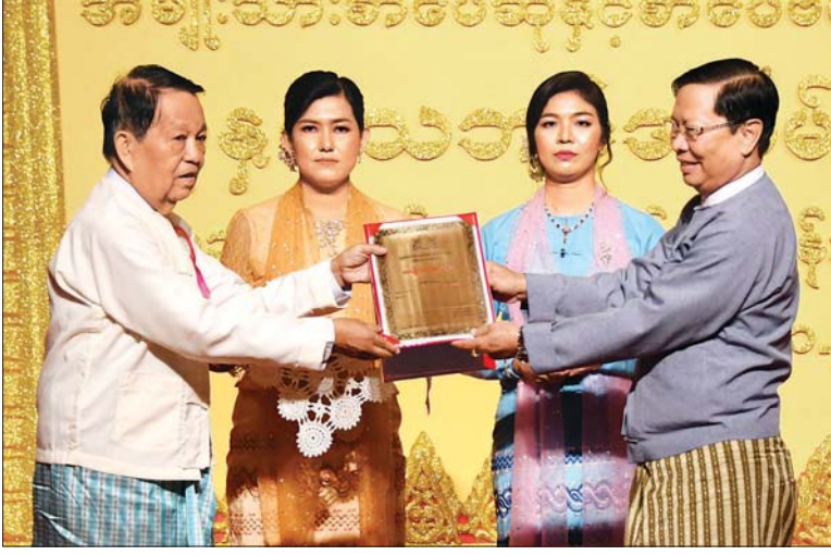
ပြည်ထောင်စုဝန်ကြီး သူရဦးအောင်ကို ၂၀၁၈ ခုနှစ်အတွက် အမျိုးသားစာပေဆု သုတပဒေသာ (ဝိဇ္ဇာ)ဆုရ မြဝင်း(ဒဿန)အား ဆုပေးအပ်ချီးမြှင့်စဉ်။