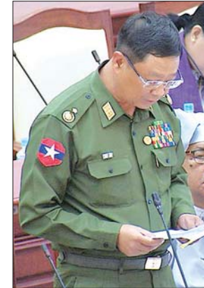
ဒုတိယဝန်ကြီး ဦးမောင်မောင်ဝင်း

ပြည်သူ့ရဲစခန်း၏ လိုအပ်ချက်ရှိသော အဆင့်စီမံကိန်းအစီအစဉ်များကို ဆောက်လုပ်ပေးရန်အစီအစဉ်အား မည်သည့်အချိန်ကာလတွင် ဆောင်ရွက်ပေးမည်ကို သိလိုခြင်းမေးခွန်းနှင့် စပ်လျဉ်း၍ ဒုတိယဝန်ကြီး ဦးမောင်မောင်ဝင်းက လည်းကောင်း ရှင်းလင်းဖြေကြားသည်။