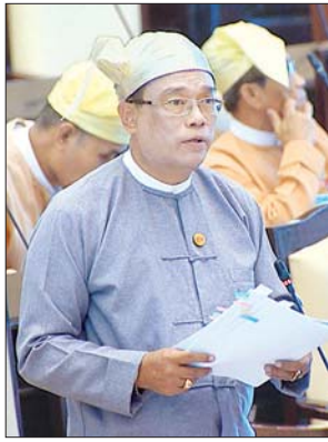
ဒုတိယဝန်ကြီး ဦးကျော်လင်း

အဆိုပါ လုပ်ငန်းစဉ်များ ဆောင်ရွက်သည့်အချိန်အတွင်း ရန်ကုန် - ပုသိမ် လမ်းမကြီးသည် ယာဉ်အစီးရေတိုးတက်များပြားလာသည့်အတွက် ရန်ကုန် တိုင်းဒေသကြီးအစိုးရအဖွဲ့ အစီအစဉ်ဖြင့် ရန်ကုန်တိုင်းဒေသကြီးအတွင်းတွင် ရှိသည့် မိုင်တိုင်အမှတ် (၅/၄) မှ (၁၇/၄)အထိ ၁၂ မိုင်ကို မူလ B.O.T စနစ် ဖြင့် အကောင်အထည်ဖော်ခဲ့သော Oriental Highway Co.,Ltd ကို တိုက်ရိုက် တာဝန်ပေးအပ်ပြီး ၄၆ ပေနှင့် ၃၆ ပေအကျယ် ကွန်ကရစ်လမ်းများအဖြစ် အဆင့်မြှင့်တင်ခြင်းလုပ်ငန်းများကို ယခုအချိန်တွင် စတင်ဆောင်ရွက်နေပြီ