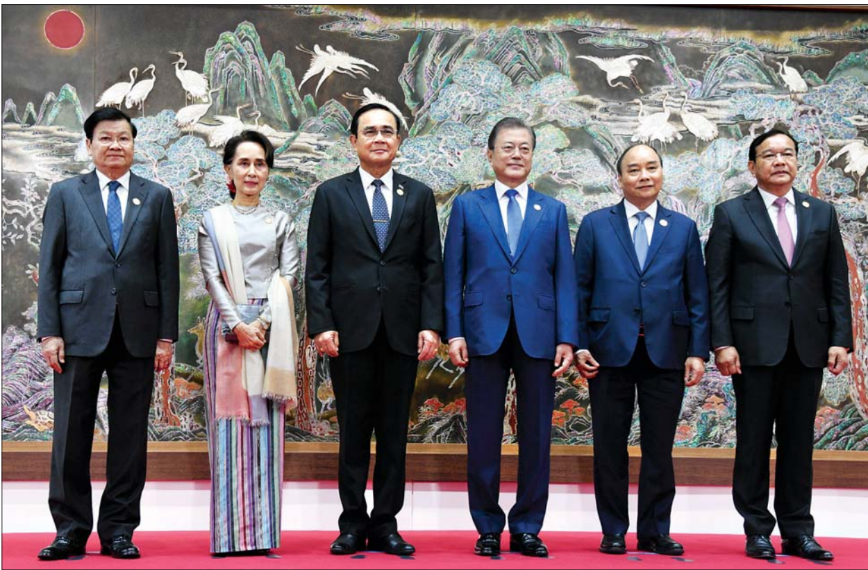
နိုင်ငံတော်၏အတိုင်ပင်ခံပုဂ္ဂိုလ် ဒေါ်အောင်ဆန်းစုကြည်၊ ကိုရီးယားသမ္မတ မစ္စတာ မွန်ဂျေအင်း၊ မဲခေါင်နိုင်ငံများမှ အစိုးရအဖွဲ့အကြီးအကဲများ မှတ်တမ်းတင်ဓာတ်ပုံရိုက်စဉ်။

များအတွက် အကျိုးဖြစ်ထွန်းစေခဲ့ပါ ကြောင်း၊ မဲခေါင်-ကိုရီးယားပူးပေါင်း ဆောင်ရွက်မှု လုပ်ငန်းစဉ်များအား ထိပ်သီးအစည်းအဝေး အဆင့်သို့ မြှင့်တင်နိုင်ခြင်းသည် မဲခေါင်- ကိုရီးယား နိုင်ငံခေါင်းဆောင်များ၏ မဲခေါင်-ကိုရီးယားပူးပေါင်းဆောင်ရွက် မှုအပေါ် အလေးအနက်ထားမှုအား ပြသခြင်းဖြစ်ပါကြောင်း၊ ကိုရီးယား နိုင်ငံ၏ New Southern Policy၊ အာဆီယံ-ကိုရီးယား ပူးပေါင်း ဆောင်ရွက်မှုနှင့် မဲခေါင်-ကိုရီးယား ပူးပေါင်းဆောင်ရွက်မှုတို့သည် တစ်ခု နှင့်တစ်ခု အပြန်အလှန်အထောက် အကူပြုနေသည့်အတွက် ဒေသတွင်း ဌာန ငြိမ်းချမ်းသာယာသော ပြည်သူ့ အခြေပြု လူမှုအသိုက်အဝန်းများ ထူထောင်ရေးအပေါ် များစွာအကျိုး ကျေးဇူးဖြစ်ထွန်းစေပါကြောင်း၊ ဇီဝ မျိုးစုံမျိုးကွဲ ထိန်းသိမ်းစောင့်ရှောက် ရေးနှင့် သဘာဝပတ်ဝန်းကျင် ထိန်းသိမ်းရေးသည် နိုင်ငံများအားလုံး အတွက် အလွန်အရေးကြီးသော လုပ်ငန်းဖြစ်သည့် အားလျော်စွာ “မဲခေါင်-ကိုရီးယား ပူးပေါင်းဆောင် ရွက်မှု ဇီဝမျိုးစုံမျိုးကွဲ ထိန်းသိမ်း