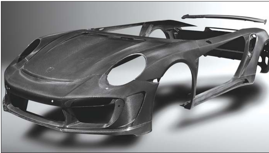
ကာဗွန်ဖိုင်ဘာကိုယ်ထည်ဖြင့် တပ်ဆင်ထုတ်လုပ်မည့် ပေါ်ရူး-၉၁၁ ဖိမ်ခံကားတစ်စီး

ထိုကာလသို့ ရောက်ရှိချိန်တွင် မော်တော်ကား ထုတ်လုပ်မှု နည်းပညာက မတိုးတက် မထွန်းကားသေးသည့်အတွက် မော်တော်ကားကိုယ်ထည်နှင့် ဖရိန်များကို လေးလံသော သံမဏိပြားများဖြင့်သာ ထုတ်လုပ်နေကြရ ဆဲဖြစ်သည်။ ပင်လယ်ရေကြောင်းသွား ရောမသင်္ဘောကြီးများကို တည်ဆောက်ရာ၌လည်း ထုထဲလွန်းသော သံမဏိပြားများကိုသာ အသုံးပြုလျက်ရှိနေကြဆဲဖြစ်သည်။