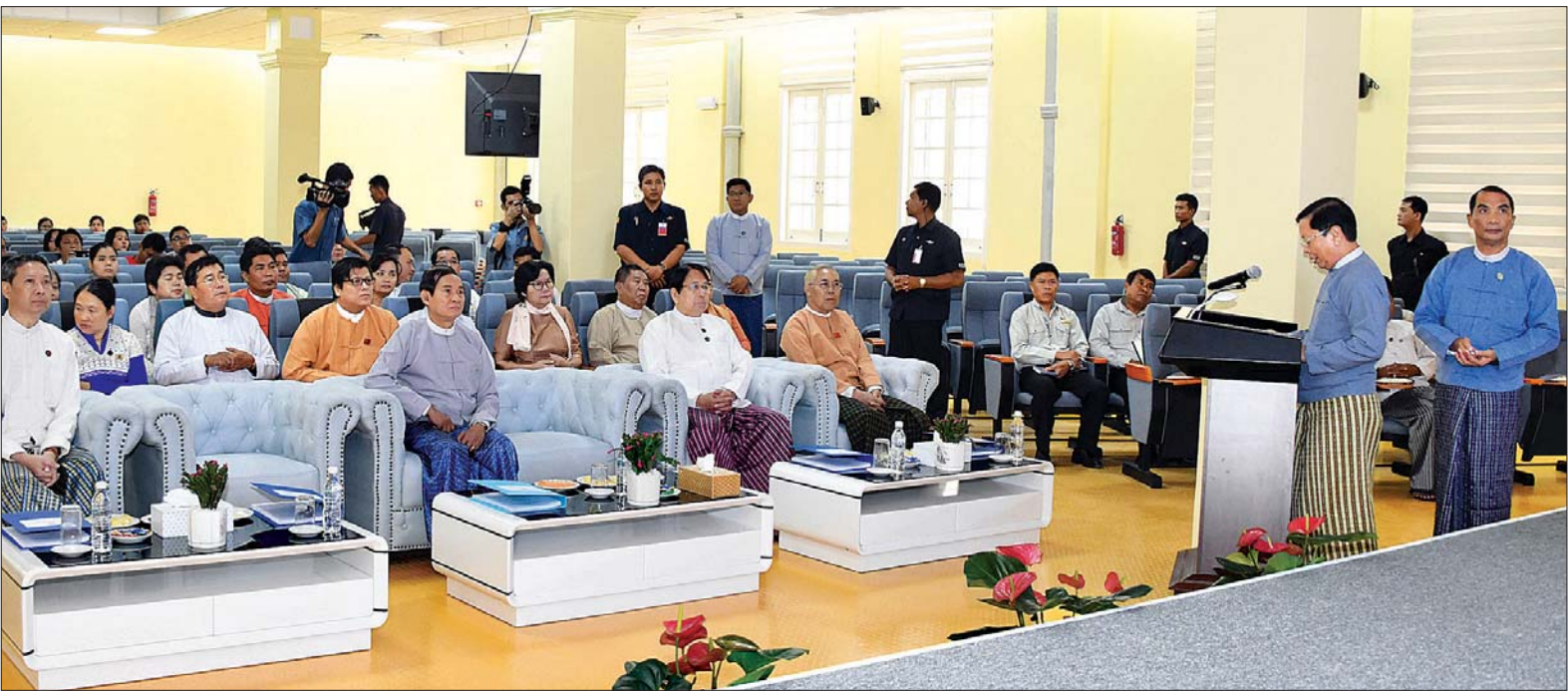
နိုင်ငံတော်သမ္မတ ဦးဝင်းမြင့် အား အမျိုးသားစာကြည့်တိုက်(ရန်ကုန်) အဆောက်အအုံ ပြင်ဆင်မွမ်းမံဆောင်ရွက်နေသည့်လုပ်ငန်းများနှင့် စပ်လျဉ်း၍ ပြည်ထောင်စုဝန်ကြီး သူရဦးအောင်ကိုက ရှင်းလင်းတင်ပြစဉ်။

ရန်ကုန် နိုဝင်ဘာ ၂၀ နိုင်ငံတော်သမ္မတ ဦးဝင်းမြင့်သည် ယနေ့ မွန်းလွဲပိုင်းတွင် ပြည်ထောင်စု ဝန်ကြီးများဖြစ်ကြသည့် ဒေါက်တာ ဖေမြင့်၊ သူရဦးအောင်ကို၊ ဒေါက်တာ မျိုးသိမ်းကြီး၊ ရန်ကုန်တိုင်းဒေသကြီး လွှတ်တော်ဥက္ကဋ္ဌ ဦးတင်မောင်ထွန်း၊ ဒုတိယဝန်ကြီး ဦးအောင်လှထွန်း၊ တိုင်းဒေသကြီးအစိုးရအဖွဲ့ ဝန်ကြီး များ၊ ဌာနဆိုင်ရာတာဝန်ရှိသူများနှင့် အတူ ရန်ကုန်မြို့ ပန်းဘဲတန်းမြို့နယ် ကုန်သည်လမ်းရှိ အမျိုးသားစာကြည့် တိုက်(ရန်ကုန်) သို့ ရောက်ရှိကြပြီး စာကြည့်တိုက်အဆောက်အအုံ ပြင်ဆင် မွမ်းမံဆောင်ရွက်ပြီးစီးမှုအခြေအနေ ကို ကြည့်ရှုစစ်ဆေးသည်။