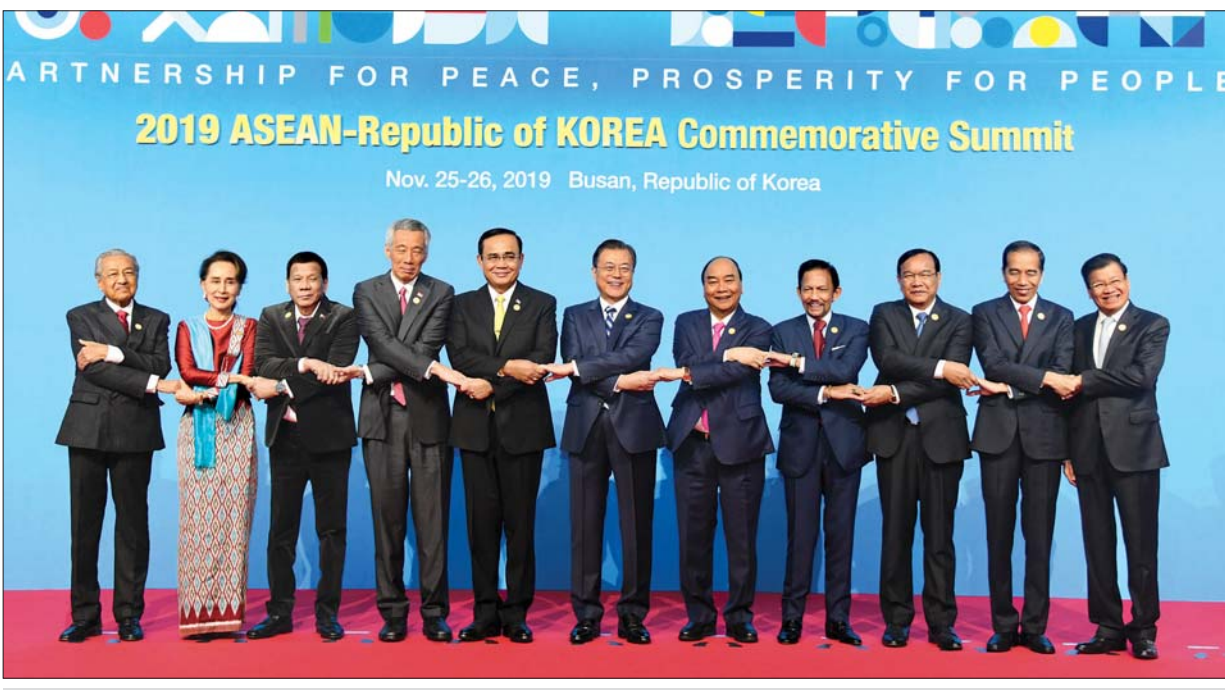
အာဆီယံ-ကိုရီးယား ဆွေးနွေးဖက်ဆက်ဆံရေး နှစ်(၃၀)ပြည့်အထိမ်းအမှတ် ထိပ်သီးအစည်းအဝေးတွင် နိုင်ငံတော်၏အတိုင်ပင်ခံပုဂ္ဂိုလ် ဒေါ်အောင်ဆန်းစုကြည်၊ ကိုရီးယားနိုင်ငံသမ္မတ မစ္စတာ မွန်ဂျေအင်း၊ အာဆီယံနိုင်ငံများမှ နိုင်ငံအကြီးအကဲများ၊ အစိုးရအဖွဲ့အကြီးအကဲများ မှတ်တမ်းတင်ဓာတ်ပုံရိုက်စဉ်။

ဆက်လက်၍ နိုင်ငံတော်၏အတိုင်ပင်ခံပုဂ္ဂိုလ်သည် Nurimaru APEC House တွင် ကျင်းပသော ကိုရီးယားကျွန်းဆွယ်တည်ငြိမ်အေးချမ်းရေးနှင့် သာယာဝပြောရေးကိစ္စရပ်များကို ဆွေးနွေးသည့် ခေါင်းဆောင်များ၏ သီးသန့်နေ့လယ်စာစားပွဲသို့ တက်ရောက်ခဲ့သည်။