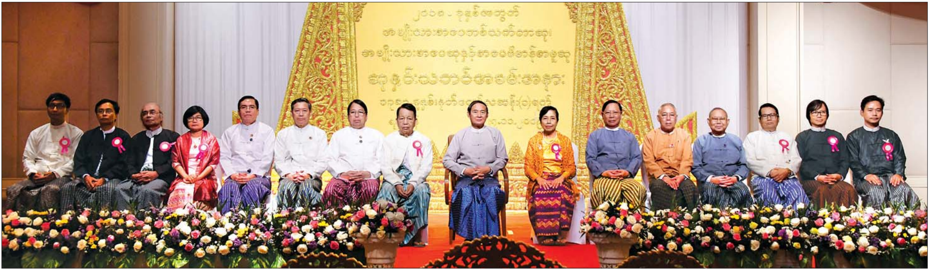
နိုင်ငံတော်သမ္မတ ဦးဝင်းမြင့်၊ ပြည်ထောင်စုဝန်ကြီးများ၊ ရန်ကုန်တိုင်းဒေသကြီး လွှတ်တော်ဥက္ကဋ္ဌ ဒုတိယဝန်ကြီး၊ ရန်ကုန်တိုင်းဒေသကြီး စီမံကိန်းနှင့် ဘဏ္ဍာရေးဝန်ကြီးတို့ အမျိုးသားစာပေဆုရ ပုဂ္ဂိုလ်များနှင့် စုပေါင်းမှတ်တမ်းတင် ဓာတ်ပုံရိုက်စဉ်။