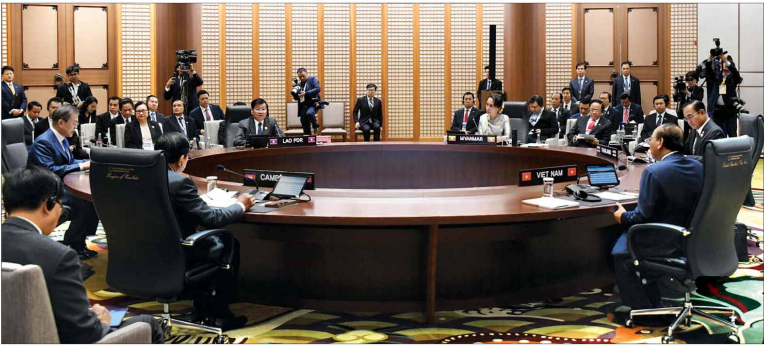
ပထမအကြိမ် မဲခေါင် - ကိုရီးယား ထိပ်သီးအစည်းအဝေး ကျင်းပစဉ်။

မဲခေါင် - ကိုရီးယား ပူးပေါင်း ဆောင်ရွက်မှု အထောက်အကူပြု ယင်းနောက် နိုင်ငံတော်၏ အတိုင်ပင်ခံပုဂ္ဂိုလ်သည် ပထမအကြိမ် မဲခေါင်-ကိုရီးယား ထိပ်သီးအစည်း အဝေးသို့တက်ရောက်ပြီး ၂၀၁၁ ခုနှစ် က စတင်ခဲ့သည့် မဲခေါင်-ကိုရီးယား ပူးပေါင်းဆောင်ရွက်မှုမှာ အောင်မြင် မှုများရရှိခဲ့ပြီး မဲခေါင်ဒေသ ပြည်သူ