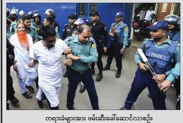
တရားရုံးများအား ဖမ်းဆီးခေါ်ဆောင်လာစဉ်။

ဒါကာကော်ဖီဆိုင်တွင် အကြမ်းဖက်တိုက်ခိုက်ခဲ့သည့် စစ်သွေးကြော့ခုနစ်ဦးကို ဘင်္ဂလားဒေ့ရှ် သေဒဏ်ပေး ဒါကာ နိုဝင်ဘာ ၂၇ ၂၀၀၆ခုနှစ်က အနောက်နိုင်ငံသားများဖြင့် စည်ကားသည့် ဒါကာကော်ဖီဆိုင်တွင် အကြမ်းဖက်တိုက်ခိုက်ခဲ့မှုဖြင့် အစ္စလာမ္မစ် အစွန်းရောက် စစ်သွေးကြော့ခုနစ်ဦးကို ဘင်္ဂလားဒေ့ရှ် တရားရုံးက သေဒဏ်ချမှတ်လိုက်သည်။ ဒါကာကော်ဖီဆိုင် အကြမ်းဖက်တိုက်ခိုက်ခံရမှုတွင် နိုင်ငံခြားသားများ အပါအဝင်လူ ၂၂ ဦးအထိ သေဆုံးခဲ့သည်။ အကြမ်းဖက်ဆန့်ကျင်တိုက်ဖျက်ရေး အဖွဲ့ခွဲ သမာဓိအဖွဲ့သည် မြို့တော်ဒါကာရှိ တရားရုံးပရိသတ်အလယ်၌ အဆိုပါဖြစ်ရပ်ကို စီရင်ချက်ကို ချမှတ်လိုက်ပြီး တရားသူကြီး မိုဂျီဘာရာမန်က တိုက်ခိုက်မှု ကျူးလွန်သူများသည် အိုင်အက်စ်အစွန်းရောက်စစ်သွေးကြော့ အဖွဲ့၏ အာရုံစိုက်မှုရရန် ဆန္ဒရှိနေကြောင်း ပြောကြားခဲ့သည်။ ဖြစ်မှုကျူးလွန်ခဲ့ကြသူများသည် အများပြည်သူ၏ ဘေးကင်းလုံခြုံမှုကို ပျက်စီးစေပြီး မင်းမဲ့စရိုက်ဆန်အောင်ဖန်တီးခဲ့ကာ ဂျီဟတ်စစ်သွေးကြော့တိုင်းပြည်တစ်ခု ထူထောင်ချင်နေကြသူများဖြစ်ကြောင်း ပြောကြားခဲ့ပြီး အဆိုပါစစ်သွေးကြော့ခုနစ်ဦးကို မသေမချင်း ကြိုးပေးသတ်ခံရမည်ဖြစ်ကြောင်း ပြောကြားခဲ့သည်။ တရားရုံးများကို ဖမ်းဆီးခံရခြင်းဖြင့် ၎င်းတို့ထံမှ အချို့သည် ရိုကား တစ်စီးပေါ်သို့မတက်မီ အကြီးမြတ်ဆုံးဘုရားသခင်၊ အစ္စလာမစ်တို့၏ ကိုးကွယ်ယုံကြည်မှု အစွန့်ရှည်ပါစေ စသည်ဖြင့် ရွတ်ဆိုအော်ဟစ်ခဲ့ကြကြောင်း သိရသည်။ အေအက်ဖ်ပီ