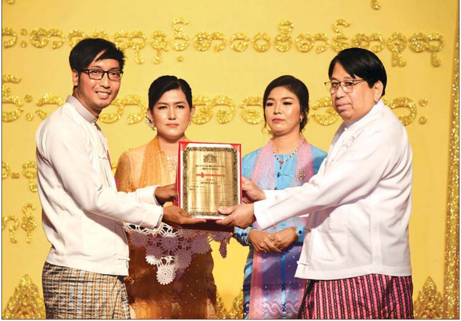
ပြည်ထောင်စုဝန်ကြီး ဒေါက်တာဖေမြင့် ၂၀၁၈ ခုနှစ်အတွက် အမျိုးသားစာပေဆု ဝတ္ထုတိုဆုရ မြစ်ကျိုးအင်း အား ဆုပေးအပ်ချီးမြှင့်စဉ်။ သတင်းစဉ်

“စာကောင်းပေမွန်များသည် ရတနာထက် ပိုမိုတန်ဖိုးရှိပြီး ပညာဗဟုသုတနှင့် ဉာဏ်အမြော်အမြင်တို့၏ ပင်မအရင်းအမြစ် ဖြစ်သလို ယင်းအကြားအမြင် ဗဟုသုတတို့သည်ပင်လျှင် ဘဝ အတွက် ခွန်အားများဖြစ်ပါကြောင်း၊ ဘဝခရီးတွင် အကြားအမြင် ဗဟုသုတမရှိဘဲ လုံ့လစိုက်ထုတ်နေခြင်းသည် အလင်းရောင်မပါဘဲ လျှောက်လှမ်းနေခြင်းသာ ဖြစ်ပါကြောင်း၊ စာဖတ်ခြင်းသည်လည်း ဘဝအတွက် အတွေ့အကြုံများ၊ သင်ခန်းစာများကို လေ့လာသင်ယူ နေခြင်းပင် ဖြစ်ပါကြောင်း၊ ယင်းအတွေ့အကြုံများ၊ သင်ခန်းစာများ ကို ရယူကျင့်သုံးတတ်ပါက စာဖတ်သူများအတွက် ဘဝ၏ လမ်းပြ မြေပုံကောင်းတစ်ခုဖြစ်ပါကြောင်း၊ စာဖတ်ခြင်းက အသိပညာ ရစေပြီး လက်တွေ့လိုက်နာကျင့်သုံးခြင်းက အတတ်ပညာကို ဖြစ်စေပါကြောင်း၊ ထိုအသိပညာနှင့် အတတ်ပညာကို ဟန်ချက်ညီ စွာ အသုံးပြုပြီး ဘဝခရီးတွင် မယိုင်မလဲအောင် လျှောက်လှမ်းနိုင် ပါကြောင်း၊ စာဖတ်ခြင်းက ဦးနှောက်အာဟာရငတ်စေပါကြောင်း၊ ကမ္ဘာလောကကို မျက်ခြည်ပြတ်စေပါကြောင်း၊ လူတိုင်း စာကောင်း ပေမွန်များကို ဖတ်လာသည်နှင့်အမျှ မြန်မာ့လူ့အဖွဲ့အစည်း၏ တန်ဖိုးသည်လည်း ပိုမိုမြင့်မားလာမည်ဖြစ်ပါကြောင်း”