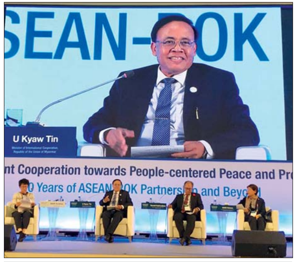
ပြည်ထောင်စုဝန်ကြီး ဦးကျော်တင် “ပြည်သူကို ဗဟိုပြုသည့် ပြည်ပဖွံ့ဖြိုးရေးအကူအညီ” ခေါင်းစဉ်ဖြင့် ပြုလုပ်သည့် ဆွေးနွေးပွဲတွင် ပါဝင်ဆွေးနွေးစဉ်။

ထို့နောက် နိုင်ငံတော်၏အတိုင်ပင်ခံပုဂ္ဂိုလ်သည် Exhibition Centre II, BEXCO ၌ ကျင်းပသည့် ASEAN-ROK CEO Summit တွင် “New Partnership for Co-Prosperity of Korea and ASEAN Businesses” ခေါင်းစဉ်ဖြင့် ဆွေးနွေးပြောကြားပြီး၊ ညနေပိုင်းတွင် Cruise Grand Ballroom, Hilton Busan ၌ ကိုရီးယားသမ္မတနိုင်ငံ သမ္မတ မစ္စတာ မွန်ဂျေအင်းက အာဆီယံ နိုင်ငံခေါင်းဆောင်များအား တည်ခင်းသည့် ကြိုဆိုဂုဏ်ပြုညစာစားပွဲသို့ တက်ရောက်ခဲ့သည်။