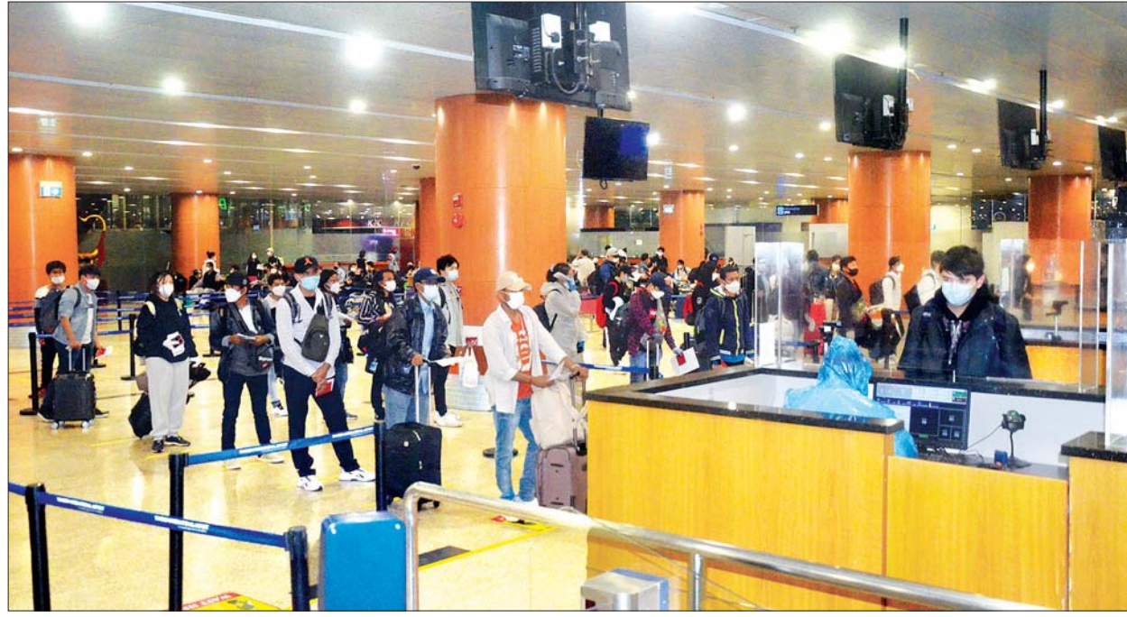
ဌာနများ၊ သက်ဆိုင်ရာနိုင်ငံများရှိ မြန်မာသံရုံးများနှင့် ပူးပေါင်းညှိနှိုင်း ဆောင်ရွက်ပေးခဲ့ရာ ယနေ့အချိန်ထိ မြန်မာနိုင်ငံသား စုစုပေါင်း ၃၃၅၆ ဦးအား မြန်မာနိုင်ငံသို့ ပြန်လည်ခေါ်ဆောင်ပေးခဲ့ပြီးဖြစ်ကြောင်း နိုင်ငံခြားရေးဝန်ကြီးဌာနမှ သိရှိရသည်။ သတင်းစဉ်

ပြည်ပနိုင်ငံများတွင် အခက်အခဲကြုံတွေ့နေရသည့် မြန်မာနိုင်ငံသားများအား ပြန်လည်ခေါ်ဆောင်ရန် Coronavirus Disease 2019(COVID-19) ကာကွယ်၊ ထိန်းချုပ်၊ ကုသရေး အမျိုးသားအဆင့် ဗဟိုကော်မတီ၏ လမ်းညွှန်ချက်နှင့်အညီ ကယ်ဆယ်ရေးလေယာဉ်များ၊ အထူးလေယာဉ်များဖြင့် ပြန်လည်ခေါ်ဆောင်ပေးနိုင်ရေးအတွက် နိုင်ငံခြားရေးဝန်ကြီးဌာနအနေဖြင့် သက်ဆိုင်ရာ ဝန်ကြီး