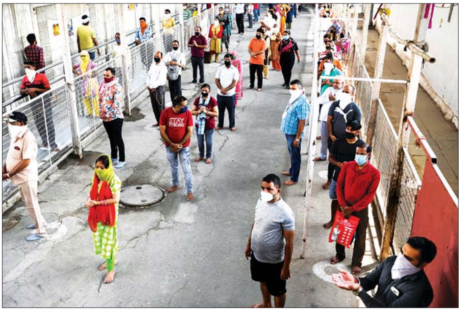
ဘုရားရှိခိုးကျောင်းသို့ မဝင်ရောက်မီ တန်းစီစောင့်ဆိုင်းနေကြသည့် ဘုရားဖူးများကို တွေ့ရစဉ်။