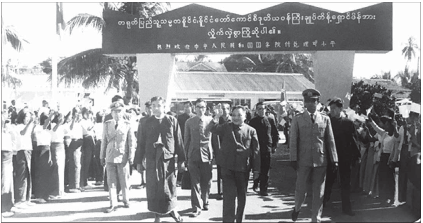
၁၉၇၈ ခုနှစ် ဇန်နဝါရီလ ၃၀ ရက်နေ့တွင် မြန်မာနိုင်ငံသို့လာရောက်လည်ပတ်နေသော ဒုတိယဝန်ကြီးချုပ် တိန်ရှောင်မိန့် ငပလီသို့ သွားရောက်လည်ပတ်ချိန်တွင် ဒေသခံပြည်သူ များက လှိုက်လှဲစွာလှည့် လှိုက်ဆက်စဉ်။

နှစ်နိုင်ငံဆက်ဆံရေး၏ ထူးခြားသော ဝိသေသလက္ခဏာ နှစ်နိုင်ငံအကြား သံတမန်ဆက်ဆံရေးထူထောင်ခဲ့ပြီး နောက် နှစ်နိုင်ငံခေါင်းဆောင်များနှင့် အစိုးရအဖွဲ့အကြီး အကဲများအကြား ချစ်ကြည်ရေးခရီးစဉ်များနှင့် အလုပ် သဘော ချစ်ကြည်ရေးခရီးစဉ်များ ကြိမ်ဖန်များစွာ အပြန် အလှန် သွားရောက်ခဲ့ကြခြင်းဖြင့် ခိုင်မာကောင်းမွန်သည့် ဆက်ဆံရေးအခြေခံကောင်းများ ချမှတ်နိုင်ခဲ့ကြပါသည်။ ထိုအစဉ်အလာကောင်းအား ခေတ်အဆက်ဆက်မှ ယခု အချိန်အထိပင် ဆက်လက်ဖော်ဆောင်လျက်ရှိနေပါသည်။ အပြန်အလှန်ခရီးစဉ်များ သွားရောက်ကြခြင်းဖြင့် နှစ်နိုင်ငံ အကြား ကဏ္ဍပေါင်းစုံပူးပေါင်းဆောင်ရွက်မှု၊ ချစ်ကြည် ရင်းနှီးမှု၊ တန်းတူရည်တူရှိမှုနှင့် အပြန်အလှန်နားလည် မှုများကို ဆတတ်ထမ်းပိုး ပိုမိုတိုးတက် ဖြစ်ထွန်းစေခဲ့ပြီး အပြန်အလှန် ချစ်ကြည်ရေးခရီးစဉ်များ သွားရောက်ကြ ခြင်းသည် နှစ်နိုင်ငံဆက်ဆံရေးတွင် ထူးခြားသည့် ဝိသေသလက္ခဏာဟု ဆိုနိုင်ပါသည်။ ခေတ်အဆက်ဆက် တွင် နှစ်ဖက်ခေါင်းဆောင်များ၏ အပြန်အလှန်ခရီးစဉ် များမှတစ်ဆင့် အစဉ်အလာဆက်ဆံရေးကို မြှင့်တင် ပုံဖော်သွားနိုင်ခဲ့ကြပါသည်။