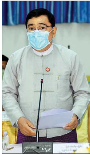
ပြည်ထောင်စုဝန်ကြီး ဒေါက်တာဝင်းမြတ်အေး