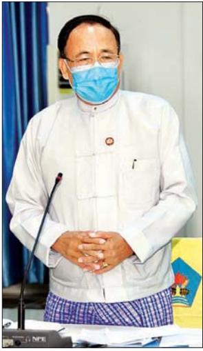
ပြည်ထောင်စုဝန်ကြီး ဦးကျော်တင်