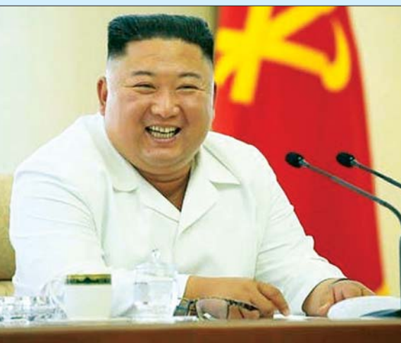
မြောက်ကိုရီးယားခေါင်းဆောင် ကင်ဂျုံအန်း