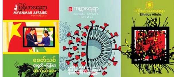
မြန်မာရေးရာလေ့လာရေးအဖွဲ့

မြန်မာရေးရာ လေ့လာရေးအဖွဲ့က ထုတ်ဝေသည့် မြန်မာရေးရာ၊ တိုင်းရင်း သားရေးရာ၊ ကမ္ဘာ့ရေးရာစာစောင်များကို တစ်အုပ်တစ်ဖိုး ကျပ် ၃၀၀၀ ဖြင့် စာဖတ်သူများထံ ရောင်းချပေးနေပါသည်။ Wave Money စနစ်ဖြင့် ဖုန်းနံပါတ် ၀၉-၄၅၀၁၂၄၇၆ ကို မှာယူနိုင်ပါသည်။