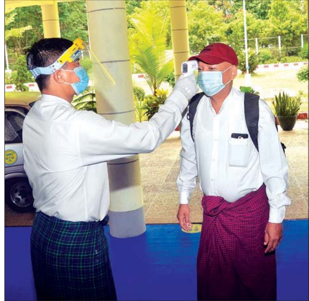
သတင်းစာရှင်းလင်းပွဲ ပြုလုပ်သည့် ပြန်ကြားရေးဝန်ကြီးဌာန ဝန်ကြီးရုံးတွင် ကိုဗစ်-၁၉ ကာကွယ်ထိန်းချုပ်ရေးဆိုင်ရာများနှင့်အညီ ဆောင်ရွက်ထားသည်ကို တွေ့ရစဉ်။