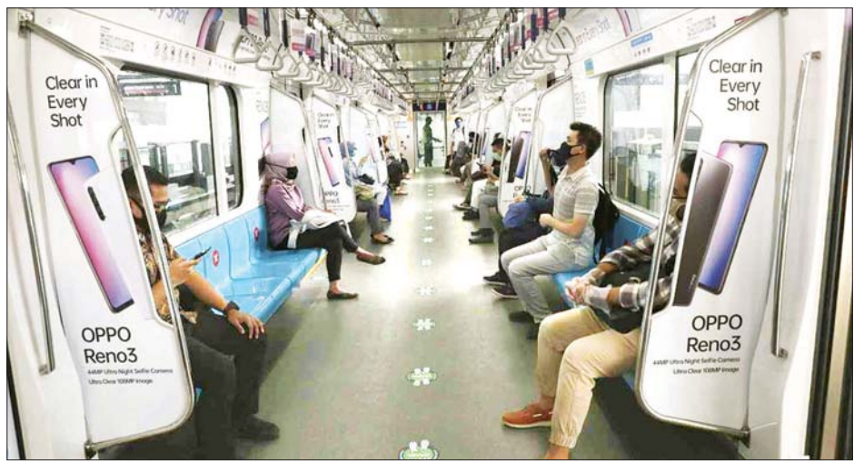
အများပြည်သူသယ်ယူပို့ဆောင်ရေးယာဉ်ပေါ်တွင် စီးနင်းလိုက်ပါကြသည့် အင်ဒိုနီးရှားပြည်သူများကို တွေ့ရစဉ်။