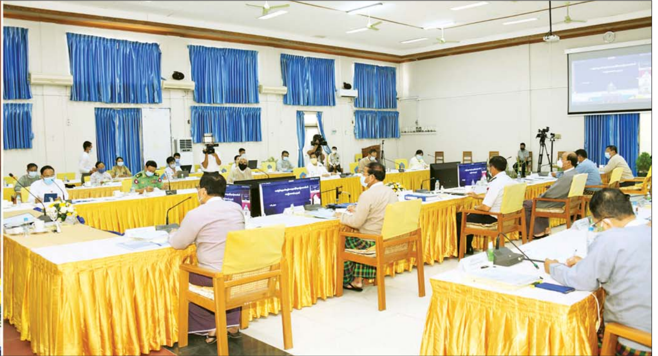
ဒုတိယသမ္မတ ဦးဟင်နရီဗန်ထီးယူ မသန်စွမ်းသူများ၏ အခွင့်အရေးများဆိုင်ရာ အမျိုးသားကော်မတီအစည်းအဝေး(၁/၂၀၂၀)တွင် အမှာစကားပြောကြားစဉ်။