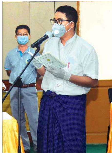
သတင်းမီဒီယာများမှ တက်ရောက်သူတစ်ဦး မေးမြန်းစဉ်။

လျှပ်စစ်ကဏ္ဍဆိုင်ရာ တိုးတက်ဆောင်ရွက်နေမှုများ အနေဖြင့် ၂၀၁၉ - ၂၀၂၀ တွင် လျှပ်စစ်စွမ်းအင်အရင်းအမြစ် ပါဝင်မှုအချိုးအစားများနှင့် ဓာတ်အားသုံးစွဲမှုများသည်