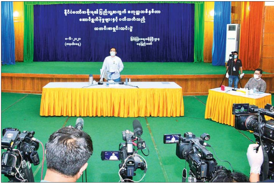
ဒုတိယဝန်ကြီး ဦးအောင်လှထွန်း နိုင်ငံတော်အစိုးရ၏ ပြည်သူ့အတွက် စတုတ္ထ(၁)နှစ်တာ ဆောင်ရွက်ချက်များနှင့် ပတ်သက်သည့် သတင်းစာရှင်းလင်းပွဲတွင် အမှာစကားပြောကြားစဉ်။

ထို့နောက် ပြည်ထောင်စုစာရင်းစစ်ချုပ်ရုံး၏ ပြည်သူ့အတွက် စတုတ္ထ (၁) နှစ်တာကာလအတွင်း ဆောင်ရွက်ခဲ့မှုနှင့်စပ်လျဉ်း၍ ပြည်ထောင်စုစာရင်းစစ်ချုပ် ဦးမော်သန်းက ပြည်ထောင်စု စာရင်းစစ်ချုပ်ရုံးသည် နိုင်ငံ၏ အမြင့်ဆုံးသော စာရင်းနှင့် လုပ်ငန်းစစ်ဆေးသည့် အဖွဲ့အစည်းဖြစ်ကြောင်း၊ ပြည်ထောင်စုစာရင်းစစ်ချုပ်ဥပဒေပါ အုပ်နှင်းထားသည့် တာဝန်များကို ကျေပွန်စွာထမ်းဆောင်ရာ၌ စစ်ဆေးရေးလုပ်ငန်းများ စွမ်းဆောင်ရည်ပြည့်ဝစွာ ဆောင်ရွက်နိုင်ရေးနှင့် ပြောင်းလဲလာသော ခေတ်စနစ်နှင့်အညီ သတင်းအချက်အလက် နည်းပညာ ဖွံ့ဖြိုးတိုးတက်မှုကို အသုံးပြုသော ခေတ်စစ်စစ်ဆေးရေး နည်းပညာများဖြင့် လုပ်ငန်းတာဝန်များကို ထမ်းဆောင်နိုင်ရေးတို့အတွက် ရုံး၏ ဖွဲ့စည်းပုံကို ပြင်ဆင်ဖွဲ့စည်းထားပြီးဖြစ်ကြောင်း၊ လက်ရှိစစ်ဆေးရေးသော အစိုးရဌာနအဖွဲ့အစည်း အရေအတွက်အနေဖြင့် ရုံးချုပ်အဆင့်တွင် ၁၉၀၊ တိုင်းဒေသကြီး/