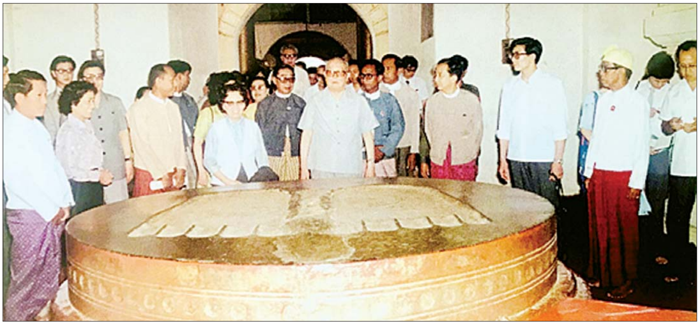
၁၉၈၅ ခုနှစ် မတ်လ ၈ ရက်နေ့တွင် တရုတ်နိုင်ငံသမ္မတ Li Xiannian နှင့် ဇနီး Lin Jiamei တို့ ပုဂံမြို့ရှိ အာနန္ဒာစေတီသို့ သွားရောက်လေ့လာခဲ့စဉ်။

ရှိရင်းစွဲချစ်ကြည်ရင်းနှီးမှုနှင့် ဆွေမျိုးပေါက်ဖော် ဆက်ဆံရေးကို ပိုမိုခိုင်မာစေရန် ဘက်စုံမဟာဗျူဟာ မြောက် ပူးပေါင်းဆောင်ရွက်ရေးမိတ်ဖက်နိုင်ငံများအဆင့် အားမြှင့်တင်သွားကာ နှစ်နိုင်ငံအကျိုးရှိပြီး သာတူညီမျှ