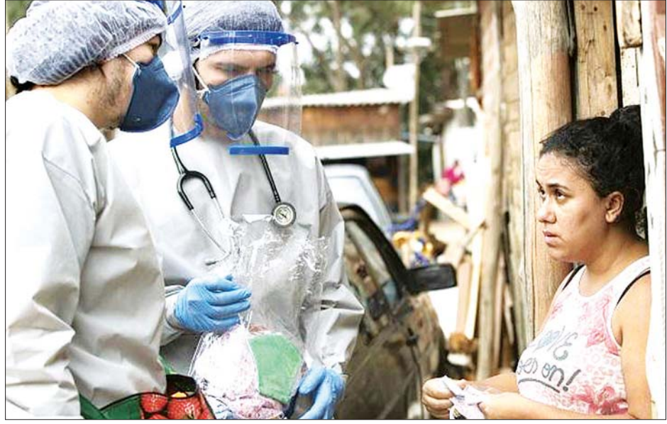
ကျန်းမာရေးဝန်ထမ်းများ ဆော်ပိုလိုမြို့တွင် ကိုဗစ်-၁၉ကာကွယ်ရေးများ လုပ်ဆောင်နေစဉ်။