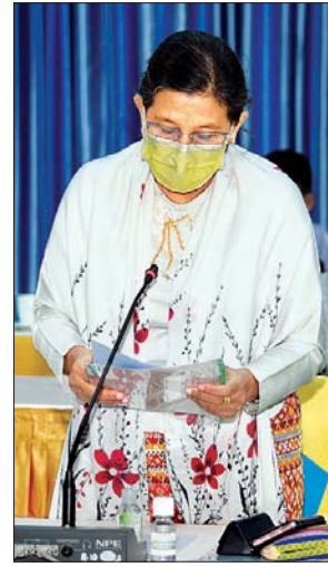
ဒုတိယဝန်ကြီး ဒေါက်တာမြလေးစိန်