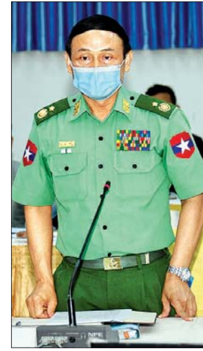
ဒုတိယဝန်ကြီး ဗိုလ်ချုပ် စိုးတင်နိုင်