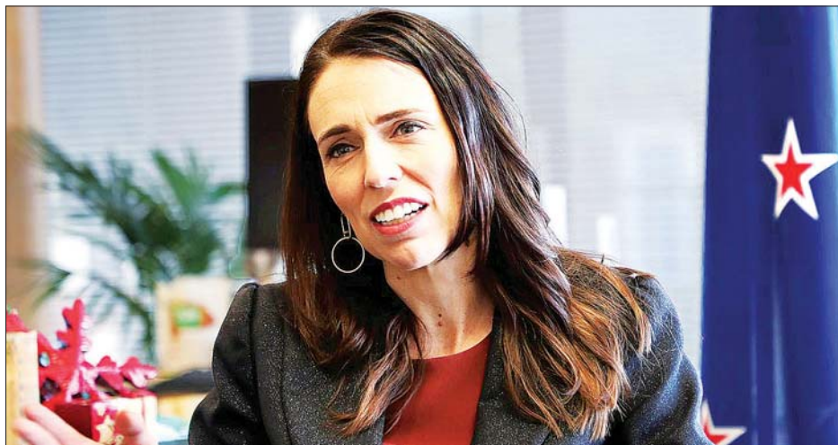
နယူးဇီလန်ဝန်ကြီးချုပ် ဂျက်ဆင်ဒါအာဒန်။

သို့ရာတွင် ကိုဗစ်-၁၉ ကပ်ရောဂါ၏ခြိမ်းခြောက်မှု ကမ္ဘာတစ်ဝန်းတွင် ဆက်လက်ရှိနေဆဲဖြစ်ပြီး နယူးဇီလန် ၌လည်း ရှိနေသေးကြောင်း အာဒန်က ပြောကြားသည်။ အင်န်အိတ်ချ်ကေ