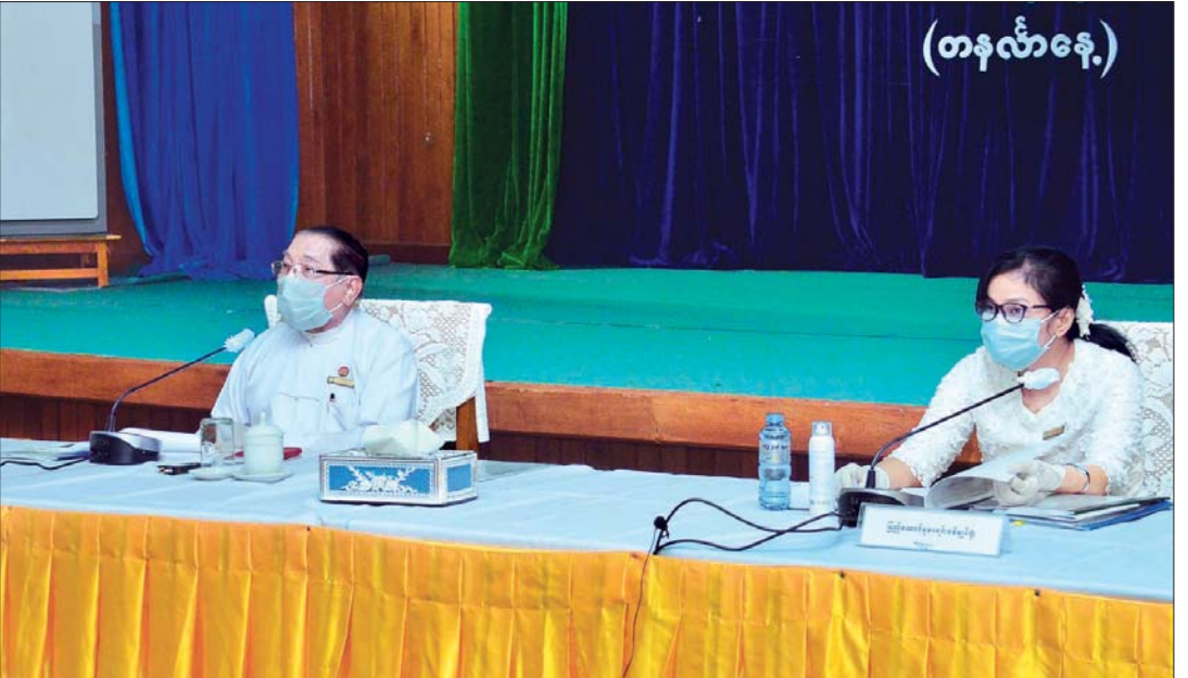
ပြည်ထောင်စုစာရင်းစစ်ချုပ်ရုံး၏ ပြည်သူ့အတွက် စတုတ္ထ(၁)နှစ်တာ ဆောင်ရွက်ချက်များနှင့်ပတ်သက်၍ ပြည်ထောင်စုစာရင်းစစ်ချုပ် ဦးမော်သန်း ရှင်းလင်းပြောကြားစဉ်။