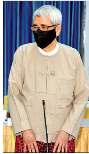
ဒုတိယဝန်ကြီး ဦးကျော်မျိုး