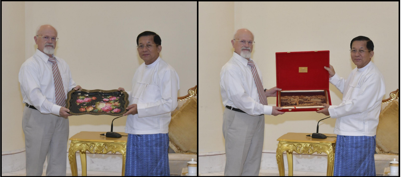
国管委主席、俄罗斯-缅甸友好合作协会总理、副主席交换纪念礼物