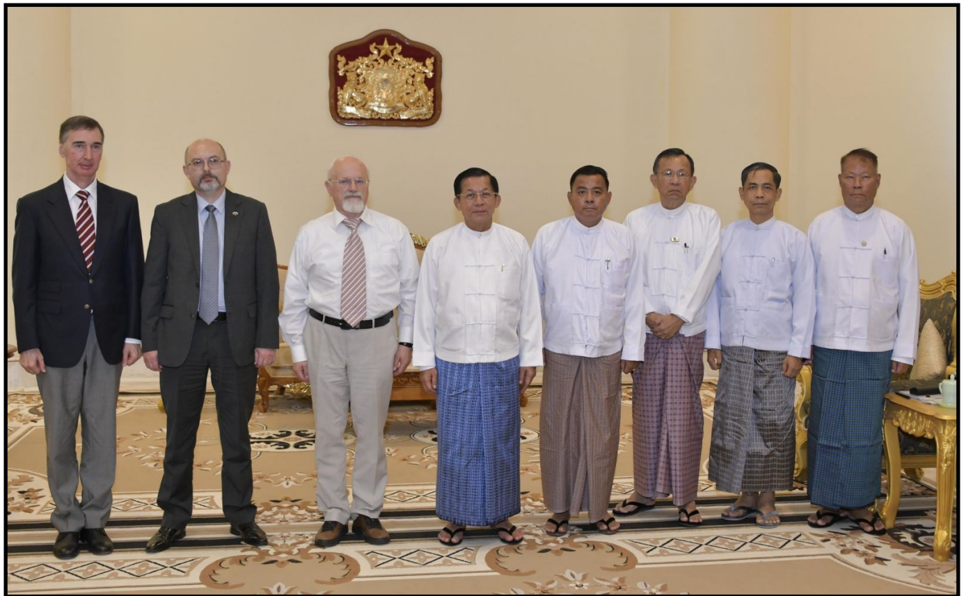
国管委主席、总理敏昂莱大将和俄罗斯-缅甸友好合作协会副主席率领的代表团合影留念