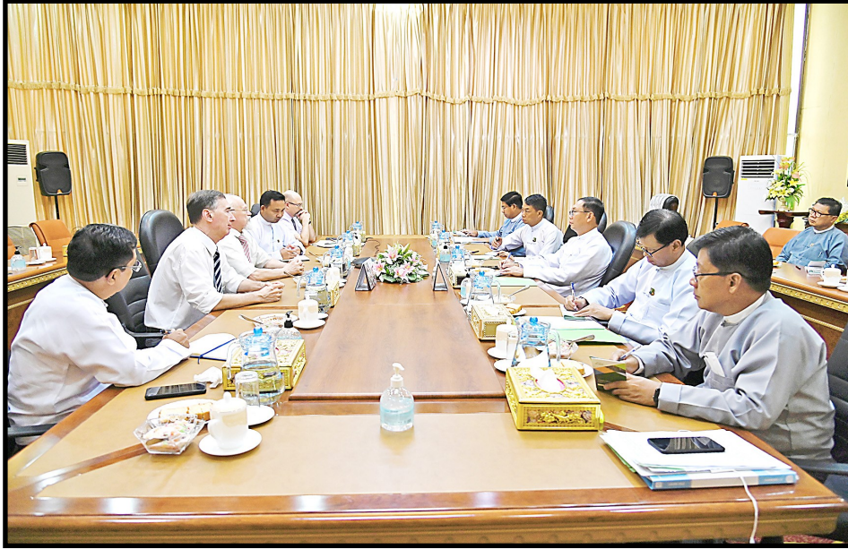
联邦部长吴钦貌意一接见由俄罗斯-缅甸友好合作协会高级副主席率领的代表团