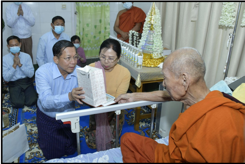
国管委主席兼国家总理及其夫人为八莫高僧提供药品、营养食品和现金作为九项先决条件