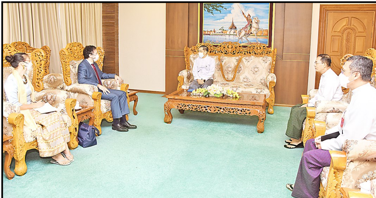
联邦部长吴哥哥莱接见红十字会与红新月会国际联合会（IFRC）亚太地区主任