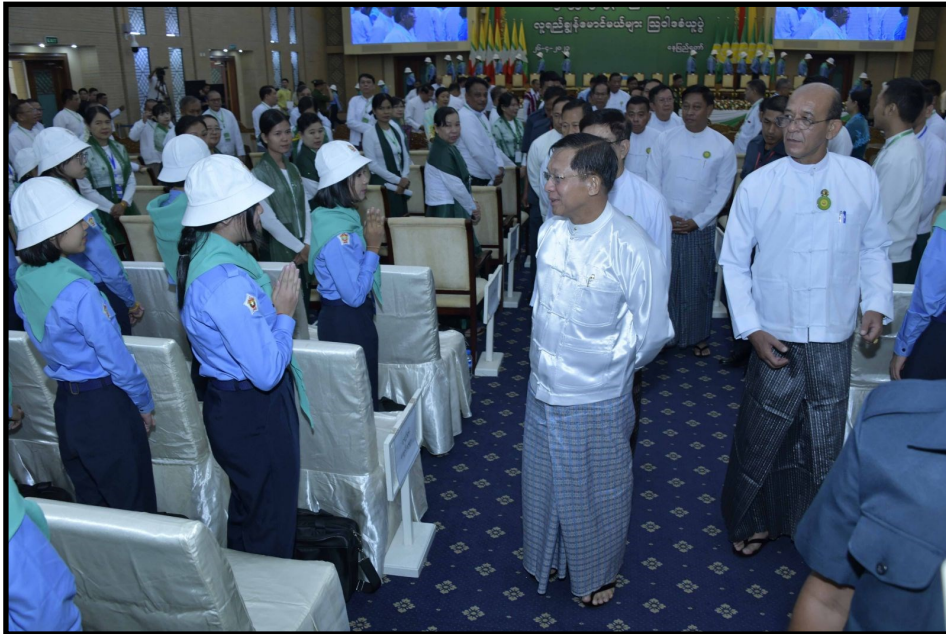
国管委主席兼国家总理亲切问候优秀学生