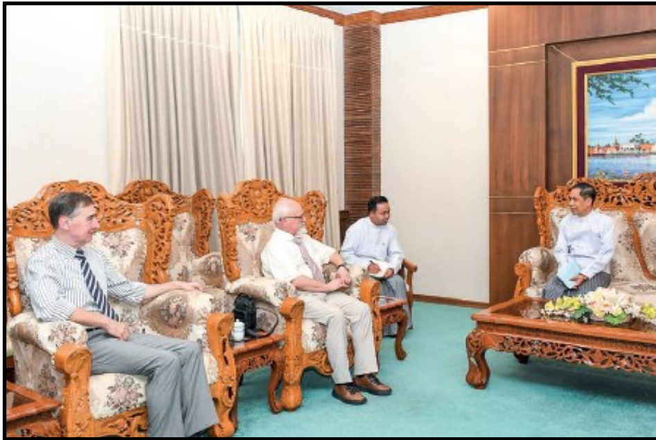
联邦部长吴哥哥莱接待由俄罗斯-缅甸友好合作协会高级副主席率领的代表团