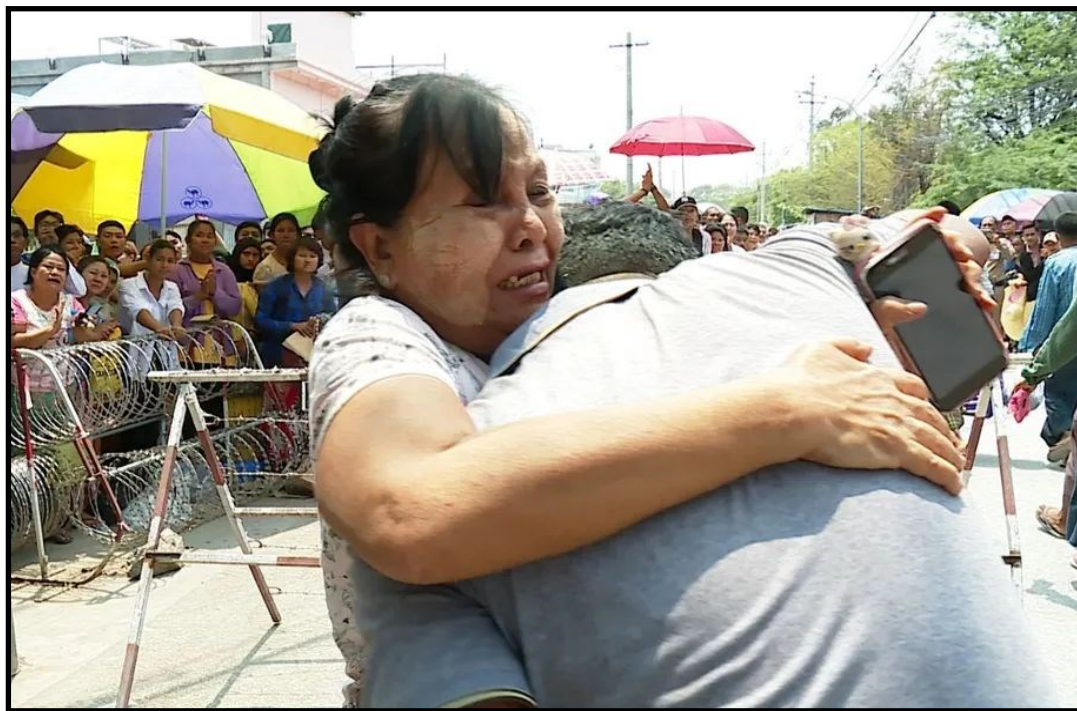
曼德勒省奥博监狱