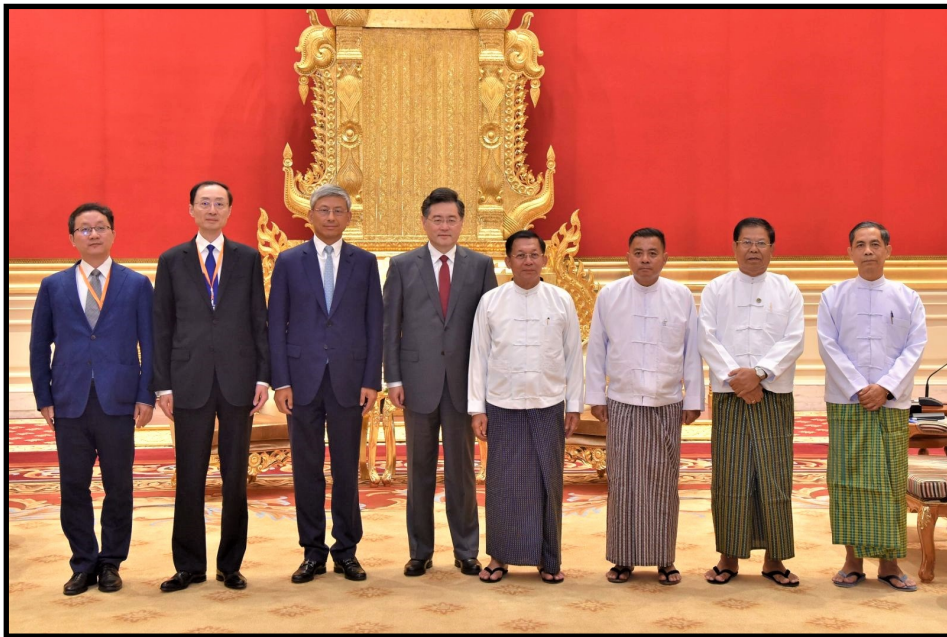
国管委主席兼国家总理敏昂莱大将、中华人民共和国国务委员、外交部长秦刚先生阁下合影留念