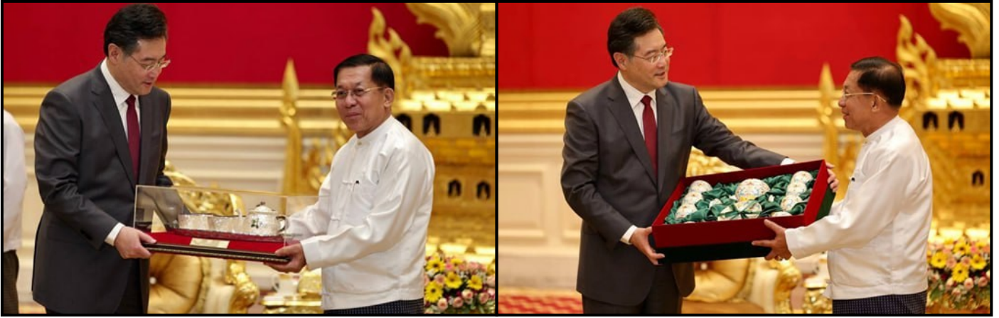
国管委主席兼国家总理敏昂莱大将和外交部长交换了纪念礼物