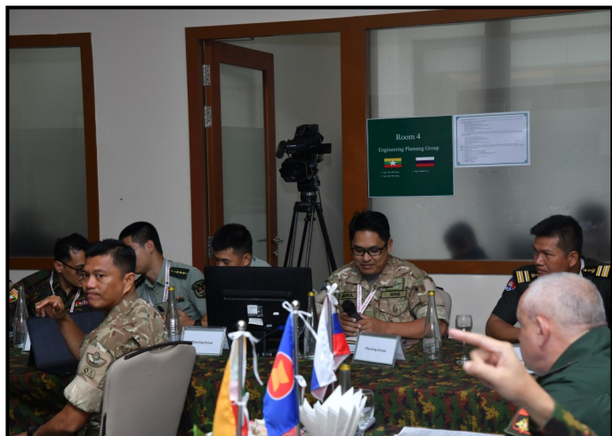
文莱的与会者进行讨论