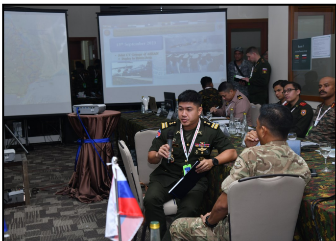
柬埔寨的与会者进行讨论