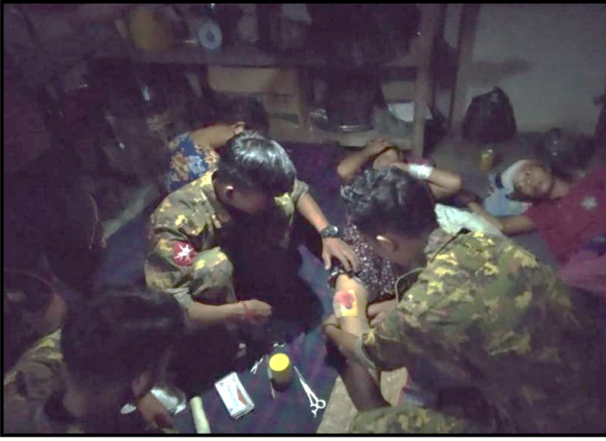
在重型武器爆炸中受伤的无辜平民正在接受治疗