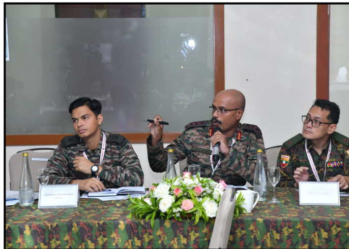
印度的与会者进行讨论