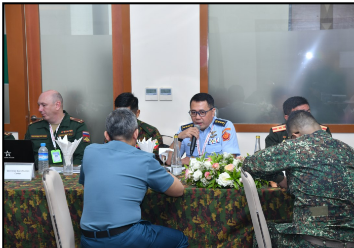
印度尼西亚的与会者进行讨论