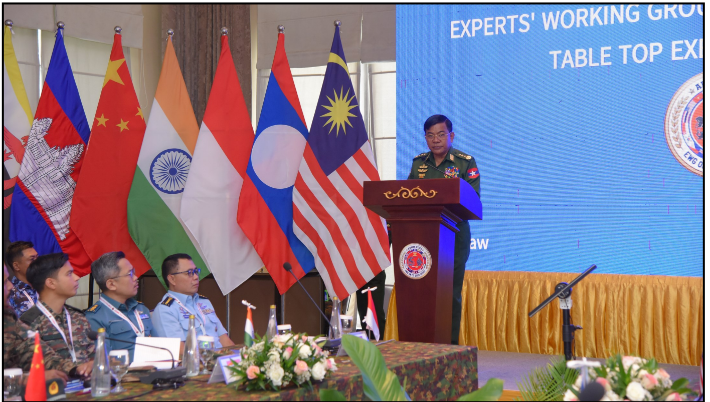
总参谋长（陆军、海军和空军）貌貌埃上将在ADMM Plus反恐专家工作组（EWG on CT）桌面演习开幕式上致开幕词