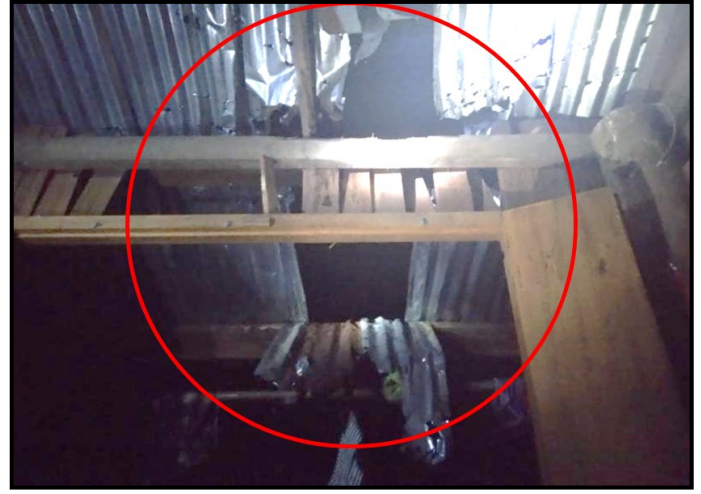
一栋住宅在重型武器爆炸中受损