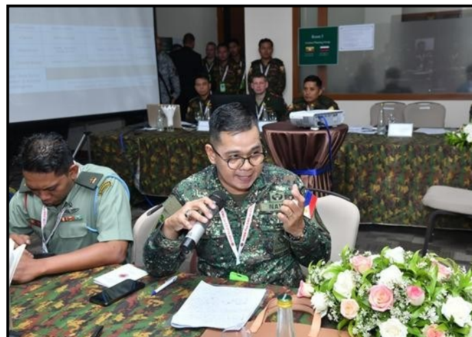
菲律宾的与会者进行讨论