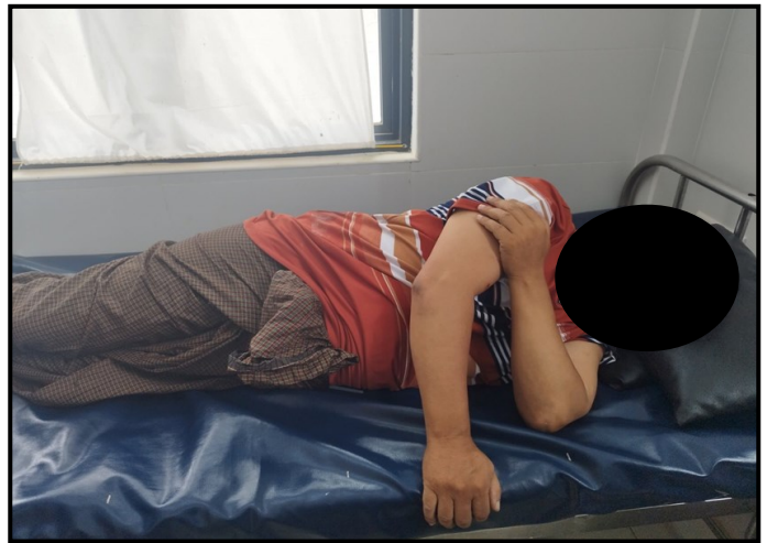
因民地武TNLA成员的袭击导致部门工作人员受伤

8月6日，TNLA成员乘车抵达北掸邦皎梅镇（1）街区的街区管理员办公室，向办公室扔了一枚手榴弹，然后向办公室发射了小武器并驾车离开。在袭击中，两名办公室工作人员死亡，另有五名工作人员受伤。