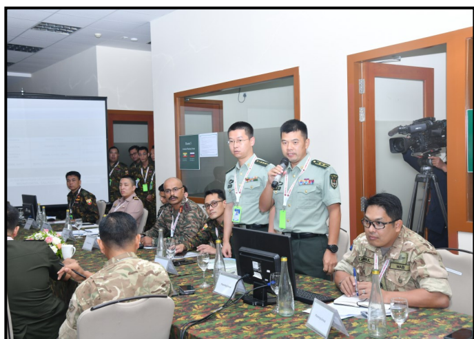
中华人民共和国的参与者 进行讨论