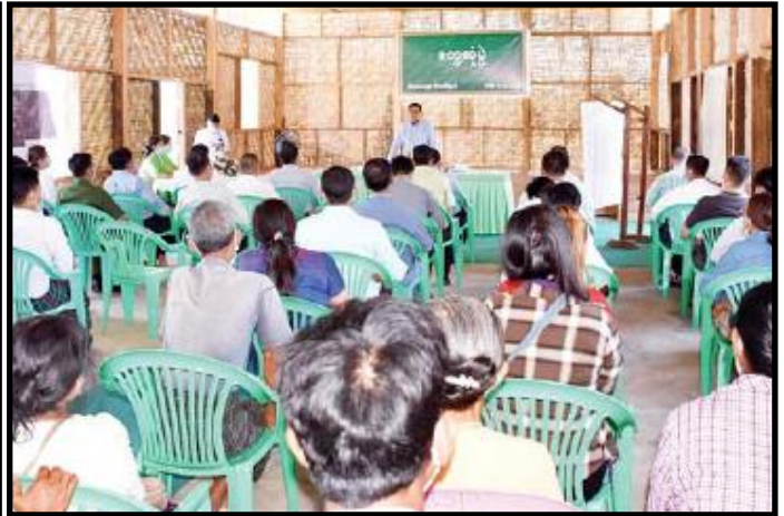
ကချင်ပြည်နယ်