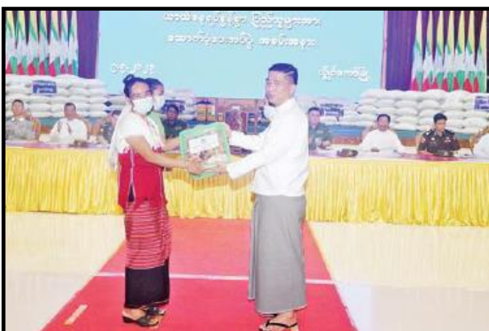
ကယားပြည်နယ်