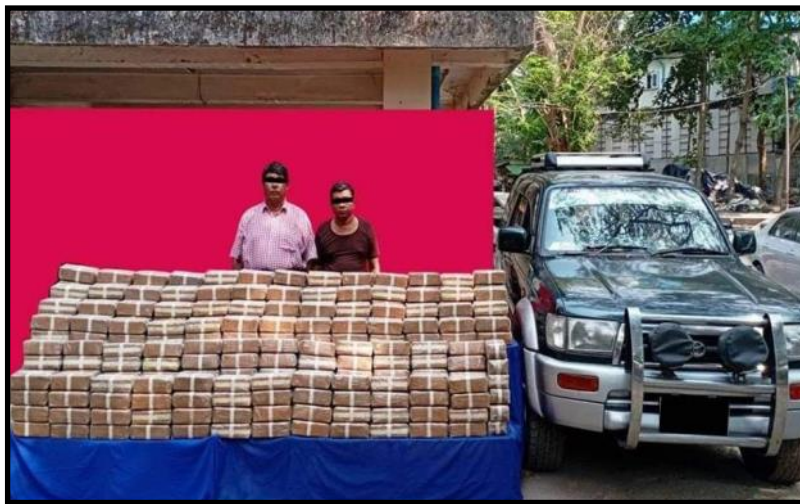
လှိုင်နှင့် မရမ်းကုန်းမြို့နယ်တို့တွင် ငွေကျပ် ၃ ဒသမ ၂ ဘီလီယံတန်ဖိုးရှိ စိတ်ကြွရူးသွပ်ဆေးပြားများအား တရားခံများနှင့်အတူ ဖမ်းဆီးရမိမှု