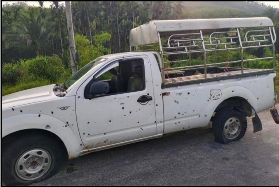
PDF အမည်ခံအကြမ်းဖက်သမားများက လက်လုပ်မိုင်းဖြင့် ဖောက်ခွဲတိုက်ခိုက်ခဲ့သည့် ခရီးသည်တင်မော်တော်ယာဉ်

သတင်းထုတ်ပြန်ခဲ့ပါသည်။ အဆိုပါလုပ်ရပ်များအား NUG/ PDF များ လုပ်ဆောင်နေသည်ကိုသိသည့် ဒေသခံပြည်သူများ အနေဖြင့် ၎င်းတို့အား ရွံရှာမုန်းတီးလျက်ရှိပါသည်။