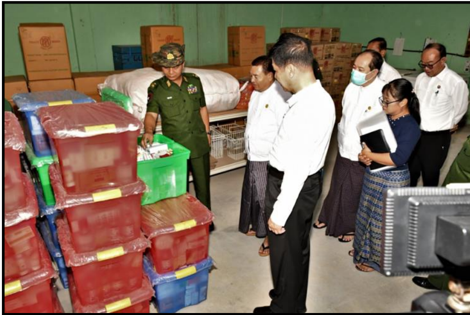
မန္တလေးတိုင်းဒေသကြီးဝန်ကြီးချုပ်နှင့် အလယ်ပိုင်းတိုင်းစစ်ဌာနချုပ် တိုင်းမှူးတို့က မန္တလေးတိုင်းဒေသကြီး၊ သဘာဝဘေးအန္တရာယ်ဆိုင်ရာ ဆေးဝါးနှင့် ဆေးပစ္စည်းများ သိုလှောင်ထားရှိမှုများကို ကြည့်ရှုစစ်ဆေးနေမှု

တပ်ဖွဲ့ဝင်များ၊ ကြက်ခြေနီတပ်ဖွဲ့ဝင်များ၊ ပရဟိတအဖွဲ့များနှင့်အတူ ဇာတ်တိုက်လေ့ကျင့်မှုများဆောင်ရွက်ခဲ့။