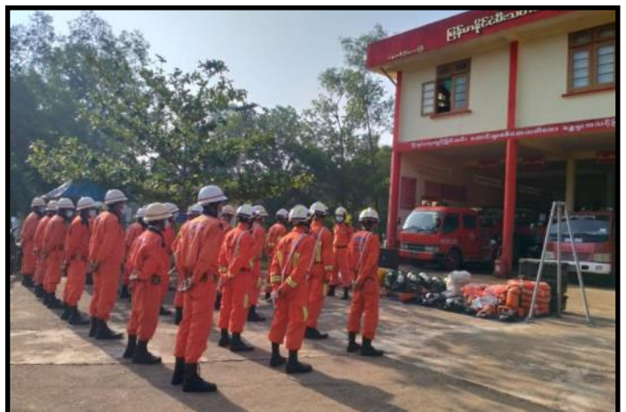
လောင်းလုံးမြို့နယ်၌ သဘာဝဘေးအန္တရာယ် ကူညီကယ်ဆယ်နိုင်ရေးအတွက် ကယ်ဆယ်ရေးပစ္စည်းများထားရှိမှု