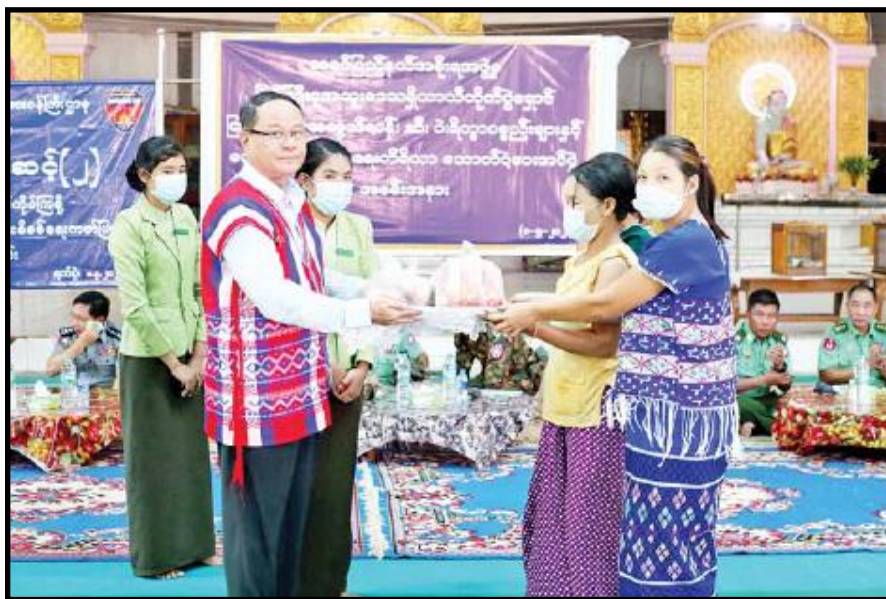
ကရင်ပြည်နယ်