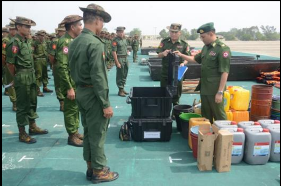
နေပြည်တော်တိုင်းစစ်ဌာနချုပ်တိုင်းမှူးက တပ်မတော်သားများ သဘာဝဘေးအန္တရာယ်ကြိုတင်ကာကွယ်ဖတ်တိုက်လေ့ကျင့်နေမှုအား ကြည့်ရှုစစ်ဆေးနေမှု

ဘင်္ဂလားပင်လယ်အော်အရှေ့တောင်ပိုင်းနှင့် ကပ္ပလီ ပင်လယ်ပြင်တောင်ပိုင်းတွင် ဖြစ်ပေါ်လျက်ရှိသည့် လေဖိအား နည်းရပ်ဝန်းသည် တဖြည်းဖြည်းအားကောင်းလာကာ ဆိုင် ကလုန်းမုန်တိုင်းအဖြစ်သို့ ရောက်ရှိလာနိုင်ပြီး မြန်မာနိုင်ငံ ဘက်သို့ ဝင်ရောက်နိုင်သည့် အခြေအနေရှိသဖြင့် မုန်တိုင်း ဘေးအန္တရာယ်ကျရောက်လာပါက ကူညီကယ်ဆယ်ရေးလုပ် ငန်းများ ဆောင်ရွက်နိုင်ရေးနှင့် အရေးပေါ်ပြုစုခြင်းလုပ်ငန်း များဆောင်ရွက်နိုင်ရေးတို့အတွက် ကြိုတင်ပြင်ဆင်ခြင်းလုပ်