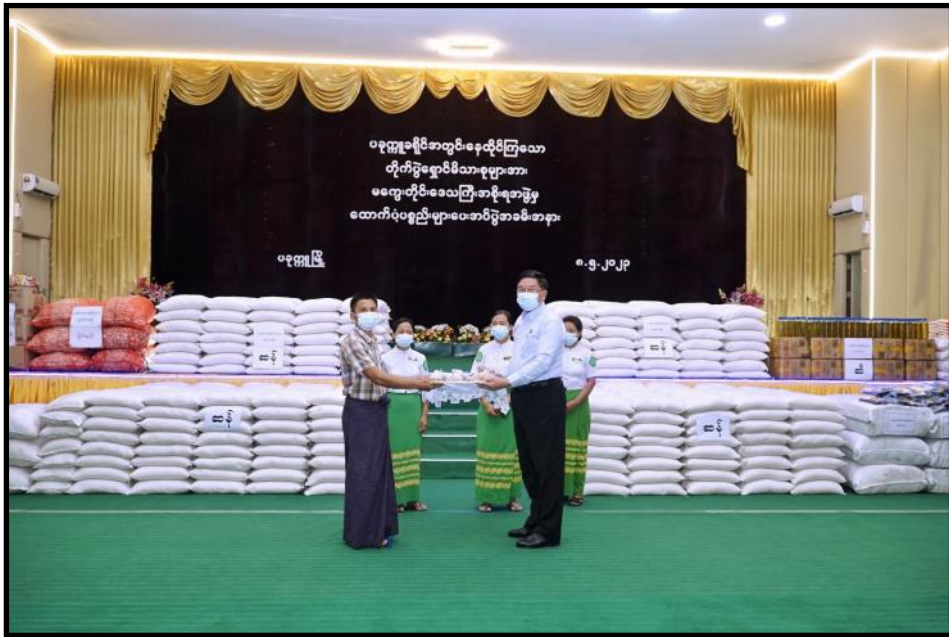
ပခုက္ကူခရိုင်အတွင်းရှိ တိုက်ပွဲရှောင်မိသားစုများအား ထောက်ပံ့ပစ္စည်းများပေးအပ်နေမှု

တိုင်းဒေသကြီးနှင့် ပြည်နယ်အသီးသီးရှိ အစိုးရအဖွဲ့များက ၎င်းတို့ပြည်နယ်အတွင်းရှိ ယာယီတိုက်ပွဲရှောင်ပြည်သူများအား စားရေရိက္ခာပစ္စည်းများ၊ ထောက်ပံ့ငွေများနှင့် ကျောင်းသားကျောင်းသူများအတွက် ကျောင်းသုံးပစ္စည်းများအား ထောက်ပံ့ပေးအပ်ပွဲများကို ကျင်းပပြုလုပ်လျက်ရှိပါသည်။