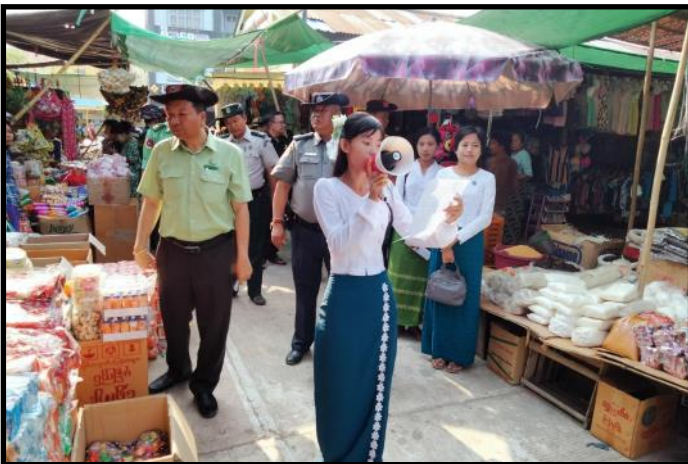
နတ်မောက်မြို့နယ်၌ မုန်တိုင်းအန္တရာယ် အသိပညာပေးလက်ကမ်းစာစောင်များဖြန့်ဝေနေမှု