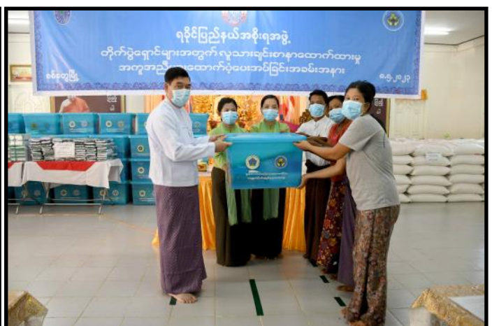
ရခိုင်ပြည်နယ်