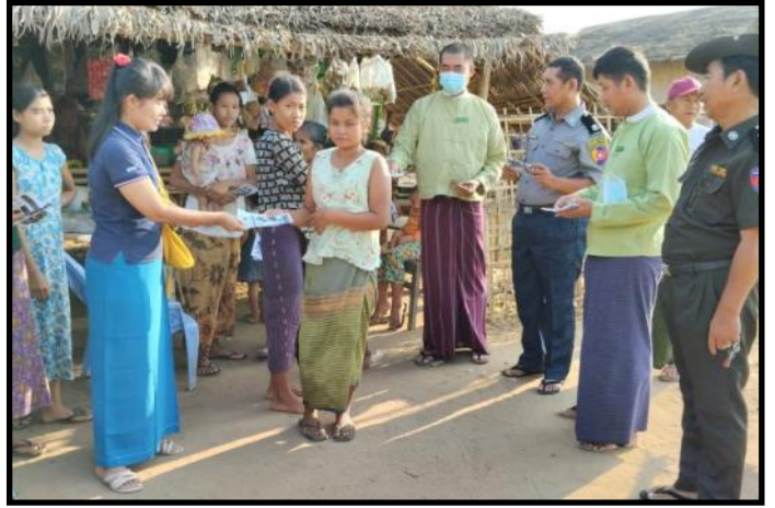
ဝှမြို့နယ်တွင် မုန်တိုင်းဘေး ပညာပေးလက်ကမ်းစာစောင်များ ဖြန့်ဝေ၊ အသိပညာပေးခြင်းများဆောင်ရွက်နေမှု