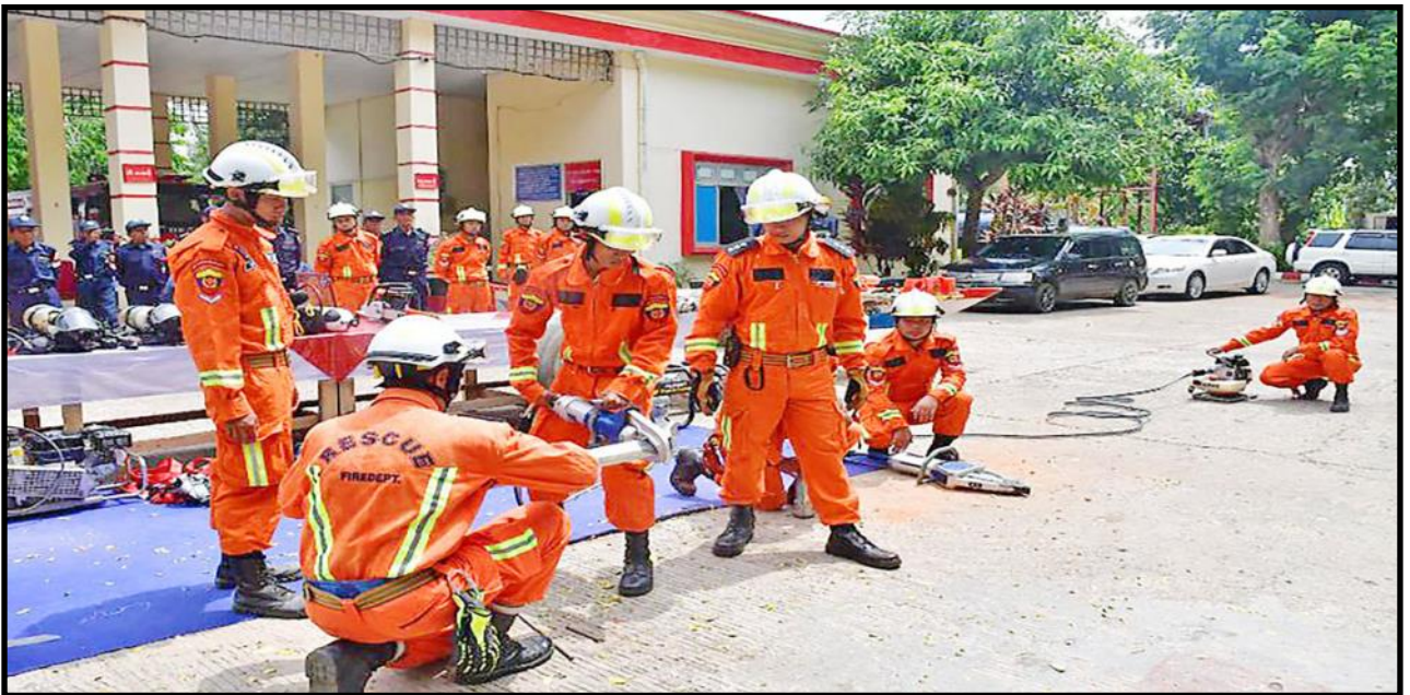
နေပြည်တော်ကောင်စီနယ်မြေတွင် သဘာဝဘေးအန္တရာယ် ကျရောက်လာပါက ရှာဖွေကယ်ဆယ်ရေးလုပ်ငန်းများ အချိန်နှင့်တစ်ပြေးညီ ကယ်ဆယ်ဆောင်ရွက်နိုင်ရန် ရှာဖွေကယ်ဆယ်ရေးသရုပ်ပြဇာတ်တိုက်လေ့ကျင့်နေမှု