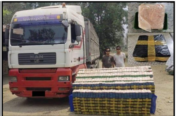
မိုးညှင်းမြို့နယ်တွင် ငွေကျပ်သိန်း ၆၉၀၀ ကျော်တန်ဖိုးရှိ ဘိန်းဖြူများအား တရားခံများနှင့်အတူ ဖမ်းဆီးရမိမှု