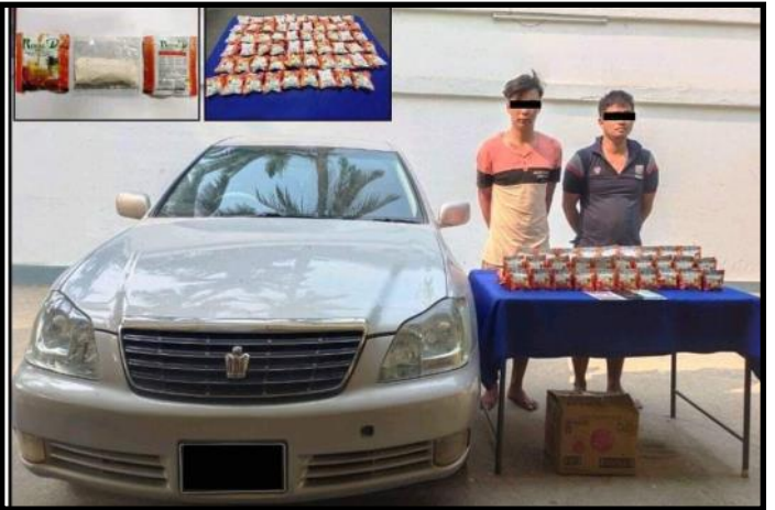
တာချီလိတ်မြို့တွင် ငွေကျပ် ၁ ဒသမ ၁ ဘီလီယံကျော်တန်ဖိုးရှိ စိတ်ပြောင်းဆေးဝါးများအား တရားခံများနှင့်အတူ ဖမ်းဆီးရမိမှု