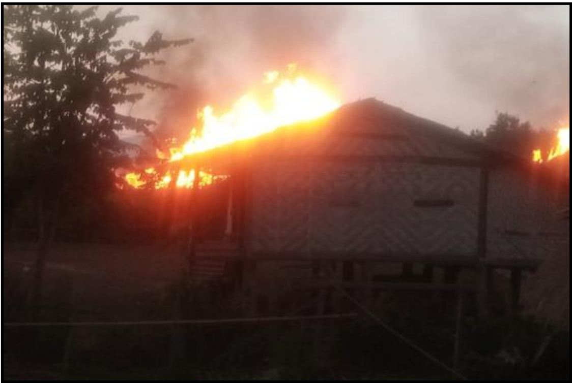
KIA အဖွဲ့မှ အကြမ်းဖက်မှုကို လိုလားသူများနှင့် PDF အမည်ခံအကြမ်းဖက်သမားများက လက်နက်ကြီးများဖြင့် ပစ်ခတ်မှုကြောင့် သာယာကုန်းကျေးရွာရှိ နေအိမ်များ မီးလောင်နေမှု

ထိုသို့ အပြစ်မဲ့အရပ်သားပြည်သူများနေထိုင်ရာ ကျေး မြေဒေသတည်ငြိမ်အေးချမ်းရေးအတွက် လုံခြုံရေးတပ်ဖွဲ့ဝင် ရွာအတွင်းသို့ လက်နက်ကြီးများဖြင့် ပစ်ခတ်တိုက်ခိုက်ခဲ့သည့် များက လိုအပ်သည့် လုံခြုံရေးလုပ်ငန်းစဉ်များအား ဆက်လက် အကြမ်းဖက်သမားများအား ဖမ်းဆီးအရေးယူနိုင်ရေးနှင့် နယ် ဆောင်ရွက်လျက်ရှိကြောင်း သိရှိရပါသည်။