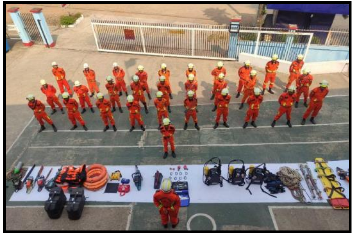
ပျဉ်းမနားမြို့နယ်၌ သဘာဝဘေးအန္တရာယ်အတွက် ဇာတ်တိုက်လေ့ကျင့်ခန်း ပြုလုပ်နေမှု