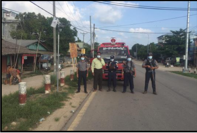
ပလောက်မြို့၌ မုန်တိုင်းကြိုတင်ကာကွယ်နိုင်ရေး အသိပေးနှိုးဆော်နေမှု