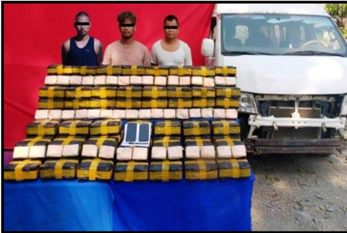
ကလေးမြို့တွင် ငွေကျပ် ၁ ဒသမ ၁ ဘီလီယံတန်ဖိုးရှိ ဘိန်းဖြူများအား တရားခံများနှင့်အတူ ဖမ်းဆီးရမိမှု