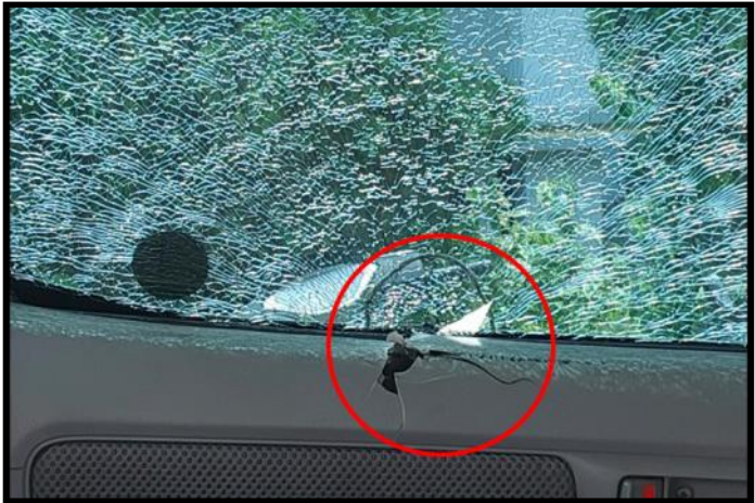
AHA Centre မှ ကိုယ်စားလှယ်များ၊ မြန်မာနိုင်ငံဆိုင်ရာ အင်ဒိုနီးရှားနိုင်ငံနှင့် စင်ကာပူနိုင်ငံသံရုံးတို့မှ ကိုယ်စားလှယ်များ လိုက်ပါလာသည့် ယာဉ်တန်းအား အကြမ်းဖက်သမားများက ပစ်ခတ်တိုက်ခိုက်မှုကြောင့် ထိခိုက်ပျက်စီးခဲ့သည့် မော်တော်ယာဉ်

မေလ ၇ ရက်တွင် ရှမ်းပြည်နယ်(တောင်ပိုင်း)၊ ဆီဆိုင်မြို့နယ်၊ ရေဖြူကျေးရွာရှိ ယာယီနေရပ်စွန့်ခွာ အိမ်ထောင်စုဝင်များအတွက် ထောက်ပံ့ရေးပစ္စည်းများပေးအပ်ရန်အတွက် AHA Centre မှ ကိုယ်စားလှယ်များ၊ မြန်မာနိုင်ငံဆိုင်ရာ အင်ဒိုနီးရှားနိုင်ငံ၊ စင်ကာပူနိုင်ငံသံရုံးတို့မှ ကိုယ်စားလှယ်များလိုက်ပါလာသည့် မော်တော်ယာဉ်တန်းအား ဆီဆိုင်မြို့နယ်၊ နန့်အောရွာ၏ မြောက်ဘက်မီတာ ၂၀၀ ခန့်အကွာသို့အရောက်၌ အသင့်စောင့်ဆိုင်းနေသည့် အကြမ်းဖက်သမားများက လက်နက်ငယ်များဖြင့် ပစ်ခတ်တိုက်ခိုက်ခဲ့သဖြင့် လုံခြုံရေးတပ်ဖွဲ့ဝင်များနှင့် ထိတွေ့မှုဖြစ်ပွားခဲ့ပြီး ဆုတ်ခွာထွက်ပြေးသွားခဲ့ပါသည်။ ဖြစ်စဉ်တွင် လူထိခိုက်ဒဏ်ရာရရှိမှုမရှိခဲ့ဘဲ လုံခြုံရေးများလိုက်ပါလာသည့် မော်တော်ယာဉ်၌ လက်နက်ငယ်ကျည်တစ်ချို့ ထိမှန်ခဲ့ကြောင်း သိရှိရပါသည်။