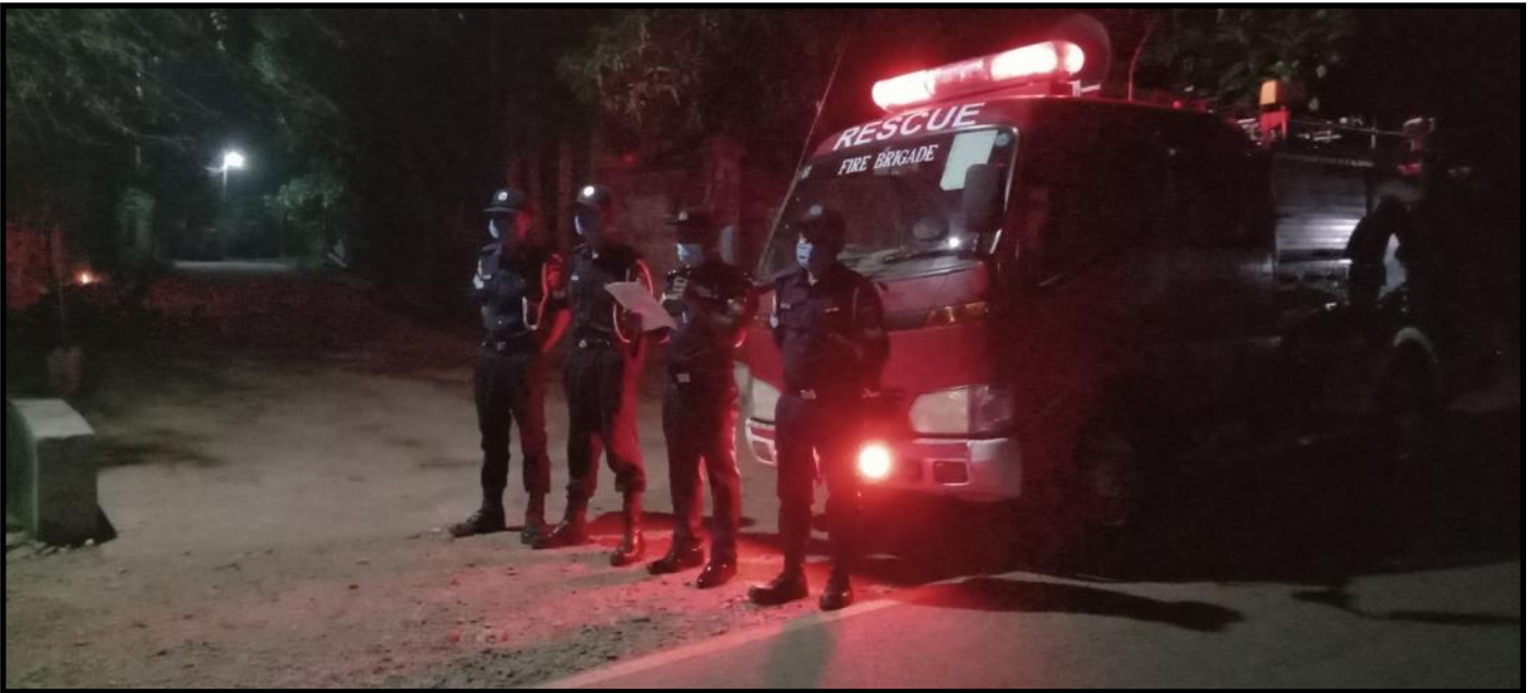
သရက်ချောင်းမြို့နယ်၌ မုန်တိုင်းအန္တရာယ်ကြိုတင်ကာကွယ်ရေး အသိပညာပေးခြင်း ဆောင်ရွက်နေမှု