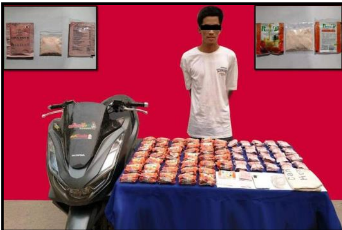
တာချီလိတ်မြို့တွင် ငွေကျပ်သိန်း ၉၀၀၀ ကျော်တန်ဖိုးရှိ စိတ်ပြောင်းဆေးဝါးများအား တရားခံနှင့်အတူ ဖမ်းဆီးရမိမှု