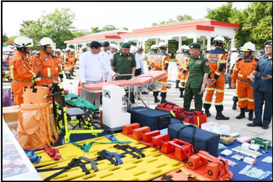
ရန်ကုန်တိုင်းဒေသကြီးဝန်ကြီးချုပ်နှင့် ရန်ကုန်တိုင်းစစ်ဌာနချုပ်တိုင်းမှူးတို့က မြန်မာနိုင်ငံမီးသတ်တပ်ဖွဲ့ဌာနချုပ် ရှာဖွေကယ်ဆယ်ရေးအထူးတပ်ဖွဲ့အသင့်ပြင်ဆင်ထားရှိမှုအား ကြည့်ရှုစစ်ဆေးနေမှု