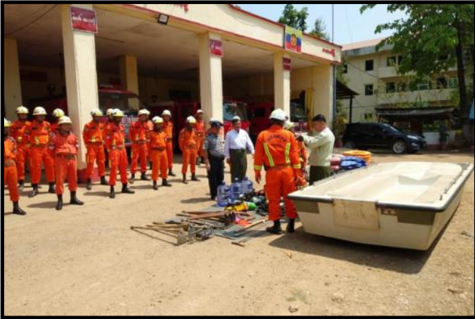
သာယာဝတီမြို့၌ သဘာဝဘေးအန္တရာယ်ကူညီကယ်ဆယ်ရေးအဖွဲ့ ဖွဲ့စည်းဆောင်ရွက်ထားရှိမှု