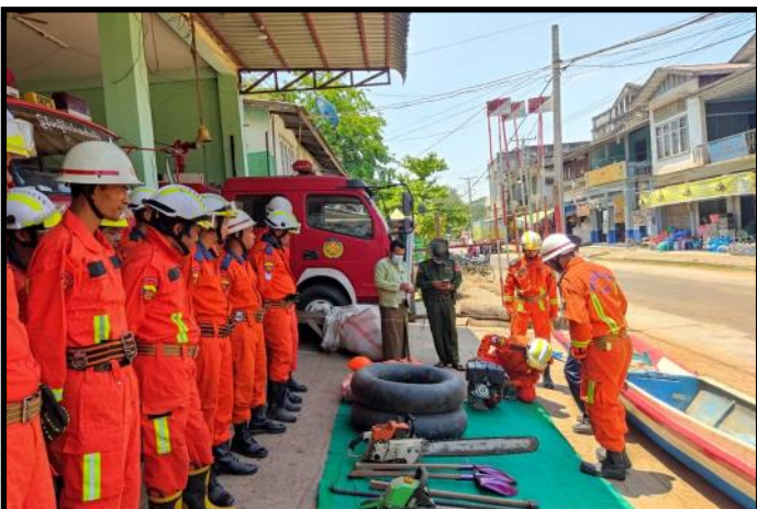
အုတ်ဖိုမြို့၌ သဘာဝဘေးအန္တရာယ် ကြိုတင်ကာကွယ်ရေး လုပ်ငန်းများဆောင်ရွက်နေမှု