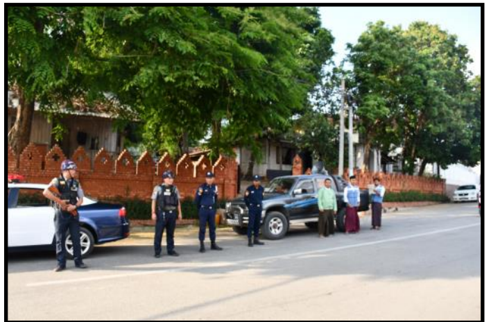
ကျိုင်းတုံမြို့နယ်တွင် မုန်တိုင်းအန္တရာယ်ကြိုတင်ကာကွယ်ရေး အသိပေးနှိုးဆော်နေမှု