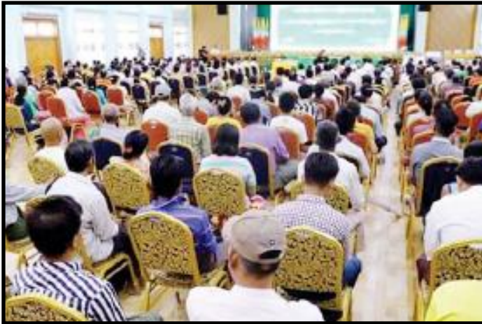
စစ်ကိုင်းတိုင်းဒေသကြီး