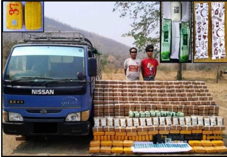
သာစည်မြို့နယ်၌ ငွေကျပ် ၁၀ ဘီလီယံကျော်တန်ဖိုးရှိ မူးယစ်ဆေးဝါးနှင့် စိတ်ပြောင်းဆေးဝါးများအား တရားခံများနှင့်အတူ ဖမ်းဆီးရမိမှု

ပြည်ထဲရေးဝန်ကြီးဌာန၊ မြန်မာနိုင်ငံမူးယစ်ဆေးဝါး နှိမ်နင်းရေးတပ်ဖွဲ့ဝင်များနှင့် လုံခြုံရေးတပ်ဖွဲ့ဝင်များပူးပေါင်း၍ မူးယစ်ဆေးဝါးဖမ်းဆီးမှုများအား အလေးထားဆောင်ရွက် လျက်ရှိရာ ၂၀၂၃ ခုနှစ်၊ ဧပြီလအတွင်း အောက်ပါအတိုင်း ဖမ်းဆီးရမိခဲ့ပါသည်-