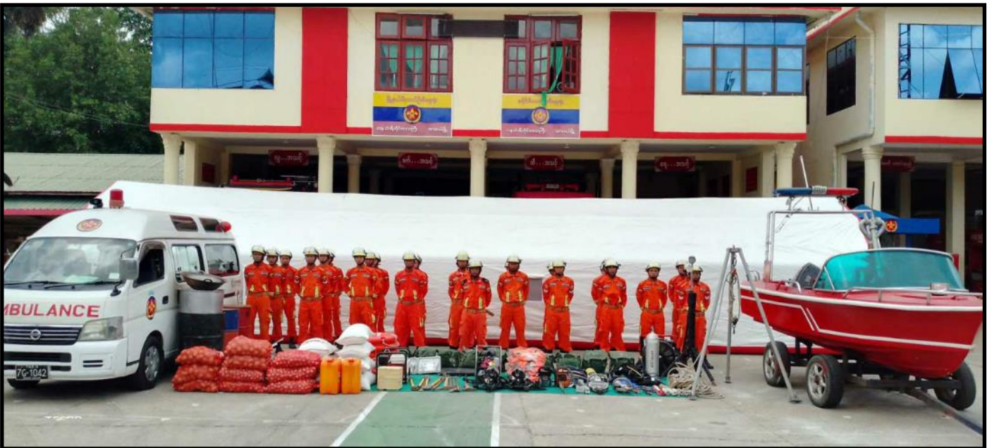
ထားဝယ်မြို့နယ်တွင် ကယ်ဆယ်ရေးပစ္စည်းများ ကြိုတင်ပြင်ဆင်ဆောင်ရွက်ထားရှိမှု