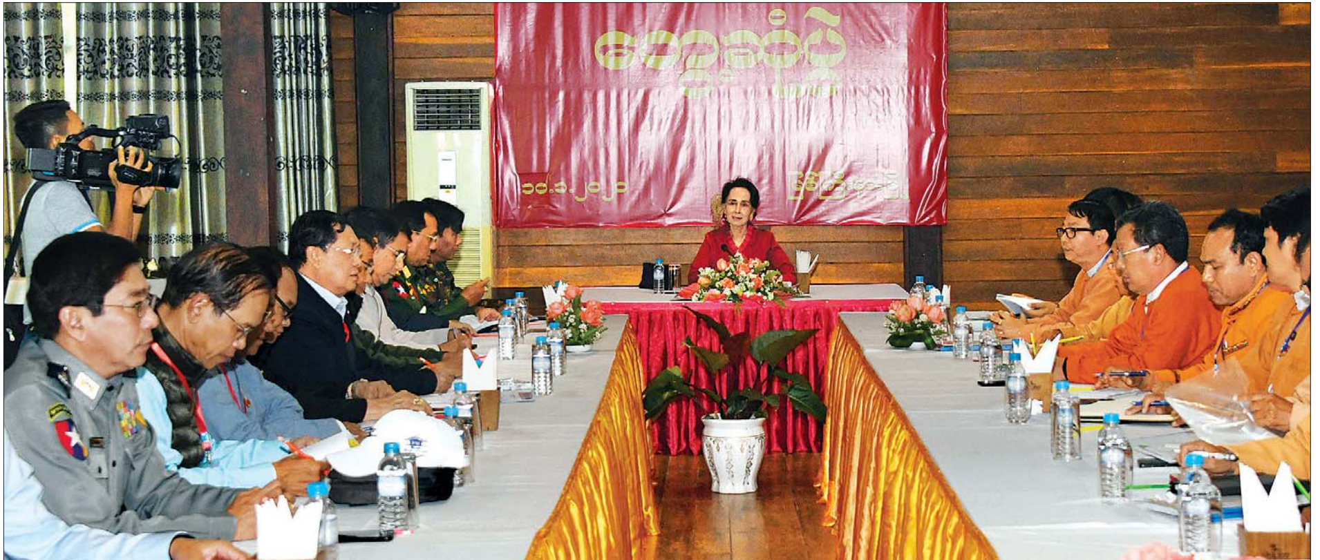
နိုင်ငံတော်၏အတိုင်ပင်ခံပုဂ္ဂိုလ် ဒေါ်အောင်ဆန်းစုကြည် ကချင်ပြည်နယ်ဝန်ကြီးချုပ် ဒေါက်တာ ခက်အောင်နှင့် ပြည်နယ်ဝန်ကြီးများနှင့် တွေ့ဆုံစဉ်။