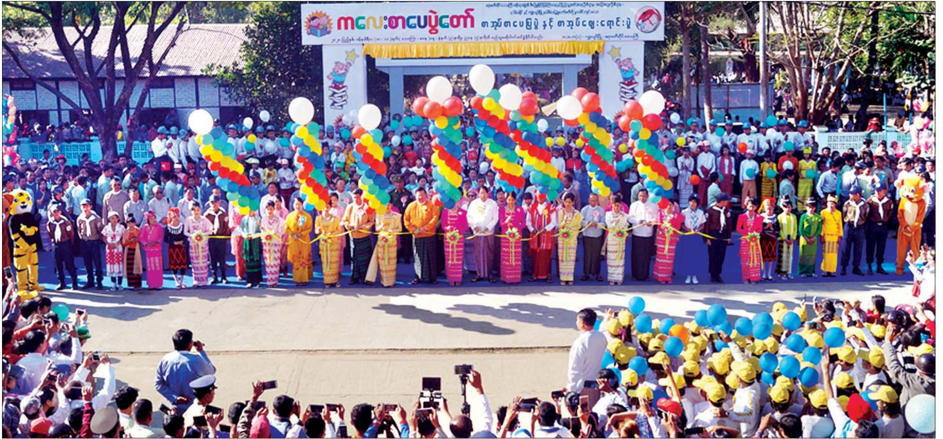
ပြည်ထောင်စုဝန်ကြီး ဒေါက်တာဖေမြင့်၊ တိုင်းဒေသကြီးဝန်ကြီးချုပ် ဦးလှစိုးအောင်နှင့် တာဝန်ရှိသူများ၊ ထူးချွန်ကျောင်းသား ကျောင်းသူများက ကျျပျော်မြို့နယ် ကလေးစာပေပွဲတော်အား ဖဲကြိုးဖြတ်ဖွင့်လှစ်ပေးစဉ်။