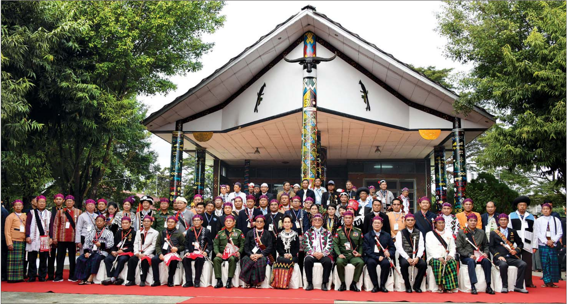
နိုင်ငံတော်၏အတိုင်ပင်ခံပုဂ္ဂိုလ် ဒေါ်အောင်ဆန်းစုကြည်၊ ပြည်ထောင်စုဝန်ကြီးများ၊ ပြည်နယ်ဝန်ကြီးချုပ်နှင့် တာဝန်ရှိသူများ မြန်မာနိုင်ငံ ကချင်လူမျိုးရိုးရာယဉ်ကျေးမှုအသင်း ဥက္ကဋ္ဌ ဦးထံဖူးဒဂုဏ်နှင့် အဖွဲ့ဝင်များ၊ ယဉ်ကျေးမှုအဖွဲ့များနှင့်အတူ စုပေါင်းမှတ်တမ်းတင် ဓာတ်ပုံရိုက်ကြစဉ်။