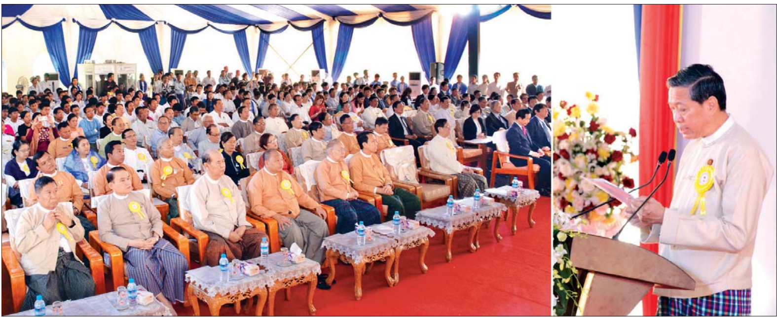
ပြည်ထောင်စုဝန်ကြီး ဒေါက်တာမျိုးသိမ်းကြီး၊ ဂျပန်-မြန်မာ အောင်ဆန်းသက်မွေးပညာသင်တန်းကျောင်း (JMASVTI) ၏ ဖွင့်ပွဲအခမ်းအနားနှင့် ပန္နက်တင်မင်္ဂလာအခမ်းအနားတွင် အမှာစကားသတင်းစဉ်

ရန်ကုန် ဇန်နဝါရီ ၁၀ ဂျပန်-မြန်မာ အောင်ဆန်းသက်မွေးပညာသင်တန်းကျောင်း (JMASVTI) ၏ ဖွင့်ပွဲအခမ်းအနားနှင့် ပန္နက်တင်မင်္ဂလာအခမ်းအနားကို ယနေ့နံနက် ၉ နာရီခွဲတွင် ရန်ကုန်တိုင်းဒေသကြီးအင်းစိန်မြို့နယ် စဉ့်တိုင်ကွက်ရှိ ဂျပန် - မြန်မာ အောင်ဆန်းသက်မွေးပညာသင်တန်းကျောင်း (JMASVTI) ဆောက်လုပ်မည့် မြေကွက်လပ်ရှိ ယာယီမဏ္ဍပ်တွင် ကျင်းပသည်။ အဆိုပါ အခမ်းအနားသို့ အမျိုးသားလွှတ်တော် ဒုတိယဥက္ကဋ္ဌ ဦးအေးသာအောင်၊ ပညာရေးဝန်ကြီးဌာန ပြည်ထောင်စုဝန်ကြီး ဒေါက်တာမျိုးသိမ်းကြီး၊ ရန်ကုန်တိုင်းဒေသကြီးဝန်ကြီးချုပ် ဦးမြိုးမင်းသိန်း၊ ရန်ကုန်တိုင်းဒေသကြီး လွှတ်တော်ဥက္ကဋ္ဌ ဦးတင်မောင်ထွန်း၊ ဒုတိယဥက္ကဋ္ဌ ဦးလင်းနိုင်မြင့်၊ ဒုတိယဝန်ကြီး ဦးဝင်းမော်ထွန်း၊ ရန်ကုန်တိုင်းဒေသကြီးဝန်ကြီးများ၊ ပြည်သူ့လွှတ်တော်နှင့် အမျိုးသားလွှတ်တော်တို့မှ ကိုယ်စားလှယ်များ၊ ရန်ကုန်တိုင်းဒေသကြီးမှ လွှတ်တော်ကိုယ်စားလှယ်များ၊ ဂျပန်နိုင်ငံ၏ လွှတ်တော်ကိုယ်စားလှယ်များ ဖြစ်ကြသော Mr. Kozo Yamamoto နှင့် Mr. Satoshi Fujimaru၊ မြန်မာနိုင်ငံဆိုင်ရာ ဂျပန်နိုင်ငံသံအမတ်ကြီး မစ္စတာ အိချိုရီမာရူးယားမား၊ ဂျပန်အပြည်ပြည်ဆိုင်ရာပူးပေါင်းဆောင်ရွက်ရေးအေဂျင်စီမှ Chief Representative Mr. Masayuki Karasawa၊ မြန်မာ - ဂျပန်လွှတ်တော်အချင်းချင်း ချစ်ကြည်ရင်းနှီးရေးအသင်းဥက္ကဋ္ဌ ဦးကျော်ထွေး၊ ပညာရေးဝန်ကြီးဌာနမှ ညွှန်ကြားရေးမှူးချုပ်များ၊ ပါမောက္ခချုပ်များနှင့် တာဝန်ရှိသူများ၊ မြန်မာနိုင်ငံကုန်သည်များနှင့် စက်မှုလက်မှုလုပ်ငန်းရှင်များအသင်းချုပ်၊ မြန်မာနိုင်ငံအင်ဂျင်နီယာကောင်စီ၊ မြန်မာ့မော်တော်ယာဉ်ဖွံ့ဖြိုးမှု အများနှင့် သက်ဆိုင်သော ကုမ္ပဏီလီမိတက်တို့မှ ကိုယ်စားလှယ်များ၊ သက်မွေး