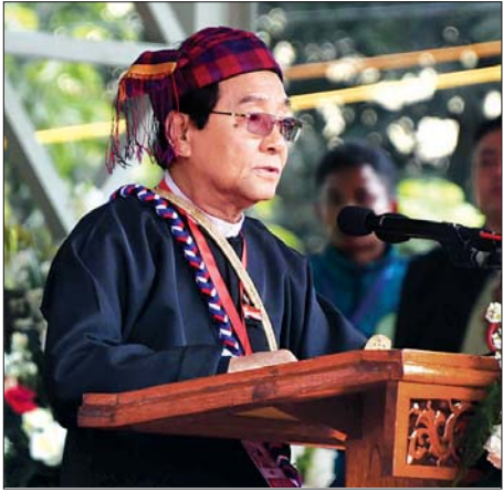
နိုင်ငံတော်သမ္မတ ဦးဝင်းမြင့်ထံမှ ပေးပို့သည့် (၇၂) နှစ် မြောက် ကချင်ပြည်နယ်နေ့ ဂုဏ်ပြုသဝဏ်လွှာကို ကချင်ပြည်နယ် ဝန်ကြီးချုပ် ဒေါက်တာ ခက်အောင် ဖတ်ကြားစဉ်။

စွမ်းစွမ်းတမံ ဆောင်ရွက်မည့် ရဲဘော်ရဲဘက်များ ဖြစ်လာမည်ကို ပြောကြားလိုပါကြောင်း၊ ယခု ကူညီနေသည့် သူများကိုလည်း ကျေးဇူးတင်ပါကြောင်း၊ အထူးသဖြင့် ကလေးများသည် မိမိတို့အနာဂတ်ကို တည်ဆောက်သည့် နေရာတွင် ထဲထဲဝင်ဝင်ပါနိုင်ရန် လိုပါကြောင်း၊ ကလေး များအနေဖြင့် မိမိတို့နိုင်ငံသည် ပြည်ထောင်စုဖြစ်သည်ကို သတိရစေလိုပါကြောင်း၊ မိမိတို့နိုင်ငံသည် တိုင်းရင်းသား မျိုးစုံနှင့်ဖွဲ့စည်းထားသည့် ပြည်ထောင်စုဖြစ်ကြောင်း၊ ဆရာ၊ ဆရာမများအနေဖြင့် ကလေးများကို ပြည်ထောင်စု ဆိုသည်ကို ရှင်းရှင်းလင်းလင်းသိအောင် ရှင်းပြရန် လိုပါကြောင်း၊ ကလေးများကို အမှန်အတိုင်းပြောတတ် အောင် လေ့ကျင့်ပေးမြဲရန် လိုပါကြောင်း၊ ဆရာ၊ ဆရာမ များအနေဖြင့် ကလေးများ မေးခွန်းများမေးလျှင် သိလျှင် သိကြောင်း၊ မသိလျှင် မသိကြောင်းကို ပွင့်ပွင့်လင်းလင်း ပြောစေလိုပါကြောင်း၊ ကလေးများကို စာဖတ်စေချင်ပါ ကြောင်း၊ ငယ်စဉ်ကပင် စာဖတ်သည့်အလေ့အကျင့်ကို မွေးမြူပေးစေလိုပါကြောင်း၊ စာဖတ်ခြင်းသည် ပြည်ထောင်စု စိတ်ဓာတ်ကို နားလည်စေပြီး တိုင်းရင်းသားအားလုံးသည် အသီးသီး တန်ဖိုးကိုယ်စီရှိသည်ကို သိရှိစေပါကြောင်း၊ ဂေဟာရှေ့ရေးအတွက် မိမိတို့အနေဖြင့် တတ်နိုင်သလောက် ပံ့ပိုးပေးသွားမည်ဖြစ်ပြီး ကလေးများအနေဖြင့် စာကြိုးစား သင်ယူကြစေလိုကြောင်း ပြောကြားသည်။