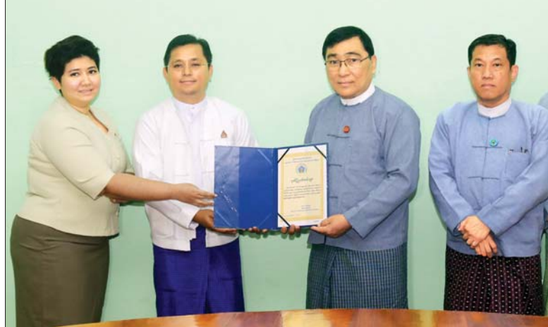
သတင်းစဉ်

နေပြည်တော် ဇန်နဝါရီ ၁၀ မြန်မာနိုင်ငံအတွင်း သာဘာဝဘေးအန္တရာယ်များ ဖြစ်ပွား လာပါက အရေးပေါ်တုံ့ပြန်ရေးလုပ်ငန်းများ ဆောင်ရွက် ရာတွင် အသုံးပြုနိုင်ရန်အတွက် ကမ္ဘောဇ ဘဏ်လီမိတက် က ဖိုင်ဘာစက်လှေတစ်စင်းလျှင် ငွေကျပ် ၂၇၅၀၀၀ နှုန်းဖြင့် စုစုပေါင်းငွေကျပ် ၂၄ ဒသမ ၇၅၀ သန်း တန်ဖိုးရှိ ဖိုင်ဘာစက်လှေ ကိုးစင်းကို ကမ္ဘောဇဘဏ်လီမိတက် ဒုတိယအမှုဆောင်အရာရှိချုပ်(၁) ဦးအောင်ကျော်မျိုးက လှူဒါန်းတမ်း၊ ကယ်ဆယ်ရေးနှင့် ပြန်လည်နေရာချထား ရေးဝန်ကြီးဌာနသို့ ယနေ့ မွန်းလွဲပိုင်းတွင် လာရောက် ပေးအပ်လှူဒါန်းရာ ပြည်ထောင်စုဝန်ကြီး ဒေါက်တာ ဝင်းမြတ်အေးက လက်ခံရယူပြီး ဂုဏ်ပြုမှတ်တမ်းလွှာ ပြန်လည်ပေးအပ်ခဲ့ကြောင်း သိရသည်။ (ယာပုံ)