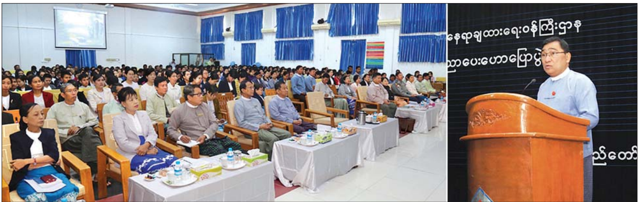
ပြည်ထောင်စုဝန်ကြီး ဒေါက်တာဝင်းမြတ်အေး မူးယစ်ဆေးဝါးအန္တရာယ် ကြိုတင်ကာကွယ်ရေးနှင့် အသိပညာပေးဟောပြောပွဲတွင် အမှာစကားပြောကြားစဉ်။

ကောင်းသော လူသားစွမ်းရည် အရင်းအမြစ်များလိုအပ်ကြောင်း၊ လူသားစွမ်းရည်အရင်းအမြစ်ကောင်းများရရှိရေးဦးစွာကတည်းက ဦးနောက်ဖွံ့ဖြိုးတိုးတက်မှုနှင့် ခန္ဓာကိုယ်ပုံမှန်ကြီးထွားမှုများအတွက် လေ့ကျင့်ပျိုးထောင်ကြရမည် ဖြစ်ကြောင်း၊ လူသားတစ်ဦးချင်း မိမိတို့၏ ရပ်တည်မှု ဖွံ့ဖြိုးတိုးတက်မှုများအတွက် ကြိုးစားဆောင်ရွက်ရာတွင် အဟန့်အတားဖြစ်စေမည့် ကိစ္စများကို ဖယ်ရှားရမည်ဖြစ်ကြောင်း၊ ၎င်းကိစ္စများတွင် မူးယစ်ဆေးဝါးအန္တရာယ်သည် အဟန့်အတားဖြစ်စေမည့် အရေးကြီးသော ပြဿနာတစ်ရပ်ဖြစ်ကြောင်း၊ မူးယစ်ဆေးဝါးကြောင့် ကျန်းမာရေး၊ လူ့ကိုယ်ရည်ကိုယ်သွေးနှင့် အကျင့်စာရိတ္တများ ထိခိုက်ကျဆင်းပြီး လူမှုပတ်ဝန်းကျင်တွင် ရပ်တည်မှု ခဲယဉ်းသွားမည်ဖြစ်ကြောင်း၊ မူးယစ်ဆေးဝါးကို စမ်းသပ်သုံးစွဲမှုမပြုလုပ်ကြရန် ငယ်စဉ်ဘဝကတည်းက အသိပညာပေး ဆောင်ရွက်ကြရမည်ဖြစ်ကြောင်း၊ ဝန်ထမ်းများသည် မိမိတို့ မိသားစု၏ တာဝန်များကို ယူကြရသကဲ့သို့ ပြည်သူလူထု၏ တာဝန်ကိုလည်း ထမ်းဆောင်ကြရမည်