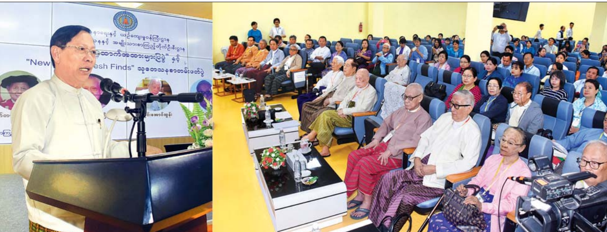
ပြည်ထောင်စုဝန်ကြီး သူရဦးအောင်ကို ရှားပါးအထောက်အထားများပြုပွဲနှင့် New Views, Fresh Finds သုတေသနစာတမ်းဖတ်ပွဲ အခမ်းအနားတွင် အမှာစကားပြောကြားစဉ်။

၁။ ပြည်ထောင်စုသမ္မတ မြန်မာနိုင်ငံတော် နိုင်ငံတော်သမ္မတသည် ကျန်းမာရေးနှင့် အားကစား ဝန်ကြီးဌာန၊ တိုင်းရင်းဆေးပညာဦးစီးဌာန ညွှန်ကြားရေးမှူးချုပ် ဒေါက်တာမိုးဆွေ ကို အစမ်းခန့်ကာလ (၁)နှစ်ပြည့်မြောက်သည့်နေ့မှစ၍ အတည်ပြုခန့်ထားလိုက်သည်။ ၂။ ပြည်ထောင်စုသမ္မတ မြန်မာနိုင်ငံတော် နိုင်ငံတော်သမ္မတသည် ပို့ဆောင်ရေးနှင့် ဆက်သွယ်ရေးဝန်ကြီးဌာန၊ ပြည်တွင်းရေကြောင်းပို့ဆောင်ရေးမှ အထွေထွေမန်နေဂျာ ဦးဌေးအောင် ကို ယင်းဌာန၏ ဦးဆောင်ညွှန်ကြားရေးမှူးအဖြစ် တာဝန်ဝတ္တရားများကို စတင်ဆောင်ရွက်သည့်နေ့မှစ၍ အစမ်းခန့်ထားလိုက်သည်။