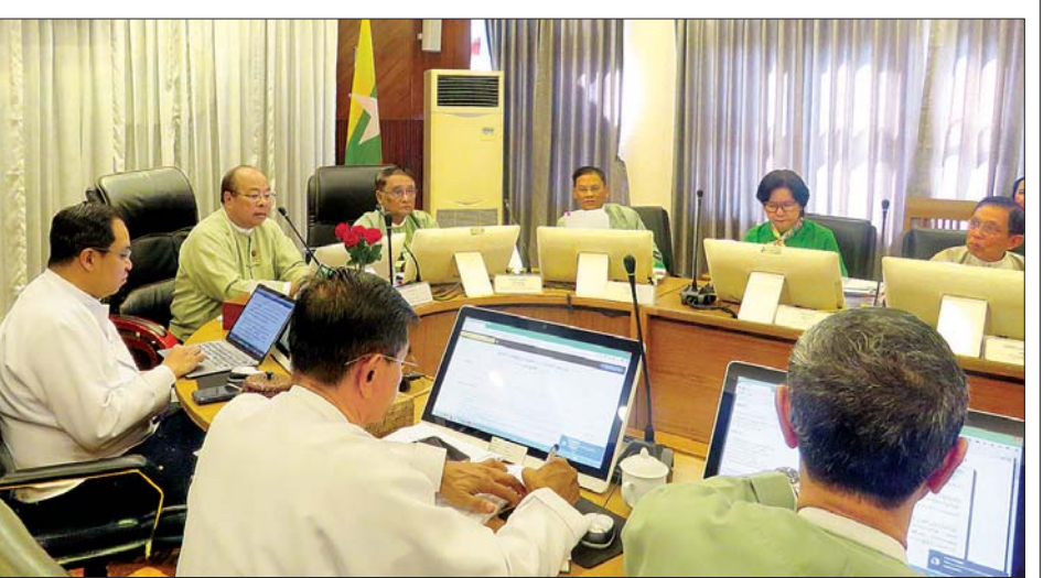
မြန်မာနိုင်ငံ ရင်းနှီးမြှုပ်နှံမှုကော်မရှင်၏ (၁/၂၀၂၀) ကြိမ်မြောက် အစည်းအဝေးကျင်းပစဉ်။

လျှပ်စစ်ဓာတ်အား ထုတ်လုပ်ရောင်းချခြင်း လုပ်ငန်းအပါအဝင် အခြားကဏ္ဍ၊ စက်မှုကဏ္ဍနှင့် ဟိုတယ်ကဏ္ဍတို့မှ လုပ်ငန်းခြောက်ခု ခွင့်ပြုခဲ့သည်။ အဆိုပါလုပ်ငန်းများ၏ ရင်းနှီးမြှုပ်နှံမှုပမာဏမှာ အမေရိကန်ဒေါ်လာ ၂၅၇ ဒသမ ၅၂ သန်းနှင့် ကျပ် ၆၀၂၂၀ ဒသမ ၃၀ သန်းရှိပြီး ပြည်တွင်းလုပ်သားများအတွက် အလုပ်အကိုင်အခွင့်အလမ်းပေါင်း ၁၃၀၇ နေရာကို ဖန်တီးပေးနိုင်မည်ဖြစ်သည်။ ရင်းနှီးမြှုပ်နှံမှု ၂၀၁၉ ခုနှစ် ရင်းနှီးမြှုပ်နှံမှုအများဆုံးပြုလုပ်သော နိုင်ငံများမှာ စင်ကာပူနိုင်ငံ၊ တရုတ်ပြည်သူ့သမ္မတနိုင်ငံနှင့် ထိုင်းနိုင်ငံတို့ဖြစ်သည်။ နိုင်ငံပေါင်း ၅၀ မှ စီးပွားရေးကဏ္ဍ ၁၂ ခုတွင် အများဆုံးရင်းနှီးမြှုပ်နှံထားရှိမှုမှာ ရေနံနှင့်သဘာဝဓာတ်ငွေ့