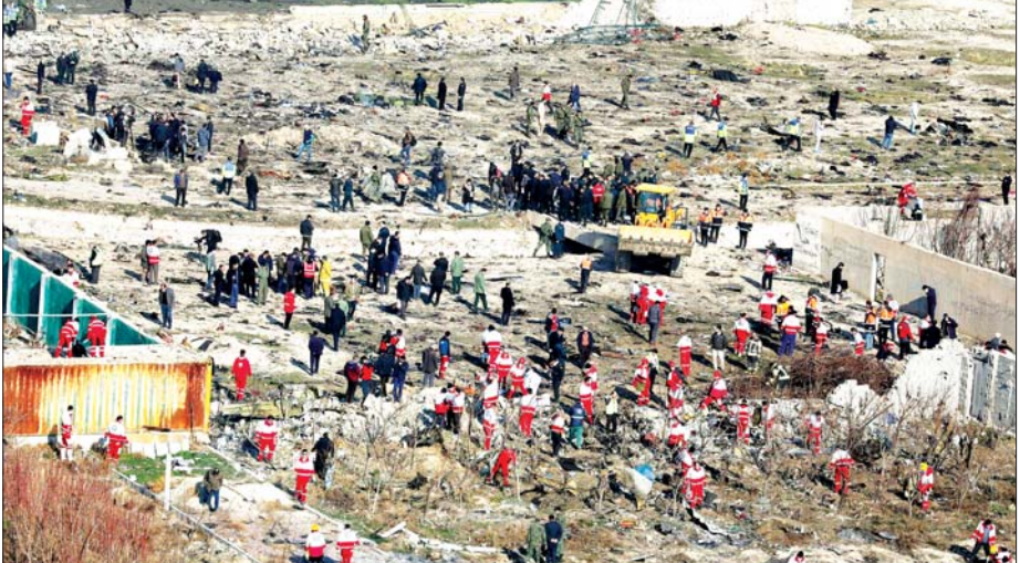
လေယာဉ်ပျက်ကျခဲ့သည့်နေရာတွင် အပျက်အစီးများရှာဖွေမှုပြုလုပ်နေကြစဉ်။