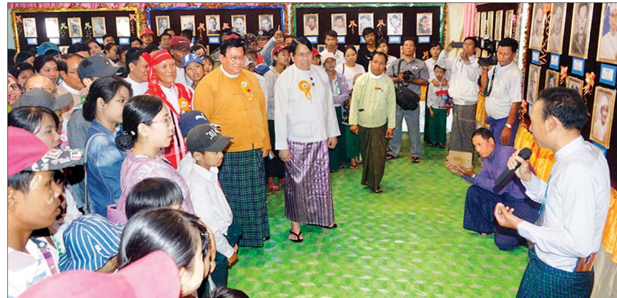
ပြည်ထောင်စုဝန်ကြီး ဒေါက်တာဖေမြင့်၊ တိုင်းဒေသကြီးဝန်ကြီးချုပ် ဦးလှစိုးအောင်နှင့် တာဝန်ရှိသူများ ကလေးစာပေပွဲတော်၌ ခင်းကျင်းပြသထားသည့် ထူးချွန်ထင်ရှား ရောဝတီတိုင်းသားများပြခန်းအား ကြည့်ရှုအားပေးစဉ်။

သတင်း - နေဝင်း(ပြန်/ဆက်)