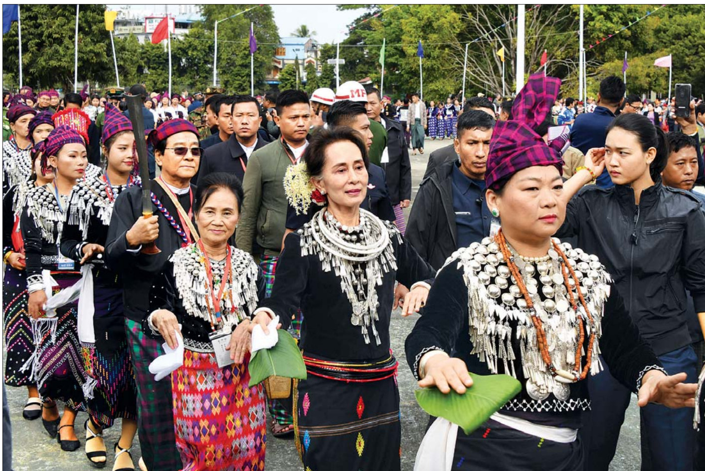
နိုင်ငံတော်၏အတိုင်ပင်ခံပုဂ္ဂိုလ် ဒေါ်အောင်ဆန်းစုကြည် ဒေသခံပြည်သူများနှင့်အတူ မနောအကဖြင့် ပါဝင်ဆင်နွှဲစဉ်။ သတင်းစဉ်