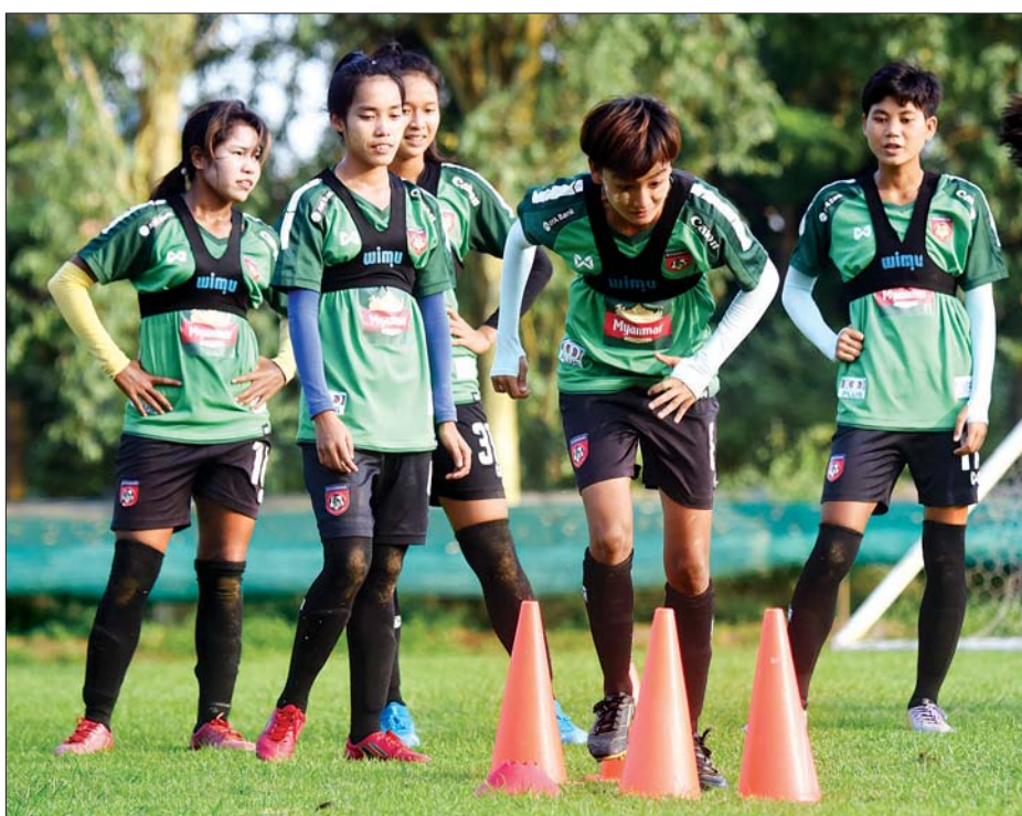
၂၀၁၉ ခုနှစ်က ဖွဲ့စည်းခဲ့သည့် မြန်မာလူငယ် အမျိုးသမီးအသင်း။