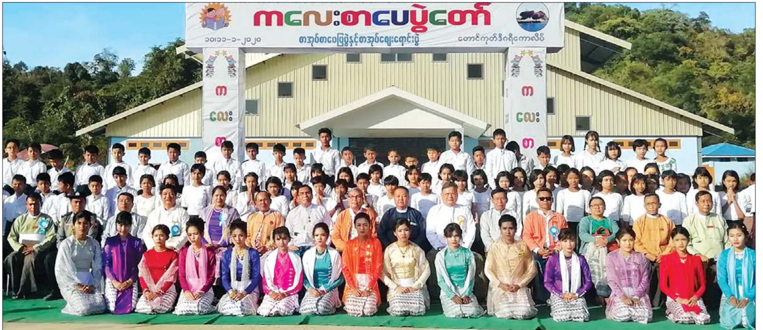
ပြည်နယ်ဝန်ကြီးချုပ် ဦးညီပု၊ ဒုတိယဝန်ကြီး ဦးအောင်လှထွန်းနှင့် ပြည်နယ်ဝန်ကြီးများ ကလေးစာပေပွဲတော်၊ စာအုပ်ပြပွဲနှင့် စာအုပ်ဈေးရောင်းပွဲ(တောင်ကုတ်)ဖွင့်ပွဲ အခမ်းအနားသို့ တက်ရောက်ကြသူများနှင့်အတူ စုပေါင်းမှတ်တမ်းတင်ဓာတ်ပုံရိုက်စဉ်။

ရခိုင်ပြည်နယ်အစိုးရအဖွဲ့၏ ဦးဆောင်မှုဖြင့် ပြန်ကြားရေးနှင့် ပြည်သူ့ဆက်ဆံရေးဦးစီးဌာန၊ အခြေခံပညာဦးစီးဌာနနှင့် တောင်ကုတ်မြို့နယ် စီမံခန့်ခွဲရေးကော်မတီတို့ ပူးပေါင်းကျင်းပသော ကလေးစာပေပွဲတော်၊ စာအုပ်ပြပွဲနှင့် စာအုပ်ဈေးရောင်းပွဲကို ယနေ့ မွန်းလွဲပိုင်းက တောင်ကုတ်ဒီဂရီကောလိပ်တွင် စည်ကားသိုက်မြိုက်စွာ ကျင်းပသည်။