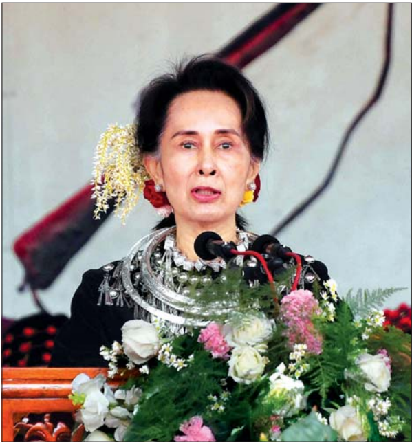
နိုင်ငံတော်၏အတိုင်ပင်ခံပုဂ္ဂိုလ် ဒေါ်အောင်ဆန်းစုကြည်

စတင်ခဲ့တဲ့ ပင်လုံကို ၂၁ ရာစုနှစ်ကနေပြီးတော့ အဆုံးသတ်ဖို့လိုပါတယ်။ အဆုံးသတ်တယ်ဆိုတာ တကယ့်ကို ထာဝရတည်တံ့ခိုင်မြဲမယ့် ငြိမ်းချမ်းရေးရဖို့ ကျွန်မတို့အားလုံးကြိုးစားဖို့ဟာ တာဝန်တစ်ခုပဲ ဖြစ်ပါတယ်။