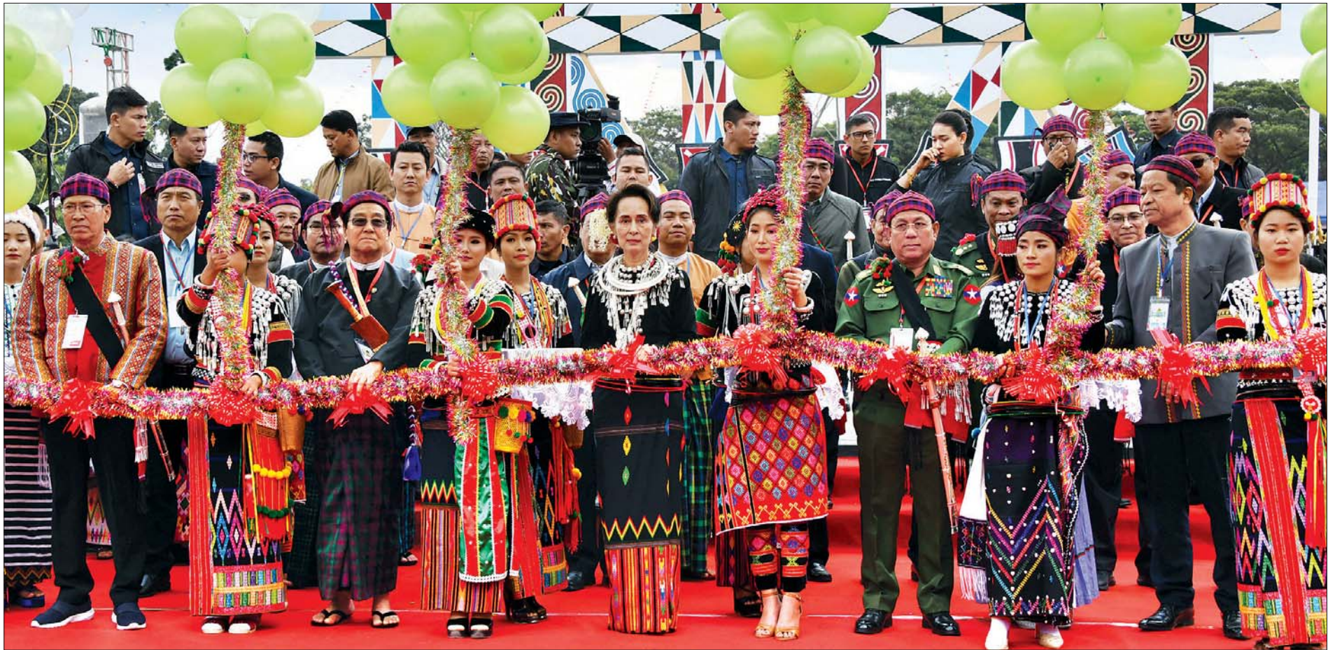
နိုင်ငံတော်၏အတိုင်ပင်ခံပုဂ္ဂိုလ် ဒေါ်အောင်ဆန်းစုကြည်၊ ပြည်ထောင်စုဝန်ကြီး ဒုတိယဗိုလ်ချုပ်ကြီး ရဲအောင်၊ ပြည်နယ်ဝန်ကြီးချုပ် ဒေါက်တာ ခက်အောင်၊ ပြည်နယ်လွှတ်တော်ဥက္ကဋ္ဌ ဦးထွန်းတင်နှင့် ကချင်နစ်မြင်းခရစ်ယာန်အဖွဲ့ချုပ် အထွေထွေအတွင်းရေးမှူး သိက္ခာတော်ရ ဖော်ယောင်တူးမိုင်တို့က (၇၂)နှစ်မြောက် ကချင်ပြည်နယ်နေ့ အထိမ်းအမှတ် မနောပွဲတော်ကို ဖြတ်ဖြတ်ဖွင့်လှစ်ပေးကြစဉ်။ သတင်းစဉ်