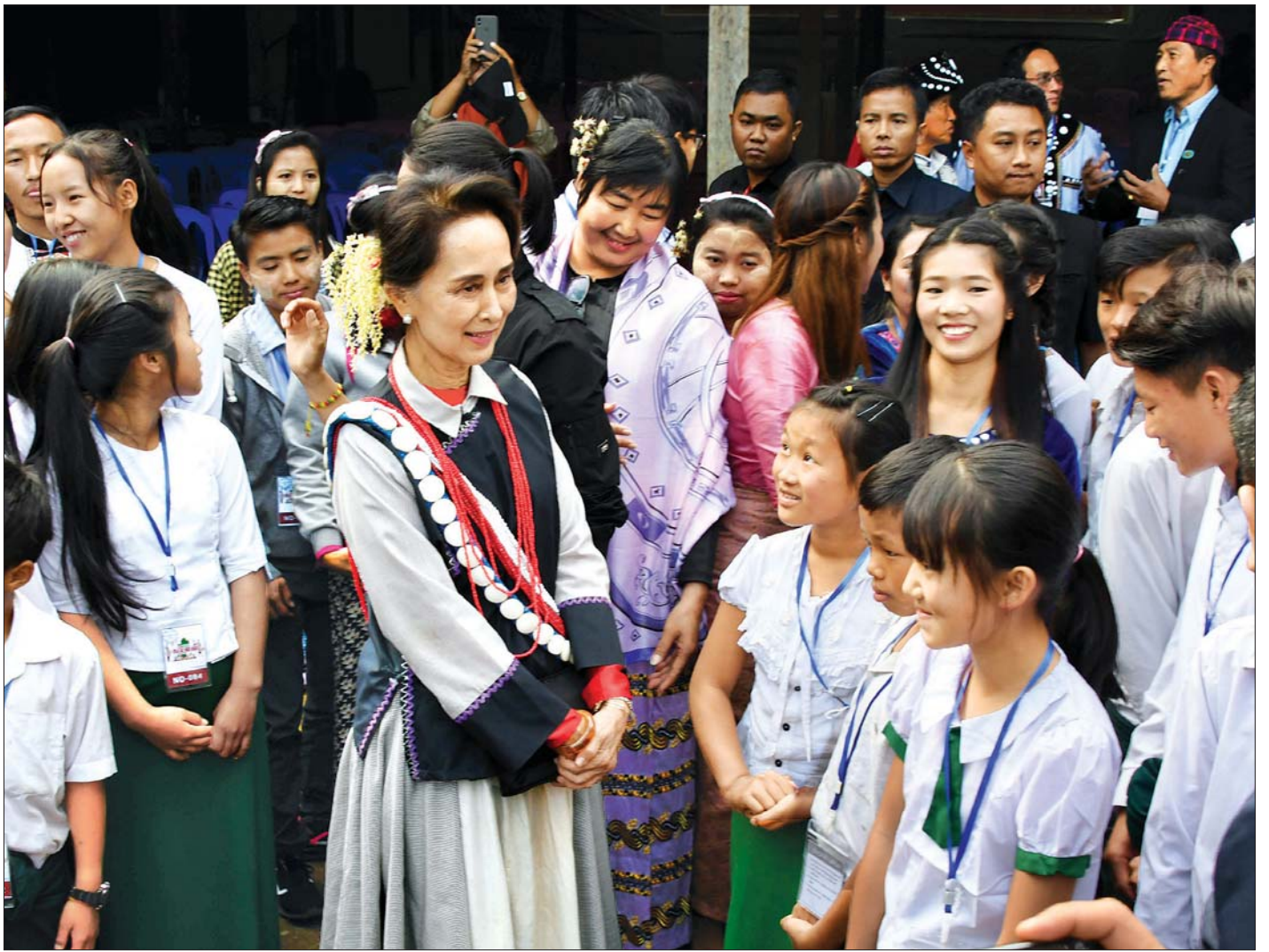
နိုင်ငံတော်၏အတိုင်ပင်ခံပုဂ္ဂိုလ် ဒေါ်အောင်ဆန်းစုကြည် မြစ်ကြီးနားမြို့ ရွှေစက်ရပ်ကွက်ရှိ လူမှုဝန်ထမ်းဦးစီးဌာန အသိအမှတ်ပြု တောင်တန်းဒေသကျောင်းသား၊ ကျောင်းသူများ ပြုစုစောင့်ရှောက်ရေးဂေဟာမှ ကျောင်းသား၊ ကျောင်းသူများအား ရင်းရင်းနှီးနှီးနှုတ်ဆက်စဉ်။

ဂေဟာအတွက် ဗိုလ်ချုပ်အောင်ဆန်းရုပ်ပုံပါ ငွေစက္ကူအသစ် များ၊ ဦးထုပ်များနှင့် ကစားစရာအရပ်များကို လည်းကောင်း၊ ပြည်ထောင်စုဝန်ကြီး ဦးသိန်းဆွေက ကွန်ပျူတာဝယ်ယူရန် အလှူငွေများကို လည်းကောင်း၊ ဒုတိယဝန်ကြီး ဦးစိုးအောင် က ထောက်ပံ့ငွေနှင့် စားသောက်ကုန်ပစ္စည်းများကို လည်းကောင်း တာဝန်ရှိသူများထံ ပေးအပ်ကြသည်။ ယင်းနောက် နိုင်ငံတော်၏အတိုင်ပင်ခံပုဂ္ဂိုလ်၊ ပြည်ထောင်စုဝန်ကြီးများ၊ ပြည်နယ်ဝန်ကြီးချုပ်နှင့်