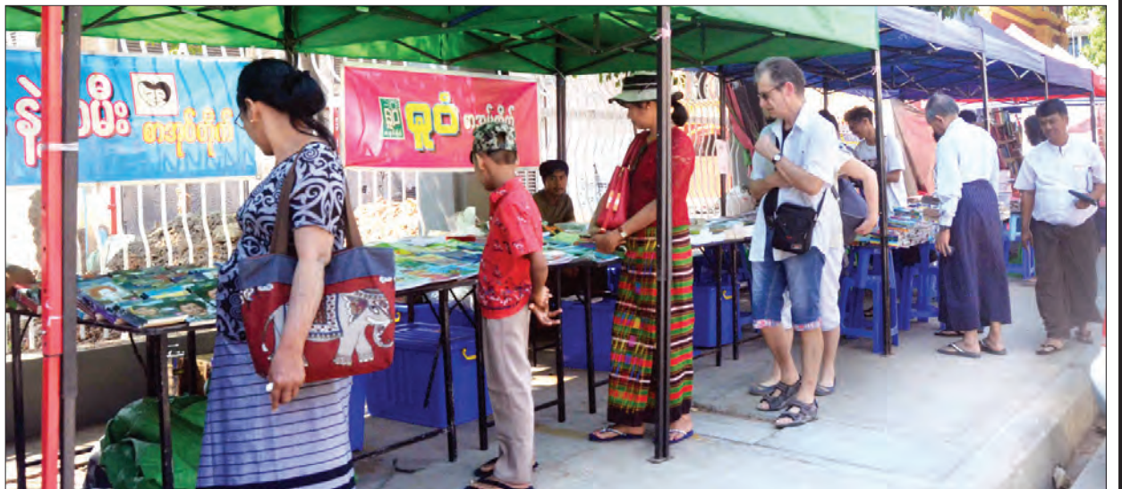
စနေ-တနင်္ဂနွေ ရန်ကုန်စာအုပ်လမ်းတွင် စာပေချစ်မြတ်နိုးသူ ဝါသနာရှင်များ စာအုပ်များကို လေ့လာနေကြစဉ်။