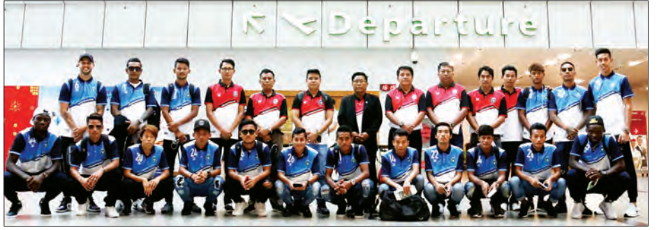
AFC Cup ပြိုင်ပွဲ ယှဉ်ပြိုင်မည့် ရန်ကုန်ယူနိုက်တက်အသင်း။