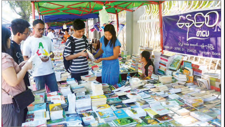
စနေ-တနင်္ဂနွေ ရန်ကုန်စာအုပ်လမ်းတွင် ပြည်တွင်း၊ ပြည်ပမှ စာပေချစ်မြတ်နိုးသူများနှင့် စည်ကားလျက်ရှိသည်ကို တွေ့ရစဉ်။