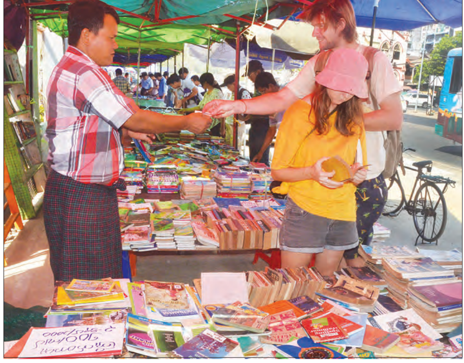
စနေ-တနင်္ဂနွေ စာအုပ်လမ်းတွင် နိုင်ငံခြားသားများ စာအုပ်ဝယ်ယူရန် ကြည့်ရှုနေသည်ကို တွေ့ရစဉ်။