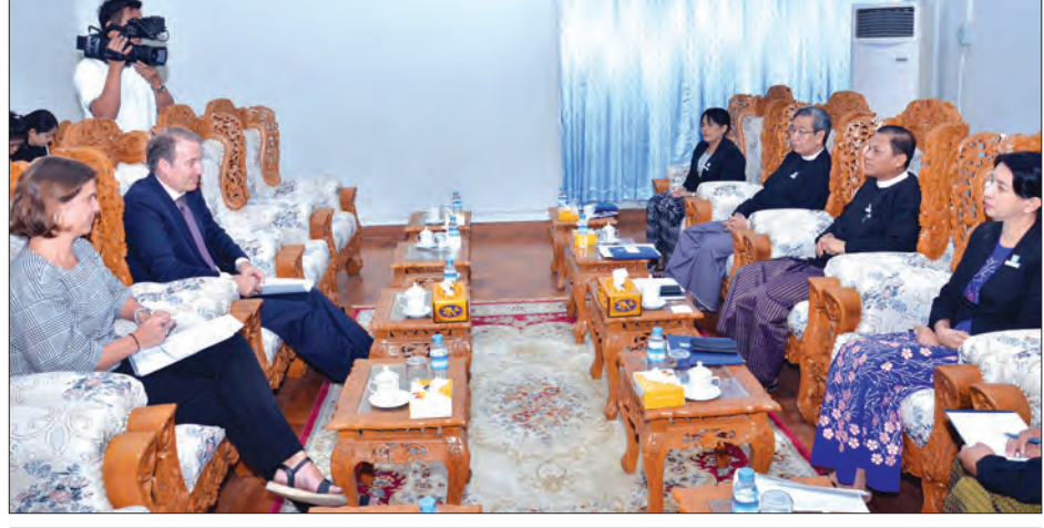
ပြည်ထောင်စုရှေ့နေချုပ် ဦးထွန်းထွန်းဦးနှင့် ဥရောပသမဂ္ဂကိုယ်စားလှယ်အဖွဲ့ရုံးမှ သံအမတ်ကြီးတို့ တွေ့ဆုံစဉ်။

အထည်ဖော်ဆောင်ရွက်နေသည့် တရား မျှတမှုဆိုင်ရာ အထောက်အကူပြု လုပ်ငန်းများ၊ ပြည်ထောင်စုရှေ့နေချုပ် ရုံးနှင့် ပူးပေါင်းဆောင်ရွက်နေသည့် လုပ်ငန်းများနှင့် ဆက်လက်တိုးမြှင့် ဆောင်ရွက်မည့်လုပ်ငန်း အစီအစဉ်များ၊ တရားဥပဒေစိုးမိုးရေးနှင့် တရားမျှတမှု တိုးတက်ကောင်းမွန်ရေးအတွက် ရှေ့နေ များ၏ ပါဝင်မှုအခန်းကဏ္ဍနှင့် တရားလွှတ်တော်ရှေ့နေများကောင်စီ အက်ဥပဒေကို ပြင်ဆင်ဆောင်ရွက်နေ မှုများ၊ အမုန်းစကားများ ကာကွယ် တားဆီးရေး ဥပဒေကြမ်းနှင့် အမျိုးသမီး များအပေါ် အကြမ်းဖက်မှုတားဆီး ကာကွယ်ရေးဥပဒေကြမ်းတို့ကို ရေးဆွဲရာ တွင် အပြည်ပြည်ဆိုင်ရာကုန်ပိုင်းရင်း များ၊ စံနှုန်းများနှင့် ညီညွတ်ရေးအတွက် အလေးထားဆောင်ရွက်မည်ကိုစွဲရပ်များ ကို ဆွေးနွေးကြသည်။ သတင်းစဉ်