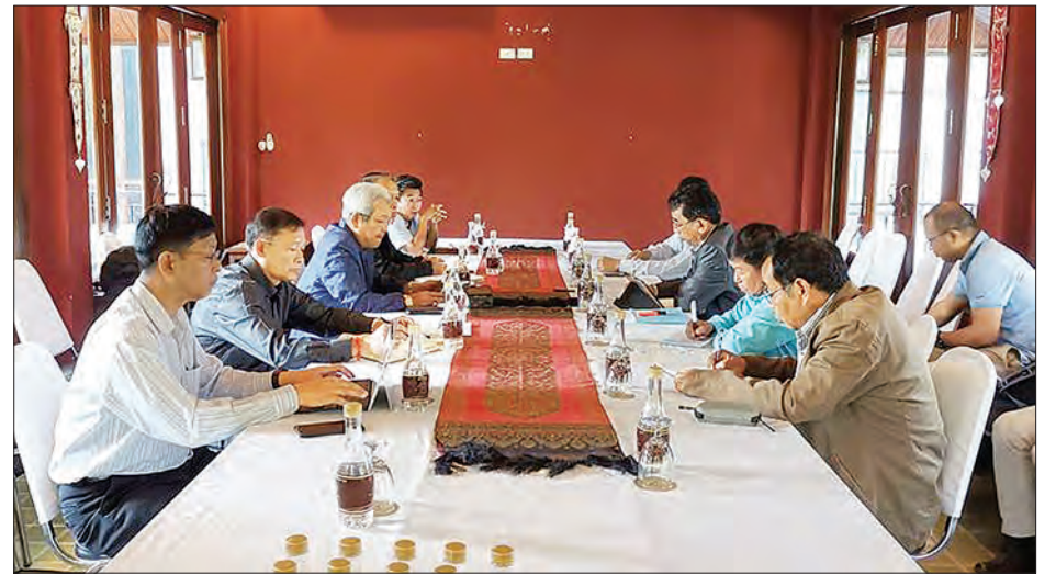
မတ် ၁၀ ရက်က ငြိမ်းချမ်းရေးကော်မရှင် (PC) အတွင်းရေးမှူးနှင့် အဖွဲ့နှင့် ကရင်နီ အမျိုးသားတိုးတက်ရေးပါတီ (KNPP) တို့ တွေ့ဆုံဆွေးနွေးစဉ်။