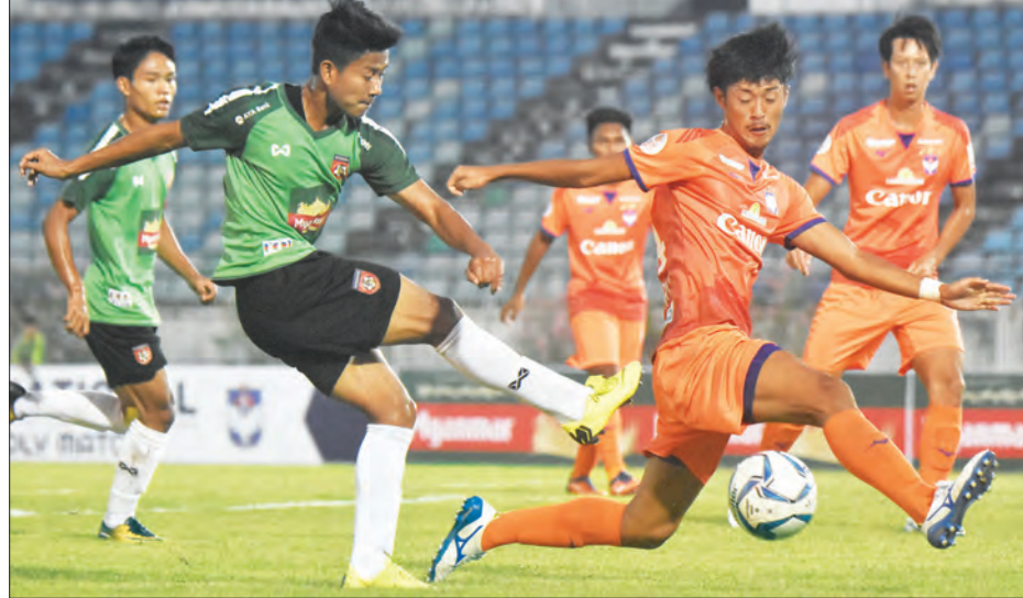
မတ် ၉ ရက်က မြန်မာ ယူ-၂၂ အသင်းနှင့် နီဂါတာအသင်း ခြေစစ်ပွဲကစားနေစဉ်။

မည်ဖြစ်သည်။ မြန်မာအသင်းသည် ပထမဆုံး ကျင်းပမည့် ၂၀၁၄ ပြိုင်ပွဲတစ်ကြိမ်သာ ခြေစစ်ပွဲအောင်မြင်ခဲ့ပြီး နောက်ပိုင်း ကျင်းပမည့် ၂၀၁၆၊ ၂၀၁၈ ပြိုင်ပွဲများ တွင် ခြေစစ်ပွဲအောင်မြင်ခဲ့ခြင်းမရှိပေ။ မြန်မာအသင်းသည် ခြေစစ်ပွဲမအောင် သည့် စာမျက်နှာ ၁၀ ကော်လံ ၄ ◆