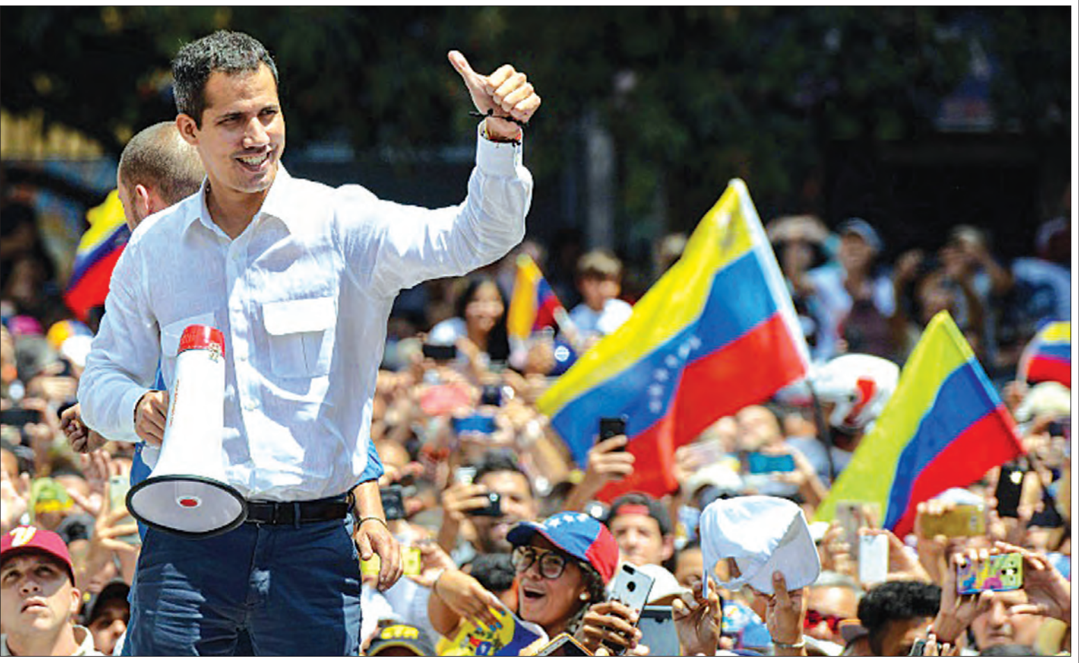
ဗင်နီဇွဲလားအတိုက်အခံခေါင်းဆောင် ဂျူအန်ဂွိုက်ဒိုကို လူထုအလယ်တွင် တွေ့ရစဉ်။

ဗင်နီဇွဲလားနိုင်ငံရဲ့လမ်းတွေပေါ်မှာ အတိုက်အခံခေါင်းဆောင် ဂျူအန်ဂွိုက်ဒိုနဲ့ သမ္မတ နီကိုလပ် မာဒူရိုကိုထောက်ခံသူတွေဟာ ခေါင်းဆောင်နှစ်ဦးရဲ့ တိုက်တွန်းမှုအရ သူထက်ငါအပြိုင်အဆိုင် ဆန္ဒဖော်ထုတ်လျက်ရှိပါတယ်။ အခုဆိုရင် နိုင်ငံအတွင်း လျှပ်စစ်ဓာတ်အားပြတ်တောက်မှုဖြစ်နေတာ သုံးရက်မြောက်နေပြီ။ ရောက်ရှိလာပါပြီ။