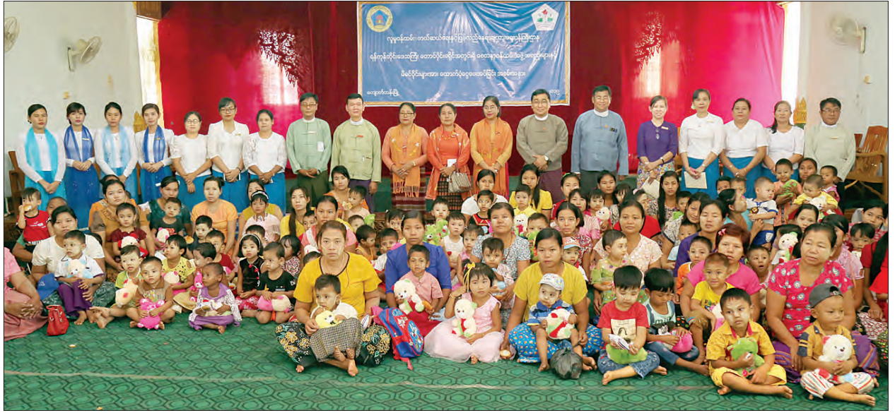
ပြည်ထောင်စုဝန်ကြီး ဒေါက်တာဝင်းမြတ်အေးနှင့်တာဝန်ရှိသူများ တောင်ပိုင်းခရိုင်အတွင်းရှိ စေတနာ့ဝန်ထမ်းအဖွဲ့အစည်းများနှင့် မိခင်ပိုင်းများအား ထောက်ပံ့ပေးအပ်ပွဲသို့ တက်ရောက်လာသည့် မိခင်နှင့်ကလေးများနှင့်အတူ စုပေါင်းမှတ်တမ်းတင်ဓာတ်ပုံရိုက်စဉ်။ သတင်းစဉ်

ပြန်လည်ပြောကြားသည်။ ဆက်လက်၍ ပြည်ထောင်စုဝန်ကြီးနှင့်အဖွဲ့သည် အခမ်းအနားသို့ တက်ရောက်လာကြသော ကလေးငယ်များအတွက် အာဟာရမုန့်နှင့် ကစားစရာအရုပ်များ ပေးဝေခဲ့ကြသည်။ ယနေ့ စုစုပေါင်း ထောက်ပံ့ငွေကျပ် ၃၂၁၅၅၇၀၀ ဖြစ်သည်။ ညှိနှိုင်းဆွေးနွေး ပြည်ထောင်စုဝန်ကြီးနှင့်အဖွဲ့သည် ညနေပိုင်းတွင် ရန်ကုန်မြို့၊ ရှေးဦးအရွယ် ကလေးသူငယ် ပြုစုပျိုးထောင်ရေးနှင့် ဘက်စုံဖွံ့ဖြိုးရေးဆိုင်ရာ ပင်မအထောက်အကူပြုဟိုဌာနတွင် ကျင်းပသော ရှေးဦးအရွယ် ကလေးသူငယ်ပြုစုပျိုးထောင်ရေးနှင့် ဖွံ့ဖြိုးရေးဆိုင်ရာ အခြေခံသင်တန်း (၃လ) ဖွင့်လှစ်နိုင်ရေး ဆောင်ရွက်ချက်များ ညှိနှိုင်းဆွေးနွေးပွဲသို့ တက်ရောက်သည်။ ဆွေးနွေးပွဲတွင် ပြည်ထောင်စုဝန်ကြီးက အဖွဲ့အမှာစကားပြောကြားခဲ့ပြီး ရှေးဦးအရွယ် ကလေးသူငယ်ပြုစုပျိုးထောင်ရေးနှင့် ဘက်စုံဖွံ့ဖြိုးရေးဆိုင်ရာ ပင်မအထောက်အကူပြုဟိုဌာန လက်ထောက်ညွှန်ကြားရေးမှူးက အခြေခံသင်တန်း (၃လ) အမြန်ဆုံးဖွင့်လှစ်နိုင်ရန် INGO အဖွဲ့အစည်းများနှင့် ပူးပေါင်းဆောင်ရွက်လျက်ရှိသည့် အခြေအနေများကို တင်ပြဆွေးနွေးခဲ့ပြီး လိုအပ်ချက်များကို ပြည်ထောင်စုဝန်ကြီးနှင့် ဒုတိယဝန်ကြီး၊ ညွှန်ကြားရေးမှူးချုပ်နှင့် တာဝန်ရှိသူများက ပြန်လည်ညှိနှိုင်း ဆွေးနွေးခဲ့ကြကြောင်း သိရသည်။ သတင်းစဉ်