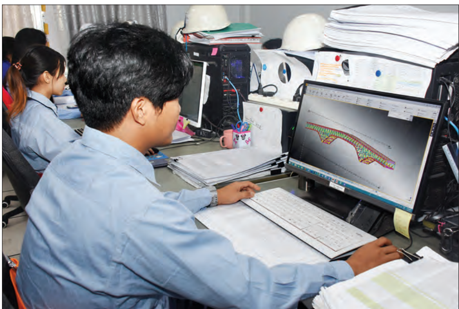
J & M Steel Solution Co, Ltd. မှ ဝန်ထမ်းများ ကွန်ပျူတာဖြင့် တံတားပုံစံဒီဇိုင်းများ ရေးဆွဲနေကြစဉ်။

အချိန်တိကျ သေချာ “ဒီစက်ရုံမှာ သန့်ရှင်းရေး၊ ကျန်းမာ ရေး၊ လုံခြုံရေးအပိုင်းတွေကို အလေးထား ဆောင်ရွက်ထားတယ်။ အလုပ်သမား တွေ လုပ်ငန်းခွင်ဘေးအန္တရာယ် ကင်းရှင်း ရေးနဲ့ ကျန်းမာရေးစောင့်ရှောက်မှု အတွက် ဆရာဝန်နဲ့ ဆေးခန်းထား ရှိပေးတယ်။ လုပ်ငန်းခွင် ပြီးစီးတဲ့အခါ ရေချိုးဖို့၊ အဝတ်လဲဖို့အခန်းတွေလည်း ထားရှိပေးတယ်။ စားသောက်ခန်း၊ နားနေခန်း၊ ဧည့်တွေခန်း စတာတွေက အစ စနစ်တကျ ထားရှိပေးပါတယ်။ စည်းကမ်းပိုင်းဆိုလည်း အချိန်တိကျ သေချာရတယ်”ဟု ထုတ်လုပ်ရေးဌာနမှ Factory Leader ကိုတံဘီ က ပြောသည်။