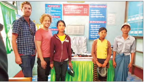
နယ်သာလန်နိုင်ငံသားများနှင့် တာဝန်သိပြည်သူများကို တွေ့ရစဉ်။

နည်းပညာအသုံးပြုမှုနှင့် ရေယာဉ်များ အကူအညီပေးရေး၊ ရေကြောင်းတရားဥပဒေစိုးမိုးရေးတို့နှင့် စပ်လျဉ်း၍ ညှိနှိုင်းဆွေးနွေးခဲ့ပြီး ဆစ်ဒနီမြို့သို့ သွားရောက်၍ ဆစ်ဒနီအပြည်ပြည်ဆိုင်ရာ လေဆိပ်တွင် လုံခြုံရေး၊ ခရီးသည်များနှင့် ပြည်ပဝင်/ထွက်မှုများ ရှာဖွေစစ်ဆေးခြင်း၊ သတင်းရယူခြင်းတို့နှင့်ပတ်သက်၍ လက်တွေ့ဆောင်ရွက်မှုများကို လေ့လာကြည့်ရှုခဲ့ပြီး ဌာနချုပ်ရုံးခွဲ (Sydeny) တွင် AFP နှင့် ABF တို့မှ တာဝန်ရှိသူ ရဲဘက်ဆိုင်ရာ အကြီးအကဲများတို့နှင့်တွေ့ဆုံ ဆွေးနွေးခဲ့သည်။ မတ် ၈ ရက်တွင် နယ်စပ်ဒေသရဲတပ်ဖွဲ့ရေယာဉ်နှင့် ပင်လယ်ရေကြောင်းဆိုင်ရာ လေ့ကျင့်ရေးစခန်းတွင် နယ်စပ်နယ်နိမိတ် ပင်လယ်ရေကြောင်းလုံခြုံရေးဆောင်ရွက်မှုများနှင့် သင်တန်းပေးလေ့ကျင့်မှုများကို လည်းကောင်း၊ ဩစတြေးလျရဲအရာရှိကြီးအဆင့် ရဲတက္ကသိုလ် (Australian Institute and Police Management-AIPM) သို့ သွားရောက်၍ တာဝန်ရှိသူများနှင့်တွေ့ဆုံကာ ရဲအရာရှိများ စွမ်းရည်မြှင့်တင်ရေးသင်တန်းများနှင့် ပတ်သက်၍ လေ့လာမေးမြန်း ဆွေးနွေးခြင်း၊ မြန်မာ-ဩစတြေးလျ နှစ်နိုင်ငံ ရဲတပ်ဖွဲ့အချင်းချင်း ပူးပေါင်းဆောင်ရွက်မှု တိုးမြှင့်ရေးတို့ကို ဆွေးနွေးသည်။ ရဲချုပ်နှင့်အဖွဲ့သည် မတ် ၉ ရက် ညပိုင်းတွင် လေကြောင်းခရီးစဉ်ဖြင့် မြန်မာနိုင်ငံ ရန်ကုန်မြို့သို့ ပြန်လည်ရောက်ရှိကြောင်း သိရသည်။ သတင်းစဉ်