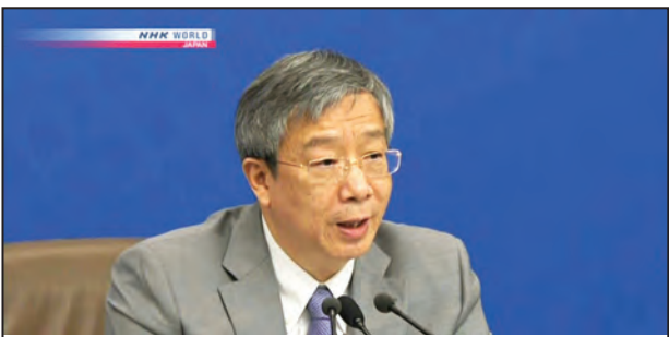
တရုတ်ပဟိုဘာန်ဥက္ကဋ္ဌ ယီဂန်