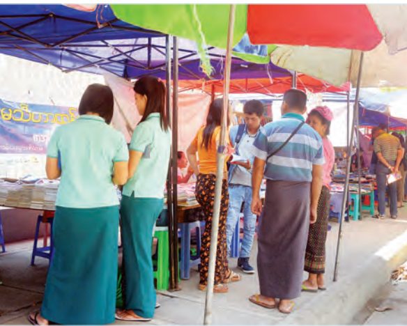
စနေ-တနင်္ဂနွေ ရန်ကုန်စာအုပ်လမ်းတွင် စာပေဝါသနာရှင်များ စာအုပ်များ ရွေးချယ်ဝယ်ယူနေကြစဉ်။