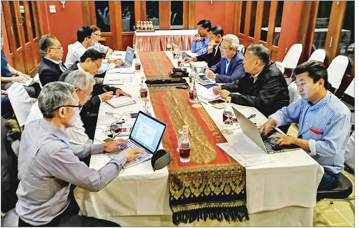
ငြိမ်းချမ်းရေးကော်မရှင် (PC) အတွင်းရေးမှူးနှင့်အဖွဲ့ ကရင်အမျိုးသားအစည်းအရုံး (KNU) ဒုတိယဥက္ကဋ္ဌနှင့် အတွင်းရေးမှူးများပါဝင်သည့် ကိုယ်စားလှယ်အဖွဲ့နှင့် မတ် ၈ ရက်က တွေ့ဆုံဆွေးနွေးစဉ်။