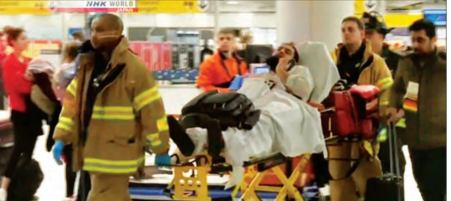
ခရီးစဉ်အတွင်းထိခိုက်ဒဏ်ရာရရှိသူတစ်ဦးကို သယ်ဆောင်လာစဉ်။