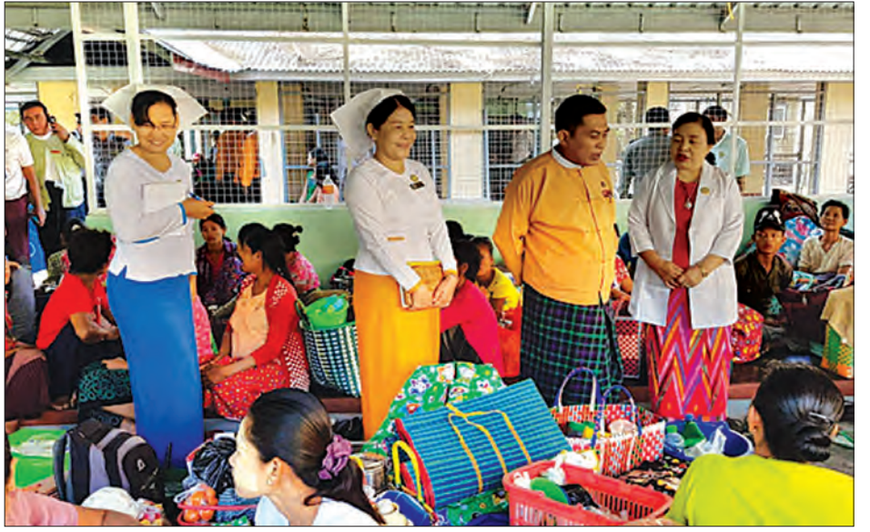
ပြည်မြို့ပြည်သူ့ဆေးရုံကြီး၌ တိုင်းဒေသကြီးဝန်ကြီးချုပ် လှည့်လည်ကြည့်ရှုစဉ်။

သရေခေတ္တရာမြို့ဟောင်းသည် ရန်ကုန်မြို့၏အနောက်မြောက်ဘက်မိုင် ၁၈၀၊ ပြည်မြို့အရှေ့တောင်ဘက် ငါးမိုင်ခန့် အကွာတွင် တည်ရှိပြီး မြို့ရိုးမှာ အစိုင်းသဏ္ဍာန်တည်ရှိ၍ လေး