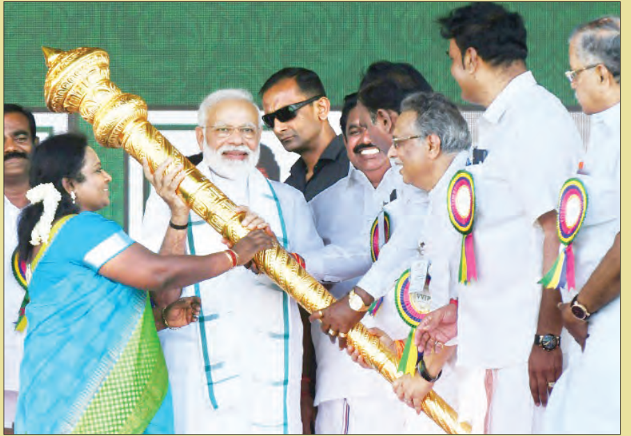
ဝန်ကြီးချုပ်မိုဒီနှင့် ၎င်း၏ ပါတီဝင်များကို တွေ့ရစဉ်။

ပြီးခဲ့သည့် ၂၀၁၄ ခုနှစ် ရွေးကောက်ပွဲအတွင်း ပြည်သူသန်းပေါင်း ၈၃၀ တို့ မဲပေး ခွင့်ရရှိခဲ့သော်လည်း ပြည်သူ သန်းပေါင်း ၅၅၀ သာ မဲထည့်ဝင်ခဲ့ကြသည်။