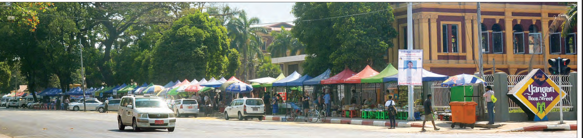
စနေ-တနင်္ဂနွေ ရန်ကုန်စာအုပ်လမ်းကို တွေ့ရစဉ်။