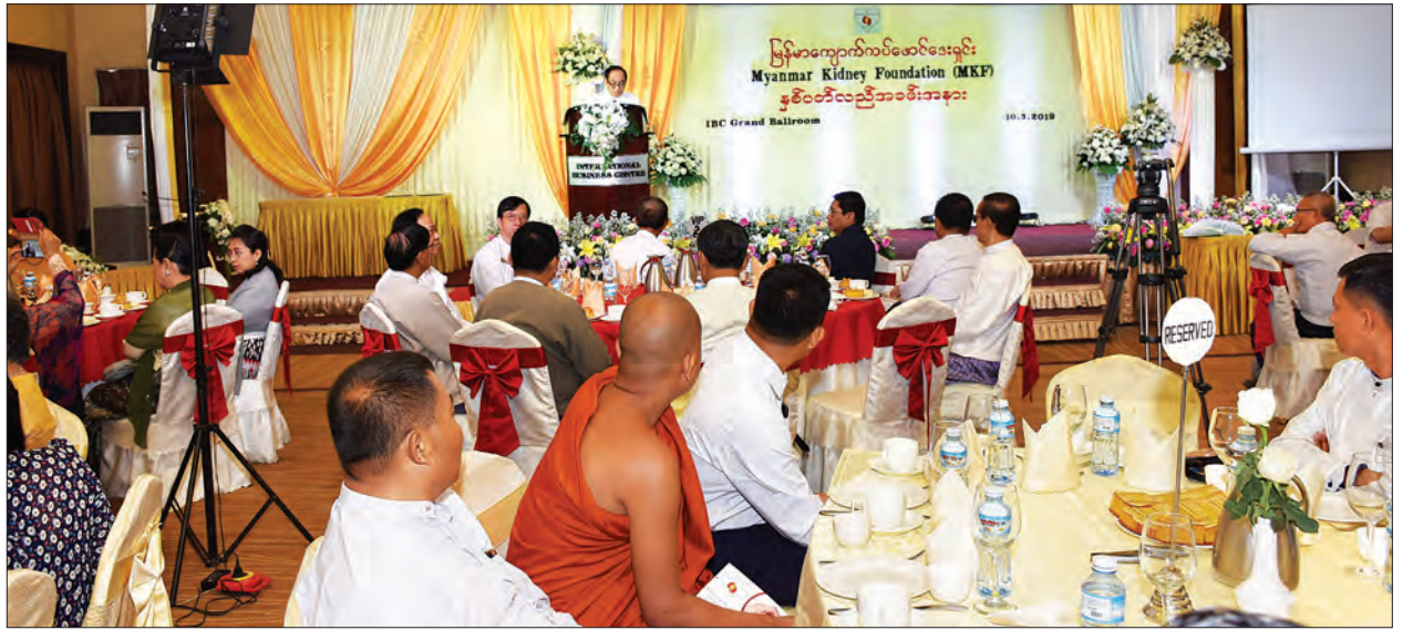
ပြည်ထောင်စုဝန်ကြီး ဒေါက်တာမြင့်ထွေး မြန်မာကျောက်ကပ်ဖောင်ဒေးရှင်း၏ နှစ်ပတ်လည်အခမ်းအနားတွင် အမှာစကား ပြောကြားစဉ်။

ကျောက်ကပ်ရောဂါ ဖြစ်ပွားပါက နေထိုင်မှုအရည်အသွေးများစွာ ကျဆင်းခြင်း၊ စနစ်တကျကုသမှုမခံယူပါက ရောဂါပိုမိုဆိုးရွားကာ အသက်ပေးဆုံးသည်အထိ ဖြစ်နိုင်သည်ဖြစ်၍ ရောဂါမဖြစ်ပွားမီ ကြိုတင်ကာကွယ်မှုများ ပြုမှုဆောင်ရွက်ရန်မှာ အရေးကြီးပါကြောင်း။