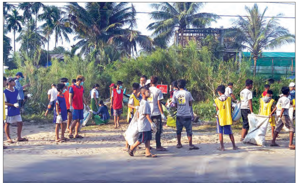
ဈာပုံမြို့သန့်ရှင်းသာယာရေးအတွက် စုပေါင်းအမှိုက်ကောက်နေသည့်ကို တွေ့ရစဉ်။

ဈာပုံမြို့၌ မြို့သန့်ရှင်းသာယာလှပရေးအတွက် ဌာနဆိုင်ရာများနှင့် လူမှုရေးအသင်းအဖွဲ့များစုပေါင်း၍ အပတ်စဉ် စနေနေ့တိုင်း သန့်ရှင်းရေးပြုလုပ်လျက်ရှိရာ ယခုအကြိမ်သည် မြောက်ကြိမ်မြောက်ဖြစ်ကြောင်း၊ လာမည့် စနေနေ့တွင် ခုနစ်ကြိမ်မြောက် လုပ်ငန်းဆက်လက် ဆောင်ရွက်မည်ဖြစ်ရာ မည်သူမဆို ပူးပေါင်းပါဝင်နိုင်ကြောင်း သိရသည်။