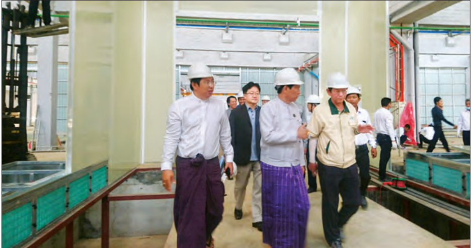
ပြည်ထောင်စုဝန်ကြီး ဦးခင်မောင်ချို Daewoo Bus Myanmar မော်တော်ယာဉ် တပ်ဆင်ထုတ်လုပ်ရေးစီမံကိန်းအတွင်း လှည့်လည်ကြည့်ရှုစဉ်။ သတင်းစဉ်

တင်ပြချက်များအပေါ် ပြည်ထောင်စုဝန်ကြီးက Chassis တပ်ဆင်ထုတ်လုပ်ရေးလိုင်စင်၊ မော်တော်ယာဉ်ကိုယ်ထည် (Coach) တပ်ဆင်ထုတ်လုပ်ရေးလိုင်စင်/ Welding တွဲဆက်ရန် လျာထားသောနေရာများ၊ အင်ဂျင်နှင့် မော်တော်ယာဉ်အောက်ပိုင်း တပ်ဆင်ရေးလိုင်စင်များ စနစ်တကျ သတ်မှတ်ပုံစံအတိုင်းတပ်ဆင်၍ အမြန်ပြီးစီးရန် မှာကြားပြီး Shower Test ဆောက်လုပ်နေမှုအား ကြည့်ရှုစစ်ဆေးသည်။ Daewoo Bus Myanmar မော်တော်ယာဉ် တပ်ဆင်ထုတ်လုပ်ရေးအတွက် လိုအပ်သော စက်ကိရိယာများသည် ရောက်ရှိနေပြီဖြစ်၍ အမြန်ဆုံးပြီးစီးအောင် ဆောင်ရွက်လျက်ရှိပြီး ကိုရီးယားနိုင်ငံတွင် စာတွေ့၊ လက်တွေ့သင်ကြားပြီးဆုံး၍ ပြန်လည်ရောက်ရှိနေသော မြန်မာအင်ဂျင်နီယာများနှင့် ပညာရှင်များ၊ ကိုရီးယားအင်ဂျင်နီယာများနှင့် ပူးတွဲ၍ စက်ကိရိယာများ တပ်ဆင်သည်မှ မော်တော်ယာဉ် ထုတ်လုပ်သည်အထိ လုပ်ငန်းများ စတင်ဆောင်ရွက်လျက် ရှိကြောင်း သိရသည်။