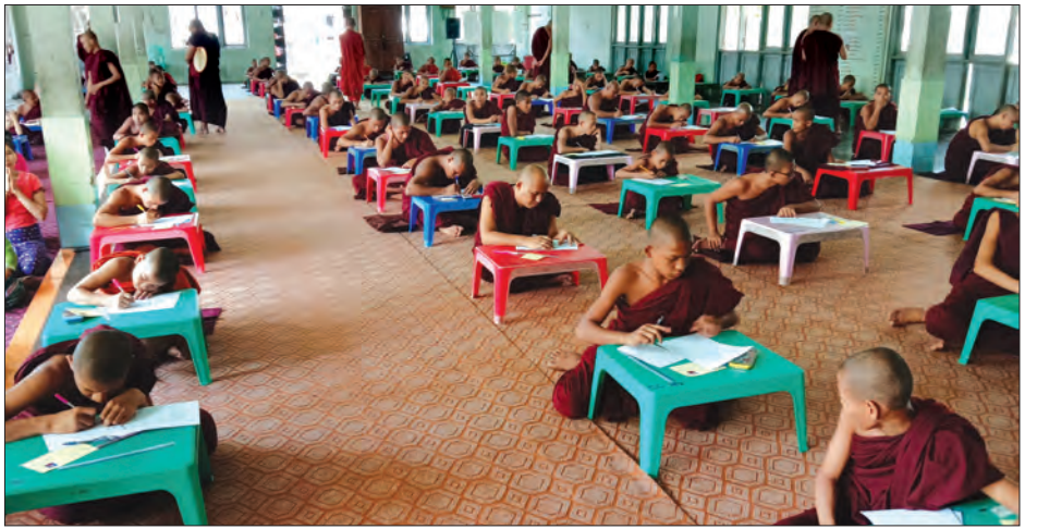
(၆၄) ကြိမ်မြောက် ပရိယတ္တိသာသနနက္ခယအသင်း စာဖြေပွဲတော် ကျင်းပစဉ်။

အဆိုပါ စာဖြေပွဲတော်ကျင်းပ သည့်ရက်အတွင်း မြို့နယ်အတွင်းရှိ အလှူ ရှင်များက အရက်ဆွမ်းနှင့် နေ့ဆွမ်းများ ဆက်ကပ် လှူဒါန်းလျက်ရှိပြီး မတ် ၁၂