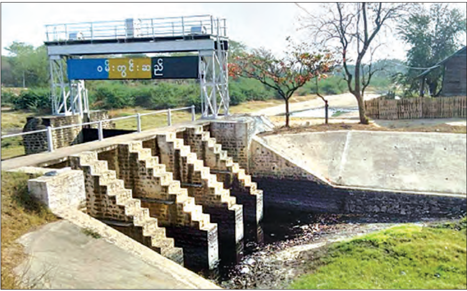
ဆည်မြောင်းကောနေသည့်နေရာကို တွေ့ရစဉ်။

မန္တလေးတိုင်းဒေသကြီး ဝမ်းတွင်းမြို့ရှိ တောင်သူများသည် စိုက်ပျိုးရေးကို အဓိကထား လုပ်ကိုင်ကြရာ ဝမ်းတွင်းမြို့ ဆည်မြောင်းမှရေကိုလည်း အဓိကထား မှီခိုနေကြောင်း၊ ယခုအခါ အဆိုပါ ဝမ်းတွင်းဆည်မှ ရေပေးဝေသည့် မြောက်ဘက်ဆုံး ရေမြောင်းကောနေ၍ ထိုရေမြောင်းစီးဆင်းရာဒေသရှိ တောင်သူများစိုက်ပျိုးရန် ရေမရရှိသဖြင့် ကျေးရွာခြောက်ရွာရှိတောင်သူများ အခက်အခဲကြုံတွေ့နေကြောင်း ဒေသခံစိုက်ပျိုးရေးလုပ်ကိုင်သူများထံမှ သိရသည်။