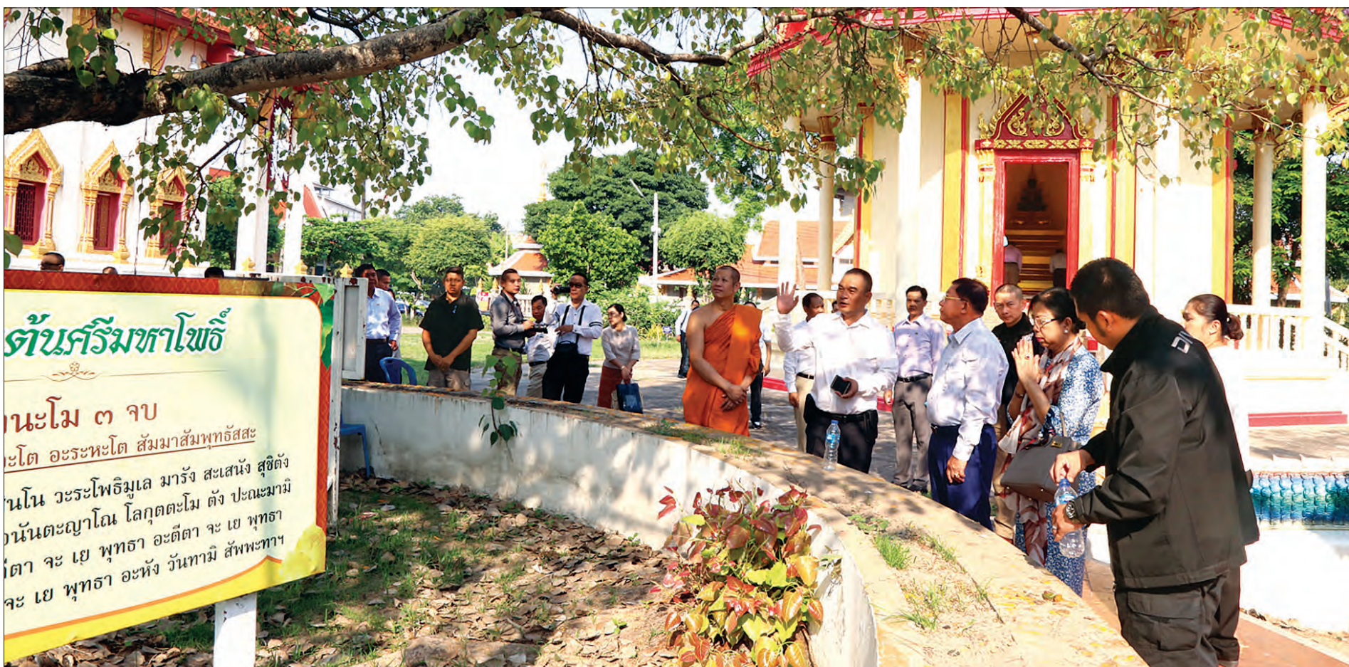
တပ်မတော်ကာကွယ်ရေးဦးစီးချုပ် ဗိုလ်ချုပ်မှူးကြီး မင်းအောင်လှိုင်နှင့် ဇနီး ဒေါ်ကြူကြူလှနှင့် အဖွဲ့ Wat Bodhisomphon ဘုရားကျောင်းအတွင်း နှစ် ၉၀ သက်တမ်းရှိ ဗောဓိညောင်ပင်အား ကြည့်ရှုလေ့လာကြည့်ညိုကြစဉ်။

နေပြည်တော် မတ် ၁၀ ထိုင်းဘုရင့်တပ်မတော် ကာကွယ်ရေးဦးစီးချုပ် General Ponpipaatt Benyasri ၏ ဖိတ်ကြားချက်အရ ထိုင်းနိုင်ငံ၌ ချစ်ကြည်ရေးခရီးရောက်ရှိနေသည့် တပ်မတော်ကာကွယ်ရေးဦးစီးချုပ် ဗိုလ်ချုပ်မှူးကြီး မင်းအောင်လှိုင်နှင့် ဇနီး ဒေါ်ကြူကြူလှနှင့် အဖွဲ့သည် ယနေ့နံနက်ပိုင်းတွင် Udon Thani ခရိုင်ရှိ Wat Bodhisomphon ဘုရားကျောင်းသို့ သွားရောက်ဖူးမြော်ကြည်ညိုကြသည်။ တပ်မတော်ကာကွယ်ရေးဦးစီးချုပ်နှင့် ဇနီးအဖွဲ့ဝင်များသည် Wat Bodhisom-