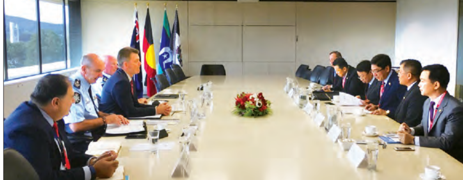
မြန်မာနိုင်ငံရဲတပ်ဖွဲ့ ရဲချုပ်နှင့်အဖွဲ့ ဩစတြေးလျနိုင်ငံ ပြည်ထောင်စုရဲအဖွဲ့ ရဲချုပ်နှင့်အဖွဲ့တို့ တွေ့ဆုံဆွေးနွေးစဉ်။