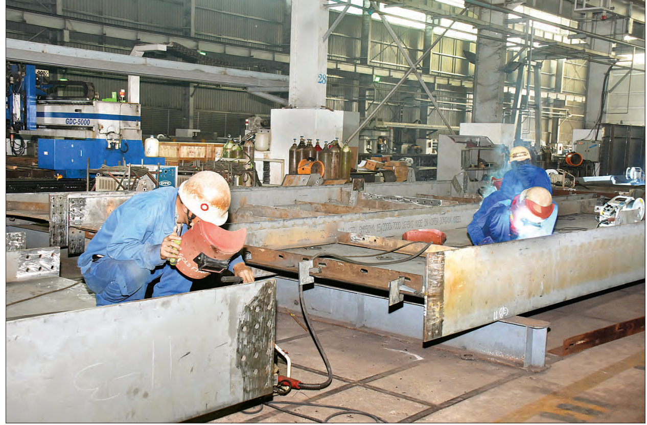
J & M သံမဏိစက်ရုံမှ ဝန်ထမ်းများ လုပ်ငန်းခွင်ဆောင်ရွက်နေမှုကို တွေ့ရစဉ်။