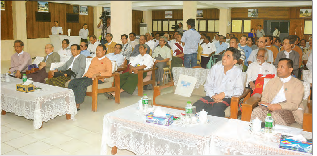
မြန်မာရေးရာလေ့လာရေးအဖွဲ့က ပြုစုရေးသားထုတ်ဝေသည့် ကမ္ဘာ့ရေးရာအမှတ်(၁) စာအုပ်မိတ်ဆက်ပွဲတွင် ပြည်ထောင်စုဝန်ကြီး ဒေါက်တာဖေမြင့် အမှာစကား ပြောကြားစဉ်။

အထောက်အကူဖြစ်မည် ထို့နောက် ကမ္ဘာ့ရေးရာအမှတ် (၁) စာအုပ်မိတ်ဆက်ပွဲ အခမ်းအနားသို့ တက်ရောက်ပြီး တိုင်းပြည်ဖွံ့ဖြိုးတိုးတက်မှုသည် ထိုတိုင်းပြည်၏ အသိဉာဏ်ပညာဖွံ့ဖြိုးတိုးတက်မှုအပေါ်တွင် မူတည်ပါကြောင်း၊ အသိပညာဖွံ့ဖြိုးတိုးတက်စေရန် ဘာသာရပ်တစ်ခုကို စူးစမ်းလေ့လာသုတေသနပြုသည့် ပုဂ္ဂိုလ်များက စုဝေးဆွေးနွေးပွဲပင်ပြီး တင်ပြကြမည်၊ တင်ပြသည့်အပေါ် ဖေဖော်ဝါရီလထောက်ပြမည်၊ ဖြည့်စွက်မည် စသည့် နည်းလမ်းများကို အသုံးပြုခြင်းဖြင့် တိုင်းပြည်၏ အသိပညာများဖွံ့ဖြိုး