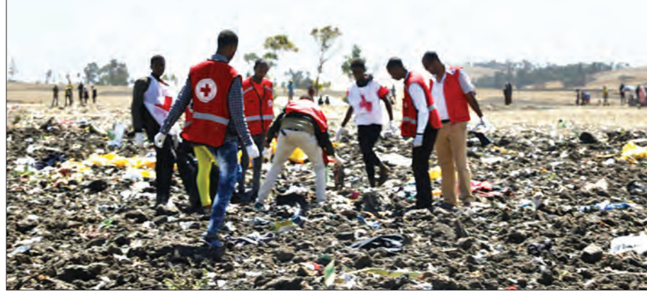
ပျက်ကျလေယာဉ်၏ အပျက်အစီးများကြားတွင် ကယ်ဆယ်ရေးဆောင်ရွက်ရန် ရောက်ရှိနေသည့် ကြက်ခြေနီအဖွဲ့ကို တွေ့ရစဉ်။