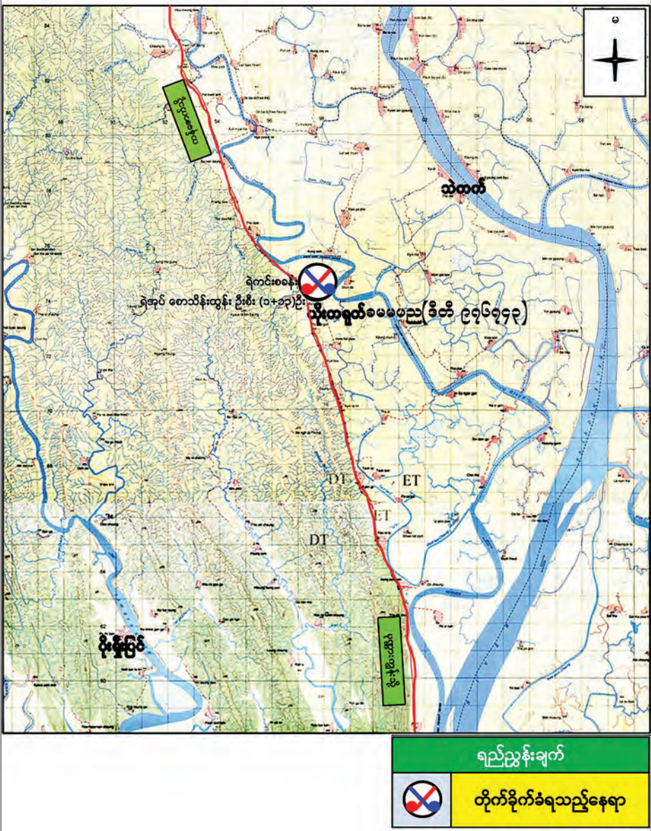
၉-၃-၂၀၁၉ ရက်နေ့ ပုဏ္ဏားကျွန်းမြို့နယ်၊ ယိုးတရတ်ရဲကင်းစခန်းအား AA သောင်းကျန်းသူအဖွဲ့မှ ဝင်ရောက်တိုက်ခိုက်သည့် နေရာပြမြေပုံ

၁၁ နာရီမိနစ် ၂၀ ခန့်မှ မိနစ် ၅၀ ခန့်အထိ AA သောင်းကျန်းသူအဖွဲ့က လက်နက်ကြီး၊ လက်နက်ငယ်များဖြင့် ဝင်ရောက်တိုက်ခိုက်ခဲ့ကြောင်း၊ အဆိုပါ ရဲကင်းစခန်းသည် ယိုးတရတ်ကျေးရွာတွင်လှည့်လည်ထားသည့် ၂၀၁၉ ခုနှစ်တက္ကသိုလ် ဝင်တန်း စာစစ်ဌာန၏မေးခွန်းလွှာနှင့် အဖြေလွှာများအား ထိန်းသိမ်းသည့်လုပ်ငန်းတာဝန်ထမ်းဆောင်နေခြင်းဖြစ်ကြောင်း၊ ယခုကဲ့သို့ အင်အားအလုံးအရင်းဖြင့် တိုက်ခိုက်ခံရမှုကြောင့် ကျဆုံးသွားသည့် တပ်ဖွဲ့ဝင်များမှာ ပုဏ္ဏားကျွန်းမြို့နယ်နှင့် ယိုးတရတ်ကျေးရွာဇာတိ ဒေသခံရခိုင်တိုင်းရင်းသားများ ဖြစ်ကြောင်း မြန်မာနိုင်ငံ ရဲတပ်ဖွဲ့မှ သတင်းရရှိသည်။ သတင်းစဉ်