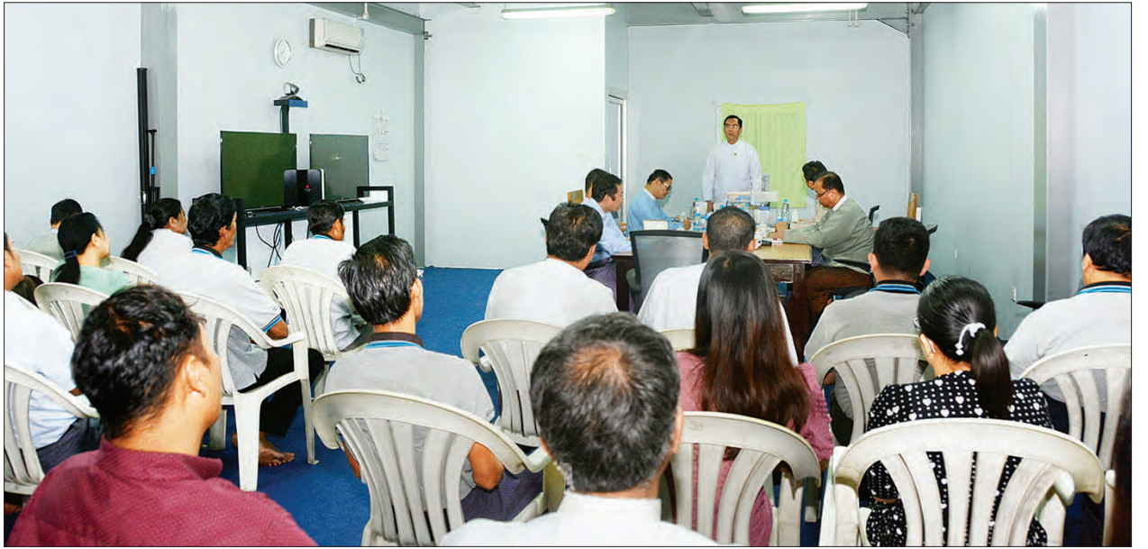
ပုံနှိပ်စက်ရုံသို့ ရောက်ရှိပြီး ကျောင်းသုံးစာအုပ်များ ရိုက်နှိပ်ထုတ်ဝေနေမှုနှင့် မကြာမီ ကျင်းပမည့် ရန်ကုန်မြို့တော် စည်ပင်သာယာရေးကော်မတီအဆင့်ဆင့် ရွေးကောက်ပွဲအတွက် မဲလက်မှတ်များ ပုံနှိပ်ခြင်းလုပ်ငန်းကို ကြည့်ရှုစစ်ဆေးပြီး တာဝန်ရှိသူများအား

ပြန်ကြားရေးဝန်ကြီးဌာန ဒုတိယဝန်ကြီး ဦးအောင်လှထွန်းသည် ယနေ့မွန်းလွဲ ၁ နာရီခွဲတွင် ရန်ကုန်မြို့၊ ဗဟန်းမြို့နယ် ငါးထပ်ကြီးဘုရားလမ်းရှိ The Global New Light of Myanmar သတင်းစာတိုက်၌ သတင်းနှင့်စာနယ်ဇင်းလုပ်ငန်းအောက်ရှိ သတင်းစာတိုက်များမှ စာတည်းအဖွဲ့ဝင်များနှင့် တွေ့ဆုံသည်။