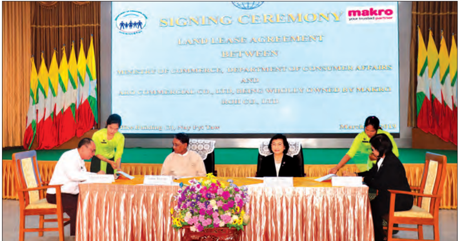
မြေငှားရမ်းခြင်းဆိုင်ရာ လက်မှတ်ရေးထိုးပွဲအခမ်းအနား ကျင်းပစဉ်။

အင်ဂျင်နီယာချုပ်ရုံးဝင်းနှင့် ဆန်စက် အပိုပစ္စည်းစက်ရုံဝင်းရှိ မြေဧက ၉ ဒသမ ၂၂၀ ပေတွင် ကုန်ပစ္စည်းအမျိုးအစား ၈၀၀၀ ခန့် ဖြန့်ဖြူးရောင်းချရန်အတွက် ဆိုင်ခွဲ ကိုးခုဖွင့်လှစ်မည်ဖြစ်ပြီး ပြည်တွင်း အသေးစား၊ အလတ်စားလုပ်ငန်းများမှ ထွက်ရှိသောကုန်ပစ္စည်းများနှင့်တောင်သူ လယ်သမားများဖွံ့ဖြိုးတိုးတက်ရန် မြန်မာ နိုင်ငံမှ လယ်ယာထွက်ကုန်ပစ္စည်းများကို ပြည်ပသို့ တင်ပို့ရောင်းချပေးသွားမည် ဖြစ်သည်။ သတင်းစဉ်