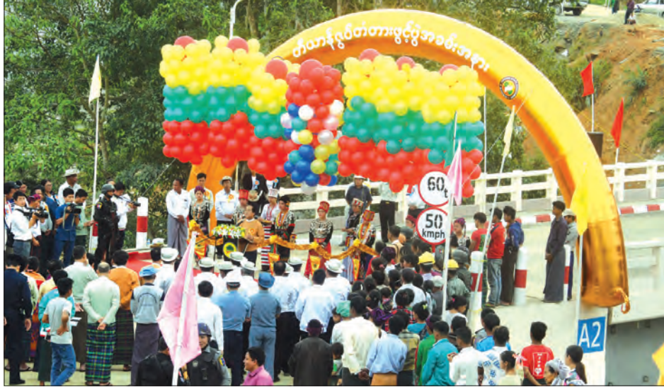
တီယန်ဇွတ်တံတား ဖွင့်လှစ်ပွဲကျင်းပစဉ်။

ထောင်ပုံမြို့ရိုးများထက် ပို၍ ရှေးကျသည်။ ပျူမြို့ဟောင်းများတွင် မိုင် ငါးမိုင်ခွဲ ပတ်လည်ရှိသည်။ သရေခေတ္တရာသည် အရွယ်အစားအကြီးဆုံးဖြစ်ပြီး စတုရန်း တိန်းထက် (ပဲခူး)