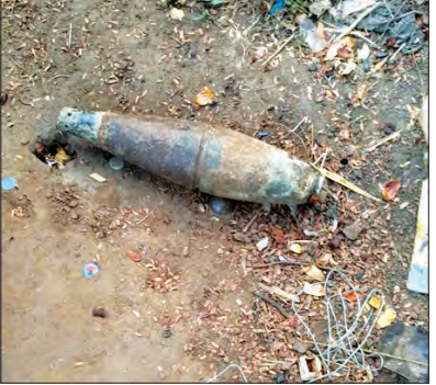
ပုံးသီးဟောင်းအား တွေ့ရစဉ်။

မန္တလေးတိုင်းဒေသကြီး မိတ္ထီလာမြို့နယ် ရေဝေကျေးရွာတွင် တစ်ပေခွဲခန့်ရှိ ပုံးသီးဟောင်းတွေ့ရှိရ၍ သက်မဲ့