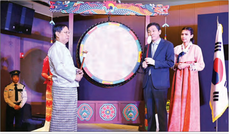
ပြည်ထောင်စုဝန်ကြီး သူရဦးအောင်ကိုနှင့် အာဆီယံ-ကိုရီးယားပဟိုဌာနမှ အထွေထွေအတွင်းရေးမှူး Mr. Lee Hyuk တို့ ကိုရီးယား မင်္ဂလာစည်တော်တို့၍ Korea Day 2019 အခမ်းအနားကို ဖွင့်လှစ်ပေးစဉ်။ သတင်းစဉ်

ပိုမိုနွေးထွေးသော ချစ်ကြည်ရင်းနှီးမှုများ တည်ဆောက်သွားနိုင်လိမ့်မည်ဟု ယုံကြည်ကြောင်း ပြောကြားသည်။ အမှာစကား ပြောကြား ထိုနေ့က တိုင်းဒေသကြီး ဝန်ကြီးချုပ် ဦးဖိုးမင်းသိန်း၊ မြန်မာနိုင်ငံဆိုင်ရာ ကိုရီးယားသံပေတံခွန် ညွှန်ကြားရေးမှူးချုပ် Mr. Lee Saung-Hwa နှင့် ASEAN Korea Centre မှ အထွေထွေ အတွင်းရေးမှူးချုပ် Mr. Lee Hyuk တို့က အမှာစကားပြောကြားကြပြီး မြန်မာ-ကိုရီးယားခရီးသွားလုပ်ငန်းမြှင့်တင်ရေးလုပ်ငန်းအဖွဲ့ဥက္ကဋ္ဌ ဦးသက်လွင်တို့က ကျေးဇူးတင်စကား ပြောကြားသည်။ ယင်းနေ့က ပြည်ထောင်စုဝန်ကြီးနှင့် တာဝန်ရှိသူများက ကိုရီးယား-မြန်မာ နှစ်နိုင်ငံ ရိုးရာယဉ်ကျေးမှု တူရိယာများ ဖြစ်သည့် မြန်မာစည်တော်နှင့် ကိုရီးယားစည်တော်များတို့၏ အခမ်းအနားကို