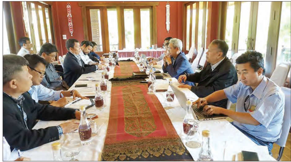
မတ် ၉ ရက်က ငြိမ်းချမ်းရေးကော်မရှင် (PC) အတွင်းရေးမှူးနှင့် အဖွဲ့နှင့် ငြိမ်းချမ်းရေးလုပ်ငန်းစဉ် ဦးဆောင်အဖွဲ့ (PPST) တို့ တွေ့ဆုံဆွေးနွေးစဉ်။

အောက်ခြေမှာရှိတဲ့ အခက်အခဲလေးတွေကို ပိုင်းပြီးတော့ နှစ်ဖက်သဘောထား အမြင်တွေ ဖလှယ်ပြီး သူတို့ KNPP ရဲ့ ဆွေးနွေးပွဲတွေ ဆက်လုပ်ပြီးရင်တော့ သူတို့ကိုလည်း နေပြည်တော်မှာ NRPC နဲ့ ဆွေးနွေးနိုင်ဖို့ပါ။ သူတို့အနေနဲ့ တပ်မတော်နဲ့လည်း ဆွေးနွေးနိုင်ဖို့ ရှိတယ်လို့ ကျွန်တော်နားလည်တဲ့အတွက် သိပ်မကြာခင်မှာ ဖြစ်လာလိမ့်မယ်လို့ နားလည်ပါတယ်။ မေး ။ ။ ကျေးဇူးပါခင်ဗျာ။ ငြိမ်းချမ်းရေး လုပ်ငန်းစဉ်အတွက် အစိုးရရဲ့ ဆက်လက်ဆောင်ရွက်နေမှု တွေကိုလည်း သိချင်ပါတယ်။ ဖြေ ။ ။ မတ်၁၁ရက်၊ နေပြည်တော်မှာ ရှမ်းပြည် ပြန်လည်ထူထောင်ရေးကောင်စီ RCSS နဲ့ ကျွန်တော်တို့ ဆွေးနွေးပွဲတွေရှိတယ်။ အမျိုးသား ပြန်လည်သင့်မြတ်ရေးနှင့် ငြိမ်းချမ်းရေးဗဟိုဌာန (NRPC) နဲ့ RCSS ဆွေးနွေးပွဲပါ။ နောက်ရက် တွေမှာလည်း တပ်မတော်နဲ့ ဆွေးနွေးဖို့ ရှိမယ်လို့တော့ သိရတယ်။ ငြိမ်းချမ်းရေး ကော်မရှင်အနေနဲ့ကတော့ မြောက်ပိုင်းမှာရှိတဲ့ တိုင်းရင်းသား လက်နက်ကိုင် အဖွဲ့အစည်းတွေနဲ့လည်း NCA ရေးထိုးနိုင်ဖို့အတွက် ဆက်လက်ကြိုးစားနေပါတယ်။ တွေ့ဆုံနိုင်ဖို့ ဆောင်ရွက်နေပါတယ်။ တွေ့ဆုံမေးမြန်း-ရဲခေါင်ညွန့်