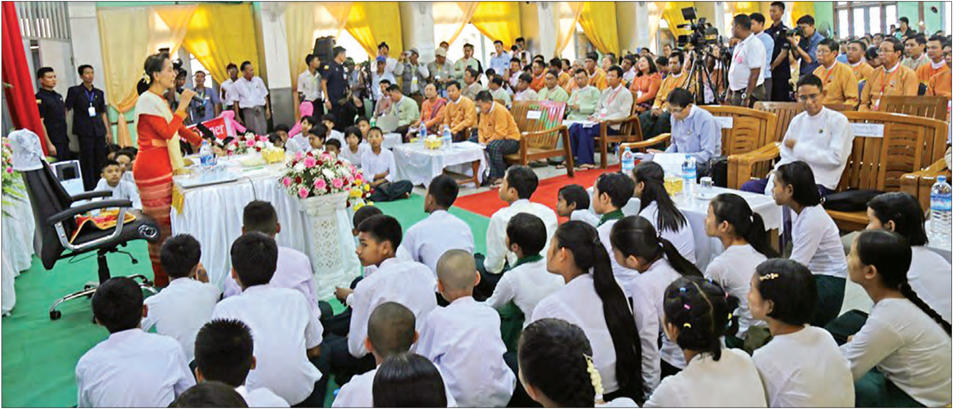
နိုင်ငံတော်၏အတိုင်ပင်ခံပုဂ္ဂိုလ် ဒေါ်အောင်ဆန်းစုကြည် သာယာဝတီမြို့ဆရာစံခန်းမ၌ ဒေသခံပြည်သူများအား တွေ့ဆုံအမှာစကား ပြောကြားစဉ်။