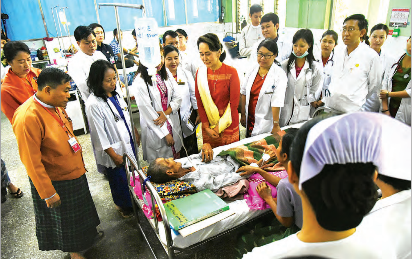
နိုင်ငံတော်၏အတိုင်ပင်ခံပုဂ္ဂိုလ် ဒေါ်အောင်ဆန်းစုကြည် ပြည်မြို့အထွေထွေရောဂါကုဆေးရုံကြီး ခုတင် ၅၀၀ ၌ ဆေးကုသမှုခံယူနေသူများအား ကြည့်ရှုအားပေးစဉ်။