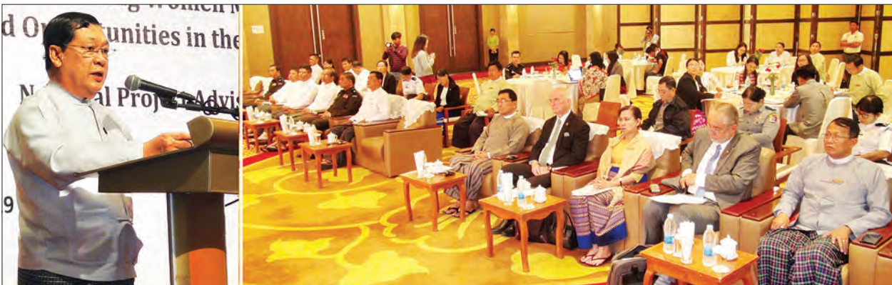
ပြည်ထောင်စုဝန်ကြီး ဦးသိန်းဆွေ အမျိုးသားစီမံကိန်းအစည်းအဝေး၌ အမှာစကား ပြောကြားစဉ်။

ပြုမှုများကို ပိုမိုနားလည်ရေး စည်းရုံးလှုံ့ဆော်ရန် ဦးတည်ဆောင်ရွက်သွားမည်ဖြစ်ကြောင်း၊ UN Women အနေဖြင့် အလုပ်သမားရေးရာများ အထူးသဖြင့် ကျား၊ မ ရေးရာရှုထောင့်မှ အကြံဉာဏ်များ ဆက်လက်ပံ့ပိုးပေးရေး၊ ပြည်ပနိုင်ငံများမှ ပြန်လည်ရောက်ရှိလာသည့် မြန်မာအမျိုးသမီး ရွှေ့ပြောင်းအလုပ်သမားများအတွက် မိသားစုပြန်လည်ပေါင်းစည်းရေးအစီအစဉ်တွင် မိသားစုတစ်ပိုင်တစ်နိုင်လုပ်ငန်းများ ဆောင်ရွက်နိုင်ရေးနှင့် သက်မွေးပညာသင်တန်းများ ဖွင့်လှစ်ပေးရေး ဆက်လက်ကူညီပေးစေလိုကြောင်း၊ ခေတ်စနစ်နှင့် လိုက်လျောညီထွေပြီး အပြည်ပြည်ဆိုင်ရာစံနှုန်းများနှင့်ကိုက်ညီသည့် ပြည်ပအလုပ်အကိုင်ဆိုင်ရာ ဥပဒေပြဋ္ဌာန်းနိုင်ရေး လက်ရှိ ဥပဒေကို ပြင်ဆင်ရေးဆွဲနေသဖြင့် ILO အနေဖြင့် လိုအပ်သည့် နည်းပညာအကူ