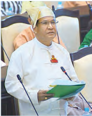
ဒုတိယဝန်ကြီး ဦးတင်မြင့်

ထို့နောက် အမျိုးသားလွှတ်တော်ဥက္ကဋ္ဌက ယင်းအဆိုကို အတည်ပြုရန် လွှတ်တော် ၏ သဘောထားရယူရာ သဘောမတူသူမရှိသည့်အတွက် အစိုးရ၏ အာမခံချက်များ၊