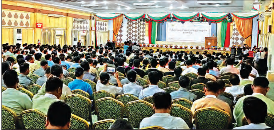
အမျိုးသား မူးယစ်ဆေးဝါးထိန်းချုပ်ရေးမူဝါဒ ရှင်းလင်းဆွေးနွေးပွဲကျင်းပစဉ်။

တိုင်းဒေသကြီးအဆင့် အမျိုးသားမူးယစ်ဆေးဝါးထိန်းချုပ်ရေး မူဝါဒ ရှင်းလင်းဆွေးနွေးပွဲကို ယမန်နေ့က မကွေးမြို့တော်ခန်းမ၌ ကျင်းပရာ တိုင်းဒေသကြီးဝန်ကြီးချုပ် ဒေါက်တာ အောင်မိုးညိုနှင့် တိုင်းဒေသကြီး ဝန်ကြီးများ၊ တိုင်းဒေသကြီး လွှတ်တော် ကိုယ်စားလှယ်များ၊ ဌာနဆိုင်ရာတာဝန်ရှိသူများ၊ မူးယစ်ဗဟိုအဖွဲ့ မှ တာဝန်ရှိသူများ၊ ကျွမ်းကျင်ပညာရှင်များ၊ UNODC မှ ကိုယ်စားလှယ်များနှင့် ဖိတ်ကြားထားသူများ တက်ရောက် ခဲ့ကြသည်။