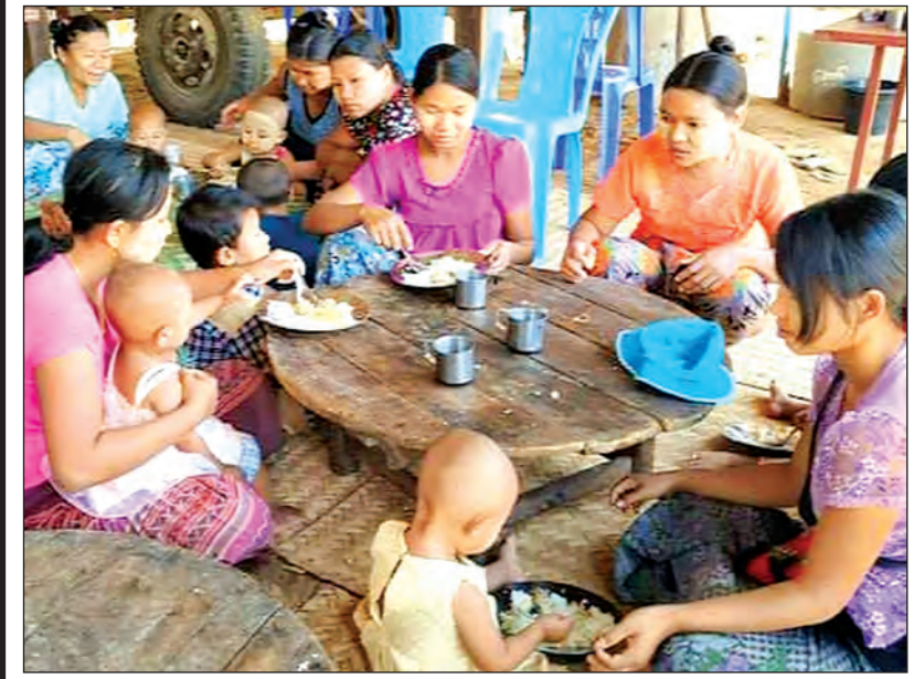
မကွေးမြို့နယ်မှ မိခင်ပိုင်းတစ်ခုတွင် ကလေးများအား ပြုစုစောင့်ရှောက်နေစဉ်။