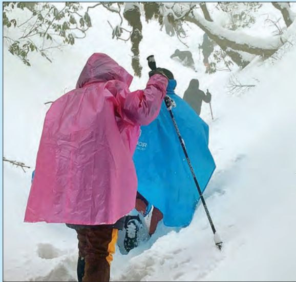
ဖုန်ကန်ရာဇီရေခဲတောင်တက်လမ်းရှိ ရေခဲစပ်စခန်းအနီးသို့ ရောက်လုနီးနေရာ ရေခဲတောကြား၌ မိတ္ထီလာခြေလျင်နှင့်တောင်တက်အသင်းဝင် အချို့ ဖြတ်သန်းခရီးဆက်နေစဉ်။