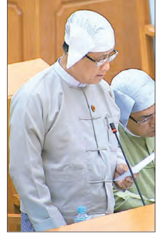
ဒုတိယဝန်ကြီး ဦးမောင်မောင်ဝင်း

ဧရာဝတီတိုင်းဒေသကြီး မဲဆန္ဒနယ်အမှတ်(၃)မှ ဦးဆန်းမြင့်က ပြည်ထောင်စု လွှတ်တော်ဆိုင်ရာ နည်းဥပဒေ ပုဒ်မ ၈၊ ပုဒ်မခွဲ (၁) ၌ နည်းဥပဒေများတွင် ပြဋ္ဌာန်း ထားခြင်းမရှိသော ကိစ္စရပ်များ ပေါ်ပေါက်လာလျှင်သော်လည်းကောင်း၊ နည်းဥပဒေ များအတိုင်း ဆောင်ရွက်ရာတွင် အခက်အခဲတစ်ရပ်နှင့် ကြုံတွေ့ရလျှင်သော် လည်းကောင်း ယင်းအခက်အခဲများကို ဖြေရှင်းနိုင်ရေးအတွက် လွှတ်တော်၏ အဆုံးအဖြတ် ရယူဆောင်ရွက်ခြင်း၊ ပြဋ္ဌာန်းချက်ပါအတိုင်း ဆောင်ရွက်ခြင်းဖြစ်သည့် အတွက် ဖွဲ့စည်းပုံအခြေခံဥပဒေပြင်ဆင်ရေး ပူးပေါင်းကော်မတီသည် ဥပဒေနှင့်အညီ ပေါ်ပေါက်လာခြင်းဖြစ်ပါကြောင်း၊ ဖွဲ့စည်းပုံအခြေခံဥပဒေဒဏ်ချုပ်ကို တိုင်းရင်းသား များ လိုလားတောင်းဆိုနေသည့် ဖက်ဒရယ်စနစ်နှင့် သဟဇာတဖြစ်အောင် အလေး အနက် စဉ်းစားဆင်ခြင်ပြီး ဘက်စုံထောင့်စုံကနေ လိုအပ်သလို ပြင်ဆင်ရန် ကြိုးစား ဆောင်ရွက်မှသာ တိုင်းပြည်ရေးရာတည်ငြိမ် အေးချမ်းရေးအတွက် အကျိုးပြုနိုင်မည့် ဖွဲ့စည်းပုံအခြေခံဥပဒေဖြစ်လာမည် ဖြစ်ပါကြောင်း၊ တိုင်းဒေသကြီးနှင့် ပြည်နယ် လွှတ်တော်များကနေ ဒေသဆိုင်ရာအစိုးရများ၏ ဝန်ကြီးချုပ်များ၊ ရွေးချယ်နိုင်ရေး ကိုသာ ရည်ရွယ်ပြီး ပြင်ဆင်လိုက်မည်ဆိုပါက ပြည်ထောင်စုလွှတ်တော်က ရွေးချယ် ထားသည့် နိုင်ငံတော်သမ္မတသည် တိုင်းဒေသကြီးနှင့်ပြည်နယ် ဝန်ကြီးချုပ်များကို ရွေးချယ်ခွင့်ဆုံးရှုံးသွားမည်ဖြစ်ပါကြောင်း၊ တပ်မတော်ကာကွယ်ရေးဦးစီးချုပ်က မူလရရှိပြီးသည့် ဒုတိယသမ္မတတစ်ဦး ပြည်ထောင်စုဝန်ကြီး သုံးဦး ခန့်အပ်ရန် အဆိုပြု