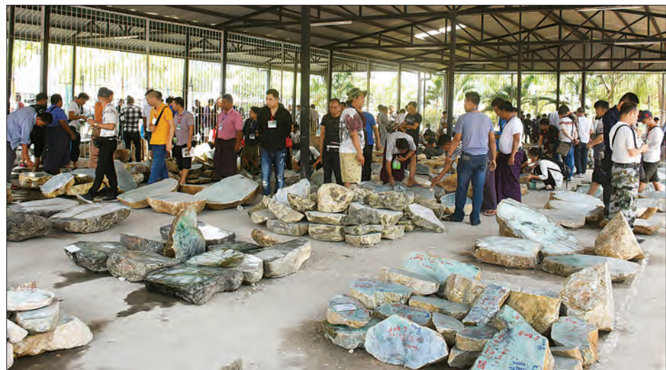
မြန်မာ့ကျောက်မျက်ရတနာပြပွဲ၌ ကျောက်မျက်အတွဲများ ရောင်းချရန်ပြသထားစဉ်။