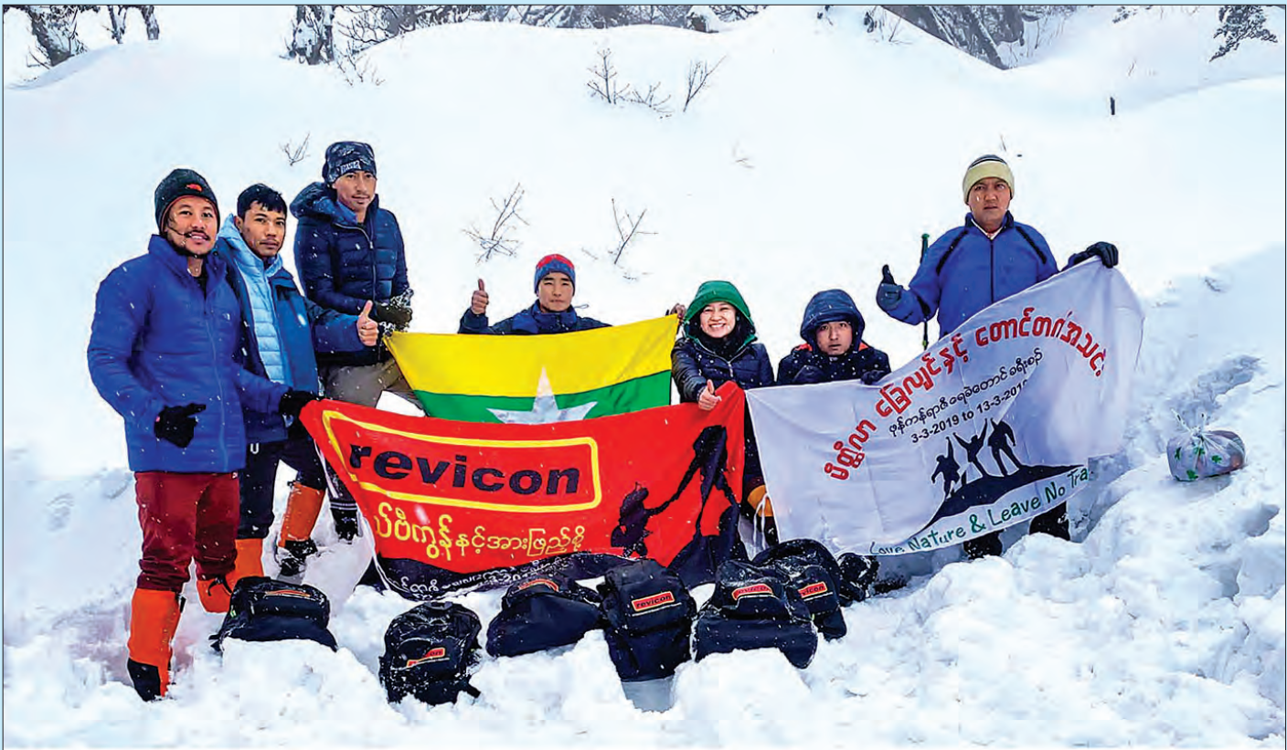
ရာသီဥတုဆိုးရွားနေသည့် အခြေအနေ၌ပင် ဖုန်ကန်ရာဇီရေခဲတောင် အမြင့်ပေ ၁၁၀၀၀ နေရာအထိ တက်ရောက်နိုင်ခဲ့သည့် မိတ္ထီလာခြေလျင်နှင့် တောင်တက်အသင်းဝင်မြောက်ဦးနှင့် လမ်းပြအဖွဲ့ခေါင်းဆောင်တို့ မှတ်တမ်းဓာတ်ပုံရိုက်စဉ်။

ရေခဲတောင်တက်ခရီးတွင် ရာသီဥတုမကောင်းမွန်သည့် အခြေအနေများကြောင့် တောင်တက်အဖွဲ့ဝင် ၂၀ အနက် ၁၄ ဦးမှာ အမြင့်ပေ ၉၇၀၀ ခန့်အထိ တက်ရောက်နိုင်ခဲ့ပြီး အဖွဲ့ဝင် ၆ဦးမှာ အမြင့်ပေ ၁၁၀၀၀ ခန့်အထိသာ တက်ရောက်နိုင်ခဲ့ကြသည်။ ဖုန်ကန်ရာဇီ ရေခဲတောင်ထိပ်အမြင့်ပေ ၁၁၉၂၀ အထိသို့ မတက်ရောက်နိုင်သော်လည်း ရာသီဥတုဆိုးရွားသည့်အခြေအနေကြားမှပင် ၁၀ မှတ်တိုင်ကိုယ်စီ စိုက်ထူနိုင်ကြမည့်အတိုင်းအတာ တစ်နေရာအထိ တက်ရောက်နိုင်ခဲ့ကြသည့် မိတ္ထီလာခြေလျင်နှင့် တောင်တက်အသင်းဝင်များ၏ ဖုန်ကန်ရာဇီရေခဲတောင်တက်ခရီးစဉ်မှတ်တမ်းဓာတ်ပုံများကို ဂုဏ်ပြုစုစည်းတင်ပြလိုက်ပါသည်။ ချမ်းသာ (မိတ္ထီလာ)