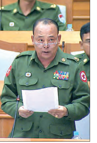
တပ်မတော်သား ပြည်သူ့လွှတ်တော် ကိုယ်စားလှယ် ဝိုင်းဦးသန်းဝင်း