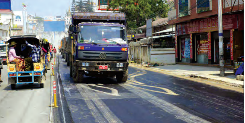
ခင်းပြီးနေသော နိုင်လွန်ကတ္တရာလမ်းတွင် ယာဉ်များသွားလာနေစဉ်။