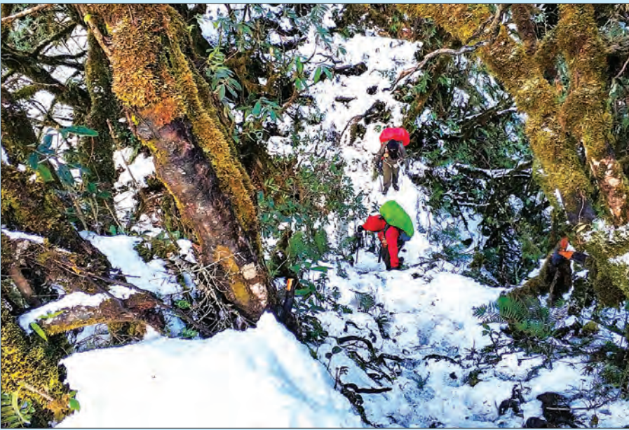
ခမ်းတောက်မြစ်စခန်းနှင့် ရေခဲစပ်စခန်းအကြားတွင် ခက်ခဲကြမ်းတမ်းသည့် တောင်တက်ခရီးအား ဖြတ်ကျော်နေသည့် မိတ္ထီလာခြေလျင်နှင့်တောင်တက်အသင်းဝင် နှစ်ဦးအား တွေ့ရစဉ်။