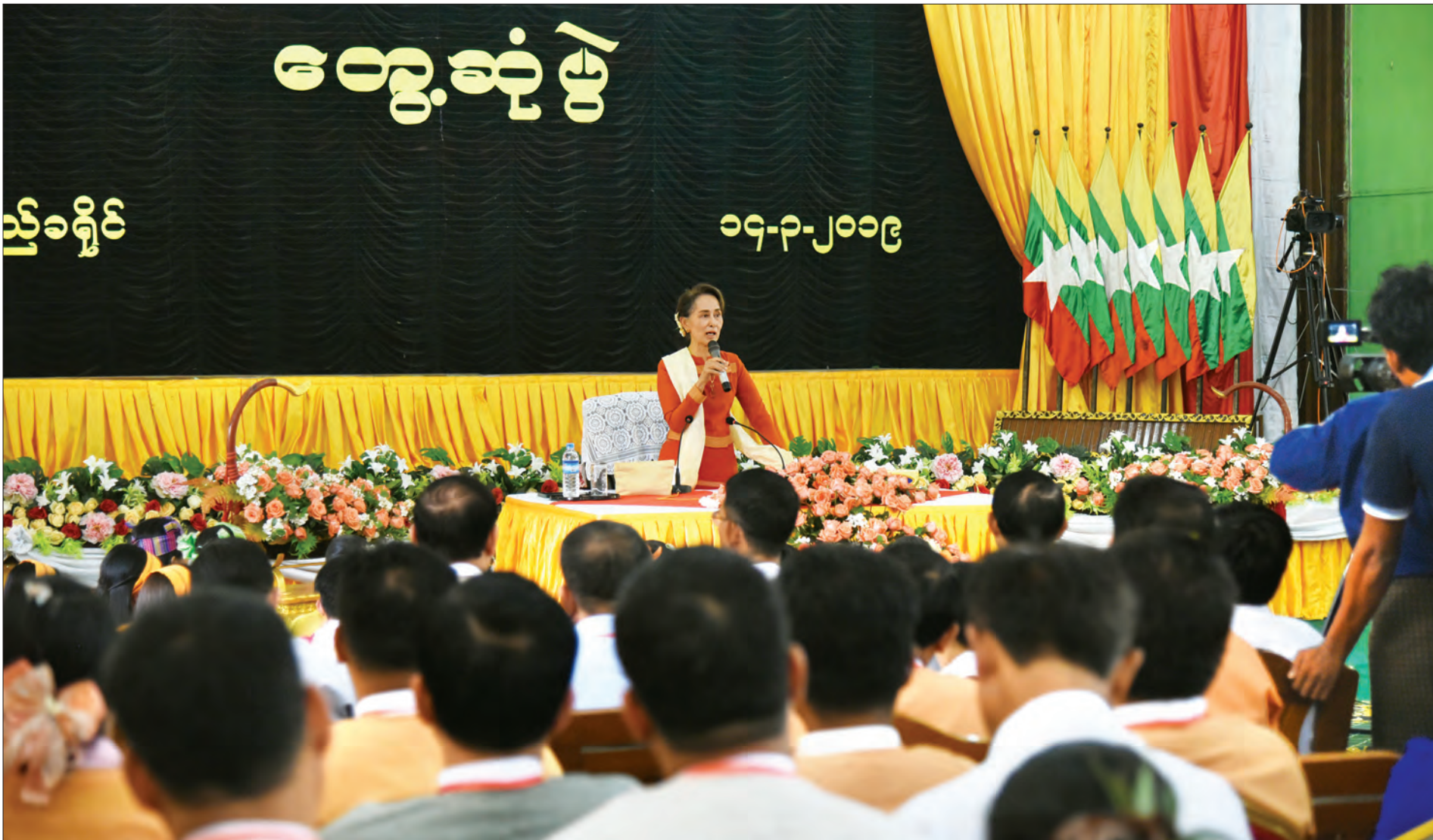
နယ်စပ်ဒေသနှင့် တိုင်းရင်းသားလူမျိုးများဖွံ့ဖြိုးတိုးတက်ရေးဗဟိုကော်မတီဥက္ကဋ္ဌ နိုင်ငံတော်၏အတိုင်ပင်ခံပုဂ္ဂိုလ် ဒေါ်အောင်ဆန်းစုကြည် ပြည်မြို့၊ သီရိဓမ္မရာဇာနာမိမြို့တော်ခန်းမ၌ ဒေသခံများအား တွေ့ဆုံအမှာစကား ပြောကြားစဉ်။ သတင်းစဉ်