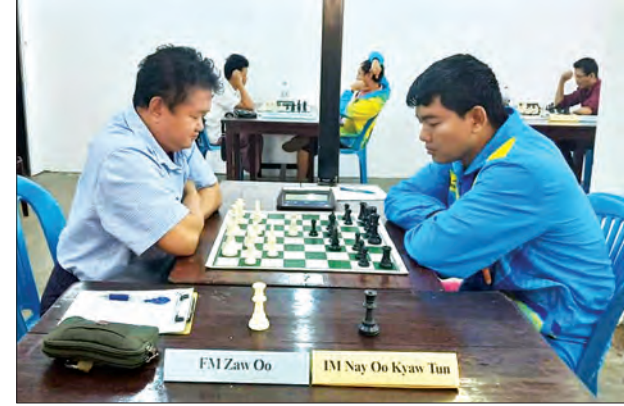
အမျိုးသားတံခွန်စိုက် စစ်တုရင်ပြိုင်ပွဲ ကျင်းပစဉ်။

သည် မြန်မာနိုင်ငံတွင် အမြင့်ဆုံးပြိုင်ပွဲ ဖြစ်ပြီး ချန်ပီယံဖြစ်ပါက ပြည်ပပြိုင်ပွဲများ သို့ သွားရောက်ယှဉ်ပြိုင်ခွင့်ရရှိမည် ဖြစ်ကြောင်း သိရသည်။ ဆုကြေးအဖြစ် ပထမဆု ငွေကျပ် ငါးသိန်း၊ ဒုတိယဆု ငွေကျပ် သုံးသိန်း၊ တတိယဆု ငွေကျပ် နှစ်သိန်းနှင့် စတုတ္ထ ဆု ငွေကျပ်တစ်သိန်း ချီးမြှင့်မည်ဖြစ် ကြောင်း သိရသည်။