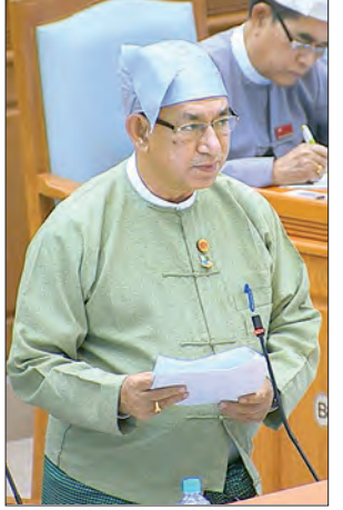
ဒုတိယဝန်ကြီး ဒေါက်တာရဲမြင့်ဆွေ