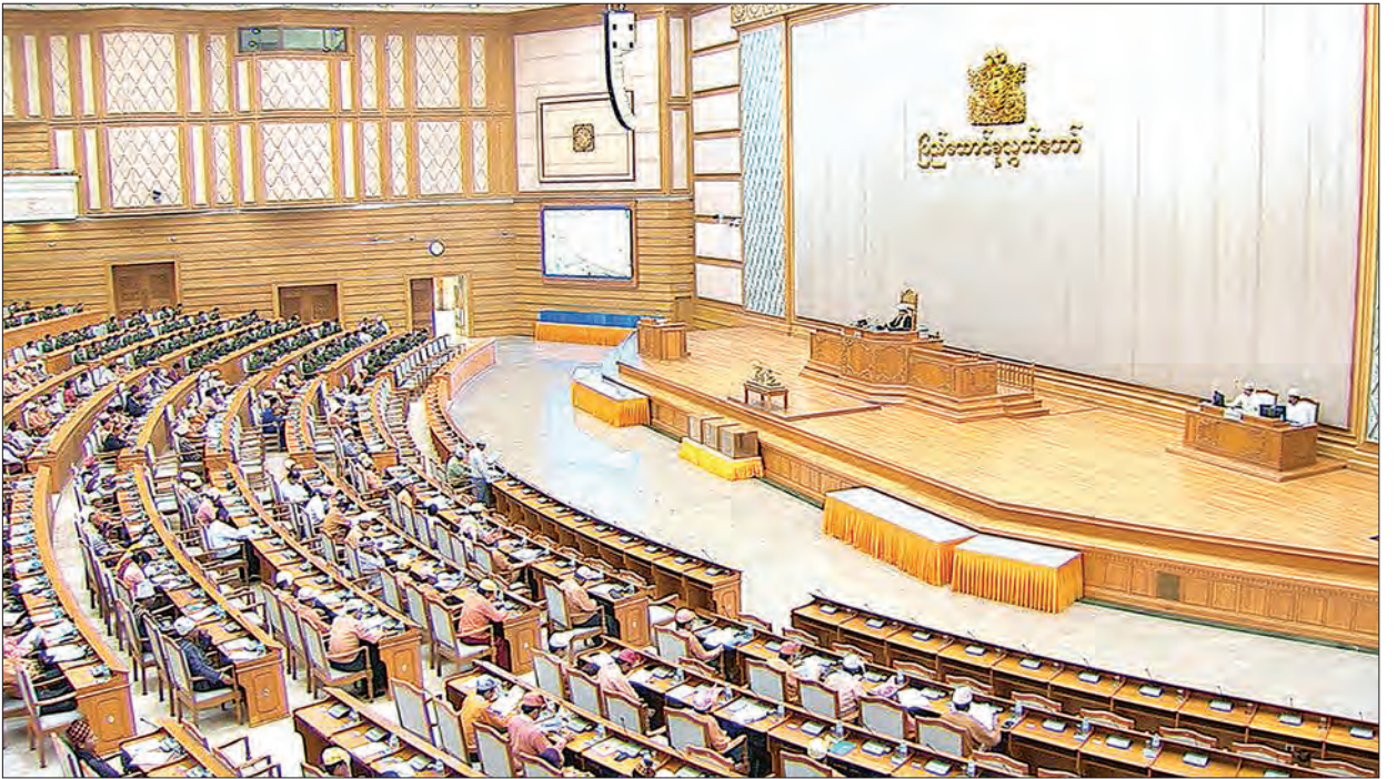
ဒုတိယအကြိမ်ပြည်ထောင်စုလွှတ်တော် (၁၁)ကြိမ်မြောက်ပုံမှန်အစည်းအဝေး ၁၅ ရက်မြောက်နေ့ ကျင်းပစဉ်။

ကုမ္ပဏီများအနေဖြင့် ဆောင်ရွက်ခဲ့သည့် ကျောက်မျက်ပြွဲများအပြင် အခြားလုပ်ငန်းများမှ ဝင်ငွေများရှိပါက အခွန်အပြည့်အဝရရှိစေရန် လုပ်ထုံးလုပ်နည်းများနှင့်အညီ စည်းကြပ်ကောက်ခံသွားမည်