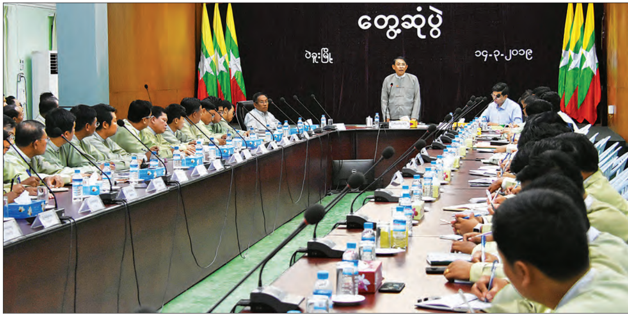
ပြည်ထောင်စုဝန်ကြီး ဦးမင်းသူ ပဲခူးတိုင်းဒေသကြီး ခရိုင်နှင့် မြို့နယ်များမှ အထွေထွေအုပ်ချုပ်ရေးဦးစီးဌာန ဝန်ထမ်းများအား တွေ့ဆုံရာတွင်။ သတင်းစဉ်

ရှေးဦးစွာ ပဲခူးတိုင်းဒေသကြီး အထွေထွေအုပ်ချုပ်ရေး ဦးစီးဌာန တိုင်းဒေသကြီးအုပ်ချုပ်ရေးမှူး၊ ဦးခင်မောင်ဆန်းက ခရိုင်အုပ်ချုပ်ရေးမှူးများ၊ မြို့နယ်အုပ်ချုပ်ရေးမှူးများနှင့် မိတ်ဆက်ပေးပြီး ပဲခူးတိုင်းဒေသကြီး အထွေထွေအုပ်ချုပ်ရေးဦးစီးဌာန၏ လုပ်ငန်းဆောင်ရွက်မှု အခြေအနေများကို ရှင်းလင်းတင်ပြသည်။