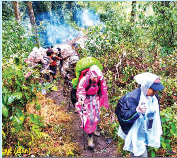
ခရီးတစ်ထောက်နားရာ သစ်ပင်ကြီးစခန်းမှ မိတ္ထီလာခြေလျင်နှင့်တောင်တက်အသင်းဝင်တချို့ ဆက်လက်ခရီးထွက်ခွာစဉ်။