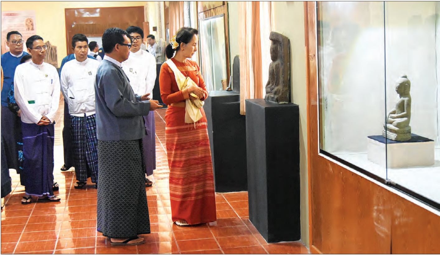
နိုင်ငံတော်၏အတိုင်ပင်ခံပုဂ္ဂိုလ် ဒေါ်အောင်ဆန်းစုကြည် သရေခေတ္တရာမြို့ဟောင်းရှိ သီရိခေတ္တရာပြတိုက်၌ လှည့်လည်ကြည့်ရှုစဉ်။