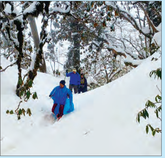
ဖုန်ကန်ရာဇီရေခဲတောင်တက်လမ်းရှိ ရေခဲစပ်စခန်းအနီးသို့ ရောက်လုနီးနေရာတွင် ရေခဲတောကြား၌ မိတ္ထီလာခြေလျင်နှင့် တောင်တက်အသင်းဝင်အချို့ ဖြတ်သန်းခရီးဆက်နေစဉ်။