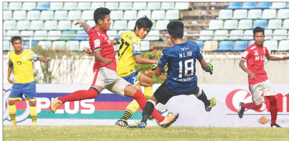
ဒဂုံအသင်း၏ ဂိုးသွင်းရန် ကြိုးပမ်းမှုကို မောရဝတီဂိုးသမား ကာကွယ်နေစဉ်။