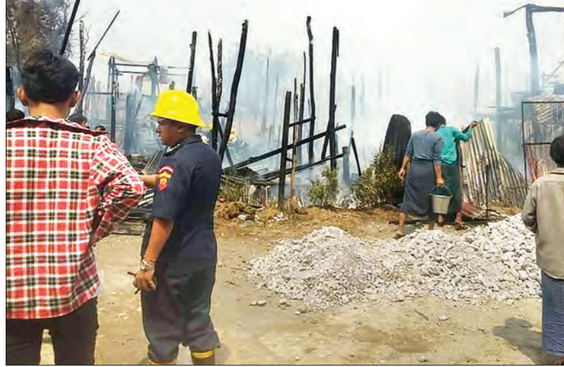
ပုသိမ်ကြီးမြို့နယ်၌ မီးလောင်မှုဖြစ်သည့်နေရာအား မီးသတ်တပ်ဖွဲ့ဝင်များနှင့် ဒေသခံများက ပိုင်းဝန်းငြိမ်းသတ်ကြစဉ်။