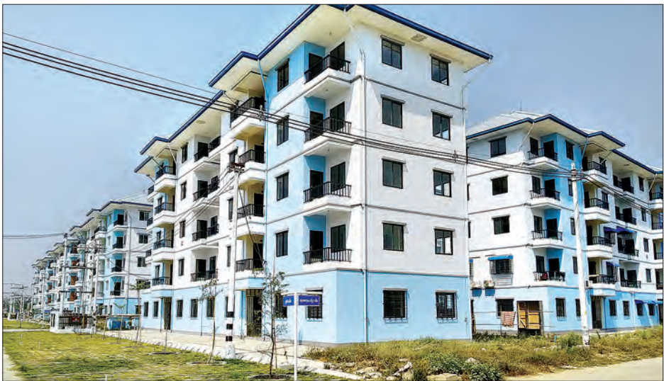
လှိုင်သာယာ မြောက်ပိုင်း ကျွန်းစစ်မင်း အိမ်ရာကို တွေ့ရစဉ်။

ရန်ကုန် မတ် ၁၄ ရန်ကုန်မြောက်ပိုင်းခရိုင် လှိုင်သာယာ မြို့နယ် ရုံးမှတ်တိုင်အနီး ကျွန်းစစ်သား လမ်းမကြီးနံဘေးတွင် ကျွန်းစစ်သား အိမ်ရာစီမံကိန်းကို အပိုင်းနှစ်ပိုင်းခွဲ၍ ဆောက်လုပ်ရေးဝန်ကြီးဌာန မြို့ပြနှင့် အိမ်ရာဦးစီးဌာနမှ တည်ဆောက်လျက် ရှိရာ တည်ဆောက်မှု ၇၀ ရာခိုင်နှုန်း ပြီးစီးသောအပိုင်းမှ တိုက်ခန်းများကို တန်ဖိုးသင့်အိမ်ရာအဖြစ် ရောင်းချ ပေးလျက်ရှိသည်။