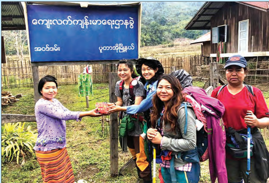
ဖုန်ကန်ရာဇီရေခဲတောင်တက်ရာလမ်းရှိ အဝဒ်ဒမ်းကျေးရွာရှိ ကျေးလက်ကျန်းမာရေးဌာနခွဲသို့ မိတ္ထီလာတောင်တက်အသင်းဝင်တချို့က အားဆေးများလှူဒါန်းစဉ်။