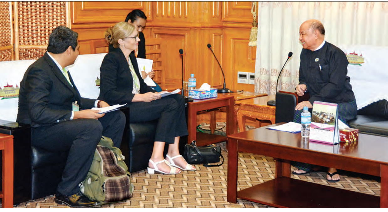
ပြည်သူ့လွှတ်တော်ဒုတိယဥက္ကဋ္ဌ ဦးထွန်းထွန်းဟိန် နော်ဝေနိုင်ငံ သံအမတ်ကြီး H.E. Mrs. Tone Tinnes အား လက်ခံတွေ့ဆုံစဉ်။ သတင်းစဉ်

မူးယစ်ဆေးဝါးအန္တရာယ် တားဆီးကာကွယ်ထိန်းချုပ်ရေးနှင့် လွှတ်တော်၏ဥပဒေ ပြုရေးဆိုင်ရာကိစ္စရပ်များနှင့်စပ်လျဉ်း၍ ရင်းနှီးပွင့်လင်းစွာ အမြင်ချင်းဖလှယ် ဆွေးနွေးကြသည်။ နော်ဝေသံအမတ်ကြီးနှင့်အဖွဲ့အား တွေ့ဆုံစဉ် နော်ဝေနိုင်ငံအနေဖြင့် မြန်မာ နိုင်ငံ၏ ပြည်တွင်းငြိမ်းချမ်းရေးနှင့် ဒီမိုကရေစီပြုပြင်ပြောင်းလဲရေးလုပ်ငန်းများ တွင် အကူအညီပေးနေသည်ကိစ္စ၊ လွှတ်တော်၌ဆောင်ရွက်လျက်ရှိသည့် ဖွဲ့စည်းပုံ အခြေခံဥပဒေပြင်ဆင်ရေးဆွဲရေးဆိုင်ရာကိစ္စရပ်များနှင့် စပ်လျဉ်း၍ ရင်းနှီးပွင့်လင်းစွာ အမြင်ချင်းဖလှယ်ဆွေးနွေးကြကြောင်း သိရသည်။ သတင်းစဉ်