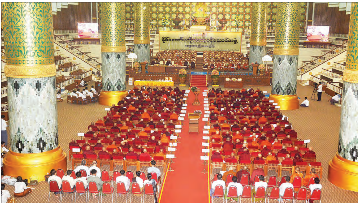
သတ္တမအကြိမ် နိုင်ငံတော်ဗဟိုသံယာဉ်ဆောင်အဖွဲ့ သတ္တမအစည်းအဝေး ပထမနေ့ ကျင်းပစဉ်။

အစည်းအဝေးသို့ နိုင်ငံတော်ဩဝါဒါ စရိယဆရာတော်ကြီးများ၊ နိုင်ငံတော် သံယာဉ်ဆောင်အဖွဲ့ဝင်များ၊ နိုင်ငံတော်ဗဟိုသံယာဉ်ဆောင် ဆရာတော်ကြီးများ ကြွရောက်တော်မူကြပြီး သာသနာရေးနှင့် ယဉ်ကျေးမှုဝန်ကြီးဌာန ပြည်ထောင်စုဝန်ကြီး သူရဦးအောင်ကို၊ ဒုတိယဝန်ကြီးဦးကြည်မင်း၊ ညွှန်ကြားရေးမှူးချုပ် ဦးမြင့်ဦးနှင့် အရာထမ်း၊ အမှုထမ်းများတိုင်းဒေသကြီး/ပြည်နယ် သာသနာရေးမှူးများ တက်ရောက်ကြည့်ကြသည်။