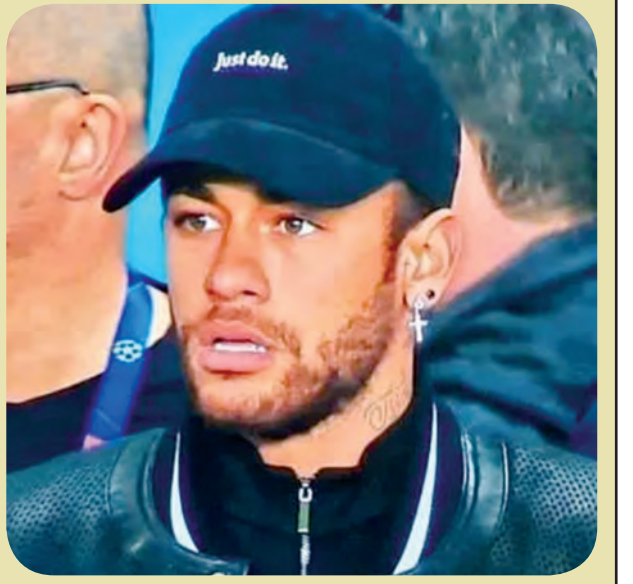
ပီအက်စ်ဂျီအသင်းသည် ယခုနှစ် ပြင်သစ်ပထမတန်းပြိုင်ပွဲ၌ ၂၇ ပွဲ ကစားပြီးချိန်တွင် ရမှတ် ၇၄ မှတ်ဖြင့် ထိပ်ဆုံးမှ ဦးဆောင်နေကာ ၂၈ ပွဲ ကစားထားပြီး ဒုတိယနေရာတွင် ရပ်တည်နေသည့် လိုင်လီအသင်းထက် ရမှတ် ၁၇ မှတ် အသာစီး ရရှိထားသည်။ ။ ထက်အောင်