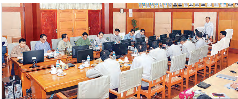
ဒုတိယဝန်ကြီး ဦးအောင်လှထွန်း ကျောင်းသုံးပြဋ္ဌာန်းစာအုပ် ပုံနှိပ်လုပ်ငန်းရှင်များနှင့် တွေ့ဆုံဆွေးနွေးစဉ်။

ပြန်ကြားရေးဝန်ကြီးဌာန ဒုတိယဝန်ကြီး ဦးအောင်လှထွန်းသည် ၂၀၁၉-၂၀၂၀ ပညာသင်နှစ်အတွက် ကျောင်းသုံးပြဋ္ဌာန်းစာအုပ်များ ပုံနှိပ်ဆောင်ရွက်လျက်ရှိသည့် မြန်မာနိုင်ငံ ပုံနှိပ်နှင့်ထုတ်ဝေသူလုပ်ငန်းရှင်များအသင်းနှင့် မန္တလေးတိုင်းဒေသကြီး ပုံနှိပ်နှင့်ထုတ်ဝေသူလုပ်ငန်းရှင်များအသင်းတို့မှ တာဝန်ရှိသူများနှင့် ယနေ့ မွန်းလွဲပိုင်းတွင် နေပြည်တော်ရှိ ပြန်ကြားရေးဝန်ကြီးဌာန အစည်းအဝေးခန်းမ၌ တွေ့ဆုံပြီး လုပ်ငန်းအချိန်မီပြုစီစဉ်ရေးအတွက် ညှိနှိုင်းဆွေးနွေးသည်။