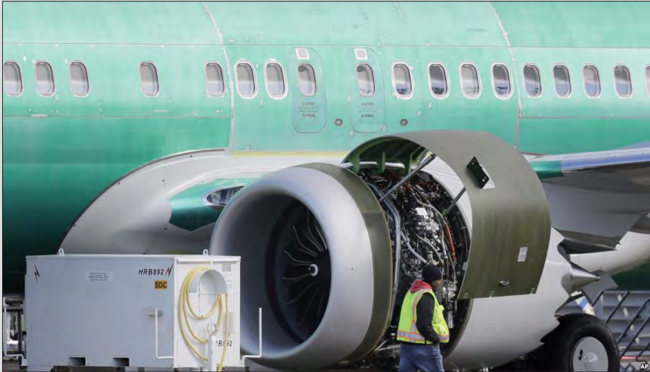
ပျံသန်းမှု ရပ်ဆိုင်းထားသော အမေရိကန်နိုင်ငံထုတ် ၇၃၇ အမျိုးအစား ဘိုးရင်းလေယာဉ်။

ပြည်တွင်းပြည်ပ ဖိအားများကြုံတွေ့ခဲ့ရသည့် ဘိုးရင်း ကုမ္ပဏီအကြီးအကဲက စိတ်ချလုံခြုံရပါသည်ဟု ဖုန်းဆက်ပြော ကြားခဲ့သည့်အတွက် အမေရိကန်သမ္မတ ဒေါ်နယ်ထရမ်က အဆိုပါ လေယာဉ်ပျံသန်းမှုကို ရပ်ဆိုင်းဘဲ တင်းကြပ်စေခြင်း သိရသည်။ ဘိုးရင်းကုမ္ပဏီသည် အမေရိကန်သမ္မတ ထရမ် ရွေးကောက်ပွဲမဲဆွယ်စည်းရုံးစဉ်က ရန်ပုံငွေထည့်ဝင်လှူဒါန်းခဲ့ ပြီး အမေရိကန်အစိုးရအတွက် အရေးကြီးသည့် အကျိုးဆောင် ကုမ္ပဏီတစ်ခုလည်းဖြစ်ကြောင်း သိရသည်။ အေအက်စ်ပီ