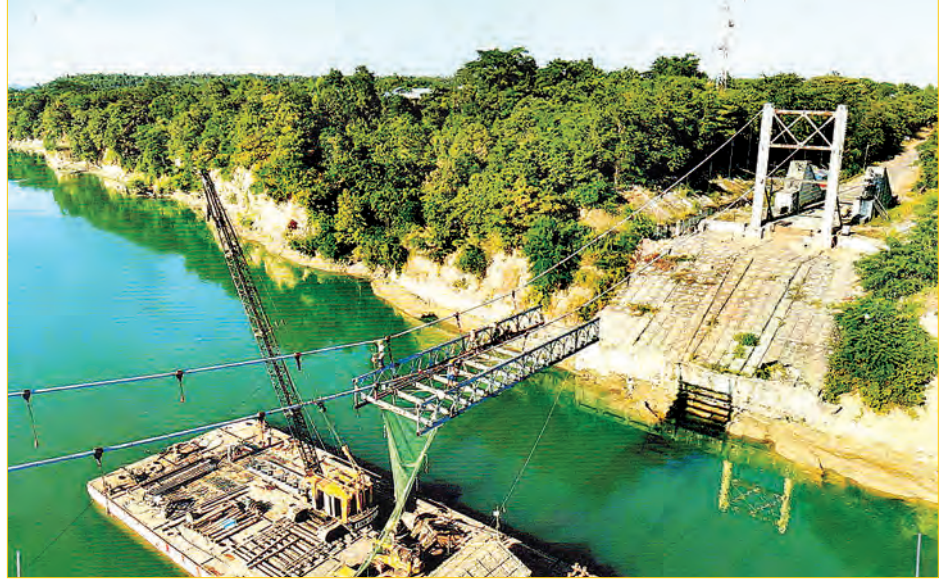
ကြိုးတံတားကို ဖျက်သိမ်းပြီး သံမဏိသံပေါင်တံတား အစားထိုးတည်ဆောက်မည့်နေရာကို တွေ့ရစဉ်။

အချိန်ထက်စော၍ သက်တမ်းကုန်ဆုံး သွားကြောင်း သိရှိပြီး အဆိုပါ တံတားကို ဖြတ်သိမ်း၍ သံမဏိရက်မ သံပေါင်ဖြင့် Box Girder အမျိုးအစားကို အစားထိုးပြန်လည်တပ်ဆင်သွားမည်ဟု သိရသည်။ ယခုအစားထိုးတည်ဆောက်မည့် တံတားအမျိုးအစားမှာ (1.2) မီတာ လွန်တူးပိုင် အုတ်မြစ်တံတားဖြစ်ပြီး တံတားအောက်ထည်မှာ သံကူကွန်ကရစ်၊ တံတားအပေါ်ထည်မှာ သံမဏိရက်မ သံပေါင်နှင့် သံကူကွန်ကရစ်ကြမ်းခင်း ဖြစ်သည်။ ယာဉ်သွားလမ်းအကျယ် ၂၄ ပေ၊ ချဉ်းကပ်တံတား ယခင်ရှိပြီး အကျယ်ပေ ၂၀၊ လူသွားလမ်းအကျယ် တစ်ဖက်လျှင် နှစ်ပေ ခြောက်လက်မ တံတား အရှည်မှာ ဖျက်သိမ်းခဲ့သည့် ပင်မကြိုးတံတား အရှည်ပေ ၄၀၊ ယခင်တည်ဆောက်ထားသည့် ချဉ်းကပ် တံတား ပေ၅၄၀ ဖြစ်ပြီး တံတားခံနိုင်ဝန် မှာ ယာဉ်တစ်စီးချင်းတန် ၆၀၊ ခန့်မှန်း စီမံကိန်းတန်ဖိုးမှာ ငွေကျပ်သန်း ၂၅၀၀ ခန့်မှန်းထားပြီး ဇွန် ၃၀ ရက်တွင် အပြီး တည်ဆောက်သွားမည်ဖြစ်ကြောင်း သိရသည်။