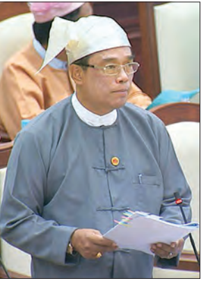
ဒုတိယဝန်ကြီး ဦးကျော်လင်း ဖြေကြားစဉ်။