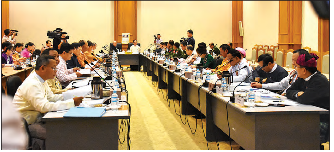
ပြည်ထောင်စုသမ္မတ မြန်မာနိုင်ငံတော် ဖွဲ့စည်းပုံအခြေခံဥပဒေ(၂၀၀၈ ခုနှစ်) ပြင်ဆင်ရေးပူးပေါင်းကော်မတီအစည်းအဝေး(၆/၂၀၁၉)ကျင်းပစဉ်။

ဦးပြုံးချိုနှင့် အဖွဲ့ဝင်များ ဖြစ်ကြသည့် နိုင်ငံရေးပါတီများနှင့် တပ်မတော်သားလွှတ်တော်ကိုယ်စားလှယ်များအစွဲတို့မှ လွှတ်တော်ကိုယ်စားလှယ်များနှင့် ပြည်ထောင်စုလွှတ်တော်ရုံးမှ တာဝန်ရှိသူများ တက်ရောက်ခဲ့ကြသည်။