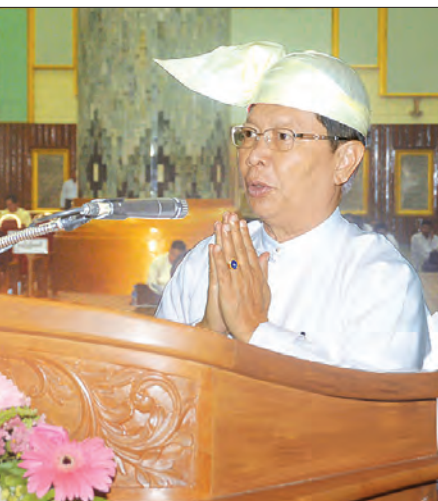
ပြည်ထောင်စု ဝန်ကြီး သူရဦးအောင်ကို သတ္တမအကြိမ် နိုင်ငံတော် ဗဟိုသံယာ ဝန်ဆောင်အဖွဲ့ သတ္တမအစည်း အဝေးတွင် သာသနာရေး ဆိုင်ရာများ လျှောက်ထားစဉ်။ သတင်းစဉ်

ဆရာတော်ကြီးများနှင့် နိုင်ငံတော် ဗဟိုသံယာဉ်ဆောင်ဆရာတော်ကြီးများ အတွက် သံဝေဂဉာဏ်ပွားတော်မူ ကြောင်း မှတ်တမ်းတင်ပြီး အစားထိုး ရွေးချယ်တင်မြှောက်ခြင်းခံရသော နိုင်ငံ တော် ဩဝါဒါစရိယဆရာတော်များနှင့် နိုင်ငံတော်ဗဟိုသံယာဉ်ဆောင် ဆရာ တော်များ၏ ဘွဲ့အမည်စာရင်းကို