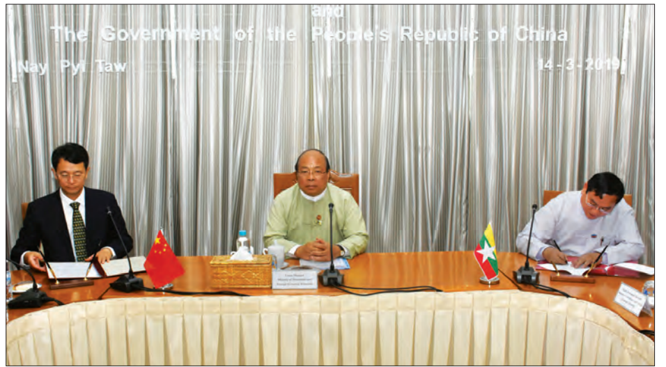
အမှတ်(၂)စက်မှုထုတ်ကုန်ကျောင်း(မန္တလေး) အဆင့်မြှင့်တင်ရေးဆိုင်ရာစာလွှာနှင့် မီးရထားစက်ခေါင်းတွဲဝယ်ယူခြင်းစီမံကိန်းဆိုင်ရာ စာလွှာနှစ်ခုကို ပြည်ထောင်စုဝန်ကြီး ဦးသောင်းထွန်းရှေ့မှောက်၌ လက်မှတ်ရေးထိုးခဲ့ကြသည်။

ဝန်ကြီးဌာနတို့မှ တာဝန်ရှိသူများနှင့် တရုတ်ပြည်သူ့သမ္မတနိုင်ငံဘက်မှ တရုတ်ပြည်သူ့သမ္မတနိုင်ငံ၊ နိုင်ငံတကာဖွံ့ဖြိုးတိုးတက်မှုပူးပေါင်းဆောင်ရွက်ရေးအေဂျင်စီ (China International Development Cooperation Agency-CIDCA) Deputy Administrator Mr.Deng Boqing ဦးဆောင်သည့် ကိုယ်စားလှယ်အဖွဲ့ စုစုပေါင်း ၃၅ ဦးခန့် တက်ရောက်၍ တရုတ်ပြည်သူ့သမ္မတနိုင်ငံအစိုးရ၏ အကူအညီဖြင့် ဆောင်ရွက်လျက်ရှိသည့် စီမံကိန်းများလွယ်ကူချောမွေ့စွာ အကောင်အထည်ဖော်ဆောင်ရွက်နိုင်ရေးနှင့် စပ်လျဉ်းသည့် အချက်အလက်များအား ရင်းနှီးပွင့်လင်းစွာ ဆွေးနွေးကြသည်။ အဆိုပါ အစည်းအဝေးတွင် အမှတ်(၂)စက်မှုထုတ်ကုန် ကျောင်း (မန္တလေး) အဆင့်မြှင့်တင်ရေးဆိုင်ရာစာလွှာနှင့် မီးရထားစက်ခေါင်းတွဲဝယ်ယူခြင်းစီမံကိန်းဆိုင်ရာ စာလွှာနှစ်ခုကို တရုတ်ပြည်သူ့သမ္မတနိုင်ငံ၊ နိုင်ငံတကာဖွံ့ဖြိုးတိုးတက်မှုပူးပေါင်းဆောင်ရွက်ရေးအေဂျင်စီ (CIDCA) နှင့် သက်ဆိုင်ရာဝန်ကြီးဌာနနှစ်ခုတို့မှ ရင်းနှီးမြှုပ်နှံမှုနှင့် နိုင်ငံခြားစီးပွားဆက်သွယ်ရေးဝန်ကြီးဌာန ပြည်ထောင်စုဝန်ကြီး ဦးသောင်းထွန်း ရှေ့မှောက်၌ လက်မှတ်ရေးထိုးခဲ့ကြသည်။ သတင်းစဉ်