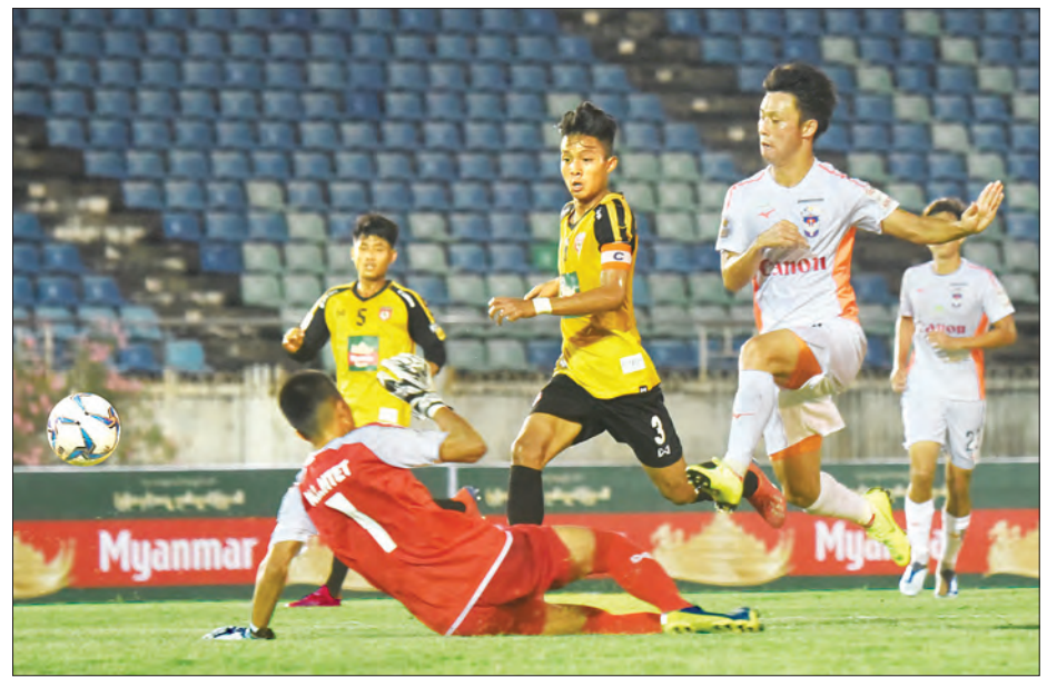
မတ် ၇ ရက်က မြန်မာ ယူ-၁၈ အသင်းနှင့် နီဂါတာအသင်း ခြေစမ်းပွဲကစားနေစဉ်။