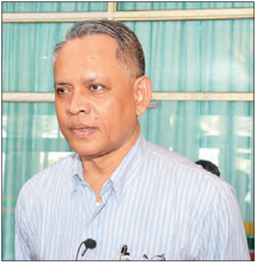
ညွှန်ကြားရေးမှူးချုပ် ဦးအောင်နိုင်ဦး (ရင်းနှီးမြှုပ်နှံမှုနှင့် ကုမ္ပဏီများ ညွှန်ကြားမှု ဦးစီးဌာန )

ကောင်းဖို့ ကြိုးစားဆောင်ရွက်နေပါတယ်။ လက်ရှိက ပြည်နယ်ဘတ်ဂျက်ရဲ့ ၆၀ ရာခိုင်နှုန်း လောက်ကို လမ်းပန်းဆက်သွယ်ရေးမှာ သုံးနေ ပါတယ်။ ပြည်ထောင်စုဘတ်ဂျက်ကလည်း ၅၀ ရာခိုင်နှုန်းကျော်သုံးပြီး လမ်းကို အကောင်းဆုံး ဖြစ်အောင် ဆောင်ရွက်နေပါတယ်။ လျှပ်စစ်မီးနဲ့ ပတ်သက်ရင်လည်း ချင်းပြည်နယ်မှာ မြို့နယ် ကိုးခုရှိရာမှာ မြို့နယ် ငါးခုဖြစ်တဲ့ ကန်ပက်လက်၊ ဟားခါး၊ ဖလမ်း၊ ထန်တလန်၊ မင်းတပ် တို့မှာ လျှပ်စစ်မီးရတယ်။ တီးတိန်၊ တွန်းဇံ၊ မဟူပီ၊ ပလက်ဝ လေးခုကျန်တယ်။ ၂၀၁၉- ၂၀၂၀ မှာ JICA အကူအညီနဲ့ လျှပ်စစ်မီးရအောင်လုပ်ဖို့ လျာထားပြီးဖြစ်ပါတယ်။ ဘတ်ဂျက်ရတဲ့ပုံမှန်ထည့် ပြီး ဆောင်ရွက်သွားမှာ ဖြစ်ပါတယ်။