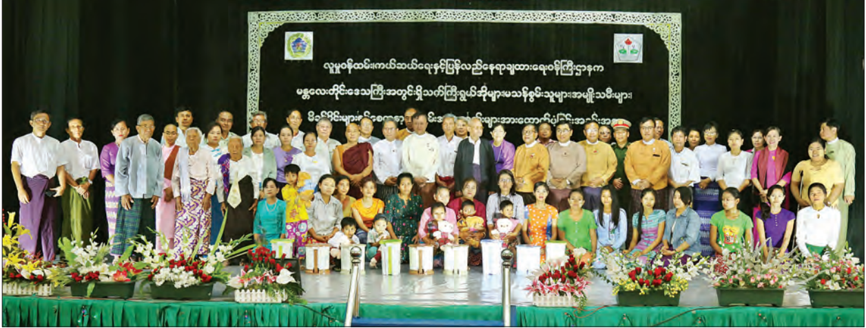
ပြည်ထောင်စုဝန်ကြီး ဒေါက်တာ ဝင်းမြတ်အေးနှင့်အဖွဲ့ အခမ်းအနားသို့ တက်ရောက်လာကြသူများနှင့်အတူ စုပေါင်းမှတ်တမ်းတင် ဓာတ်ပုံရိုက်စဉ်။ သတင်းစဉ်

မန္တလေးတိုင်းဒေသကြီးအတွင်းရှိ မသန် စွမ်းသူများ၊ သက်ကြီးရွယ်အိုများ၊ မိခင် ပိုင်းများ၊ စေတနာ့ဝန်ထမ်းအဖွဲ့အစည်း များအား ထောက်ပံ့ငွေပေးအပ်ခြင်းနှင့် တိုင်းလူငယ်ရေးရာကော်မတီအဖွဲ့ဝင်များ အပါအဝင် မန္တလေးတိုင်းဒေသကြီး အတွင်းရှိ လူငယ်အဖွဲ့အစည်းများအား တွေ့ဆုံဆွေးနွေးခြင်းကို ယနေ့မွန်းလွဲပိုင်း က ကျင်းပခဲ့ကြောင်း သိရသည်။ အခမ်းအနားတွင် လူမှုဝန်ထမ်း၊ ကယ်ဆယ်ရေးနှင့် ပြန်လည်နေရာချထား ရေးဝန်ကြီးဌာန ပြည်ထောင်စုဝန်ကြီး ဒေါက်တာဝင်းမြတ်အေးက အမှာစကား ပြောကြားသည်။