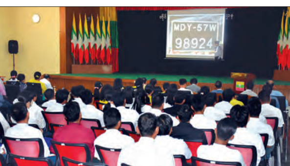
တိုင်းရင်းသားလူမျိုးများရေးရာဝန်ကြီးဌာန၌ ယာဉ်စည်းကမ်း၊ လမ်းစည်းကမ်း အသိပညာပေးဆွေးနွေးခြင်းအခမ်းအနား ကျင်းပစဉ်။

နေပြည်တော် မတ် ၁၇ ယာဉ်စည်းကမ်း လမ်းစည်းကမ်း အသိပညာပေး ဆွေးနွေးခြင်းအခမ်းအနားကို မတ် ၁၅ ရက်က တိုင်းရင်းသားလူမျိုးများ ရေးရာဝန်ကြီးဌာန အစည်းအဝေးခန်းမ၌ ကျင်းပရာ တိုင်းရင်းသားလူမျိုးများရေးရာဝန်ကြီးဌာန ပြည်ထောင်စုဝန်ကြီး နိုင်သက်လွင် တက်ရောက်အမှာစကား ပြောကြားသည်။ ထို့နောက် ယာဉ်စည်းကမ်း လမ်းစည်းကမ်းများနှင့် ပတ်သက်၍