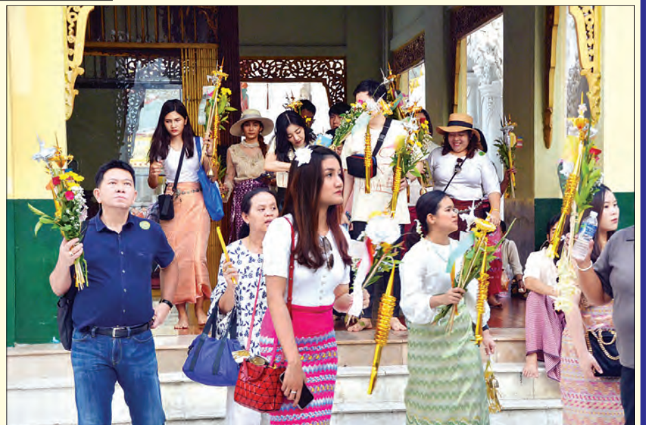
ရွှေတိဂုံစေတီသို့ လာရောက်ကြည့်ညိုသူ ဘုရားဖူးလာပြည်သူများအား တွေ့ရစဉ်။