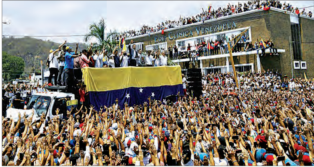
ပင်နီဇွဲလားအတိုက်အခံခေါင်းဆောင် ဂျူအန်ဂျွန်ကို ထောက်ခံသူများအား တွေ့ရစဉ်။

ကရာကတ် မတ် ၁၇ ပင်နီဇွဲလားနိုင်ငံ၌ မိမိကိုယ်မိမိ ယာယီသမ္မတဟု ကြေညာထားသော ဂျူအန်ဂျွန်ကို ပြည်အတွင်း နယ်လှည့်ခရီးကို မတ် ၁၆ ရက်မှ စတင်ခဲ့ပြီး သမ္မတအဖြစ် လက်ထပ်ခဲ့ပြီး ရာထူးမှ ဖြုတ်ချနိုင်ရေး ပြည်သူများ၏ ထောက်ခံမှု ပိုမိုရရှိစေရန် ရည်ရွယ်ပြီး သွားရောက်ခဲ့ခြင်း ဖြစ်သည်။