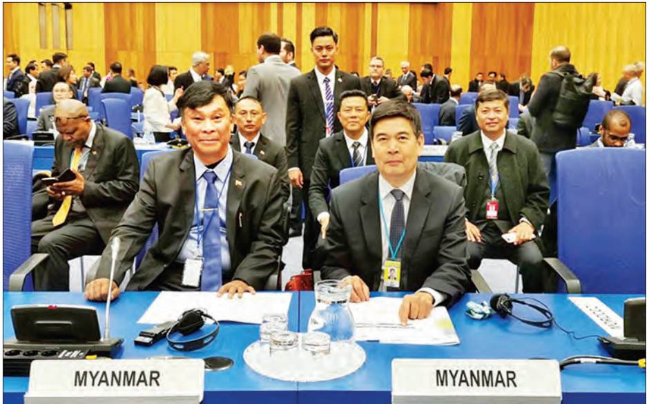
ပြည်ထောင်စုဝန်ကြီး ဒုတိယဗိုလ်ချုပ်ကြီးကျော်ဆွေ ဩစတြီးယားနိုင်ငံ ဝီယင်နာမြို့၌ ကျင်းပသော (၆၂)ကြိမ်မြောက် မူးယစ်ဆေးဝါးတိုက်ဖျက်ရေးညီလာခံ တက်ရောက်စဉ်။