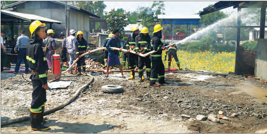
ကလေးမြို့တွင် စက်သုံးဆီအရောင်းဆိုင် မီးလောင်မှုဖြစ်ရာသို့ မီးသတ်တပ်ဖွဲ့ဝင်များပိုင်းဝန်းငြိမ်းသတ်ကြစဉ်။

ကလေး မတ် ၁၇ ကလေးခရိုင် ကလေးမြို့နယ် ချမ်းမြေ့အောင်စည်ရပ်ကွက် နယ်မြေ (၁၂) ကလေး- ကလေး- တမူးလမ်းမပေါ်ရှိ နိုင်ငံတော်စက်သုံးဆီအရောင်းဆိုင်တွင် မတ် ၁၇ ရက် နံနက် ၁၀ နာရီ မိနစ် ၂၀ က ဂါလန် ၄၀၀ ဆုံ ဒီဇယ်ဆီသိုလှောင်ကန်တစ်လုံး မီးလောင်မှုဖြစ်ကြောင်း သိရသည်။