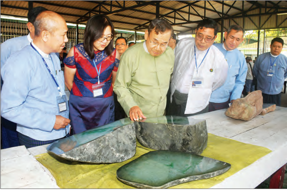
ပြည်ထောင်စုဝန်ကြီး ဦးအုန်းဝင်း ကျောက်စိမ်းများကို ကြည့်ရှုစဉ်။

★ ကျောစုံမှ ထိန်းသိမ်းရေးဝန်ကြီးဌာန ပြည်ထောင်စုဝန်ကြီး ဦးအုန်းဝင်း၊ ခင်းကျင်းပြသ ရောင်းချပေးသွားမည်ဖြစ်ကြောင်း သိရသည်။ ဒုတိယဝန်ကြီး ဒေါက်တာ ရဲမြင့်ဆွေတို့နှင့်အတူ ဌာနဆိုင်ရာ မွန်းလွှဲပိုင်းတွင် သယံဇာတနှင့် သဘာဝပတ်ဝန်းကျင် တာဝန်ရှိသူများသည် မဏိရတနာကျောက်စိမ်းခန်းမအတွင်း