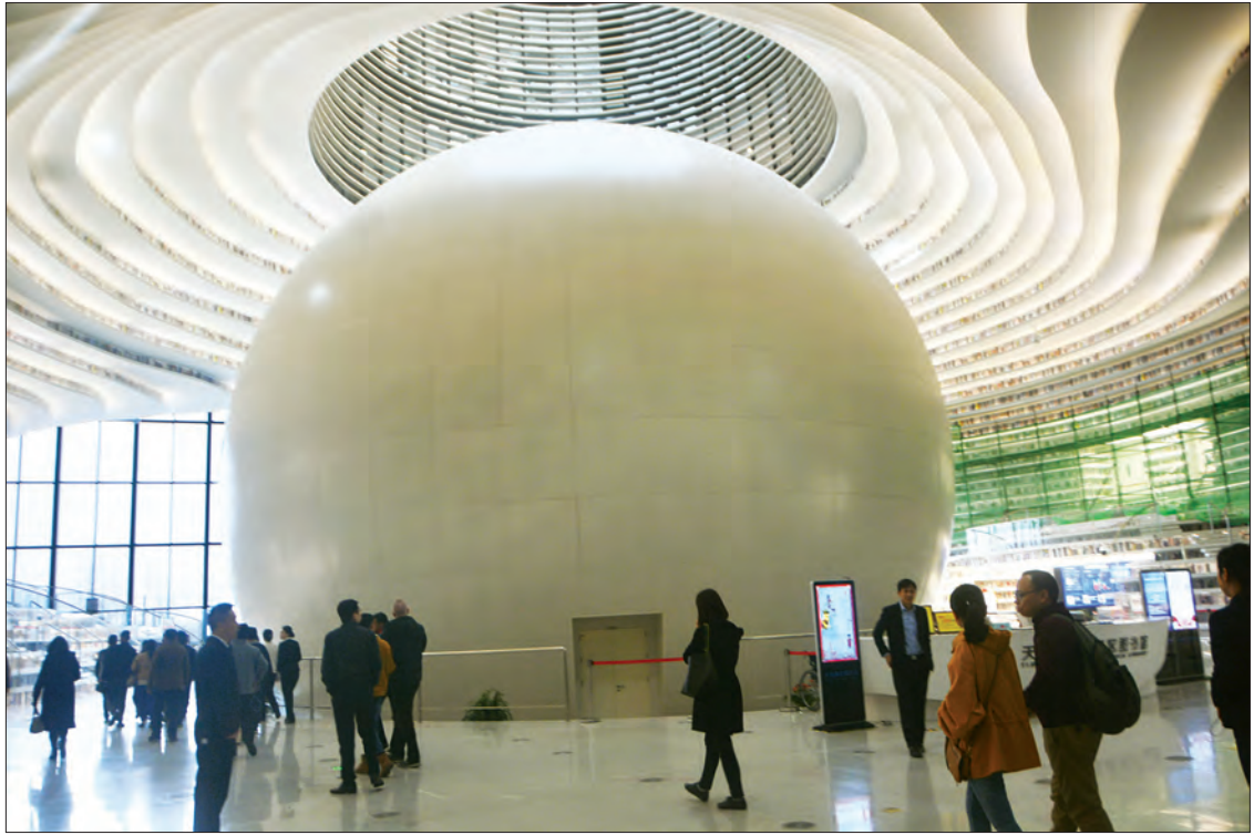
မြန်မာသတင်းမီဒီယာအဖွဲ့များ ထျန်းကျင်းမြို့ရှိ ဘင်းဟိုင်စာကြည့်တိုက်အတွင်း လေ့လာကြစဉ်။