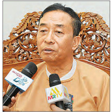
ချင်းပြည်နယ်ဝန်ကြီးချုပ် ဦးဆလင်းလျန်လွယ်

အဆိုပါ ချင်းပြည်နယ် ရင်းနှီးမြှုပ်နှံမှုနှင့် ဒေသထွက်ကုန်ပြပွဲတွင် အမေရိကန်ဒေါ်လာ ၅၄ သန်းကျော် ရင်းနှီးမြှုပ်နှံမည့် လုပ်ငန်းလေးခုအတွက် နားလည်မှုစာချုပ်လွှာ လက်မှတ်ရေးထိုးနိုင်ခဲ့သည်။ သို့ဖြစ်၍ ချင်းပြည်နယ်အတွင်း ရင်းနှီးမြှုပ်နှံမှု အခွင့်အလမ်းများ၊ ပြည်နယ်ဖွံ့ဖြိုးရေးအတွက် ဖော်ဆောင်နေသည့် စီမံကိန်းနှင့်ပတ်သက်ပြီး ပြည်နယ်အစိုးရနှင့် ရင်းနှီးမြှုပ်နှံမှုနှင့် ကုမ္ပဏီများ ညွှန်ကြားမှုဦးစီးဌာနမှ တာဝန်ရှိသူများနှင့် တွေ့ဆုံမေးမြန်းထားသည်များကို တင်ပြလိုက်ရပါသည်။