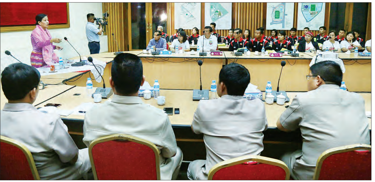
ဒုတိယဝန်ကြီး ဒေါက်တာမြလေးစိန် အပြည်ပြည်ဆိုင်ရာအားကစားပြိုင်ပွဲများသို့ သွားရောက်ယှဉ်ပြိုင်မည့် မြန်မာအားကစားအဖွဲ့များအား အမှာစကားပြောကြားစဉ်။

ပြိုင်ပွဲသို့ သွားရောက်ယှဉ်ပြိုင်မည့် အုပ်ချုပ်သူ တစ်ဦး၊ နည်းပြချုပ်တစ်ဦး၊ နည်းပြတစ်ဦးနှင့် အားကစားသမား ၁၁ ဦး၊ ယနေ့မှန်းလွဲ ၁ နာရီက ရန်ကုန်မြို့ အမျိုးသားအားကစားပြိုင်ပွဲရုံ ၁ သုဝဏ္ဏ (ပတ္တမြား)ခန်းမ၌ တွေ့ဆုံအမှာစကား ပြောကြားသည်။ ယင်းနောက် သွားရောက်ယှဉ်ပြိုင်မည့် ကနူးလှေအဖွဲ့၊ ဘတ်စကက်ဘော အဖွဲ့၊ ပြေးခုန်ပစ်အဖွဲ့များနှင့် တစ်ဦးချင်း မိတ်ဆက်ပေးကာ အားကစားနည်း အလိုက်အဖွဲ့ချုပ် တာဝန်ခံများက မိမိတို့ သွားရောက်ယှဉ်ပြိုင်ကြမည့် အားကစား အသင်းများပြိုင်ပွဲမဝင်မီ ကြိုတင်ပြင်ဆင် လေ့ကျင့်မှုနှင့်ပြိုင်ပွဲသို့ ဝင်ရောက် ယှဉ်ပြိုင်မည့် ကြိုတင်ပြင်ဆင်ထားရှိမှု များကို ရှင်းလင်းတင်ပြကြရာ ဒုတိယ ဝန်ကြီးက လိုအပ်သည်များကို ပေါင်းစပ် ညှိနှိုင်းဖြည့်ဆည်းပေးသည်။ သတင်းစဉ်