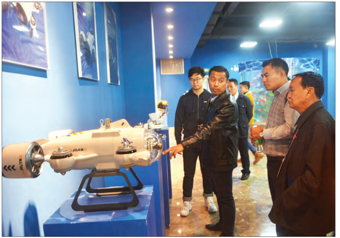
မြန်မာသတင်းမီဒီယာအဖွဲ့များ ထျန်းကျင်းမြို့ရှိ Sublue ကုမ္ပဏီမှ ထုတ်လုပ်သော ရေအောက်သုတေသနယာဉ်များကို လေ့လာကြစဉ်။

ထို့ပြင် မြို့တော်အတွင်း အမှိုက်စွန့်ပစ်မှု ထိန်းသိမ်းရေးစက်ရုံ ရှစ်ရုံအထိ တည်ဆောက် မည်ဖြစ်ကာ ယခုလက်ရှိ စက်ရုံနှစ်ရုံ တည်ဆောက် ပြီးစီးပြီဖြစ်သည်။ မြို့သူမြို့သားများအနေဖြင့် အမှိုက်ပစ်ရာတွင် အမှိုက်ပုံးကို မရသောအမှိုက်၊