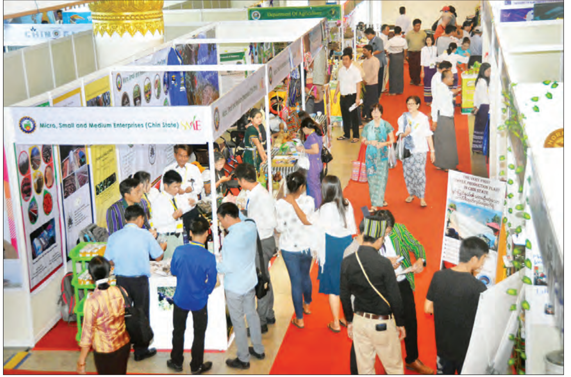
ချင်းပြည်နယ် ရင်းနှီးမြှုပ်နှံမှုနှင့် ဒေသထွက်ကုန်ပြပွဲ ဒုတိယနေ့တွင် ပြပွဲသို့လာရောက်ကြည့်ရှုလေ့လာသူများအား တွေ့ရစဉ်။

ကုလားတန်မြစ်ကြောင်းစီမံကိန်းက ချင်း ပြည်နယ်တစ်ခုလုံးရဲ့ ပင်လယ်ထွက်ပေါက် ဖြစ်ပါတယ်။ ပလက်ဝစီမံကိန်းက ရေကြောင်း၊ ကုန်းကြောင်းရှိတဲ့အပြင် အိန္ဒိယဆိုင်ရင်လည်း လူဦးရေ သန်း ၃၀၀၀ ဝန်းကျင်လောက် ရှိသွားပြီ။ လူဦးရေထူထပ်တဲ့ဟာက စီးပွားရေးလုပ်တဲ့ နေရာမှာ ဈေးကွက်တစ်ခုအနေနဲ့ ရှိနေမှာပါ။ ပြည်တွင်းကထွက်တဲ့ ထွက်ကုန်တွေကို ရောင်းဝယ် ဖောက်ကားလို့ရမယ်။ အပြန်အလှန်အရောင်း