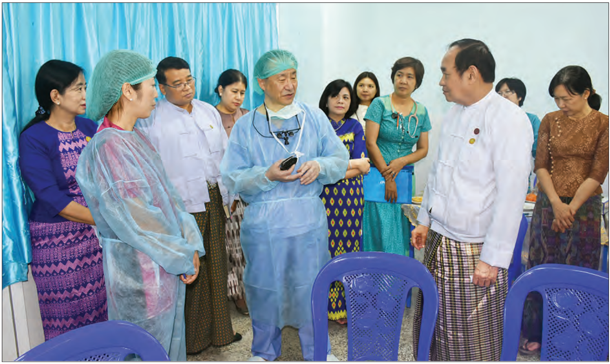
ပြည်ထောင်စုဝန်ကြီး ဒေါက်တာ မြင့်ထွေး ပါမောက္ခ Dr. Tomoaki Taguchi ဦးဆောင်သော အသည်းအစားထိုး ကုသမှုအဖွဲ့အား တွေ့ဆုံနှုတ်ဆက်စဉ်။ သတင်းစဉ်

Dr. Thomas W. Kozlowski ကို ဂုဏ်ပြုအမှတ်တရလက်ဆောင် ပေးအပ် သည်။ ဆက်လက်၍ ပြည်ထောင်စုဝန်ကြီး က ကျန်းမာရေးစောင့်ရှောက်မှု ပေးသူများအနေဖြင့် လူနာများမှ ၎င်းတို့ ၏ ရောဂါဝေဒနာနှင့် ပတ်သက်သော အခြေအနေ၊ သက်သာကောင်းမွန်စေရေး လိုက်နာဆောင်ရွက်ရမည်များ စသည် တို့ကို ရှင်းလင်းစွာသိရှိစေရေးအတွက် လူနာများနှင့် ဆက်သွယ်မှု (communication) ကောင်းမွန်ရမည်ဖြစ်ပါ ကြောင်း၊ ဝန်ကြီးဌာနအနေဖြင့် လူနာ များ ဆေးရုံမှဆင်းသည့်အခါ သက်ဆိုင်ရာ ရောဂါအလိုက် လိုက်နာကျင့်သုံး ဆောင်ရွက်ရမည့်အချက်များ အသိပေး ပြောကြားခြင်းနှင့် ဆီးချို၊ သွေးတို၊ နှလုံး စသည် ရောဂါများအပါအဝင် ဖြစ်ပွားမှု များပြားသော ရောဂါများနှင့် သက်ဆိုင် သည့် ကျန်းမာရေးအသိပညာပေး လက်ကမ်းစာစောင်များကို ပြုစု၍ ဖြန့်ဝေသွားရန် ဆောင်ရွက်လျက်ရှိပါ ကြောင်း၊ အဆိုပါ ကျန်းမာရေး အသိ ပညာပေး လက်ကမ်းစာစောင်များကို လူနာသမားက လူနာ၏ မိသားစုများ၊ မိတ်ဆွေများကပါ ဖတ်ရှုလေ့လာသိရှိနိုင် မည်ဖြစ်သဖြင့် အကျိုးရှိပါကြောင်း။ Dr. Thomas W. Kozlowski ရှင်းလင်းပြောကြားခဲ့သည့် အကြောင်း