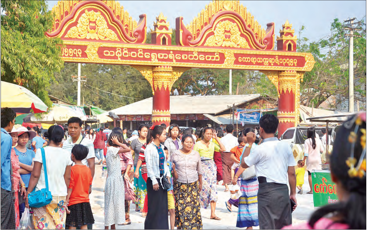
မန္တလေးမြို့ရှိ သမိုင်းဝင်ရွှေစာရံဘုရားပွဲသို့ လာရောက်လည်ပတ်သူများဖြင့် စည်ကားနေမှုကို တွေ့ရစဉ်။

ထို့အပြင် ရွှေစာရံဘုရားပွဲတော်တွင် အစဉ်အဆက် ရောင်းချသည့် ထန်းရွက်ကို မြန်မာမှုလက်ရာများဖြင့် ဖန်တီးထုတ်လုပ်ထားသည့် ပစ္စည်းများကို ပေါ်လွင်အောင် တေးဖွဲ့ဆိုထားသည်မှာ... “ကျွန်မတို့အရွယ် လူဖိုရယ် x အသက် မကြီးသေးပေါင် မောင်ရယ် x ထန်းရွက်ပုတီးလေးဆွဲလို့ x ရွှေစာရံကို အရောက်သွားလို့လည်” တဲ့ မောင်ယဉ်အောင်ရဲ့ ကိုးဆယ်ဆာလိမ့်မယ် ရုပ်ရင်ဇာတ်ကားတွင်လည်း ပါဝင်သီဆိုထားသည်။ သီချင်းထဲတွင် ထန်းရွက်ပုတီးသည် ရွှေစာရံပွဲတော်၏ သင်္ကေတဖြစ်သည်။ ဘုရားပွဲတွင် ရောင်းချသည့်