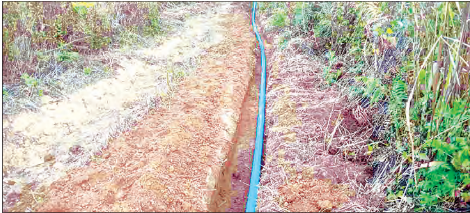
စိမ့်စမ်းရေပိုက်လိုင်းသွယ်တန်းမှုလုပ်ငန်းခွင်ကို တွေ့ရစဉ်။