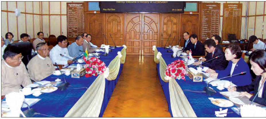
ပြည်ထောင်စုဝန်ကြီး ဦးဟန်ဇော်နှင့် ကိုရီးယားသမ္မတနိုင်ငံမြေယာအခြေခံအဆောက်အအုံနှင့် ပို့ဆောင်ရေးဝန်ကြီးတို့ တွေ့ဆုံစဉ်။

နေပြည်တော် မတ် ၁၇ ဆောက်လုပ်ရေးဝန်ကြီးဌာန ပြည်ထောင်စုဝန်ကြီး ဦးဟန်ဇော်သည် ကိုရီးယားသမ္မတနိုင်ငံ မြေယာ၊ အခြေခံအဆောက်အအုံနှင့် ပို့ဆောင်ရေးဝန်ကြီး Ms. Kim Hyum Mee နှင့်အဖွဲ့အား မတ် ၁၅ ရက်က နေပြည်တော်ရှိ ဆောက်လုပ်ရေးဝန်ကြီးဌာန အစည်းအဝေးခန်းမဆောင်၌ တွေ့ဆုံသည်။ ထိုသို့တွေ့ဆုံစဉ် အခြေခံအဆောက်အအုံကဏ္ဍ၌ ပူးပေါင်းဆောင်ရွက်မှု တိုးမြှင့်ရေးဆိုင်ရာ ဆောင်ရွက်ချက်များ၊ Korea - Myanmar Industrial Complex (KMIC) စီမံကိန်းနှင့် ကိုရီးယား-မြန်မာချစ်ကြည်ရေး(ဒလ) တံတား ပန္နက်တင်အခမ်းအနားအပြီး