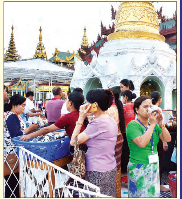
ဘုရားဖူးလာပြည်သူများ အန္တရာယ်ကင်းပရိတ်ရေများ သောက်သုံးကြစဉ်။