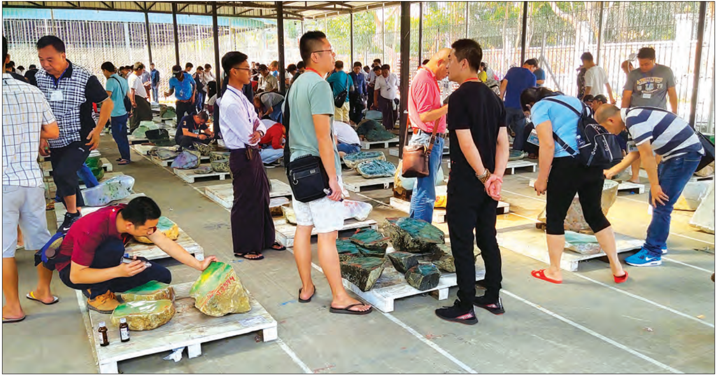
မြန်မာ့ကျောက်မျက်ရတနာပြပွဲ၌ ပြသထားသည့် ကျောက်စိမ်းအတွဲများကို ရတနာကုန်သည်များ ရွေးချယ်ဝယ်ယူကြစဉ်။

(၅၆) ကြိမ်မြောက် မြန်မာ့ကျောက်မျက်ရတနာပြပွဲကို မဏိရတနာကျောက်စိမ်းခန်းမ၌ မတ် ၂၀ ရက်အထိ ဆက်လက် ကျင်းပသွားမည်ဖြစ်ပြီး မတ် ၁၈ ရက်တွင် ကျောက်စိမ်းအတွဲ အမှတ် ၃၆၀၁ မှ ၄၈၀၀ အထိ လည်းကောင်း၊ မတ် ၁၉ ရက်တွင် ကျောက်စိမ်း အတွဲအမှတ် ၄၈၀၁ မှ ၆၀၀၀ အထိ လည်းကောင်း၊ မတ် ၂၀ ရက်တွင် ကျောက်စိမ်းအတွဲအမှတ် ၆၀၀၁ မှ ၆၉၇၃ အထိ လည်းကောင်း စာမျက်နှာ ၁၀ ကော်လံ ၁ *