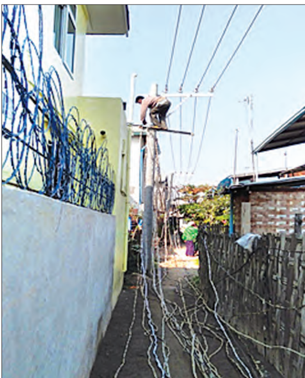
မန္တလေးတိုင်းဒေသကြီး ချမ်းအေးသာစံမြို့နယ်အတွင်း ဓာတ်အားသုံးစွဲသူ မိဘပြည်သူ များ လျှပ်စစ်အန္တရာယ် ကင်းရှင်းရေး၊ ဝိုင်းရံအပြည့်အဝရရှိရေးတို့အတွက် ချမ်းအေး သာစံမြို့နယ် လျှပ်စစ် မန်နေဂျာရုံးမှ ဝန်ထမ်းများက ရှည်လျားရှုပ်ထွေးလျက်ရှိသော ဆားပစ်ကြိုးများကို မတ်လ တတိယပတ်က ရှင်းလင်းဆောင်ရွက်ခဲ့စဉ် (လက်ရှိအချိန် တွင် ဆောင်ရွက်ပြီးပြီဖြစ်၍ ရပ်ကွက်နေပြည်သူများ နေရာသီဇာတ်အားပြတ်တောက်မှု လျော့နည်းစေပြီး ဝိုင်းရံ အပြည့်အဝ သုံးစွဲနိုင်ပြီဖြစ်ကြောင်း သိရသည်။) မန်း(ကိုယ်ပွား)