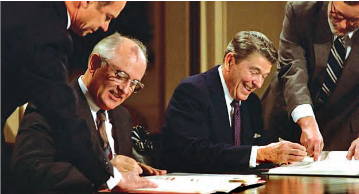
မီခေးလ်ဂေါ်ဘာချော့ဘ်(ဝဲ)နှင့် ရော်နယ်ရောင်တို့ ၁၉၈၇ ခုနှစ်က တာလတ်ပစ်နျူကလီးယားလက်နက်ထိန်းချုပ်ရေး သဘောတူစာချုပ်ကို လက်မှတ်ရေးထိုးခဲ့စဉ်။

မျိုးဆက်သစ်တွေအတွက် အိပ်မက်ဆိုးတစ်ခု အိပန်နော့ရဲ့ အိပ်မက်မြင်ချက်ကို အမေရိကန် ဆီးနိတ် လွှတ်တော်အမတ်ဟောင်းလည်းဖြစ်၊ ကာလရှည်အောင် လက်နက်ထိန်းချုပ်ရေးတက်ကြွလှုပ်ရှားသူတစ်ဦးလည်းဖြစ်တဲ့ ဆမ်နွမ်က ထောက်ခံခဲ့ပါတယ်။ အကယ်၍သာ အမေရိကန် ရုရှားနဲ့ တရုတ်တို့အတူ အလုပ်မလုပ်ကြတော့ဘူးဆိုရင် ကျွန်ုပ် တို့ရဲ့သားသမီး မြေးမြစ်တွေအတွက် အိပ်မက်ဆိုးတစ်ခုဖြစ်လာနိုင် တယ်လို့ ၎င်းက ပြောကြားလိုက်ပါတယ်။ ၎င်းက လက်ရှိ ခေါင်းဆောင်တွေကို သမ္မတရော်နယ်ရောင်နဲ့ မီခေးလ် ဂေါ်ဘာချော့ဘ်တို့ လုပ်ဆောင်ခဲ့သလိုမျိုး စစ်အေးတိုက်ပွဲ ပြီးဆုံး အောင်ချဉ်းကပ်ခဲ့ပုံမျိုးကို အတုယူဖို့ တိုက်တွန်းထားပြီး နျူကလီး ယားစစ်ပွဲဆိုတာမျိုးက အနိုင်မရနိုင်ဘူး။ ဒီအတွက်ကြောင့် ဒါကိုဘယ်သောအခါမှ ထည့်သွင်းစဉ်းစားလို့ မရဘူးဆိုတဲ့ အဆိုကို ဝန်းရံဖို့ ဆော်ဩနေပါတယ်။