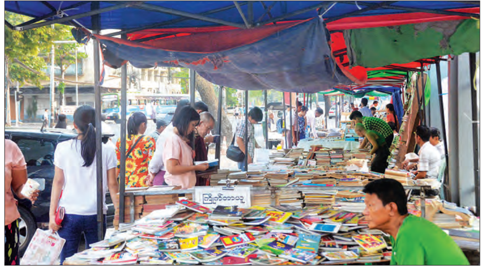
ရန်ကုန်စာအုပ်လမ်းတွင် စာပေချစ်သူများဖြင့် စည်ကားနေမှုကို တွေ့ရစဉ်။

(ညောင်လေးပင်) ၏ “ခြောက်ဆယ်အရွယ် စမ်းထတယ်” ခေါင်းစဉ်ဖြင့် စာပေဟောပြောပွဲ၊ ညနေ ၄ နာရီတွင် သီဟရတနာစာအုပ်တိုက်မှ စီစဉ်သည့်