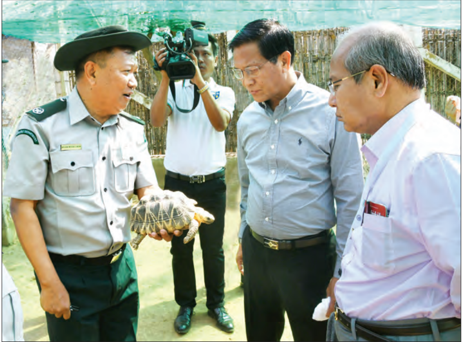
ဒုတိယသမ္မတ ဦးဟင်နရီဝန်ထီးယူ ဘေးမဲ့တောဥယျာဉ်အတွင်း ကြယ်လိပ်များ မွေးမြူထားရုံကို ကြည့်ရှုစဉ်။

ညနေပိုင်းတွင် ဒုတိယသမ္မတသည် အဖွဲ့ဝင်များနှင့်အတူ မော်တော်ယာဉ်များဖြင့် နေပြည်တော်သို့ ပြန်လည်ရောက်ရှိကြသည်။