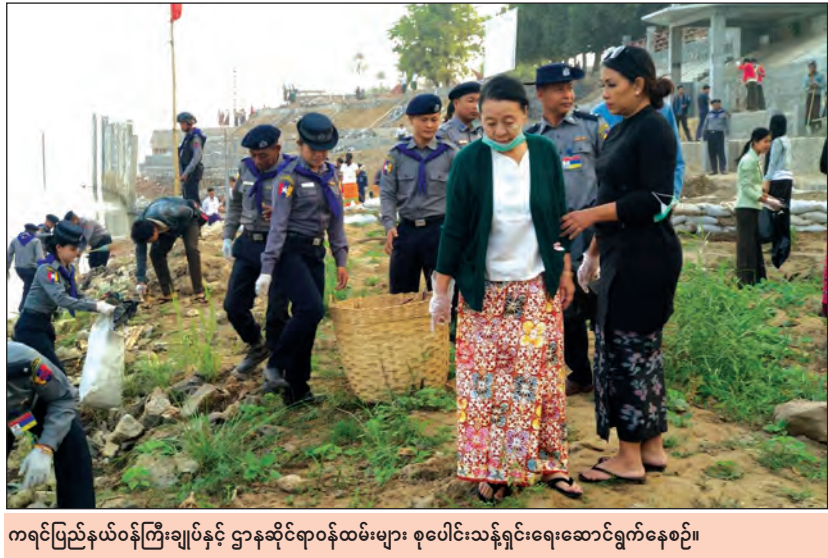
ကရင်ပြည်နယ်ဝန်ကြီးချုပ်နှင့် ဌာနဆိုင်ရာဝန်ထမ်းများ စုပေါင်းသန့်ရှင်းရေးဆောင်ရွက်နေစဉ်။