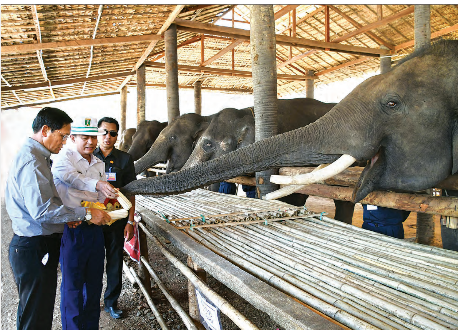
ဒုတိယသမ္မတ ဦးဟင်နရီပန်ထီးယူ ရွှေစက်တော် မန်းချောင်းအပန်းဖြေဆင်စခန်း၌ ဆင်များအား အစာကျွေးစဉ်။ သတင်းစဉ်

နေပြည်တော် မတ် ၁၇ ဒုတိယသမ္မတ ဦးဟင်နရီပန်ထီးယူ သည် မတ် ၁၆ ရက်က ရွှေစက်တော် တော်ရိုင်းတိရစ္ဆာန် ဘေးမဲ့တော၊ မန်းချောင်းအပန်းဖြေဆင်စခန်း၊ ကော်ဖီ နည်းပညာဖွံ့ဖြိုးရေးမြို့ (နတ်ရေကန်) နှင့် မျိုးကောင်းမျိုးသန့် နွားမွေးမြူရေး ခြံတို့အား လှည့်လည်ကြည့်ရှု၍ လိုအပ်သည်များ မှာကြားသည်။ ဒုတိယသမ္မတ ဦးဟင်နရီပန်ထီးယူ သည် မကွေးတိုင်းဒေသကြီး ဝန်ကြီးချုပ် ဒေါက်တာအောင်မိုးညို၊ ဒုတိယဝန်ကြီး များဖြစ်ကြသည့် ဗိုလ်ချုပ်မြင့်နွယ်၊ ဒေါက်တာ ရဲမြင့်ဆွေ၊ တိုင်းဒေသကြီး ဝန်ကြီးများ၊ လွှတ်တော်ကိုယ်စားလှယ် များ၊ ဌာနဆိုင်ရာတာဝန်ရှိသူများနှင့် အတူ မတ် ၁၆ ရက် နံနက်ပိုင်းက မော်တော်ယာဉ်များဖြင့် ရွှေစက်တော် တော်ရိုင်းတိရစ္ဆာန်ဘေးမဲ့တောဥယျာဉ် စီမံကိန်းရှင်းလင်းဆောင်သို့ ရောက်ရှိကြသည်။ ရှင်းလင်းဆောင်တွင် ဒုတိယ ညွှန်ကြားရေးမှူးချုပ် ဦးကျော်ကျော် လွင်က နိုင်ငံအတွင်း ဇီဝမျိုးစုံမျိုးကွဲနှင့် သဘာဝထိန်းသိမ်းရေးနယ်မြေများ ဖွဲ့စည်းတည်ထောင်ထားရှိမှု၊ သဘာဝ ပတ်ဝန်းကျင်နှင့် သားငှက်တိရစ္ဆာန် ထိန်းသိမ်းရေးဌာနက ထိန်းသိမ်း ကာကွယ်စောင့်ရှောက်လျက်ရှိသည့် ဘေးမဲ့တောများအခြေအနေ၊ ရွှေစက် တော် တော်ရိုင်းတိရစ္ဆာန်ဘေးမဲ့တော ဥယျာဉ်နောက်ခံသမိုင်းအကျဉ်း၊ ဖွဲ့စည်း တည်ထောင်ရသည့် ရည်ရွယ်ချက်၊ စာမျက်နှာ ၃ ကော်လံ ၁ □