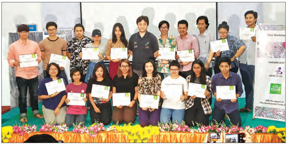
Animation Workshop အဖွဲ့တစ်ဖွဲ့မှ သင်တန်းသားများနှင့် နည်းပြတို့ စုပေါင်းမှတ်တမ်းတင် ဓာတ်ပုံရိုက်စဉ်။

ရန်ကုန် မတ် ၁၇ ပြန်ကြားရေးဝန်ကြီးဌာန၏ ပံ့ပိုးမှုဖြင့် ဝဿန်ရုပ်ရှင်ပွဲတော်နှင့် ဂျပန်ဖောင်ဒေးရှင်းတို့က ကြီးမှူး၍ စတုတ္ထအကြိမ် Animation Workshop ကို မတ် ၁၃ ရက်မှ ၁၇ ရက်အထိ ငါးရက်ကြာ ကျင်းပပြီးစီးသည့်အခမ်းအနားကို ယနေ့ ညနေ ၄ နာရီက ရန်ကုန်မြို့ ဝဟန်းမြို့နယ် ရွှေတောင်ကြားလမ်း အမှတ် ၅၀ ရှိ ရုပ်ရှင်ဖွံ့ဖြိုးတိုးတက်ရေးစင်တာ၌ ကျင်းပ သည်။