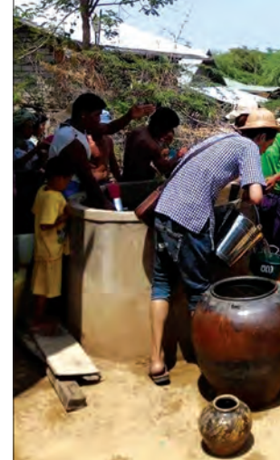
ယခင်နှစ်က ရေပြတ်လပ်ခဲ့သည့်ရွာများသို့ ဝလင်းတန် လူမှုကူညီရေးအသင်းမှ ရေလှူဒါန်းနေစဉ်။

ပေါင်း ၂၄၇ ရွာရှိပြီး နှစ်စဉ်နီးပါး သောက်သုံးရေ ရှားပါးလေ့ရှိသော ကျေးရွာများမှာ ကမ္ဘာ့မြေကျေးရွာအုပ်စု၌ လျှော့ဖြူကုန်း၊ သရက်ကန်နှင့် ရေတွင်းကျေးရွာ မြင်းဦး လှည့်ကျေးရွာအုပ်စု၌ မြင်းဦးလှည့်တောင်ရွာ၊ မြင်းဦးလှည့်ရွာ၊ ကသစ်ပင်ကျေးရွာ၊ လယ်ဖျားအုပ်စုတွင် ရေပေါက်ကန်နှစ်ဆင့်ကျေးရွာ၊ နတ်စင်ကုန်းအုပ်စုတွင် ကံရွာ ကျေးရွာ၊ ဖတ်ကုန်းအုပ်စုတွင် ကုန်းကျေးရွာနှင့် မရိုးအုပ်စုမှ ကုခွဲကျေးရွာတို့ဖြစ်သည်။ အဆိုပါကျေးရွာများ၌ အိမ်ခြေ ၆၃၀ ခန့်ရှိကာ စုစုပေါင်းလူဦးရေ ၃၉၀၀ နီးပါး နေထိုင်ကြပြီး ယခုနှစ် နွေရာသီကာလ သောက်သုံးရေ ရှားပါးမှုများကို စတင်ကြုံတွေ့ရ ပြီဖြစ်ကာ အဓိကအားဖြင့် သောက်ရေအတွက် ပို၍အခက်ကြုံနေကြရကြောင်း ဒေသခံပြည်သူများထံမှ သိရသည်။ မလိုင်မြို့ပေါ်ရှိ ဝလင်းတန် လူမှုရေးအသင်းအနေ ဖြင့် ပြည်သူတို့၏ လှူဒါန်းငွေဖြင့် အဆိုပါ ရေရှားပါးသည့်ကျေးရွာများသို့ နှစ်စဉ် ရေများ ဖြန့်ဝေလှူဒါန်းလျက်ရှိရာ ယခုနှစ်တွင် မတ် ၉ ရက်က အရှေ့တူနီကျေးရွာသို့ ရေများ စတင်လှူဒါန်းထားရကြောင်းလည်း သိရသည်။ မလိုင်မြို့နယ် ကျေးလက်ဒေသဖွံ့ဖြိုးတိုးတက်ရေးဦးစီးဌာနမှ တာဝန်ရှိသူတစ်ဦးက သောက်သုံးရေပြတ်လပ်မှုဖြစ်နေသည့် ကျေးရွာများကို စာရင်းပြုစုထားကာ ရေရရှိရေး ဆောင်ရွက်ပေးရန်အတွက် အထက်အဆင့်ဆင့် တင်ပြထားကြောင်း၊ လက်ရှိအချိန်တွင် ကျေးရွာများ၌ သောက်သုံးရေပြတ်လပ်မှုနှင့် ကြုံတွေ့ပါက မလိုင် မြို့နယ် ကျေးလက်ဒေသဖွံ့ဖြိုးတိုးတက်ရေးဦးစီးဌာန ဖုန်း ၀၆၄-၂၀၆၀၆၄၆ သို့ ဖုန်းဖြင့်ဖြစ်စေ၊ လူကိုယ်တိုင်ဖြစ်စေ ဆက်သွယ်၍ အကူအညီတောင်းခံနိုင်ကြောင်း၊ မလိုင်မြို့နယ် ကျေးလက်ဒေသဖွံ့ဖြိုးတိုးတက်ရေးဦးစီးဌာနအနေဖြင့် မြို့နယ်မီးသတ် တပ်ဖွဲ့နှင့်ပူးပေါင်း၍ ရေပြတ်လပ်သည့်ရွာများသို့ အချိန်မီ ရေဖြည့်ဆည်းပေးနိုင်ရန် စီစဉ်ထားကြောင်း ပြောကြားသည်။