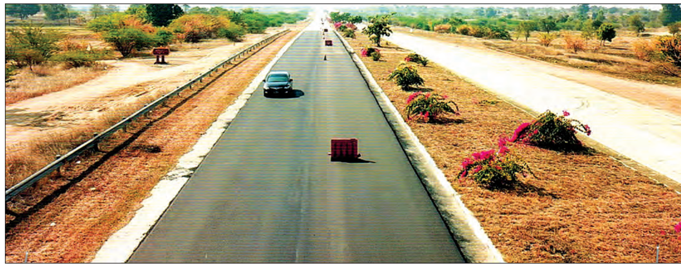
ရန်ကုန်-မန္တလေးအမြန်လမ်းမကြီးကို နိုင်လွန်ကတ္တရာ (AC) ခင်း၍ ဤသို့ အဆင့်မြှင့်တင်ထားသည်။