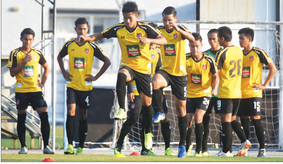
မြန်မာယူ-၂၂အသင်းအား လေ့ကျင့်ရေးကွင်း၌တွေ့ရစဉ်။

ရန်ကုန် မတ် ၁၇ နိုင်ငံတကာပြိုင်ပွဲများ ဝင်ရောက် ယှဉ်ပြိုင်ရန် လေ့ကျင့်ပြင်ဆင်နေသည့် မြန်မာ ယူ-၂၂ အသင်းနှင့် ဗီယက်နမ် ယူ-၂၂ အသင်းသည် ဇွန်လတွင် ခြေစမ်းပွဲ ယှဉ်ပြိုင်ကစားမည်ဖြစ်သည်။ မြန်မာနိုင်ငံဘောလုံးအဖွဲ့ချုပ်သည် မြန်မာ ယူ-၂၂ အသင်း ဆီးဂိမ်းပြိုင်ပွဲတွင် အောင်မြင်မှုရရှိ ကြိုတင်ပြင်ဆင်မှုများ စတင်ပြုလုပ်နေပြီဖြစ်ပြီး ဇွန်လမှ စတင်ကာ နိုင်ငံတကာခြေစမ်းပွဲနှင့် ဖိတ်ခေါ်ပြိုင်ပွဲများ ယှဉ်ပြိုင်ရန် စတင် ဆောင်ရွက်လျက်ရှိသည်။ မြန်မာနိုင်ငံ ဘောလုံးအဖွဲ့ချုပ်နှင့် ဗီယက်နမ်ဘောလုံး အဖွဲ့ချုပ်သည် ယူ-၂၂ အသင်းများ ခြေစမ်းပွဲများကစားရန် သဘောတူညီမှု ရခဲ့ပြီး ကစားမည့်ရက်နှင့်နေရာကို ပြန်လည်အတည်ပြုမည် ဖြစ်သည်။ မြန်မာ ယူ-၂၂ အသင်းသည် ဇွန်လတွင် ဗီယက်နမ်အသင်းနှင့် ခြေစမ်းပွဲအပြင် တောင်ကိုရီးယားတက္ကသိုလ် ဖိတ်ခေါ် ပြိုင်ပွဲတွင်လည်း ဝင်ရောက်ယှဉ်ပြိုင်မည် ဖြစ်သည်။