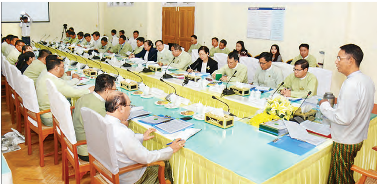
ပြည်ထောင်စုဝန်ကြီး ဒေါက်တာအောင်သူ စိုက်ပျိုးရေး၊ မွေးမြူရေးနှင့် ဆည်မြောင်းဝန်ကြီးဌာန ကျေးလက်ဒေသဖွံ့ဖြိုးတိုးတက်ရေးဦးစီးဌာန လုပ်ငန်းညှိနှိုင်းအစည်းအဝေးတွင် အမှာစကားပြောကြားစဉ်။

ထို့နောက် ညွှန်ကြားရေးမှူးချုပ် ဦးခန့်ဇော်က ကျေးလက်ဒေသဖွံ့ဖြိုးတိုးတက်ရေးဦးစီးဌာနက ဘဏ္ဍာနှစ်အလိုက် ဆောင်ရွက်လျက်ရှိသော ကျေးလက်ရေးရာရရှိရေး၊ ကျေးလက်မီးလင်းရေး၊ လူထုအခြေပြုစီမံကိန်းများ၊ အသက်မွေးဝမ်းကျောင်း လုပ်ငန်းများနှင့် စွမ်းဆောင်ရည်မြှင့်တင်ရေးလုပ်ငန်းများ ဆောင်ရွက်ပေးနေမှုတို့ကို လည်းကောင်း၊ ရုံးချုပ်နှင့် တိုင်းဒေသကြီး/ပြည်နယ်များ၏ တင်ဒါလုပ်ငန်းများ ဆောင်ရွက်မှု အခြေအနေများကိုလည်းကောင်း၊ လူထုပတ်ဝန်းကျင် (ပဉ္စမနှစ်စက်ဝန်း)