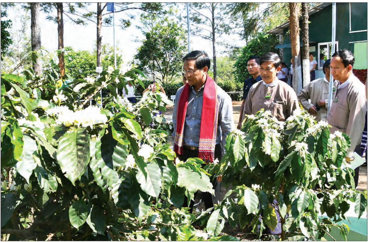
ဒုတိယသမ္မတ ဦးဟင်နရီဝန်ထီးယူ မင်းဘူးခရိုင် ငမဲမြို့နယ်၌ စိုက်ပျိုးရေးဦးစီးဌာန ကော်စီရာသီ သီးနှံဌာနခွဲက တာဝန်ယူဆောင်ရွက်လျက်ရှိသည့် ကော်စီနည်းပညာစိုက်ပျိုးရေးခြံ (နတ်ရေကန်) ၌ ကော်စီစိုက်ပျိုးထားမှု အခြေအနေကို လှည့်လည်ကြည့်ရှုစဉ်။

ယင်းနောက် ဒုတိယသမ္မတနှင့် အဖွဲ့ဝင်များသည် မန်ရွှေစက်တော်ဘုရားသို့ သွားရောက်၍ ပန်း၊ ရေချမ်း၊ ဆီမီးတုံး ဆက်ကပ်လှူဒါန်းပြီး ဂေါပကအဖွဲ့ဝင် အလှူငွေများပေးအပ်လှူဒါန်းကာ