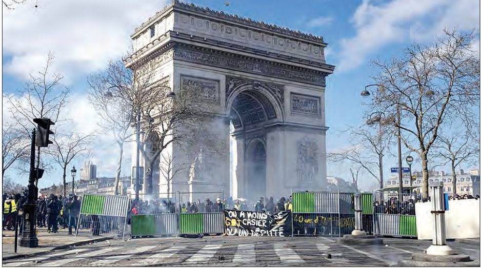
ပြင်သစ်နိုင်ငံ ပါရီမြို့၌ ဆန္ဒပြနေသူများကို မတ် ၁၆ ရက်က တွေ့ရစဉ်။

အဆိုပါဖြစ်ရပ်သည် လက်ခံနိုင်ဖွယ်မရှိကြောင်း ပြင်သစ် ဝန်ကြီးချုပ် ဒီရော့ဖီလစ်က ပြောသည်။ မတ် ၁၆ ရက်က ပေါ်ပေါက်ခဲ့သည့် အဝါရောင်အင်္ကျီဝတ် ဆန္ဒပြလှုပ်ရှားမှုကို ဆော်ဩသူက ယခုဖြစ်ရပ်သည် ပြင်သစ်သမ္မတမက်ခရွန် အတွက် ရာဇသံပင်ဖြစ်သည်ဟု ပြောကြားခဲ့ပြီး အဆိုပါ ဆန္ဒပြပွဲအတွင်း လူပေါင်း ၃၂၀၀ ပါဝင်ခဲ့ရာ ပြီးခဲ့သည့် သီတင်း ပတ်က ဖြစ်ပွားခဲ့သည့် ဆန္ဒပြပွဲတွင်မူ လူပေါင်း ၂၀၆၀၀ ခန့် ပါဝင်ခဲ့ကြောင်း သိရသည်။ ဆင်ဟွာ