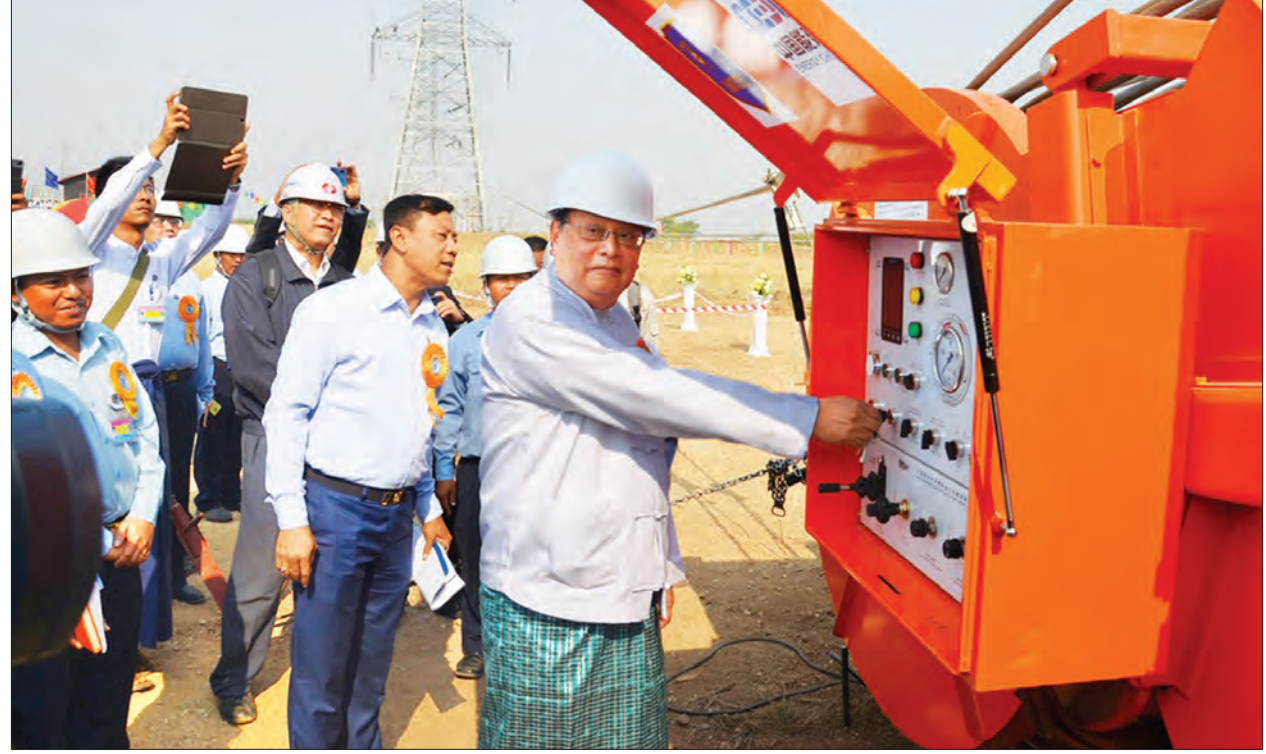
ပြည်ထောင်စုဝန်ကြီး ဦးဝင်းနိုင် ၅၀၀ ကေစီ ကံကောင်း (မိတ္ထီလာ) - စပါးကြွယ် (တောင်ငူ) မဟာဓာတ်အားလိုင်း ၁၄၆ မိုင် ကြိုးဆွဲလုပ်ငန်းစတင်ခြင်း အထိမ်းအမှတ်အဖြစ် Tensioner Switch အား စက်ခလုတ်နှိပ်ဖွင့်လှစ်ပေးစဉ်။

ပူးပေါင်းကူညီ ဆောင်ရွက်ပေးကြစေလိုကြောင်း ပြောကြားသည်။ ထို့နောက် CEEC ကုမ္ပဏီ၏ တာဝန်ရှိသူက ၅၀၀ ကေစီ ကံကောင်း (မိတ္ထီလာ) - စပါးကြွယ် (တောင်ငူ) မဟာဓာတ်အားလိုင်း ၁၄၆ မိုင် ကြိုးဆွဲလုပ်ငန်း ဆောင်ရွက်မည့် အစီအမံများကို ရှင်းလင်းတင်ပြသည်။ ယင်းနောက် ပြည်ထောင်စုဝန်ကြီး ဦးဝင်းနိုင်က ၅၀၀ ကေစီ ကံကောင်း (မိတ္ထီလာ) - စပါးကြွယ် (တောင်ငူ) မဟာဓာတ်အားလိုင်း ၁၄၆ မိုင် ကြိုးဆွဲလုပ်ငန်း စတင်ခြင်း အထိမ်းအမှတ်အဖြစ် Tensioner Switch အား စက်ခလုတ် နှိပ်ဖွင့်လှစ်ပေးခဲ့ပြီး ပြည်ထောင်စုဝန်ကြီးနှင့် တာဝန်ရှိသူများက Running Board ကို အမွှေးနံ့သာချည်များ ပတ်ဖျန်းပေးသည်။