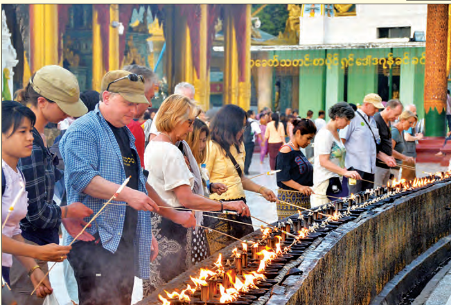
ပြည်ပခရီးသွားဧည့်သည်များ ဆီမီးထွန်းညှိပူဇော်ကြစဉ်။