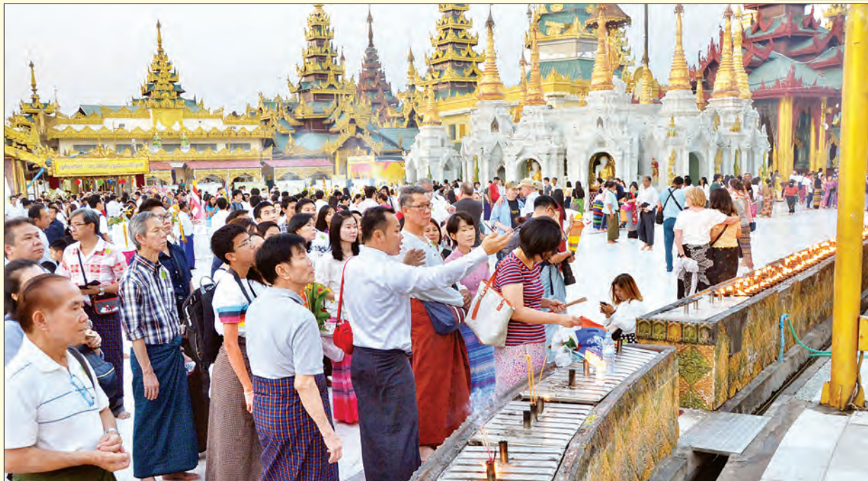
ရွှေတိဂုံစေတီတော်ရင်ပြင်၌ ဘုရားဖူးလာပြည်သူများဖြင့် စည်ကားနေသည်ကို တွေ့ရစဉ်။