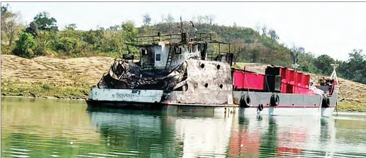
AA အဖွဲ့ မီးရှို့ဖျက်ဆီးခဲ့သည့် ရေယာဉ်ကို တွေ့ရစဉ်။