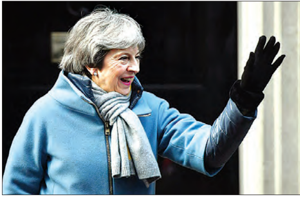
ဗြိတိန်ဝန်ကြီးချုပ် ထရီဆာမေ

ဗြိတိန်နိုင်ငံသည် ၂၀၁၆ ခုနှစ်ကတည်းက အီးယူမှခွဲထွက်ရေး လူထုဆန္ဒခံယူပွဲ ကျင်းပခဲ့ပြီး နှစ်နှစ်ကျော်ကြာ ခက်ခဲလှသည့် ဆွေးနွေးမှုများ ပြုလုပ်ခဲ့ပြီးနောက် ပြီးခဲ့သည့် နိုဝင်ဘာလက ထရီဆာမေသည် အီးယူမှ ခွဲထွက်ရေးစာချုပ်အတွက် အီးယူ