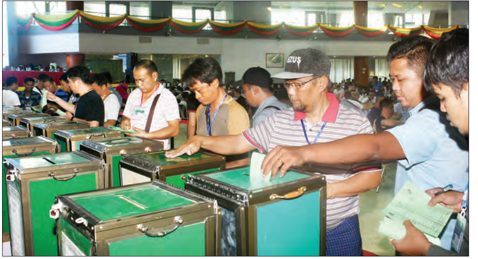
ပြည်တွင်း ပြည်ပ ရတနာကုန်သည်များ ဝယ်ယူမည့်ကျောက်စိမ်းအတွဲများအတွက် အိတ်စွင့်တင်ဒါများ တင်ဒါပုံစံအတွင်းသို့ ထည့်သွင်းနေသည်ကို တွေ့ရစဉ်။

★ ကျောစုံမှ ထိန်းသိမ်းရေးဝန်ကြီးဌာန ပြည်ထောင်စုဝန်ကြီး ဦးအုန်းဝင်း၊ ခင်းကျင်းပြသ ရောင်းချပေးသွားမည်ဖြစ်ကြောင်း သိရသည်။ ဒုတိယဝန်ကြီး ဒေါက်တာ ရဲမြင့်ဆွေတို့နှင့်အတူ ဌာနဆိုင်ရာ မွန်းလွှဲပိုင်းတွင် သယံဇာတနှင့် သဘာဝပတ်ဝန်းကျင် တာဝန်ရှိသူများသည် မဏိရတနာကျောက်စိမ်းခန်းမအတွင်း