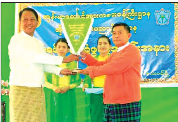
တိုင်းဒေသကြီးဝန်ကြီးချုပ်က အလှူရှင်တစ်ဦးအား ဂုဏ်ပြုမှတ်တမ်းလွှာပေးအပ်စဉ်။

အဆိုပါ (၁၆)ခုတင်ဆွဲ တိုင်းရင်းဆေးရုံကို ပြည်သူများ၏ကျန်းမာရေးအတွက် ကျန်းမာရေးနှင့် အားကစားဝန်ကြီးဌာန တိုင်းရင်းဆေးပညာဦးစီးဌာန၏ ရည်မှန်းချက်များနှင့်အညီ ၂၀၁၅-၂၀၁၆ ဘဏ္ဍာရေးနှစ်မှစ၍ ပြည်ထောင်စုခွင့်ပြုရန်ပုံငွေ ကျပ် ၁၅၄ သန်းဖြင့် အလှူပေး ၂၄ ပေ၊ အန် ၆၄ ရေရှိ အာရုံစိုက် တစ်ထပ်အဆောက်အအုံ အဖြစ် ဆောက်လုပ်ခဲ့ကာ ဆေးရုံနှင့်အတူ လေးခန်းတွဲ ဝန်ထမ်းအိမ်ရာကိုလည်း ၂၀၁၆-၂၀၁၇ ဘဏ္ဍာနှစ် ပြည်ထောင်စု ခွင့်ပြုရန်ပုံငွေ ကျပ်သိန်း ၃၀၀၀ ကျော်ဖြင့် ဆောက်လုပ်ခဲ့ကြောင်း၊ ဆေးရုံကို ရုံးပိတ်ရက်များမှအပ ကျန်ရက်များတွင် နေ့စဉ်