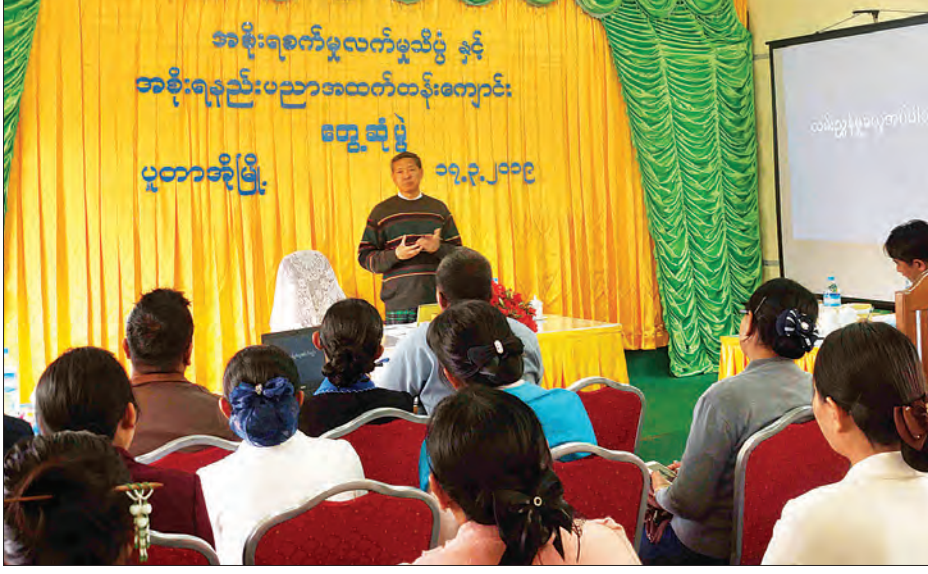
ပြည်ထောင်စုဝန်ကြီး ဒေါက်တာမျိုးသိမ်းကြီး ပူတာအိုမြို့ရှိ အစိုးရစက်မှုလက်မှုသိပ္ပံနှင့် အစိုးရနည်းပညာအထက်တန်းကျောင်းများမှ ကျောင်းအုပ်ကြီး၊ ဌာနမှူးများ၊ ဆရာ၊ ဆရာမများအား တွေ့ဆုံမှာကြားစဉ်။

ပြည်ထောင်စုဝန်ကြီး ဒေါက်တာမျိုးသိမ်းကြီးသည် ယနေ့မုန်းလွဲ ၃ နာရီခွဲတွင် ကချင်ပြည်နယ် ပူတာအိုခရိုင် ပူတာအိုမြို့ရှိ အစိုးရနည်းပညာအထက်တန်းကျောင်းခန်းမ၌ အစိုးရစက်မှုလက်မှုသိပ္ပံနှင့် အစိုးရနည်းပညာအထက်တန်းကျောင်းများမှ ကျောင်းအုပ်ကြီး၊ ဌာနမှူးများ၊ ဆရာ၊ ဆရာမများအား တွေ့ဆုံသည်။