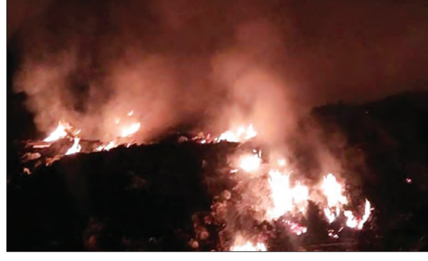
နွားထိုးကြီးမြို့ရှိ စည်ပင်အမှိုက်ပုံ မတ် ၃ ရက်က မီးလောင်နေစဉ်။