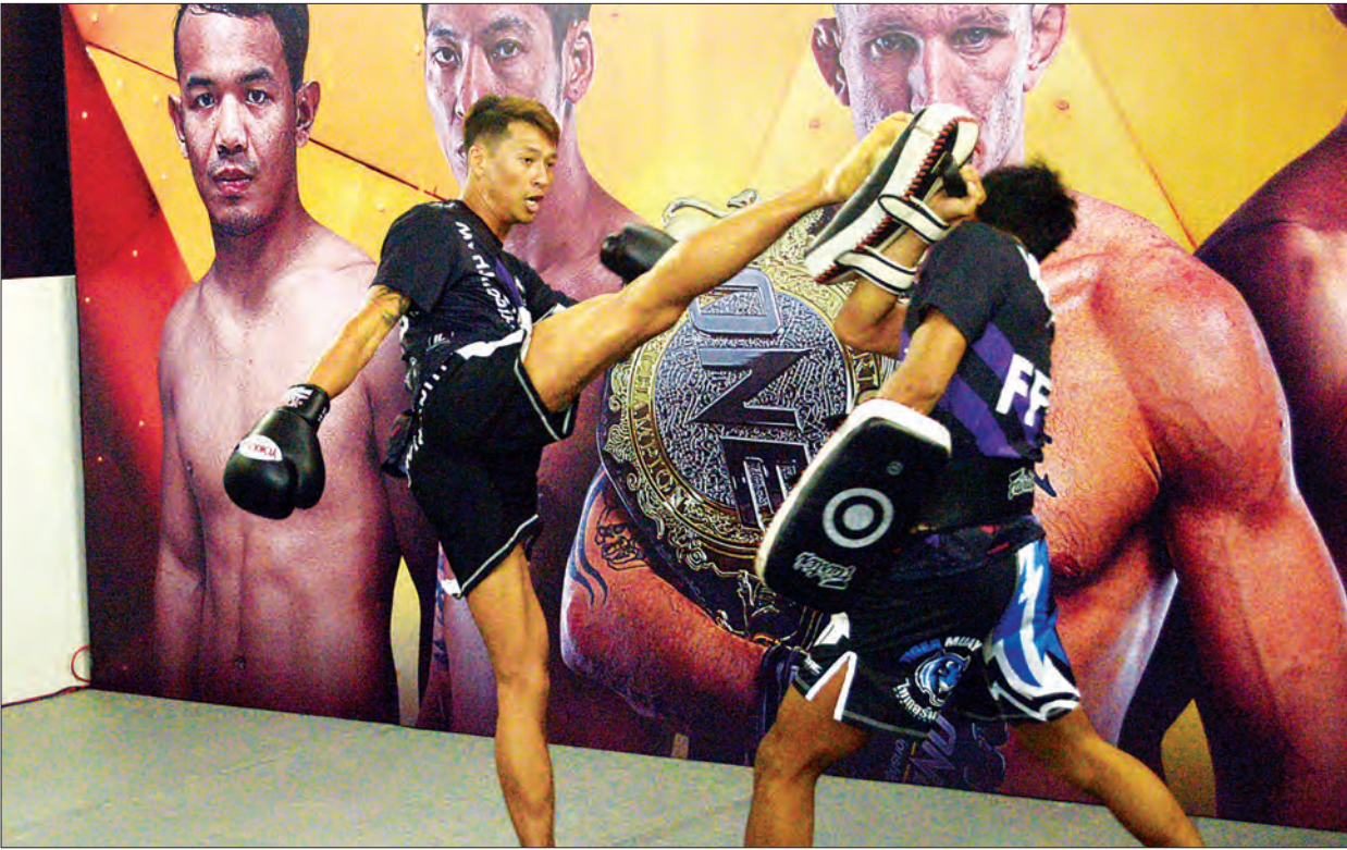
ဖယ်သာဝိတ်တန်းတွင် ယှဉ်ပြိုင်ထိုးသတ်မည့် ဖိုးသော် လေ့ကျင့်ပြင်ဆင်နေစဉ်။