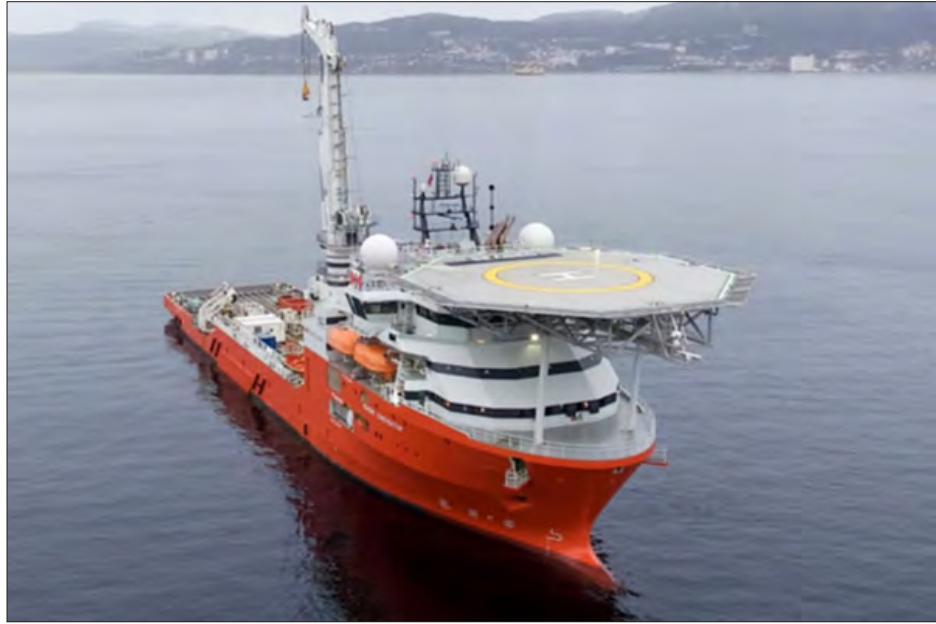
မလေးရှား လေကြောင်းလိုင်းမှ ပျောက်ဆုံးလေယာဉ်ကို ရှာဖွေမည့် အိုးရှန်းအင်ဖန်နတ်ကုမ္ပဏီ၏ သင်္ဘောတစ်စင်းကို တွေ့ရစဉ်။