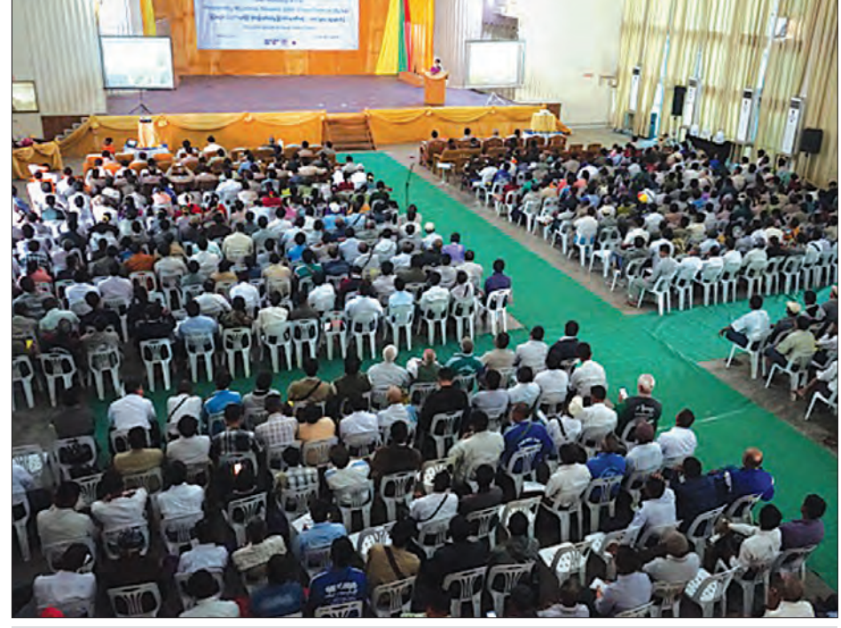
မြန်မာ့နှမ်း GAP စနစ်ဖြင့် စိုက်ပျိုးထုတ်လုပ်မှု မြှင့်တင်ရေး အလုပ်ရုံဆွေးနွေးပွဲ ကျင်းပနေစဉ်။

သို့မဟုတ် ပြည်တွင်း စားသုံးသူများအတွက် အန္တရာယ်ကင်းစေရန် ပြည်ပတင်ပို့ ရောင်းချရာတွင်လည်း ဈေးနှိမ်ခြင်း မခံရမှာဖြစ်ကြောင်း၊ ထို့ကြောင့် စိုက်ပျိုးရေးဆိုင်ရာ အလေ့အကျင့် ကောင်းများဖြစ်သည့် GAP စနစ်ဖြင့် သာ စိုက်ပျိုးသွားကြစေလိုကြောင်း၊ တောင်သူများလိုအပ်သည့် အရည် အသွေးပြည့်ဝသော သွင်းအားစုများကို ဈေးနှုန်းသက်သာသာနှင့် သီးနှံပေါ် ပေးအကြေးစနစ်ဖြင့် ရောင်းချပေးလျက် ရှိသော ကုမ္ပဏီများကိုလည်း ဖိတ်ခေါ် ထားသဖြင့် တောင်သူများက မိမိတို့ လိုအပ်သည့် သွင်းအားစုများကို စိတ်ကြိုက် ဝယ်ယူနိုင်ကြောင်း ရှင်းလင်း ပြောကြားသည်။