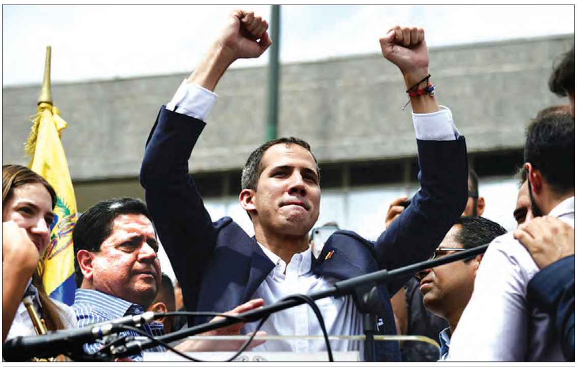
ပင်နီဇွဲလားသို့ ပြန်လည်ရောက်ရှိလာသည့် အတိုက်အခံခေါင်းဆောင် ဂျူအန်ဂွိုက်ဒိုကို တွေ့ရစဉ်။

ထောက်ခံသူကိုယ်စီရို ၎င်းတို့ကခြိမ်းခြောက်နေပေမယ့်လည်း ကျွန်ုပ်တို့ကတော့ အခုဒီကို ရောက်နေပြီ။ ကျွန်ုပ်တို့ရဲ့ မျက်နှာတွေကို ပင်နီဇွဲလားဆီ လာပြန်ပြန်လို့ ၎င်းက လူအုပ်ကြီးကို ပြောလိုက်ပါတယ်။ အတိုက်အခံအဖွဲ့ ဦးဆောင်တဲ့ အောက်လွှတ်တော်ဥက္ကဋ္ဌ မစ္စတာဂွိုက်ဒိုဟာ မိမိကိုယ်ကို ပင်နီဇွဲလားရဲ့ ယာယီသမ္မတအဖြစ် ကြေညာထားသူဖြစ်ပါတယ်။ ၂၀၁၈ ခုနှစ် မေလမှာ ပြန်လည်ရွေးကောက်ခံခဲ့ရတဲ့ သမ္မတမာဒူရိုဟာ တရားမဝင်ဘူးလို့ နိုင်ငံပေါင်း ၅၀ ကျော်က ယူဆထားပြီး အတိုက်အခံခေါင်းဆောင် ဂွိုက်ဒိုကိုထောက်ခံနေကြပေမယ့်လို့ သမ္မတမာဒူရိုကတော့ သူသာလျှင် တရားဝင်သမ္မတဖြစ်တယ်လို့ ငြင်းဆန်နေပြီး တရုတ်၊ ရုရှားနဲ့ ကျူးဘားရဲ့ ထောက်ခံမှုကို အခိုင်အမာရရှိထားပါတယ်။