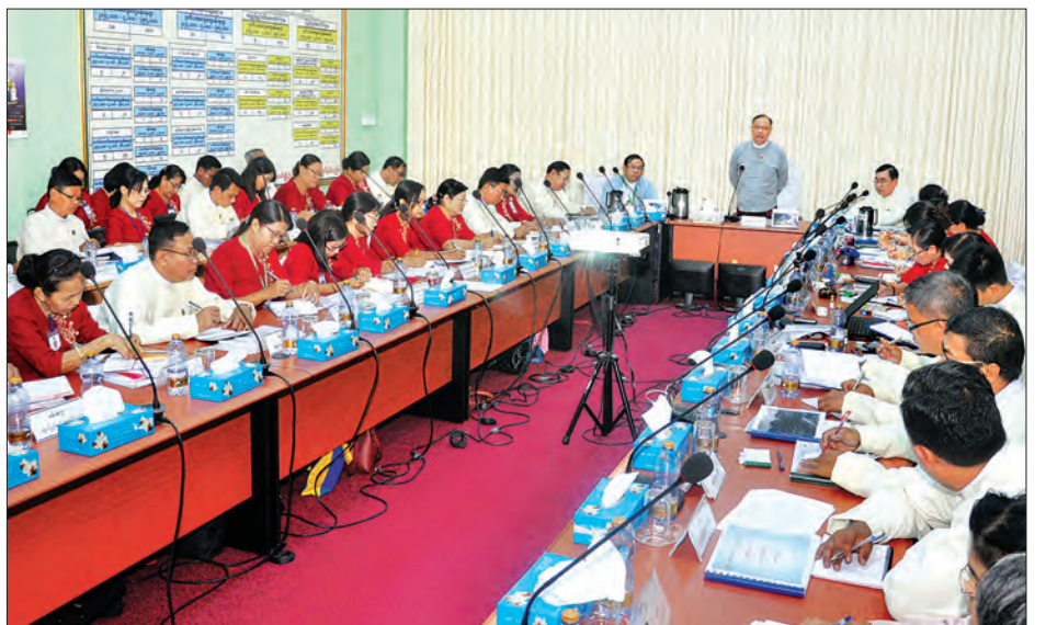
ကြရန် တိုက်တွန်းပြောကြားသည်။ အဆိုပါအစည်းအဝေးသို့ ပို့ဆောင်ရေးနှင့်ဆက်သွယ်ရေးဝန်ကြီးဌာန အမြဲ

အင်အားနှင့် ဆောင်ရွက်ခဲ့မှုများအပေါ် အသိအမှတ်ပြုပါကြောင်း၊ လုပ်ငန်းသစ်များကို တိုးချဲ့ဆောင်ရွက်နေသည့်အတွက် တရားရေးနှင့် တစ်နှစ်ထက်တစ်နှစ် ဝင်ငွေတိုးတက်လာပြီး အရုံးများလည်း တစ်နှစ်ထက်တစ်နှစ် လျော့ကျလာသည်ကို တွေ့ရှိရပါကြောင်း၊ ဝင်ငွေနှင့် အသုံးစရိတ်များကို စနစ်တကျ စိစစ်ဆောင်ရွက်ပြီး အကတိတရားကင်းရှင်းစွာ ဆောင်ရွက်သွားကြရန်နှင့် တိုးတက်သော နိုင်ငံများတွင် လူတစ်ဦးနှင့်တစ်ဦး တန်ဖိုးထားပြီး အလေးထားကြသည့်အခါ ပေးပို့လိုသည်များအတွက် စာတိုက်ကို အားကိုးအသုံးပြုလာကြပါကြောင်း၊ သို့ဖြစ်၍ မြန်မာ့စာတိုက်လုပ်ငန်းကို ပြည်သူများယုံကြည်မှုရှိစေရန်အတွက် ကြိုးစားဆောင်ရွက်