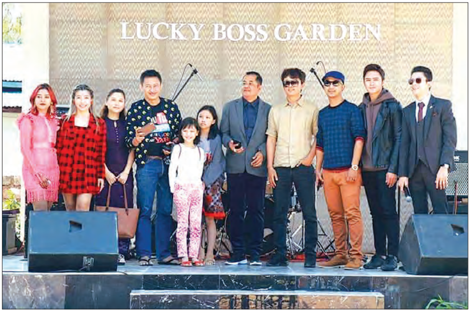
Lucky Boss အပန်းဖြေဥယျာဉ်ဖွင့်ပွဲသို့ တက်ရောက်လာသည့် အနုပညာရှင်များကို တွေ့ရစဉ်။

ကြီး ၁၈ ခုကွင်းကျေးရွာရှိ မြေဧက ၄၀ ကျယ်အဝန်းရှိသည့် မြှုပ်နှံအတွင်းတွင် တည်ဆောက်ထားသည့် အပန်းဖြေဥယျာဉ် ကြီးဖြစ်သည်။ မိသားစုအလိုက် အပန်းဖြေနားနေနိုင်မည့် နေရာများ၊ သစ်ခွနှင့် ပန်းမျိုးစုံ ဥယျာဉ်များအပြင် ဒေသန္တရ တောင်တန်း အလှအပများကို ခံစားကြည့်ရှုနိုင်မည့်နေရာများကို တွေ့မြင်နိုင်မည်ဖြစ်သည့်အပြင် ဒေသန္တရ အလှအပနှင့် လိုက်လျောညီထွေမည့် ငှက်ရုပ်များအပါအဝင် တိရစ္ဆာန်များ၏ အရုပ်များကိုလည်း မြင်တွေ့နိုင်မည်ဖြစ်သည်။ ထို့အပြင် အပန်းဖြေအနားယူသူများ အစားအသောက်များ ဝယ်ယူစားသောက်နိုင်ရန်အတွက် ရှမ်းစာနှင့် တရုတ်အစားအစာ စားသောက်ဆိုင်များကိုလည်း ဖွင့်လှစ်ပေးထားကြောင်း သိရသည်။ ဥယျာဉ်၏ဝင်ကြေးကို တစ်ဦးလျှင် ငွေကျပ် ၂၀၀၀ နှုန်း သတ်မှတ်ထားပြီး နေ့စဉ် နံနက် ၇ နာရီမှ ညနေ ၆ နာရီအထိ ဖွင့်လှစ်ထားရှိမည်ဖြစ်ကြောင်း သိရသည်။ ကိုလင်း