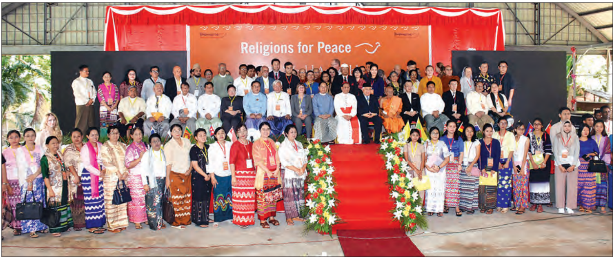
ပြည်ထောင်စုဝန်ကြီး သူရဦးအောင်ကို ဒသမအကြိမ်မြောက် ကမ္ဘာလုံးဆိုင်ရာ ဘာသာပေါင်းစုံ ငြိမ်းချမ်းရေးညီလာခံအကြို အာရှတိုက်ဒေသလုံးဆိုင်ရာ ဘာသာပေါင်းစုံ ညှိနှိုင်းအစည်းအဝေးဖွင့်ပွဲ အခမ်းအနားတွင် တက်ရောက်လာကြသူများနှင့်အတူ စုပေါင်းမှတ်တမ်းတင် ဓာတ်ပုံရိုက်စဉ်။

မြန်မာနိုင်ငံက အိမ်ရှင်နိုင်ငံအဖြစ် ကျင်းပသည့် ငြိမ်းချမ်းမေတ္တာအဖွဲ့ (RfP-Myanmar) က ကြီးပွား၍ ဒသမ အကြိမ်မြောက် ကမ္ဘာလုံးဆိုင်ရာ ဘာသာ ပေါင်းစုံ ငြိမ်းချမ်းရေးညီလာခံအကြို အာရှတိုက်ဒေသလုံးဆိုင်ရာ ဘာသာ ပေါင်းစုံညှိနှိုင်းအစည်းအဝေးဖွင့်ပွဲ အခမ်း အနားကို ယနေ့နံနက် ၉ နာရီက ရန်ကုန် မြို့ သိမ်ဖြူလမ်းရှိ စိန်မေရီကာသီဒြယ် ဘုရားကျောင်း၌ ကျင်းပသည်။