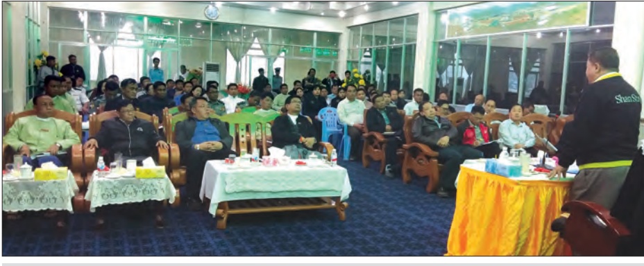
ပြည်နယ်ဝန်ကြီးချုပ် ဒေါက်တာလင်းထွဋ် (၁၀၅)မိုင်၌ ဌာနဆိုင်ရာတာဝန်ရှိသူများနှင့် တွေ့ဆုံစဉ်။

မူဆယ် မတ် ၅ ရှမ်းပြည်နယ်ဝန်ကြီးချုပ် ဒေါက်တာလင်းထွဋ် ဦးဆောင်သော ပြည်နယ်ဝန်ကြီးများနှင့် အဖွဲ့ဝင်များသည် မတ် ၄ ရက်က မူဆယ်မြို့နယ် မိုင်းယု (၁၀၅)မိုင် ကုန်သွယ်ရေးဇုန်သို့ရောက်ရှိခဲ့သည်။ အဆိုပါ ဝန်ကြီးချုပ်နှင့် အဖွဲ့ဝင်များအား တာဝန်ရှိသူများက ကြိုဆိုနှုတ်ဆက်ခဲ့ကြသည်။