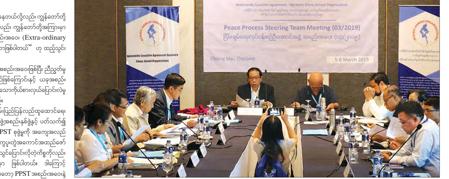
တစ်နိုင်ငံလုံး ပစ်ခတ်တိုက်ခိုက်မှုရပ်စဲရေး သဘောတူစာချုပ် (NCA) လက်မှတ်ရေးထိုးထားသည့် တိုင်းရင်းသားလက်နက်ကိုင်အဖွဲ့အစည်းများ၏ ငြိမ်းချမ်းရေးလုပ်ငန်းစဉ် ဦးဆောင်အဖွဲ့ (PPST) ၏ အစည်းအဝေးကျင်းပစဉ်။