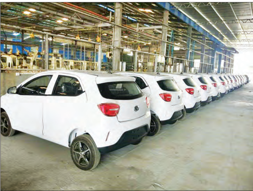
သာဓကန်စက်မှုဇုန်တွင် ထုတ်လုပ်ထားသော လျှပ်စစ်ကားများကို တွေ့ရစဉ်။

“ဒီလို လျှပ်စစ်ကားတွေကို မြန်မာနိုင်ငံအတွက် ပထမဆုံး ထုတ်လုပ်တင်သွင်းရတာဟာ တရုတ်နိုင်ငံက ဦးဆောင်ပြီး အကောင်အထည်ဖော်နေတဲ့ ရပ်ဝန်းနှင့် ပူးလမ်းမစီမံကိန်းအတိုင်း ကျွန်တော်တို့ရဲ့ ရင်းနှီးမြှုပ်နှံမှုကို တရုတ်-မြန်မာ နှစ်နိုင်ငံချစ်ကြည်ရင်းနှီးမှု ပိုမိုခိုင်မာစေဖို့ အဓိကရည်ရွယ်ပါတယ်။ ဒီကားတွေ တင်သွင်းမှုအတွက် တရုတ်အစိုးရက အခွန်မယူပါဘူး။ မြန်မာနိုင်ငံသားတွေ ဈေးဝေါပေါနဲ့ ဝယ်ယူအသုံးပြုနိုင်အောင် ဆောင်ရွက်ပေးသွားမှာပါ။ အရစ်ကျစနစ်နဲ့လည်း ဆောင်ရွက်ပေးနိုင်ဖို့ အစီအစဉ်ရှိပါတယ်။”