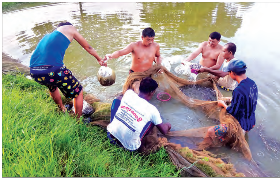
ကန်အတွင်း မွေးမြူထားသော ငါးများကို မျိုးပွားရန်အတွက် ရွေးချယ်နေမှုကို တွေ့ရစဉ်။

မြန်မာနိုင်ငံအတွင်း ငါးသယ်ဇာတများ မပပျောက်စေအောင် ထိန်းသိမ်းစောင့်ရှောက်သည့်အနေဖြင့်လည်းကောင်း၊ ပြည်သူများ ဈေးနှုန်းချိုသာစွာ ဝယ်ယူစားသုံးနိုင်စေရေးအတွက် မွန်ပြည်နယ် စိုက်ပျိုးရေး၊ မွေးမြူရေးနှင့် ဆည်မြောင်းဦးစီးဌာန၏ ငါးလုပ်ငန်းဦးစီးဌာန ငါးလုပ်ငန်းစခန်း(သထုံ) ငါးလုပ်ငန်းသင်တန်းကျောင်းတွင် ကျန်းမာသန်စွမ်းသော မျိုးကောင်းမျိုးသန်ငါးမျိုးများကို ခေတ်နှင့်အညီ တိုးတက်လာသော လူဦးရေနှင့် စားနပ်ရိက္ခာအတွက် အချိုးကျသဟဇာတဖြစ်အောင် သဘာဝအတိုင်း ငါးသားဖောက်ခြင်း၊ ငါးဆေးထိုးသားဖောက်ခြင်းလုပ်ငန်းများကို ဆောင်ရွက်၍ ငါးသားပေါက်များအား ငါးမွေးမြူရေးလုပ်ငန်းရှင်များ လက်ဝယ်သို့ သက်သာသော ဈေးနှုန်းဖြင့် ရောင်းချဖြန့်ဖြူးပေးနိုင်ရန် ငါးသားပေါက်များကို တိုးမြှင့် ထုတ်လုပ်နေကြောင်း သိရသည်။