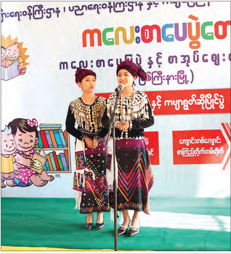
ကလေးစာပေပွဲတော်(မြစ်ကြီးနား)တွင် ဂျိန်းဇောဘာသာဖြင့် ပုံပြောပြိုင်ပွဲ ယှဉ်ပြိုင်နေမှုကို တွေ့ရစဉ်။

ပွဲတော်၌ ပျော်ရွှင်စွာဆင်နွှဲရင်း စုပေါင်းအလုပ်များ တွင် ဝိုင်းဝန်းပါဝင်တတ်သည့် အလေ့အထကောင်း များ ရရှိလာစေရန်၊ ပညာပေးပို့ပေးရန်အတွက် လူရည် လူသွေးပါပြည့်ဝ၍ အနာဂတ်တွင် တိုင်းပြည် အတွက် ဦးဆောင်ဦးရွက်ပြုနိုင်သူများ ဖြစ်လာ စေရန် ရည်ရွယ်ချက်များဖြင့် ကလေးစာပေ ပွဲတော်များကို ၂၀၁၆ ခုနှစ်မှစ၍ နိုင်ငံအနှံ့တွင် ကျင်းပပေးလျက်ရှိသည်။ အသိပညာနှင့် စိတ်နှလုံးအပန်းဖြေရန် ကလေးစာပေပွဲတော်များတွင် ကလေးများ စာပေနှင့် ထိတွေ့မှုရှိစေရန် ကဗျာရွတ်ဆိုပြိုင်ပွဲ၊ ပုံပြောပြိုင်ပွဲ၊ ကျန်းမာရေးပြောပြိုင်ပွဲများ၊ ဉာဏ်ရည်ထက်မြက်စေသည့် စက္ကူခေါက်၊ ဆေးရောင်ခြယ်၊ အရုပ်ဆက်၊ စကားပုံဆက် ကစားနည်းများ၊ အများနှင့် ပူးပေါင်းဆောင်ရွက် တတ်စေမည့် Team Building ဂိမ်းများ ထည့်သွင်း ကျင်းပလျက်ရှိသည်။ စာပေနှင့်နီးစပ်မှု