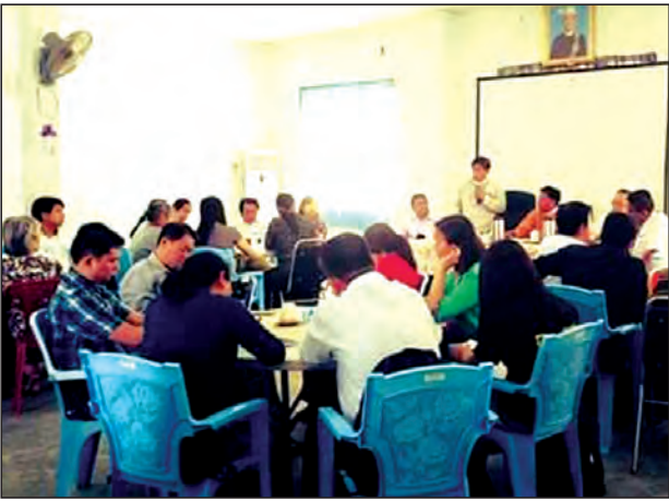
ကမ္ဘာတီဘီတိုက်ဖျက်ရေးနေ့ လုပ်ငန်းညှိနှိုင်းအစည်းအဝေးပြုလုပ်စဉ်။

တီဘီရောဂါသည်လေမှတစ်ဆင့် ကူးစက်တတ်သောကြောင့် အများပြည်သူစီးနင်း သော ခရီးသွားယာဉ်များပေါ်ပါမကျန် ရန်ကုန်တိုင်းဒေသကြီးကျန်းမာရေး ဦးစီးဌာနမှ အသိပညာပေးဆောင်ရွက်ခြင်း၊ စစ်တမ်းကောက်ယူခြင်းတို့ ဆောင်ရွက်ခဲ့ပြီး ကုန်ကျ စရိတ်မရှိသော ဝန်ဆောင်မှုဖြင့်ပြည်သူ့ကျန်းမာရေး ဦးစီးဌာနမှ ဆောင်ရွက်လျက် ရှိသည့်တိုင် လာရောက်ကုသရန်လိုအပ်နေဆဲဖြစ်သည်။ ဆေးအခဲရရှိသော ဆေးရုံ၊ ဆေးခန်းသို့ မလာသောကြောင့် လူနာရှိရာ စက်ရုံ၊ အလုပ်ရုံ၊ ရပ်ကွက်ကျေးရွာများသို့ ရွေ့လျားကုသသောဝန်ဆောင်မှုဖြင့် ကွင်းဆင်းဆောင်ရွက်သည့်တိုင် ကျန်ရှိနေဆဲ ဖြစ်ရာ တီဘီရောဂါကိုပြည်သူများ ပိုမိုသိရှိနားလည်လာစေရန် ပထမဆုံးအကြိမ်အဖြစ်