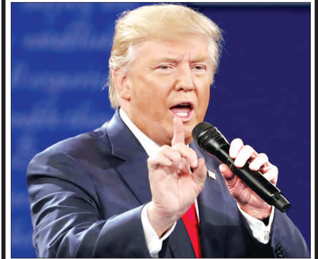
အမေရိကန်သမ္မတ ဒေါ်နယ်ထရမ်