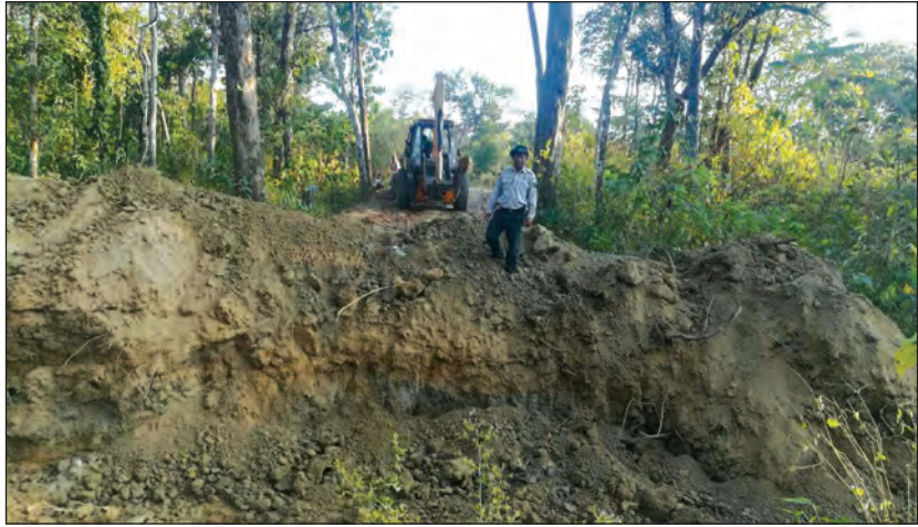
သစ်ခိုးထုတ်သည့်လမ်းများကို လိုက်လံဖျက်ဆီးနေစဉ်။

မော်လိုက် မတ် ၅ ဦးစီးဌာနမှ သစ်ခိုးထုတ်မှုများအား ကြိုတင်တားဆီး စစ်ကိုင်းတိုင်းဒေသကြီး မော်လိုက်မြို့နယ် သစ်တော ခြင်းအနေဖြင့် မော်လိုက်မြို့နယ် ဖုန်းသုန်းကြီးဝိုင်း ၁၄၂