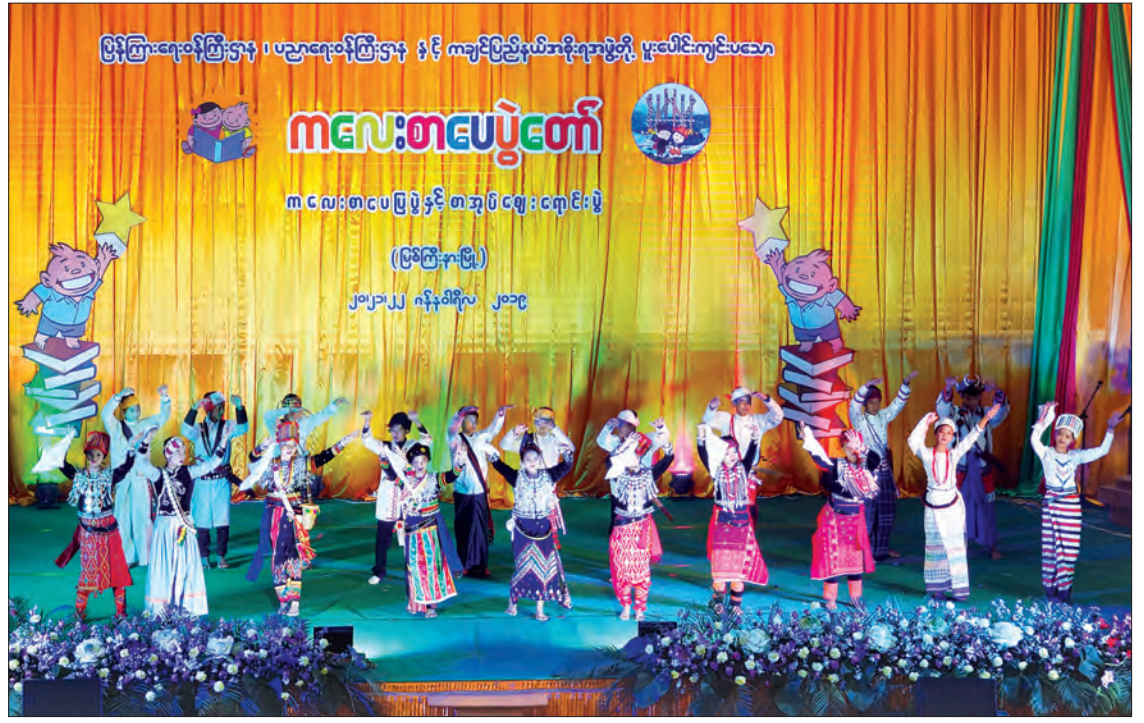
ကလေးစာပေပွဲတော်(မြစ်ကြီးနား)တွင် တိုင်းရင်းသား တိုင်းရင်းသူများက စုပေါင်းအကဖြင့် ဖျော်ဖြေနေမှုကို တွေ့ရစဉ်။

ရှိစေရန် စာအုပ်ပြခန်း၊ ကလေးစာဖတ်ခန်းနမူနာ၊ စာအုပ်အရောင်းဆိုင်များ၊ စာပေဟောပြောပွဲ၊ ဆွေးနွေးပွဲများကိုလည်း ကျင်းပပေးလျက်ရှိသည်။ ထို့ပြင် အသိပညာပေးပို့ပေးရန်အတွက် ပြခန်းများပါရှိသကဲ့သို့ စိတ်နှလုံးအပန်းဖြေရန်နှင့် ပျော်ရွှင်မှု ရရှိနိုင်မည့် ဖျော်ဖြေရေးအစီအစဉ်များ ကိုလည်း ထည့်သွင်းကျင်းပပေးလျက်ရှိသည်။ ထိုကဲ့သို့ ကလေးစာပေပွဲတော်များ ကျင်းပ ခဲ့မှုအနက် ကချင်ပြည်နယ် မြစ်ကြီးနားတက္ကသိုလ် တွင် ကျင်းပခဲ့သည့် ကလေးစာပေပွဲတော်သည် ထူးခြားသည်ဟု ဆိုရပါမည်။ ကလေးစာပေပွဲတော် (မြစ်ကြီးနား) ဖွဲ့စည်းအခမ်းအနားကို မြစ်ကြီးနား တက္ကသိုလ် ဘွဲ့နှင်းသဘင်ခန်းမကြီး၌ ကျင်းပရာ မနောမြေမှတေးသံသာ၊ အိုဝမ် ကချင်ရိုးရာသီချင်း၊ ရှမ်းရိုးရာအက၊ ရဝမ်ရိုးရာအက၊ လီဆူရိုးရာအက၊ တိုင်းလုံရိုးရာအကများဖြင့် စတင်ဖွင့်လှစ်ခဲ့ကြပြီး ပွဲတော်ကျင်းပသည့် သုံးရက်လုံးတွင်လည်း ကျောင်းသား ကျောင်းသူလေးများ၏ ဖျော်ဖြေမှု များနှင့်အတူ တိုင်းရင်းသားရိုးရာ အကအလှများ ပါဝင်ကပြဖျော်ဖြေခဲ့ကြသည်။ ဘွဲ့နှင်းသဘင် ခန်းမရှေ့ရှိ ဖျော်ဖြေရေးစင်မြင့်၌လည်း လီဆူ၊