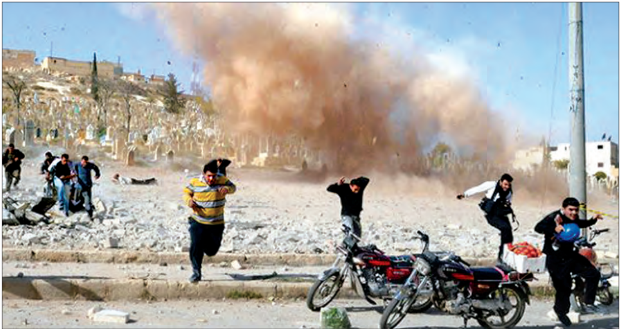
ဆီးရီးယားနိုင်ငံတွင် တိုက်ပွဲများပြင်းထန်လျက်ရှိသည်ကို တွေ့ရစဉ်။

အိုင်အက်စ်အေအဖွဲ့၏ နောက်ဆုံးခြေကုပ်ယူရာနေရာဖြစ်သည့် Baghuz တွင်ညွှန်ပေါင်းတပ်ဖွဲ့များ၏ လွန်ခဲ့သည့် နှစ်ရက်တာအတွင်း လေကြောင်းတိုက်