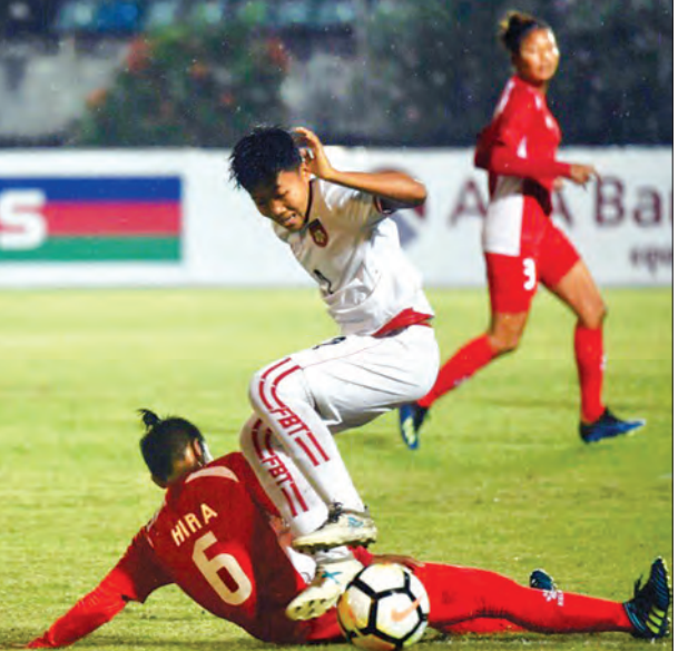
ပွဲဦးထွက်ယှဉ်ပြိုင်ရမည့် မြန်မာနှင့် နီပေါအသင်း ပထမအဆင့်ခြေစစ်ပွဲတွင် တွေ့ဆုံခဲ့စဉ်။

ရန်ကုန် မတ် ၅ ၂၀၁၉ ဂျပန်-အာဆီယံ ယူ-၁၉ အမျိုးသမီးဘောလုံးပြိုင်ပွဲ အုပ်စု စတုတ္ထနေ့ကို ယနေ့နံနက်ပိုင်းက ဂျပန်နိုင်ငံ၌ ဆက်လက်ကျင်းပရာ မြန်မာနှင့် ထိုင်းအသင်း ဝိုင်းမရိုသရေကျခဲ့သည်။ မြန်မာ ယူ-၁၉ အမျိုးသမီးအသင်းသည် နိုင်ပွဲဆက်ရန် ကြိုးပမ်းခဲ့သော်လည်း သရေရလဒ်ဖြင့် ကျေနပ်ခဲ့ရသည်။ အာဆီယံဒေသတွင်း အသင်းနှစ်သင်း တွေ့ဆုံသောကြောင့် ပွဲမှာအပြန်အလှန်ရှိခဲ့ပြီး ဝိုင်းသွင်းခွင့်များ အသုံးမချနိုင်၍ သရေကျခဲ့ခြင်း ဖြစ်သည်။ မြန်မာ ယူ-၁၉ အမျိုးသမီးအသင်းသည် ယင်းပြိုင်ပွဲတွင် ပွဲအားလုံးယှဉ်ပြိုင်ပြီးစီးသွားပြီး လေးပွဲကစား တစ်ပွဲနိုင်၊ သုံးပွဲသရေ ခြောက်ပွဲမရရှိခဲ့ပါ။ မြန်မာအသင်းသည် ဂျပန်ကလပ် အိုကီနာဝါ ယူ-၁၉ အသင်းကို ငါးဂိုး-နှစ်ဂိုးဖြင့် အနိုင်ရပြီး ဝီယက်နမ်နှင့် ဝိုင်းမရိုသရေ ဂျပန်နှင့် တစ်ဂိုးစီသရေ၊ ထိုင်းနှင့် ဝိုင်းမရိုသရေကျခဲ့ခြင်းဖြစ်သည်။ အုပ်စုပွဲများမှာမူ မတ် ၆ ရက် (ယနေ့) မှ ပြီးဆုံးမည်ဖြစ်ပြီး မြန်မာအသင်းသည် အုပ်စုလေးပွဲကို ရက်ဆက်ကစားခဲ့ခြင်းဖြစ်သည်။ ရဲရင့်ရှိုင်း