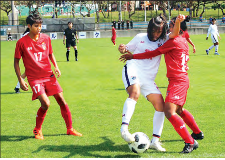
မြန်မာနှင့် ထိုင်းအသင်း ယှဉ်ပြိုင်နေစဉ်။

ရန်ကုန် မတ် ၅ ၂၀၁၉ ဂျပန်-အာဆီယံ ယူ-၁၉ အမျိုးသမီးဘောလုံးပြိုင်ပွဲ အုပ်စု စတုတ္ထနေ့ကို ယနေ့နံနက်ပိုင်းက ဂျပန်နိုင်ငံ၌ ဆက်လက်ကျင်းပရာ မြန်မာနှင့် ထိုင်းအသင်း ဝိုင်းမရိုသရေကျခဲ့သည်။ မြန်မာ ယူ-၁၉ အမျိုးသမီးအသင်းသည် နိုင်ပွဲဆက်ရန် ကြိုးပမ်းခဲ့သော်လည်း သရေရလဒ်ဖြင့် ကျေနပ်ခဲ့ရသည်။ အာဆီယံဒေသတွင်း အသင်းနှစ်သင်း တွေ့ဆုံသောကြောင့် ပွဲမှာအပြန်အလှန်ရှိခဲ့ပြီး ဝိုင်းသွင်းခွင့်များ အသုံးမချနိုင်၍ သရေကျခဲ့ခြင်း ဖြစ်သည်။ မြန်မာ ယူ-၁၉ အမျိုးသမီးအသင်းသည် ယင်းပြိုင်ပွဲတွင် ပွဲအားလုံးယှဉ်ပြိုင်ပြီးစီးသွားပြီး လေးပွဲကစား တစ်ပွဲနိုင်၊ သုံးပွဲသရေ ခြောက်ပွဲမရရှိခဲ့ပါ။ မြန်မာအသင်းသည် ဂျပန်ကလပ် အိုကီနာဝါ ယူ-၁၉ အသင်းကို ငါးဂိုး-နှစ်ဂိုးဖြင့် အနိုင်ရပြီး ဝီယက်နမ်နှင့် ဝိုင်းမရိုသရေ ဂျပန်နှင့် တစ်ဂိုးစီသရေ၊ ထိုင်းနှင့် ဝိုင်းမရိုသရေကျခဲ့ခြင်းဖြစ်သည်။ အုပ်စုပွဲများမှာမူ မတ် ၆ ရက် (ယနေ့) မှ ပြီးဆုံးမည်ဖြစ်ပြီး မြန်မာအသင်းသည် အုပ်စုလေးပွဲကို ရက်ဆက်ကစားခဲ့ခြင်းဖြစ်သည်။ ရဲရင့်ရှိုင်း