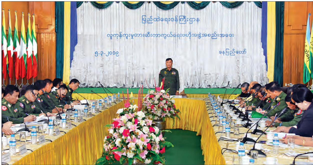
ပြည်ထောင်စုဝန်ကြီး ဒုတိယဗိုလ်ချုပ်ကြီး ကျော်ဆွေ လူကုန်ကူးမှုတားဆီးကာကွယ်ရေးပဟိုအဖွဲ့ အစည်းအဝေးတွင် အမှာစကား ပြောကြားစဉ်။