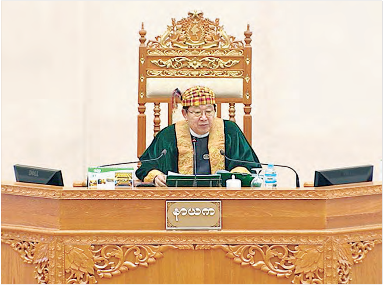
ပြည်ထောင်စုလွှတ်တော် နာယက ဦးတီခွန်မြတ်