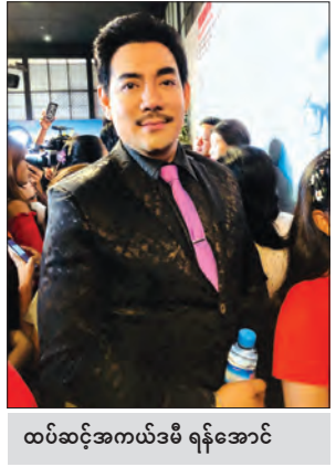
ထပ်ဆင့်အကယ်ဒမီ ရန်အောင်

ရွေးချယ်ရပိုမို ခက်ခဲကြောင်း သိရသည်။ “ဒီနှစ်က တော်တော်လေးကို ကားကောင်းတွေများတယ်။ ဘာလို့လဲဆိုတော့ လူငယ်သရုပ်ဆောင်သစ်တွေ လူငယ်ဒါရိုက်တာတွေက အလွန်ကို တော်ပြီး ကြိုးစားထားတာကို ကျွန်တော် ကြည့်ရတယ်။ တွေ့ရတယ်။ ဇော်စိတို့ ရိုက်တဲ့ “ဥပယ်တံမျဉ်” လိုကားမျိုးတွေ၊ နောက်ပြီး “ဒီ” ဇာတ်ကားဆိုလည်း ဒီလိုပဲ ကြည့်ရတာ တော်တော်ကို အရည်အချင်းပြည့်ဝတဲ့ ကားမျိုးတွေပါပဲ။ နောက်ပြီး ဟာသအနေနဲ့ဆို “ကိုယ်စောင့်နတ်” ကားဆို ပေါ့ပေါ့ပါးပါးနဲ့ ပရိသတ်ကို အများကြီး အကျိုးရှိစေတဲ့ ပညာပေး ဟာသကားလေးတွေပါ။ ပြီးတော့ မြို့ပြမုဆိုးများ ဇာတ်ကားဆိုလည်း တော်တော်လေး ကောင်းပါတယ်။ ဒီနှစ်က တော်တော်လေးကို ရွေးရခက်တဲ့နှစ်လို့ လူကြီးတွေကလည်း ပြောပါတယ်။ တချို့ အကဲဖြတ်တွေဆို ခေါင်းတွေတောင်ခြောက်ပြီး ထွက်ပြေးချင်စိတ်တွေပါ ပေါက်တယ်။ ကျွန်တော်တို့ကတော့ အကောင်းဆုံး စံနှုန်းတွေနဲ့ပဲ ရွေးရပါတယ်။ ဘယ်နေရာမှာ ဘာလို့