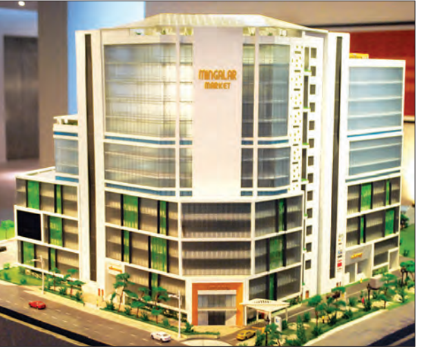
မင်္ဂလာဈေး အဆောက်အအုံပုံစံငယ်ကို တွေ့ရစဉ်။

ရန်ကုန်မြို့ ဈေးများ ဖွံ့ဖြိုးတိုးတက်ရေးအတွက် စစ်ဆေးရေးအရာရှိ ထားရှိဆောင်ရွက်သင့်သည်။ ဈေးများသာမက ရန်ကုန်မြို့တော် ဖွံ့ဖြိုးရေးလုပ်ငန်းအရပ်ရပ်ကို စစ်ဆေးရေးအရာရှိများ ထားရှိသင့်သည်။ ပြည်ထောင်စုအစိုးရမှ လုပ်ကိုင်ဆောင်ရွက်နေသော ဖွံ့ဖြိုးရေးလုပ်ငန်းများ၊ တိုင်းဒေသကြီးအစိုးရမှ လုပ်ကိုင်လျက်ရှိသော ပြည်သူ့အကျိုးပြုလုပ်ငန်းများတွင် ကိုယ်ကျင့်တရားကောင်းမွန်သော စစ်ဆေးရေးအရာရှိများ ထားရှိဆောင်ရွက်ပါက ရန်ကုန်မြို့ပြ၏ ဖွံ့ဖြိုးမှုသည် အားအင်အပြည့် အရှိန်အဟုန်ကောင်းစွာဖြင့် လုပ်ငန်းများ လည်ပတ်လာမည် ဖြစ်ပေသည်။