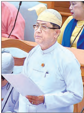
ဒုတိယဝန်ကြီး ဦးမောင်မောင်ဝင်း