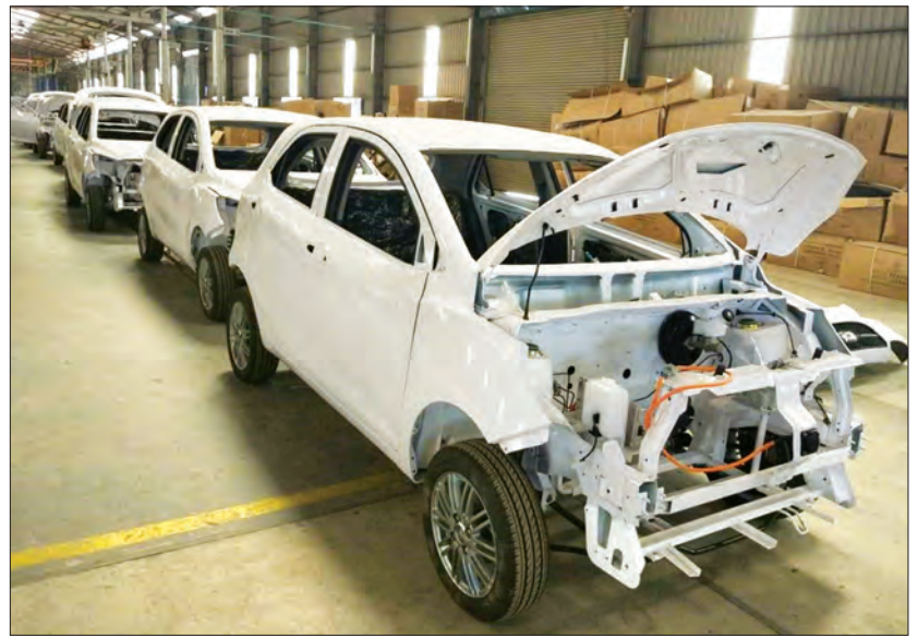
ထုတ်လုပ်နေဆဲ လျှပ်စစ်ကားများကို တွေ့ရစဉ်။

ယင်းလျှပ်စစ်ကားများကို ရန်ကုန်တိုင်းဒေသကြီး ရွှေပြည်သာမြို့နယ် သာဓကန် စက်မှုဇုန် အပိုင်း(၃/၄) အမှတ် ၇၉/၈၀ တွင် မြန်မာနိုင်ငံစက်ရုံအဖြစ် တည်ကာ ထုတ်လုပ်သွားမည်ဖြစ်သည်။ ထိုကားစက်ရုံကြီး တည်ဆောက်ထုတ်လုပ်သွားမည့်အပေါ် ပြည်တွင်းအလုပ်အကိုင်အခွင့်အလမ်းများ ရရှိစေကာ ကားထုတ်လုပ်မှုနှင့် ပတ်သက်သည့် နည်းပညာကျွမ်းကျင်ဝန်ထမ်းများ မွေးထုတ်ပေးနိုင်တော့မည် ဖြစ်ကြောင်း သိရသည်။ ထို New Energy Car (Hybrid) လျှပ်စစ် (ဘက်ထရီ)ကားများ မြန်မာနိုင်ငံတွင် စတင်ထုတ်လုပ်မှုသည်လည်း ပထမဆုံးဖြစ်ကြောင်း သိရသည်။