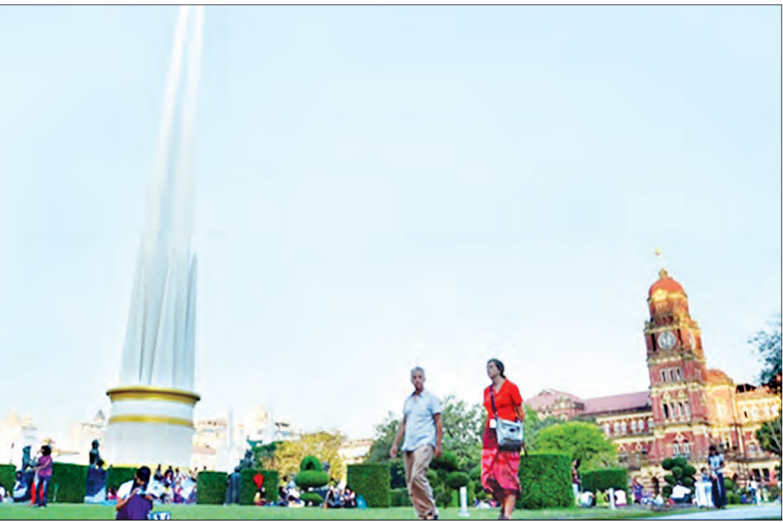
ရန်ကုန်မြို့၊ မဟာဝန္တလုပ်ငန်းခြံ၌ လာရောက်အပန်းဖြေသူများအား တွေ့ရစဉ်။

ဒီလိုဆောင်ရွက်တဲ့အခါ မြို့နယ်အုပ်ချုပ်ရေးမှ တာဝန်ရှိသူတွေ၊ အစိုးရနဲ့ အရပ်ဘက်လူမှုအဖွဲ့ အစည်းတွေ စုပေါင်းပြီး လူထုလှုပ်ရှားမှု သတ္တန် အဖြစ် ဖော်ဆောင်မှုတွေကိုလည်း ပြုလုပ်လျက် ရှိပါတယ်။ ၂၀၁၉ ခုနှစ် ဇန်နဝါရီ ၆ ရက်က ကျောက်တံတားမြို့နယ် မဟာဝန္တလုပ်ငန်းခြံမှာ ကျောက်တံတားမြို့နယ် ဆေးလိပ်ငွေ့ကင်းစင် ရေး လူထုလှုပ်ရှားမှု ပြုလုပ်ခဲ့ပါတယ်။ အသိ ပညာပေးမှုတွေကတစ်ဆင့် ပြည်သူများ အကြား ဆေးလိပ်မသောက်ရေးအသိ ပိုမို ကျယ်ပြန့်စွာ စိမ့်ဝင်ရောက်ရှိနိုင်ရေးလည်း ဆောင်ရွက်နေတာမို့ ထိရောက်တဲ့ နည်းလမ်းတွေပဲ ဖြစ်ပါတယ်။