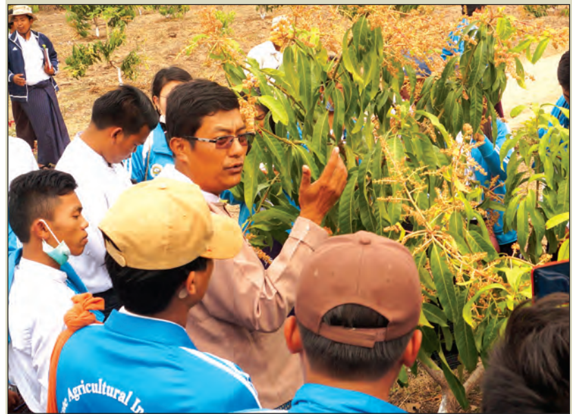
အော်ဂဲနစ် သရက်စိုက်ပျိုးထုတ်လုပ်မှုတိုးတက်ရေး ကွင်းဆင်းကြည့်ရှုစဉ်။

ချက်ရေးဆွဲ၍ သီးနှံ ၁၅ မျိုးအထိ အကောင်အထည် ဖော်ဆောင်ရွက်နေပြီဖြစ်သည်။ အဆိုပါ သီးနှံများထဲမှ သရက်သီးနှံသည် ပထမဆုံး GAP အသိအမှတ်ပြု လက်မှတ်ရရှိသည့်သီးနှံဖြစ်ကြောင်း သိရသည်။ GAP ဆိုသည်မှာ စိုက်ပျိုးရေးဆိုင်ရာအလေ့အကျင့်ကောင်းများ ဖြစ်ပြီး စတင်မြေပြုပြင်စိုက်ပျိုးထုတ်လုပ်သည့်မှ စားသုံးသူလက်ဝယ်ရောက်သည်အထိ အဆင့်ဆင့်တိုင်းတွင် စားသုံးသူအတွက် ဘေးအန္တရာယ်ဖြစ်စေသည့် ကူးစက်ညစ်ညမ်းမှုများကို အနည်းဆုံးဖြစ်စေရန် လိုက်နာရသည့်နည်းလမ်းများကို စုစည်းထားသည့် စံသတ်မှတ်ချက်များဖြစ်သည်။