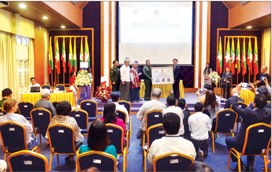
ကိုရီးယားနိုင်ငံ သံအမတ်ကြီးက JMC-U ဥက္ကဋ္ဌနှင့် အဖွဲ့ဝင်များထံ မြန်မာနိုင်ငံ၏ ငြိမ်းချမ်းရေးလုပ်ငန်းစဉ်ကို အားပေးထောက်ခံသည့်အနေဖြင့် လှူဒါန်းထားသော အထောက်အကူပစ္စည်းများအား လွှဲပြောင်းပေးအပ်စဉ်။

ငြိမ်းချမ်းရေးလုပ်ငန်းစဉ်အတွက် အားပေး အခမ်းအနားတွင် ကိုရီးယားသမ္မတနိုင်ငံ သံအမတ်ကြီး H.E. Mr. Lee Sang-hwa က လှူဒါန်းခြင်းရည်ရွယ်ချက်နှင့် ပတ်သက်၍ ကိုရီးယားနိုင်ငံနှင့် မြန်မာနိုင်ငံသည် များစွာသော ရင်းနှီးမှုများ ရှိကြပါကြောင်း၊ သမိုင်းအရသော်လည်းကောင်း၊ စိတ်ပိုင်းဆိုင်ရာအရသော်လည်းကောင်း တူညီနေပါကြောင်း၊ ယနေ့လှူဒါန်း ထားသောပစ္စည်းများသည် မြန်မာနိုင်ငံ ငြိမ်းချမ်းရေးလုပ်ငန်းစဉ်အတွက် ကိုရီးယားနိုင်ငံ၏ အားပေးမှုကို ပြသနေခြင်းဖြစ်ပါကြောင်း ထည့်သွင်းပြောကြားခဲ့သည်။