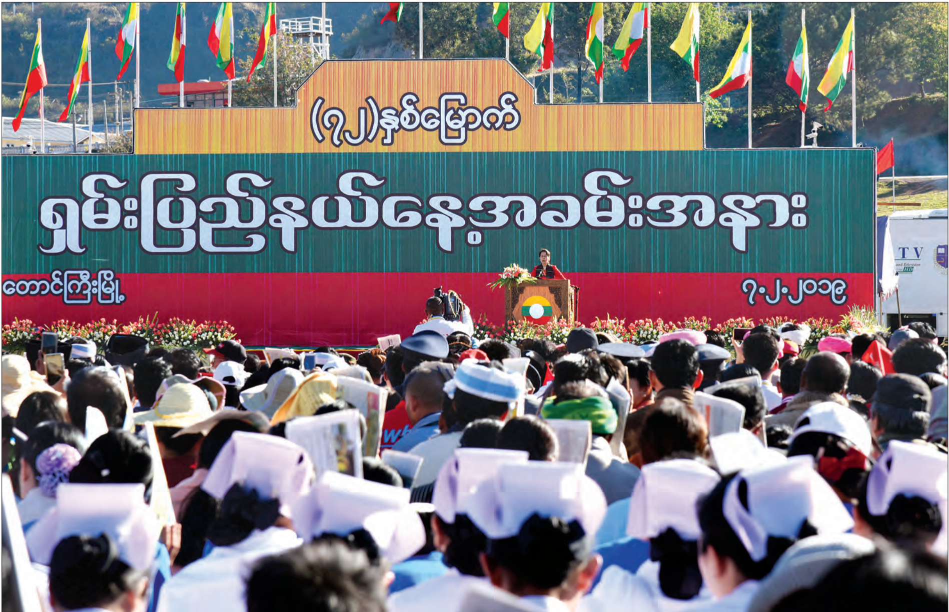
နယ်စပ်ဒေသနှင့် တိုင်းရင်းသားလူမျိုးများ ဖွံ့ဖြိုးတိုးတက်ရေးပဟိကော်မတီဥက္ကဋ္ဌ နိုင်ငံတော်၏အတိုင်ပင်ခံပုဂ္ဂိုလ် ဒေါ်အောင်ဆန်းစုကြည် (၇၂)နှစ်မြောက် ရှမ်းပြည်နယ်နေ့အခမ်းအနားတွင် အမှာစကားပြောကြားစဉ်။ သတင်းစဉ်

၁၃၈၀ ပြည့်နှစ်၊ တပို့တွဲလဆန်း ၄ ရက် ၂၀၁၉ ခုနှစ်၊ ဖေဖော်ဝါရီ ၈ ရက်၊ သောကြာနေ့ အတွဲ (၅၈)၊ အမှတ် (၁၃၁)