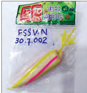
မြမြ ရောင်စုံသကြားလုံး