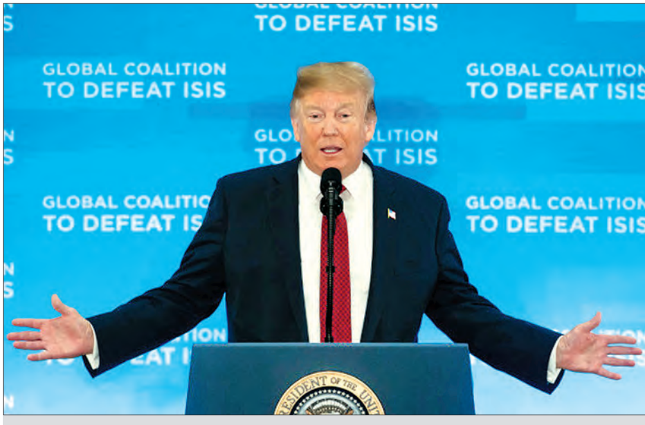
အိုင်အက်စ်အဖွဲ့အား တိုက်ခိုက်ချေမှုန်းရေးကမ္ဘာ့မဟာမိတ်နိုင်ငံခြားရေးဝန်ကြီးများအစည်းအဝေးတွင် အမေရိကန်သမ္မတ ဒေါ်နယ် ထရမ် မိန့်ခွန်းပြောကြားနေစဉ်။