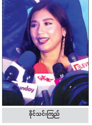
ခိုင်သင်းကြည်