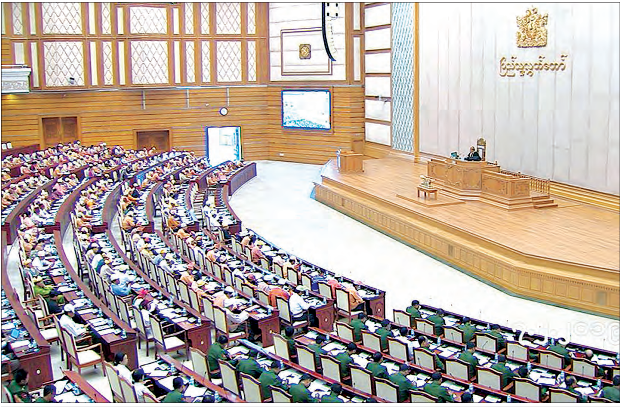
ဒုတိယအကြိမ် ပြည်သူ့လွှတ်တော်(၁၁)ကြိမ်မြောက် ပုံမှန်အစည်းအဝေး နဝမနေ့ ကျင်းပစဉ်။