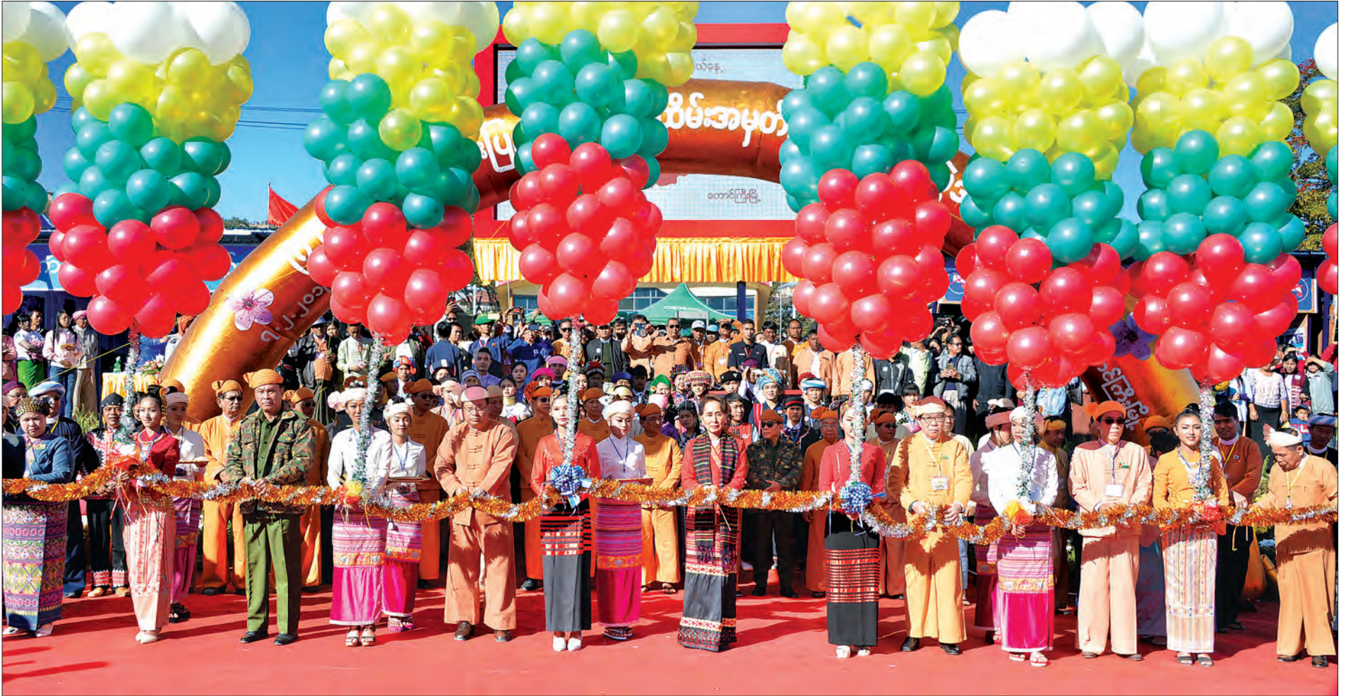
နိုင်ငံတော်၏အတိုင်ပင်ခံပုဂ္ဂိုလ် ဒေါ်အောင်ဆန်းစုကြည်၊ ပြည်ထောင်စုဝန်ကြီး ဒုတိယဗိုလ်ချုပ်ကြီး ကျော်ဆွေ၊ ပြည်နယ်ဝန်ကြီးချုပ် ဒေါက်တာလင်းထွဋ်နှင့် တာဝန်ရှိသူများက (၇၂)နှစ်မြောက် ရှမ်းပြည်နယ်နေအိမ်အမှတ်တိုင်တော်ကို ဝိုင်းရင်းသားရိုးရာယဉ်ကျေးမှု ပြခန်းများနှင့် ဌာနဆိုင်ရာပြခန်းများကို ဖွဲ့စည်းဖြတ်ဖြူခွင့်လှစ်ပေးစဉ်။

◆ ရှေ့မှ သဝဏ်လွှာကို ရှမ်းပြည်နယ်ဝန်ကြီးချုပ် ဒေါက်တာလင်းထွဋ်က ဖတ်ကြားသည်။