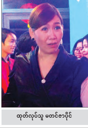
ထုတ်လုပ်သူ မတင်ဇာပိုင်