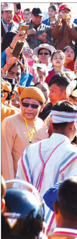
နိုင်ငံတော်၏အတိုင်ပင်ခံပုဂ္ဂိုလ် ဒေါ်အောင်ဆန်းစုကြည် ရှမ်းပြည်နယ်နေအိမ်အမှတ်တိုင်တော်ကို ဝိုင်းရင်းသားရိုးရာယဉ်ကျေးမှု ပြခန်းများနှင့် ဌာနဆိုင်ရာပြခန်းများကို ဖွဲ့စည်းဖြတ်ဖြူခွင့်လှစ်ပေးစဉ်။

တန်ဖိုးရှိတဲ့ လုပ်ရပ်တွေဖြစ် ကျွန်ုပ်တို့ မှန်ကန်တဲ့ ဆုံးဖြတ်ချက်တွေကို ဒီအချိန် ဒီအခါမှာ ချလိုက်ရင်