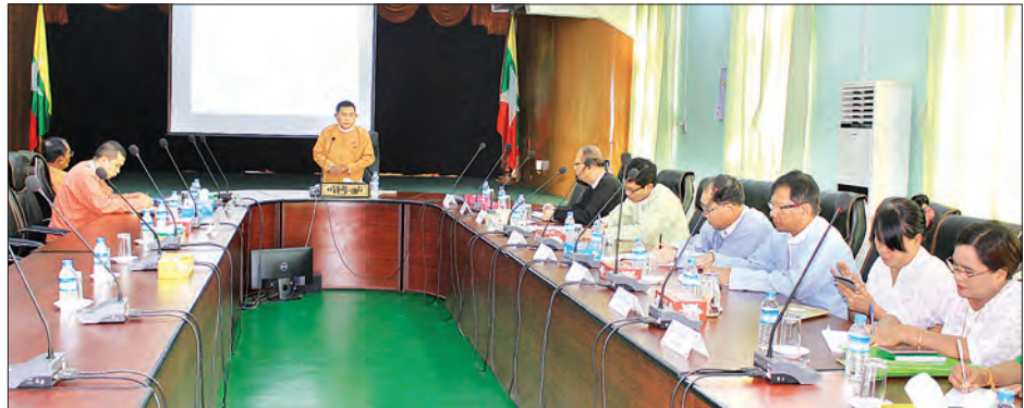
ပဲခူးတိုင်းဒေသကြီးအစိုးရအဖွဲ့နှင့် ဆောက်လုပ်ခွင့်ရ ကုမ္ပဏီတို့ တွေ့ဆုံစဉ်။