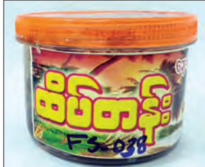
ထိပ်တန်း ရခိုင်ငါးပိထောင်း