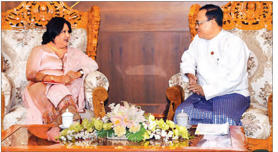
ပြည်ထောင်စုဝန်ကြီး ဦးကျော်တင် ကုလသမဂ္ဂအတွင်းရေးမှူးချုပ်၏ ပဋိပက္ခအတွင်း အမျိုးသမီးများအား အကြမ်းဖက်မှုဆိုင်ရာ အထူးကိုယ်စားလှယ် Ms. Pramila Patten အား လက်ခံတွေ့ဆုံစဉ်။ သတင်းစဉ်