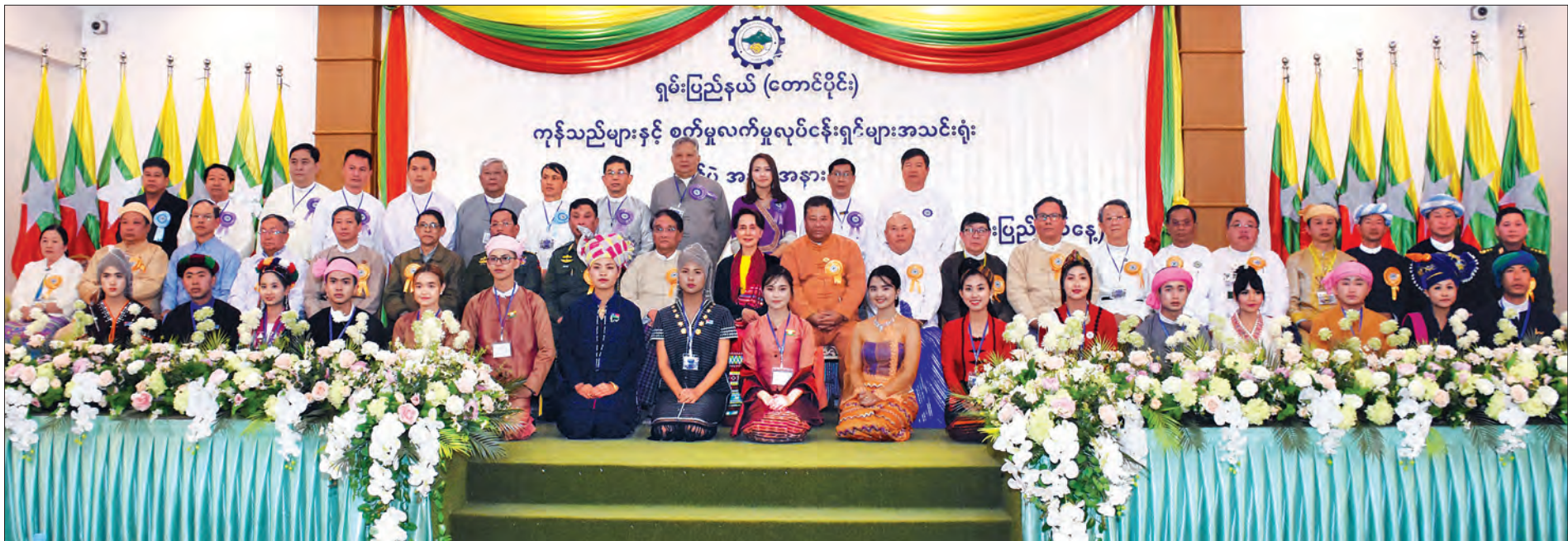
နိုင်ငံတော်၏ အတိုင်ပင်ခံပုဂ္ဂိုလ် ဒေါ်အောင်ဆန်းစုကြည်၊ ပြည်ထောင်စုဝန်ကြီးများ၊ ရှမ်းပြည်နယ်ဝန်ကြီးချုပ်တို့ ပြည်ထောင်စုသမ္မတမြန်မာနိုင်ငံ ကုန်သည်များနှင့် စက်မှုလက်မှုလုပ်ငန်းရှင်များအသင်းချုပ်၊ ရှမ်းပြည်နယ် (တောင်ပိုင်း) ကုန်သည်များနှင့် စက်မှုလက်မှုလုပ်ငန်းရှင်များအသင်း၊ ညီနောင်အသင်းများမှ ဥက္ကဋ္ဌများ၊ အတွင်းရေးမှူးများ၊ တိုင်းရင်းသားအဖွဲ့များနှင့်အတူ စုပေါင်းမှတ်တမ်းတင်ဓာတ်ပုံရိုက်စဉ်။