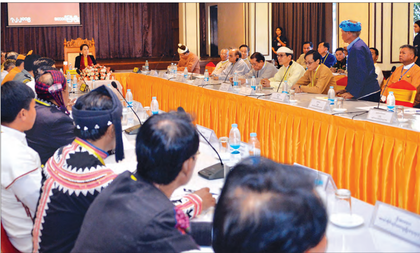
နိုင်ငံတော်၏ အတိုင်ပင်ခံပုဂ္ဂိုလ် ဒေါ်အောင်ဆန်းစုကြည် ဘာသာရေးခေါင်းဆောင်များ၊ တိုင်းရင်းသားခေါင်းဆောင်များ၊ တိုင်းရင်းသားလူမျိုးရေးရာဝန်ကြီးများ၊ ကိုယ်ပိုင်အုပ်ချုပ်ခွင့်ရ တိုင်း / ဒေသ ဦးစီးဥက္ကဋ္ဌများနှင့် တွေ့ဆုံစဉ်။

အဆိုပါတွေ့ဆုံပွဲသို့ ပြည်ထောင်စုဝန်ကြီးများ ဖြစ်ကြသည့် ဒုတိယဗိုလ်ချုပ်ကြီး ကျော်ဆွေ၊ ဒုတိယဗိုလ်ချုပ်ကြီး ရဲအောင်၊