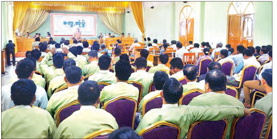
တိုင်းဒေသကြီးဝန်ကြီးချုပ်နှင့်ဒေသခံများ တွေ့ဆုံကြစဉ်။

ပြည်သူများ၏ ဆန္ဒမပါဘဲနဲ့ အုပ်ချုပ်တဲ့ အစိုးရဆိုသည် ဒီမိုကရေစီအစိုးရမဖြစ်နိုင်ကြောင်း၊ အုပ်ချုပ်ရေး တာဝန်ယူထားသော အစိုးရဆိုသည်မှာ ပြည်သူများ၏ လိုအပ်ချက်များကို အကောင်းဆုံး၊ အဖြစ်နိုင်ဆုံးဖြည့်ဆည်းပေးရန် တာဝန်သာ အဓိက ဖြစ်ကြောင်း၊ ပြည်သူများ၏ ဆန္ဒကို မိမိတို့က ကိုယ်စွမ်း ဉာဏ်စွမ်း ရှိသလောက် တတ်နိုင်သမျှ ထောက်ပံ့ဖြည့်ဆည်းဆောင်ရွက်ပေးခြင်း ဖြစ်ကြောင်း၊ နိုင်ငံ၏အလှူကိုပိုပြီး တင့်တယ်အောင် ပြည်သူပြည်သားများက လုပ်ရန် တာဝန်ရှိကြောင်း၊ ဆန္ဒပြင်းပြမှု ကိစ္စ