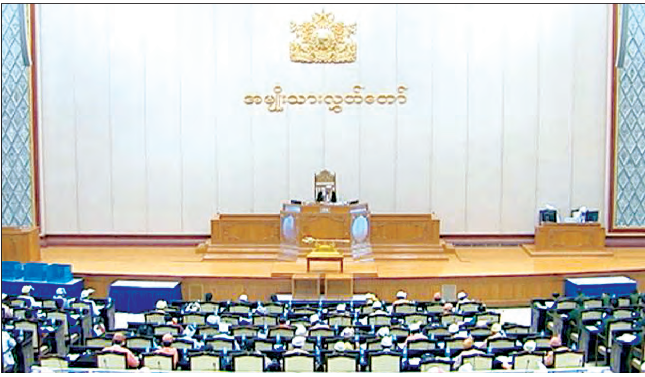
ဒုတိယအကြိမ် အမျိုးသားလွှတ်တော် (၁၁)ကြိမ်မြောက် ပုံမှန်အစည်းအဝေး နဝမနေ့ ကျင်းပစဉ်။

အလားတူ စစ်ကိုင်းတိုင်းဒေသကြီး မဲဆန္ဒနယ် အမှတ်(၉)မှ ဦးမောင်မောင်လတ် ၏ မေးခွန်းနှင့် စပ်လျဉ်း၍ မြန်မာနိုင်ငံတော်တိုင်းဒေသကြီး ဒုတိယဥက္ကဋ္ဌ ဦးစိုးမင်းက ပြန်လည်ရှင်းလင်းဖြေကြားခဲ့သည်။