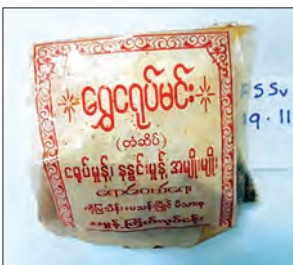
ရွှေငရုပ်မင်း ငရုတ်သီး အကြမ်းမှုန့်