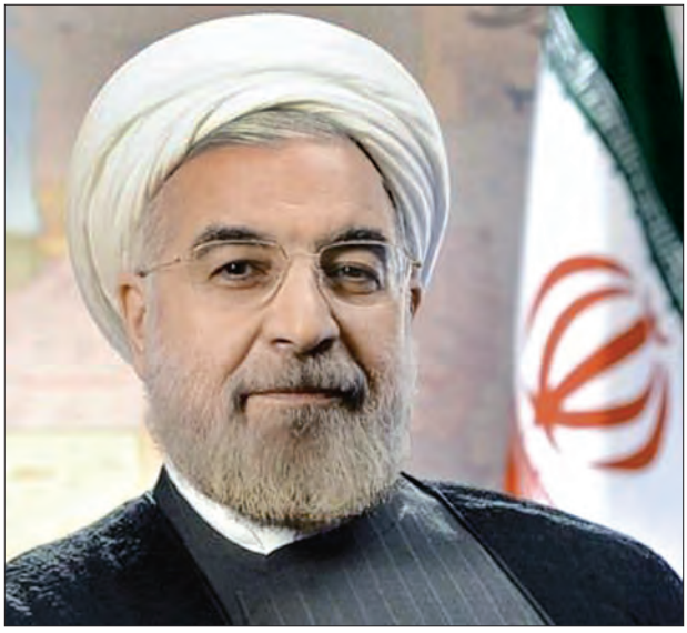
အီရန်သမ္မတ ဟက်ဆန်ရိုဟာနီကို တွေ့ရစဉ်။