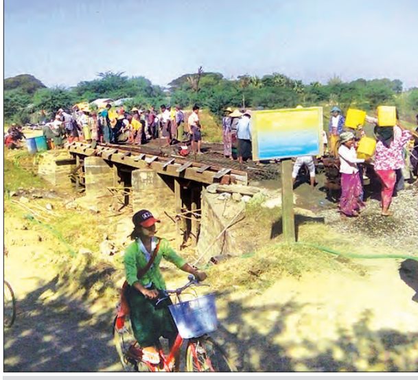
ကျေးရွာချင်းဆက်တံတား ဆောက်လုပ်နေမှုကို တွေ့ရစဉ်။