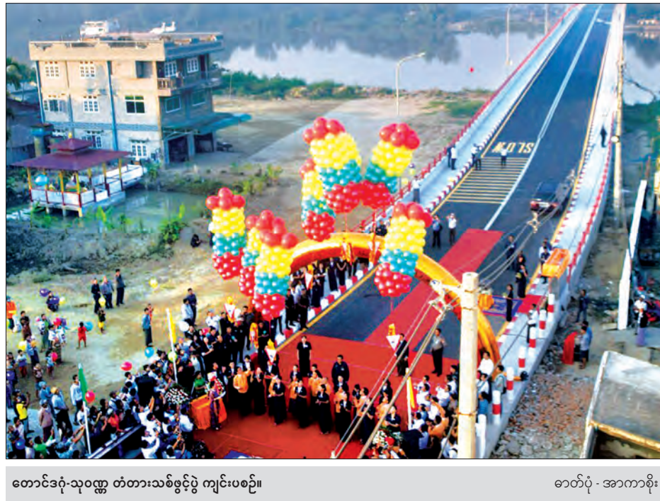
တောင်ဒဂုံ-သုဝဏ္ဏ တံတားသစ်ဖွင့်ပွဲ ကျင်းပစဉ်။

အစင်း ၂၀ မြောက် တံတား ယနေ့ဖွင့်လှစ်သော တောင်ဒဂုံ- သုဝဏ္ဏတံတားသစ်မှာ ငမိုးရိပ်ချောင်း ပေါ်တွင် တည်ဆောက်ဖွင့်လှစ်ခဲ့သော တံတားများအနက် အစင်း ၂၀ မြောက် တံတားတစ်စင်းဖြစ်ပြီး ဒဂုံမြို့သစ် (တောင်ပိုင်း)မြို့နယ်အတွက် ဒုတိယ မြောက် တည်ဆောက်ဖွင့်လှစ်ပေး နိုင်ခဲ့သော တံတားတစ်စင်းဖြစ်ကြောင်း သိရသည်။