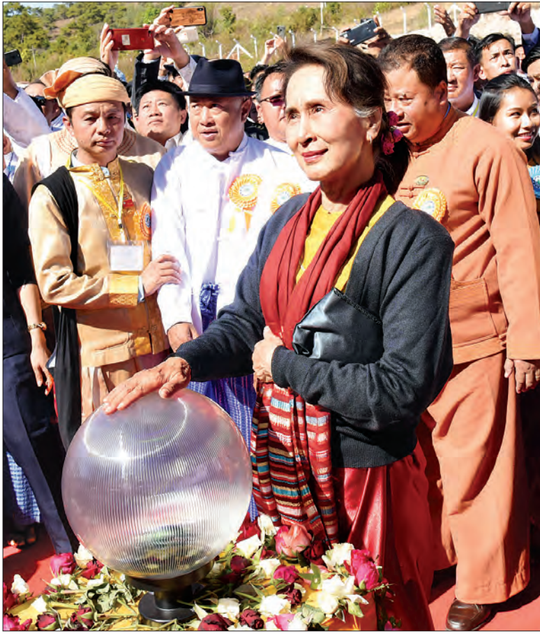
နိုင်ငံတော်၏အတိုင်ပင်ခံပုဂ္ဂိုလ် ဒေါ်အောင်ဆန်းစုကြည် ရှမ်းပြည်နယ်(တောင်ပိုင်း) ကုန်သည်များနှင့် စက်မှုလက်မှုလုပ်ငန်းရှင်များအသင်းရုံး အဆောက်အအုံ ဆိုင်းဘုတ်ကို စက်ခလုတ်နှိပ်ပေးစဉ်။