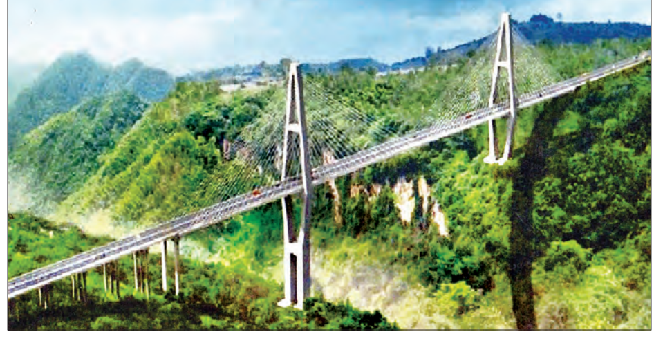
မန္တလေး-လားရှိုး-မူဆယ်ကားလမ်း၌ တည်ဆောက်မည့် ဂုတ်တွင်းတံတားပုံစံကို တွေ့ရစဉ်။

အဆိုပါ နောင်ချိုမြို့ရှောင်လမ်းနှင့် ဂုတ်တွင်းတံတား တည်ဆောက်ပြီးစီးသွားလျှင် မန္တလေး-လားရှိုး-မူဆယ် ပြည်ထောင်စုလမ်းမကြီး AH-14 ပေါ်တွင် တွေ့ပေါင်း ၂၁ ကွေ့ရှိပြီး ချောက်ကမ်းပါးများပေါများသည့် ဂုတ်တွင်းကားလမ်းမှ သွားစရာမလိုတော့ဘဲ တံတားပေါ်မှ ကားများ အန္တရာယ်ကင်းစွာဖြင့် ဖြတ်သန်း မောင်းနှင်နိုင်တော့မည် ဖြစ်သည်။