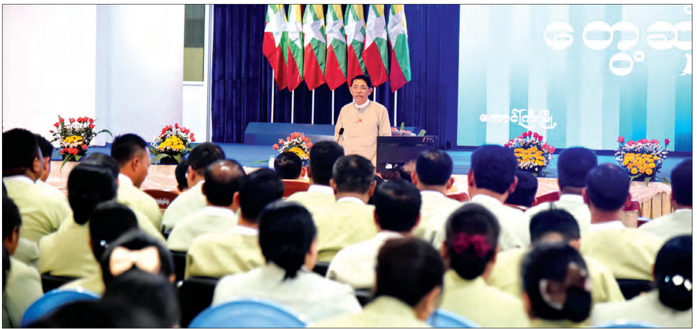
ပြည်ထောင်စုဝန်ကြီး ဦးမင်းသူ တောင်ကြီးမြို့၌ ကျင်းပသည့် ရှမ်းပြည်နယ် (တောင်ပိုင်း/မြောက်ပိုင်း)ရှိ အထွေထွေအုပ်ချုပ်ရေးဦးစီးဌာန ဝန်ထမ်းများနှင့် တွေ့ဆုံပွဲတွင် အမှာစကား ပြောကြားစဉ်။ သတင်းစဉ်

တောင်ကြီး ဖေဖော်ဝါရီ ၇ ပြည်ထောင်စုအစိုးရအဖွဲ့ရုံးဝန်ကြီးဌာန ပြည်ထောင်စုဝန်ကြီး ဦးမင်းသူသည် ရှမ်းပြည်နယ် (တောင်ပိုင်း/မြောက်ပိုင်း)ရှိ အထွေထွေအုပ်ချုပ်ရေးဦးစီးဌာန ဝန်ထမ်းများအား ယနေ့ ညနေ ၄ နာရီတွင် ရှမ်းပြည်နယ် တောင်ကြီးမြို့ရှိ ပြည်နယ် အထွေထွေအုပ်ချုပ်ရေးဦးစီးဌာနရုံး အစည်းအဝေးခန်းမ၌ တွေ့ဆုံသည်။ ရှေးဦးစွာ ရှမ်းပြည်နယ်အထွေထွေအုပ်ချုပ်ရေးဦးစီးဌာန ပြည်နယ်အုပ်ချုပ်ရေးမှူး ဦးစိုးစိုးဇော်က ပြည်နယ်အထွေထွေ အုပ်ချုပ်ရေးဦးစီးဌာနမှ ညွှန်ကြားရေးမှူးများ၊ “ဝ”ကိုယ်ပိုင် အုပ်ချုပ်ခွင့်ရတိုင်း၊ “ကိုးကန့်”၊ “ခန”၊ “ပအိုဝ်း”၊ “ပလောင်” ကိုယ်ပိုင်အုပ်ချုပ်ခွင့်ရဒေသ ဦးစီးအဖွဲ့မှူးများမှ တာဝန်ရှိသူများ နှင့် ခရိုင်အုပ်ချုပ်ရေးမှူးများ၊ မြို့နယ်အုပ်ချုပ်ရေးမှူးများနှင့် မိတ်ဆက်ပေးပြီး ရှမ်းပြည်နယ် အထွေထွေအုပ်ချုပ်ရေးဦးစီး ဌာန၏ လုပ်ငန်းဆောင်ရွက်မှု အခြေအနေများကို ရှင်းလင်း တင်ပြသည်။ ယင်းနောက် ပြည်ထောင်စုအစိုးရအဖွဲ့ရုံး ဝန်ကြီးဌာန ပြည်ထောင်စုဝန်ကြီး ဦးမင်းသူက မိမိအနေဖြင့် နိုင်ငံတော် သမ္မတ၊ နိုင်ငံတော်၏ အတိုင်ပင်ခံပုဂ္ဂိုလ်တို့နှင့် ပြည်တွင်းခရီးစဉ် များ သွားရောက်ကာ ရောက်သည့်နေရာတွင် အထွေထွေ အုပ်ချုပ်ရေးဝန်ထမ်းများနှင့် စာမျက်နှာ ၁၁ ကော်လံ ၁ ❄