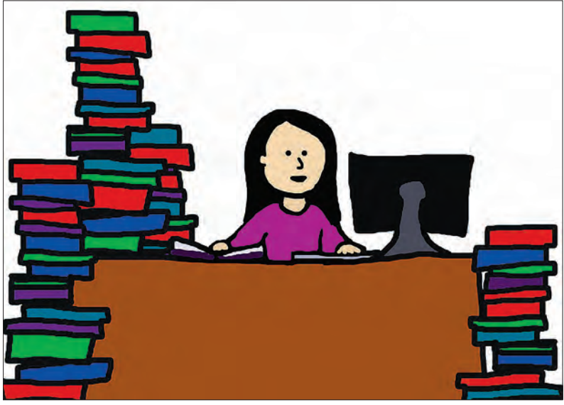
ပိုလိုတောင် လက်ပျက်သေးတယ်လို့ ပြောပါတယ်။

သမီးတစ်ခုတော့ ပြောထားချင်ပါတယ်မေမေ။ သမီးအခုလို ပြောပြလို့ ငါ့သမီး ကတော့ ဂုဏ်ထူးလေးဘာသာ၊ ငါးဘာသာထွက်မှာဆိုတာမျိုးတော့ ဘယ်သူ့ကိုမှ ကြိုမပြောထားစေချင်ပါဘူး။ သမီးကအတတ်နိုင်ဆုံး ကြိုးစားနေတယ်ဆိုပေမယ့် ချွတ်ချော်မှုရှိခဲ့ရင် မကောင်းလို့ပါ။ ဒါကိုတာနဲ့ ဥပမာပေးချင်သလိုဆိုရင် ဖေဖေ ဂေါက်ရိုက်တာကိုပဲ ဥပမာပေးချင်ပါတယ်။ ဖေဖေဟာ သူငယ်ချင်းတွေနဲ့ ဂေါက်ရိုက် ရင် အမြဲနိုင်နေကျပဲလေ။ ပြိုင်ပွဲလည်းကျရော ဖေဖေနိုင်တယ်ဆိုတာ သိပ်မရှိလှဘူး။