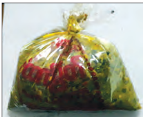
ထက်မြတ် လက်ဖက် (ချဉ်စပ်နှပ်)