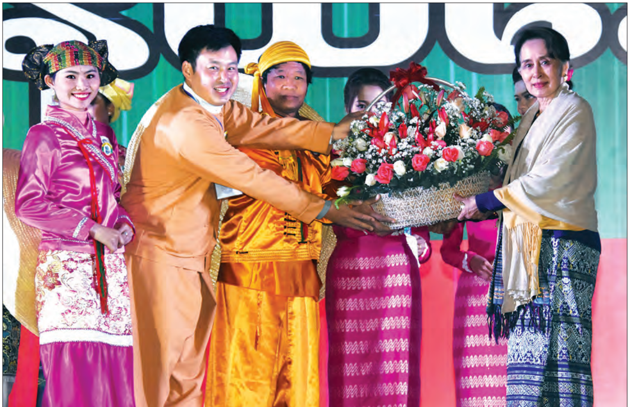
နိုင်ငံတော်၏အတိုင်ပင်ခံပုဂ္ဂိုလ် ဒေါ်အောင်ဆန်းစုကြည် (၇၂)နှစ်မြောက် ရှမ်းပြည်နယ်နေ့ ဂုဏ်ပြုညစာစားပွဲတွင် ကပြဖျော်ဖြေသည့် တိုင်းရင်းသားရိုးရာအဖွဲ့အား ဂုဏ်ပြုလက်ဆောင်ပန်းခြင်း ပေးအပ်စဉ်။

ငြိမ်းချမ်းရေးနဲ့ ပတ်သက်ရင် ၂၀ ရာစုပင်လုံ ညီလာခံကြီးကို စတင်နိုင်ခဲ့ ပါပြီ။ ငြိမ်းချမ်းရေးဆိုတာဟာလည်း အမျိုးသားရင်ကြားစေရေးနဲ့ လက်တွဲ ပြီးတော့ တစ်ကြိမ်တည်းမှာလုပ်ရမယ့် ကိစ္စဖြစ်ပါတယ်။ အခုဆိုရင် မကြာမီကာလက လွှတ်တော်မှာစပြီး စစ်မှန်တဲ့ ဒီမိုကရေစီ ဖက်ဒရယ်ပြည်ထောင်စု ပေါ်ထွန်းရေး အတွက် ဖွဲ့စည်းပုံအခြေခံ ဥပဒေပြင်ဆင် ရေးခြေလှမ်းများကိုစပြီးတော့ လှမ်းပြီ ဆိုတာကို ပြည်သူလူထုအားလုံး အသိ