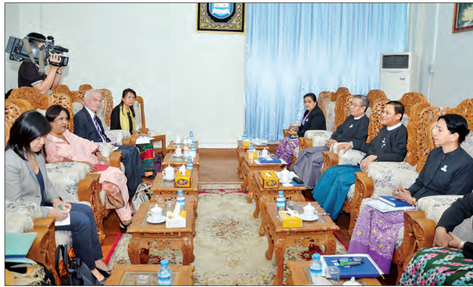
ပြည်ထောင်စုရှေ့နေချုပ် ဦးထွန်းထွန်းဦး ပဋိပက္ခအတွင်း အမျိုးသမီးများအား အကြမ်းဖက်မှုဆိုင်ရာ ကုလသမဂ္ဂအတွင်းရေးမှူးချုပ်၏ အထူးကိုယ်စားလှယ် Ms. Pramila Patten နှင့် ကိုယ်စားလှယ်အဖွဲ့အား လက်ခံတွေ့ဆုံစဉ်။ သတင်းစဉ်

ထိုသို့တွေ့ဆုံစဉ် နိုင်ငံတကာကွန်ပင်ရှင်းများနှင့်အညီ အမျိုးသမီးများအပေါ် အကြမ်းဖက်မှုမှ ကာကွယ်ရေးဆိုင်ရာ ဥပဒေတစ်ရပ်ကို သက်ဆိုင်ရာဝန်ကြီးဌာနက ရေးဆွဲ၍ လွှတ်တော်သို့ တင်ပြရန် ဆောင်ရွက်လျက်ရှိသည်ကို အမျိုးသမီးများအပေါ် အကြမ်းဖက်မှုသည့်မှခင်းများကို တည်ဆဲ ပြစ်မှုဆိုင်ရာဥပဒေ၊ အထူးဥပဒေများဖြင့် အရေးယူဆောင်ရွက် လျက်ရှိသည်ကို မြန်မာနိုင်ငံအစိုးရနှင့် တိုင်းရင်းသား လက်နက်ကိုင်အဖွဲ့အစည်း ၁၀ ဖွဲ့တို့အကြား ချုပ်ဆိုထားသည့် တစ်နိုင်ငံလုံးပစ်ခတ်တိုက်ခိုက်မှု ရပ်စဲရေးသဘောတူစာချုပ် တွင် အမျိုးသမီးများ အပါအဝင် အရပ်သားများအား ကာကွယ် ပေးခြင်းနှင့်စပ်လျဉ်းသည့် စည်းကမ်းချက်များကို ပဋိပက္ခ အတွင်း အမျိုးသမီးများအား အကြမ်းဖက်မှုမှကာကွယ်ရေး ဆိုင်ရာ ပူးတွဲကြေညာချက်ပါ လုပ်ငန်းများကို အကောင်အထည် ဖော်နိုင်ရေးအတွက် နီးကပ်စွာပူးပေါင်းဆောင်ရွက်မည်ကို စွဲ ဥပဒေများ ပြည့်စုံကောင်းမွန်စေရန် သုံးသပ်အကြံပြုခြင်း။