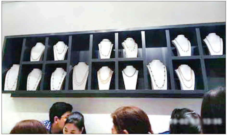
ပိုလ်ချုပ်ဈေး ပုလဲအရောင်းဆိုင်တစ်ခုကို တွေ့ရစဉ်။

ရန်ကုန် ဖေဖော်ဝါရီ ၇ မြန်မာ့ပုလဲဈေးကို ပြည်တွင်းသာမက ပြည်ပနိုင်ငံများကလည်း စိတ်ဝင် စား၍ ဝယ်ယူမှုများရှိပြီး အဓိက တရုတ်နိုင်ငံသားများ ဝယ်ယူမှုများကြောင့် ယခင်နှစ်များထက် ယှဉ်ပါကလည်း ဈေးနှုန်းမှာ မြင့်တက်လာလျက်ရှိကြောင်း သိရသည်။