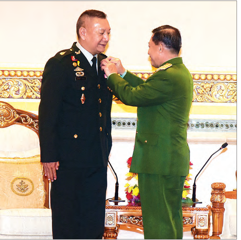
တပ်မတော်ကာကွယ်ရေးဦးစီးချုပ် ပိုလ်ချုပ်မှူးကြီးမင်းအောင်လှိုင် ထိုင်းဘုရင့်တပ်မတော် ကာကွယ်ရေးဦးစီးချုပ်အား ဂုဏ်ထူးဆောင်တံဆိပ် ချီးမြှင့်အပ်နှင်းတပ်ဆင်ပေးစဉ်။

အကြား အကျိုးတူပူးပေါင်းဆောင်ရွက် မှုနှင့် ချစ်ကြည်ရင်းနှီးမှုကို လက်ရှိအဆင့် ထက် ပိုမိုမြှင့်တင်အောင် အရှိန်အဟုန် မြှင့် ဆောင်ရွက်ကြမည့်အခြေအနေ များအား ခင်မင်ရင်းနှီးစွာ အမြင်ချင်း ဖလှယ် ဆွေးနွေးကြသည်။ ဂုဏ်ပြုချီးမြှင့် တွေ့ဆုံပွဲအပြီးတွင် ပိုလ်ချုပ်မှူးကြီး မင်းအောင်လှိုင်က ထိုင်းဘုရင့်တပ်မတော် ကာကွယ်ရေးဦးစီးချုပ် General Ponpipt Benyasri အား တပ်မတော် ကာကွယ်ရေးဦးစီးချုပ်၏ ဂုဏ်ထူးဆောင် တံဆိပ်ကို ချီးမြှင့်အပ်နှင်းတပ်ဆင် ပေးသည်။ ယင်းဂုဏ်ထူးဆောင်တံဆိပ် မှာ ပြည်ပတပ်မတော်ကာကွယ်ရေးဦးစီး ချုပ်များအား ပထမဆုံးအကြိမ် ဂုဏ်ပြု ချီးမြှင့်အပ်နှင်းခြင်းဖြစ်ပြီး General Ponpipat Benyasri မှာ ပထမဆုံး ချီးမြှင့်ခံရသည့်ပုဂ္ဂိုလ်ဖြစ်သည်။ တည်ခင်းညှိနှိုင်း ညှိနှိုင်းတွင် တပ်မတော်ကာကွယ် ရေးဦးစီးချုပ်က ထိုင်းဘုရင့်တပ်မတော် ကာကွယ်ရေးဦးစီးချုပ်အား နေပြည် တော်ရှိ ရွှေနန်းတော်ဟိုတယ်၌ ဂုဏ်ပြု ညစာဖြင့် တည်ခင်းညှိနှိုင်းကြောင်း တပ်မတော်ကာကွယ်ရေးဦးစီးချုပ်ရုံး၏ သတင်းထုတ်ပြန်ချက်အရ သိရှိရသည်။ သတင်းစဉ်