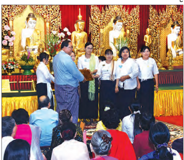
အလှူတော်ငွေပေးအပ်လှူဒါန်းပွဲတွင် ဂေါပကအဖွဲ့ဝင်များက အလှူရှင်များအား ဂုဏ်ပြုမှတ်တမ်းလွှာများ ပြန်လည်ပေးအပ်စဉ်။

ရန်ကုန် ဖေဖော်ဝါရီ ၇ ရွှေတိဂုံစေတီတော်ဘဏ္ဍာတော်ထိန်း ဂေါပကအဖွဲ့က စီစဉ်ကျင်းပသော (၅၆၆) ကြိမ် မြောက် အလှူတော်ငွေပေးအပ်လှူဒါန်းပွဲနှင့် အလှူရှင်များအား ထုတ်အနုမောဒနာ ဂုဏ်ပြုမှတ်တမ်းလွှာ ပြန်လည်ချီးမြှင့်ပွဲကို ယနေ့မွန်းလွဲ ၁ နာရီက စေတီတော် ရင်ပြင်တော်ရှိ ရှေးဟောင်းဗုဒ္ဓရုပ်ပွားတော်များ တန်ဆောင်း၌ ကျင်းပသည်။ ရှေးဦးစွာ အလှူရှင်များက အလှူတော်ငွေများကို ပေးအပ်လှူဒါန်းရာ ဂေါပက အဖွဲ့ဝင်များက လက်ခံရယူပြီး ထုတ်အနုမောဒနာဂုဏ်ပြုမှတ်တမ်းလွှာများ ပြန်လည် ပေးအပ်ကြသည်။ ထို့နောက် ဘဏ္ဍာတော်ထိန်း ဂေါပကအဖွဲ့၏ ဩဝါဒါစရိယနိုင်ငံတော် သံဃမဟာ နာယကအဖွဲ့ဝင် အဂ္ဂမဟာပဏ္ဍိတ၊ အဂ္ဂမဟာဂန္ထဝါစကပဏ္ဍိတ ဗဟန်းမြို့နယ် ပညာဉာဏ်တန်းပိဋကတ္တသိုလ် ကျောင်းတိုက်ဆရာတော် ဘဒ္ဒန္တပဝရာဘိဝံသထံမှ ဧည့်ပရိသတ်များက ငါးပါးသီလံယူဆောင်တည်ကြပြီး ရေစက်ချအနုမောဒနာတရား နာယူကြသည်။ ယနေ့ပြုလုပ်သော အလှူတော်ငွေပေးအပ်လှူဒါန်းပွဲ၌ ရွှေသင်္ကန်းတော် (ရွှေပြား) အလှူရှင် ၁၅၁ ဦးတို့က ရွှေပြားပေါင်း ၁၅၉ ချပ် လှူဒါန်းခဲ့ကြပြီး လှူဒါန်း ငွေကျပ်စုစုပေါင်း ကျပ် ၁၇၄၁၅၀၀၀ ဖြစ်ကြောင်း သိရသည်။ သတင်းစဉ်