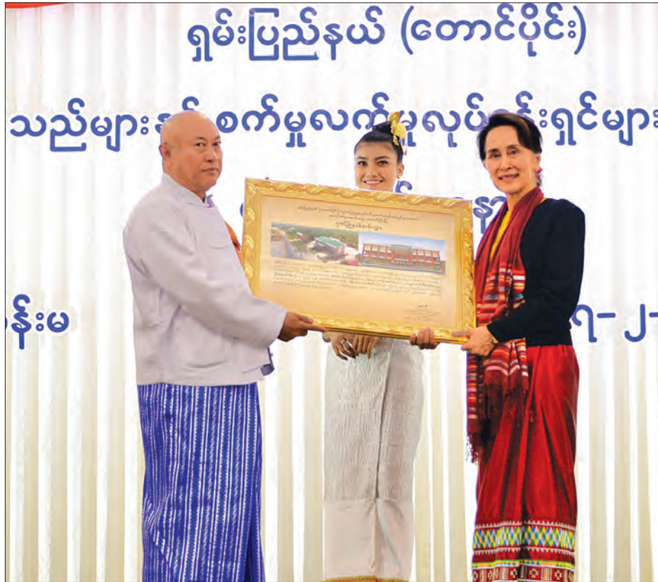
နိုင်ငံတော်၏အတိုင်ပင်ခံပုဂ္ဂိုလ် ဒေါ်အောင်ဆန်းစုကြည် ကုန်သည်များနှင့်စက်မှုလက်မှုလုပ်ငန်းရှင်များအသင်းချုပ် နာယက ဦးအောင်ကိုဝင်းအား ဂုဏ်ပြုမှတ်တမ်းလွှာ ပေးပို့စဉ်။

လုပ်ပြီး အချို့က ဘာမှမလုပ်ဘဲ နေနေကြကြောင်း၊ ယင်းကို မိဘများနှင့် ဆရာ ဆရာမများအနေဖြင့် ပြန်လည်ကြည့်ရှုပေးစေချင်ပါကြောင်း၊ ကျောင်းမတက်သည့် ယောက်ျားလေးများသည် မိဘများကိုကူညီပြီး စီးပွားရေးလုပ်နေသလား၊ အလုပ်လုပ်နေသလား၊ လမ်းပေါ်ရောက် နေသလား၊ သို့မဟုတ် လက်ဖက်ရည်ဆိုင်မှ အရက်ဆိုင် ထိုမှတစ်ဆင့် မူးယစ်ဆေးဝါးအဆင့်အထိ ရောက်သွားမည်ကို မိမိအနေဖြင့် စိုးရိမ်မိပါကြောင်း။