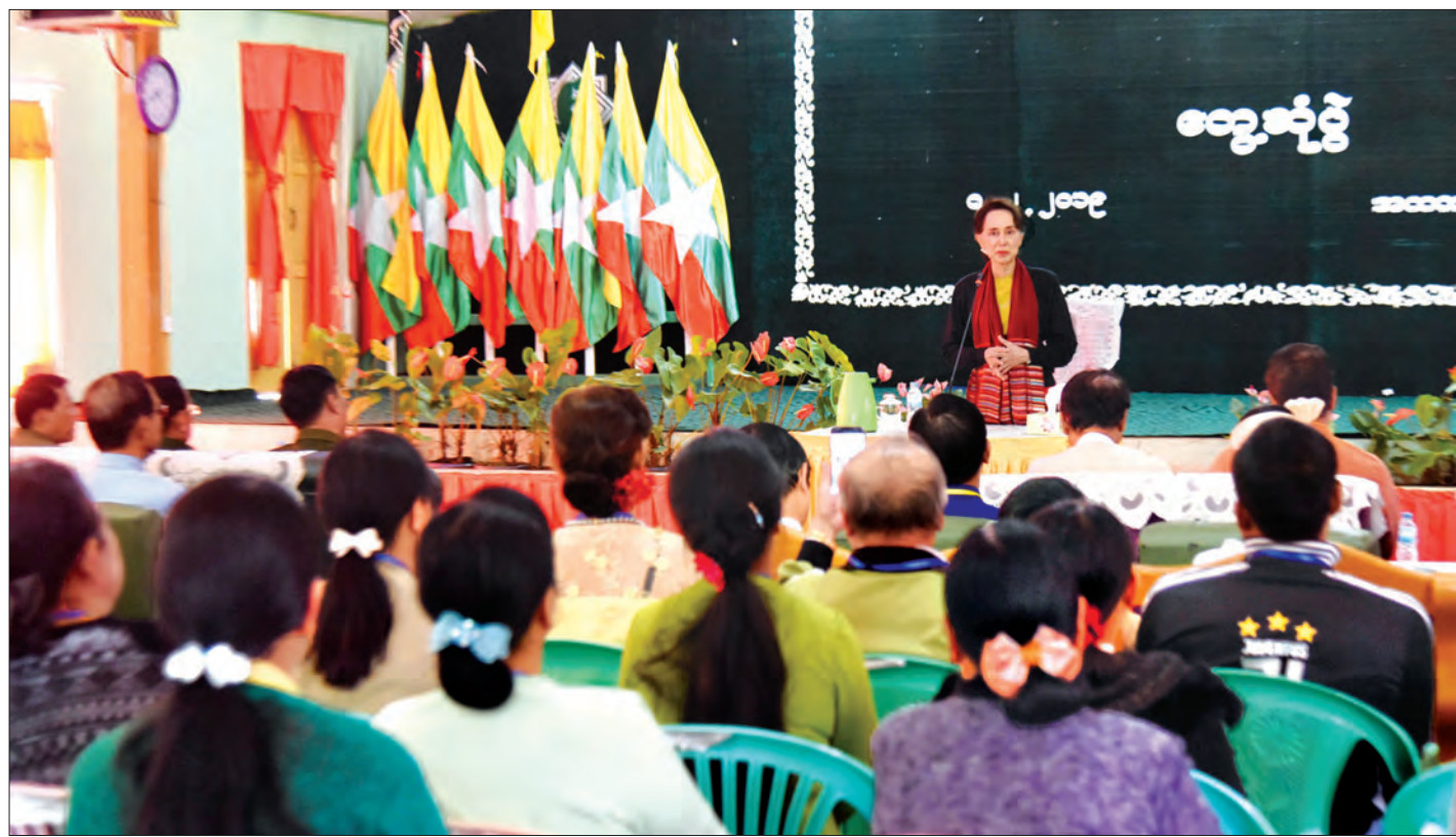
နိုင်ငံတော်၏ အတိုင်ပင်ခံပုဂ္ဂိုလ် ဒေါ်အောင်ဆန်းစုကြည် တောင်ကြီးမြို့အမှတ် (၂) အခြေခံပညာအထက်တန်းကျောင်း၌ ဆရာ ဆရာမများ၊ ကျောင်းသားမိဘများနှင့် ပညာရေးကဏ္ဍဖွံ့ဖြိုး တိုးတက်ရေးကိစ္စများကို တွေ့ဆုံဆွေးနွေးစဉ်။

KG အတန်းများကို သွားသည့်အခါ ကလေးများမှာ တိုင်းရင်းသားမျိုးစုံက တက်ရောက်သင်ကြားနေသည်ကို တွေ့ရ ကြောင်း၊ တိုင်းရင်းသားပေါင်းစုံ အေးအေးဆေးဆေး ချစ်ချစ် ခင်ခင် တွေ့ရပါကြောင်း၊ ဆရာ ဆရာမများအနေဖြင့် ကလေး များတတ်သော ဘာသာစကားတိုင်းကို အနည်းဆုံး နှုတ်ဆက်ရုံ အတွက် တစ်ယောက်ကို တစ်ယောက် သင်ပေးရန်လိုကြောင်း၊ ဘာသာစကားများကို အစကတည်းက နှုတ်ဆက်နည်း၊ ကျေးဇူး တင်ပါသည်ဟု ပြောနည်းများကို သင်ပေးခြင်းသည် အခြေခံ အားဖြင့် မိမိတို့၏ ပြည်ထောင်စုစိတ်ဓာတ်ကို ချုပ်ချိမ်းခြင်းဖြစ်သည့် အပြင် တစ်ဦးနှင့်တစ်ဦး နားလည်မှုပိုမိုရရှိလာမည်ဖြစ်ပါ ကြောင်း။