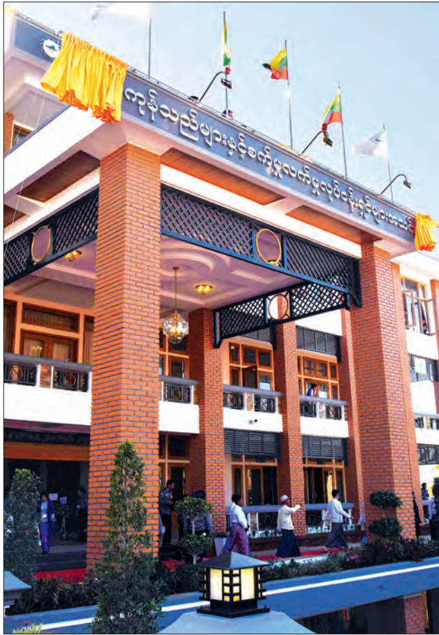
နိုင်ငံတော်၏အတိုင်ပင်ခံပုဂ္ဂိုလ် ဒေါ်အောင်ဆန်းစုကြည် ရှမ်းပြည်နယ်(တောင်ပိုင်း) ကုန်သည်များနှင့် စက်မှုလက်မှုလုပ်ငန်းရှင်များအသင်းရုံး အဆောက်အအုံ ဆိုင်းဘုတ်ကို စက်ခလုတ်နှိပ်ပေးစဉ်။

ယခုအတန်းထဲတွင် ယောက်ျားလေး သုံးပုံတစ်ပုံလောက်သာ တက်ရောက်သင်ကြားနေသည်ကို တွေ့ရသည့်အတွက် မိမိအနေဖြင့် စိုးရိမ်မိပါကြောင်း၊ မည်သည့်အတွက်ကြောင့် ယခုလိုနည်းပါးရသည်ကိုလည်း အဖြေမပေးနိုင်ကြပါကြောင်း၊ တစ်ယောက်ကပြောသည်မှာ အချို့က ကျောင်းထွက် အလုပ်