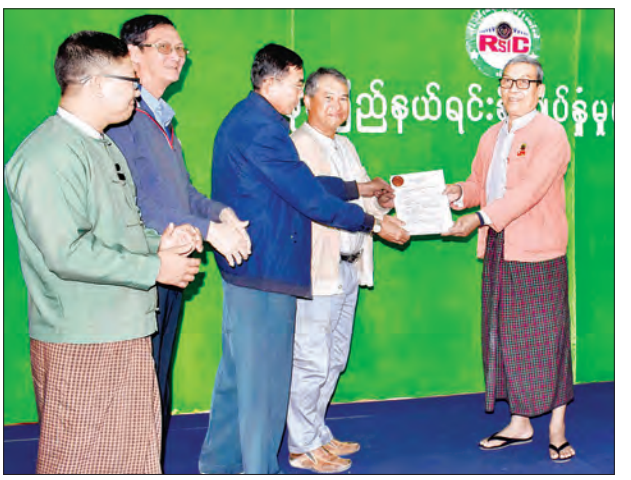
ပြည်နယ်ဝန်ကြီးချုပ်က အတည်ပြုမိန့်ရ ကုမ္ပဏီသို့ အတည်ပြုလွှာ ပေးအပ်စဉ်။