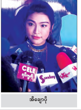
အိချောပို