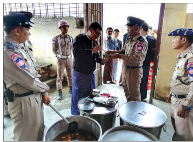
ပဲခူးတိုင်းဒေသကြီး တရားလွှတ်တော် တရားသူကြီးချုပ် ဦးမောင်မောင်ရွှေ ဒိုက်ဦးအကျဉ်းထောင် စားစိုဆောင်ရွက် ကြည့်ရှုစစ်ဆေးစဉ်။

ပဲခူး မတ် ၂၃ ပဲခူးတိုင်းဒေသကြီး တရားလွှတ်တော် တရားသူကြီးချုပ် ဦးမောင်မောင်ရွှေနှင့် တာဝန်ရှိသူများသည် ယမန်နေ့က ဒိုက်ဦး အကျဉ်းထောင်ကို သွားရောက် စစ်ဆေးခဲ့ သည်။ ဒိုက်ဦးအကျဉ်းထောင် တာဝန်ခံ အရာရှိရုံးခန်း၌ တာဝန်ခံအရာရှိ ဦးမိုးဟိန်းက ဒိုက်ဦးအကျဉ်းထောင်နှင့် ပတ်သက်၍ လုံခြုံရေးရာနှင့် စီမံရေးရာ ကိစ္စများ ဆောင်ရွက်ထားရှိမှု၊ အကျဉ်းသူ အကျဉ်းသားများ၏ အခြေအနေ၊ နေထိုင် စားသောက်မှု၊ ကျန်းမာရေး စောင့်ရှောက် မှု၊ သောက်သုံးရေရရှိမှုတို့ကို ရှင်းလင်း တင်ပြသည်။ ဆက်လက်၍ ပဲခူးတိုင်းဒေသကြီး