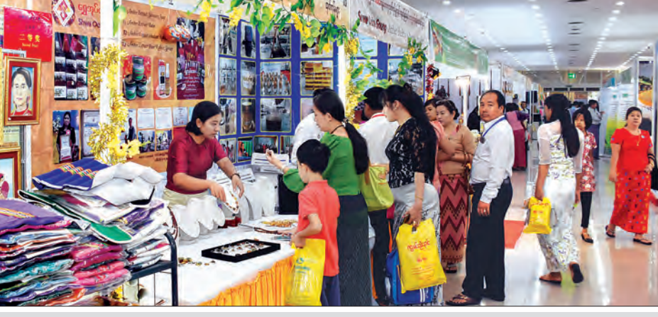
နိုင်ငံတော်အဆင့် MSMEs ထုတ်ကုန်ပြပွဲနှင့် ပြိုင်ပွဲ၌ ပြသရောင်းချနေသော ဆိုင်ခန်းများ၌ ကြည့်ရှုဝယ်ယူသူများကို တွေ့ရစဉ်။

ထွက်ကုန်တွေကို ဝယ်ယူလိုရပါတယ်။ ကိုယ့်နိုင်ငံရဲ့ အသေးစား၊ အလတ်စားလုပ်ငန်းတွေက ထွက်တဲ့ ထုတ်ကုန်ပစ္စည်းတွေကို လေ့လာဝယ်ယူချင်လို့လာတာပါ။ ဈေးနှုန်းတွေကလည်း သင့်တင့်ပါတယ်။ တိုက်ရိုက်လာပြီးရောင်းချတာဆိုတော့ အပြင်က ဈေးထက်တော့ သက်သာပါတယ်။ ဒီပွဲက သုံးရက်ပဲဆိုတော့ ကျွန်ုပ်တို့ဝန်ထမ်းတွေက စနေ၊ တနင်္ဂနွေနဲ့ တိုက်လို့သာ