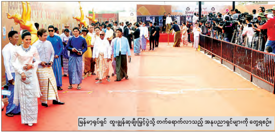
မြန်မာ့ရုပ်ရှင် ထူးချွန်ဆုချီးမြှင့်ပွဲသို့ တက်ရောက်လာသည့် အနုပညာရှင်များကို တွေ့ရစဉ်။