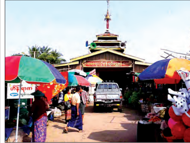
အမေရေယဉ် နန်းရင်းရွှေနန်းတော် အဝင်မုခ်ဦး

အနောက်အမေကြီး၏နယ်မြေသည် ပုံတောင်ပုံညာ အရှေ့ဘက်နှင့် ချင်းတွင်းမြစ် အနောက်ဘက်ကမ်း ယမားနယ်ဒေသဖြစ်သည်။ အနောက်အမေကြီးပွဲ ကျင်းပရာ တွင် တပေါင်းလဆန်း ၁၃ ရက်မှ တပေါင်းလပြည့်ကျော် ၃ ရက်အထိ အတွင်း နန်းဆောင် မောင်းတုံနန်းရင်း၌ ပွဲကျင်းပပြီး တပေါင်းလပြည့်ကျော် ၄ ရက်တွင် ချိုးရေတော်သုံးကာ လပြည့်ကျော် ၅ ရက်မှ ၈ ရက်အထိ ယင်းမာပင်မြို့နယ် ဇီးတော ကျေးရွာ ရွာဦးကုန်းမြင်ရုံ အပြင်နန်းဆောင်(တောနန်း)သို့ ကြွတော်မူကြောင်း သိရ သည်။