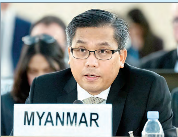
မြန်မာအမြဲတမ်းကိုယ်စားလှယ် ဦးကျော်မိုးထွန်း

“ဆုံးဖြတ်ချက်အဆိုမူကြမ်းအား အဖွဲ့ဝင် ၄၇ နိုင်ငံ ပါဝင်သည့် လူ့အခွင့်အရေးကောင်စီတွင် မဲခွဲခဲ့ရာ ကန့်ကွက်မဲ ၃ မဲ၊ ကြားနေမဲ ၇ မဲနှင့် ထောက်ခံမဲ ၃၇ မဲဖြင့် အတည်ပြုခဲ့သည်။ တရုတ်၊ ကျူးဘား နှင့် ဖိလစ်ပိုင်တို့က မြန်မာနိုင်ငံဘက်မှ ရပ်တည် လျက် ကန့်ကွက်မဲပေးခဲ့ကြပြီး၊ အန်ဂိုလာ၊ ကင်မရွန်း၊ ကွန်ဂိုဒီမိုကရက်တစ်သမ္မတနိုင်ငံ၊ အိန္ဒိယ၊ ဂျပန်၊ နီပေါနှင့် ဆီနီဂေါနိုင်ငံတို့ကလည်း အီးယူ၏ဆုံးဖြတ်ချက် အဆိုမူကြမ်းအား ထောက်ခံ ခြင်းမပြုဘဲ ကြားနေမဲပေးခဲ့”