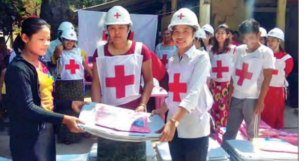
မြောက်ဦးမြို့ရှိ နေရပ်စွန့်ခွာသူများအား မြန်မာနိုင်ငံ ကြက်ခြေနီအဖွဲ့ဝင်များက ထောက်ပံ့ပစ္စည်းများ ပေးအပ်စဉ်။

ထို့နောက် ကြက်ခြေနီတပ်ဖွဲ့ဝင်များသည် ရွာဟောင်းတောကျေးရွာမှ ရွှေတောင်ဘုန်းကြီးကျောင်းတိုက်ပွဲရှောင်စခန်းသို့ ခိုလှုံ့ရောက်ရှိလာသည့် နေရပ်စွန့်ခွာသူ အိမ်ထောင်စု ၃၇ စုအား တာလပတ် (မိုးကာ) ၃၇ ခုနှင့် ဆေးခြင်ထောင် ၇၀ တို့အား အိမ်ထောင်စုအလိုက်ပေးအပ်ခဲ့သည့်အပြင် ကြက်ခြေနီအကြောင်း သိကောင်းစရာ အသိပညာပေးဟောပြောမှုများ ပြုလုပ်ပေးခဲ့ကြောင်း သိရသည်။ ခရိုင်(ပြန်/ဆက်)