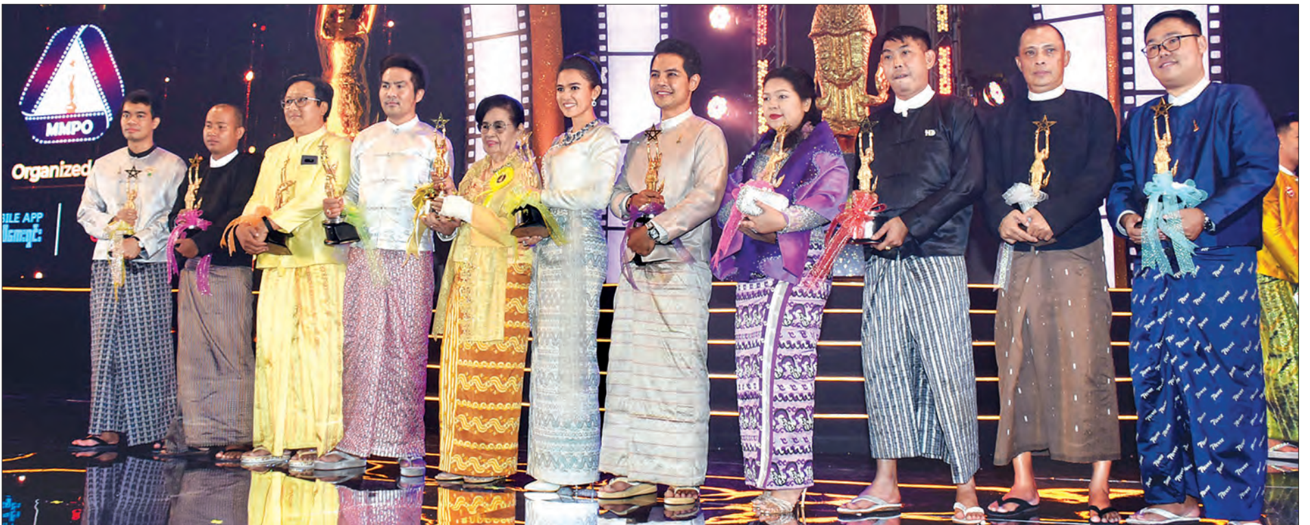
၂၀၁၈ ခုနှစ် မြန်မာ့ရုပ်ရှင်ထူးချွန်ဆုရရှိသူများကို တွေ့ရစဉ်။