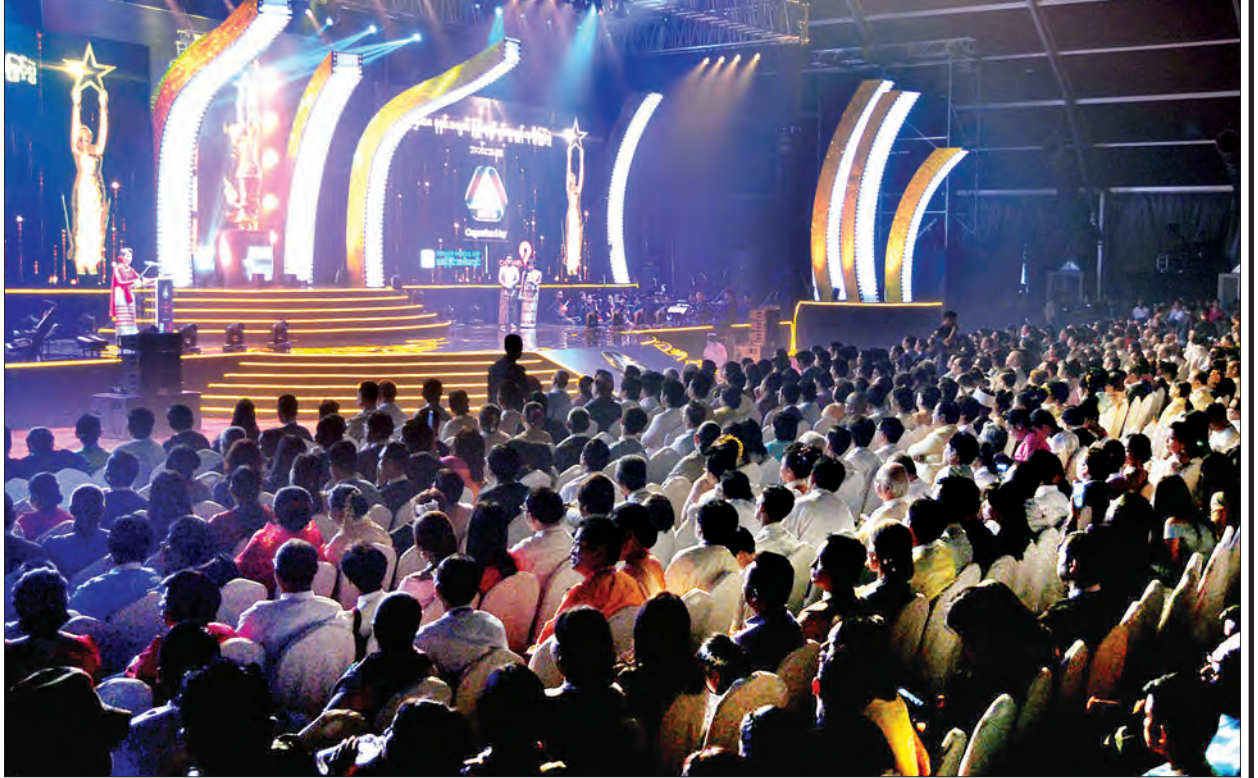
၂၀၁၈ ခုနှစ်အတွက် မြန်မာ့ရုပ်ရှင်ထူးချွန်ဆုချီးမြှင့်ပွဲ အခမ်းအနားကို သယ်နှံးကျွန်းမြို့နယ် သုဝဏ္ဏရှိ The One Entertainment Park ဌာနတွင် ကျင်းပ စဉ်။ (ယာဝု)