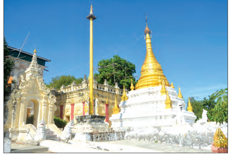
မင်းတုန်းမင်းကြီး တည်ထားကိုးကွယ်ခဲ့သည့် စေတီတော်

ရှိမ်းမကားဘေးမဲ့တောကြီးသည် အကျယ် အဝန်း စတုရန်းမိုင် နှစ်မိုင်ခန့်ရှိပြီး အဆိုပါ ဘေးမဲ့ တောကြီးတွင် သမင်၊ ဒရယ်၊ ယုန်၊ တောဝက်နှင့် တောကြက် စသည့် တိရစ္ဆာန်များ ခိုအောင်း