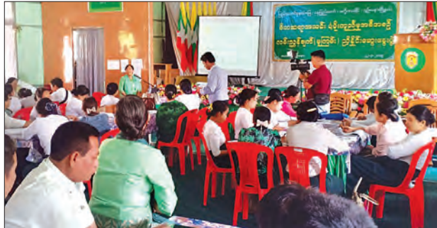
မိဘဆရာအသင်း ပံ့ပိုးကူညီမှုအစီအစဉ် လမ်းညွှန်ချက် (မူကြမ်း) ညှိနှိုင်းဆွေးနွေးပွဲ ကျင်းပစဉ်။