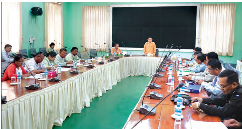
ပဲခူးတိုင်းဒေသကြီး ဝန်ကြီးချုပ် ဦးဝင်းသိန်း သီးနှံနှစ်နာကြေးပေးလျော်နိုင်ရေး ညှိနှိုင်းအစည်းအဝေးတွင် အမှာစကားပြောကြားစဉ်။

ပဲခူး မတ် ၂၃ ပဲခူးတိုင်းဒေသကြီး အစိုးရအဖွဲ့ရုံး အစည်းအဝေးခန်းမ၌ မတ် ၂၃ ရက်က ဟံသာဝတီ အပြည်ပြည်ဆိုင်ရာလေဆိပ် ပတ်လမ်းအတွင်း ကျူးကျော်စိုက်ပျိုးသူ များအား သီးနှံနှစ်နာကြေး ပေးလျော် နိုင်ရေး ညှိနှိုင်းအစည်းအဝေး ကျင်းပ သည်။