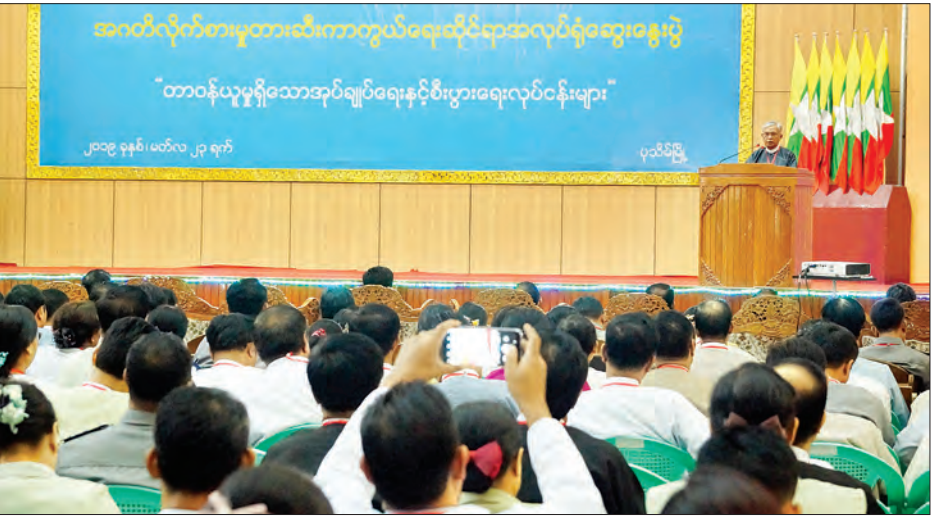
အဂတိလိုက်စားမှုတိုက်ဖျက်ရေးကော်မရှင်ဥက္ကဋ္ဌ ဦးအောင်ကြည် အဂတိလိုက်စားမှုတားဆီးကာကွယ်ရေးအလုပ်ရုံဆွေးနွေးပွဲ၌ အမှာစကား ပြောကြားစဉ်။

အလုပ်ရုံဆွေးနွေး ထို့နောက် အလုပ်ရုံဆွေးနွေးပွဲကို ဆက်လက်ကျင်းပရာ ကော်မရှင်အဖွဲ့ဝင်