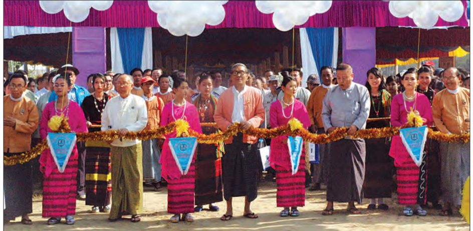
ရခိုင်ပြည်နယ်ဝန်ကြီးချုပ် ဦးညီပု၊ ပြည်နယ်ဝန်ကြီးများနှင့် တာဝန်ရှိသူများက ကျိန္တလီမြို့ ၂၄ နာရီ လျှပ်စစ်ဓာတ်အားဖြန့်ဖြူး ခြင်းဖွင့်ပွဲ ဖဲကြိုးဖြတ်ဖွင့်လှစ်ပေးစဉ်။

ကျိန္တလီမြို့တွင် ၂၄ နာရီ လျှပ်စစ်မီး ရရှိရေးအတွက် ဝတ်ဗားခွဲရုံမှ ၁၁ ကေပီ ဝ-ကျိန္တလီဓာတ်အားလိုင်း ၄၃ ဒဿမ ၃၄ မိုင် တည်ဆောက်ရေးလုပ်ငန်း ကို ၂၀၁၉ ခုနှစ် မတ်လတွင် တည်ဆောက် ပြီးစီးခဲ့ပြီး ကျိန္တလီမြို့ပေါ်ရှိ အိမ်ထောင်စု ၁၃၀၃ ခုနှင့် အနီးပတ်ဝန်းကျင်ကျေးရွာ များမှ အိမ်ထောင်စု ၁၅၉၄ စုကို ၂၄ နာရီ လျှပ်စစ်ဓာတ်အား ဖြန့်ဖြူးပေးနိုင် ပြီဖြစ်ကြောင်း သိရသည်။ မျိုးသူထွန်း