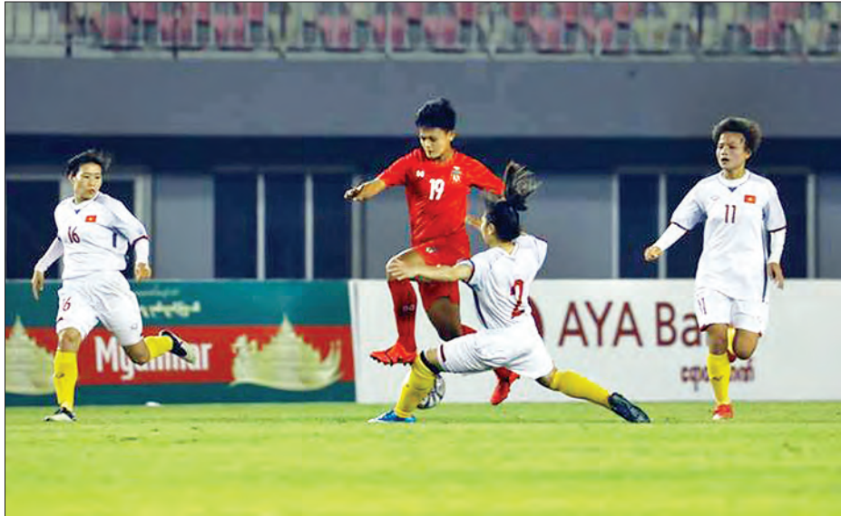
မြန်မာအသင်းနှင့် ဗီယက်နမ်အသင်း ယှဉ်ပြိုင်နေစဉ်။

မြန်မာအမျိုးသမီးအသင်းသည် ပထမပွဲတွင် ရှုံးနိမ့်ထားသည့် ရှုံးကြေးကိုပြန်ဆပ်နိုင်ခဲ့ပြီး နိုင်ပွဲပြန်ယူနိုင်ခဲ့သည်။ ယခုနိုင်ပွဲမှာ မြန်မာအမျိုးသမီးအသင်းအတွက် အဖိုးတန်သည့်နိုင်ပွဲဖြစ်ခဲ့ပြီး ကစားသမားများ၏ ယုံကြည်မှုကို တိုးတက်စေခဲ့သလို ကစားသမားများ၏ ကြိုးစားမှုကြောင့် နှစ်ဂိုးပြတ်အရှုံးမှ စာမျက်နှာ ၇ ကော်လံ ၁