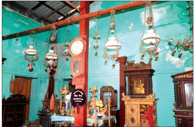
ကနောင်မင်းသားကြီး ပြင်သစ်နိုင်ငံမှ ယူဆောင်လာသည့် ရှေးဟောင်းမီးအိမ်များ

ရှိမ်းမကားကျေးရွာသည် လက်ရှိတွင် အိမ် ထောင်စုပေါင်း ၅၅၇ စုနှင့် လူဦးရေ ၃၃၄၇ ဦး နေထိုင်လျက်ရှိသော စံပြကျေးရွာကြီးဖြစ်ပြီး စစ်ကိုင်းမြို့အမှတ်(၃) ခရိုင်ချင်းဆက်လမ်းမကြီးမှ လာရောက်ပါက ရှိမ်းမကားကျေးရွာအထိ ၂၆ မိုင်မျှသာ ကွာဝေးကြောင်းနှင့် ဧရာဝတီမြစ် ရေ လမ်းကြောင်းမှလည်း လာရောက်နိုင်ကြောင်း သိရသည်။ မင်းထက်အောင်(မန်းကိုယ်ပွား)