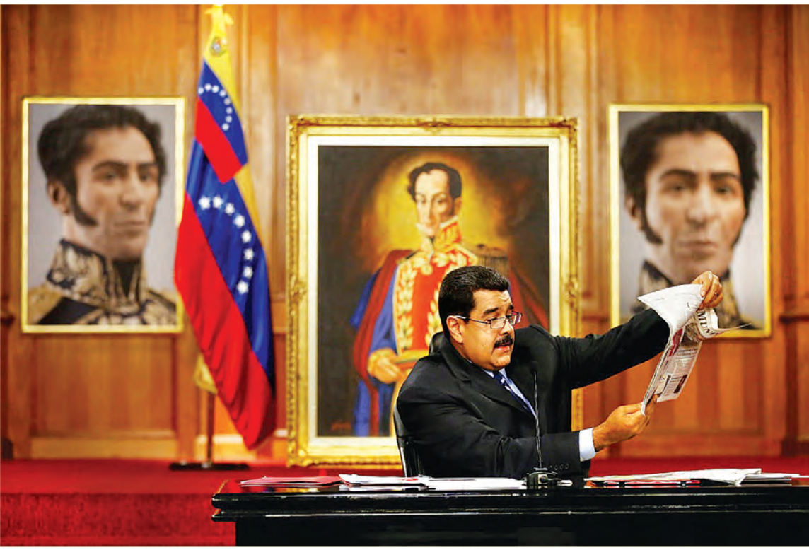
လက်ရှိ ပင်နီဇွဲလားသမ္မတ မာဒူရိုကို တွေ့ရစဉ်။

“ဘာကြောင့်များ ဥရောပသမဂ္ဂက ရွေးကောက်ပွဲကျင်းပပြီးတဲ့ ကမ္ဘာ့နိုင်ငံတစ်နိုင်ငံကို ထပ်ပြီး ရွေးကောက်ပွဲပြုလုပ်ဖို့ ပြောနေတာပါလိမ့်။ ဘာဖြစ်လို့လဲဆိုတော့ သူတို့ရဲ့ မဟာမိတ်တွေ