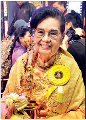
စည်သူ ဒေါ်မြင့်မြင့်ခင် (တစ်သက်တာထူးချွန်ဆု)

ဒေါ်မြင့်မြင့်ခင်သည် အသက် ၈၅ နှစ် အရွယ်ရှိပြီး ရုပ်ရှင်အကယ်ဒမီ ထူးချွန်ဆု ငါးဆုရရှိခဲ့သည်။ မြန်မာနိုင်ငံ