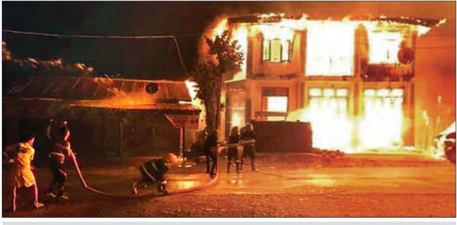
မင်းတပ်မြို့၌ မီးလောင်မှုဖြစ်ပွားသည့်နေအိမ်အား မီးသတ်တပ်ဖွဲ့ဝင်နှင့်ပြည်သူများ ဝိုင်းဝန်းငြိမ်းသတ်ကြစဉ်။