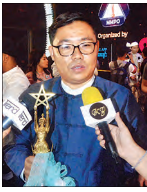
ဒါရိုက်တာ ဩရသ

အတွက် ဒီနေ့မှာဘဝရဲ့ မှတ်တိုင်တစ်ခုကိုရောက်သွားသလို ကိုယ့်ကိုယ်ကိုယ်ခံစားရတယ်။ ပရိသတ်တွေရဲ့ အချစ်တွေနဲ့အတူ ကိုယ့်ဆန္ဒတွေလည်း ပြည့်သွားတဲ့အတွက် ဝမ်းသာပါတယ်။ အနုပညာဖန်တီးတဲ့သူ အားလုံးရဲ့ အိပ်မက်တွေဟာ အကယ်ဒမီပါ။ ဒီနေ့ ဒီအကယ်ဒမီလေးကိုရတဲ့အတွက် အလွန်ဝမ်းသာပါတယ်။ အဖေအမေတွေအတွက်လည်း ကိုယ်ကပညာရေးမှာသိပ်မထူးချွန်ခဲ့တဲ့အတွက် သရုပ်ဆောင်ပိုင်းမှာ အခုလို