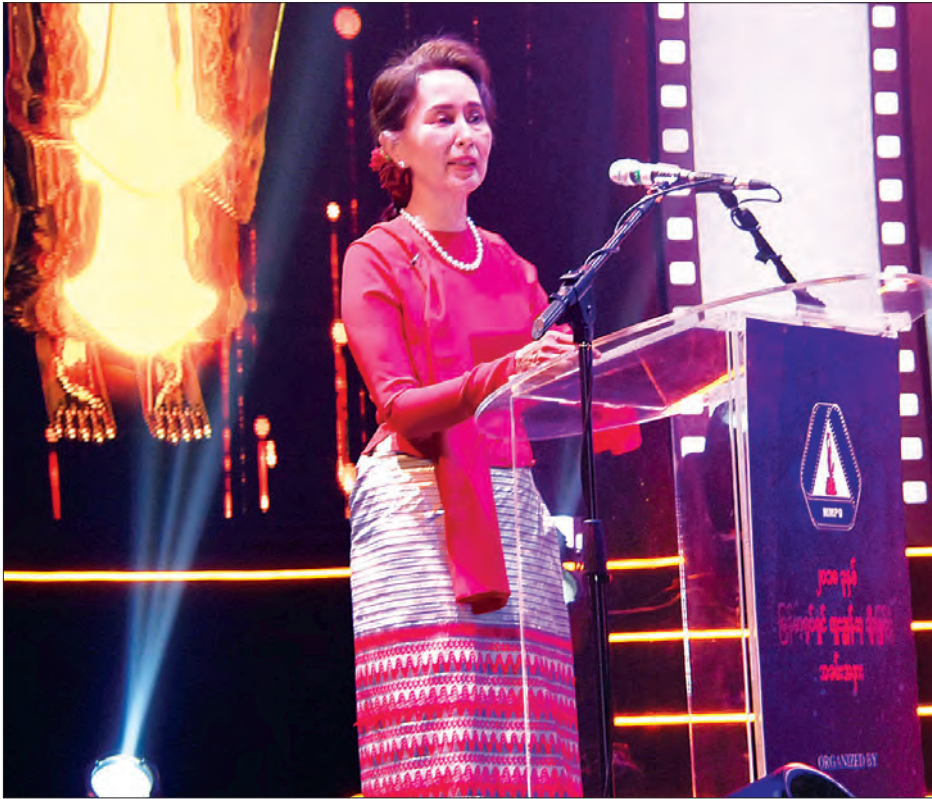
နိုင်ငံတော်၏အတိုင်ပင်ခံပုဂ္ဂိုလ် ဒေါ်အောင်ဆန်းစုကြည် ၂၀၁၈ ခုနှစ် မြန်မာ့ရုပ်ရှင်ထူးချွန်ဆုချီးမြှင့်ခြင်း အခမ်းအနားတွင် အမှာစကားပြောကြားစဉ်။