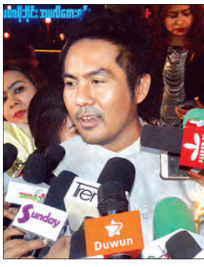
သရုပ်ဆောင် သူထူးစံ

အကယ်ဒမီဆိုတာ အားလုံးရဲ့ရင်ထဲမှာ ဘဝရဲ့ မှတ်တိုင်တစ်ခုလိုဖြစ်တဲ့