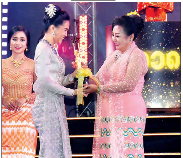
အကောင်းဆုံးအမျိုးသမီးရုပ်ရှင်ဇာတ်ပို့ထူးချွန်ဆုရ အေးမြတ်သူ ဆုလက်ခံရယူစဉ်။