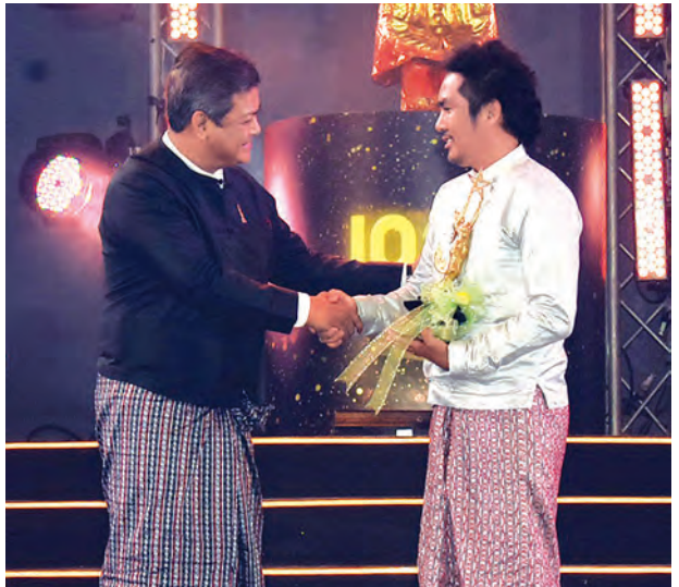
အကောင်းဆုံးအမျိုးသားရုပ်ရှင်ဇာတ်ဆောင်ထူးချွန်ဆုရ သူထူးစံ ဆုလက်ခံရယူစဉ်။