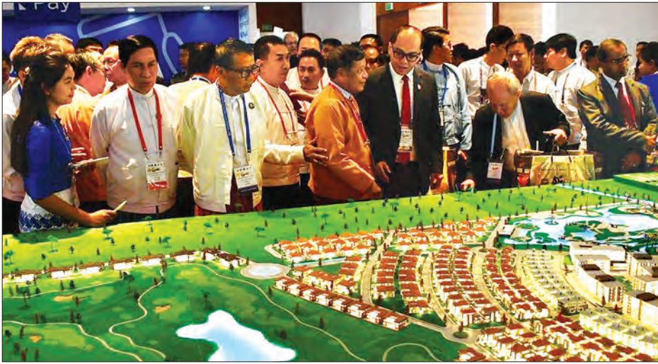
ပြည်ထောင်စုဝန်ကြီးများဖြစ်ကြသည့် ဒေါက်တာသန်းမြင့်၊ ဦးခင်မောင်ချို၊ မန္တလေးတိုင်းဒေသကြီးဝန်ကြီးချုပ် ဒေါက်တာဇော်မြင့်မောင်နှင့် တာဝန်ရှိသူများ နိုင်ငံတကာကုန်စည်ပြပွဲနှင့် စီးပွားရေးဆိုင်ရာဆွေးနွေးပွဲ၌ ပြသထားသော ပြခန်းများအား ကြည့်ရှုစစ်ဆေးစဉ်။

မန္တလေး မတ် ၂၃ မန္တလေး နိုင်ငံတကာကုန်စည်ပြပွဲနှင့် စီးပွားရေးဆိုင်ရာဆွေးနွေးပွဲ (၂၀၁၉) (Mandalay International Trade Fair & Business Forum 2019) ဖွင့်ပွဲအခမ်းအနားကို ယနေ့နံနက် ၈ နာရီတွင် မန္တလေးမြို့ရှိ Mandalay Convention Center (MCC) ၌ ကျင်းပသည်။