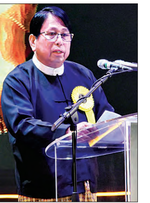
ပြည်ထောင်စုဝန်ကြီး ဒေါက်တာဖေမြင့်

ပရိသတ်များအနေဖြင့် စဉ်းစား ကြည့်စေလိုပါကြောင်း၊ မကြာသေးခင် နှစ်များအတွင်းက မြန်မာ့ရုပ်ရှင်လောက တွင် ရုပ်ရှင်အရည်အသွေးနှင့်ပတ်သက် ပြီး အားမရနိုင်၊ မနှစ်သက်နိုင်၍ ဝေဖန် သည့်အသံများ၊ ထောက်ပြသည့်အသံများ