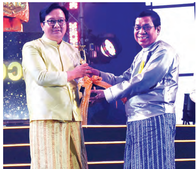
အကောင်းဆုံးရုပ်ရှင်ဇာတ်ညွှန်းထူးချွန်ဆုရ ပိုင်း ဆုလက်ခံရယူစဉ်။