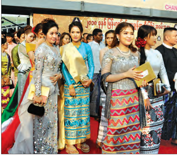
မြန်မာ့ရုပ်ရှင်ထူးချွန်ဆုချီးမြှင့်ပွဲအခမ်းအနားသို့ တက်ရောက်လာသည့် အနုပညာရှင် အချို့ကို တွေ့ရစဉ်။