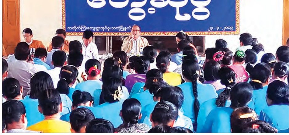
ပြည်နယ်ဝန်ကြီးချုပ် ဒေါက်တာအေးဇံ သထုံမြို့နယ်ရှိ ဒေသခံများနှင့် တွေ့ဆုံအမှာစကားပြောကြားစဉ်။

ဆက်လက်၍ ကတိုက်ကြီးကျေးရွာမှ ဦးစိန်ကွက်သစ်တွင် နေအိမ်များ မိုးရာသီတွင် ရေလွှမ်းမှုများ ရှိနေသဖြင့် တံတားတစ်ခုနှင့် ဂံလမ်းတည်ဆောက်ပေးရန်၊ စားကျက်မြေများအား အစိုးရက ပြန်လည်ပေးပြီးသော်လည်း အဖွဲ့အစည်းများက ရယူထားသဖြင့် ဂျွဲ၊ နွားတိရစ္ဆာန်များအတွက် စားကျက်မြေလိုအပ်နေပါကြောင်း၊ သောင်နုမြေများ ပေါ်ထွန်းလာသော်လည်း ယနေ့အထိ လယ်ယာမြေများ ရှိနေသေးကြောင်း၊