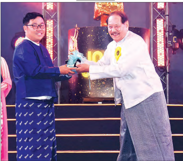
အကောင်းဆုံးရုပ်ရှင်ဒါရိုက်တာထူးချွန်ဆုရ ဩရသ ဆုလက်ခံရယူစဉ်။