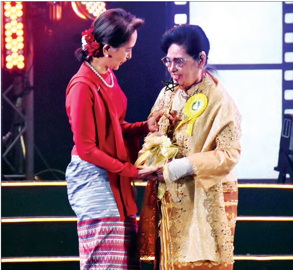
နိုင်ငံတော်၏အတိုင်ပင်ခံပုဂ္ဂိုလ် ဒေါ်အောင်ဆန်းစုကြည် ငါးထပ်ကွမ်းရုပ်ရှင်ထူးချွန်ဆုရ စည်သူ ဒေါ်မြင့်မြင့်ခင်အား ရုပ်ရှင်တစ်သက်တာဆု ပေးအပ်ချီးမြှင့်စဉ်။

ထို့နောက် နိုင်ငံတော်၏ အတိုင်ပင်ခံပုဂ္ဂိုလ် ဒေါ်အောင်ဆန်းစုကြည်က အမှာစကား ပြောကြားရာတွင် ဒီနေ့ကျင်းပပြုလုပ်တဲ့ မြန်မာ့ရုပ်ရှင်ထူးချွန်ဆုရရှိခြင်းပွဲ အခမ်းအနားကို တက်ရောက်လာကြတဲ့ ရုပ်ရှင်လောကမှ အနုပညာရှင်၊ အတတ်ပညာရှင်များ၊ ဧည့်သည်တော်များ၊ ရုပ်မြင်သံကြား ဖန်သားပြင်ပေါက်ကြည့်ရှုအားပေးနေကြတဲ့ ရုပ်ရှင်ချစ်ပရိသတ်များနဲ့ အခမ်းအနားဖြစ်မြောက်ရေးအတွက် ဝိုင်းဝန်းဆောင်ရွက်သူများအားလုံး ကျန်းမာချမ်းသာကြပါစေကြောင်း ဆုတောင်းမေတ္တာပို့သလိုနဲ့ နှုတ်ခွန်းဆက်သအပ်ပါတယ်။ ကျွန်မအနေနဲ့ ဒီအခမ်းအနားကို မနှစ်ကလည်း တက်ရောက်ခဲ့ပါတယ်။ မတက်ရောက်ဖြစ်တဲ့ နှစ်တွေမှာတော့ ရုပ်ရှင်လောကသားများအတွက် သဝဏ်လွှာပေးပို့ခဲ့ပါတယ်။