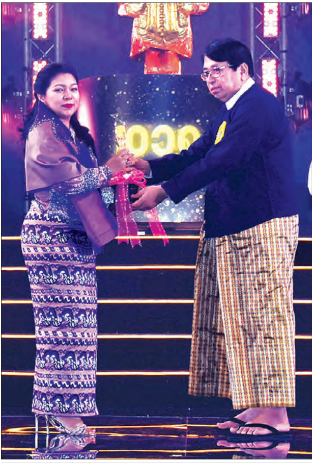
ပြည်ထောင်စုဝန်ကြီး ဒေါက်တာဖေမြင့် အကောင်းဆုံးရုပ်ရှင်ဇာတ်ကား ထူးချွန်ဆုရ ငွေသော်တာရုပ်ရှင်ထုတ်လုပ်ရေးအား ဆုပေးအပ်ချီးမြှင့်စဉ်။

ထိုသို့ ယိုယွင်းကျဆင်းသည့် အနေအထားမှ ယနေ့ကာလတွင် မြန်မာဇာတ်ကားကောင်းများ ပေါ်ထွက်လာပြီး ယင်းဇာတ်ကားများသည် ပြည်တွင်းသာမက ပြည်ပကို တင်ပို့လာနိုင်ပါကြောင်း၊ ၂၀၁၈ ခုနှစ်အတွက် ဆန်ခါတင်စာရင်းတွင် ပါဝင်ခဲ့သည့် ဇာတ်ကားများထဲမှ ၁၀ ကားသည် အိမ်နီးချင်းတိုင်းပြည်များသို့ တင်ပို့ပြသနိုင်ခဲ့သည့် အနေအထားများအပေါ် မူတည်ပြီး မြန်မာ့ရုပ်ရှင်သည် ပြန်လည်ဆန်းသစ်စပြုကာ ရှေ့ဆက်၍ ဖွံ့ဖြိုး