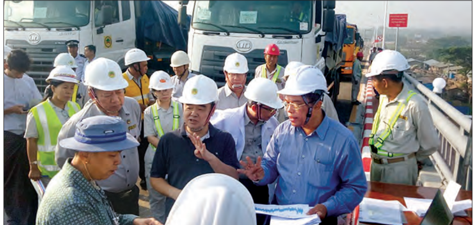
ဒုတိယဝန်ကြီး ဦးကျော်လင်း မြောင်းမြတံတားသစ်၌ တံတားခံနိုင်ရည်စမ်းသပ်စစ်ဆေးမှုအား ကြည့်ရှုစစ်ဆေးစဉ်။