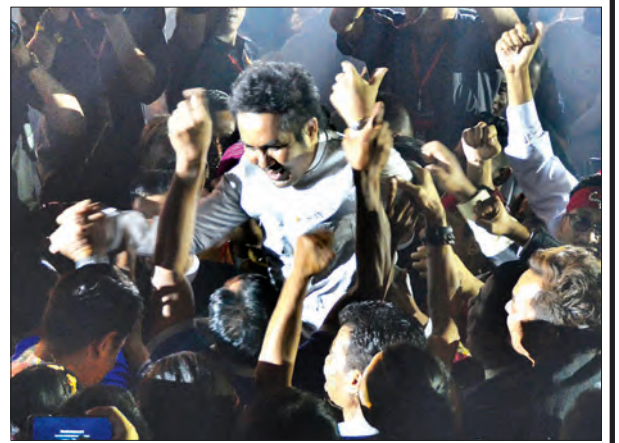
၂၀၁၈ ခုနှစ်အတွက် မြန်မာ့ရုပ်ရှင်ထူးချွန်ဆုရရှိသူများအား အနုပညာရှင်ညီအစ်ကိုမောင်နှမများက ဝိုင်းဝန်းဂုဏ်ပြုကြသည့် ကြည့်နူးဖွယ်ပုံရိပ်များ။