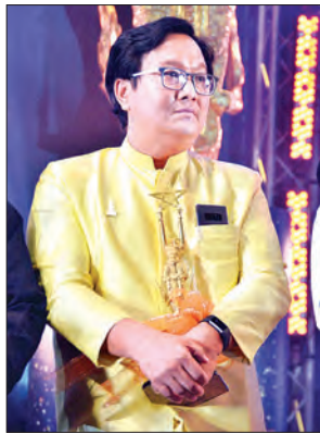
ဒါရိုက်တာဝိုင်း (ရုပ်ရှင်ဇာတ်ညွှန်းဆု)

ကျွန်တော်ပရိသတ်အပေါ် စေတနာထားပါတယ်။ အဲဒီစေတနာ ကျွန်တော် ပြန်ပြီးရလိုက်တယ်လို့ ထင်တာပါပဲ။ မေတ္တာနဲ့ရတဲ့ အကယ်ဒမီဆုလို့ ဆိုရမှာ ဖြစ်ပါတယ်။ ကျွန်တော့်ဘဝကို အခုလို